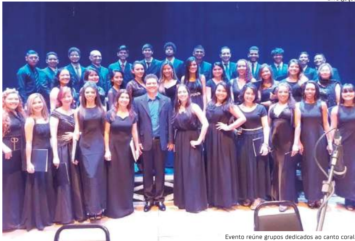
Evento reúne grupos dedicados ao canto coral