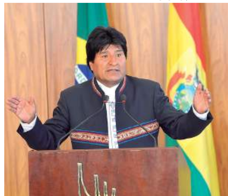
Ex-presidente da Bolívia, Evo Morales