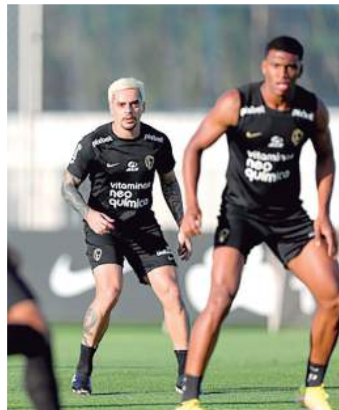
Jogadores do Timão otimistas com vaga na Copa do Brasil

O Corinthians também pode se garantir na Copa do Brasil por desempenho próprio. Isso acontecerá se a equipe conquistar o título da Copa Sul-Americana ou ficar na zona de classificação para a Libertadores pelo Campeonato Brasileiro. Neste momento, o time de Vanderlei Luxemburgo está na semifinal da Sula (enfrenta o Fortaleza) e se encontra na 10ª colocação da liga nacional, com 30 pontos conquistados.