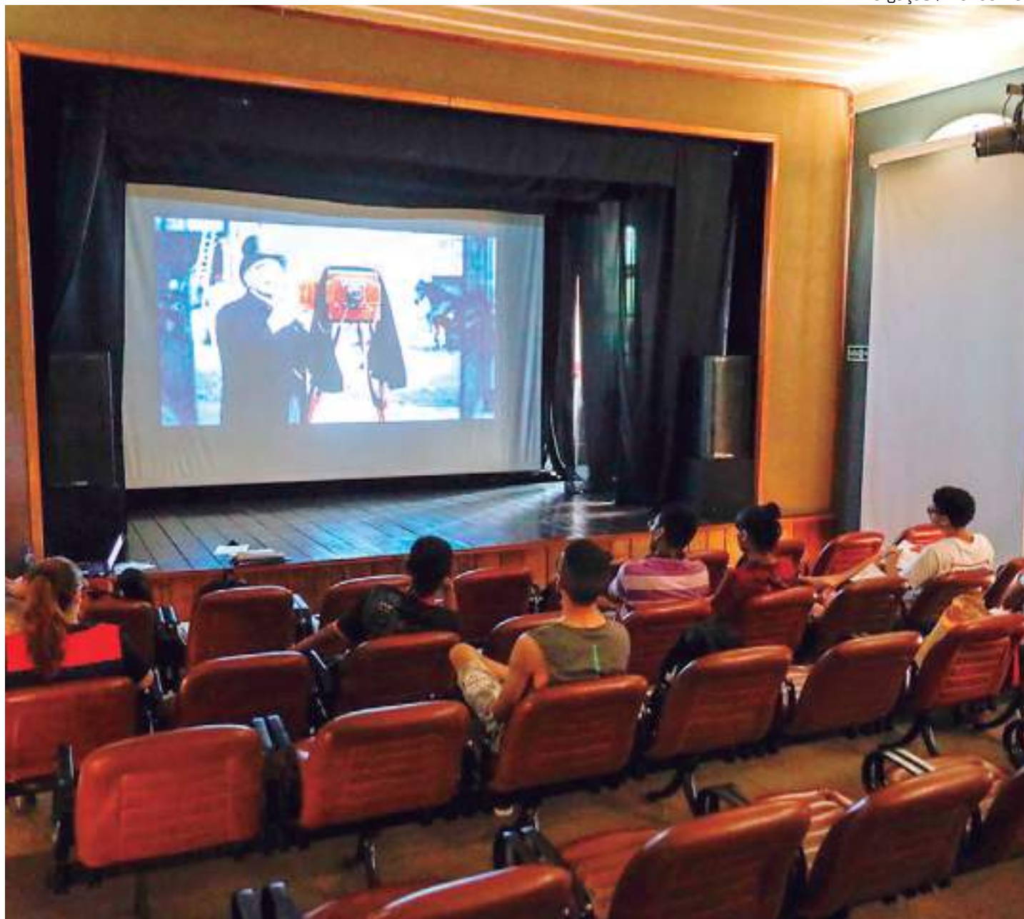
Evento é realizado no Cineteatro Guarany, localizado na avenida sete de setembro, Centro de Manaus

"Hoje as pessoas estão criando muito conteúdo, mas sem referências, reflexões críticas e tudo que envolve as obras cinematográficas. Então, a proposta é abordar um pouco da teoria