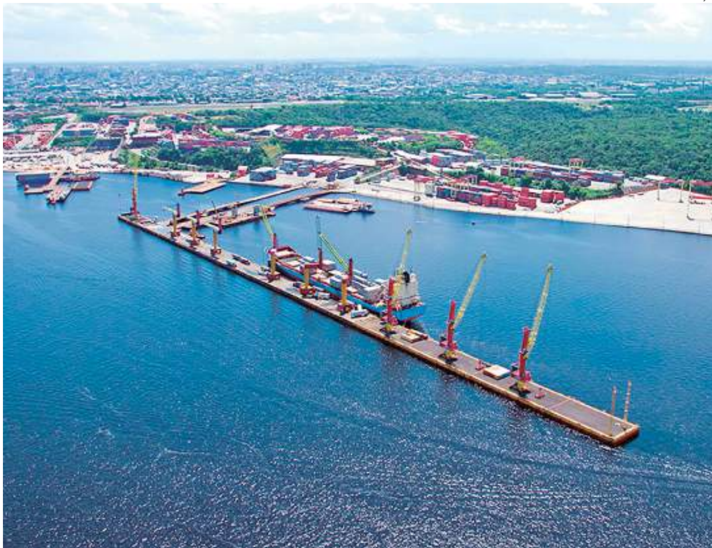
Transportes aquaviários transportam principalmente mercadorias da Zona Franca de Manaus

De acordo com os dados do Estatístico Aquaviário da Agência Nacional de Transportes Aquaviários (ANTAQ), são 15 milhões de toneladas