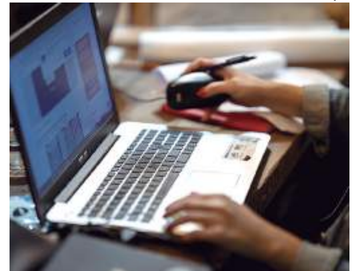
Inscrições devem ser feitas por meio do site www.am.senac.br/pdi

"O curso de desenvolvedor Full Stack vai preparar o