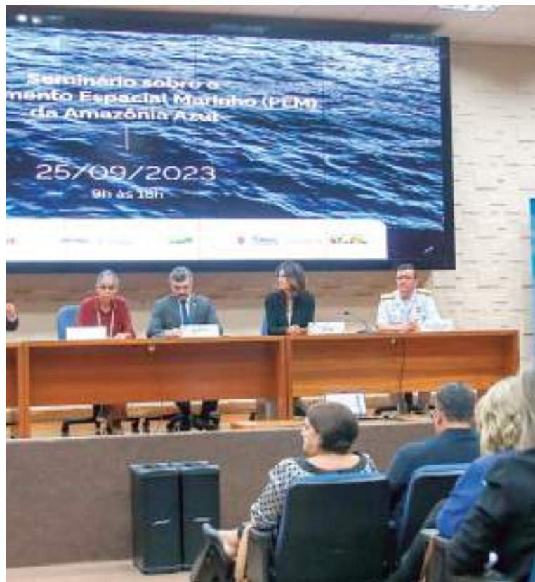
Ibama e MMA participam de seminário sobre planejamento da Amazônia