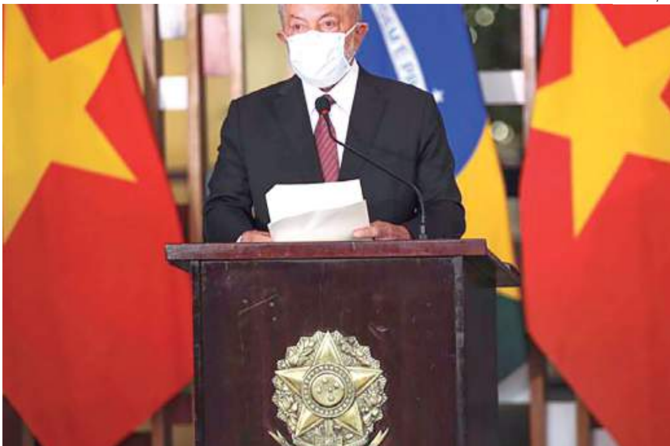
Lula tem pela frente a escolha dos novos nomes para a Procuradoria-Geral da República, no lugar de Aras, e para o STF, para ocupar vaga de Rosa Weber

Lula tem pela frente a escolha dos novos nomes para a Procuradoria-Geral da República (PGR), no lugar de Augusto Aras, e para o STF, para ocupar a vaga de ministra Rosa Weber. O mandato de Aras na PGR