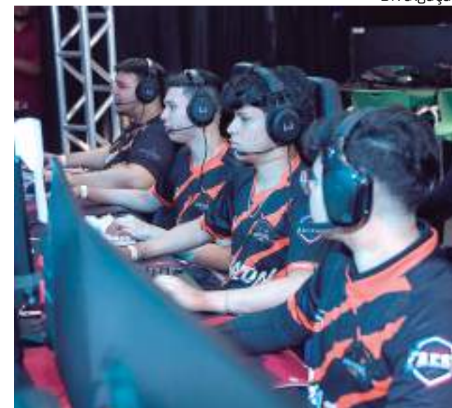
Jogadores têm até dia 29 de setembro para se inscreverem