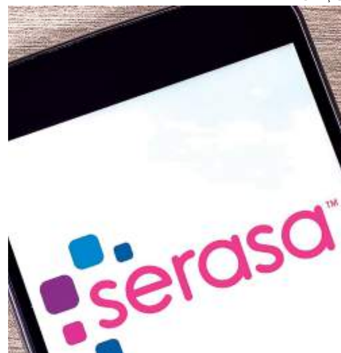
Brasileiros acessaram as plataformas da Serasa para negociações

As negociações podem ser realizadas pelo site ( www.serasa.com.br ), aplicativo Serasa (Android e iOS) ou via WhatsApp (11 99575-2096).