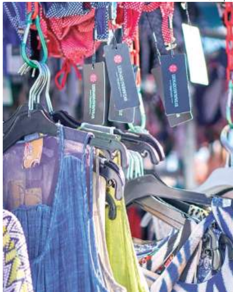
Mulheres empreendedoras vão expor seus produtos

"É uma feira para toda família, na qual a protagonista é a mulher que já empreende ou quer empreender e precisa de qualificação para isso. Nosso objetivo é oferecer capacitação, estrutura para e exposição e vendas dos