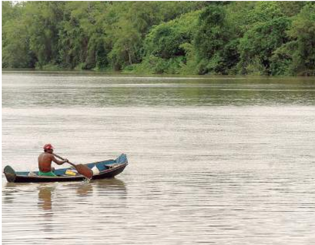
Ribeirinhos sofrem com criminalidade enquanto tentam manter vida na Amazônia

“Estamos construindo aqui no Brasil um plano ousado com investimentos de cerca de R$ 2 bilhões para a Amazônia brasileira – chamado Amazônia mais Segura e Soberana, com a implantação de 34 bases de segurança, das quais 28 terrestres e seis fluviais”, disse Capelli durante a abertura da 13ª Semana de Segurança Cidadã e Justiça.