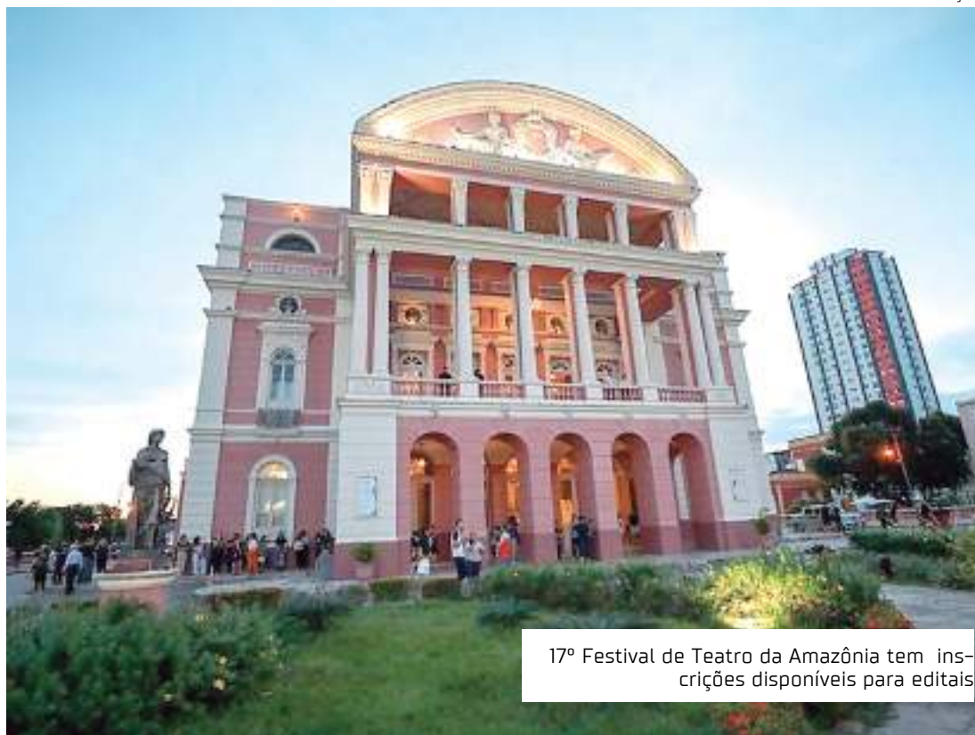
17º Festival de Teatro da Amazônia tem inscrições disponíveis para editais

Para a inscrição, é necessário apresentar o título da oficina, descrição da atividade e metodologia, breve currículo, público-alvo, quantidade de