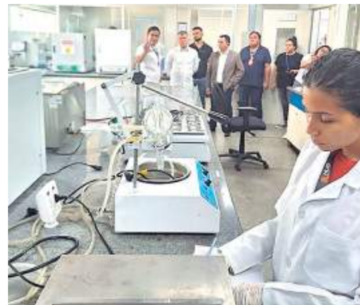
Hub Tecnologia e Inovação visa desenvolver capital intelectual