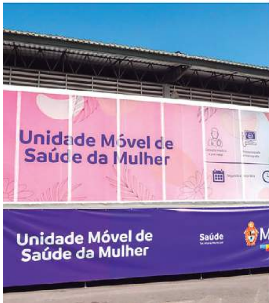
Prefeito reafirmou o compromisso da gestão municipal com a causa da saúde feminina na capital