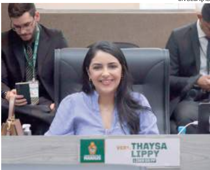
Vereadora destacou importância da Lei municipal

Pela lei, as candidatas estarão isentas das taxas de pagamento quando tiverem feito as doações em, pelo menos, três ocasiões nos doze meses anteriores à publicação do edital do certame. A isenção também será concedida mediante apresentação, na for-