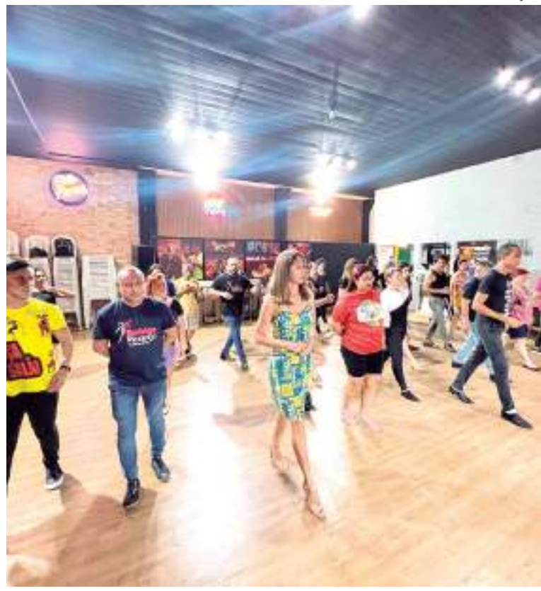
Entre os tipos de danças estão forró, brega, sertanejo, bolero, dentre outras

Mais detalhes também podem ser obtidos via o WhatsApp (92) 98292-3253 e pelas redes sociais do professor e do estúdio.