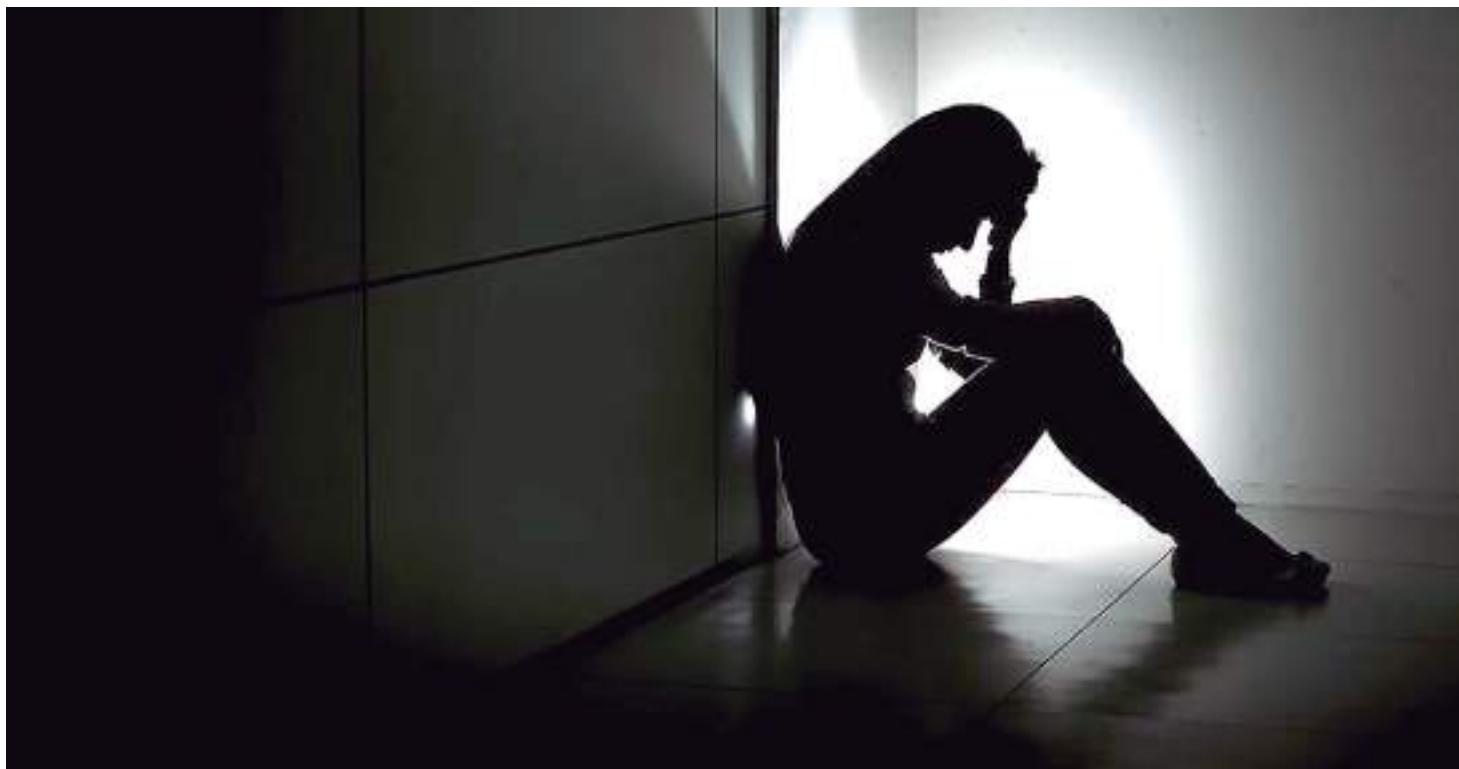
Imagem representando pessoa em estado de depressão

“Em homens de regiões como a Centro-Oeste e Norte, essas taxas chegaram a alcançar 73,75 e 52,05 por 100 mil habitantes, em 2018 e 2017, respectivamente. Em indivíduos de 10-24 anos da Região Norte, o grupo etário de maior risco para o suicídio indígena, essas taxas aumentaram substancialmente de 2013 em diante, contrariando