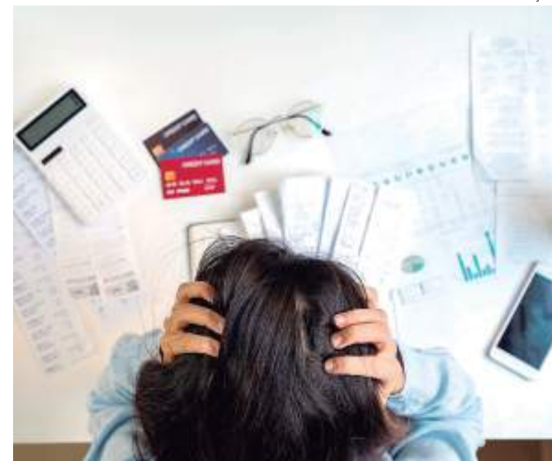
Brasileiros têm dificuldades em gerenciar dívidas