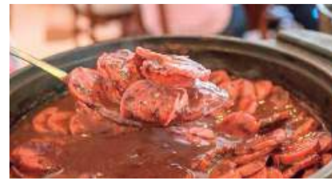
Feijoada acontece no próximo sábado (30)

Samba, bate-papo e muita solidariedade. Essa é a proposta da Feijoada Beneficente que acontece no próximo sábado (30) na Loppiano Pizza, localizada na Praça 14 de Janeiro. Promovida pelo movimento "Economia de Comunhão" (EdC), a ação solidária tem o objetivo de contribuir com a Campanha da Fraternidade 2023, sob o tema "Fraternidade e Fome", e auxiliar na revitalização do Colégio Nossa Senhora Auxiliadora (CNSA).