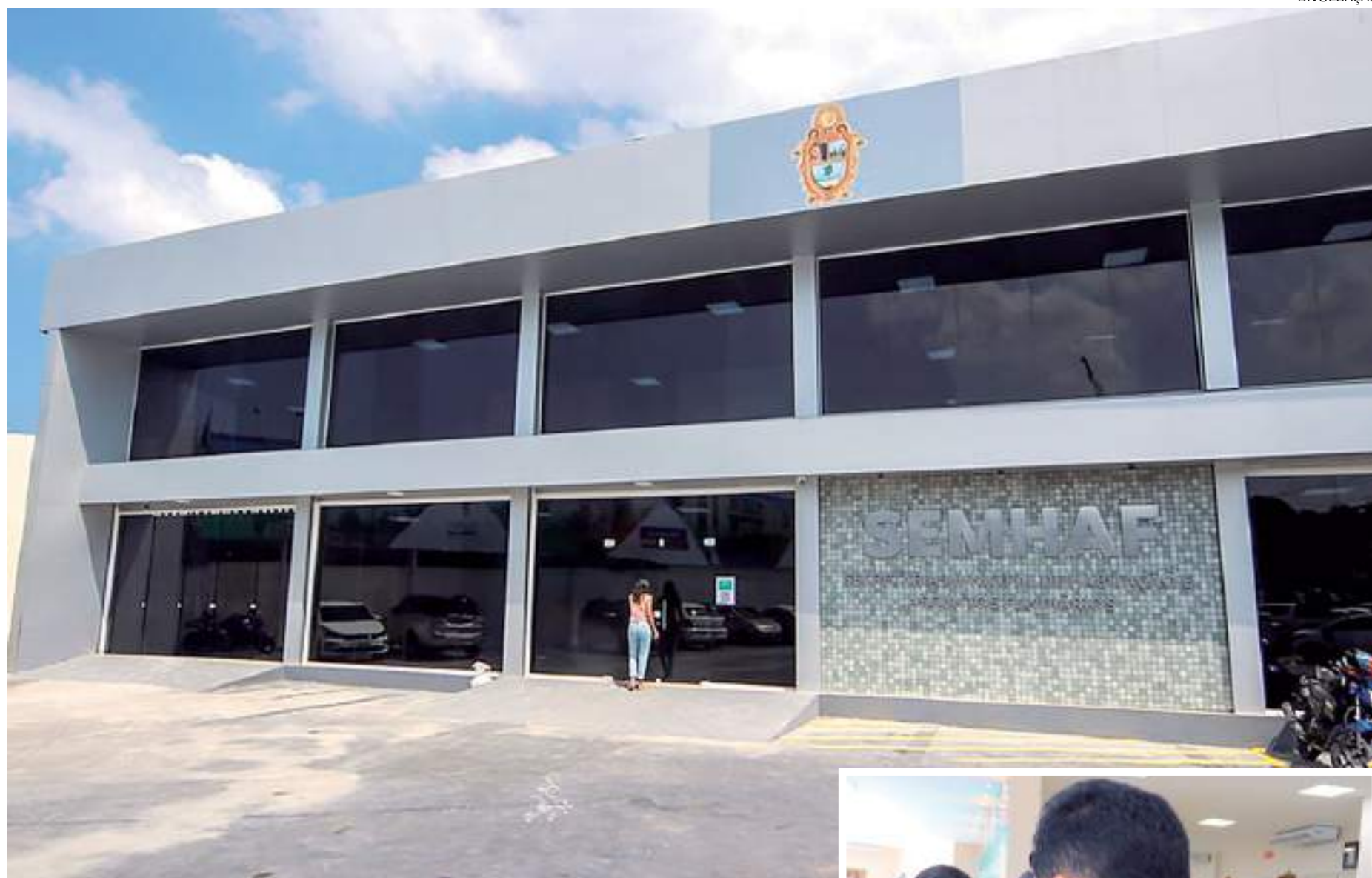
Atendimentos podem ser realizados presencialmente ou de forma on-line

A partir da parceria entre os Executivos municipal e federal, 17 mil famílias serão beneficiadas a partir do trabalho desenvolvido na Semhaf. Estão previstas, por ano, 1,2 mil moradias para famílias em área de risco e três mil moradias do "Minha Casa, Minha Vida". Já no programa municipal "Manaus Minha Casa", a prefeitura vai bene-