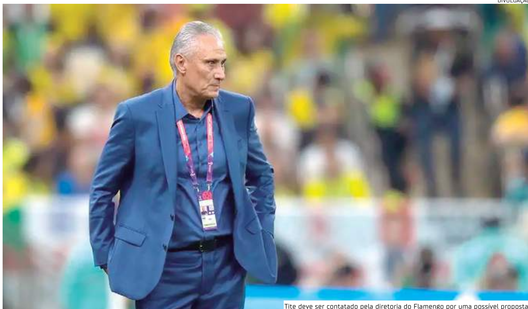
Tite deve ser contatado pela diretoria do Flamengo por uma possível proposta

Com a derrota para o São Paulo na final da Copa do Brasil, a pressão sobre Jorge Sampaoli aumentou no Flamengo, e o argentino deve ser demitido pela diretoria rubro-negra antes do final da temporada.