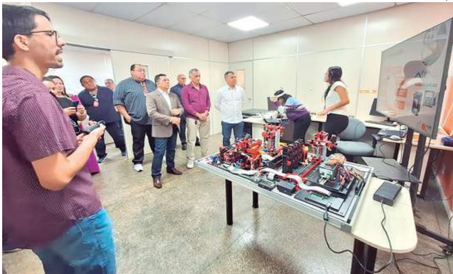
Representantes da Suframa conhecem projetos tecnológicos do Hub da UEA

Outro projeto de destaque apresentado foi o Projeto