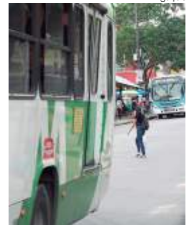
Reestruturação das linhas de ônibus visam melhorias

Quanto a linha 447, esta deixará de atender o percurso pela avenida Nathan Xavier e realizará seu trajeto direto pela avenida João Câmara. O IMMÚ ressalta que as linhas 439 e 654 permanecerão atendendo esse percurso pela Nathan Xavier.