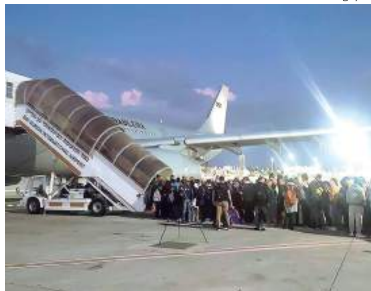
Brasileiros já tinham contatado embaixada para deixar Israel

“Depois de 33 horas esperando aqui no aeroporto [de Tel Aviv], estamos aqui, dentro avião para embarcar para Bangcoc. Bora para