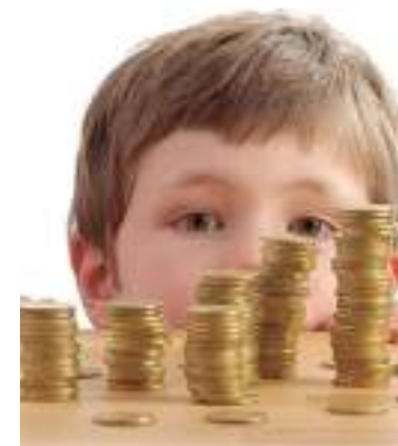
Maioria dos pais não proporciona mesada para os filhos

A falta de tato para abordar finanças ainda na infância pode estar relacionada a um comportamento cultural, pois 56% dos pais não lembram de, quando crianças, terem conversado com os pais a respeito de finanças. Esse indicador se sobressai entre as mulheres (65%) e nas classes D e E (64%).