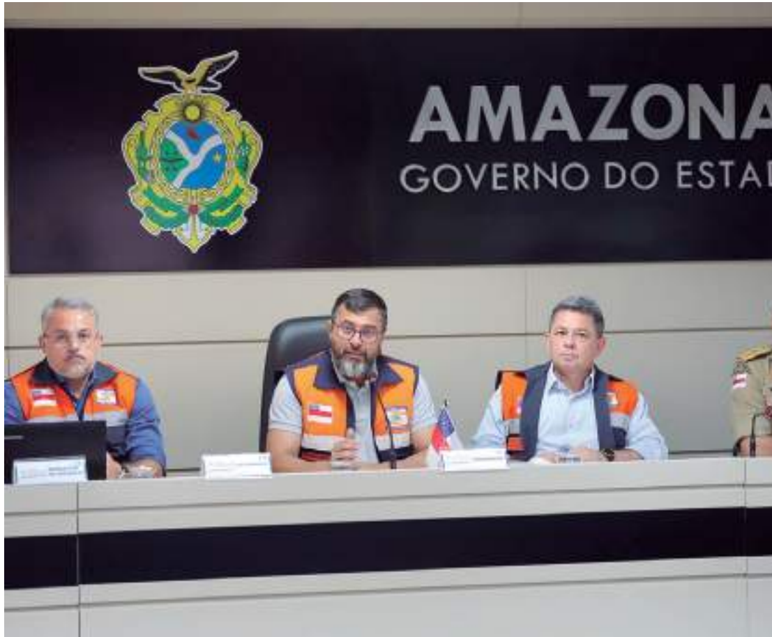
Autoridades destacam que Amazonas está preparado para dar assistência às populações impactadas pela seca

Os kits contêm remédios como amoxicilina, paracetamol, omeprazol, ibuprofeno, entre outros, além de insumos como ataduras, hipoclorito de sódio, seringas e máscaras. O objetivo é reforçar o trabalho que vem sendo feito pelo Estado para que os morado-