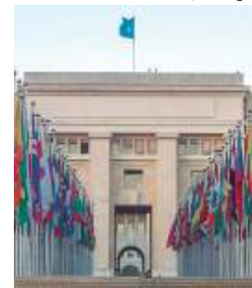
Palácio das Nações Unidas, em Genebra, na Suíça

tribuição geográfica equitativa. Todos os Estados-membros das Nações Unidas podem aderir ao conselho. A eleição é realizada durante a Assembleia Geral por meio de votação individual e direta por maioria absoluta, totalizando 97 votos. De acordo com ONU, o pleito é realizado anualmente, com cédulas secretas. Os eleitos têm mandato de três anos, sem direito à reeleição imediata após dois mandatos consecutivos.