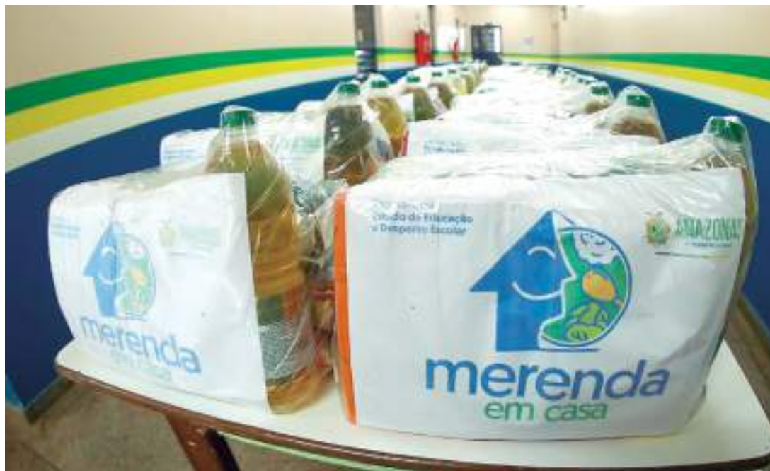
Estado segue cronograma de entrega dos kits do Merenda em Casa para contribuir com a segurança alimentar

A previsão é de que mais de 100 mil famílias sejam afetadas e recebam ajuda humanitária, como o envio de cestas básicas, kits de higiene, água potável e medicamentos. O governador também destacou que o Estado segue, ainda, um cronograma de entrega dos kits do Merenda em Casa para contribuir com a segurança alimentar dos alunos. Mais de 4 mil estudantes já que tiveram as