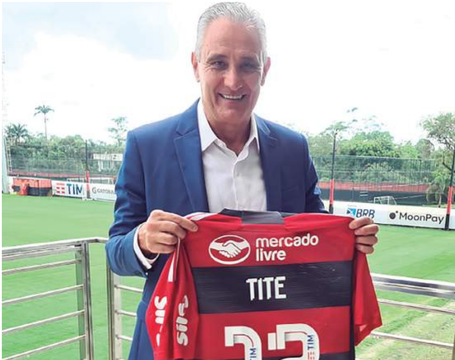
Tite teve primeiro contato com jogadores no Ninho do Urubu

Restam 12 rodadas da Série A. O Rubro-Negro, dono da maior receita e investimento no Brasil, depende da classificação no campeonato para dis-