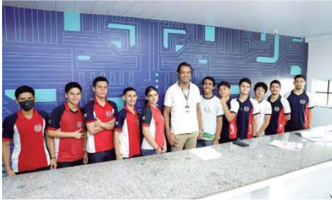
Estudantes irão competir na Tailândia em uma instituição de preparação olímpica do mundo