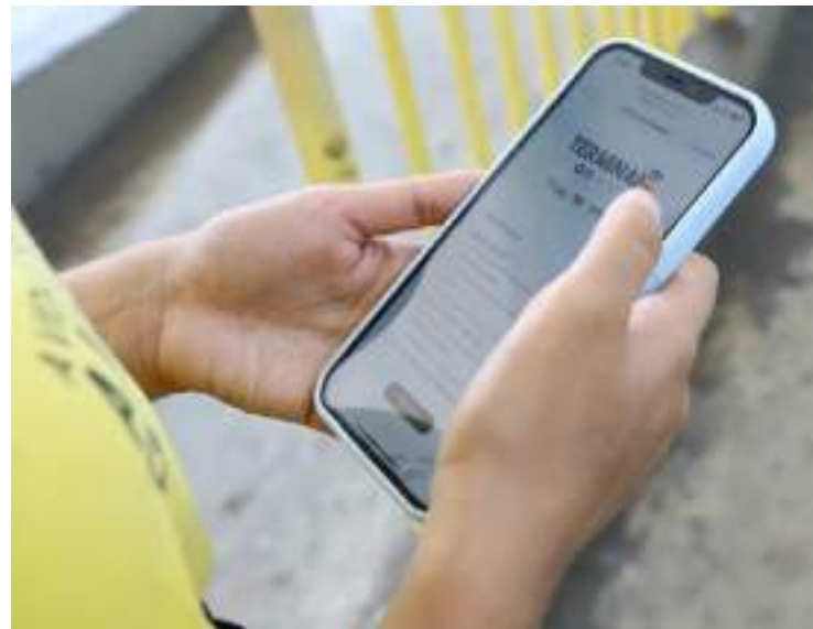
Passageiros agora podem acessar o aplicativo “Cadê Meu Ônibus”

Manaus se tornou a primeira capital da região Norte a disponibilizar internet grátis nos terminais de integração para os passageiros do transporte coletivo. Essa iniciativa visa melhorar a experiência dos usuários enquanto aguardam seus ônibus. Além de proporcionar entretenimento, a medida também facilita o acesso a informações e serviços on-line durante a espera.