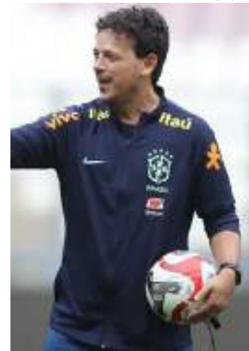
Treinador deve fazer mudanças na equipe titular da Seleção

Há outras diferenças em relação à lista da Data Fifa anterior, mas que não devem mexer, por enquanto, com a equipe titular.