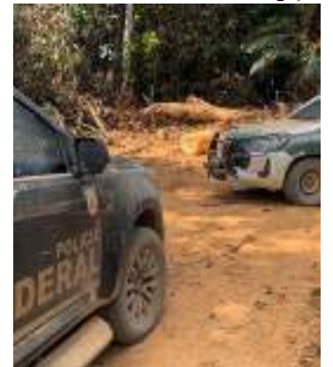
Carros da PF e Ibama em operação na Amazônia

O Ibama definiu ainda as prioridades no planejamento para as operações aéreas coordenadas pelo Centro de Operações Aéreas (COAer).