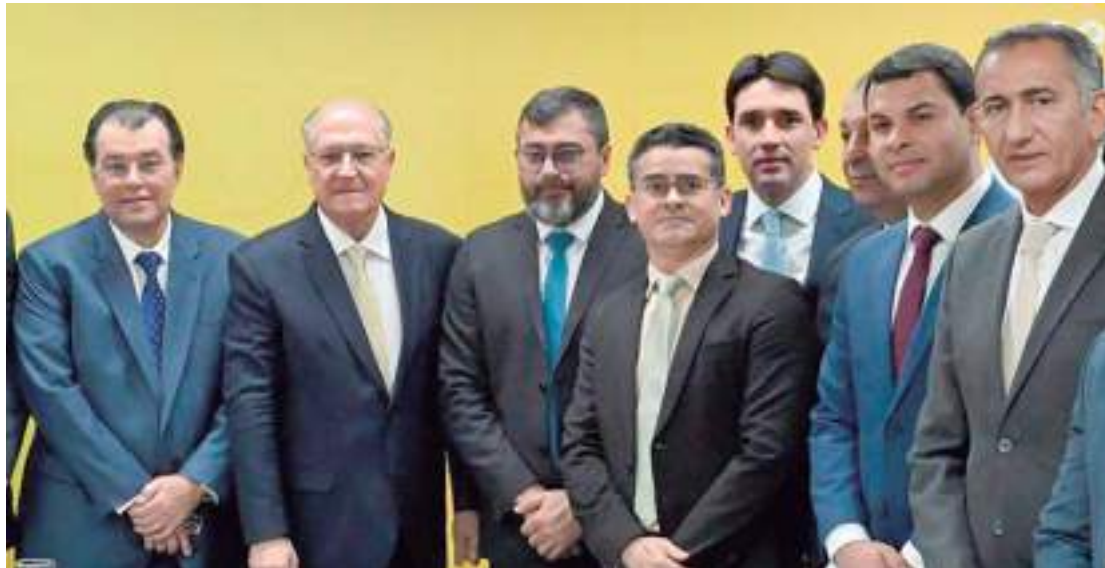
Parlamentares definiram valores e parte da logística de ajuda aos afetados pela estiagem

Além disso, o mandatário municipal teve a confirmação da liberação do pagamento unificado do Bolsa Família para quase 600 mil famílias de municípios do Amazonas com decreto de emergência por conta da estiagem histórica. Um total de R$ 440,5 milhões, de acordo com informações do Ministério do Desenvolvimento e Assistência Social,