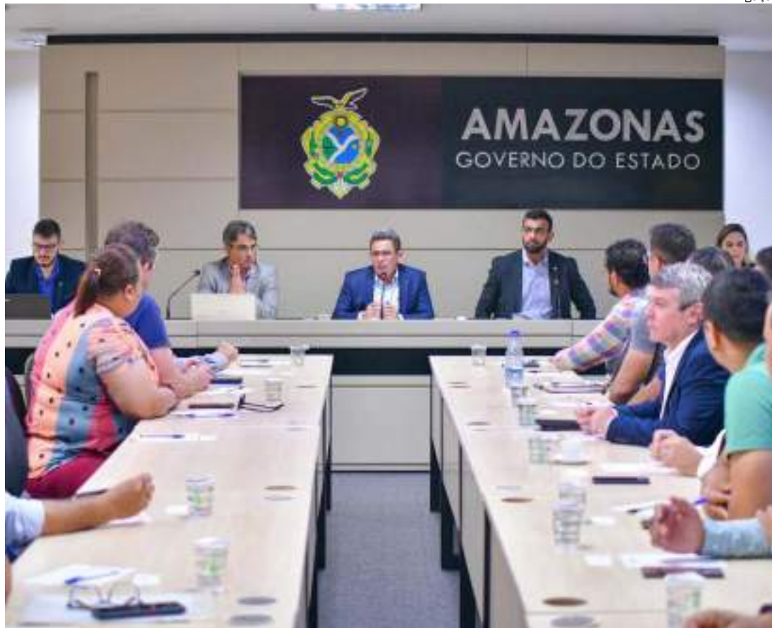
Reunião, na sede do Governo, que tratou sobre os investimentos foi conduzida pelo vice-governador

“É um programa instituído pelo Ministério do Meio Ambiente, em que quase 70 municípios foram qua-