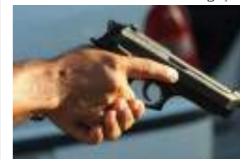
Dois homens foram presos por cometer assaltos