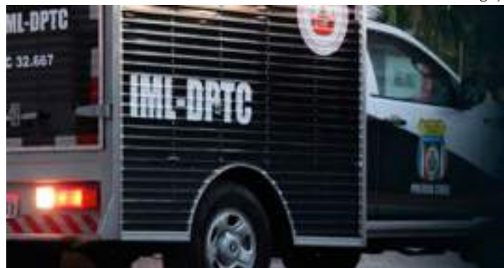
Corpo de homem foi retirado pelo Instituto Médico Legal

O corpo de um homem, não identificado, foi abandonado no beco Santa Inês, na terça-feira (17). Segundo a polícia, a vítima foi espancada até a morte por homens desconhecidos no bairro São José, Zona Leste de Manaus.