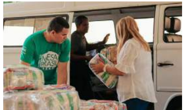
“Sesc Solidário” arrecada mantimentos para famílias atingidas pela seca

Os interessados em fazer parte dessa rede de solidariedade podem entregar os materiais nos seguintes pontos de coleta: Sesc Centro, rua Henrique Martins, n.º 427; Balneário, av. Constantinopla, n.º 288, Alvorada; Cidade Nova, rua Visconde de Itanhaém, n.º 94.