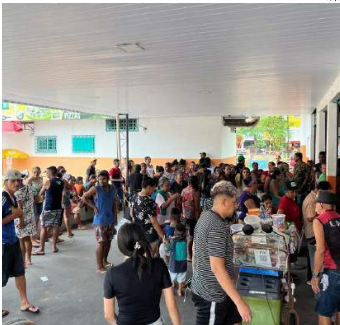
Após anúncio do pagamento, agências da Caixa ficam lotadas

“Eu estou aqui desde às 8h da manhã e ainda nem tomei um café tentando receber o meu Bolsa Famí-