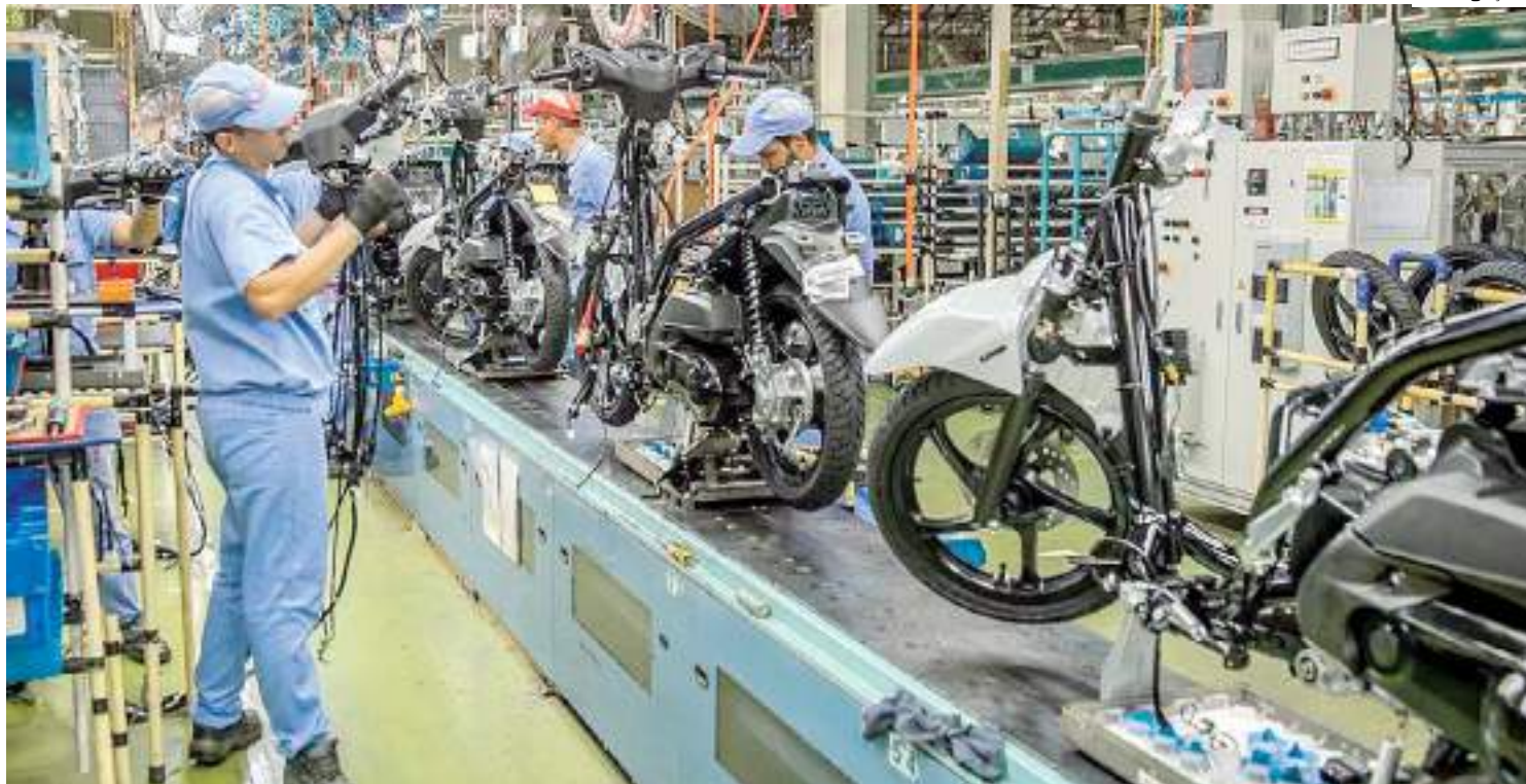
Produção da Yamaha Motor da Amazônia terá paradas programadas

A informação veio após o anúncio da diretoria da Samsung Eletrônica da Amazônia Ltda. comunicar, ainda na quarta-feira (18), a antecipação