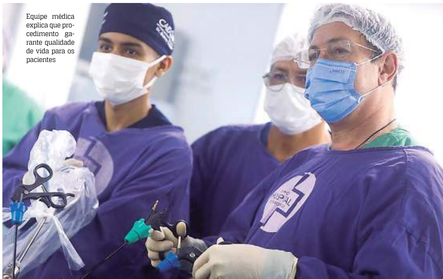
Equipe médica explica que procedimento garante qualidade de vida para os pacientes

eu percebi que já estava no ápice e que não podia mais levar a vida que eu levava foi quando fiquei presa na catraca de um ônibus. Eu ocupava dois assentos no ônibus, não conseguia andar direito”, relatou.