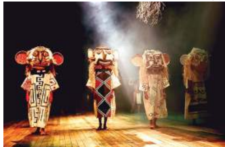
Programação conta com espetáculos, ações formativas e projeto de mediação

Na quinta-feira (12) tem apresentação de “Mar Acá”,