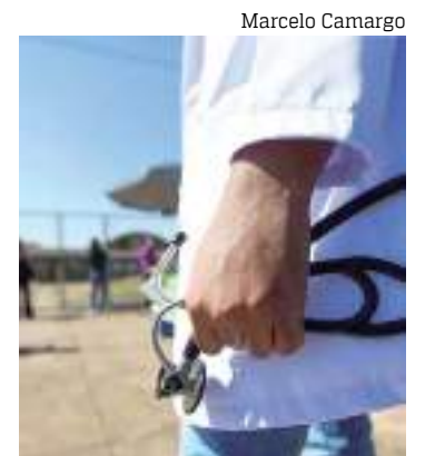
Processo foi concluído por 930 médicos

Na primeira etapa são aplicadas provas teóricas, objetiva e discursiva e, na segunda etapa, os profissionais passam por dez estações avaliativas onde precisam cumprir um Padrão Esperado de Procedimentos (PEP). Este ano, os exames práticos foram aplicados em Belo Horizonte, Brasília, Curitiba, Florianópolis, Goiânia, Manaus, Porto Alegre, Salvador, São Luís e Uberlândia (MG).