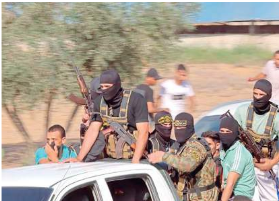
Hammas realizou ataques usando parapentes e foguetes em ataque que inteligência israelense falhou em prever

Ao jornal The Times of Israel, no entanto, uma alta fonte do governo do premiê Binyamin Netanyahu disse que a decisão de Tel Aviv, por ora, é prosse-