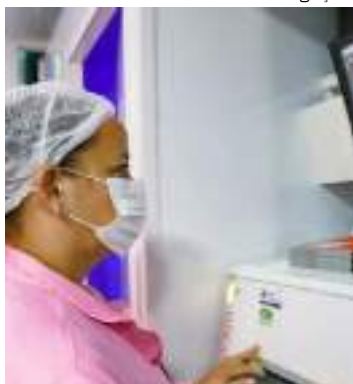
Acompanhamento médico é essencial

O câncer de mama é o mais incidente em mulheres no Brasil, após o câncer de pele não melanoma. Em 2023, estima-se que ocorrerão 73.610 casos novos da doença no país, o que representa uma taxa ajustada de incidência de 41,89 casos por 100.000 mulheres. O Amazonas tem uma estimativa de 28,34 casos de câncer de mama a cada 100 mil pessoas para