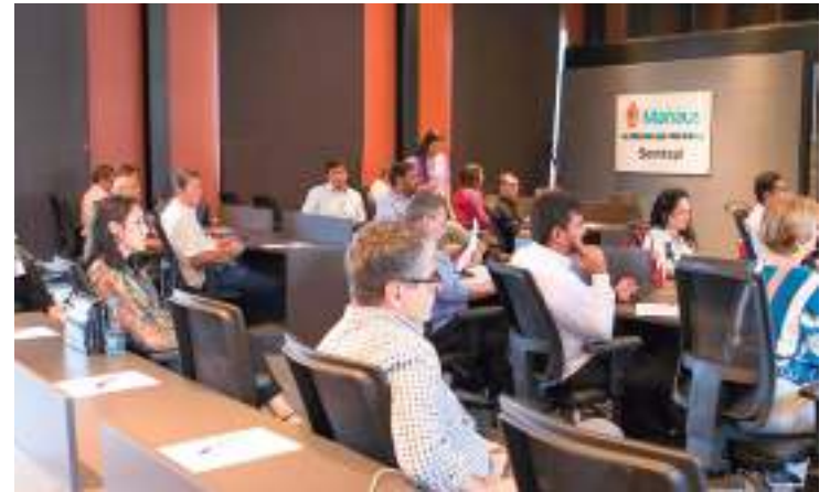
Projeto foi apresentado no Casarão da Inovação Cassina

"O corredor do Mindu é uma área muito importante, porque cobre 23 quilômetros transversalmente a cidade de Manaus. E a gente compreendendo a microbacia do Mindu, que têm bairros de classe média alta ou muito pobre, áreas muito vulneráveis, com a nascente lá na Cidade de Deus, que é um local que tem uma caracteris-