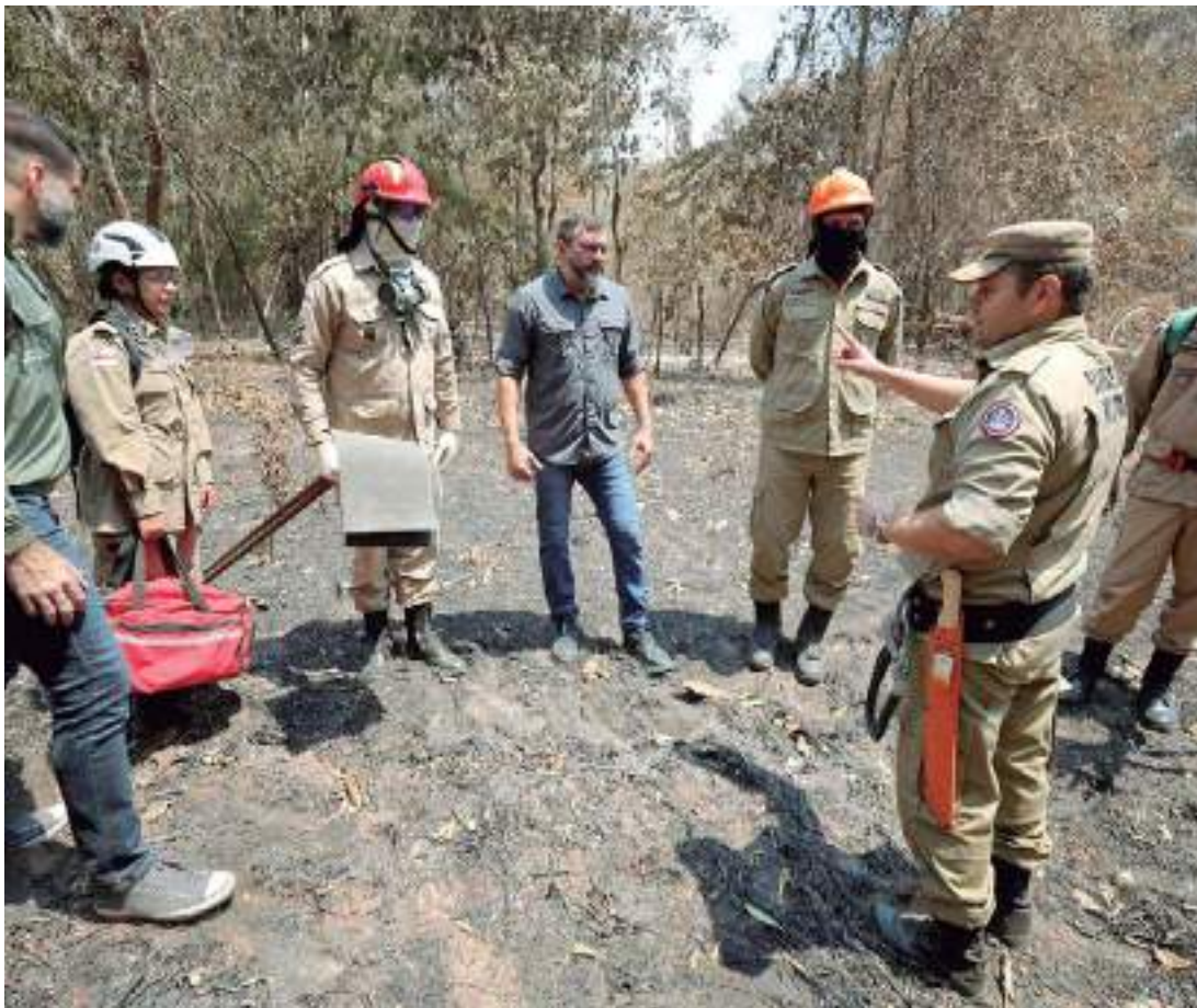
Governador vistoriou área da mata onde tropa dos bombeiros havia controlado focos de queimadas

A atuação dos bombeiros é reforçada por agen-