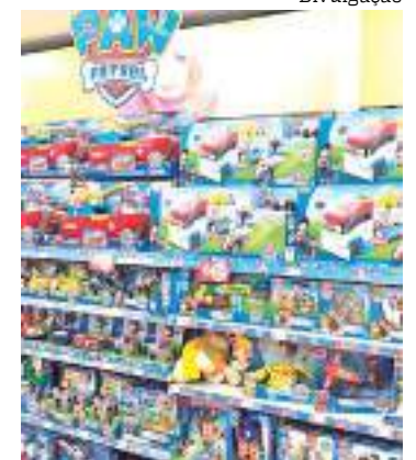
Brinquedos mais uma vez lideram a lista dos mais buscados

O TIM Ads é uma plataforma para levantamentos rápidos a partir da base de 38,9 milhões de clientes pré-pagos da TIM.