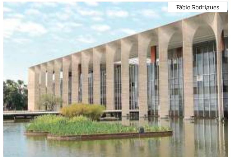
Palácio do Itamaraty montou estrutura para atendimento

Surpreendidos pela escalada da violência na região, os três sequer deixaram o