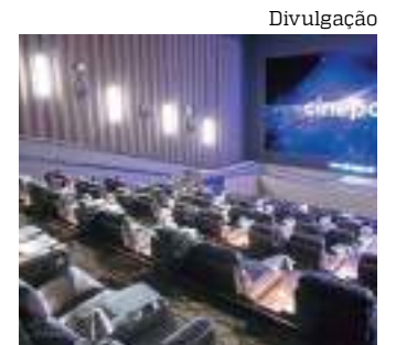
Ação garante o desconto de 50% nos ingressos de filmes

A programação do período inclui PAW Patrol: The Mighty Movie, The Equalizer 3, Som da Liberdade, Resistência, Os Mercenários, entre outros. Consulte a programação e horários de exibição.