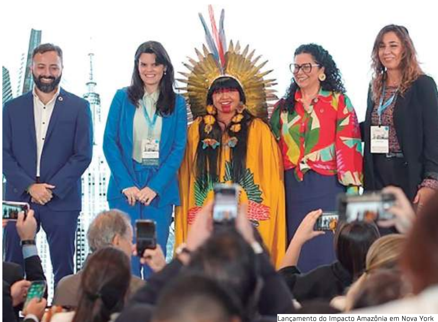
Lançamento do Impacto Amazônia em Nova York

"Nosso trabalho diário com o saneamento básico passa pela preservação do meio ambiente. Pensar na floresta em pé e em igarapés limpos é necessário para podermos ter mais qualidade de vida, melhores índices de saúde, mais oportunidades de turismo. Tudo está ligado, e, por isso, agradecemos a confiança do Pacto Global em trazer esse evento histórico para Manaus, uma cidade que está no centro de um bioma que precisa ser preser-