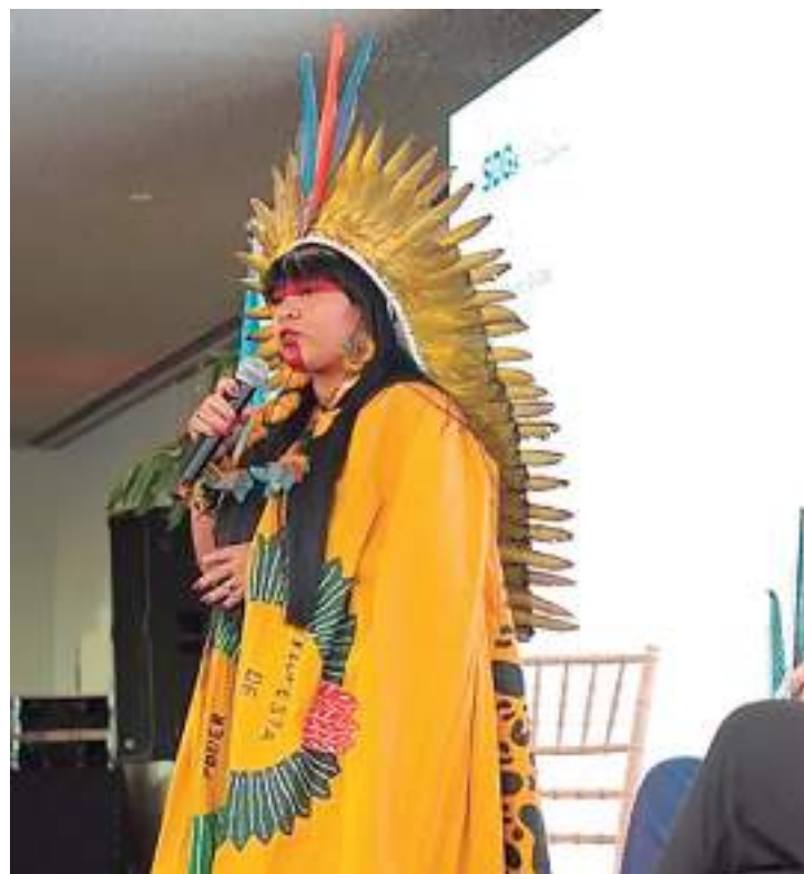
Movimento Impacto Amazônia desenvolverá ações com base nos ODS