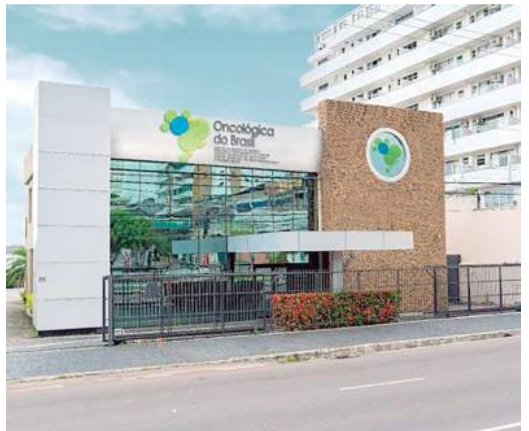
Clínica Oncológica do Brasil realiza atividades e eventos para conscientizar a população neste mês

Durante todo o mês de outubro, a Clínica Oncológica do Brasil realiza atividades e eventos para conscientizar a população sobre o câncer de mama. Essas ações incluem palestras informativas, campanhas de conscientização e distribuição de materiais educativos.