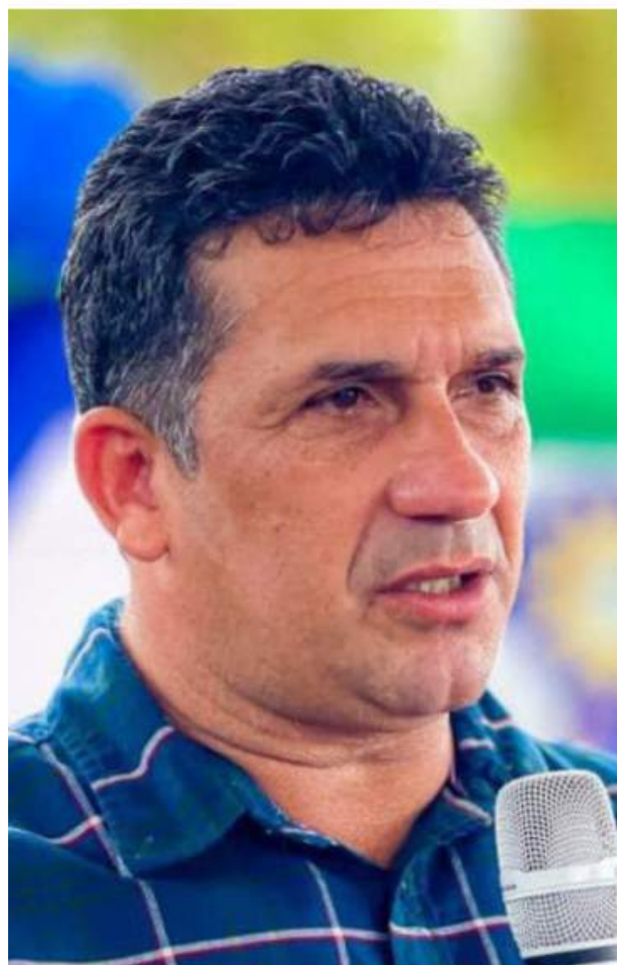
Até a publicação desta matéria, Prefeitura ainda não se manifestou sobre o show em momento delicado

Na Reserva de Desenvolvimento Sustentável Lago do Piranha, em Manacapuru, milhares de peixes apareceram mortos na superfície durante a última quarta-feira (27). Em vídeos publicados nas redes sociais, moradores filmaram a