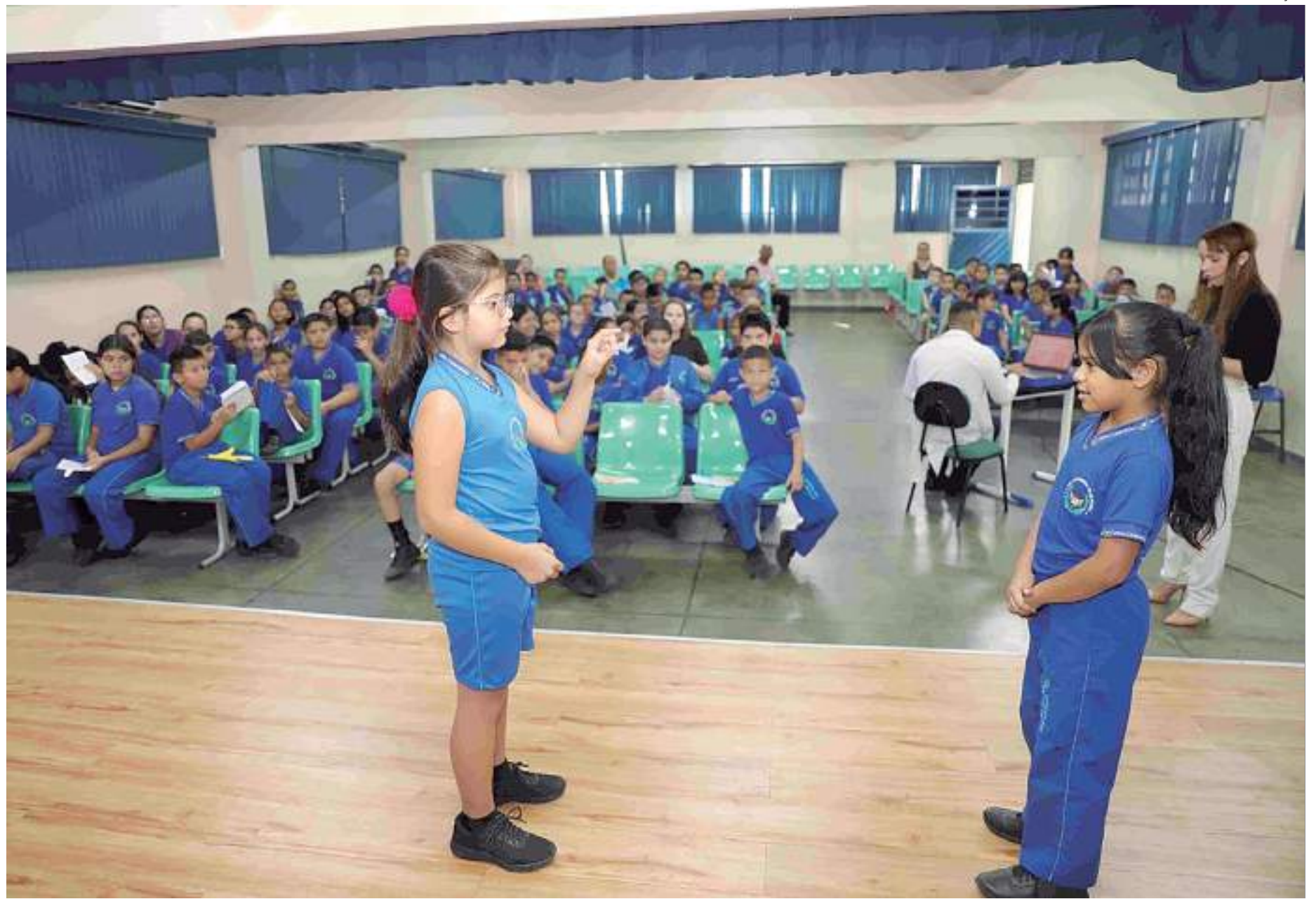
Alunos do 5º ano do Ensino Fundamental da Escola Estadual (EE) Brigadeiro Camarão Telles Ribeiro participam do projeto

Foi, inclusive, a partir do convívio com uma aluna "Coda", que surgiu a ideia do projeto em Libras. A professora contou que a aluna de 7 anos, que cursa o 2º ano