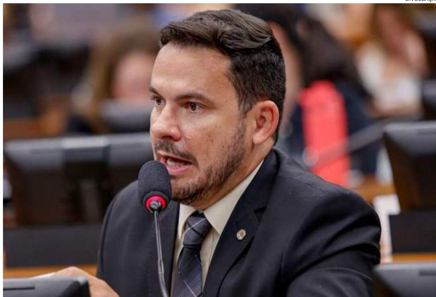
Parlamentar destacou que recursos são usados principalmente para o combate ao tráfico

“O corte do governo na segurança pública demonstra a falta de prioridade para a área, beneficiando ainda