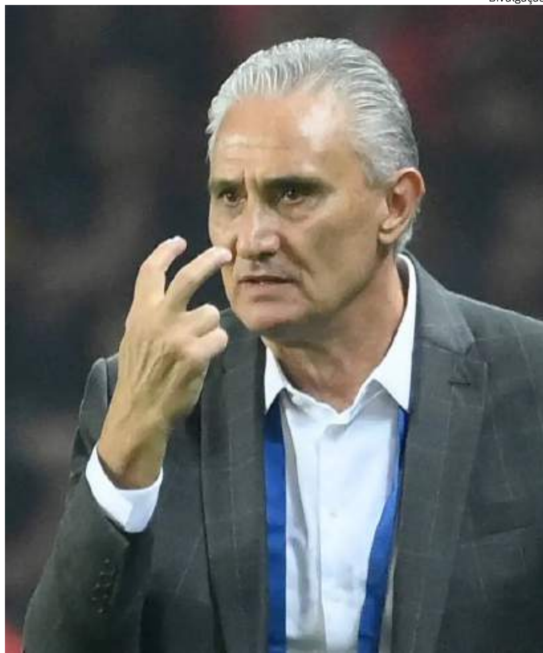
Tite fechou contrato com o Flamengo e vai assumir time depois da Data Fifa de outubro

No último contrato entre Flamengo e Pixbet, selado em 2021, o montante acordado entre as partes para a exibição da marca nas omoplatas dos uniformes foi de R$ 48 milhões, válidos pelos dois anos do vínculo. Ou seja, a proposta pela renovação contratual é de praticamente o dobro do valor anterior.