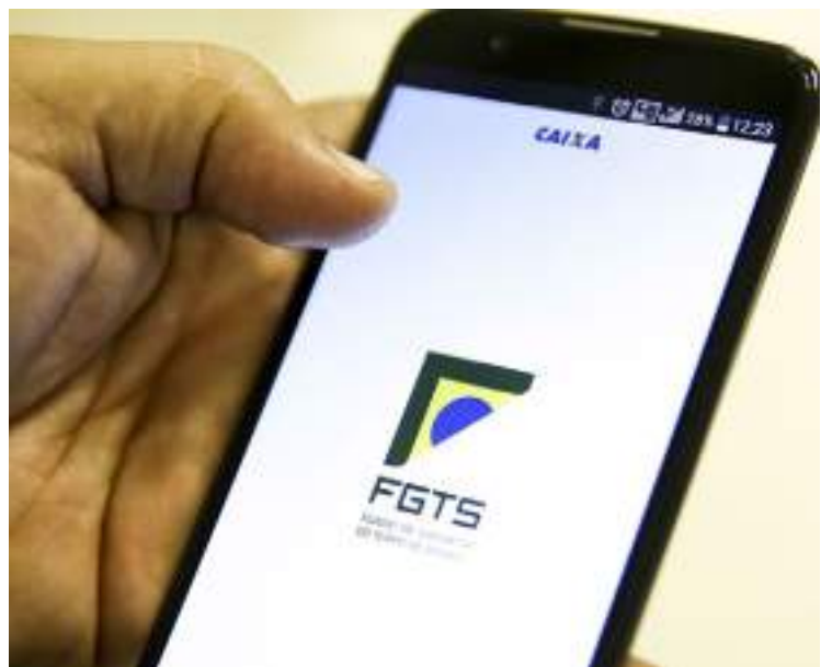
Aplicativo do FGTS em telefone celular