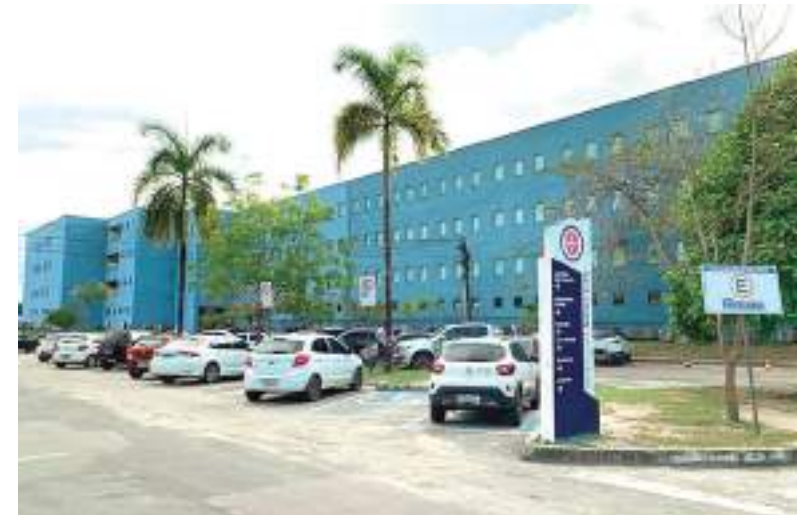
Evento promovido na Universidade Nilton Lins