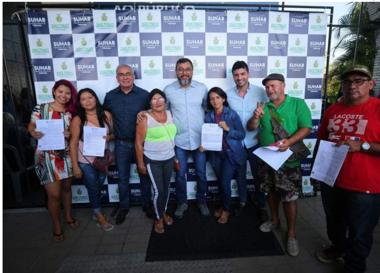
Segundo o governador, a construção do Rapidão – Rodoanel Metropolitano de Manaus é fundamental

"Essa é a maior intervenção viária da cidade de Manaus, perfazendo um total de 37 quilômetros de avenida du-