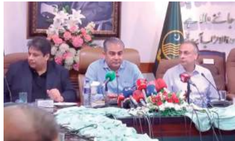
Três mortes foram confirmadas, de acordo com o ministro-chefe de Punjab