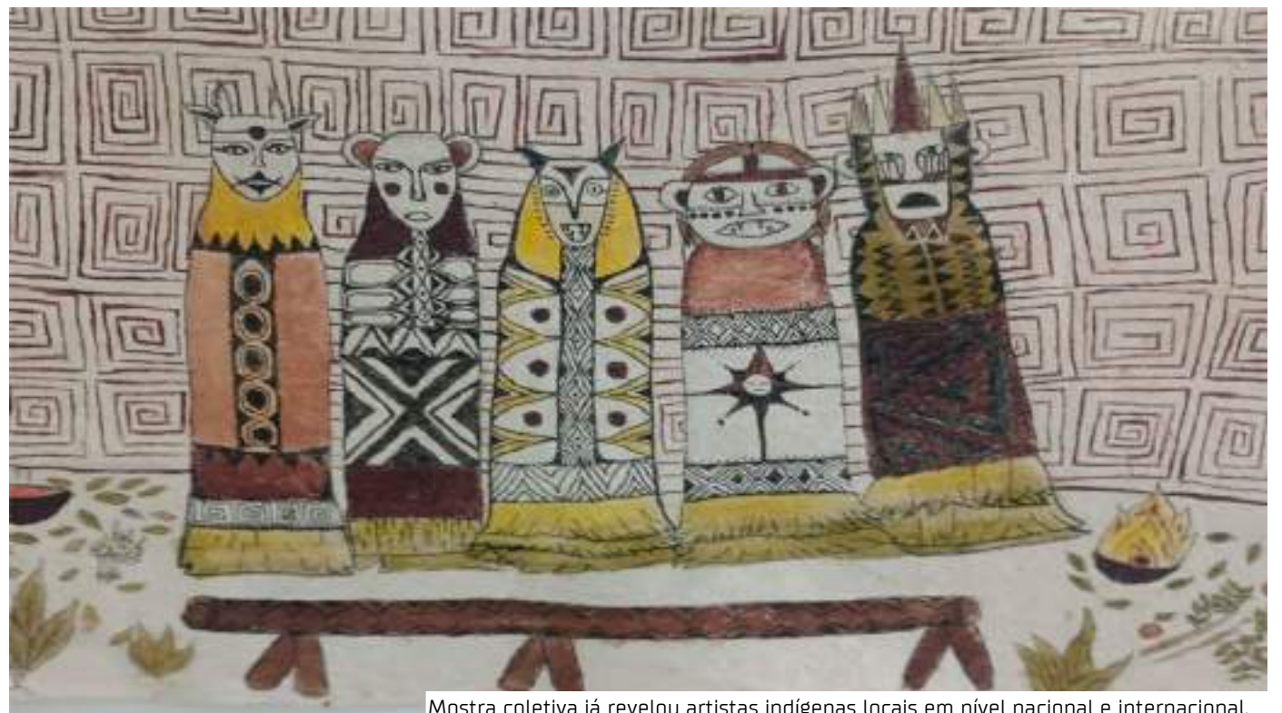
Mostra coletiva já revelou artistas indígenas locais em nível nacional e internacional.

Os artistas são representantes indígenas de vários povos, como munduruku, tukano, apurinã, tikuna, baré, dessana, kokama, mura, sateré-mawé.