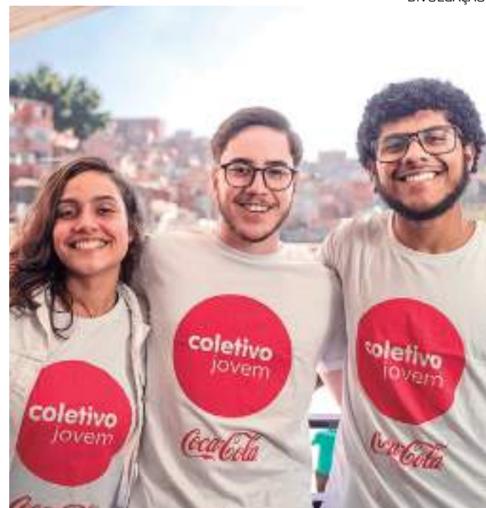
Instituto Coca-Cola Brasil capacita jovens de 16 a 25 anos

Desde o início de sua implementação, em 2009, a Plataforma já impactou mais de 350 mil jovens em comunidades brasileiras espalhadas por todos os 26 estados do país, + DF, chegando a 2.413 municípios. Do total de beneficiados, mais de 105 mil tiveram acesso ao mercado de trabalho.