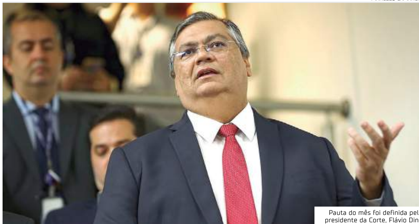
Pauta do mês foi definida pelo presidente da Corte, Flávio Dino

– http://mj.gov.br/escolasegura E ainda há extremistas achando que ‘liberdade de expressão’ protege ameaças e agressões contra crianças, adolescentes e educadores”, escreveu o ministro da Justiça e Segurança Pública, Flávio Dino, em uma rede social.