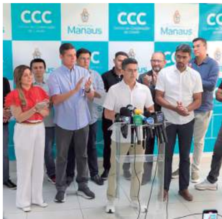
Chefe do executivo anunciou novas medidas de combate à seca

O prefeito de Manaus, David Almeida, anunciou, nesta terça-feira (3), um conjunto de novas medidas para o enfrentamento à vazante histórica. O ato aconteceu no Centro de Cooperação da Cidade (CCC), localizado no bairro Parque 10 de Novem-