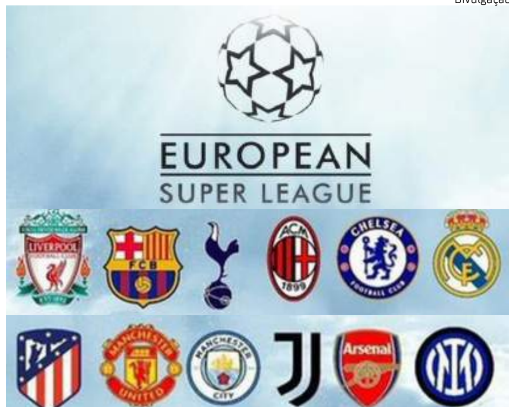
Nova liga deve passar a funcionar na próxima temporada do futebol Europeu