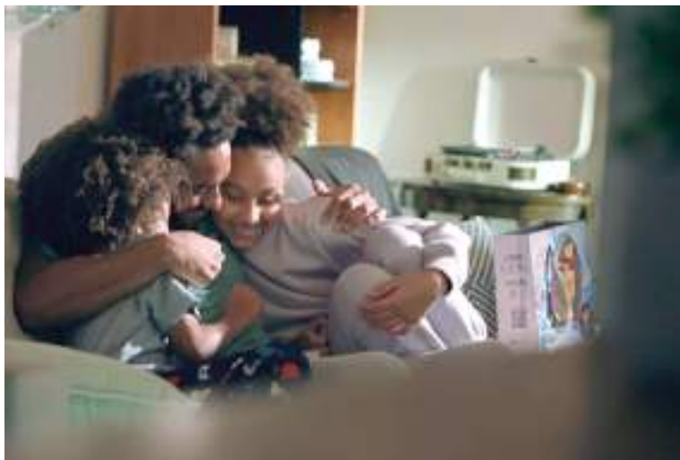
Crianças celebram o Dia das Crianças com presentes especiais