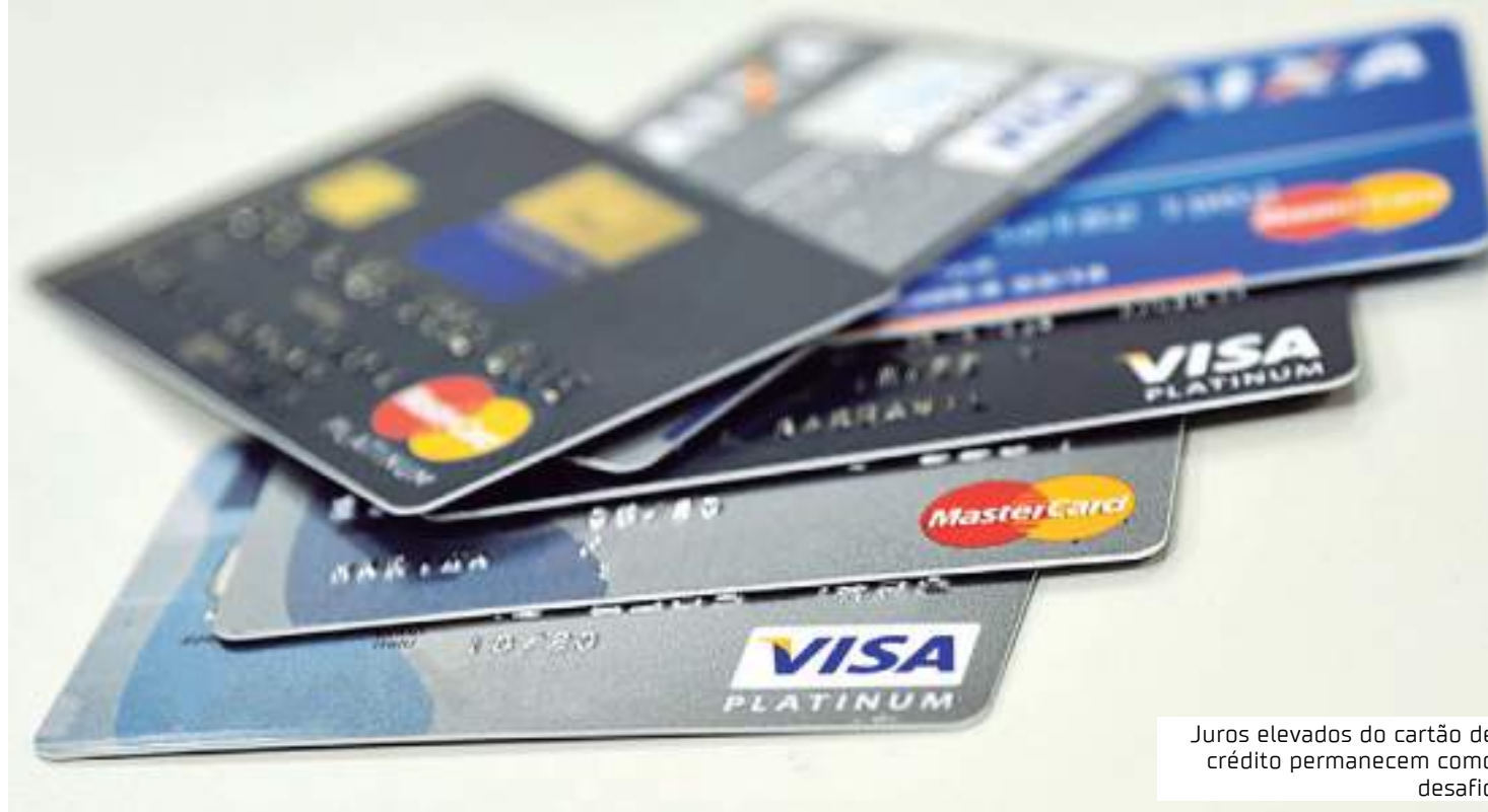
Juros elevados do cartão de crédito permanecem como desafio

Para o presidente, os juros elevados do cartão de crédito permanecem como desafio nesta que é a principal modalidade de endividamento do