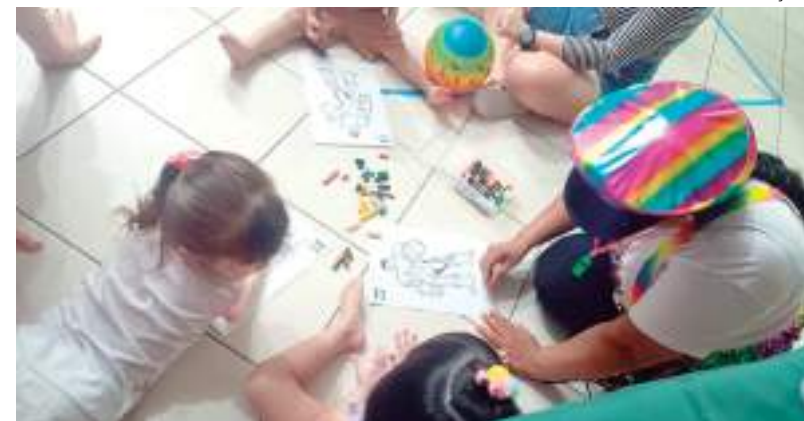
Crianças contarão com programação especial