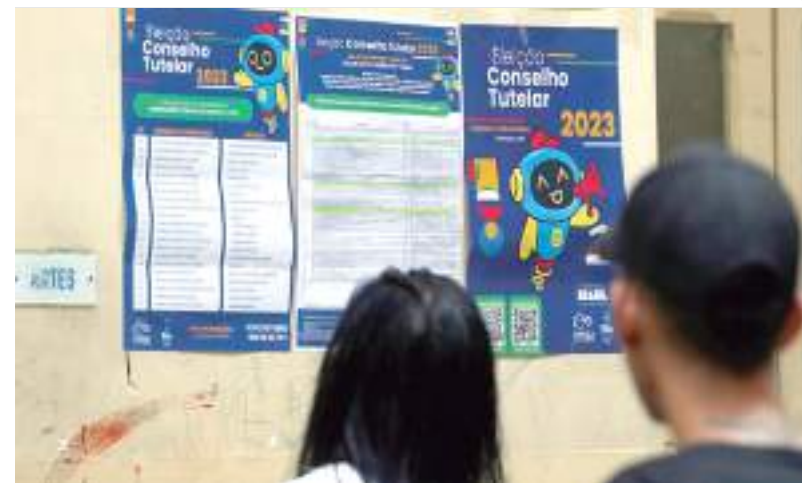
Brasil tem, ao todo, 6.100 conselhos tutelares e 30,5 mil conselheiros