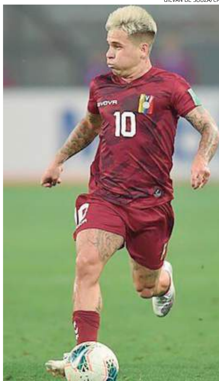
Soteldo deve encarar a Seleção Canarinho

O técnico Fernando Diniz, que assinou um contrato de apenas um ano para comandar a seleção e provavelmente será substituído por Carlo