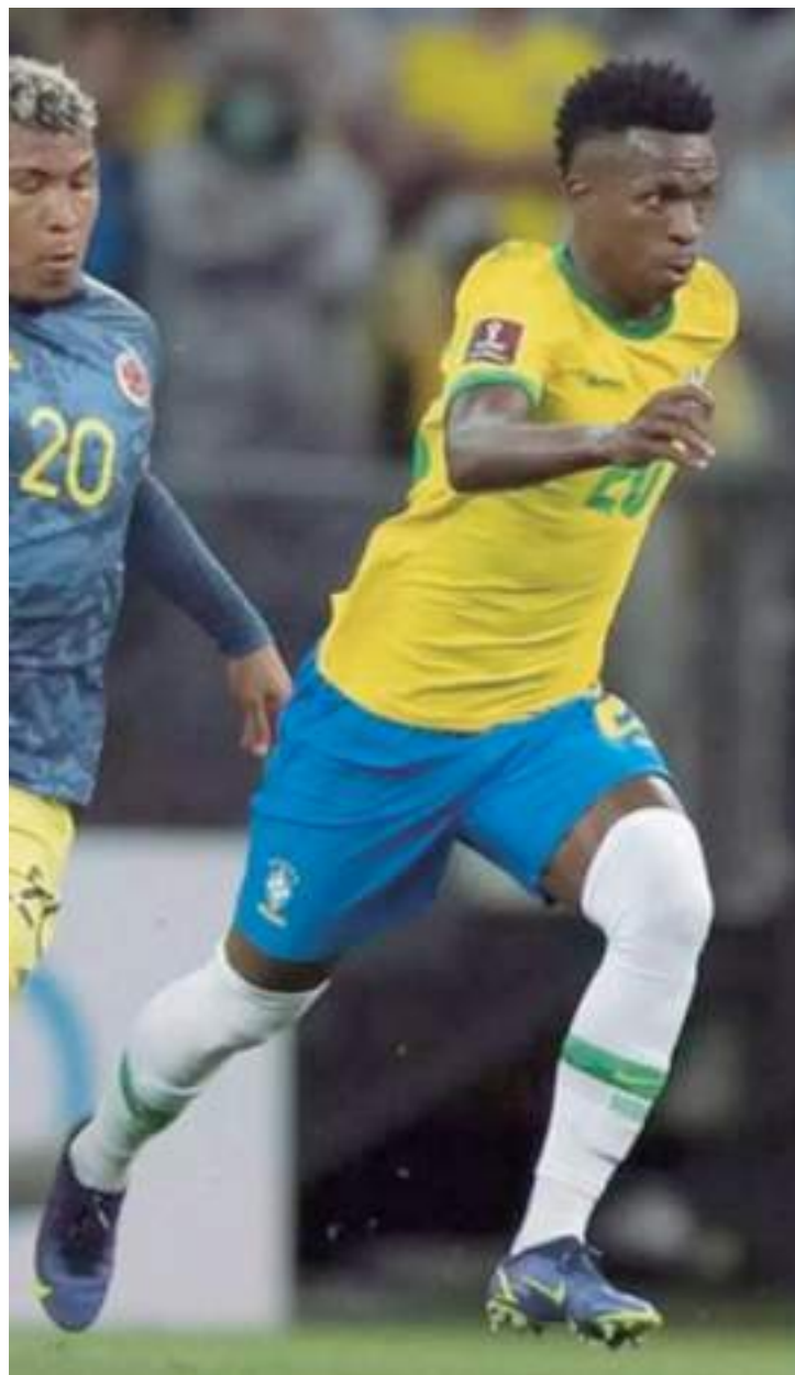
Vini Júnior está confirmado contra Venezuela

Alisson; Danilo, Marquinhos, Bremer (Gabriel Ma-