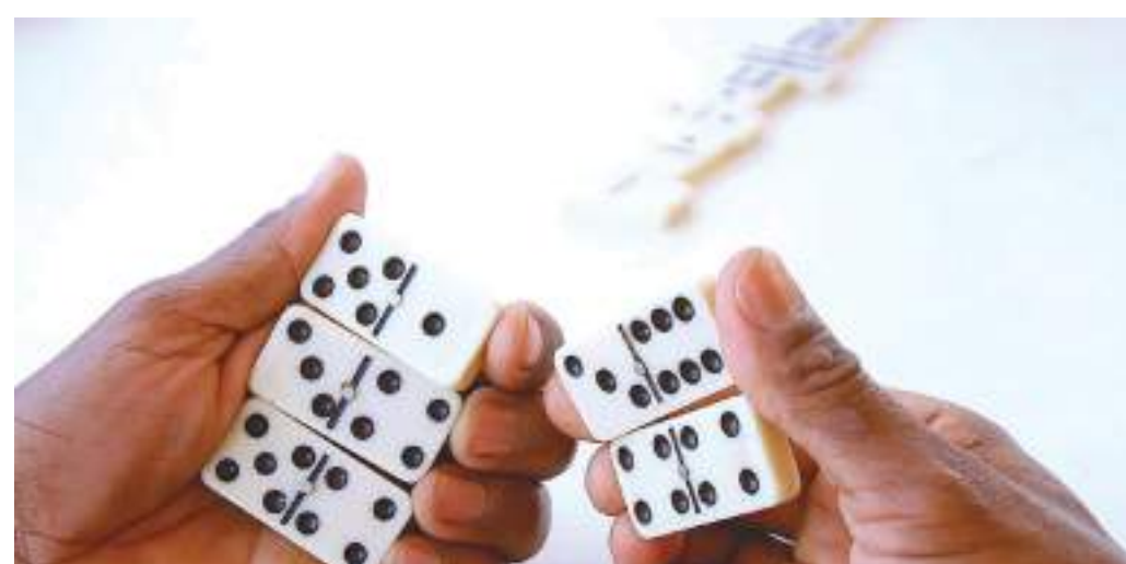
Torneio da Associação Casa do Professor acontecerá em Presidente Figueiredo