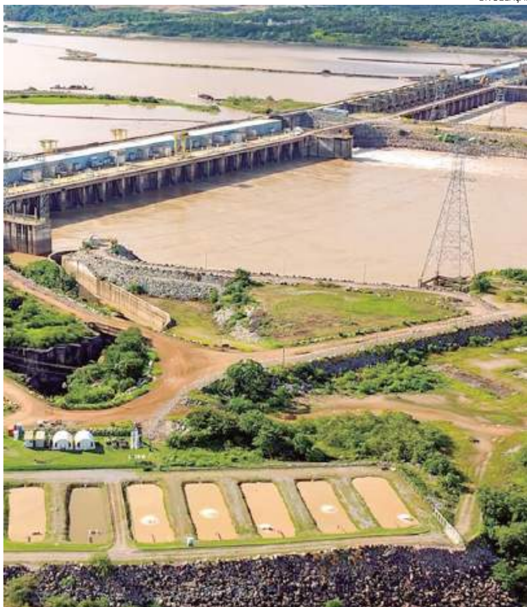
Hidrelétrica de Santo Antônio não era interrompida há 56 anos

Por conta do baixo nível da água, a usina de Santo Antônio parou de funcionar desde o início de outubro, impactando a vida dos ribeirinhos que dependem do fornecimento