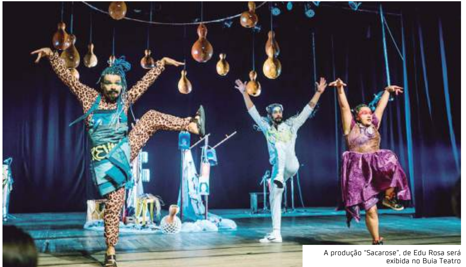
A produção "Sacarose", de Edu Rosa será exibida no Buia Teatro

A montagem traça um paralelo entre as memórias históricas da cana-de-açúcar no Brasil e as lembranças pessoais do artista Edu Rosa, referentes aos abusos trabalhistas vividos por seus familiares nos canaviais. O narrador representa a metáfora caricatural de um Brasil que acredita ser uma república progressista enquanto mantém os cultivos de seus velhos hábitos coloniais.