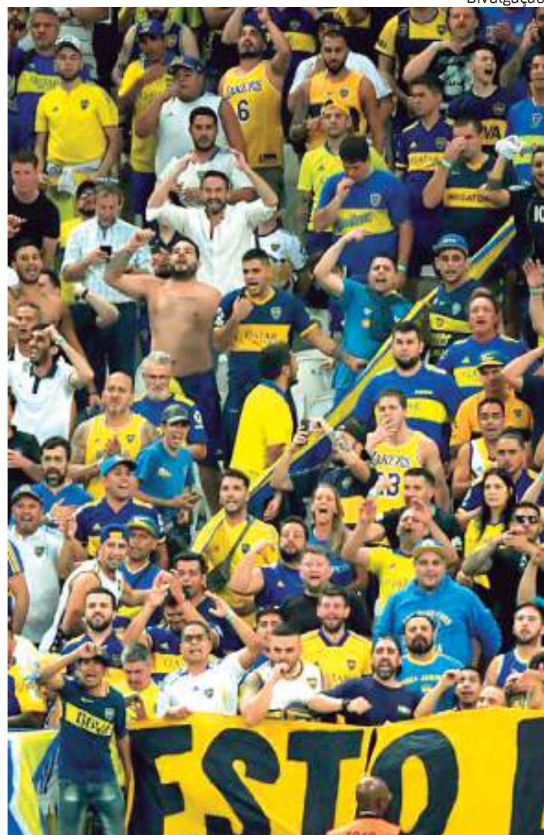
Cem mil torcedores do Boca Juniors prometem invadir Rio de Janeiro

Argentinos prometem invadir a cidade Maravilhosa para jogo da final da Libertadores da América