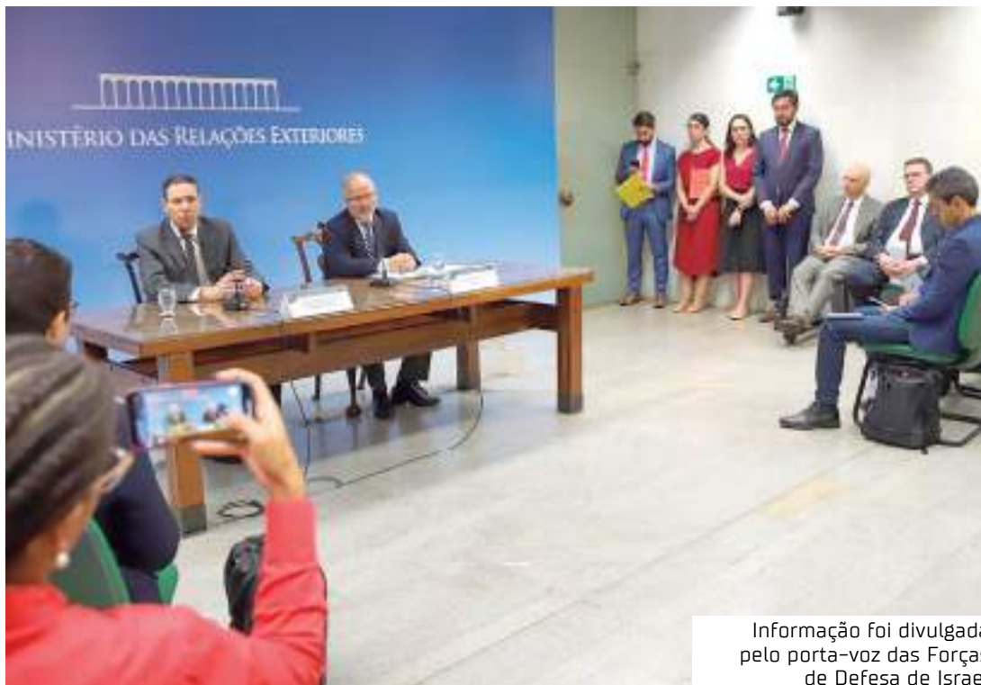
Informação foi divulgada pelo porta-voz das Forças de Defesa de Israel

Gomide, contudo, ressaltou que está sendo feito um