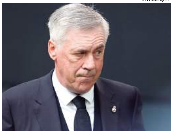
Reitor de universidade 'dedura' acerto de Ancelotti com Brasil