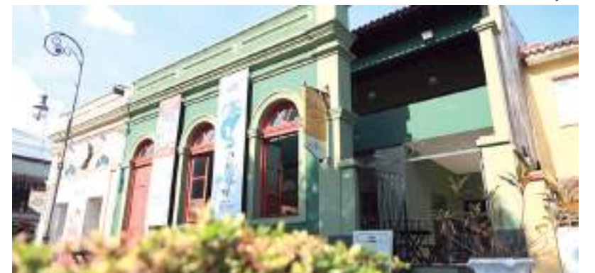
Público deve ficar atento às mudanças nos horários deste feriado