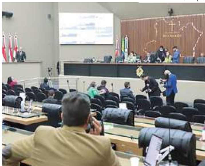
Deputados demonstraram indignação com qualidade péssima do ar

“Isso vai causar um grande prejuízo na saúde pública. O estado precisa fiscalizar e punir quem pratica tal ato, tendo em vista que estamos vivendo um momento delicado