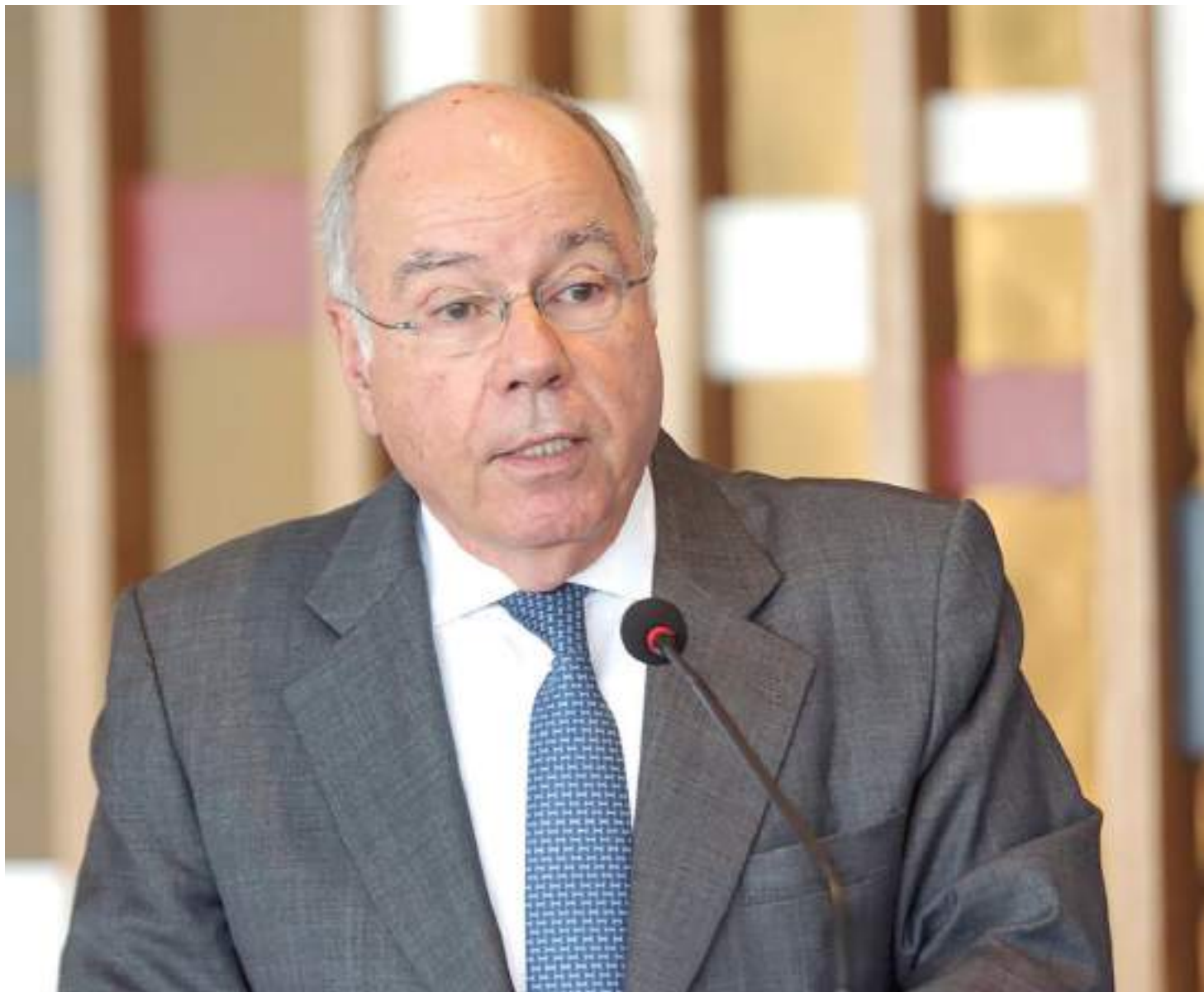
Ministro das relações exteriores, Mauro Vieira conduzirá reunião da Organização das Nações Unidas

Esta é a segunda reunião do Conselho de Segurança da ONU para debater este novo conflito. No fim de semana, o colegiado se reuniu a portas fechadas e nenhuma declaração foi emitida.