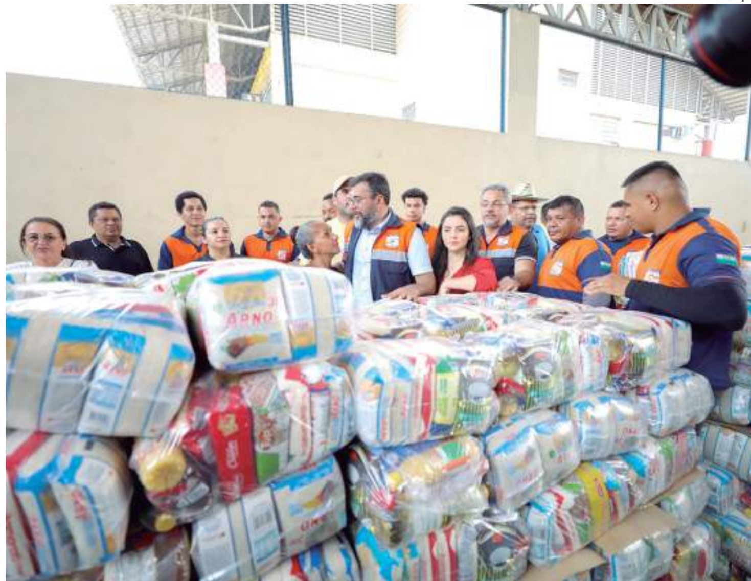
Além de cestas básicas, também foram entregues 200 kits de higiene, uma doação do Alto Comissariado das Nações Unidas

Além de cestas básicas, também foram entregues 200 kits de higiene, uma doação do Alto Comissariado das Nações Unidas (Acnur) para o Governo do Estado, por meio da Secretaria de Justiça e Cidadania (Sejusc); aproximadamente 10 mil copos de água pela Companhia de Saneamento do Amazonas (Cosama); kits de alimentos