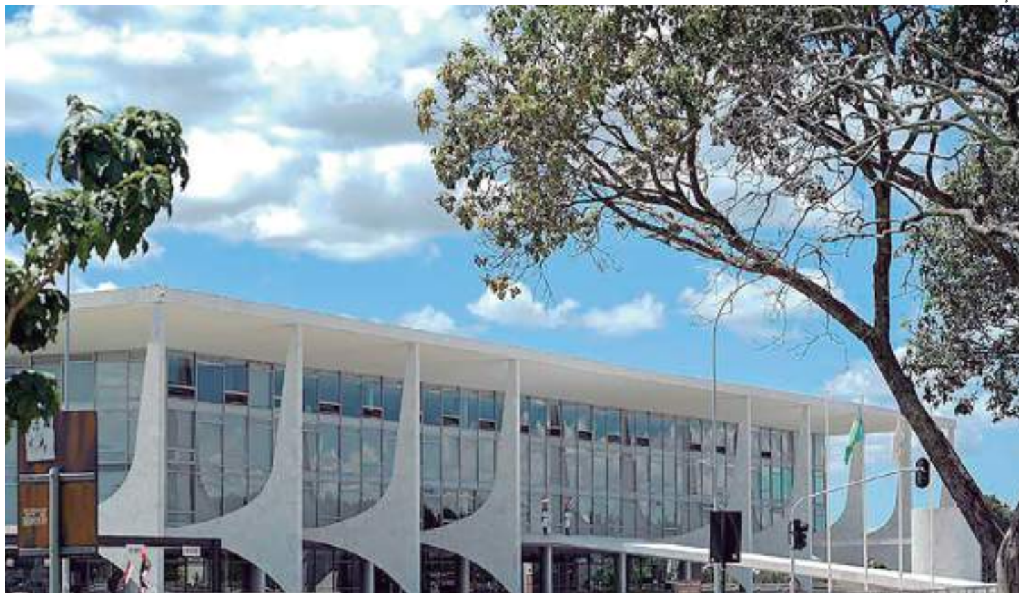
A forma de concessão das bolsas será regulamentada pelo Ministério da Educação

A nova lei foi publicada na edição do Diário da Oficial da União desta quarta-feira (11) com um veto. O presidente decidiu rejeitar justamente um dispositivo inserido pelos senadores quando a matéria foi votada no Senado, em julho deste ano. O relatório da senadora Teresa Leitão (PT-PE) apresentou artigo que permitia a técnicos administrativos que atuam em instituições