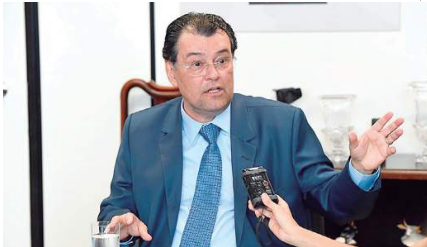
Braga informou que já recebeu mais de 380 emendas de senadores ao projeto

A PEC 45/2019 unifica a legislação tributária, busca diminuir os impostos sobre o consumo, prevê a criação