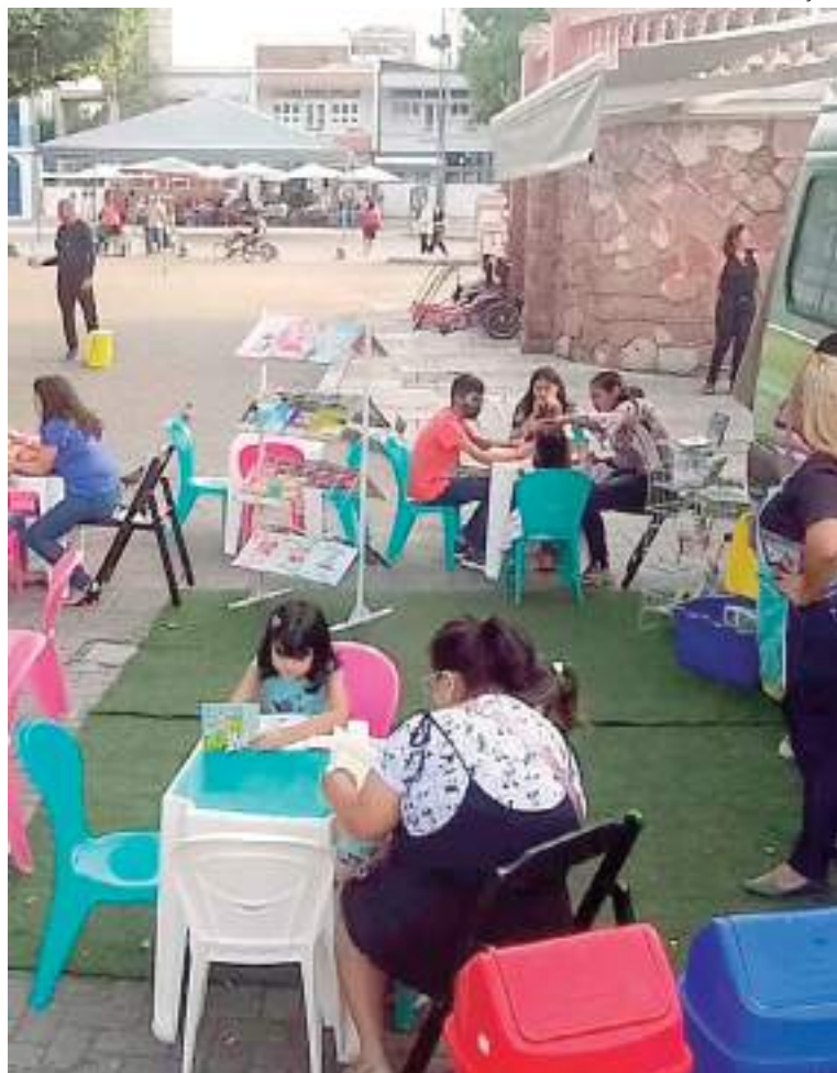
Programação conta com atividades que incentivam a leitura