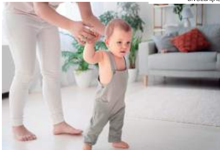
Diagnóstico precoce e tratamento permitem minimizar os efeitos da doença

O diagnóstico da deficiência hormonal em crianças envolve uma avaliação clínica detalhada, análises