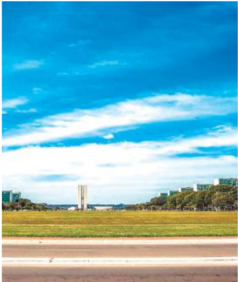
Coordenação será feita pela Secretaria Nacional de Participação Social