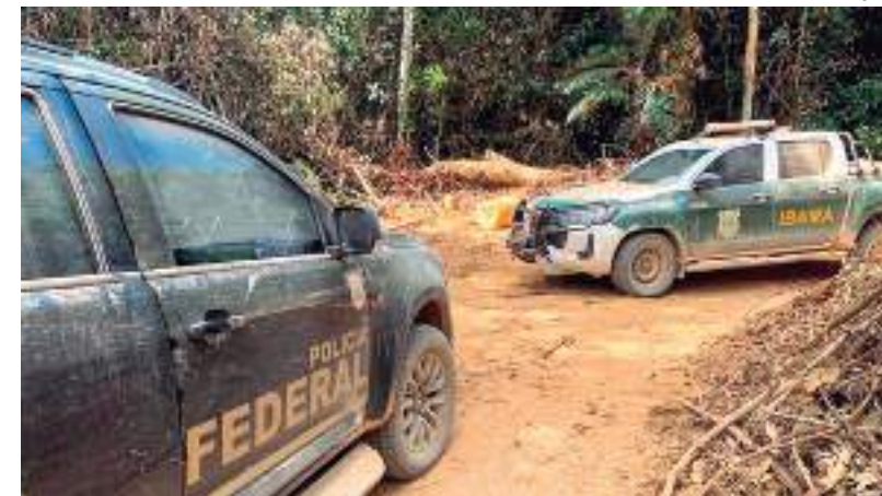
Carros da PF e Ibama em operação na Amazônia