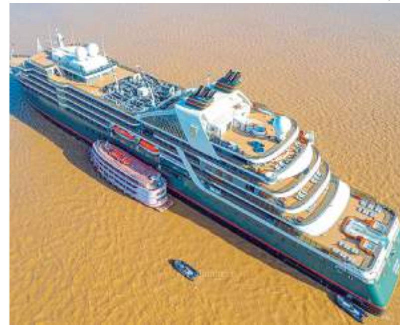
Primeiro navio a atracar em Parintins é o "Sabourn Pursuit"