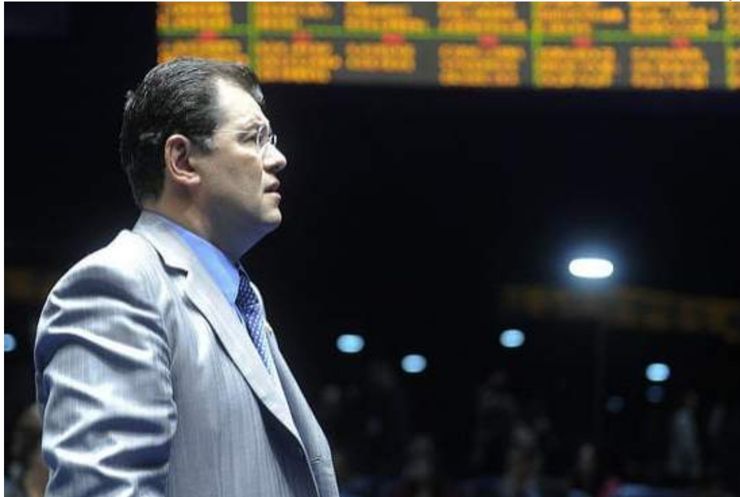
Relator já deixou claro que texto apresentará modificações em relação ao material apresentado pela Câmara dos Deputados

"Nós estamos fazendo toda essa revisão. Por isso é que estou dizendo, muito provavelmente nós teremos algumas versões do nosso