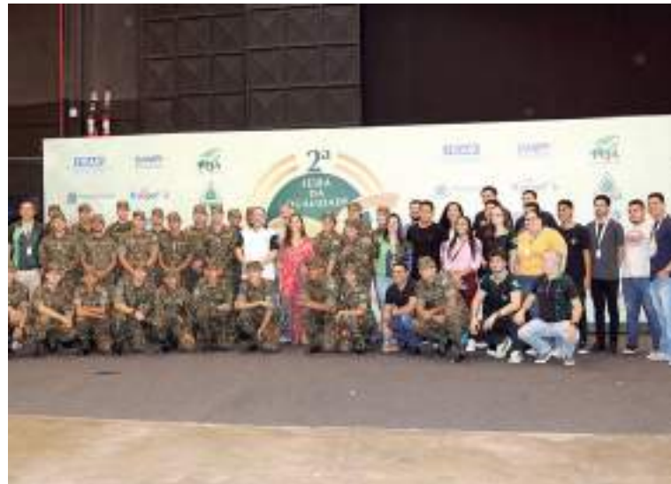
Conexthus Instituto e Cigs se apresentaram no primeiro dia da feira