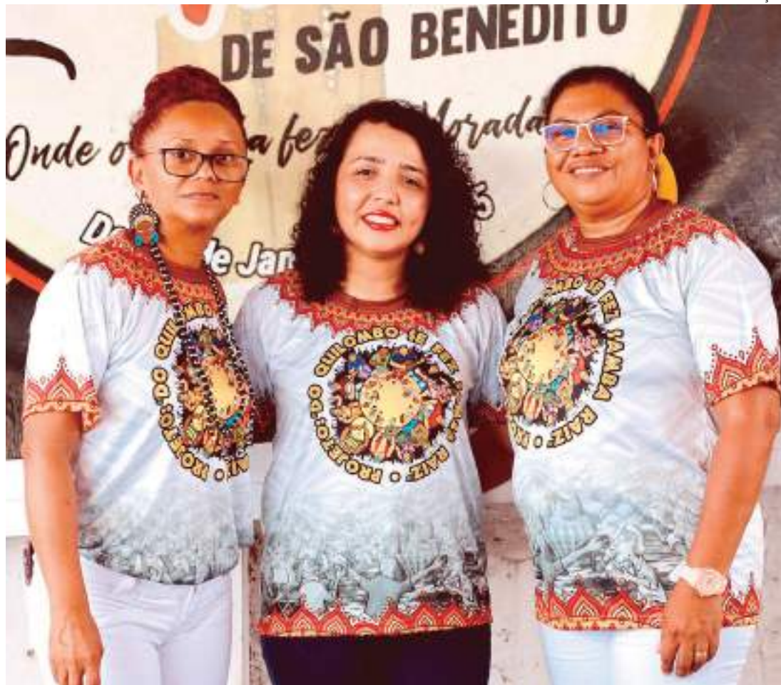
No total, o projeto vai abrir inscrições para duas turmas com aulas teóricas e práticas

A partir disso ficou o desejo de continuar compartilhando o conhecimento musical com pessoas para além da comunidade. Assim, a primeira edição do projeto aconteceu no início deste ano, com a aprovação