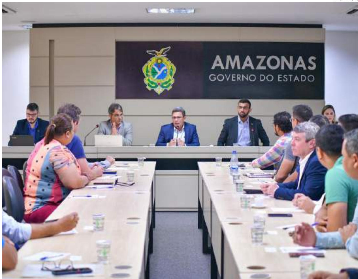
Reunião, na sede do Governo, que tratou sobre os investimentos foi conduzida pelo vice-governador Tadeu de Souza

Anunciado em setembro pelo presidente Luiz Inácio Lula da Silva, o União com Municípios terá como condição para a transferência de repasses a redução das taxas de queimadas e desmatamento, com base nos