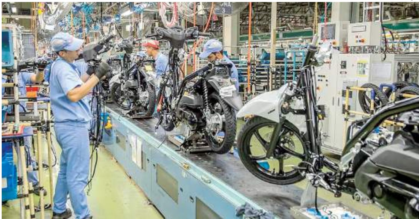
Produção da Yamaha Motor da Amazônia terá paradas programadas por conta da falta de insumos

“A ideia é antecipar as férias coletivas que estavam programadas para depois do dia 10 de dezembro, para agora. E quando chegar a matéria-prima, não haja demissão desses trabalhadores. Não é toda fábrica, vai pelos cálculos que fizemos aqui;