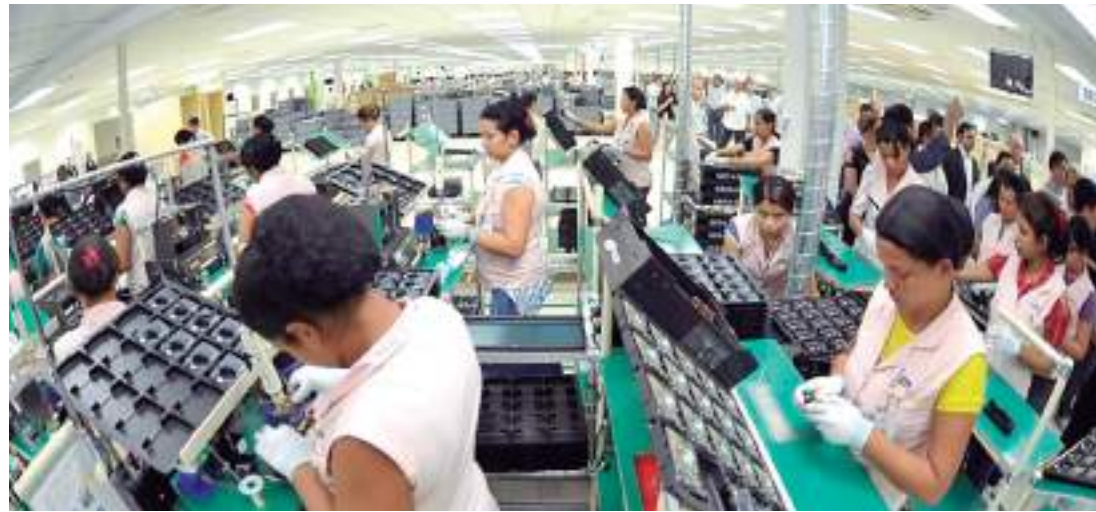
Samsung anunciou que irá antecipar as férias coletivas de parte dos colaboradores

Estatísticas apontam que aproximadamente 35 empresas do Polo Industrial de Manaus (PIM), irão aderir à medida. Conforme especialista, a medida pode preservar empregos,