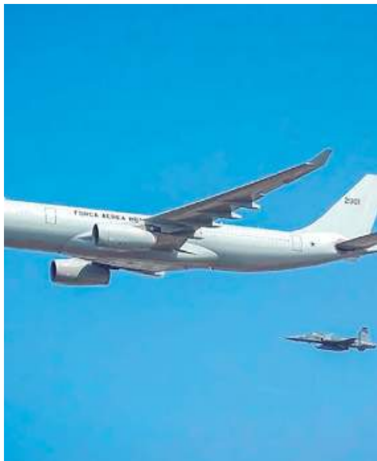
Aeronaves da FAB buscam brasileiros em Israel e Gaza