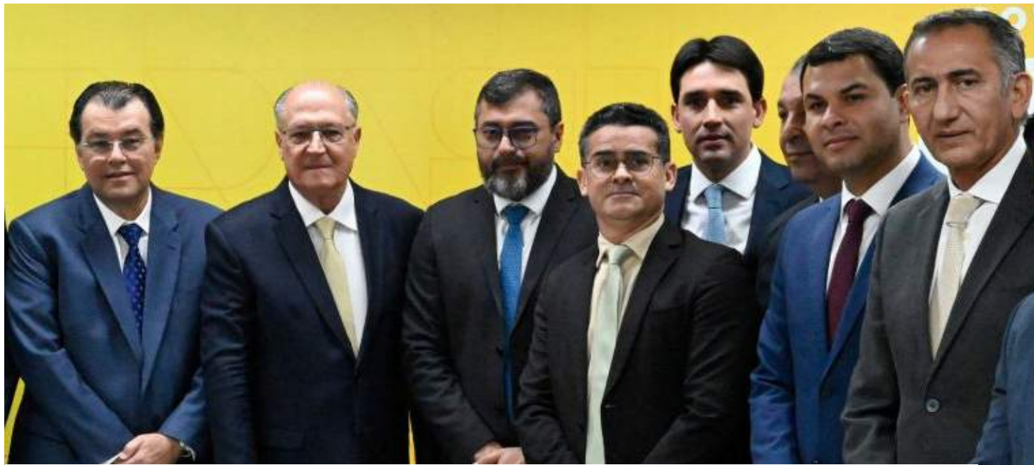
Parlamentares definiram valores e parte da logística de ajuda aos afetados pela estiagem

Além disso, o mandatário municipal teve a confirmação da liberação do pagamento unificado do Bolsa Família para quase 600 mil famílias de municípios do Amazonas com decreto de emergência por conta da estiagem histórica. Um total de R$ 440,5 milhões, de acordo com informações do Ministério do Desenvolvimento e Assistência Social, Família e Combate à Fome (MDS), do Governo Federal.