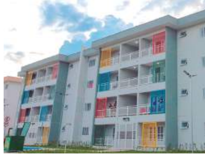
Empreendimento habitacional construídos pelo programa