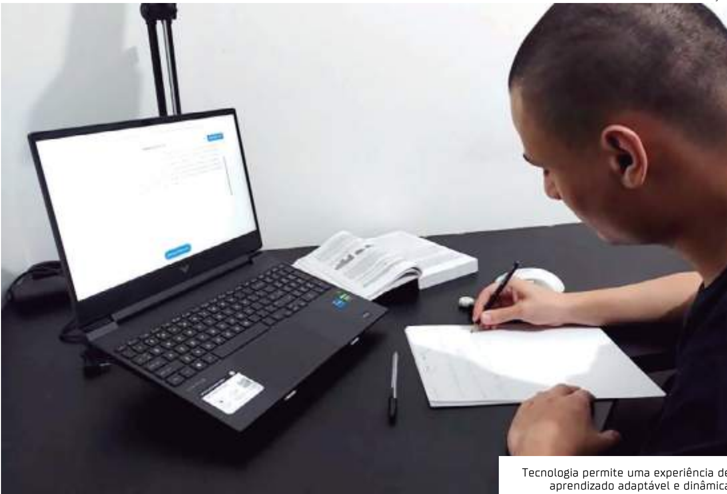
Tecnologia permite uma experiência de aprendizado adaptável e dinâmica