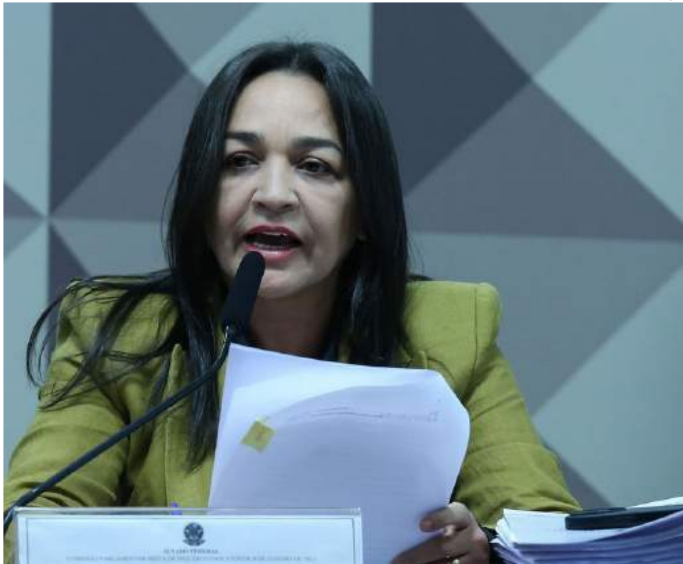
Relatório da CPMI será enviado para instâncias de investigação, como o Ministério Público Federal

O relatório de Eliziane aponta Bolsonaro como o maior culpado pelos atos golpistas de janeiro, fazendo a construção