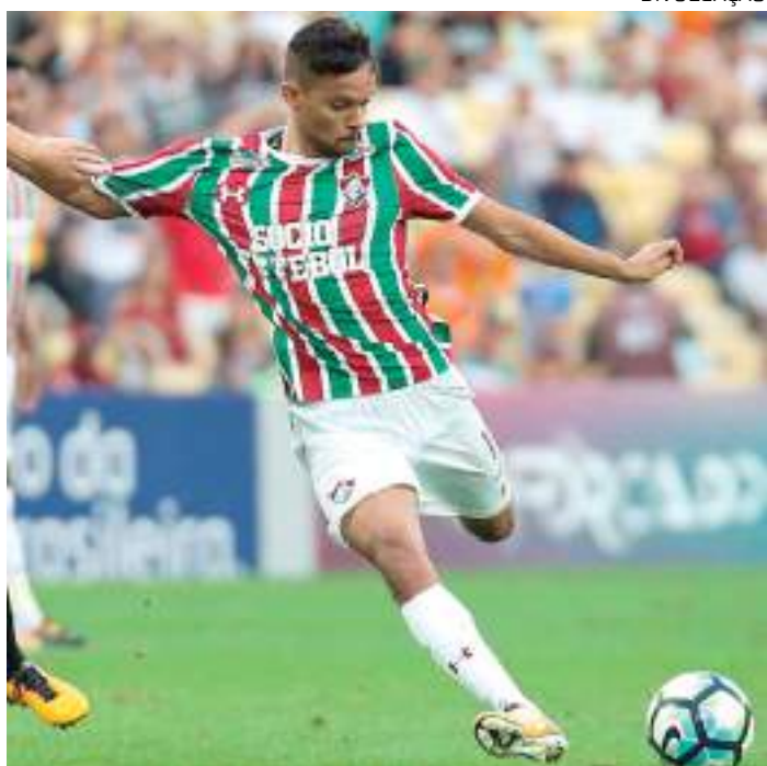
Flu e Timão vão jogar no estádio Maracanã na noite desta quinta-feira (19)

Em meio à expectativa pela final da Libertadores, o Fluminense volta suas atenções para o Campeonato Brasileiro. Fora do G4, o Tricolor terá a tarefa de voltar a vencer depois de duas rodadas para não deixar o pelotão de frente se distanciar. Para isso, os comandados de Fernando Diniz precisam manter o tabu de mais de seis anos sem perder para o Corinthians no Maracanã.