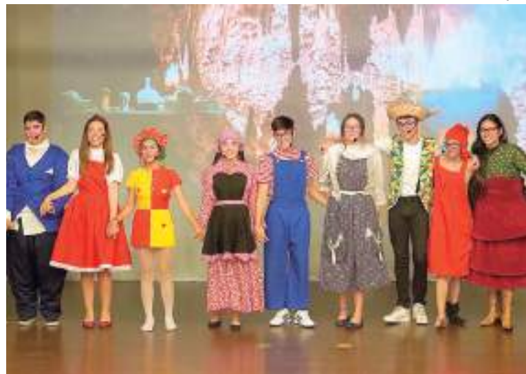
Alunos transformam obras nacionais e internacionais em peças teatrais