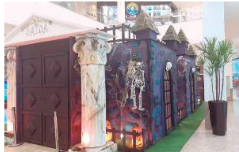
Atração vai funcionar até o dia 31 de outubro