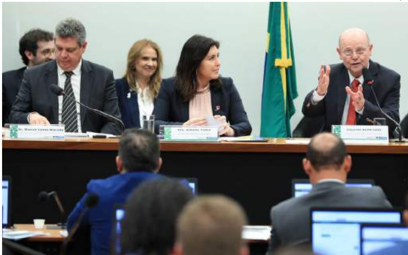
Segundo ela, o governo formou grupos de trabalho para fazer um levantamento sobre as renúncias fiscais e para corrigir erros

"É preciso tirar de quem não merece e está recebendo de forma injusta para dar para quem precisa. Se nós conseguirmos virar essa chave e garan-