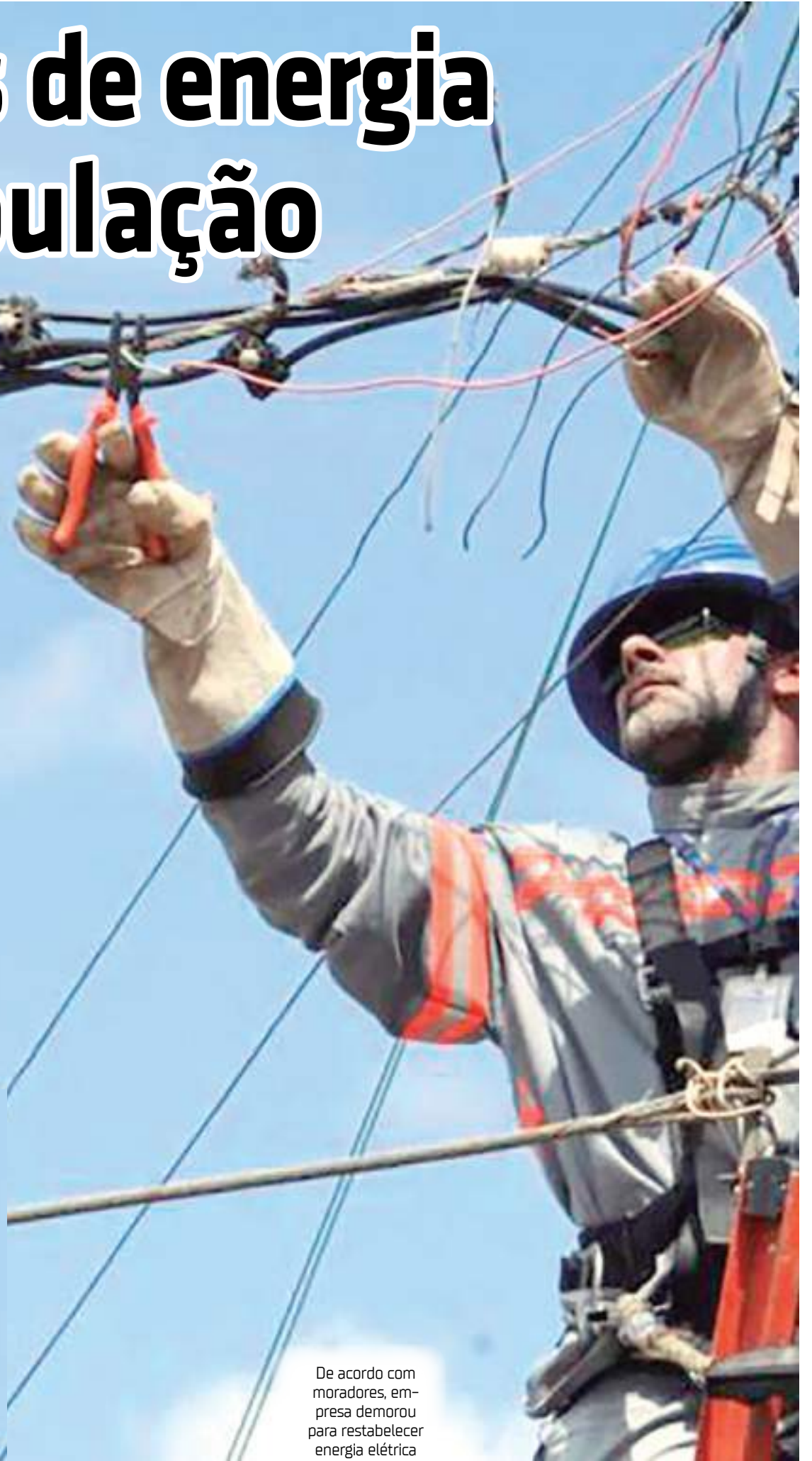
De acordo com moradores, empresa demorou para restabelecer energia elétrica

Em nota, a Amazonas Energia informou o fornecimento de energia na comunidade do Tupé encontra-se normal, a ocorrência foi atendida ontem mesmo, normalizando assim o fornecimento de energia na localidade. Desde agosto, aumentaram as ocorrências, solicitações de serviços pelas equipes de manutenção da Amazonas Energia, que atuam em regime de plantão de 24 horas.