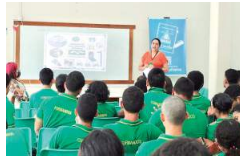
Estudantes da Escola Ângelo Ramazotti participam de palestra