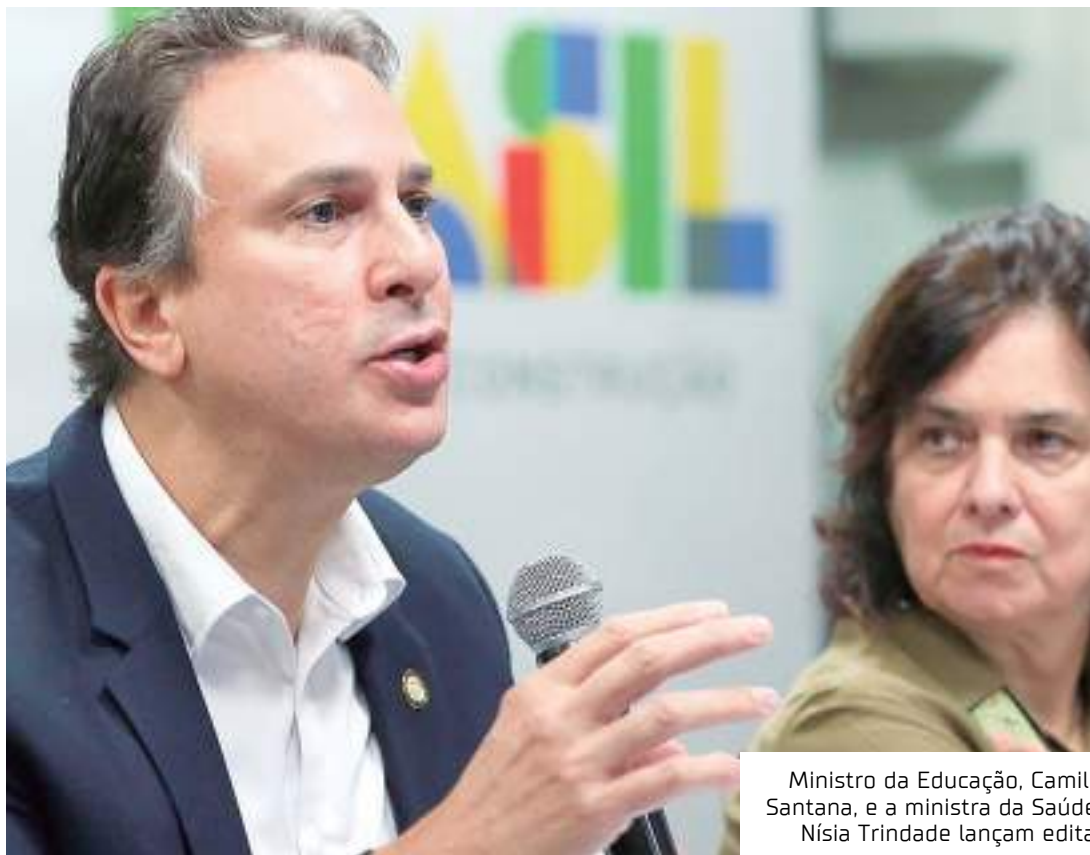
Ministro da Educação, Camilo Santana, e a ministra da Saúde, Nísia Trindade lançam edital

Para alcançar a meta da OCDE, é necessária a abertura