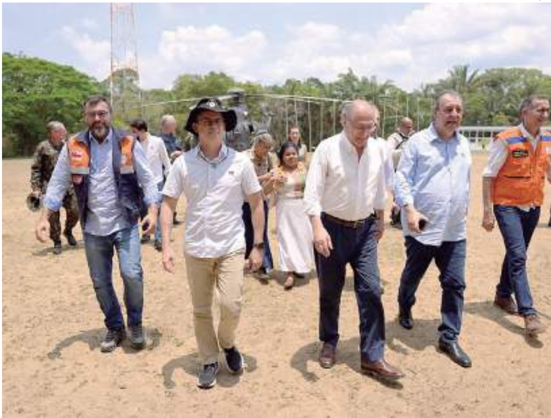
Autoridades da região Norte acompanharam vice-presidente em visita no AM

Segundo o governador do Amazonas, a infraestrutura da