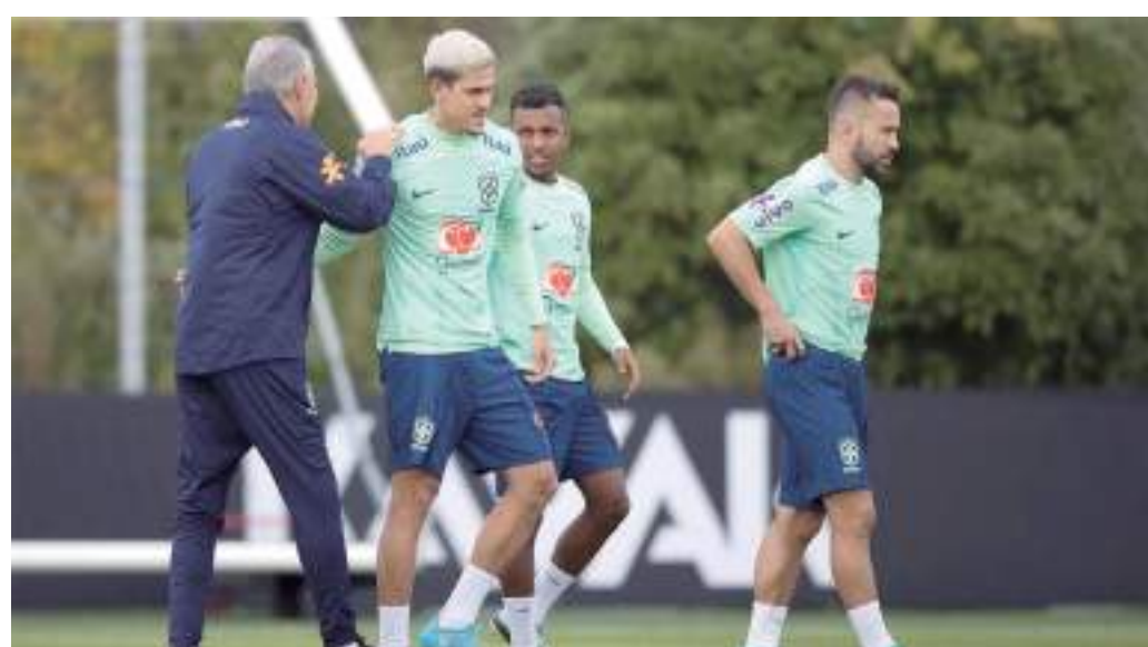
Tite assume Flamengo na próxima semana, após jogo do Rubro-Negro contra o Timão