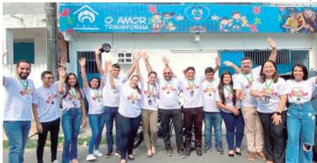
Instituição recebe doação de brinquedos para campanha do Dia das Crianças

A quarta edição da campanha solidária do Pátio Gourmet, pelo Dia das Crianças recebe doações de brinquedos novos e usados, que serão entregues ao Projeto Casa Azul