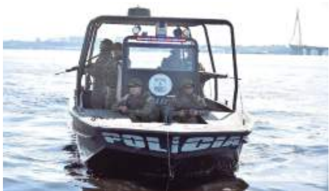
Patrulhamento fluvial na Amazônia Legal

MINISTÉRIO DA JUSTIÇA E SEGURANÇA PÚBLICA