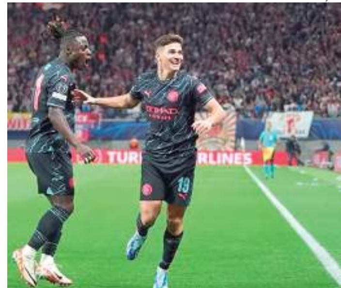
Álvarez marcou um dos gols da vitória do City na Champions