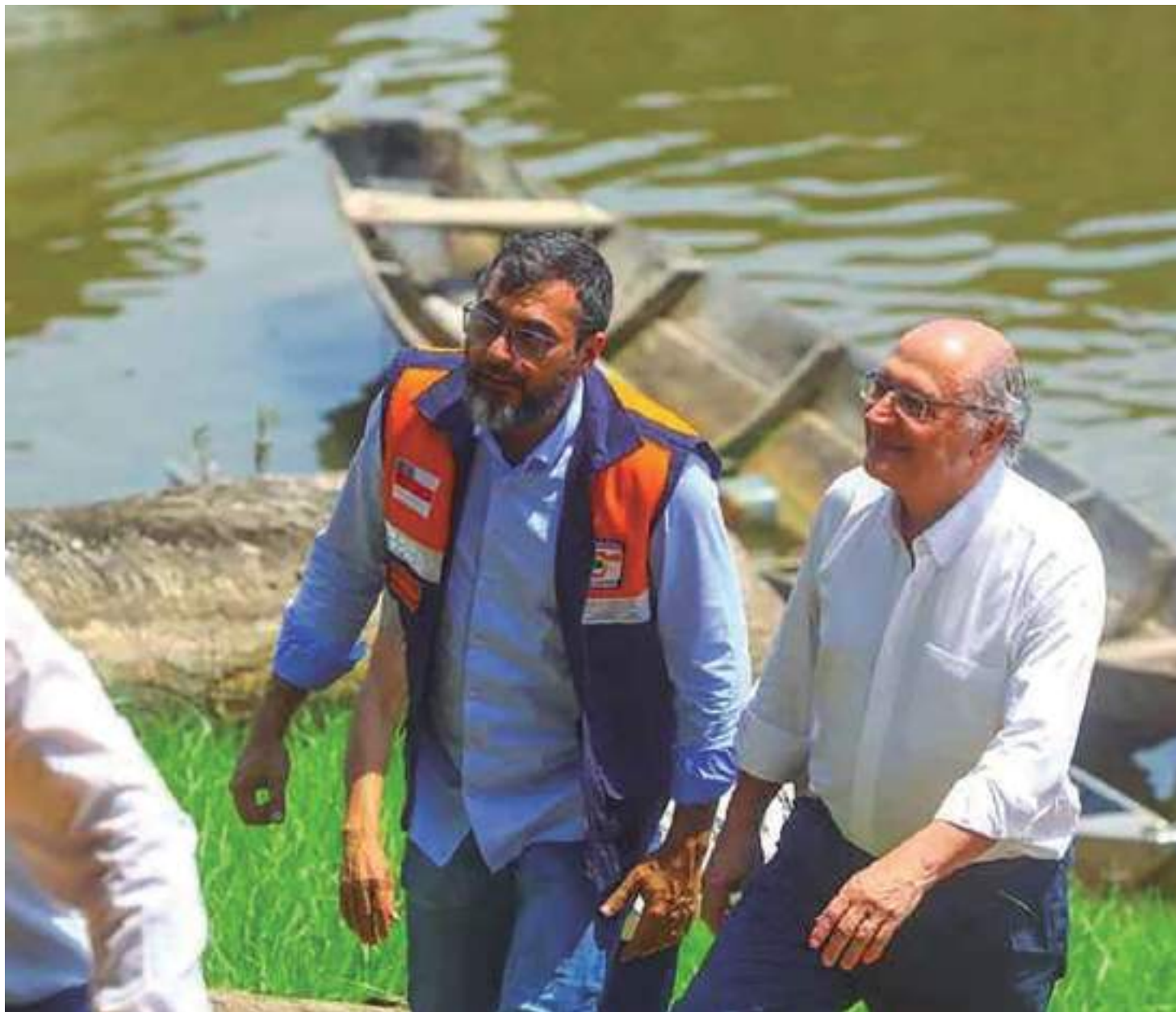
Governador e vice-presidente visitaram comunidades afetadas pela estiagem no Amazonas

No rio Solimões, o serviço de dragagem será realizado ao longo de 8 quilômetros de extensão, entre os municípios de Tabatinga e Benjamin Constant. Realizado pelo Departamento Nacional de Infraestrutura