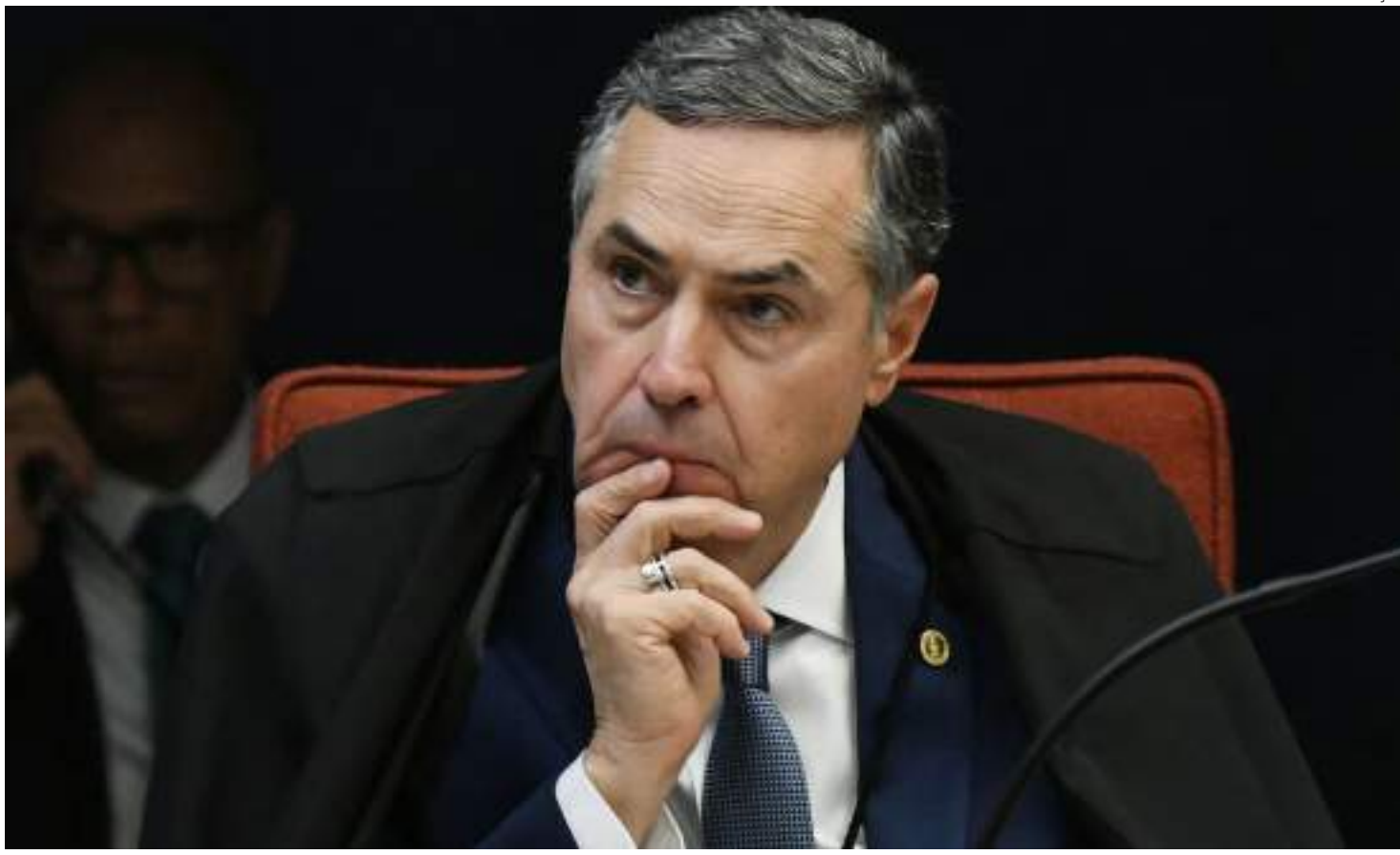
Ministro tenta brejar esforços do Senado para alterar normas atuais do Supremo Tribunal Federal

missão de Constituição e Justiça) do Senado aprovou em votação relâmpago uma PEC [proposta de emenda à Constituição] que limita as decisões monocráticas [individuais] e pedidos de vista [mais tempo para análise] em tri-