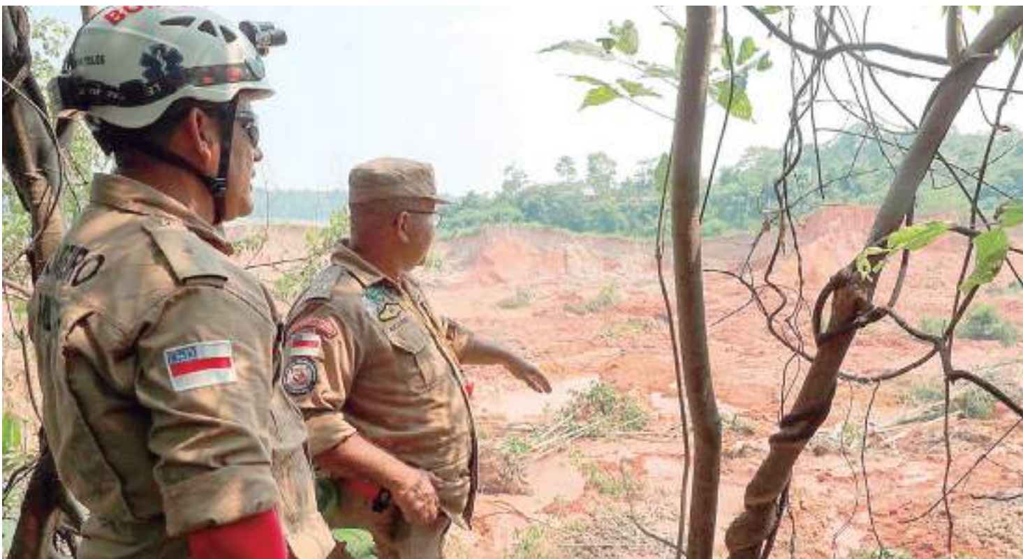
Corpo de Bombeiros Militar do Amazonas realizam análise na área

De acordo com o Serviço Geológico do Brasil, solo do povoado apresentava 'cicatriz' de 90 m