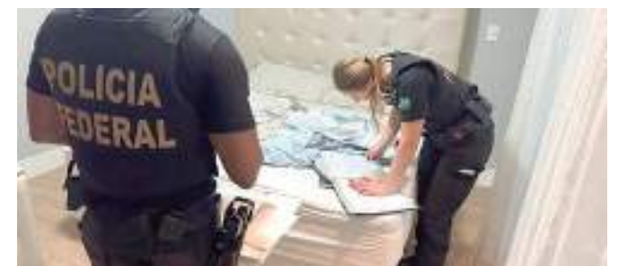
Polícia Federal realizou 21 mandados de busca e apreensão

As empresas eram criadas com CNPJ, documento de pessoa jurídica, constituído. Entretanto, tinham o intuito de darem continuidade a atividade ilegal de venda de planos de saúde sem registro na Agência Nacional de Saúde Suplementar (ANS).