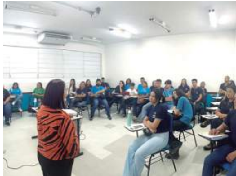
Alunos, egressos e profissionais de consultoria participaram do evento