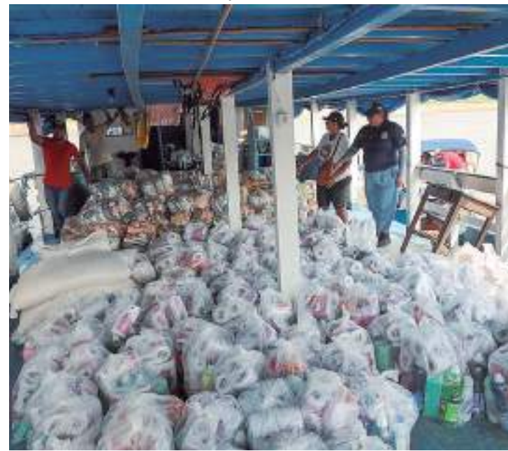
Governo já distribuiu 150 cestas básicas além de água potável e demais itens