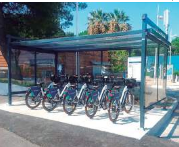
Estacionamentos são comuns em diversas capitais do país

Para Peixoto, esta primeira aprovação mostra a boa vontade que os parlamentares têm em relação aos ciclistas que