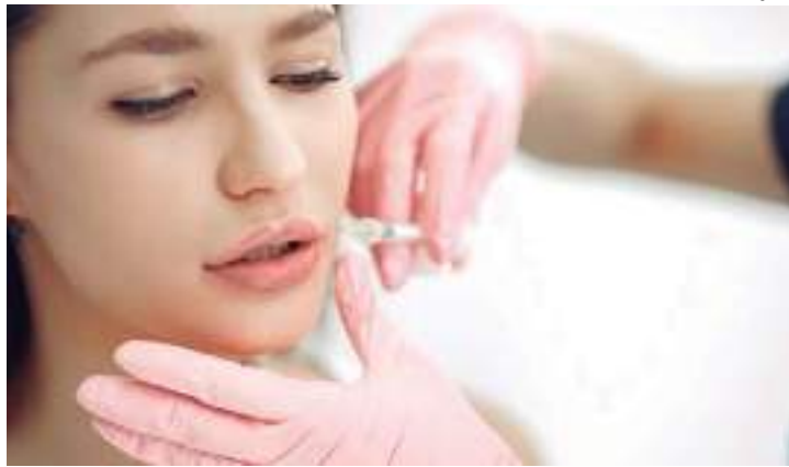
Procedimento revoluciona tratamento de problemas de saúde

É o caso da sudorese excessiva, ou seja, o excesso de suor em mãos, pés, axilas, que muitas pessoas sofrem silenciosamente. É chamada também de hiperidrose e causa muitos constran-