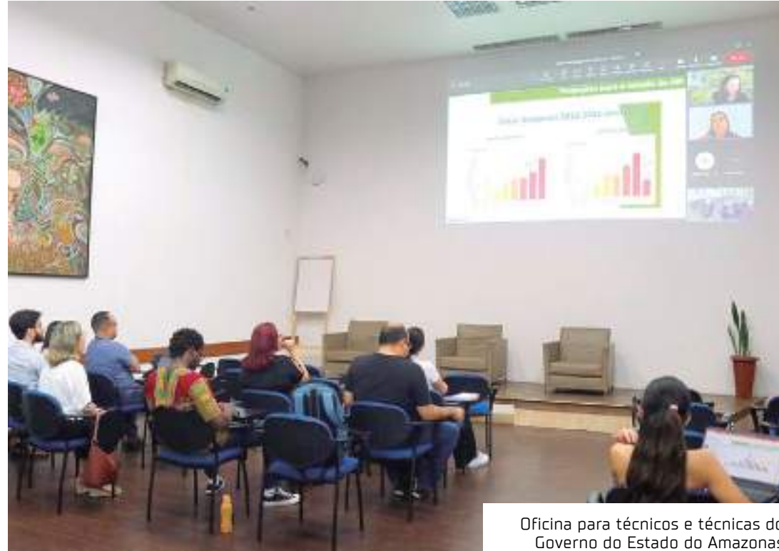
Oficina para técnicos e técnicas do Governo do Estado do Amazonas

Como parte da oficina, foram mapeadas as legislações vigentes no estado que atendem às