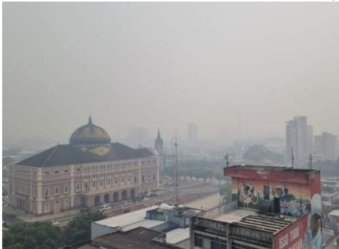
Fumaça de queimadas "esconde" Teatro Amazonas

No ambiente doméstico, é importante o uso de umidificadores, vaporizadores ou de uma bacia com água para dei-