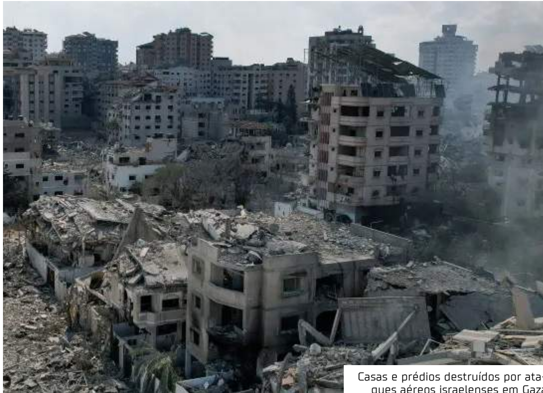
Casas e prédios destruídos por ataques aéreos israelenses em Gaza