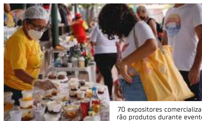
70 expositores comercializam produtos durante evento

desenvolvimento sustentável da Amazônia por meio de programas e projetos nas áreas de educação e cidadania, saúde, empoderamento, pesquisa e inovação, conservação ambiental, infraestrutura comunitária, empreendedorismo e geração de renda.