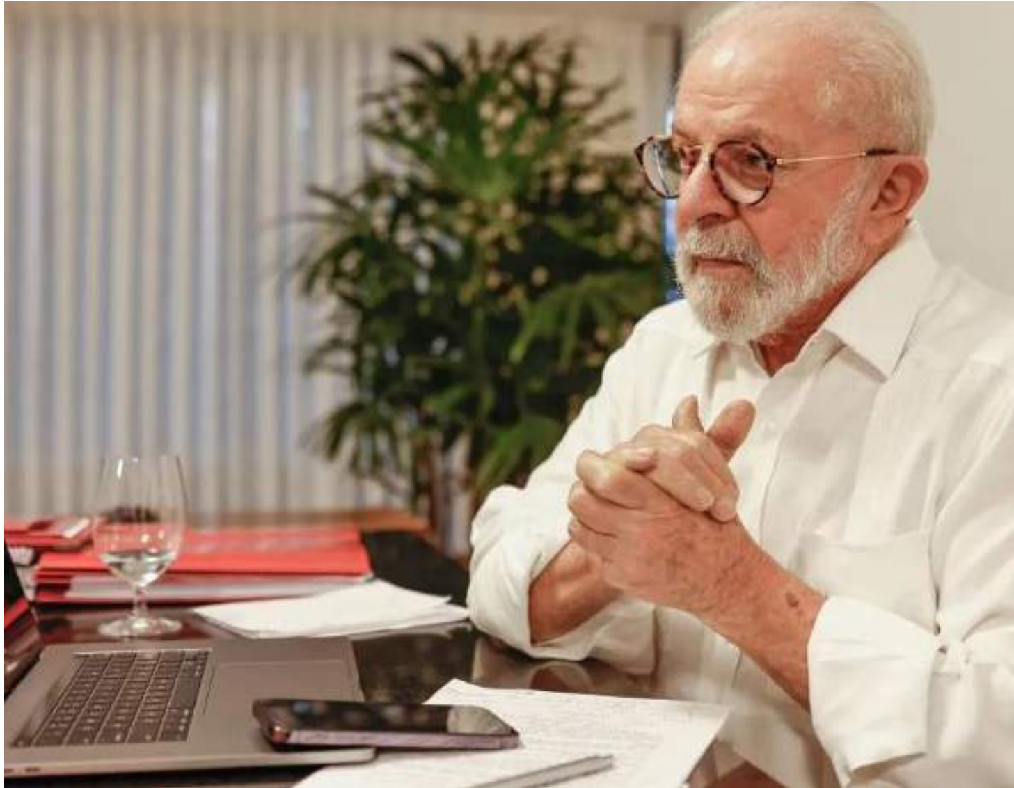
Presidente Lula compartilhou registro feito de ligação para autoridades israelenses que brecam saída por Gaza

“Reafirmei a condenação brasileira aos ataques terroristas e nossa solidari-