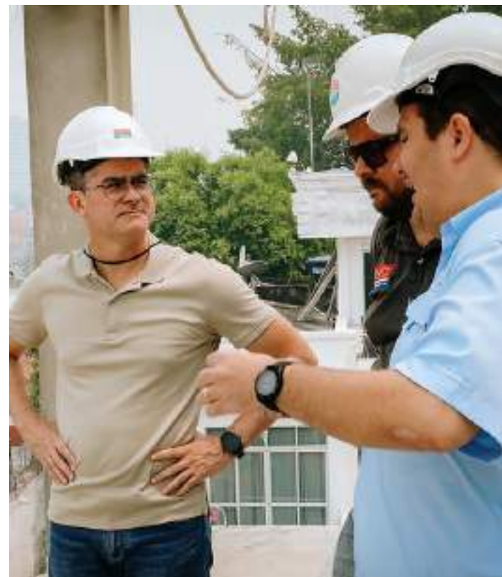
Projeto tem inauguração prevista para dezembro deste ano