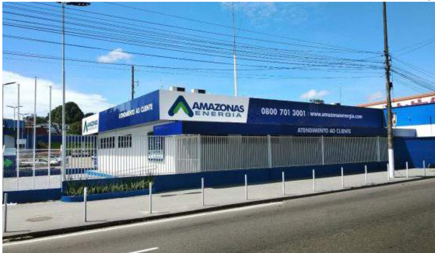
Concessionária de Energia acumula diversas reclamações e denúncias na Comissão de Defesa do Consumidor

No ofício formalizado, o parlamentar destacou que moradores dos bairros mencionados relataram prejuízos materiais devido à falta de