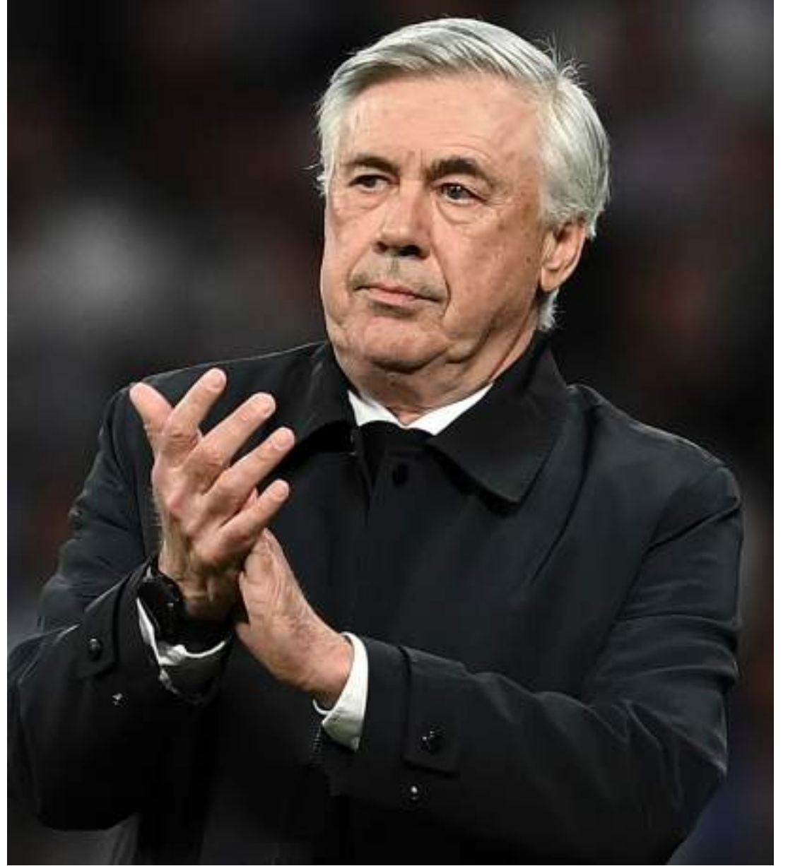
Carlo Ancelotti deve comanda a Seleção Brasileira no próximo ano, segundo sites de notícias

Cabe destacar que os valores citados acima são brutos e antes do pagamento de impostos (que são elevados na Espanha).