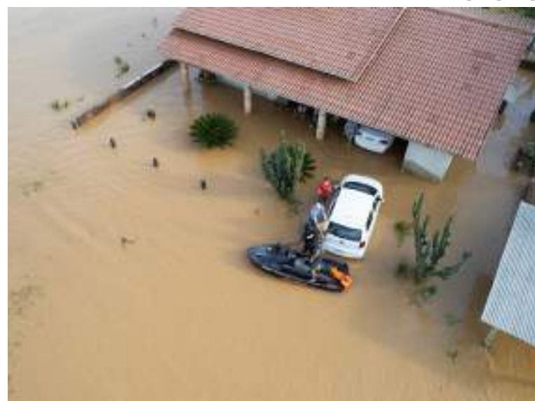
Área alagada pelas fortes chuvas em Santa Catarina

Waldez Góes listou as atividades de vários ministérios e órgãos federais que, neste momento, estão à disposição de Santa Catarina para somar esforços. De acordo com o ministro, a Caixa Econômica Federal poderá disponibilizar o Saque Calamidade do FGTS (Fundo de Garantia do Tempo de Serviço) aos trabalhadores de cidades com o estado de calamidade pública já reconhecido; assim como a antecipação do pagamento de benefícios sociais, como o Bolsa Família, pelo Ministério do Desenvolvimento e Assistência Social, Família e Combate à Fome, aos beneficiários residentes nestas regiões.