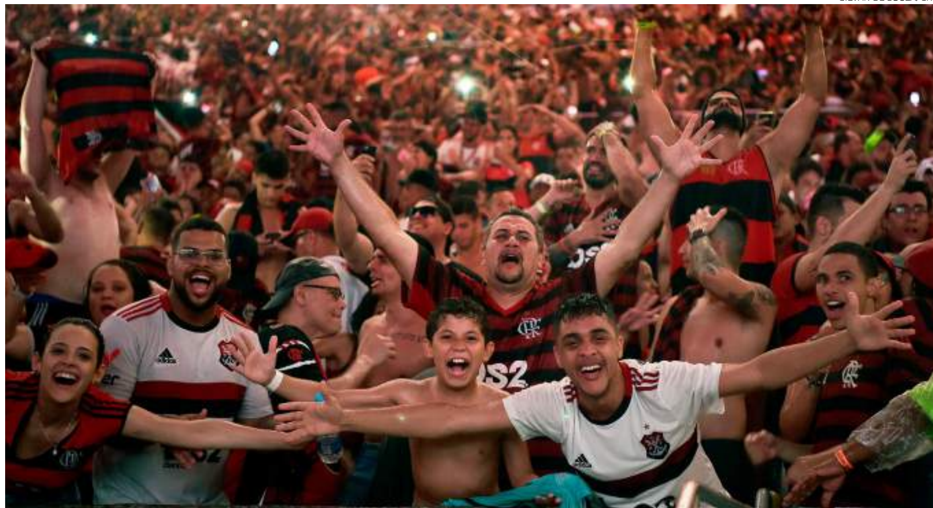
Torcedores do Flamengo lotam estádios por onde o clube joga

1. Flamengo: 32.394 torcedores (1 jogo sem público como visitante)