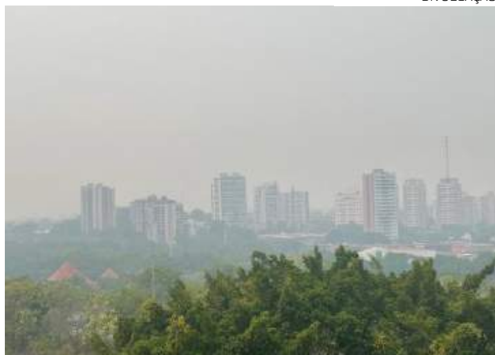
MPAM vem monitorando qualidade do ar em parceria com UEA

"Estamos acompanhando a atuação do Governo Estadual frente ao enfrentamento das queimadas e da seca via ações de fiscalização e logística. A opera-