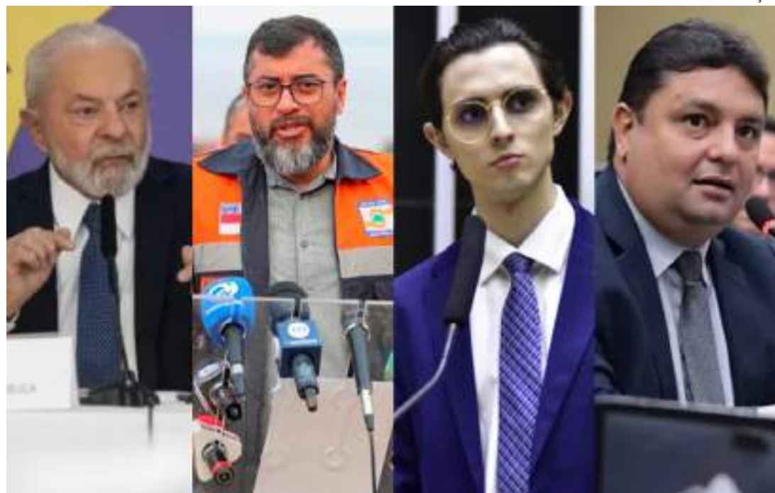
Parlamentares de todas as esferas movimentam-se para ajudar Amazonas

O Amazonas enfrenta uma seca histórica e o governo fe-