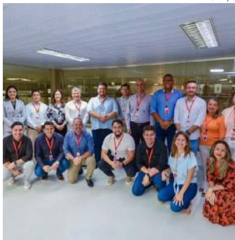
Suframa conhece a primeira empresa do PIM a obter certificação 'Lixo Zero'