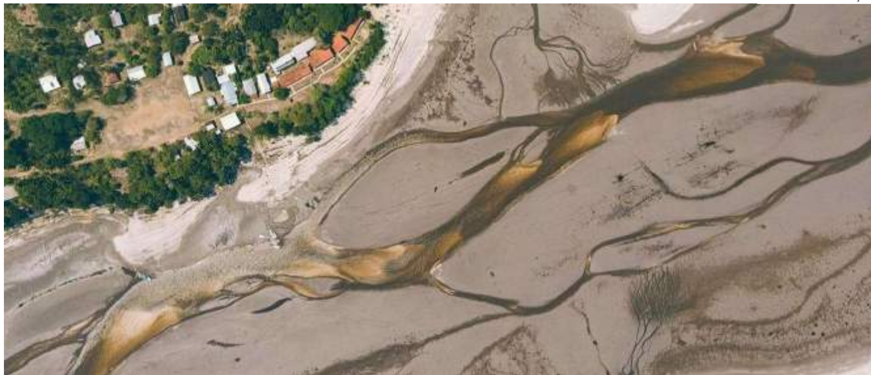
Rio Preto da Eva faz parte das 50 cidades do Amazonas que enfrentam uma situação de emergência devido à seca

O Serviço Autônomo de Água e Esgoto de Rio Preto da Eva (SAAE) ressaltou a