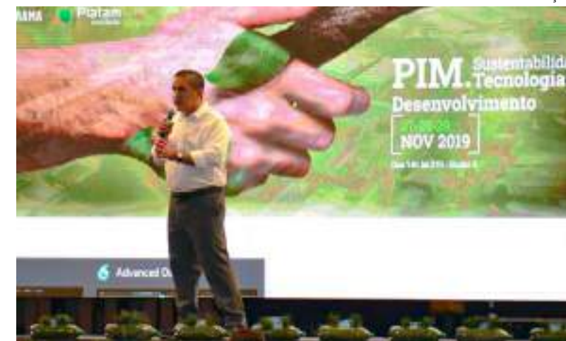
FesPIM promete apresentar as novidades em tecnologia