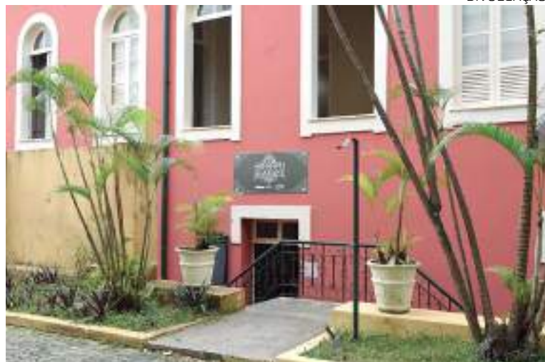
Projeto realiza mostra coletiva com 13 filmes em exibição