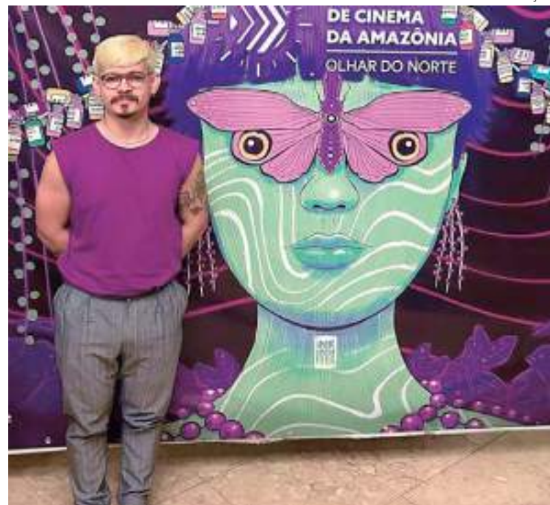
Evento contará com 15 desenhos do artista gráfico Yan Bentes