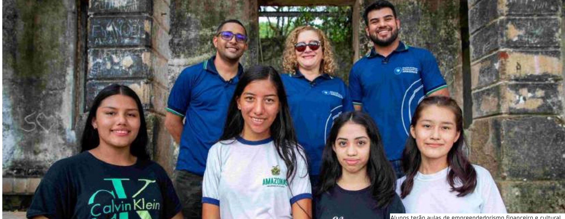
Alunos terão aulas de empreendedorismo financeiro e cultural

Aulas de empreendedorismo alcançarão 9 mil estudantes de 33 municípios por meio das transmissões do Centro de Mídias