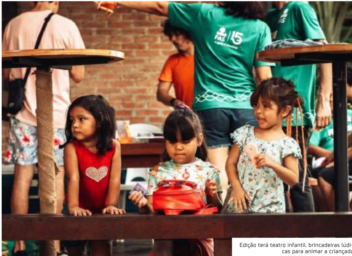
Edição terá teatro infantil, brincadeiras lúdicas para animar a criançada

A Fundação Amazônia Sustentável (FAS) é uma organização da sociedade civil sem fins lucrativos que atua pelo