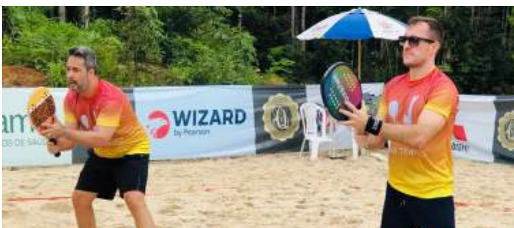
Beach tennis vai acontecer neste sábado no Quintas de São José do rio Negro

Na semana anterior, abrindo o Desafio 6 Weeks Challenge, os participantes enfrentaram o Insanos Day, com aulas nas modalidades de Indoor Cycling (ciclismo em ambiente fechado), Running (corrida em esteira) e Cross Training (treino funcional), além de aulas de Aeroboxe.