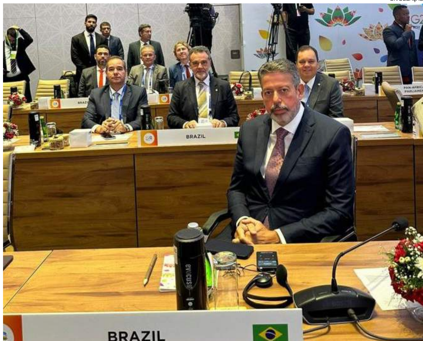
Lira destacou os avanços na legislação brasileira na defesa do meio ambiente

Segundo Lira, para que esses objetivos sejam cumpridos, os parlamentos devem estar na vanguarda desses esforços, como impul-