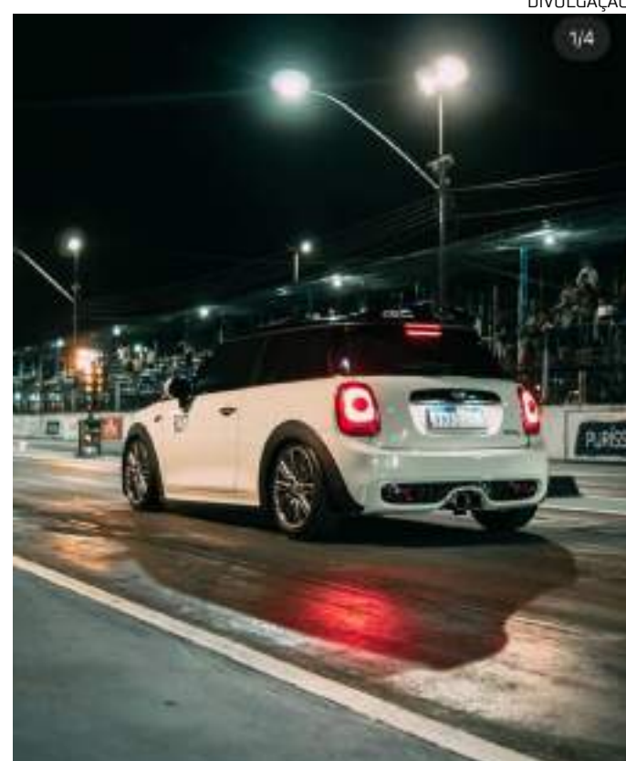
Drag Race vai acontecer na pista Amazonas Dragway

O Grupo Atem, com 28 anos de fundação, é composto por diversas empresas no ramo de combustíveis, logística rodoviária e fluvial, construção naval e refino de petróleo, entre outras. O Grupo está presente em 13 estados do Brasil, possuindo, a Distribuidora, mais de 350 postos franqueados, 7 bases de distribuição ativa, 2 bases em construção e milhares de clientes ativos, além de capacidade de movimentação de 9 bilhões de litros de combustíveis por ano.