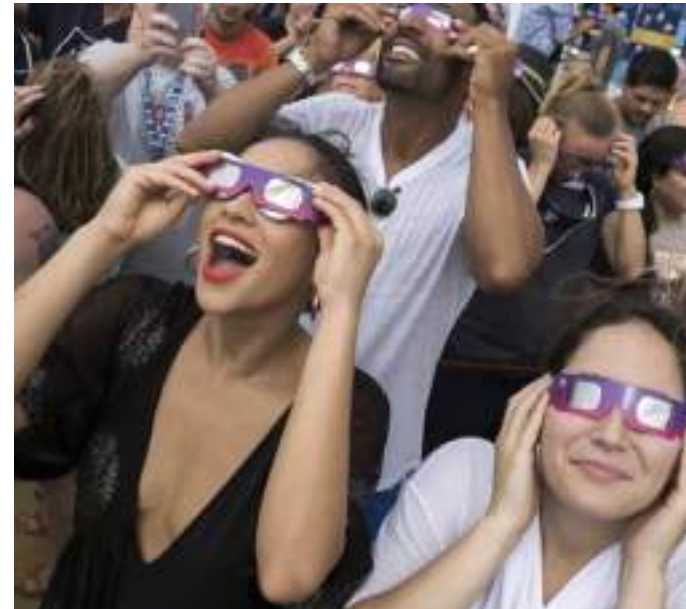
Em Manaus, o melhor horário para observar o fenômeno será às 16h19

será de duas horas, mas o ponto máximo, que é quando se forma o 'anel dourado', terá duração de cinco minutos.