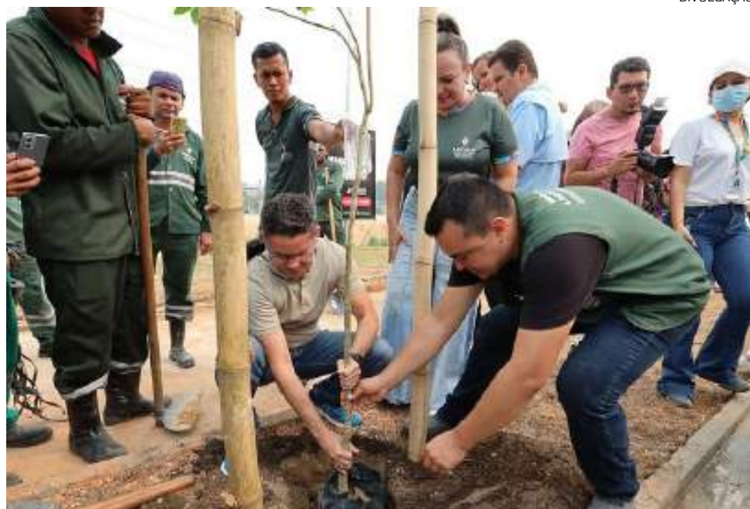
No total, 200 mudas de árvores serão plantadas pela prefeitura

No local, também serão plantadas espécies frutíferas, sendo um atrativo para a fauna local. No total, 200 mudas de árvores serão