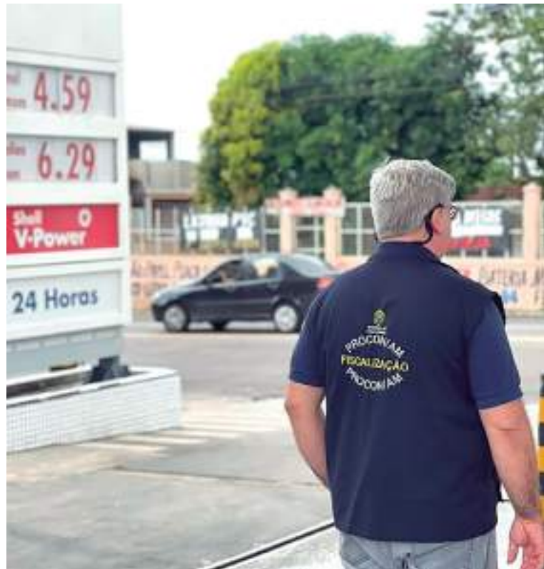
Postos de gasolina são alvos de fiscalização do Procon na Zona Sul