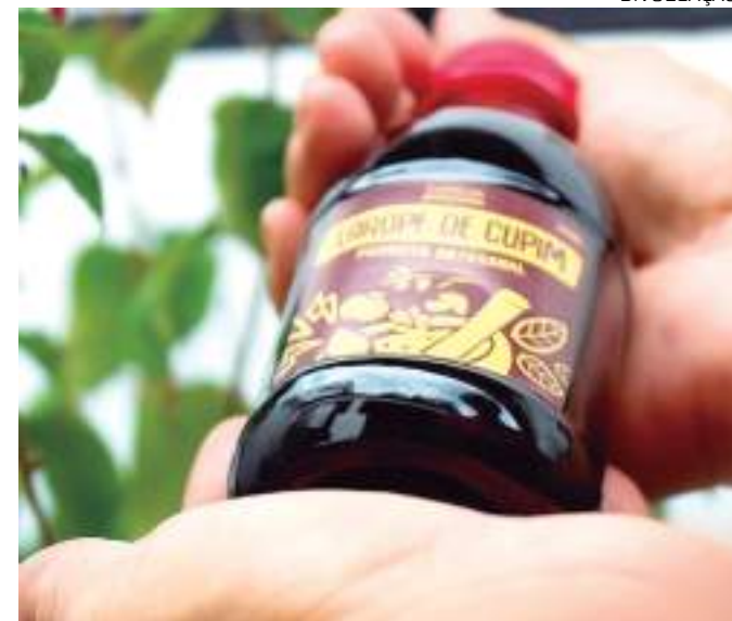
Xarope de cupim ganhou visibilidade na Feira do Das

A farinha contém alto teor de nitrogênio, sendo amplamente utilizada na produção de rações para peixes e também como fertilizante ou adubo.