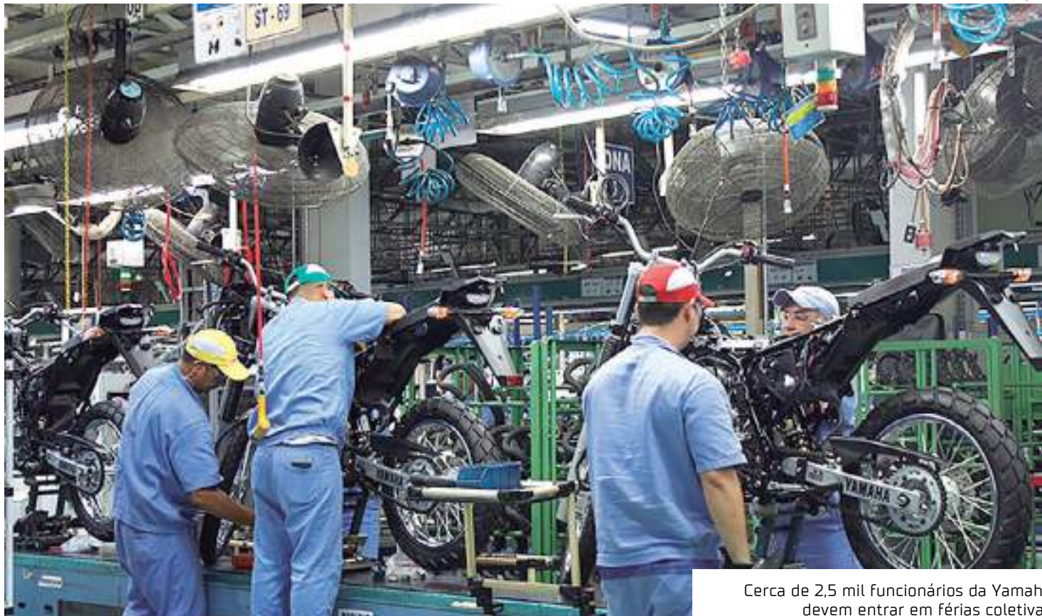
Cerca de 2,5 mil funcionários da Yamaha devem entrar em férias coletivas

Ao EM TEMPO, a Yamaha ainda apontou que a projeção é que 2,5 mil funcionários