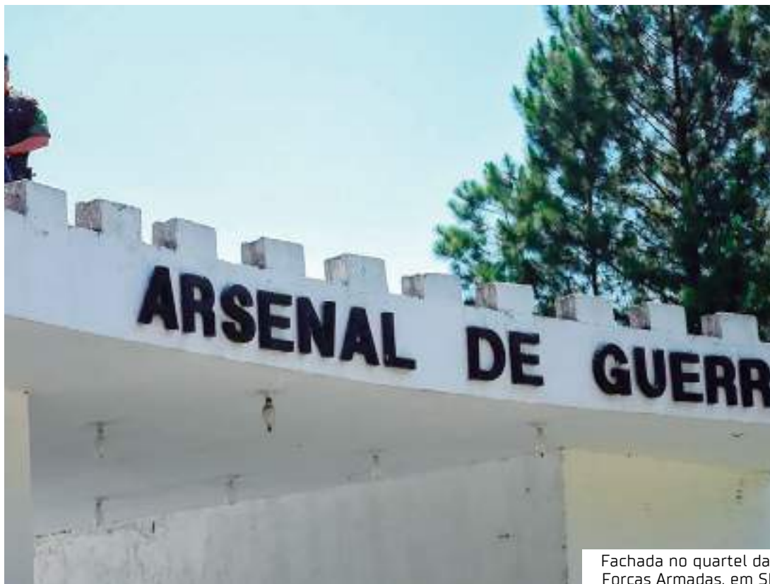
Fachada no quartel das Forças Armadas, em SP

Conforme apurado, as investigações militares estão reduzindo progressivamente o número de pessoas que podem estar ligadas ao desaparecimento das armas. Todos os militares que tinham responsabilidades de fiscalização ou controle serão responsabilizados e sujeitos a sanções