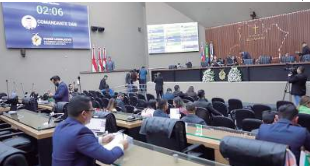
Plano é considerado fundamental na administração pública

Após, o recebimento de emendas, o projeto retorna à CAE que avalia as emendas, acatando-as ou não, junto ao projeto originalmente enviado pelo Governo do Estado.