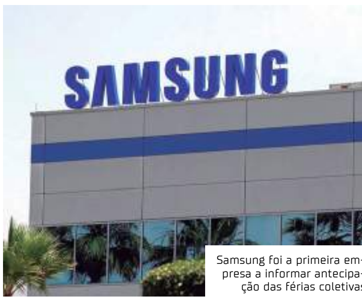
Samsung foi a primeira empresa a informar antecipação das férias coletivas

devem entrar em férias coletivas na empresa. Elas serão divididas em dois períodos, sendo o primeiro de 20 dias e o outro de 10 dias: 24/10 a 12/11 (20 dias) – Linha BIG e Motor de Popa; 01/11 a 10/11 (10 dias) – Todos os demais setores da empresa.