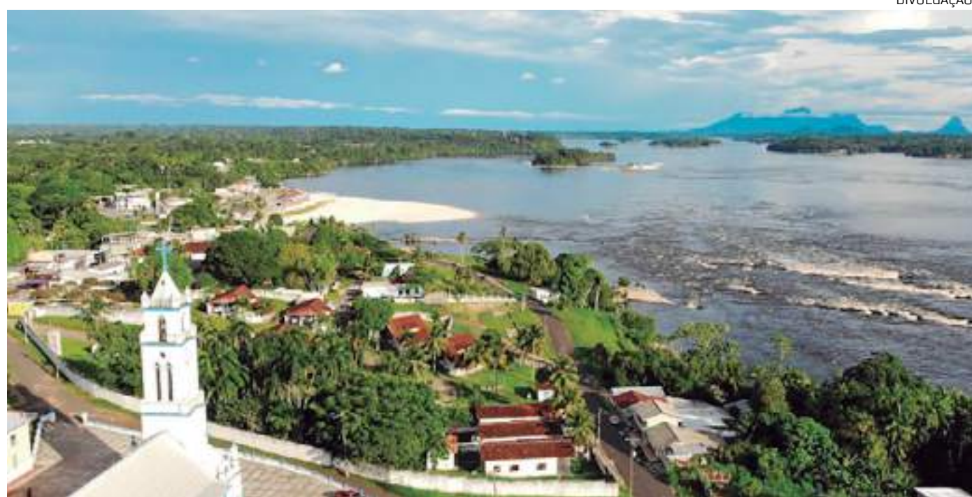
Racionamento de energia no município iniciou na última segunda-feira (16)

“O racionamento de energia gera prejuízos à população, devido à dificuldade de armazenamento de alimentos e insumos da saúde, além de reduzir a oferta de serviços essenciais. Se a medida for prolongada, há a possibilidade de apagão elétrico”,