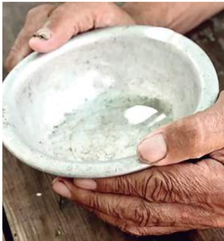
Novo registro da fome no planeta comprova o retorno do Brasil ao mapa