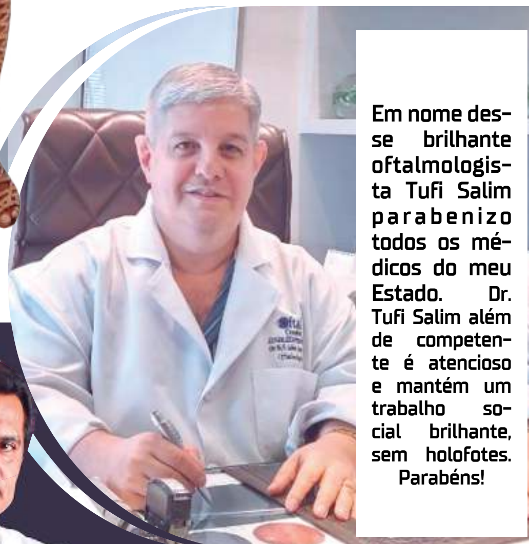
Em nome desse brilhante oftalmologista Tufi Salim parabênz todos os médicos do meu Estado. Dr. Tufi Salim além de competente é atencioso e mantém um trabalho social brilhante, sem holofotes. Parabéns!