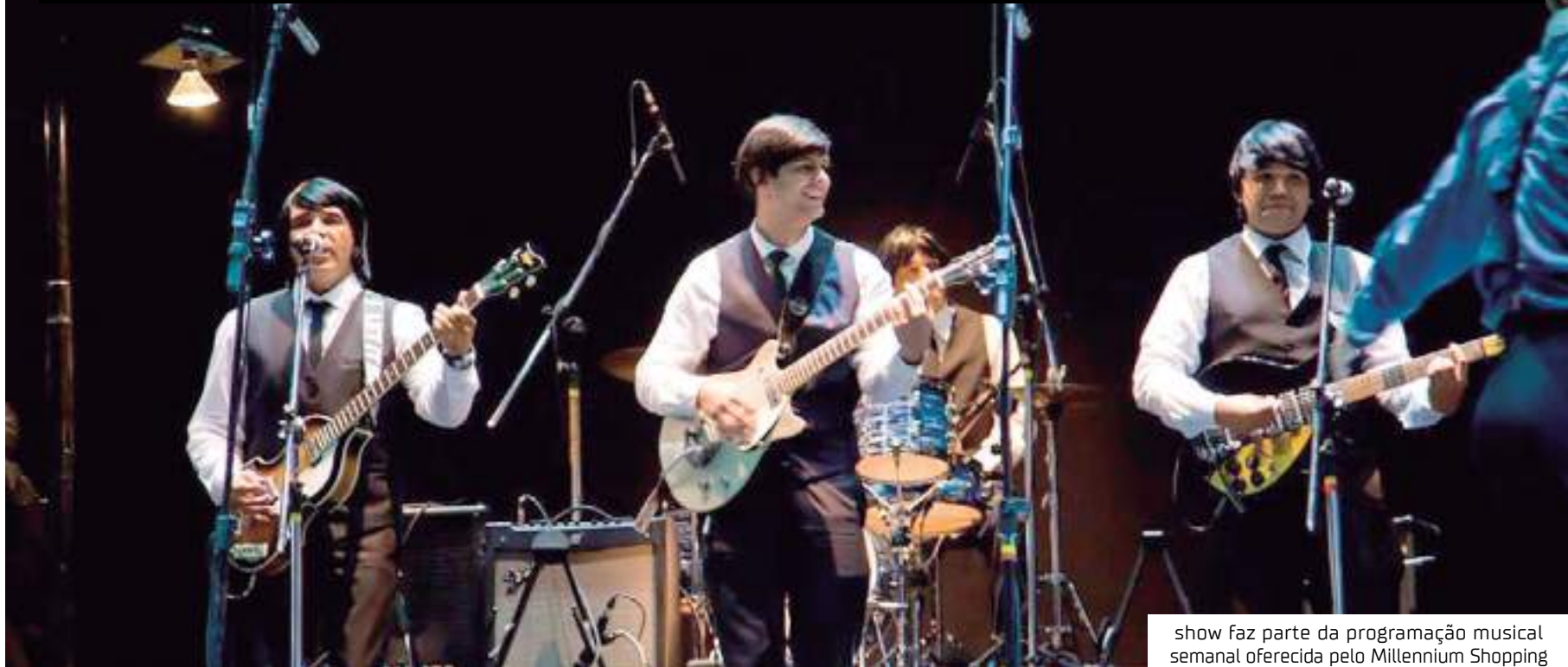
show faz parte da programação musical semanal oferecida pelo Millennium Shopping

Velhas e novas gerações de fãs vão poder aproveitar o clima de comemoração pelos 354 anos de Manaus