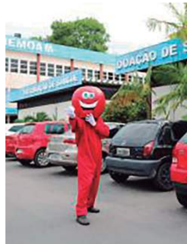
Ação conta com participação da mascote da doação, o hematolino

O baixo comparecimento de doadores já vem se arrastando desde o início do mês e, os feriados tendem a acentuar ainda mais essa falta. Para manter o estoque regular, o Hemoam precisa coletar no mínimo 200 bolsas de sangue diárias, porém, esse número não tem sido alcançado ultimamente.