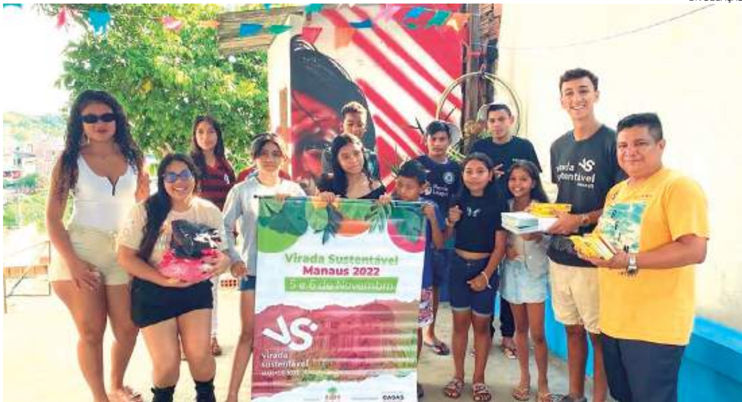
Virada Sustentável Manaus movimentou moradores de vários bairros em 2022

A tradicional Feira da Fundação Amazônia Sustentável, a "Feira da FAS", também realizará uma edição especial na Virada Sustentável Manaus. Para isso, a instituição busca 90 empreendedores de economia verde e criativa para expor seus negócios no evento, que será realizado no Largo São Sebastião, localizado na Rua Costa Azevedo, bairro Centro - Zona Sul, nos dias 4