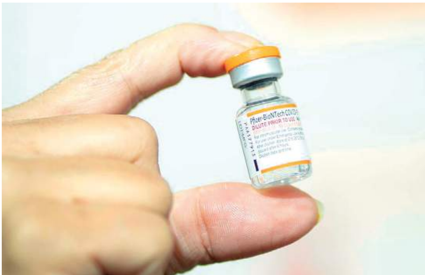
Maior porcentagem de vacinas vencidas foi registrada no Paraná, com 78,6% do total não aproveitado

Segundo o relatório, as causas para as perdas não foram efetiva e individualmente identificadas pelo Ministério da Saúde, que as atribui apenas ao não atingimento da meta vacinal. "A unidade técnica, por outro