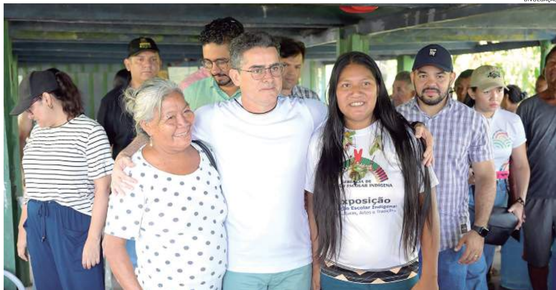
Prefeito David Almeida acompanhou a força-tarefa no ramal Frederico Veigas

O trabalho conjunto conta com as equipes das secretarias municipais de Agricultura, Abastecimentos, Centro e Comércio Informal (Semacc); de Assistência Social e Cidadania