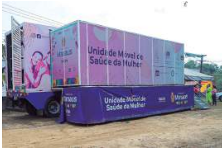
Serviços de saúde ofertados para mulheres

A estrutura móvel da zona Oeste vai atender, até esta sexta-feira, às usuárias da comunidade Parque Riachuelo, localizada na rua Beija-Flor Vermelho, no bairro Tarumã. Após o deslocamento, a unidade voltará