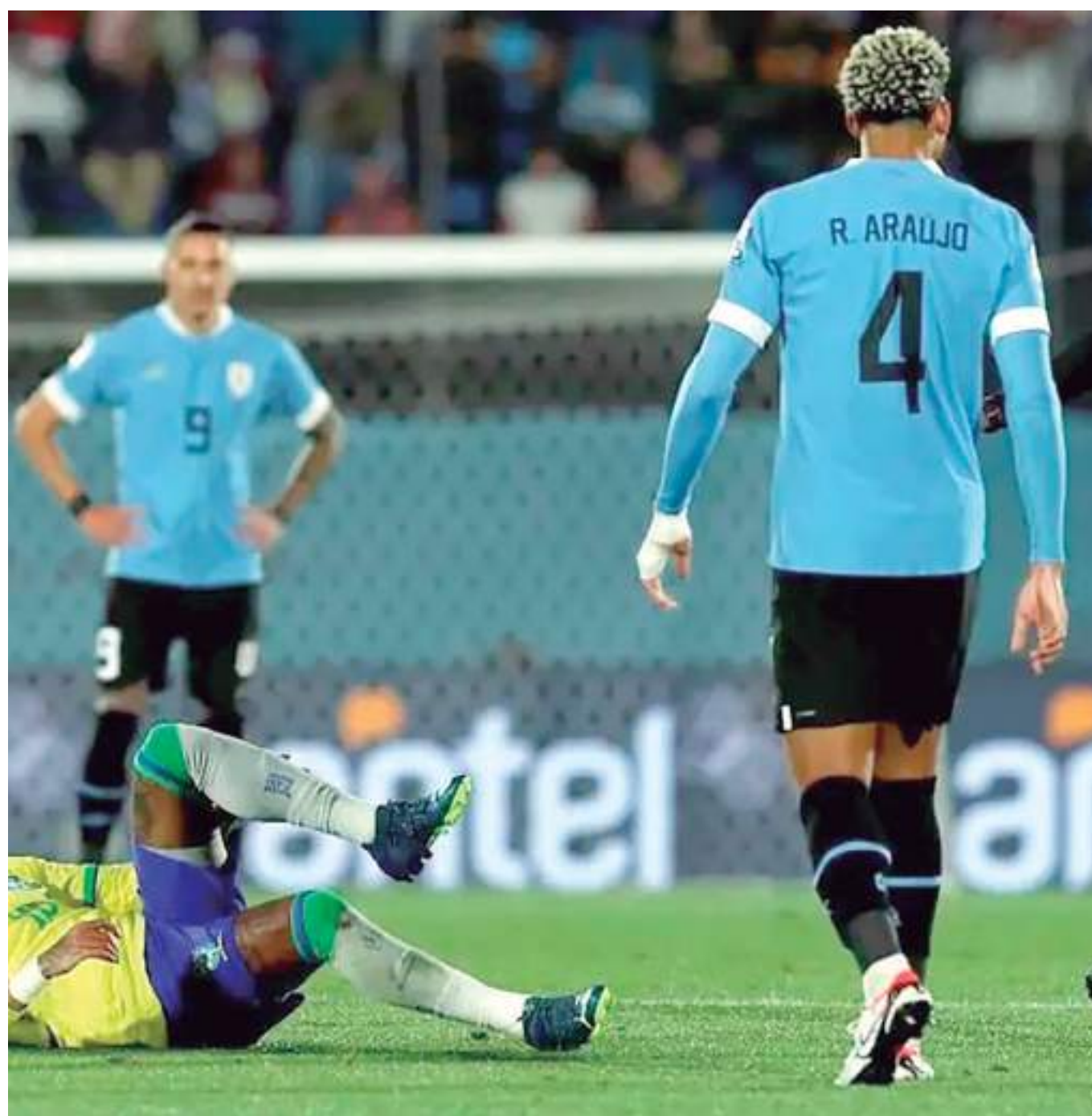
Neymar sofreu lesão grave no joelho durante jogo com Uruguai

lesões graves pelo Santos, Neymar se machucou no seu início no Barcelona. Em seguida, sofreu uma contusão na lombar pelo Brasil na Copa do Mundo de 2014 e conviveu com problemas físicos no Paris Saint-Germain desde 2018.