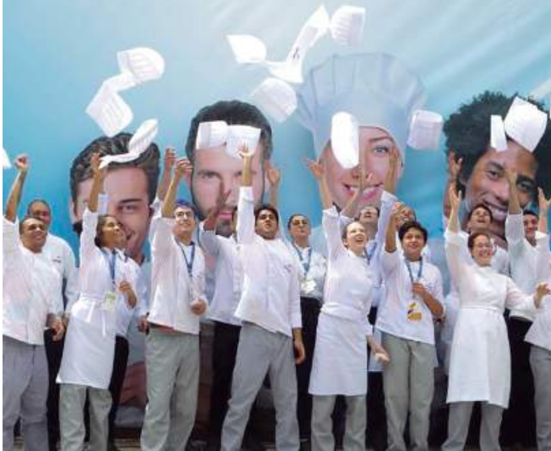
Torneio tem como objetivo reunir talentos para que demonstrem as habilidades técnicas aprendidas

A maior competição nacional de Educação Profissional do Comércio.