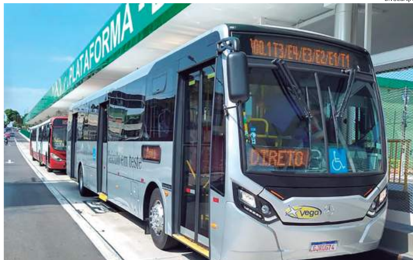
As alterações ocorrem após os estudos realizados por técnicos do IMMU