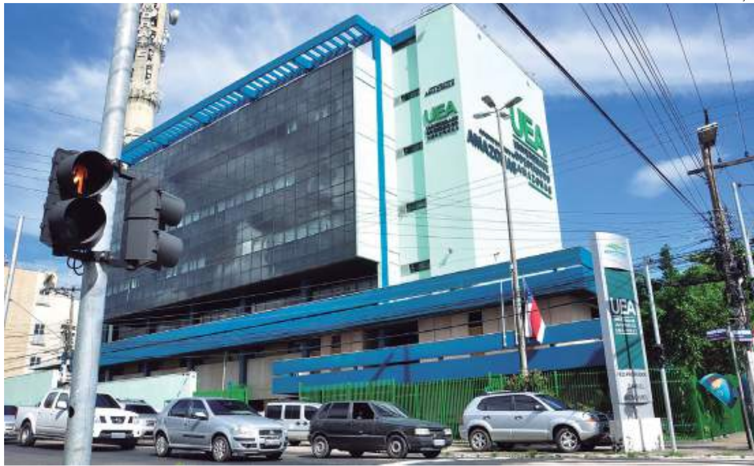
Universidade declarou que já trabalha para acatar decisão do Supremo Tribunal Federal

Em abril deste ano, o STF formou maioria para anular o percentual de 80% na cota de vagas aos alunos que cursaram o ensino médio no estado,