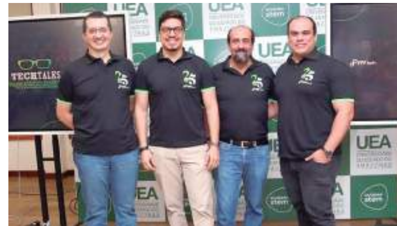
Profissionais da tecnologia palestraram para estudantes