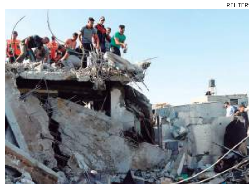
Ataque aéreo teria deixado vários mortos e feridos