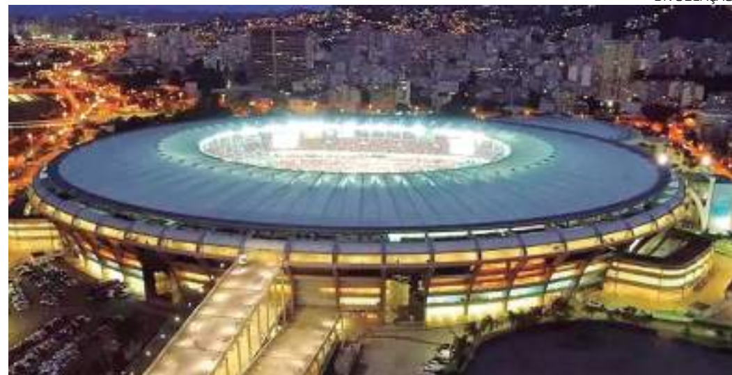
Final da Libertadores pode ser mudada do Maracã para o Morumbi