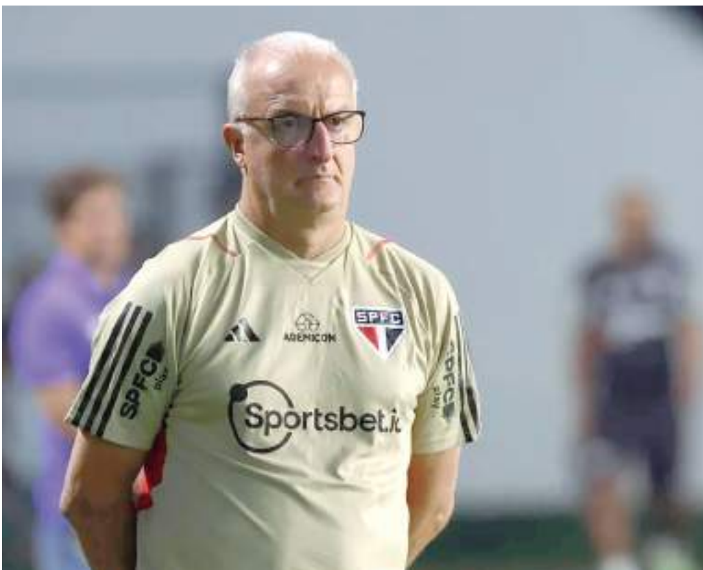
Dorival junior deve fazer mudanças no time para próximos jogos do São Paulo

Em 11º lugar, com 35 pontos, o São Paulo está a apenas cinco da zona de rebaixamento e precisa reagir no Campeonato Brasileiro para se distanciar do grupo dos últimos quatro colocados que cairão para a Série B.