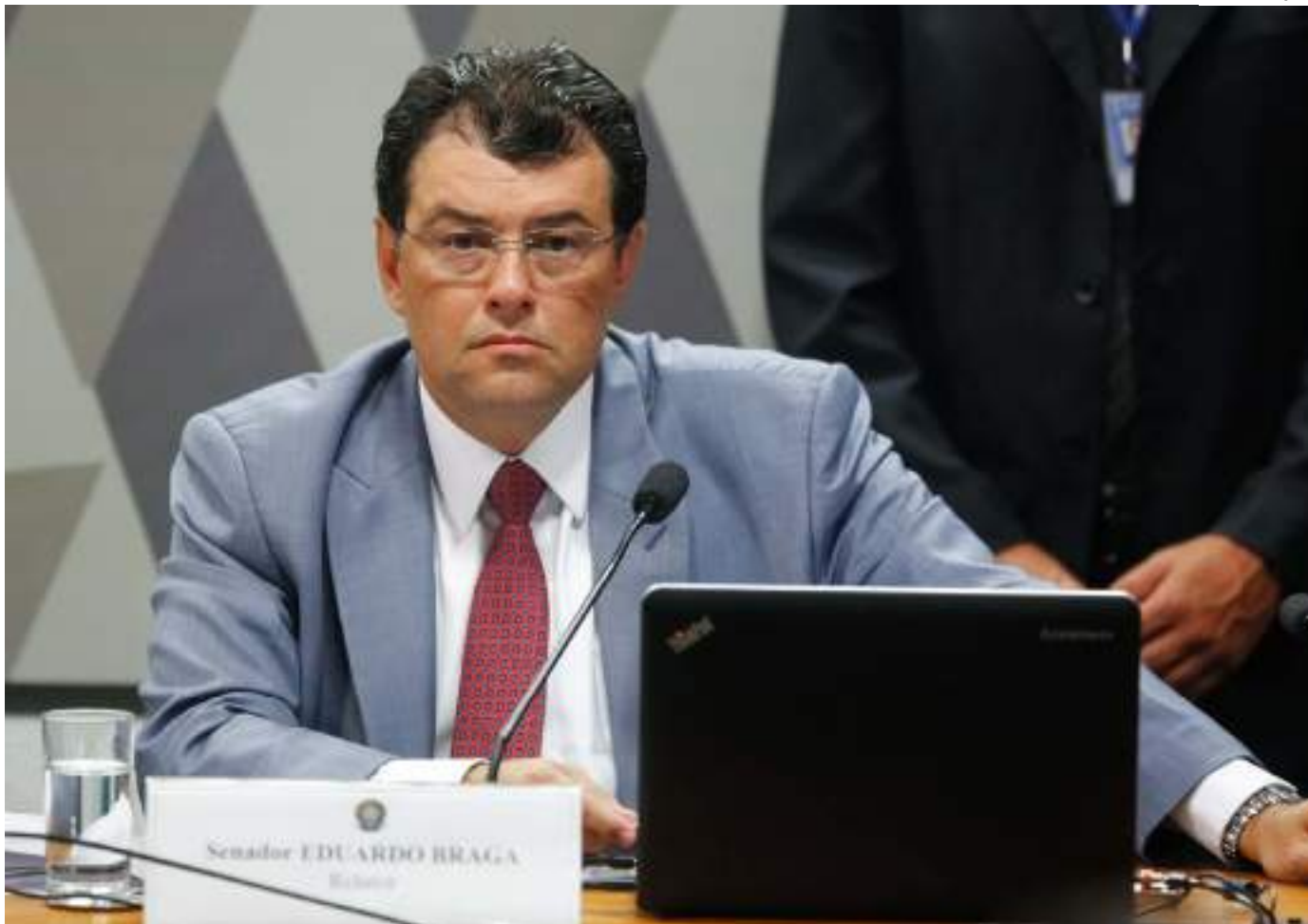
Braga também recebeu relatório elaborado pelo Tribunal de Contas da União (TCU) sobre o mérito da matéria

Neste período de audiências, o relator da reforma se reuniu com setor de serviços, agropesquisas, cooperativas, além de estados e municípios. Teve ainda audiência específica sobre regimes favorecidos. Re-