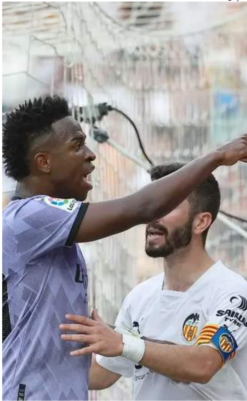
Vini reclamou sobre insultos racistas durante partida de futebol

Brasileiro prestou depoimento na Espanha sobre insultos raciais que sofreu durante jogo de futebol