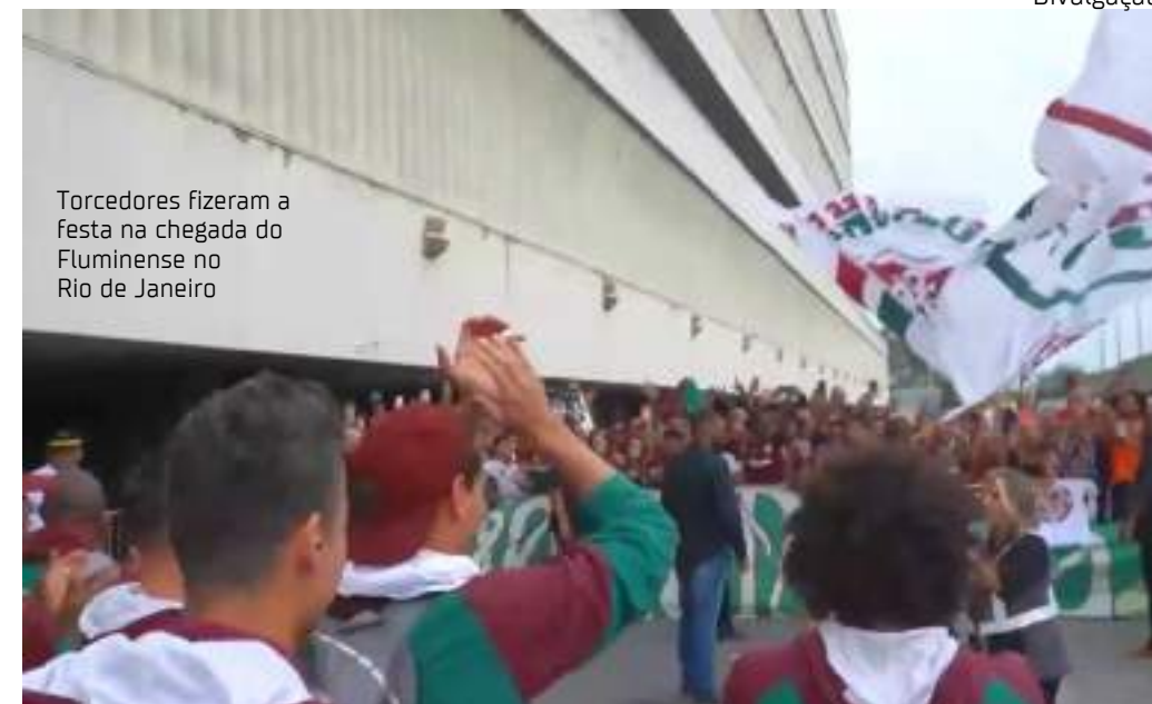
Torcedores fizeram a festa na chegada do Fluminense no Rio de Janeiro