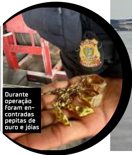
Durante a operação foram encontradas pepitas de ouro e jóias

Nesta quinta-feira, nove dragas foram destruídas nas proximidades da Ponte Jornalista Philippe Daou. Ainda segundo o órgão, as dragas de garimpo estavam operando no Rio Negro, na divisa entre Manaus e o município de Iranduba. Também foram encontradas pepitas de ouro e jóias, que foram apreendidas e encaminhadas à perícia.