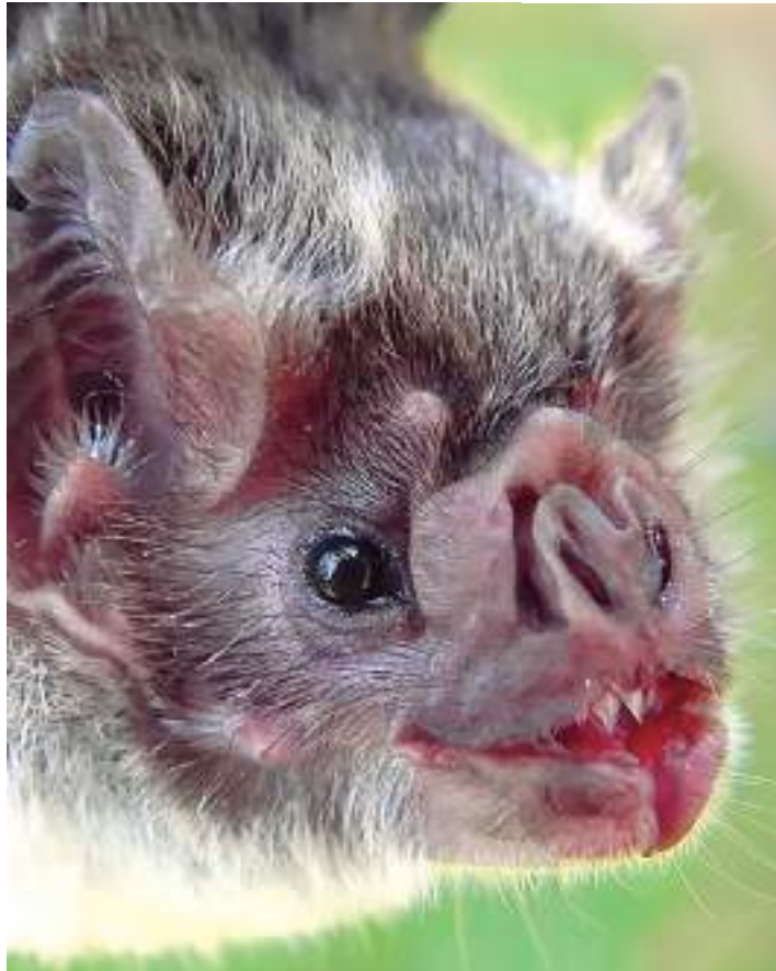
Morcego-vampiro-comum é hematófago, por isso se alimenta do sangue

Os municípios do Amazonas que receberam a visita dos técnicos foram: Atalaia do Norte, Benjamin Constant, Coari e Presidente Figueiredo. Está prevista, para o mês de outubro, uma visita ao município de Marã (a 634 quilômetros de Ma-