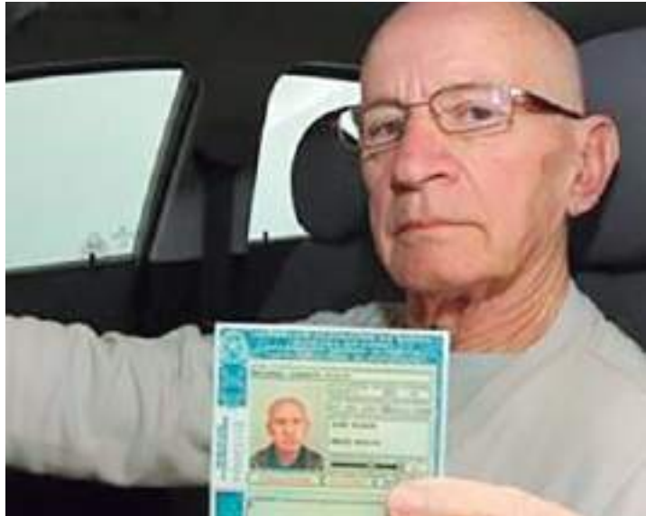
Idosos a partir de 70 anos terão acesso ao benefício

Da tribuna, o parlamentar explicou que pessoas a partir de 70 anos que possuem CNH não foram beneficiados pela Lei