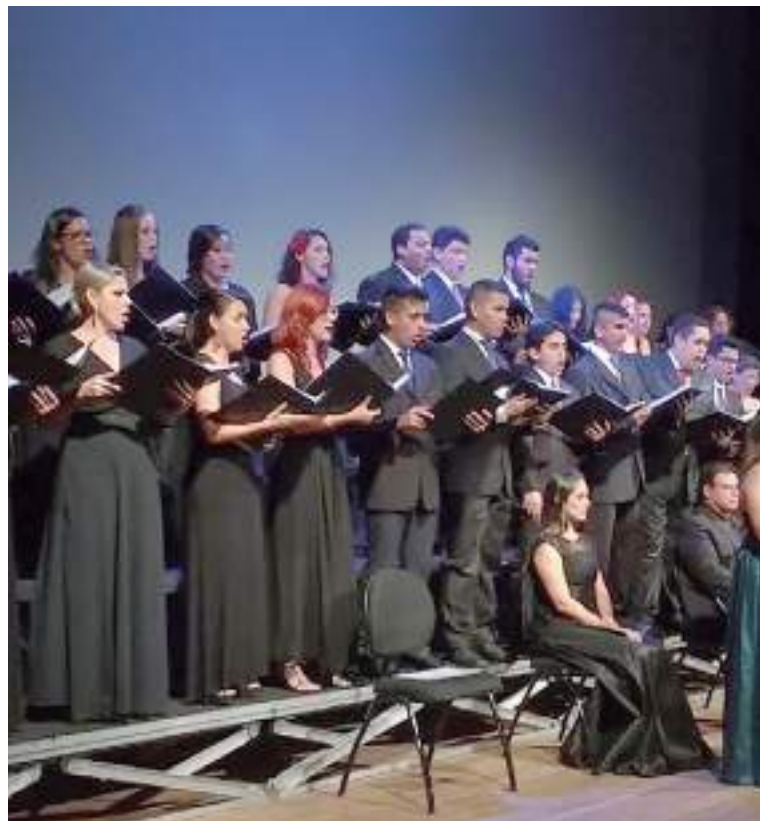
Coral do Amazonas se apresenta na Igreja de São Sebastião

No dia 22, o Madrigal do Amazonas se apresenta no Centro Cultural Palácio da Justiça, às 18h, com o recital "Mozart e Salieri". Ao lado de solistas do grupo, o coral canta as obras corais e as árias de óperas do W.A. Mozart e A. Salieri.