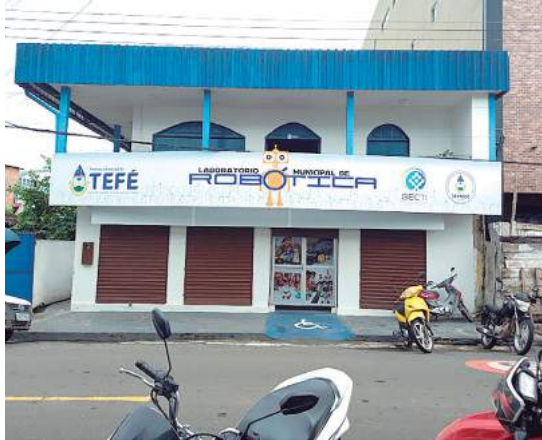
Atividades acontecem no Laboratório Municipal de Robótica de Tefé