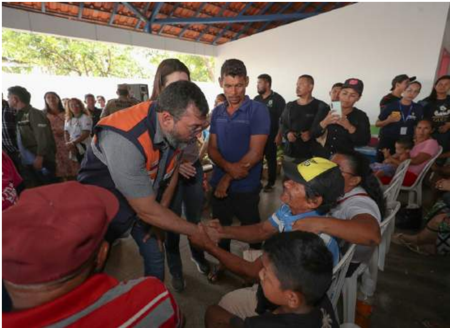
De acordo com o governador, em um segundo momento, o foco será o trabalho de reconstruir a vida das pessoas afetadas

Na ocasião, Wilson Lima destacou que desde as primeiras horas do ocorrido, no último sábado (30), determinou a criação de uma força tarefa para atender a população atingida pelo desastre natural e destacou que o Governo do Estado seguirá atuando na área. Ele afirmou que, em um segundo momento, deverá realizar uma audiência pública para definir quem pretende permanecer morando próximo do local ou na sede do