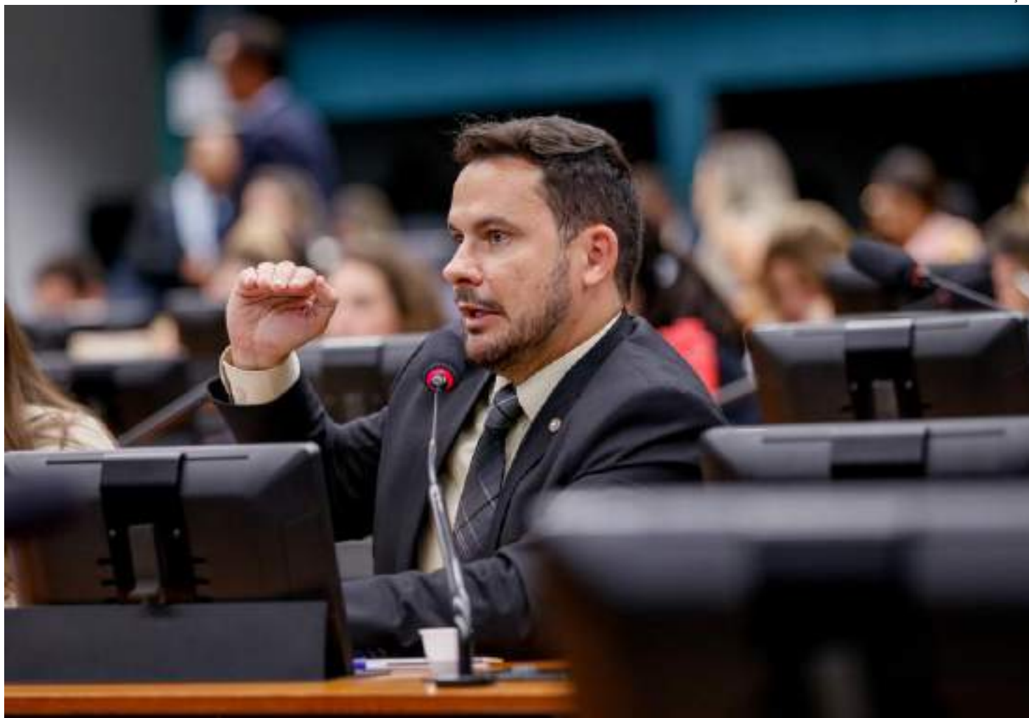
Parlamentar destacou que objetivo é que essa categoria de empresa não desapareça do país

Nos documentos n.1238/23 e n.1240/23, o parlamentar pede que sejam criadas e divulgadas consultorias especializadas direcionadas aos empreendimentos, e no caso do Ministério da Fazenda que as articulações sejam viabilizadas pela Secretaria Especial de Produtividade, Emprego e Compe-