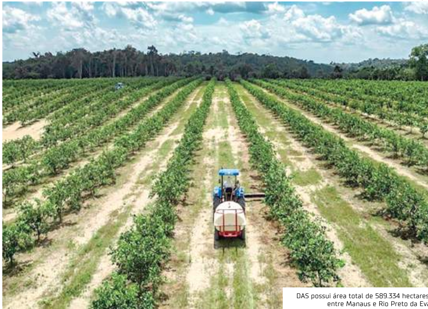
DAS possui área total de 589.334 hectares, entre Manaus e Rio Preto da Eva