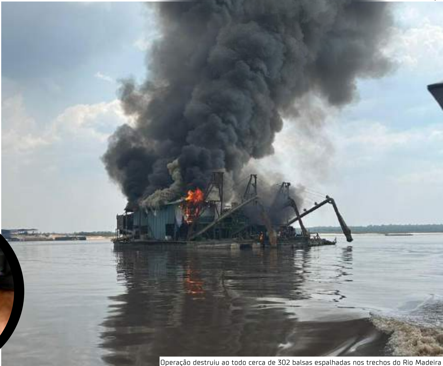
Operação destruiu ao todo cerca de 302 balsas espalhadas nos trechos do Rio Madeira

As investigações e investidas da Força Integrada de Combate ao Crime Organizado e órgãos parceiros contra os delitos ambientais continuam, com especial atenção à identificação das lideranças e demais integrantes da associação criminosa, bem como à sua completa descapitalização, inclusive para reparação dos danos impostos à sociedade.