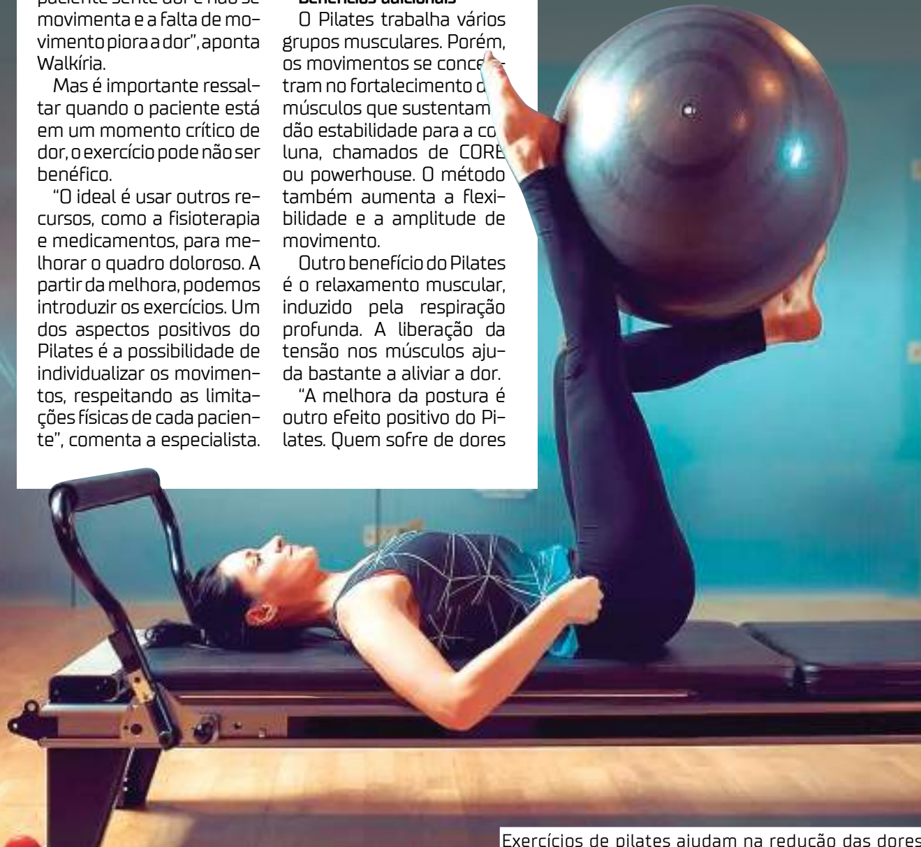
Exercícios de pilates ajudam na redução das dores e fortalece músculos e articulações

A mensagem final é: quem sofre com dores crônicas precisa adotar uma série de autocuidados, sendo um deles realizar uma atividade física. O Pilates é uma ótima escolha, desde que bem orientado e individualizado, de acordo com o perfil e necessidades de cada paciente", finaliza Walkíria.