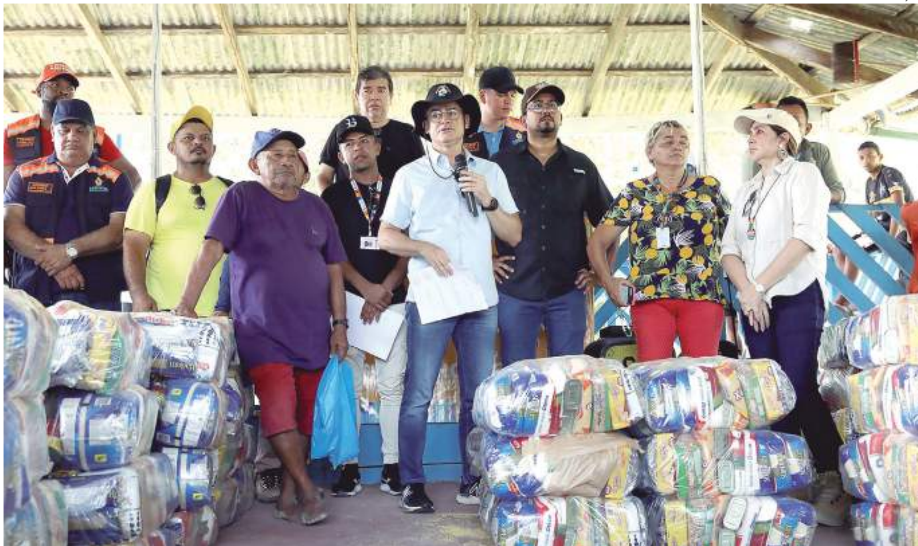
Gestão do prefeito inclui planejamento com cronograma completo para assistência durante estiagem

De acordo com a Secretária Municipal de Agricultura, Abastecimento, Centro, Mercado e Comércio Informal (Semacc), a ação, que iniciou nos primeiros dias da