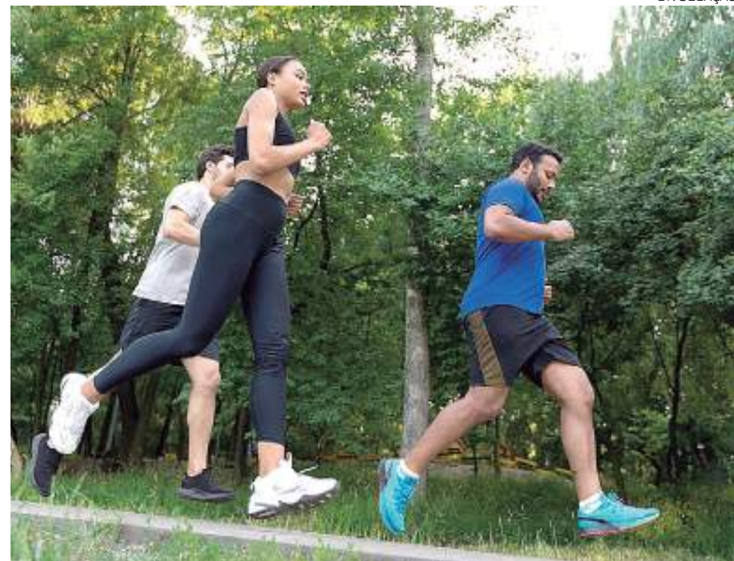
Profissional de Educação Física alerta sobre os cuidados ao praticar exercício ao ar livre

Nas últimas semanas Manaus tem amanhecido com o céu encoberto de fumaça. A situação, ocasionada pelo grande número de focos de incêndio na capital e região metropolitana, tem deixado o ar impuro, o que afeta diretamente a respiração. Para quem pratica atividade física ao ar livre é preciso redobrar os cuidados com a saúde nesse período.