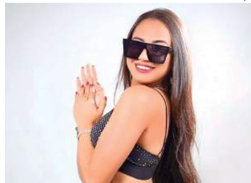
Cantora amazonense conquista público com voz potente e talento musical