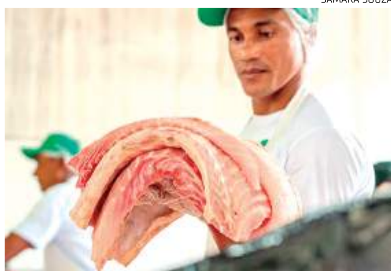
Pirarucu comercializado durante a feira da FAS