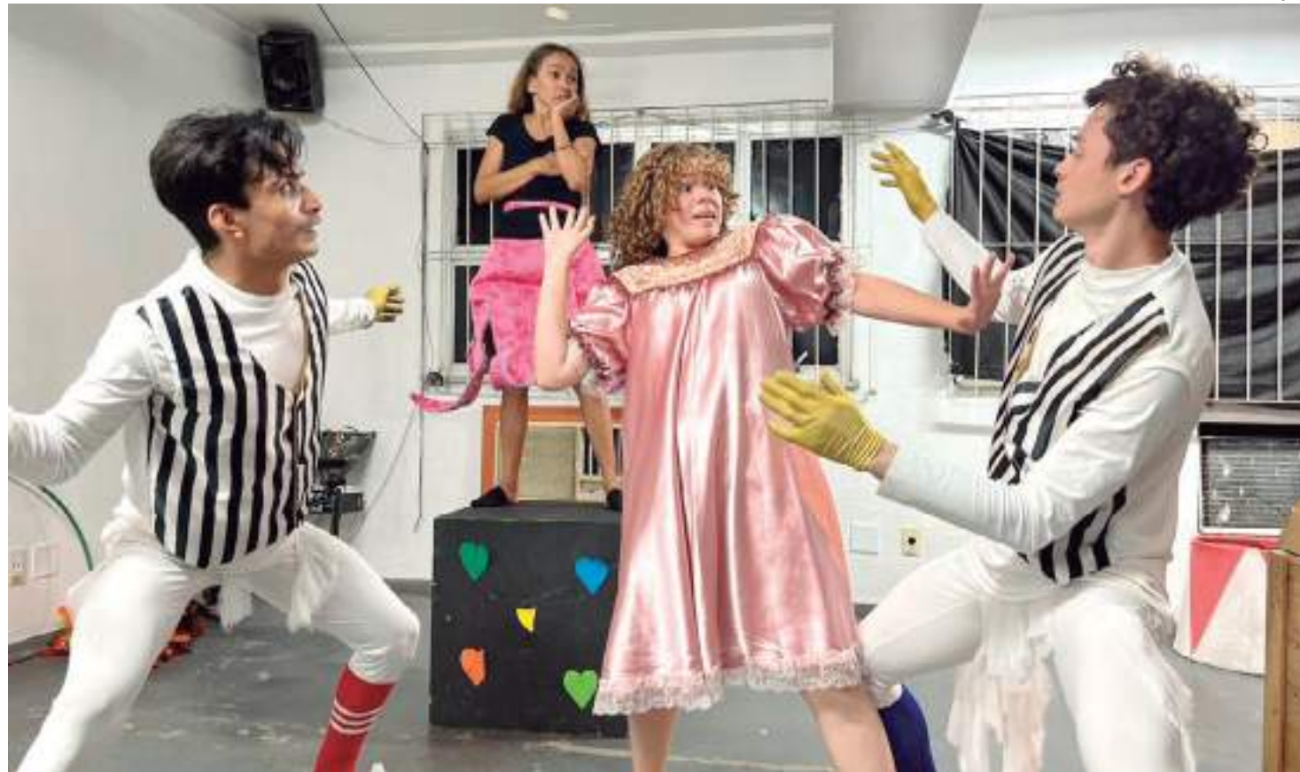
Durante espetáculo, atores fazem acrobacias, mágicas e números circenses

A apresentação é realizada todos os anos pelo Liceu de Artes e Ofícios Claudio Santoro, para celebrar o Dia das Crian-