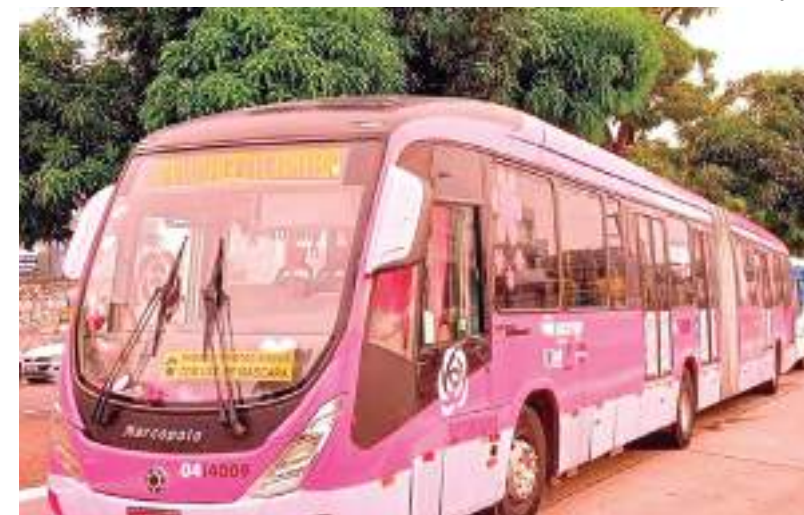
Ônibus da campanha Outubro Rosa ofertará serviços para mulheres