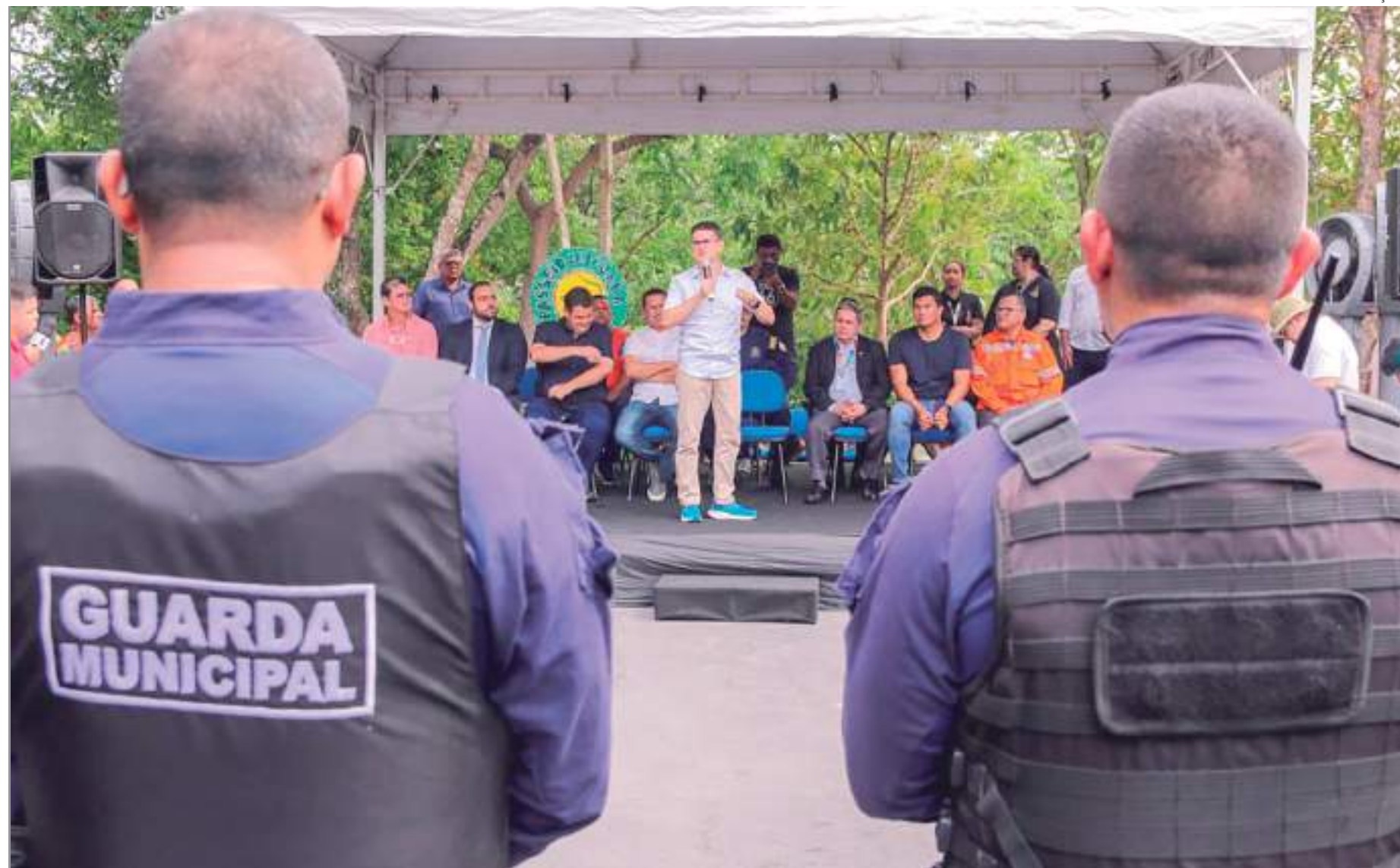
Prefeito David Almeida destacou também a realização do concurso da Guarda Municipal, com 200 vagas

"Esses investimentos irão equipar ainda mais a Guarda Municipal. Nós iremos comprar 22 novas viaturas, viaturas de porte grande da marca Mitsubishi, viaturas de patrulhamento da marca Toyota, Yaris. Nós vamos comprar metralhadoras,