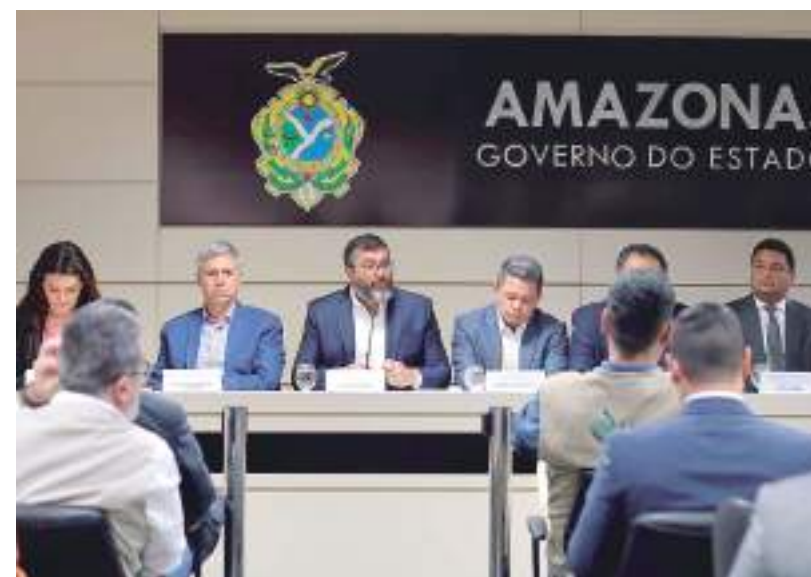
Governador destacou parcerias que o Estado tem firmado para avançar ações na área

Além disso, o ministro também anunciou repasse de R$ 4,8 milhões do programa Bolsa Verde para populações