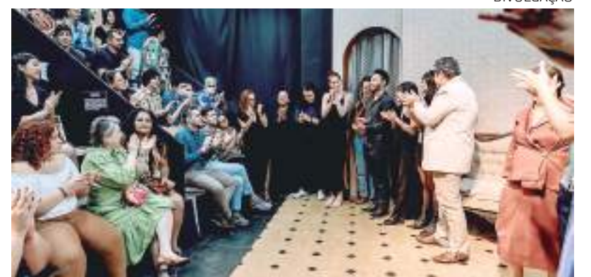
Prêmio Cenym reconhece os talentos do teatro brasileiro