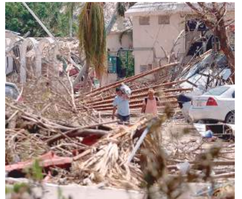
Acapulco após passagem do furacão Otis