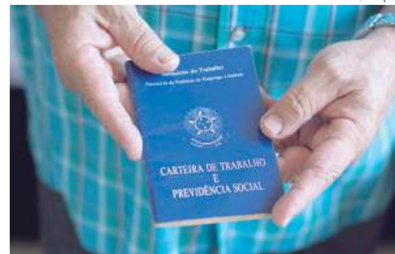
Média salarial gira em torno de R$ 2.032,07