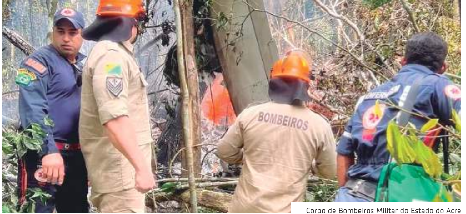
Corpo de Bombeiros Militar do Estado do Acre

Ainda conforme o Governo do Acre, ambulâncias do Ser-