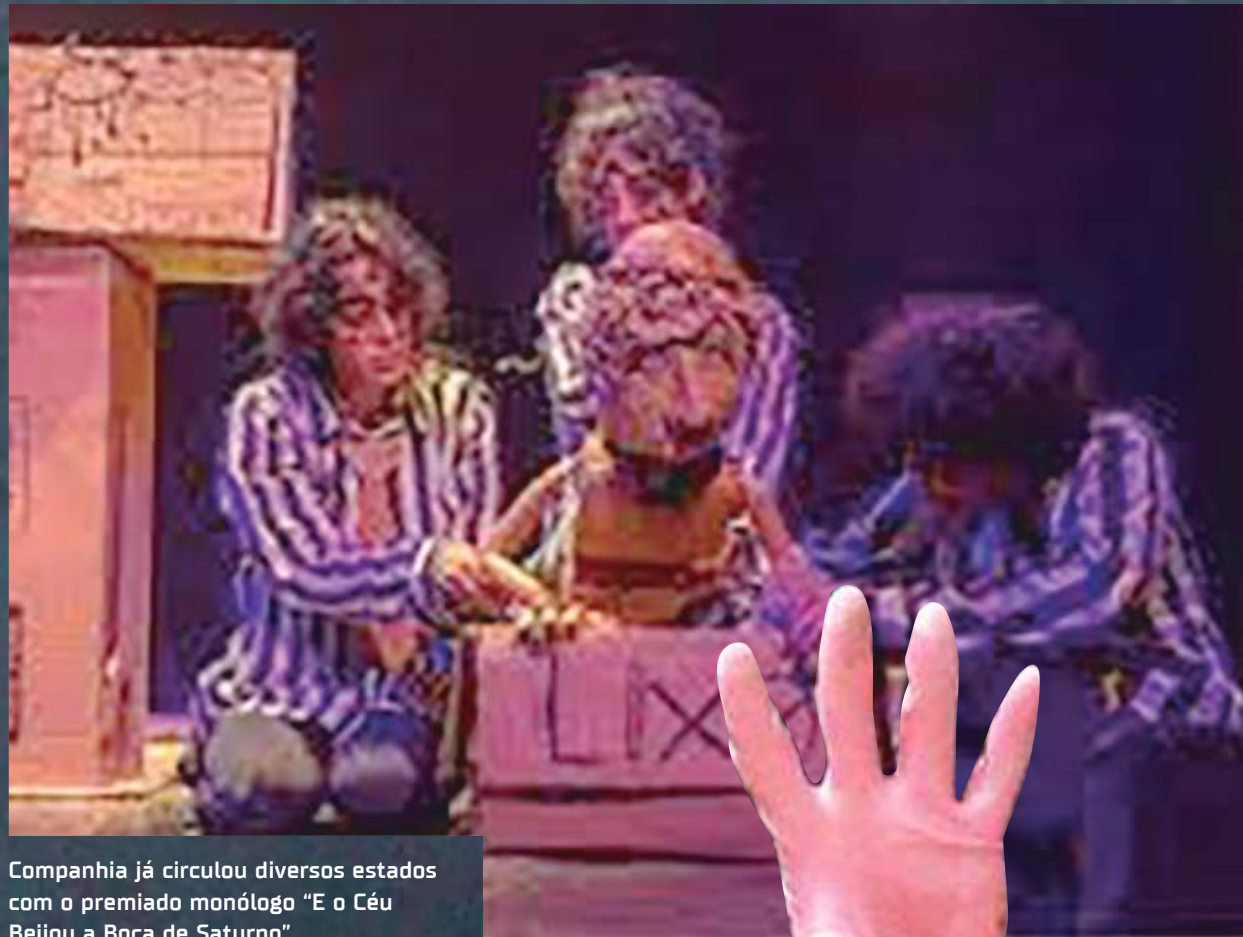
Companhia já circula diversos estados com o premiado monólogo "E o Céu Beijou a Boca de Saturno"

A companhia já circula diversos estados do país com o premiado monólogo "E o Céu Beijou a Boca de Saturno" e, agora, pretende alcançar novos voos voltados para o público infantil da cidade.