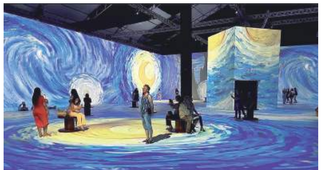
Exposição traz ao público obras como 'A Noite Estrelada', 'Quarto em Arles', 'Girassóis' e 'Amendoeira em Flor'

Os ingressos podem ser adquiridos pela internet, por meio do site www.lightland.com.br . Os valores variam de acordo com a idade e o período de visita e podem ser verificados por meio do site.