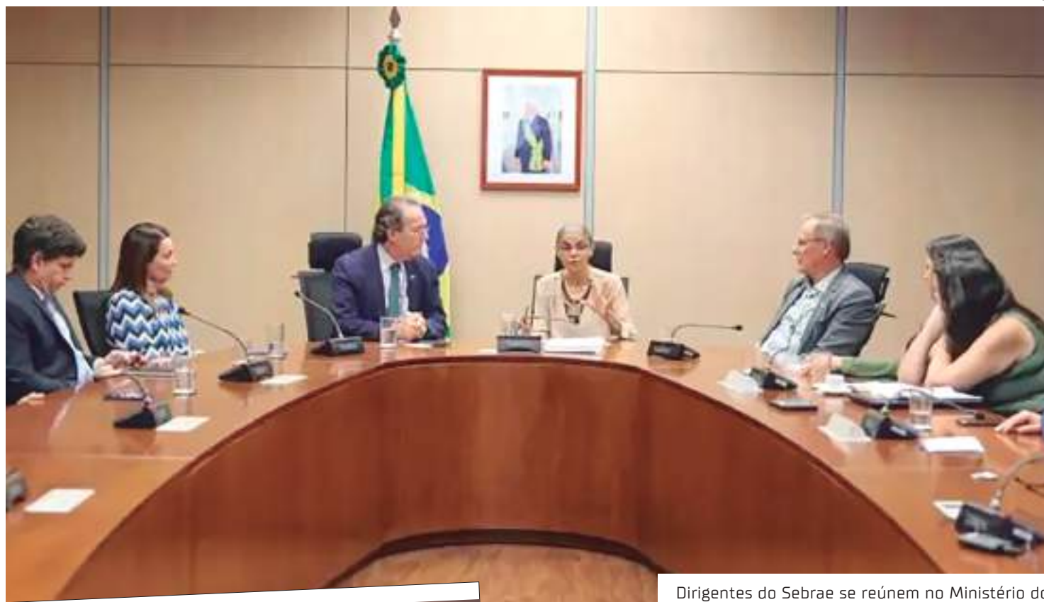
Dirigentes do Sebrae se reúnem no Ministério do Meio Ambiente para discutir agenda de pautas

Para participar do edital, os pequenos negócios formalizados já devem estar em ope-