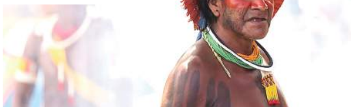
Índigenas, na foto. Entre as áreas incluídas na medida, figura a Avá-Canoeiro,