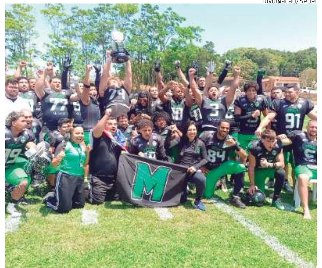
Manaus FA conquistou etapa regional de futebol Americano

Com a conquista da etapa regional, o time amazonense garantiu vaga no wildcard dos playoffs nacionais, onde enfrentará a equipe do Sorriso Hornets-MT, campeão da Conferência Centro-Oeste. A partida está marcada para acontecer dia 12 de novembro, às 14h, em Manaus, que pela primeira vez receberá um jogo de playoff nacional