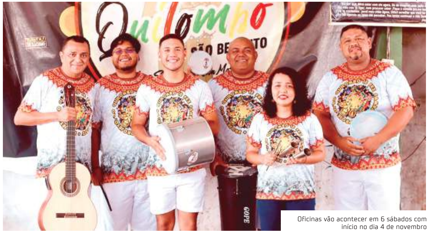
Oficinas vão acontecer em 6 sábados com início no dia 4 de novembro

Como aplicação de leis culturais e abertura de editais a nível