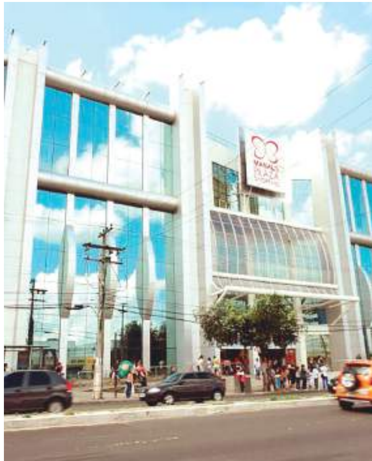
Rainha do Euro90 vem a Manaus, no Plaza Shopping