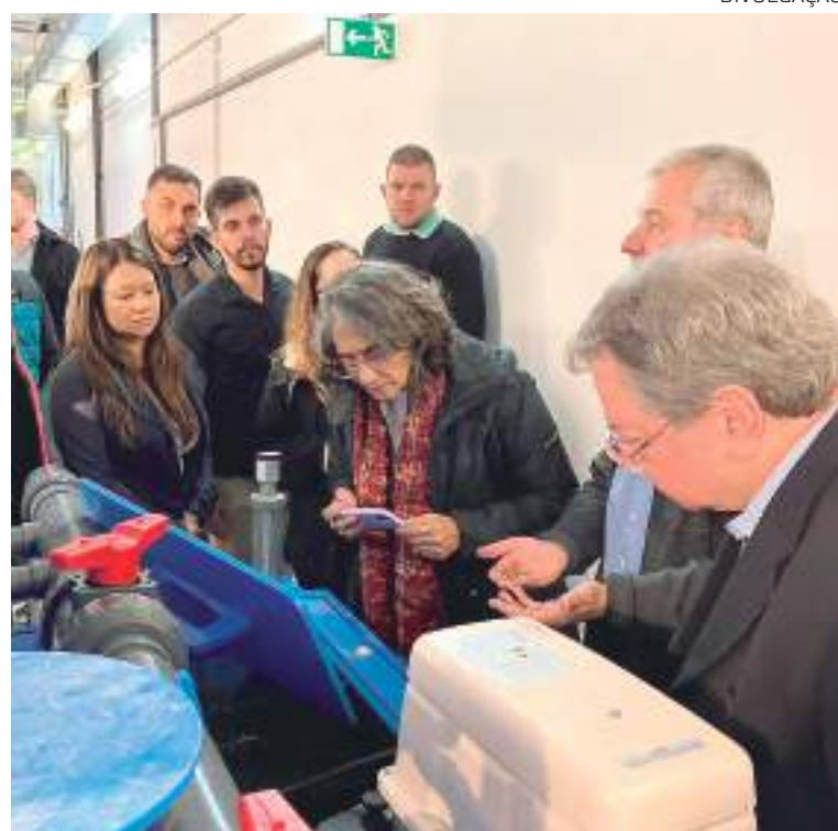
Trabalhos produzidos voltados para o desenvolvimento da piscicultura no Estado

“A participação dos pesquisadores locais nestes eventos e a internacionalização cada vez maior das atividades realizadas pela Universidade, atestam a excelência da pesquisa realizada no Amazonas”,