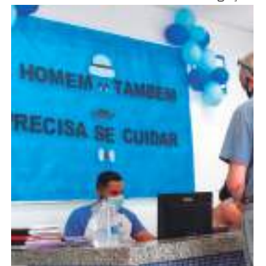
Tratamentos variam de acordo com o estágio da doença