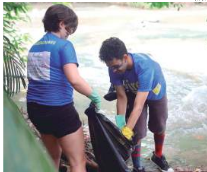
Objetivo da ação é promover a conservação do meio ambiente

Além disso, haverá uma ação de coleta de resíduos na Marina do Davi, em parceria com o projeto Remada Ambiental; caminhada ambiental na Ponta das Lajes; plantio e distribuição de mudas; mutirão de limpeza; oficinas gastronômicas; Drive Thru ambiental; exposições; performances de teatro e dança;