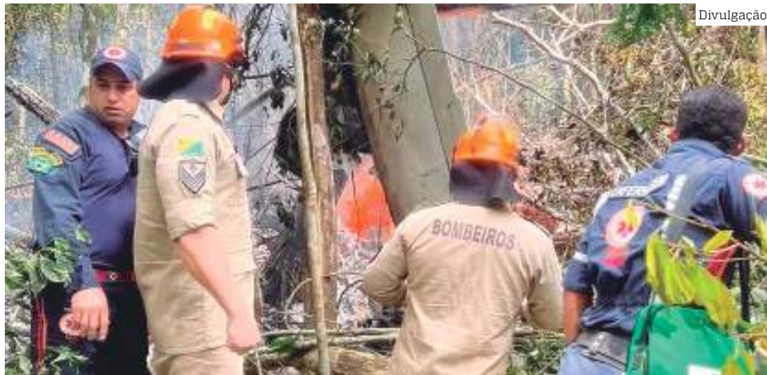
Corpo de Bombeiro Militar no estado do Acre

Ainda conforme o Governo do Acre, ambulâncias do Ser-