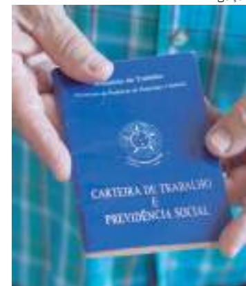
Média salarial gira em torno de R$ 2.032,07

A previsão oficial para o INPC em 2023 está 4,48%. O valor consta no último Relatório de Avaliação de Receitas e Despesas, divulgado no fim de julho. A próxima estimativa será divulgada no fim de setembro, na nova edição do Boletim Macroeconômico pela Secretaria de Política Econômica do Ministério da Fazenda.