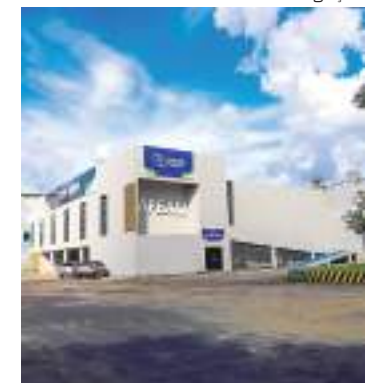
Pesquisadores podem submeter propostas até 18 de dezembro

Para acessar o formulário, o proponente deverá utilizar seu login e senha previamente cadastrados. Novos usuários deverão realizar o cadastro no banco de pesquisadores da Fapeam. Além do envio do formulário online, a submissão da proposta requer a apresentação de documentação complementar a ser anexada ao SigFapeam, conforme especificado no edital.