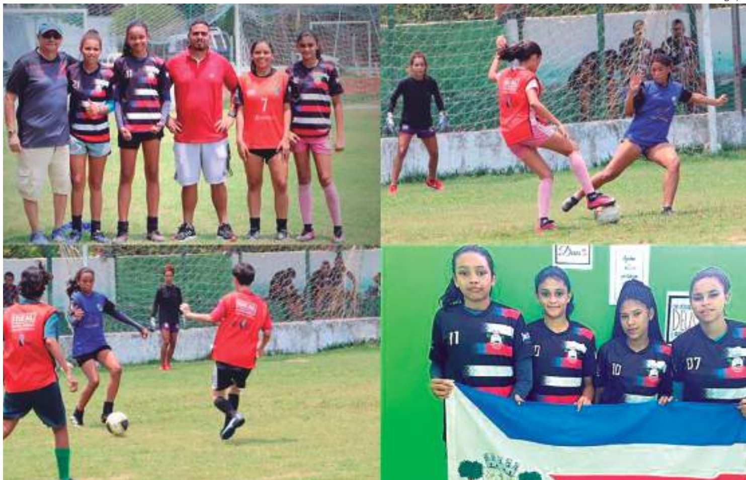
Meninas de Carauari e Barcelos selecionadas para testes em núcleo de futebol Sub-17 no Rio de Janeiro