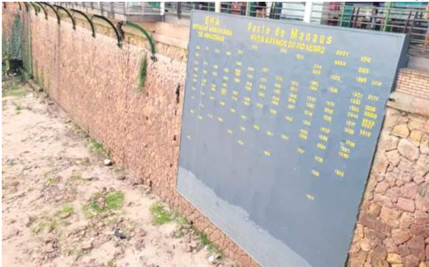
Rio registrou pior seca em 121 anos de medição ao atingir 13,59 metros