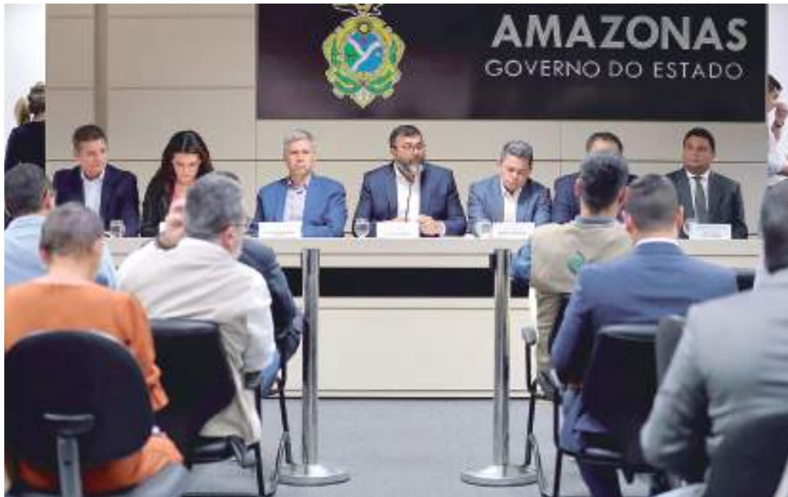
Governador Wilson Lima destacou parcerias que o Estado tem firmado para avançar ações na área

Segundo o governador, com as parcerias já em curso no estado, incluindo os governos estadual e federal, prefeituras e cartórios, há segurança jurídica para quem recebe o título definitivo, não correndo o risco de ser questionado por terceiros.