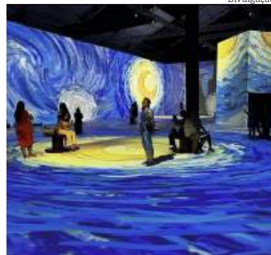
Exposição está instalada no Amazonas Shopping

Os ingressos podem ser adquiridos pela internet, por meio do site www.lightland.com.br . Os valores variam de acordo com a idade e o período de visitaçã e podem ser verificados por meio do site.