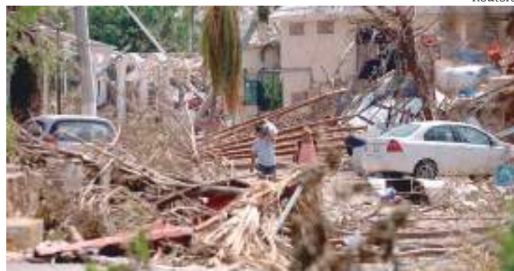
Acapulco após passagem do furacão Otis

Na tarde de domingo, autoridades federais de proteção civil do México disseram que havia 48 mortos, sendo 43 em Acapulco e cinco na vizinha Coyuca de Benítez.