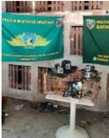
Ao todo foram apreendidos 92 galos

Uma rinha de galo, no bairro Santa Etelvina, na Zona Norte de Manaus, foi desarticulada, no domingo (29), pela Polícia Militar do Amazonas (PMAM) por meio do Batalhão de Policiamento Ambiental (BPAMB). Dois homens, de 29 e 60 anos, foram presos.