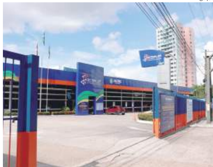
Teste laboratorial busca aferir o consumo de substâncias psicoativas

De acordo com o artigo nº 165-B, do CTB, conduzir o veículo para o qual seja exigida habilitação nas categorias “C”, “D” ou “E” sem realizar o exame toxicológico após 30 dias do vencimento do prazo, é considerado infração gravíssima, com suspensão do direito de dirigir por três meses.