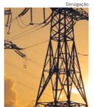
Onda de calor em novembro

A onda de calor chegou em uma época do ano em que, normalmente, a estação chuvosa já está estabelecida e em que as nuvens funcionam como uma espécie de controle das temperaturas. A ausência dessa defesa, segundo a meteorologista do Instituto Nacional de Meteorologia (Inmet) Anete Fernandes, potencializa os efeitos do fenômeno climático.