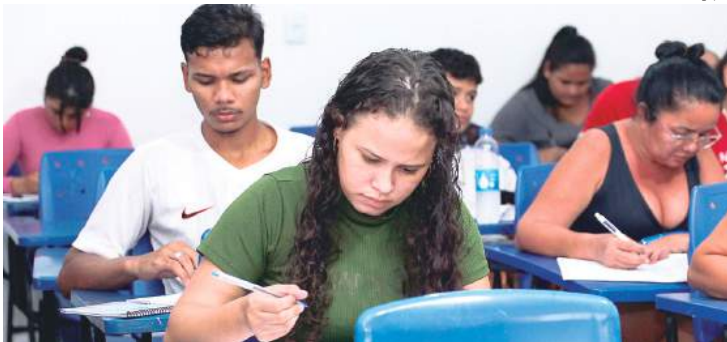
Serão oferecidas 125 vagas em seis cursos de qualificação profissional

“Esses cursos de qualificação profissional desempenham um papel fundamental no desenvolvimento contínuo dos participantes, proporcionando benefícios, tanto para os