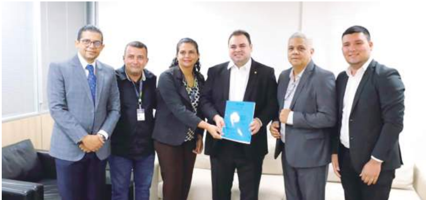
Órgão entregou relatório com as sugestões à Aleam, nesta semana

Durante 4 meses, as reuniões trataram de estudo, sugestões e encaminhamento para a implementação do marco legal da pesca esportiva no estado do Amazonas. Participaram das mudanças e sugestões para alteração inicial da PL 249-2023 cerca de 40 profissionais, pesquisadores e organizações da