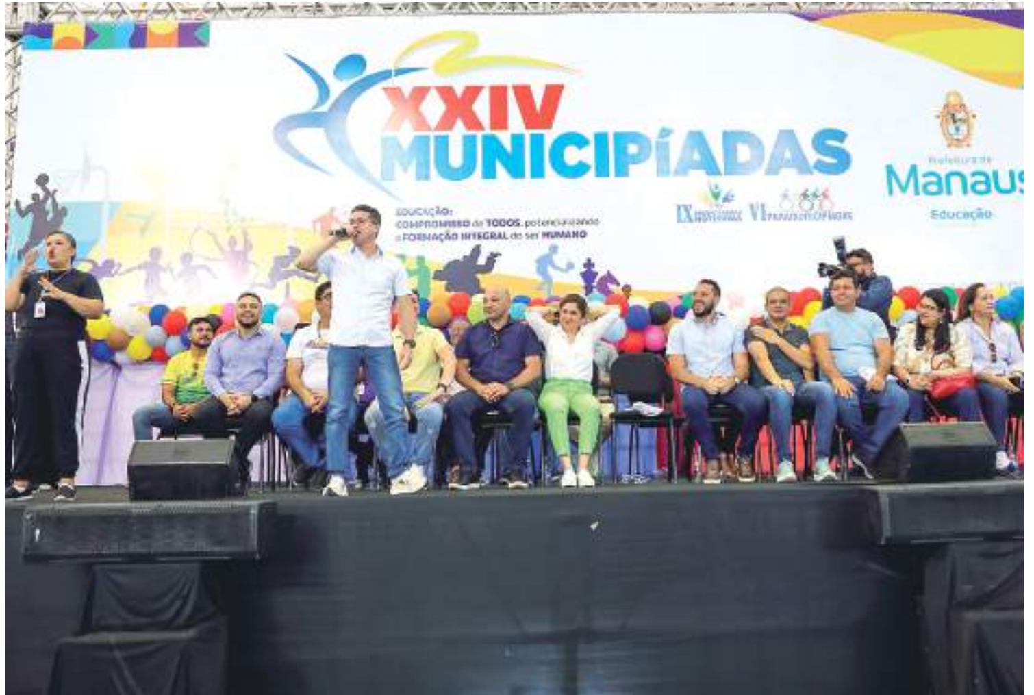
Prefeito David Almeida realizou abertura da municipiadas escolares

O evento iniciou com os desfiles das delegações, representando as sete Divisões Distritais Zonais (DDZs) e logo em seguida o acendimento da tocha olímpica que passou pelas mãos de vários atletas, até chegar ao acendimento da pira. As seletivas para os jogos ocorreram desde março deste ano e, agora, na fase final, participarão