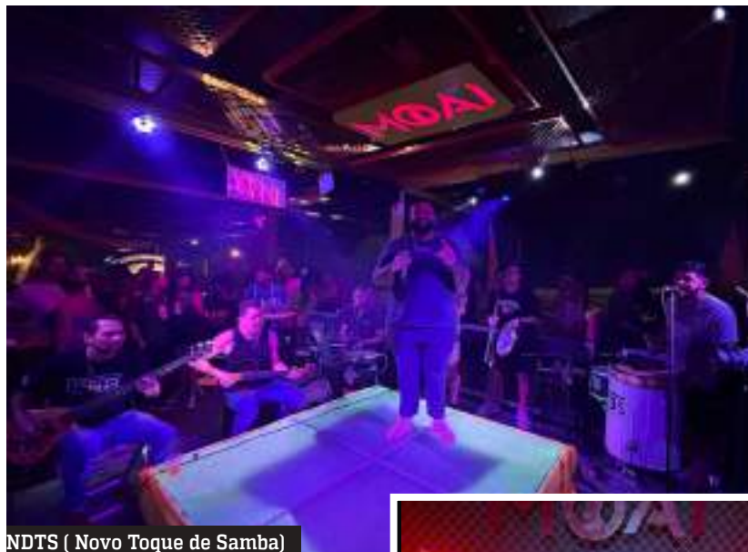
NDTS ( Novo Toque de Samba)