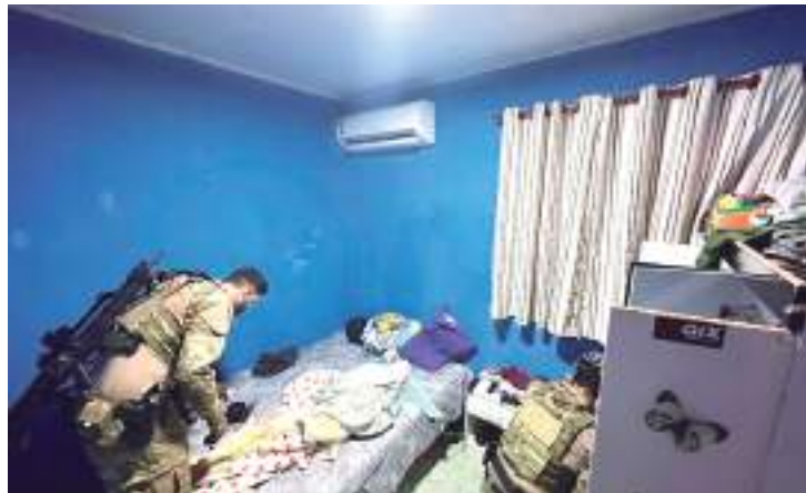
PF realiza operação para reprimir o tráfico interestadual de drogas

A Polícia Federal (PF) realizou na terça-feira (14) a “Operação Livro de Sal”, com o objetivo de reprimir o tráfico interestadual de drogas pelos Correios, em Manaus.