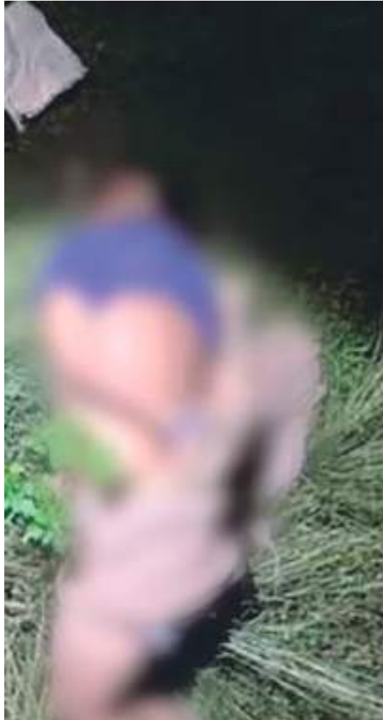
Corpo de homem apresentava sinais de tortura com pés e mãos amarradas

O caso deve ser investigado pela Delegacia de Homicídios e Sequestro (DEHS).