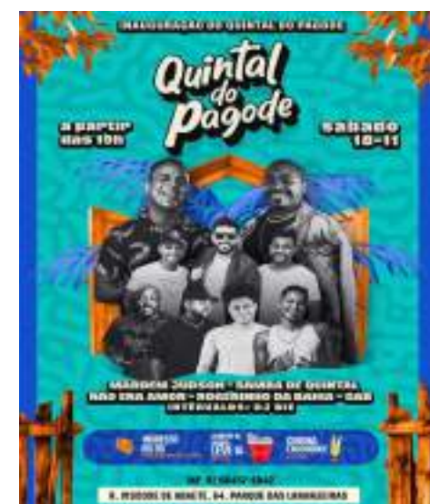
Inauguração | • Quintal do Pagode, inaugura neste final de Semana, no dia 18 de Novembro 19h. Para mais informações, acesse: @quintaldopagod_