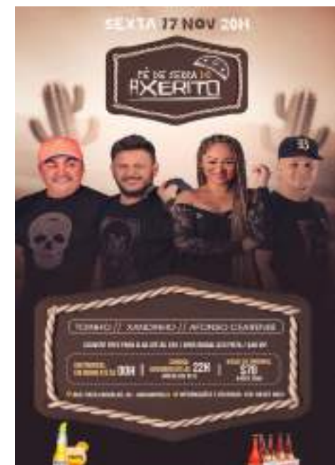
PÉ DE SERRA DO AXERITO - 17 de Novembro - Entrada Free para mulheres até 23h , Corona Em Dobro até 22h.