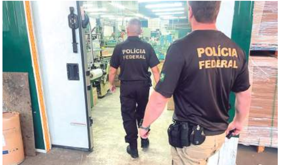
Organização criminosa tinha fábricas clandestinas espalhadas pelo país

Foi revelado que a quadrilha, chefiada por um empresário de Barueri (SP), cooptava trabalhadores no Paraguai, os quais eram trazidos para fábricas clandestinas no Brasil, na região de Divinópolis (MG), onde eram submetidos a condições de trabalho análogas à escravidão, com a liberdade tolhida, perma-