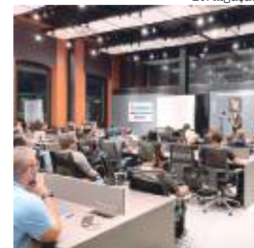
Empreendedores terão qualificação em ‘Vendas no RD Station CRM’

O RD Station CRM é uma ferramenta completa que visa otimizar os processos de vendas, melhorar a eficiência das equipes e fornecer insights valiosos para aprimorar a gestão de relacionamento com o cliente.