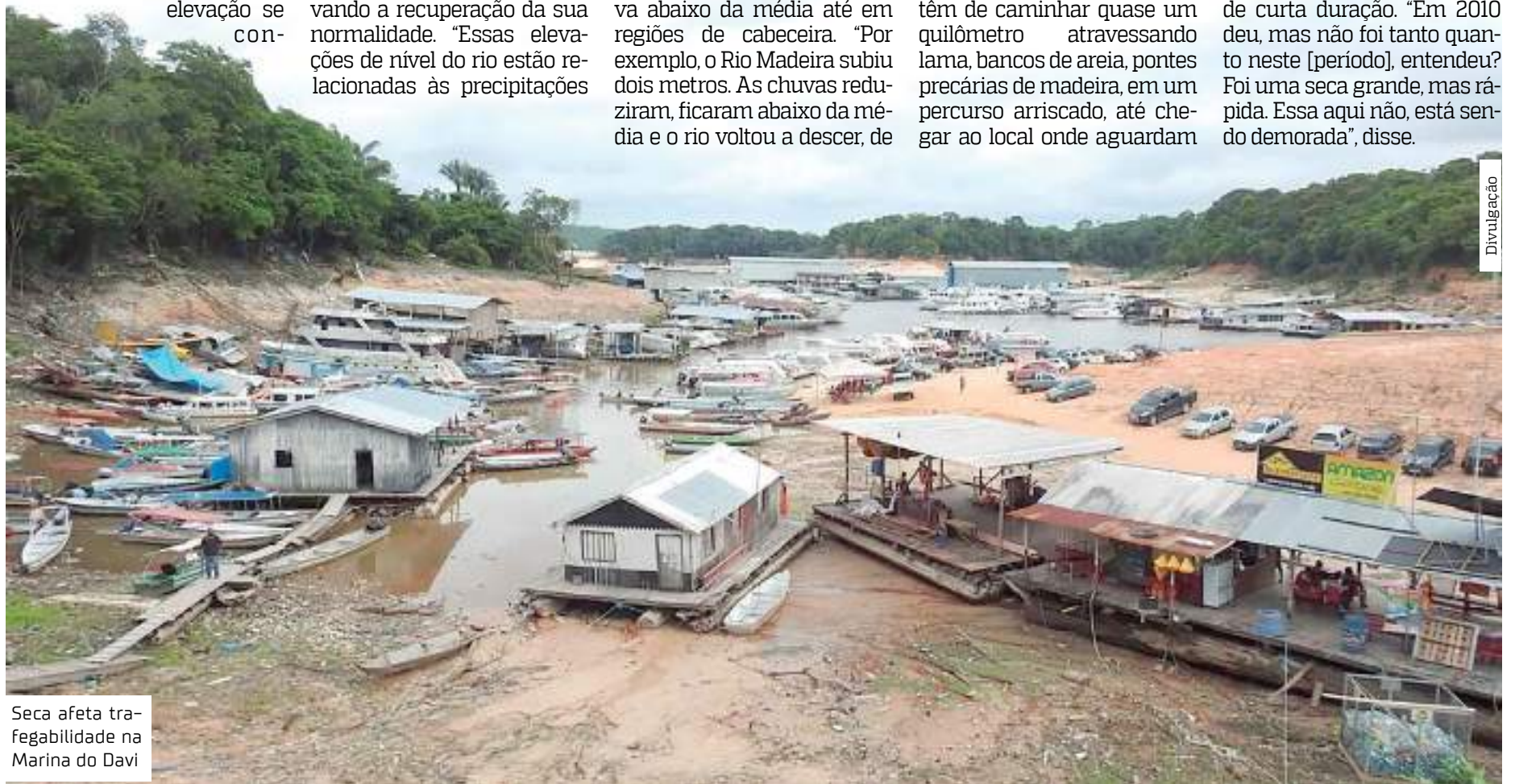
Seca afeta tra- fegabilidade na Marina do Davi