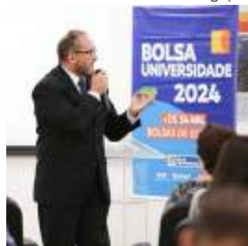
Candidatos devem se apresentarem no período de 18 a 20 de dezembro

A Prefeitura de Manaus divulgou, nesta terça-feira (21), o resultado preliminar do Programa Bolsa Universidade (PBU) 2024, coordenado pela Escola de Serviço Público e Inclusão Socioeducacional (Espí), órgão vinculado à Secretaria Municipal de Administração, Planejamento e Gestão (Semad). Nesta primeira chamada,