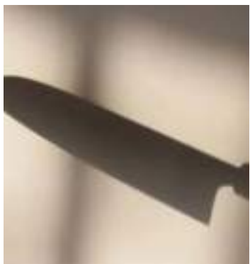
Adolescente é suspeita de esfaquear homem em área de mata