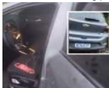
Corpo da mulher foi encontrado por motoristas