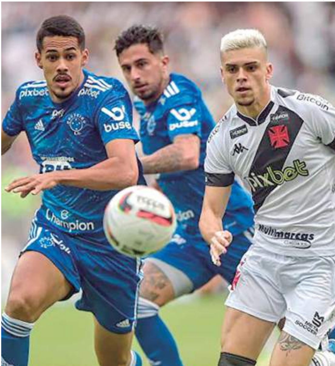
Cruzeiro tenta segunda vitória seguida diante do Vasco no Brasileirão

Após uma emocionante vitória contra a equipe Fortaleza, jogando na Arena Castelão, em jogo atrasado pela 30ª rodada do Campeonato Brasileiro, o Cruzeiro fará o 'jogo do ano' contra o Vasco. Devido à briga entre torcedores do Coritiba e do Cruzeiro na última rodada disputada do Brasileirão, o jogo será com portões fechados.