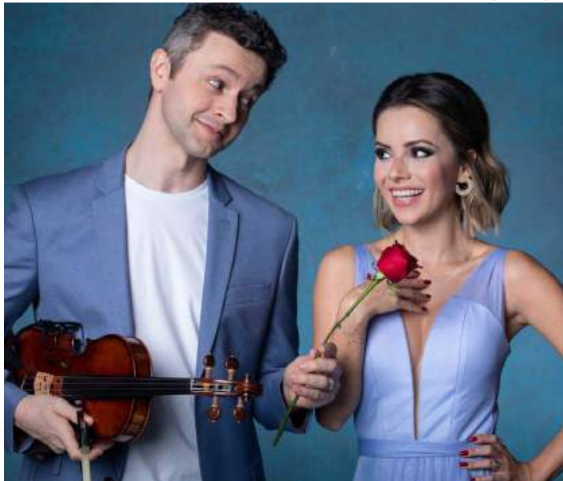
Sandy e Lucas Lima anunciaram o fim do relacionamento de 24 anos, em setembro de 2023

Sandy e Lucas Lima negaram em um comunicado nas redes sociais os rumores de que teriam reatado o relacionamento após o anúncio do divórcio. O então ex-casal estavam juntos há mais de 15 anos (com 24 anos de relação), os cantores são pais de Théo, de 9 anos.