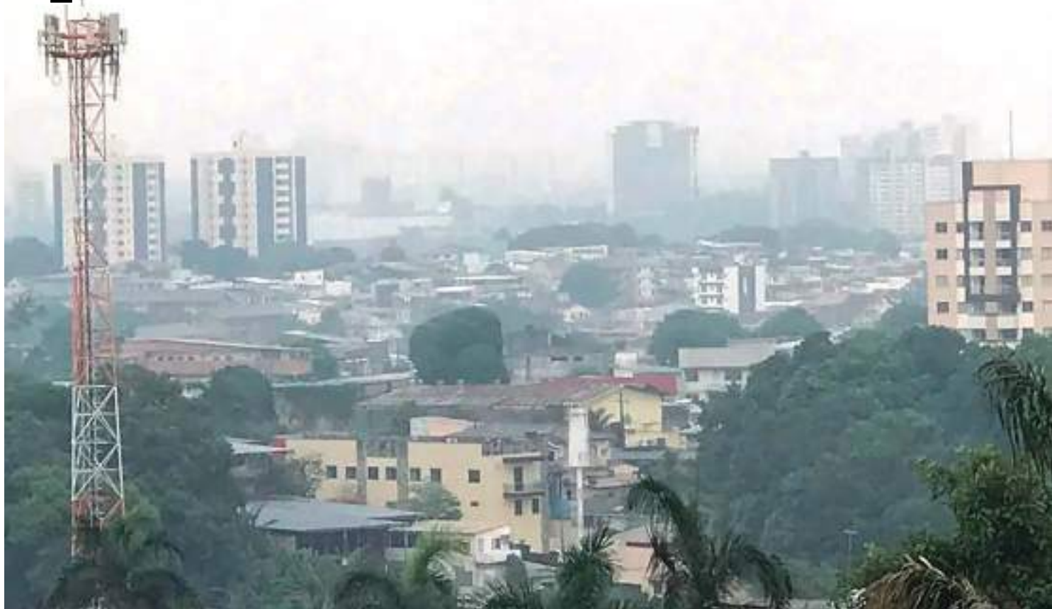
Fumaça de queimadas no bairro Aleixo Zona Centro-Sul de Manaus

uma vez que partículas de fumaça encontram dificuldades em se dispersar nessas condições.