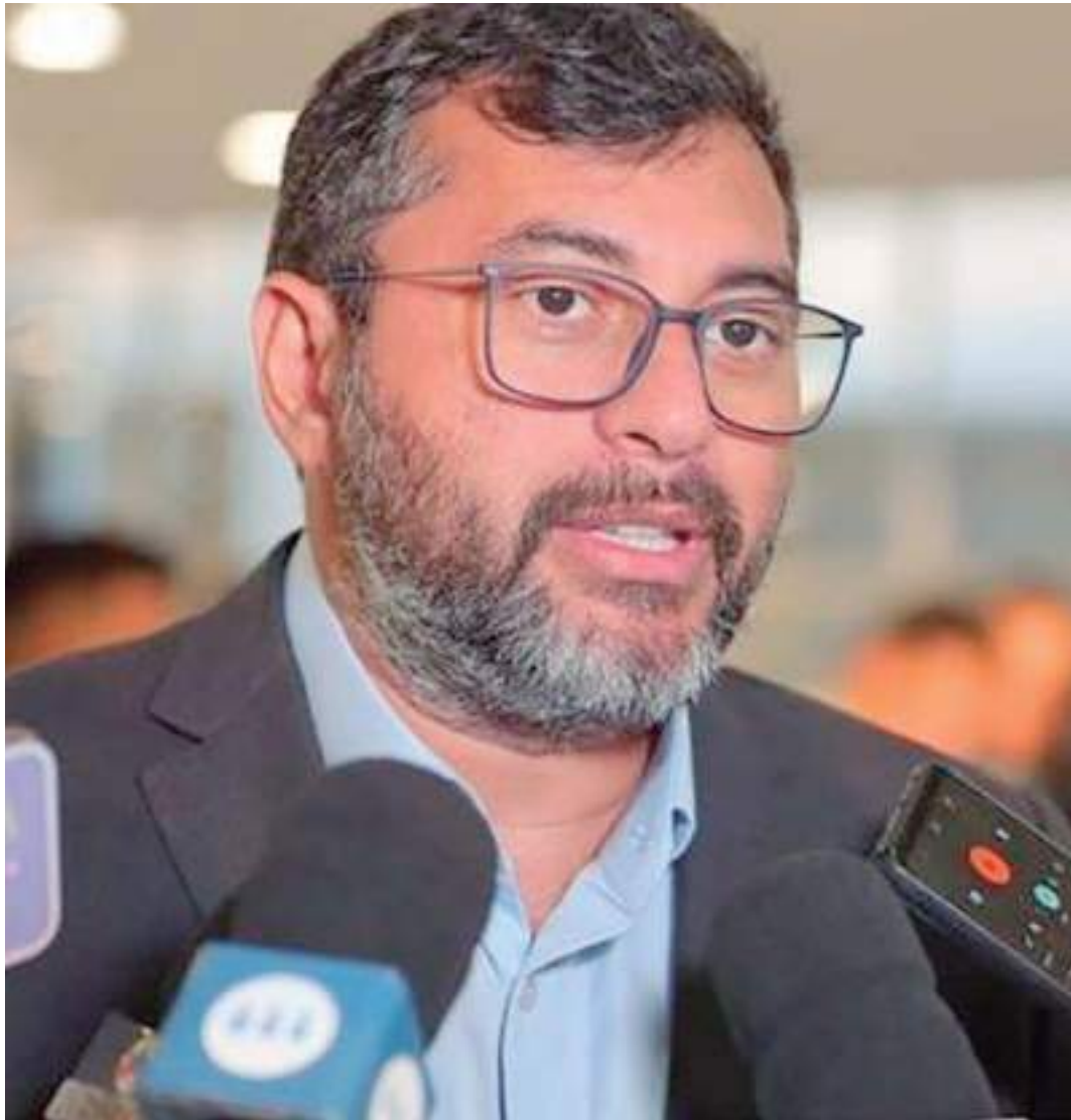
Partido União Brasil repercutiu o resultado nas redes sociais e parabenizou o governador Wilson Lima

O Amazonas conquistou o primeiro lugar na região Norte no Ranking de Competitividade dos Estados, uma avaliação que mede pilares importantes para o desenvolvimento econômico e social.