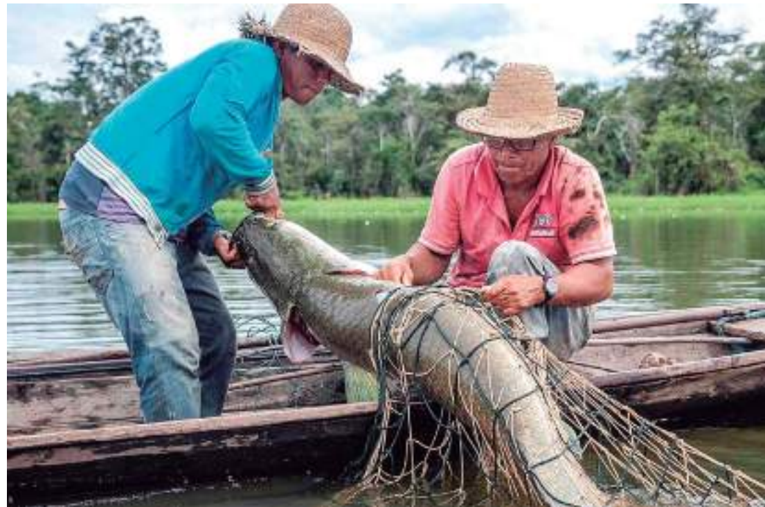
Autorização atende solicitação dos pescadores dos municípios do médio e alto rio Solimões

“Por se tratarem de áreas das quais temos relatórios anuais com as contagens de populações de pirarucu juvenil e adulto, vislumbramos fazer a prorrogação por mais um período de 20 dias, para que os manejadores possam capturar a