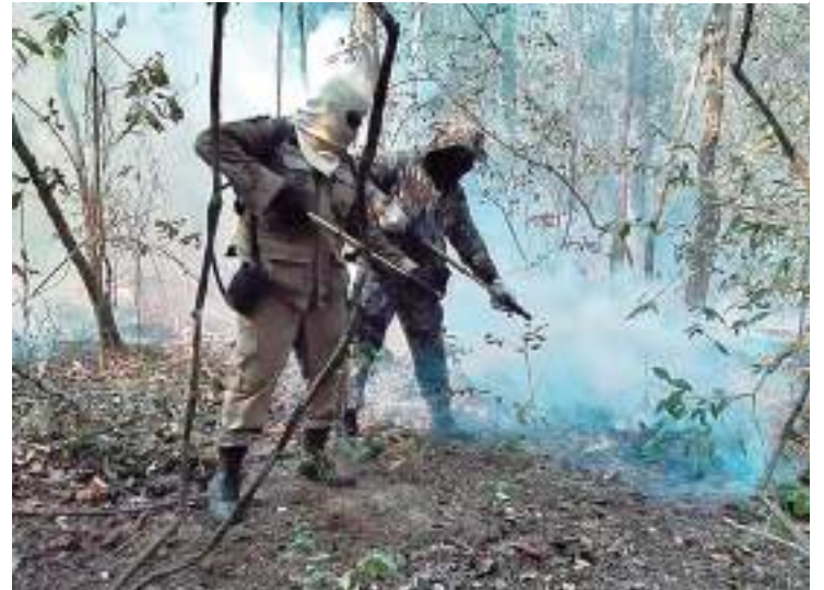
Ibama e o ICMBio haviam anunciado reforço de brigadistas e aviões

Em 21 de outubro, três raios atingiram o Parna do Pantanal, a Reserva Particular do Patrimônio Natural Dorochê e uma propriedade particular próxima, dando início a incêndios. Desde janeiro, o governo federal se planeja para a prevenção e o combate a incêndios no bioma. Em