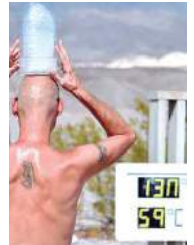
Secas colocarão pessoas em risco