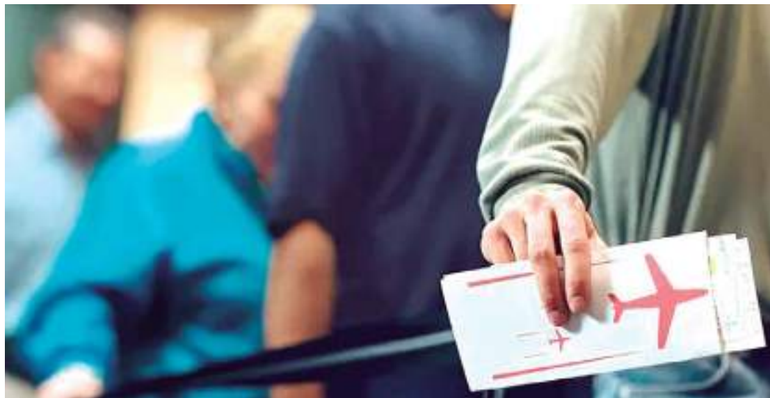
Passagens aéreas subiram 23,70% em outubro

Apesar da cobrança, o ministro ponderou que o setor aéreo foi um dos que mais sofreu durante a pandemia, por conta das medidas de isolamento social, e que o mercado brasileiro representa mais de 70% da judicialização do segmento em todo o mundo, com impactos