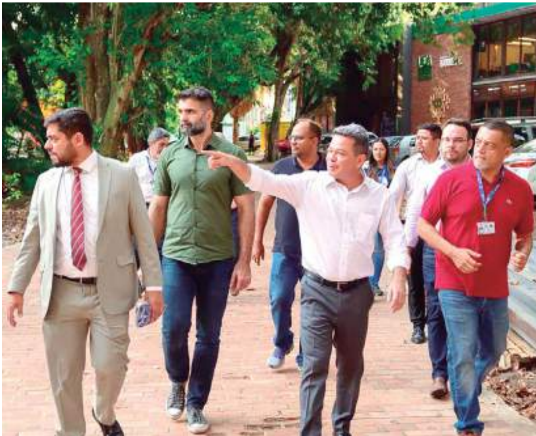
Tadeu de Souza esteve em uma das unidades da universidade para conhecer a infraestrutura e inovações

O vice-governador visitou os laboratórios que funcionam em parceria com empresas do Polo Industrial de Manaus (PIM), qualificando mão de obra para o setor tecnológico, e discutiu a ampliação do uso dos projetos. Dentre