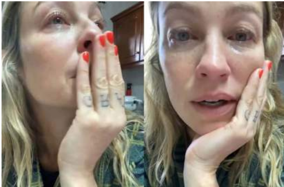
A atriz Luana Piovani ainda aproveitou para deixar um alerta aos pais