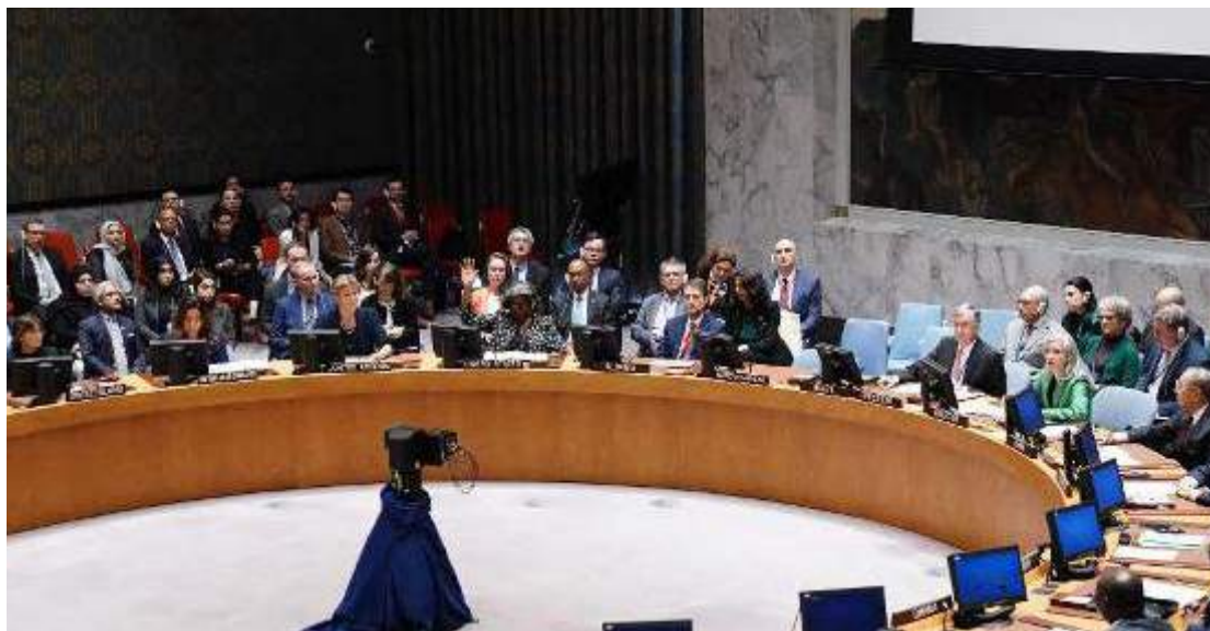
Ministério das Relações Exteriores de Israel acredita que não há lugar para as medidas propostas

O embaixador de Israel na ONU, Gilad Erdan, disse que a resolução está "des-