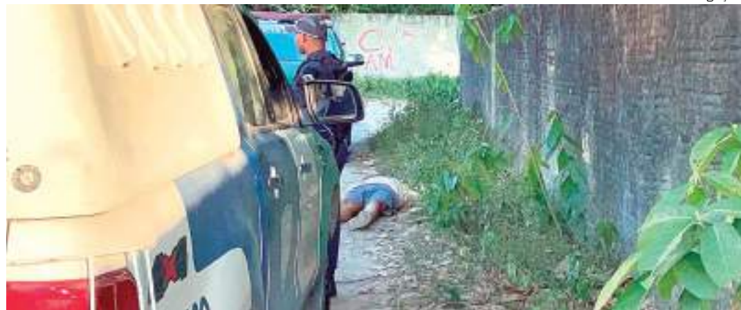
Criminosos mataram homem a tiros e fugiram do local em carros

Um homem, não identificado, foi executado com dois tiros na cabeça, no fim da tarde de quarta-feira (15), na Rua Patuá, bairro Santa Etelvina, Zona Norte de Manaus.