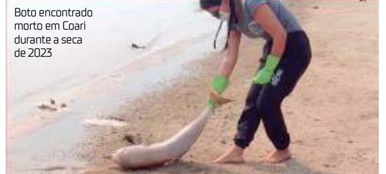
Boto encontrado morto em Coari durante a seca de 2023