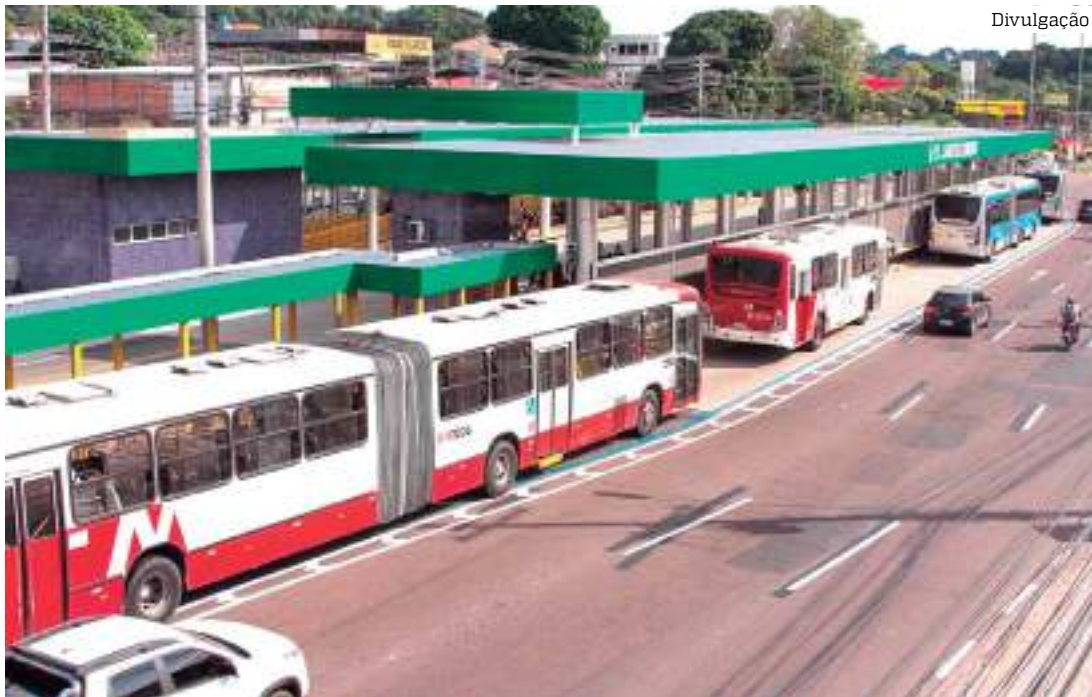
Mudanças serão em três linhas que atendem as zonas Leste e Oeste da cidade

Ainda no domingo, dia 19, outra linha também será alterada. No caso, a linha 452 - Beija Flor/ Parque das Nações/ Terminal 1/ Centro, passará a atender o per-