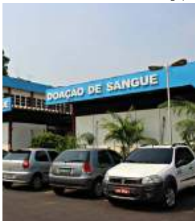
Hemoam funciona de segunda a sábado, das 7h às 18h