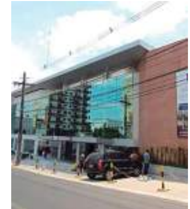
Faculdade Santa Teresa fica localizada no bairro Nossa Senhora das Graças

A campanha está prevista para ser encerrada no dia 17 de novembro, mas de acordo com o coordenador, está sendo estudada a sua prorrogação até o dia 24. Todos os itens arrecadados serão entregues a Ieadam, responsável pela entrega aos beneficiários.