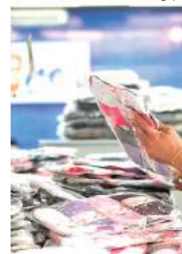
Força Sindical considera a decisão importante