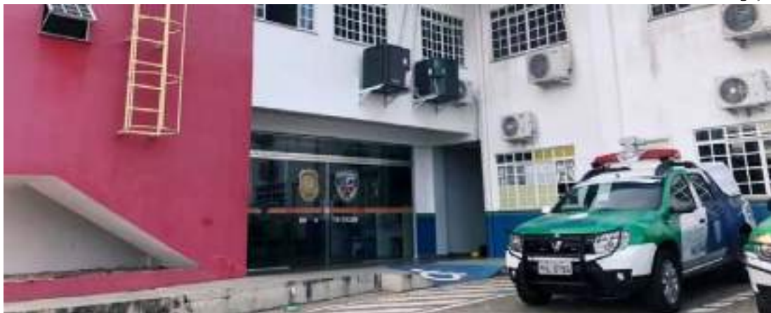
Homem foi encaminhado para delegacia de proteção à criança após deixar o hospital

Um homem suspeito de estuprar uma adolescente de 14 anos foi espancado por moradores do bairro Gilberto Mes-trinho, Zona Leste, nesta terça-feira (14). De acordo com relatos, o suspeito foi agredido após ser reconhecido por estupro que ocorreu na última segunda-feira (13).