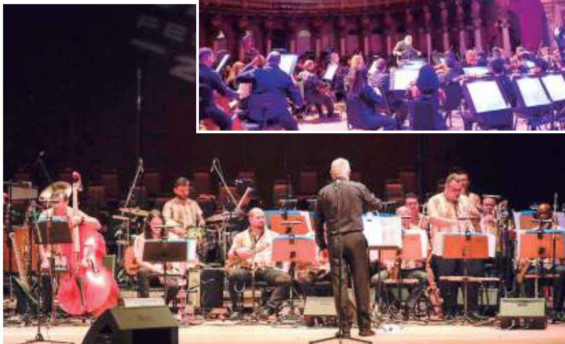
Programação inclui dança, teatro, música e outras artes, oferecendo entretenimento a todas as idades