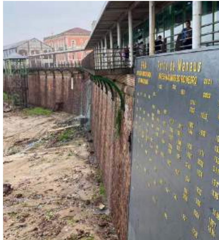
Régua do Porto de Manaus, usada na medição do nível do Rio Negro

De acordo com o Secretário-geral da OMM, Petteri Taalas, é esperado que 2023 se torne o ano mais