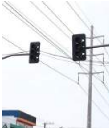
Medida busca garantir um trânsito mais seguro

Manter a fluidez na via e reduzir o número de acidentes são os objetivos da Prefeitura de Manaus, por meio do Instituto Municipal de Mobilidade Urbana (IMMU), ao instalar uma sinalização vertical semafórica, que entrou em operação nesta segunda-feira (13), no cruzamento das avenidas Tenente Roxana Bonessi com Arquiteto José Henrique, no bairro Terra Nova, na Zona Norte da cidade. A medida também garante uma