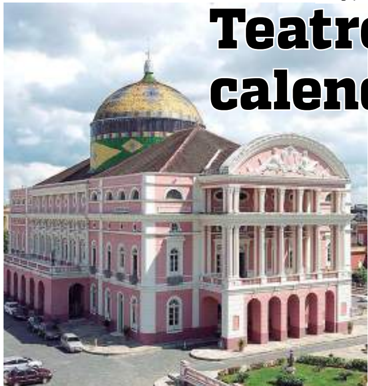
Calendário de apresentações leva artistas ao palco do Teatro Amazonas

O Teatro Amazonas divulgou a agenda de apresentações a partir da segunda metade do mês de novembro. Os espetáculos vão do dia 14 ao dia 29 deste mês. A programação é diversificada e oferece entretenimento para todas as idades.