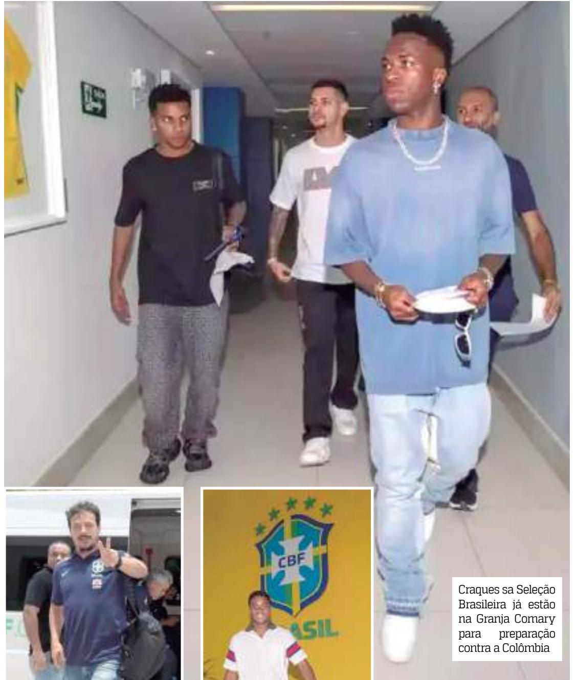
Craques da Seleção Brasileira já estão na Granja Comary para preparação contra a Colômbia

“Agradeço muito a Deus por essa oportunidade. Creio que vai ser muito especial e espero ajudar a Seleção. E também quero agradecer a todos os envolvidos que es-