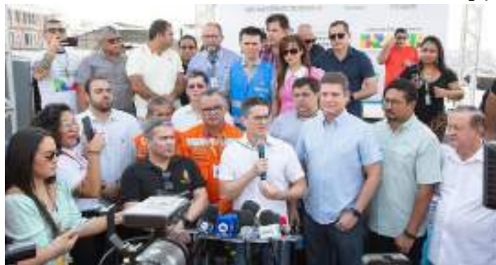
Em coletiva, prefeito anunciou repasse de R$ 3,6 milhões

"O rio é cíclico. É de conhecimento de todos que essa é a pior e mais severa estiagem de todos os tempos. Nós estamos sofrendo algo que nunca sofremos. A nossa esperança é que o rio Solimões está subindo lá na cabeceira. Em Quito, está enchendo aproximadamente 61 centímetros por dia. Então, as águas que vêm de lá, quan-