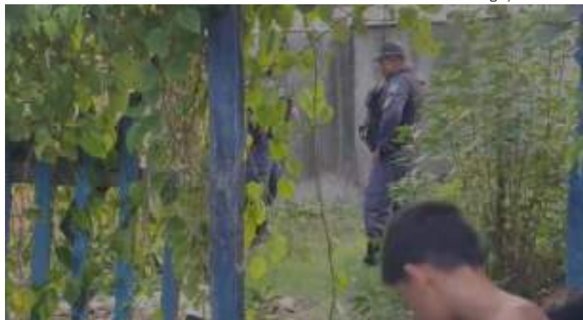
Corpo de homem foi achado em casa abandonada no Monte das Oliveiras

O corpo de um homem, não identificado, foi encontrado, no domingo (12), em uma casa abandonada, na rua Faveiro, bairro Monte das Oliveiras, Zona Norte de Manaus.