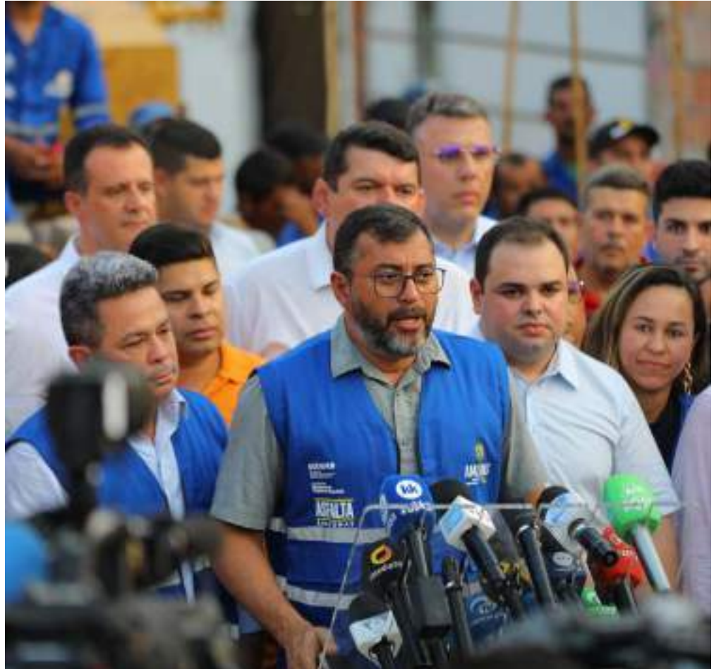
Estiveram presentes na ocasião deputados estaduais, vereadores e líderes comunitários.