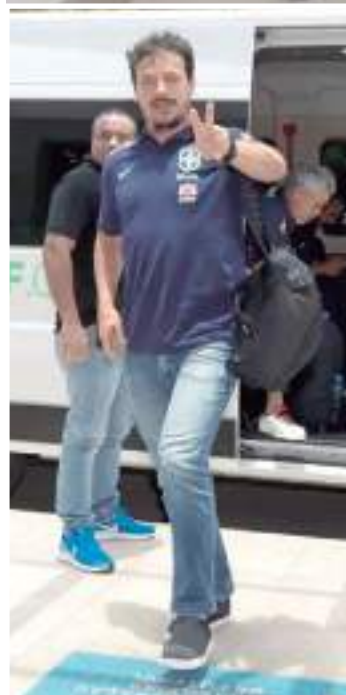
Fernando Diniz já está na Granja Comary para receber os jogadores da Seleção Brasileira