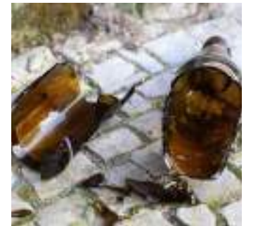
Homem levou uma garrafada durante uma discussão