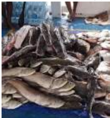
Carga apreendida foi doada para comunidade indígena

O Instituto Brasileiro do Meio Ambiente e dos Recursos Naturais Renováveis (Ibama), com o apoio da Fundação Nacional do Índio (Funai), apreendeu 300 quilos de peixes protegidos pelo período de defeso, durante operação em Beruri, distante cerca de 263 quilômetros de Manaus.