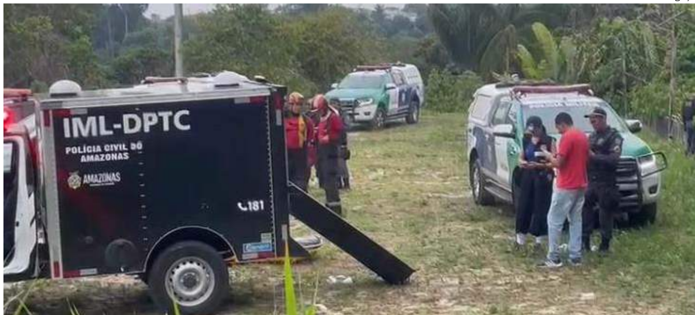
O corpo de Andryw Kalleb Imal Lobato foi encontrado em área de mata