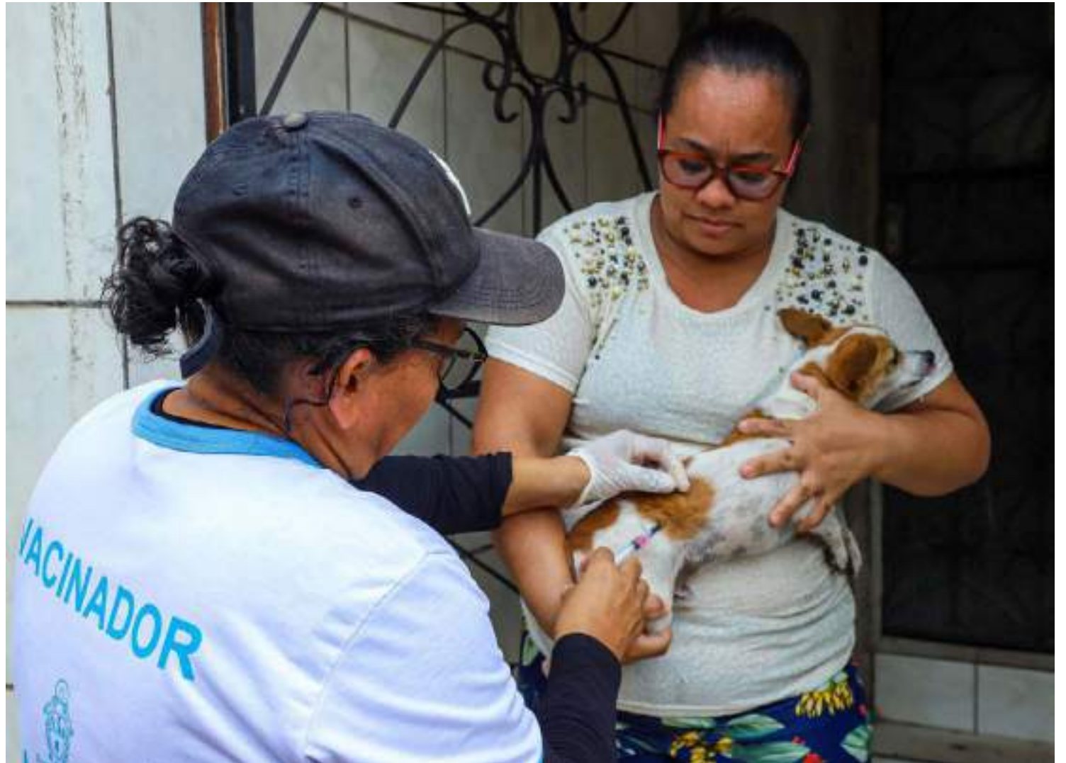
Ao todo, 220 trabalhadores atuam nas visitas de casa em casa

As atividades da campanha de imunização alcançam todas as zonas da capital nesta semana. Na zona Sul, as equipes chegarão a