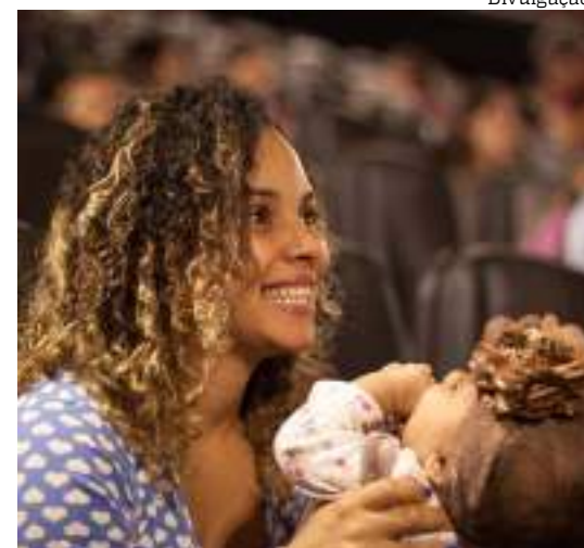
Projeto organiza sessões de cinema para pais e filhos

“Proporcionar uma sessão inclusiva para famílias com bebês de até 18 meses, criando um espaço especial em meio às transformações da maternidade é significativo para o Shopping Ponta Negra que busca oferecer experiências únicas a seus clientes”, ressalta a gerente de Marketing do Shopping Ponta Negra, Priscila Furtado.