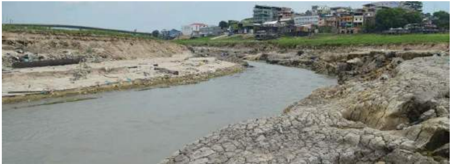
Imagem mostra impacto da seca de 2023 na foz do Igarapé do Quarenta

De acordo com o 51º Boletim de Alerta Hidrológico da Bacia do Amazonas, do Serviço Geológico do Brasil (SGB) essas oscilações