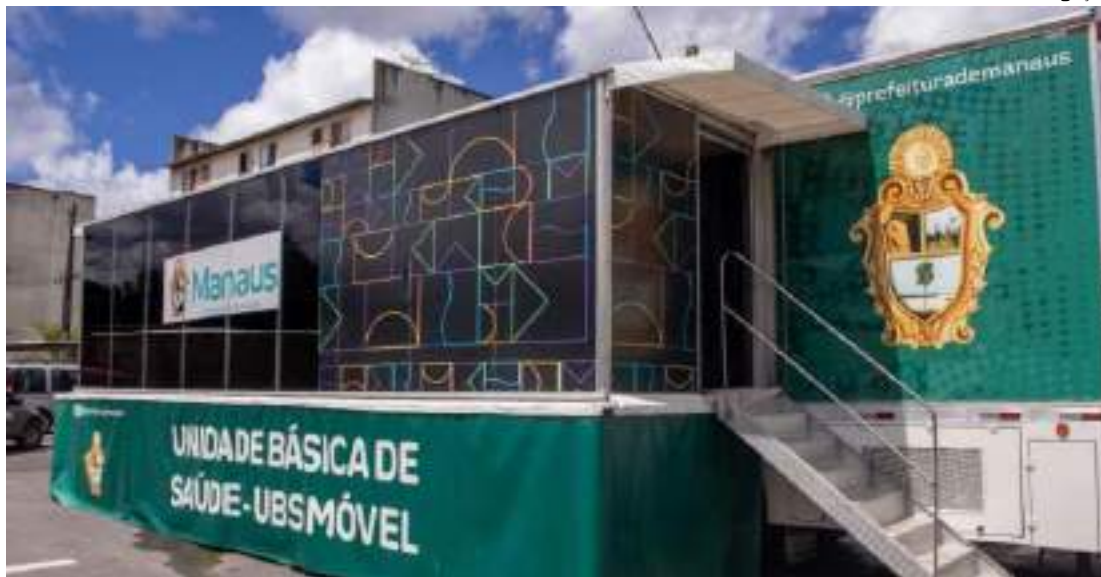
Unidade Básica de Saúde Móvel na comunidade Val Paraíso