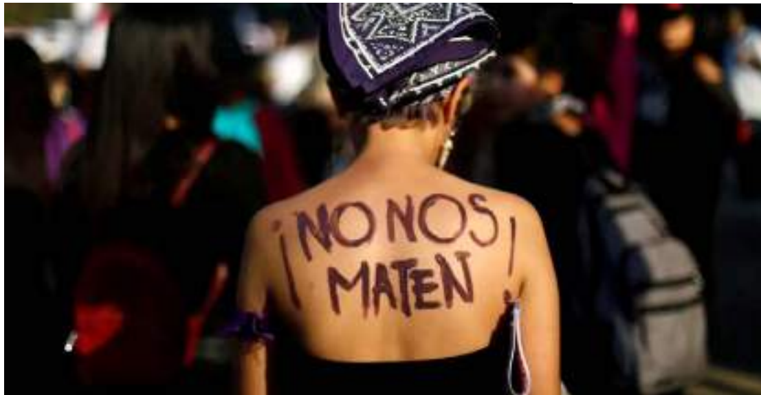
Movimento surgiu a partir da iniciativa 16 Dias de Ativismo pelo Fim da Violência contra a mulher

Uma mulher é vítima de violência a cada quatro horas, conforme da-