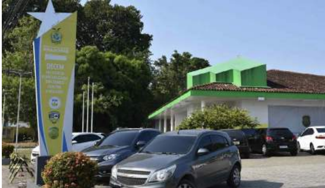
Filho esfaqueou a mulher que “cuidava” da mãe e abusava dele