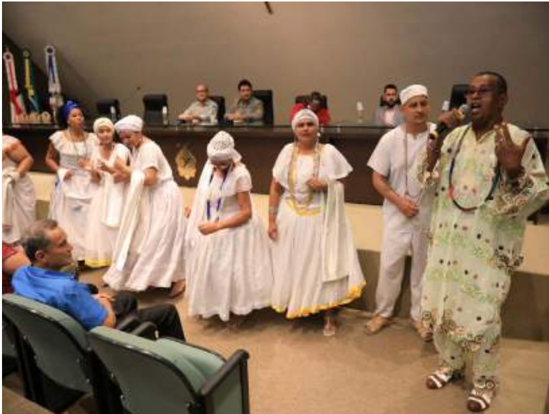
Data marca a trajetória de lutas por reconhecimento e igualdade

“Lamento que ainda hoje seja preciso criar leis para que as pessoas façam o básico, que é respeitar umas às outras, mas, se ainda é necessário, que possamos fazer a nossa parte e criar meios de educação e conscientização. Essa lei tem esse objetivo, o de permitir que por meio de campanhas educativas em escolas, eventos esportivos, culturais e demais espaços, sejam divulgadas informações, esclarecimentos e números de denúncias para que as pessoas tenham consciência de que o comportamento racista e discriminatório é algo que não coube nunca e agora muito menos. Todo