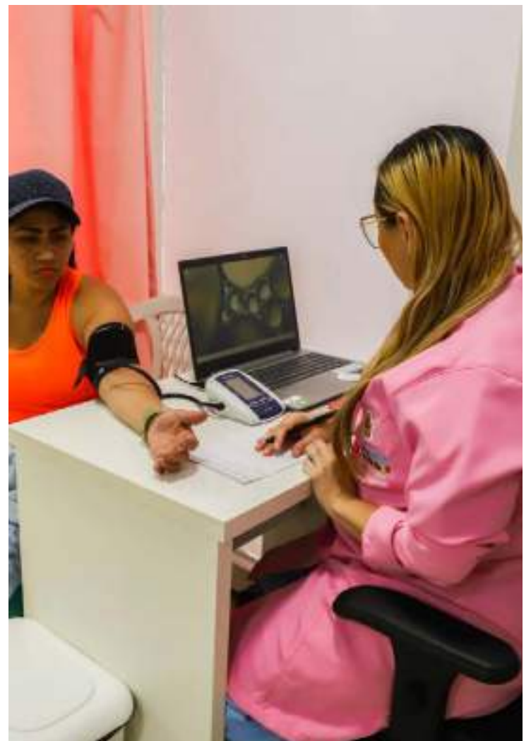
Unidade Móvel de Saúde da Mulher atende mulheres da zona Oeste

Os moradores do Tatumã-Açu, na zona Oeste, podem buscar os serviços oferecidos pela UBS Móvel 03, na rua Sete, que está apoiando a USF Lindalva Damasceno.