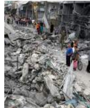
Ataque israelense em Gaza