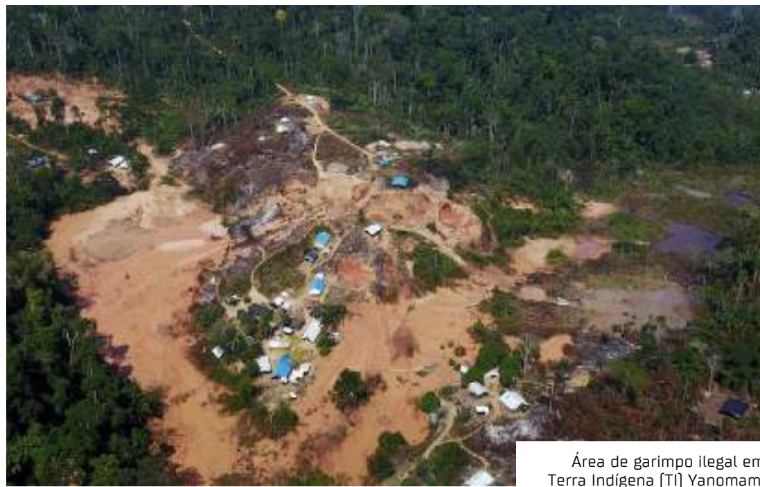
Área de garimpo ilegal em Terra Indígena (TI) Yanomami

A pesquisa revelou que mais de 20% dos peixes vendidos nos 17 centros urbanos visitados possuem níveis de mercúrio superiores aos limites seguros estabelecidos pela Organização para Alimentação e Agricultura das Nações Unidas (FAO/OMS) e pela Agência de Vigilância Sanitária brasileira (ANVISA).