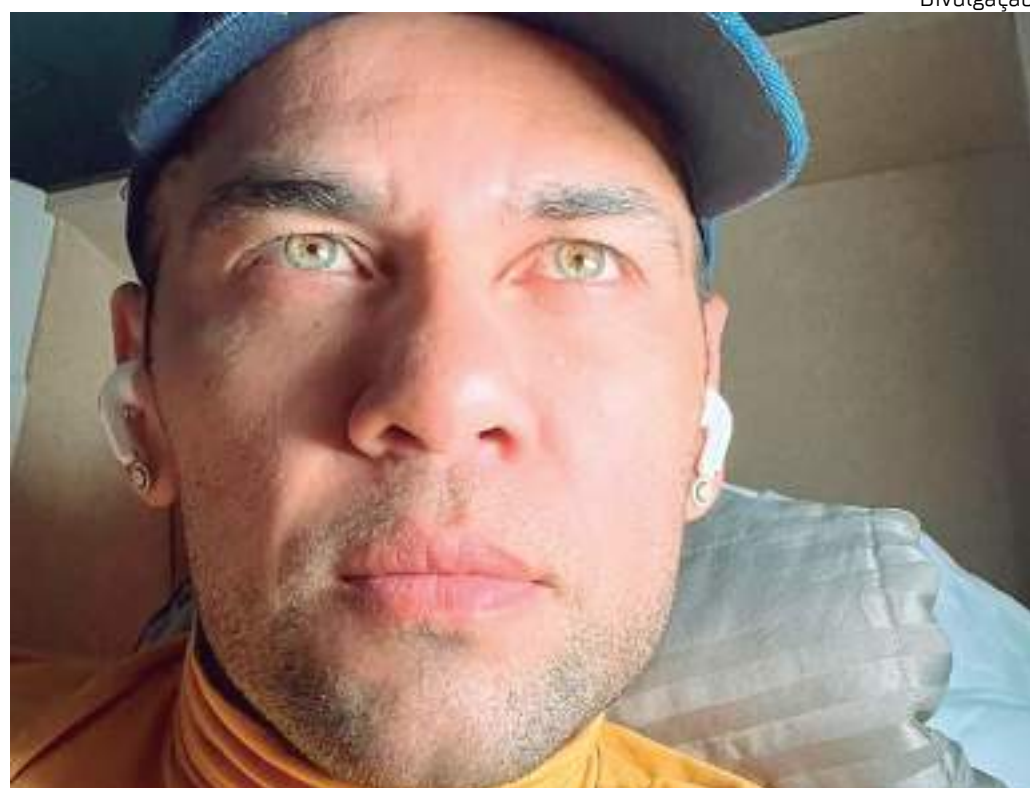
Caso Daniel Alves pode ser encerrado ainda neste ano, segundo advogados do jogador