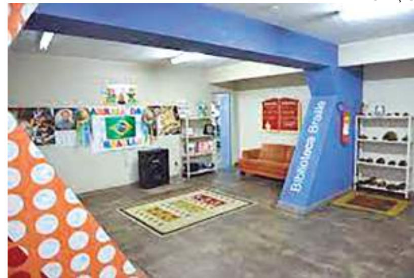
Espaço oferece cultura em diversas formas para pessoas com deficiência visual