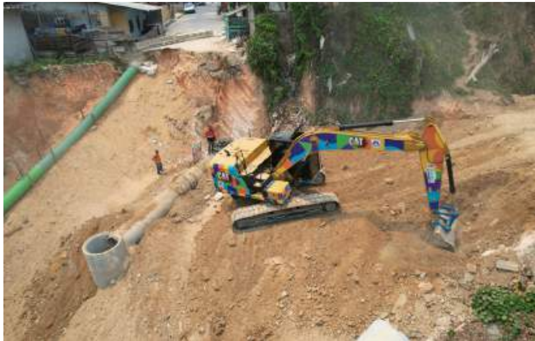
Obra de drenagem profunda tem construção de duas caixas coletoras de efluentes pluviais

A Prefeitura de Manaus conta sempre com a colaboração dos moradores em toda a cidade, na identificação de áreas mais afetadas, para que as obras emergenciais sejam realizadas de forma emergencial e célere.