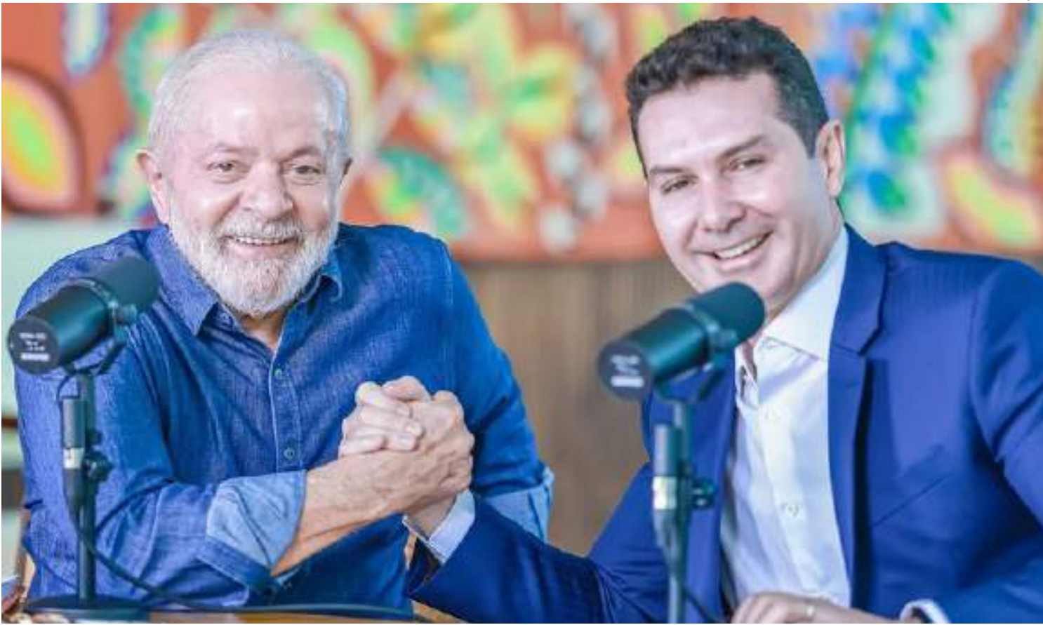
Meta de contratações deve ser atingida até 2026, segundo o atual ministro das Cidades Jader Filho

“O Minha Casa, Minha Vida é um sonho de cada mulher, de cada homem, de cada trabalhador. E não é favor. É obrigação. Está na Constituição que cabe ao Estado garantir o direito à saúde, o direito à educação e o direito à