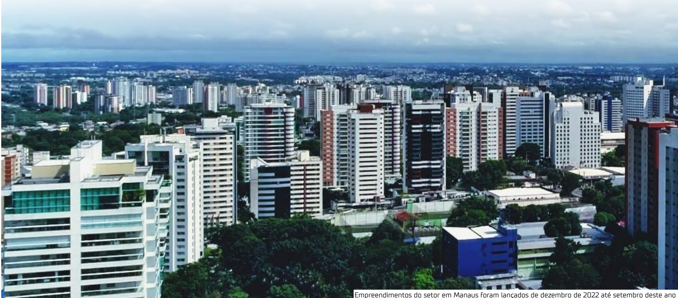
Empreendimentos do setor em Manaus foram lançados de dezembro de 2022 até setembro deste ano

Até o final da próxima década, as áreas urbanas do globo deverão crescer em 80%, e esse aumento deverá ser vertical, se as cidades não quiserem acumular ainda mais problemas além dos que têm hoje. É o que diz o relatório da World Resources Institute (WRI), realizado em conjunto com a Universidade Yale, de 2019. Ainda de acordo com esse estudo,