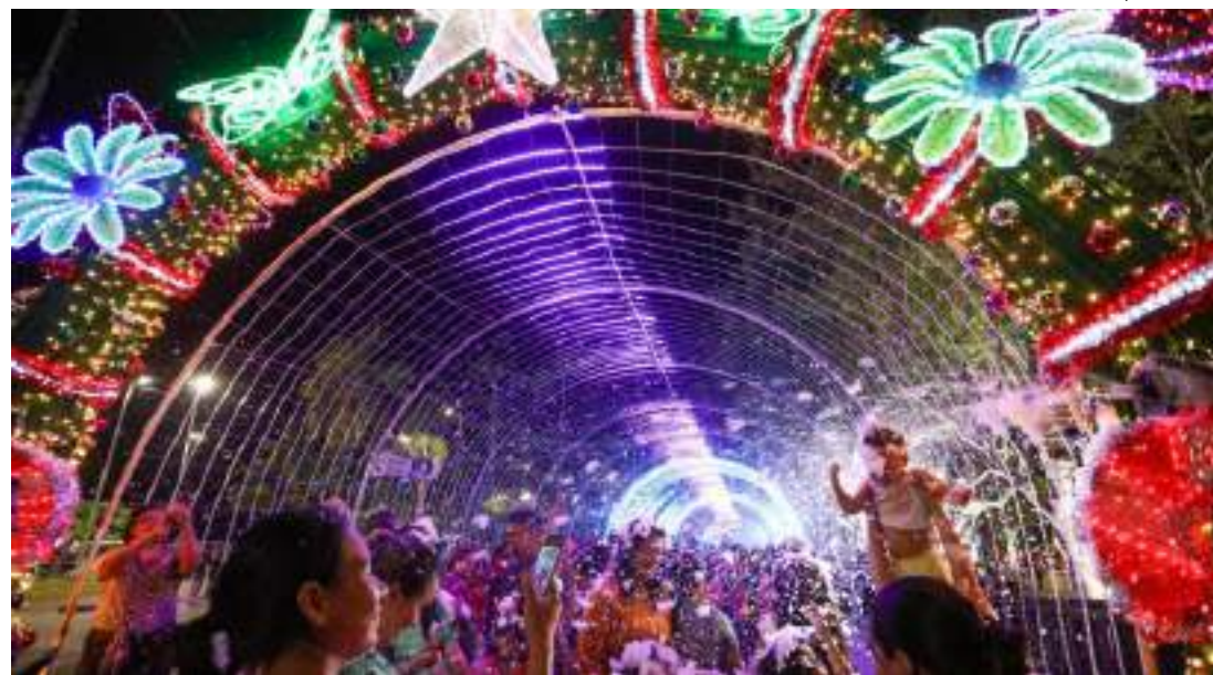
Túnel de 80 metros com mil fitas de LED foi inaugurado no calçadão da Ponta Negra

“É uma oportunidade que a gente tem de fazer em toda a cidade de Manaus aquilo que era feito em ape-