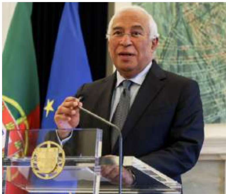
Operação apura irregularidades na exploração de lítio e hidrogênio verde