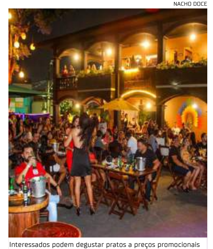
Interessados podem degustar pratos a preços promocionais

Entre os estabelecimentos participantes em Manaus, destacam-se nomes como o Restaurante Rei do Churrasco (unidade Cachoeirinha e Cidade Nova), Snoopy Bar, Biergarten Manaus, Camarão Amazonas, Dedé Boteco (Amazonas Shopping), Salomé Bar, Expresso 73, Flor de Jambu Manaus, Restaurante Calçada Alta, Ancho Steak Burger, Camaruri Bar e Restaurante, Bem Assados Restaurante e Choperia, Casa Paraense, Dom Frangão, Minhas Delícias Culinária