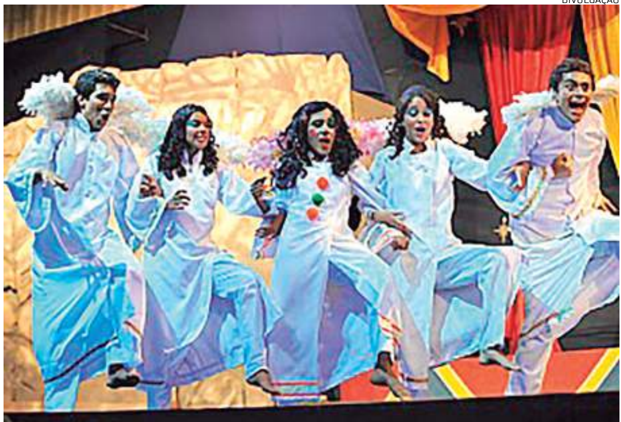
Apresentações serão realizadas entre os dias 9 e 25 de dezembro