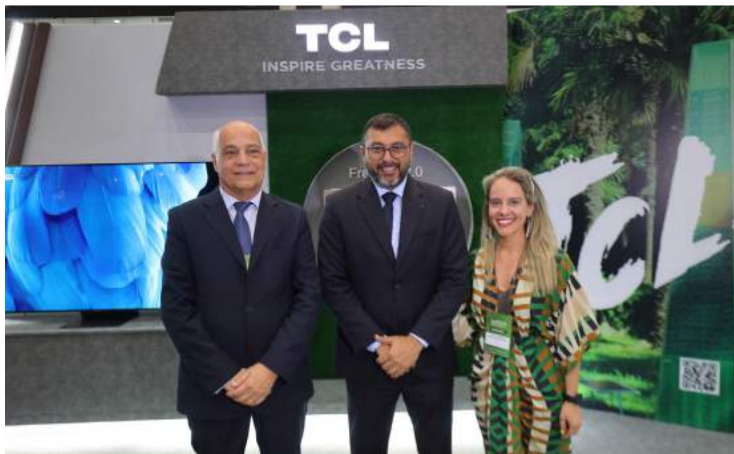
Wilson Lima participou da abertura da 2ª edição da Feira de Sustentabilidade do Polo Industrial de Manaus (FesPIM)

Segundo Wilson Lima, é preciso que o Brasil reconheça que a Zona Franca de Manaus é não apenas a principal força econômica do Amazonas, mas a responsável por manter 97% da floresta amazônica do estado preservadas. E, ainda, que