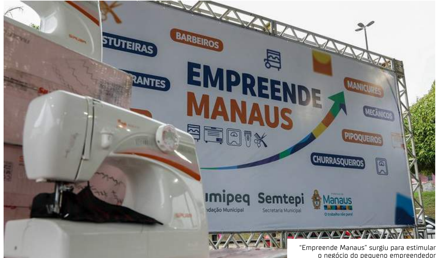
"Empreende Manaus" surgiu para estimular o negócio do pequeno empreendedor

"Fazer a aquisição dos itens foi um desafio para a gestão pública. Nunca houve a entrega de máquinas de costura, de roçadeiras, de estufas e de freezers. Cada um de vocês, vai poder utilizar uma ferramenta para melhorar a qualidade de vida das suas famílias, é para isso que a gente está aqui. E nós estamos simplesmente devolvendo tudo que vocês investem no poder público. Nós entregamos pneu para os empreendedores da área de transporte, que não pararam na pandemia, e hoje nós vamos entregar as máquinas de costura, de um programa que vai entregar seis mil itens. Esse é o primeiro grupo que está recebendo, fazendo justiça e, simbolicamente, vocês representam todos os empre-