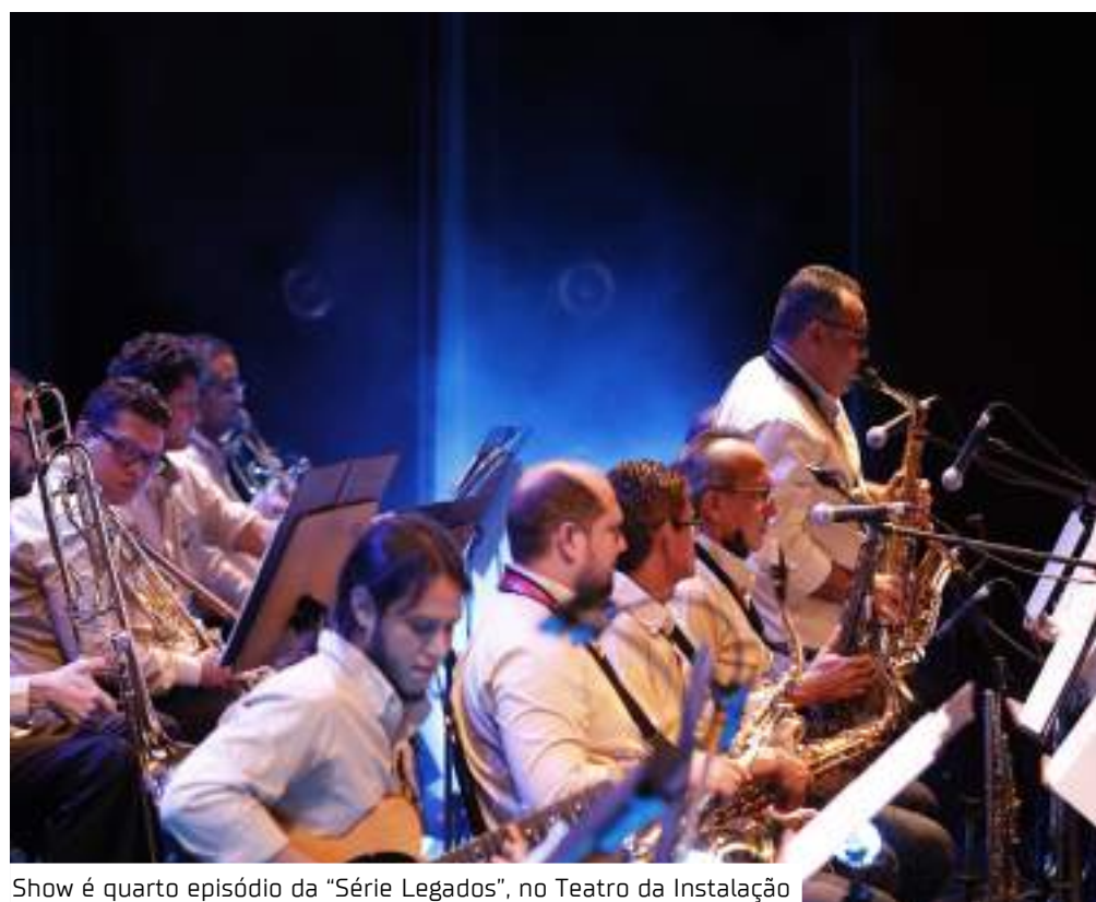
Show é quarto episódio da "Série Legados", no Teatro da Instalação