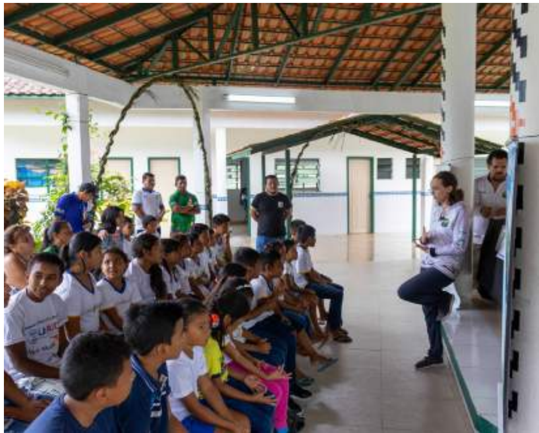
Pesquisa visa popularizar importância da conservação de espécies amazônicas