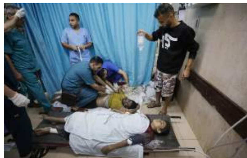
OMS continua fazendo apelos em favor de médicos que atuam em Gaza