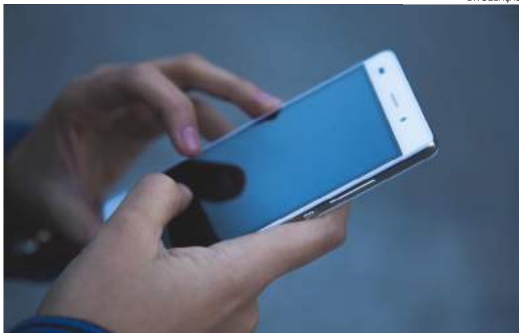
KEFI foi desenvolvida para oferecer apoio anônimo e gratuito

O propósito da ferramenta é acolher adolescentes e jovens recém-diagnosticados com HIV, oferecendo