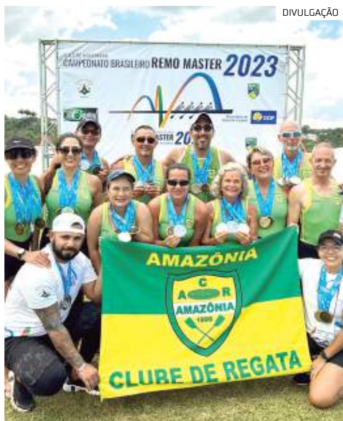
Campeonato Brasileiro Master foi disputado em Brasília