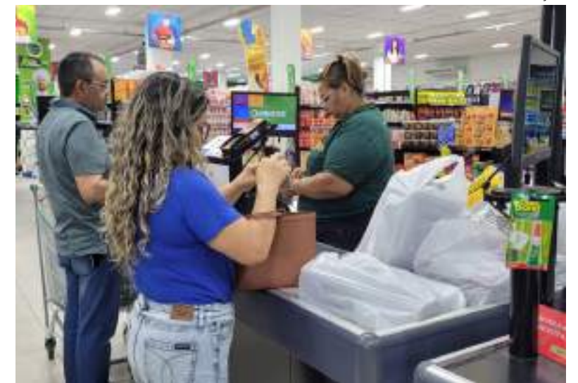
Varejista espera crescimento de 30% nas vendas