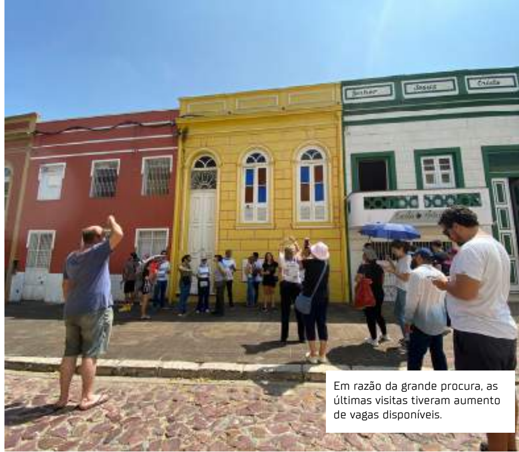
Em razão da grande procura, as últimas visitas tiveram aumento de vagas disponíveis.

O tour tem coordenação do Implurb, com apoio da Fundação Municipal de Cultura, Turismo e Eventos (Manauscult)