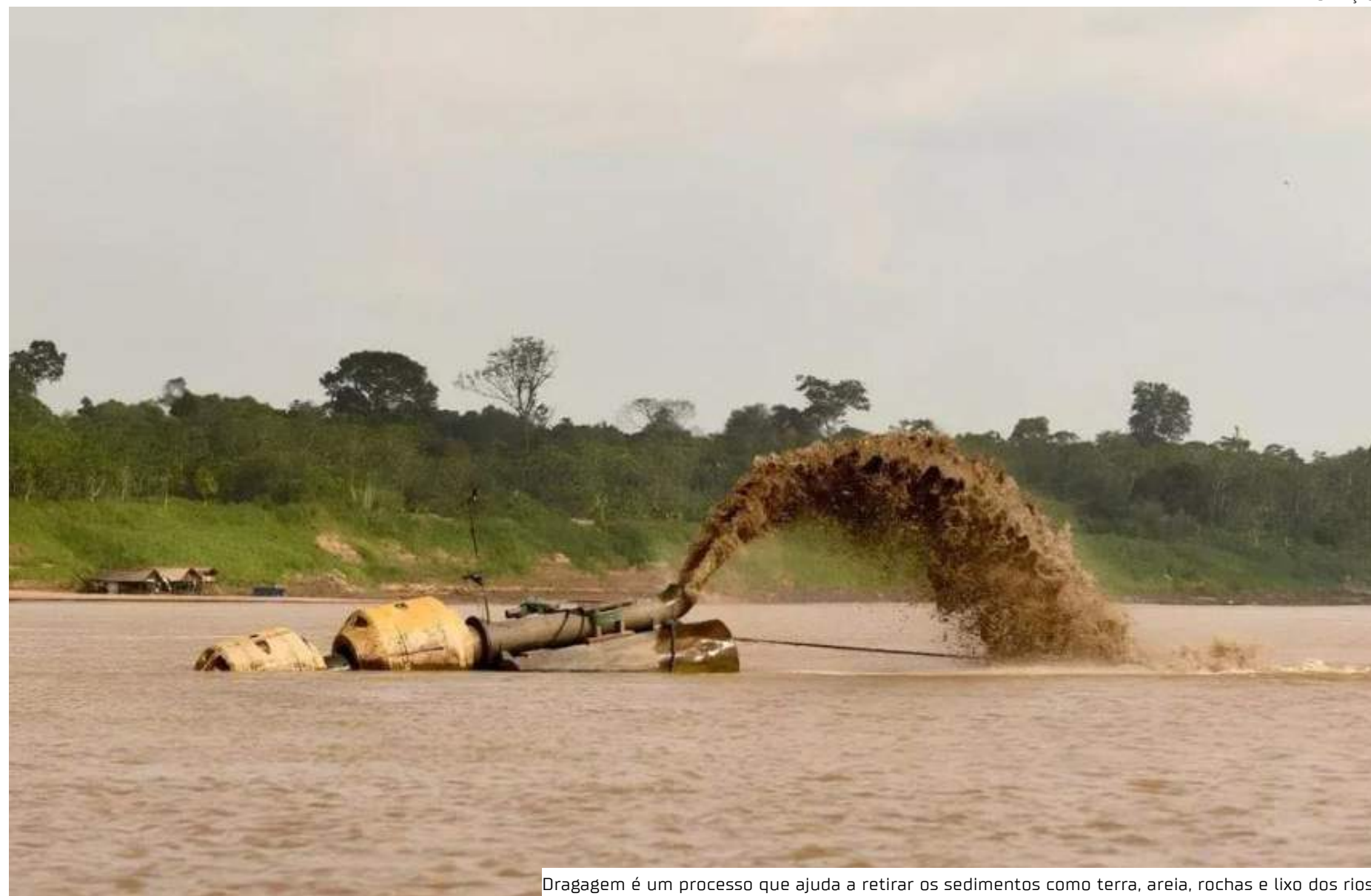
Dragagem é um processo que ajuda a retirar os sedimentos como terra, areia, rochas e lixo dos rios

“Com o início da dragagem na enseada do rio Madeira, temos o