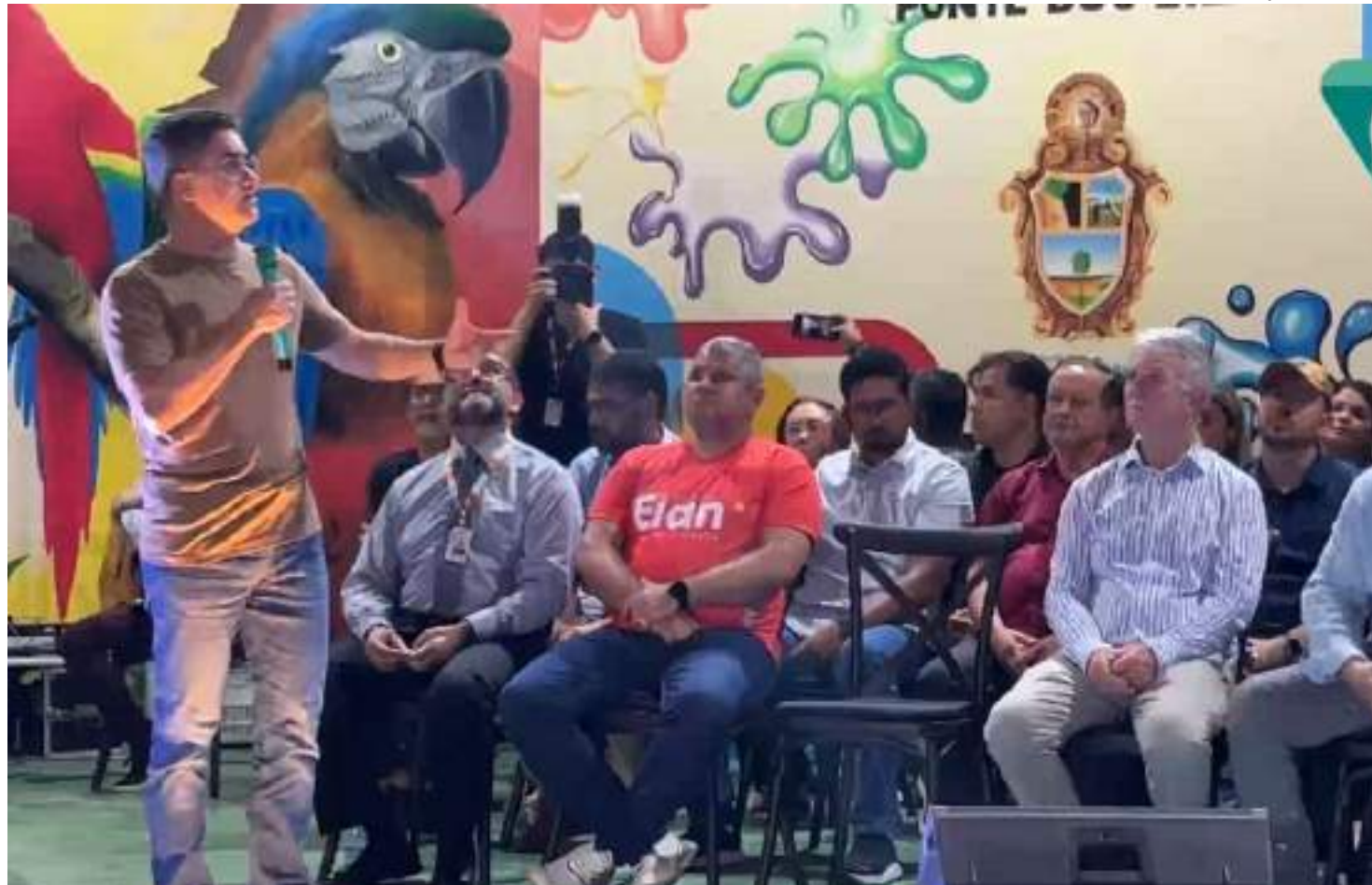
Prefeito anunciou inauguração após reformas na estrutura do parque