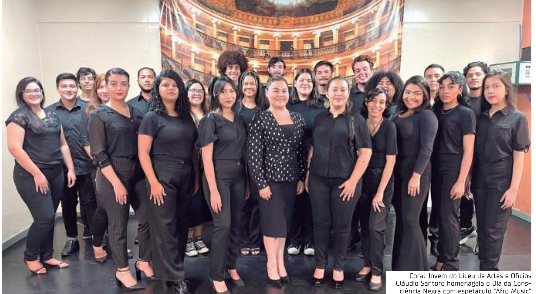
Coral Jovem do Liceu de Artes e Ofícios Cláudio Santoro homenageia o Dia da Consciência Negra com espetáculo "Afro Music"

Com musicalidade caracteristicamente africana e um trabalho vocal linguisticamente diferenciado, a proposta do concerto contempla a agregação de instrumentos percussivos, instrumentais coloridas para