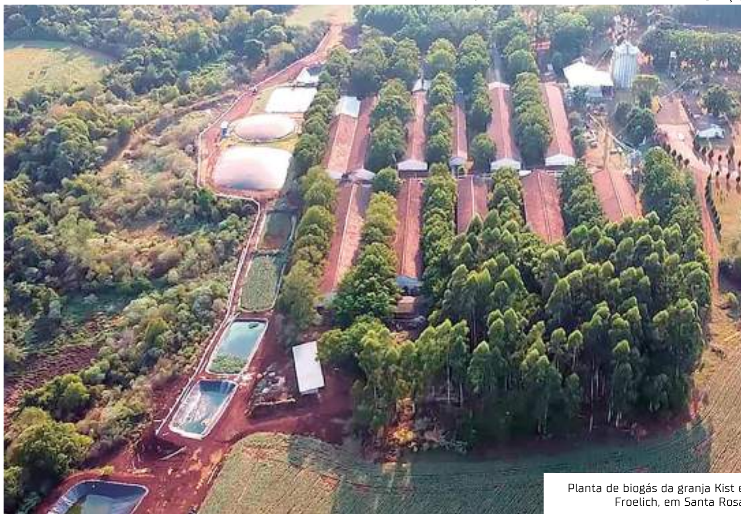
Planta de biogás da granja Kist e Froelich, em Santa Rosa

Os dois são quimicamente idênticos e podem inclusive ser misturados nos gasodutos, mas têm uma grande diferença no que se refere a emissões. Considerando toda a cadeia de