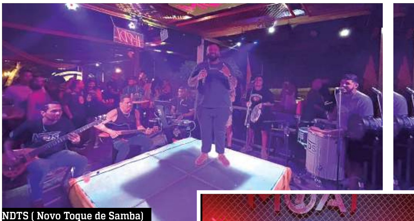
NDTS ( Novo Toque de Samba)