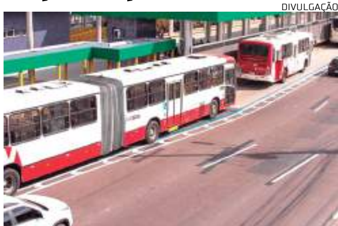
Mudanças são em três linhas que atendem as zonas Leste e Oeste

Ainda no domingo, dia 19, outra linha também será alterada. No caso, a linha 452 – Beija Flor/ Parque das Nações/ Terminal 1/ Centro, passará a atender o percurso pelas avenidas João Valério e Constantino Nery. A medida visa o retorno à operação da linha nesse trajeto, principalmente, após os devidos reparos realizados no complexo viário Roberto Campos. Outra mudança da linha 452 será na rua Souza Campos, no bairro Flores.