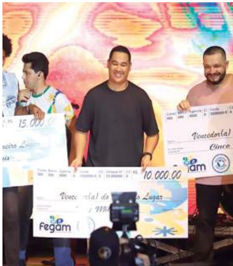
Os três ganhadores foram premiados com de R$ 15 mil, R$ 10 mil e R$ 5 mil