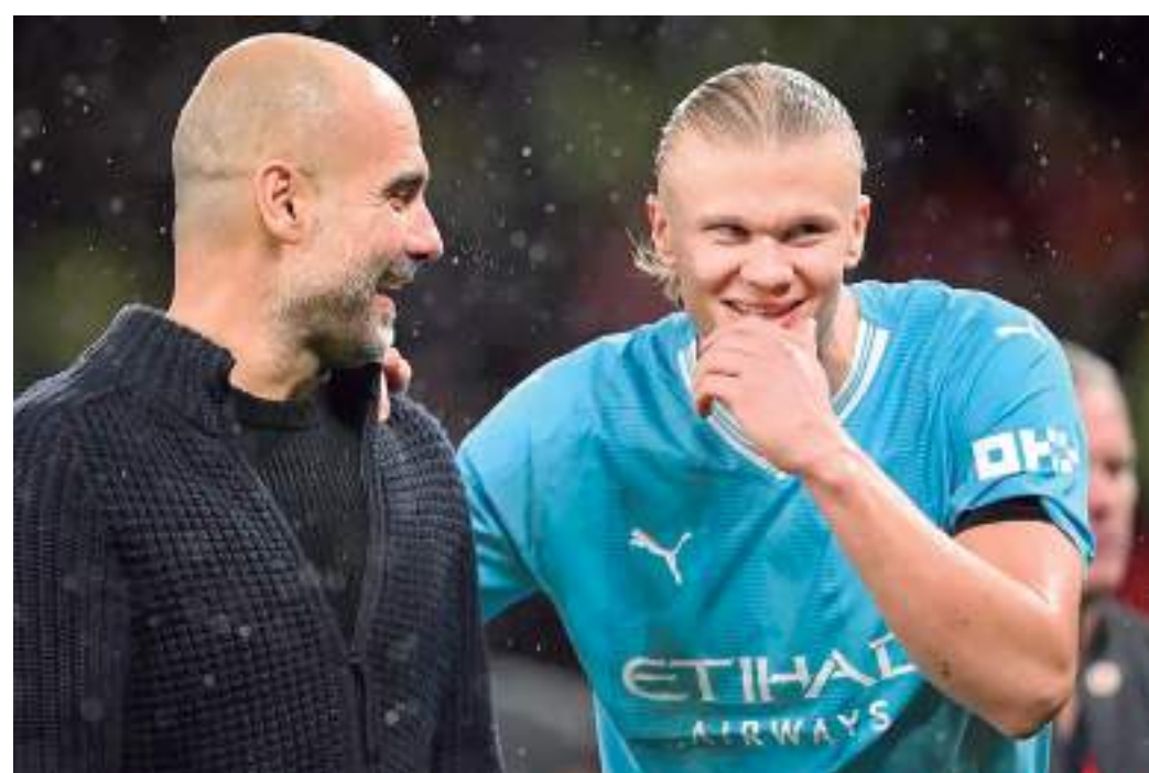
Manchester City de Guardiola e Haaland lidera ranking da IFFHS