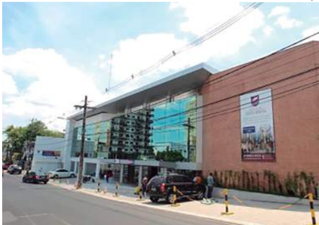
Faculdade Santa Teresa fica localizada no bairro Nossa Senhora das Graças

O município de Beruri está localizado na calha do Rio Purus, a 172 quilômetros de Manaus e tem, aproximadamente, 20,7 mil habitantes, de acordo com o Censo do IBGE 2022. Este ano, sob o