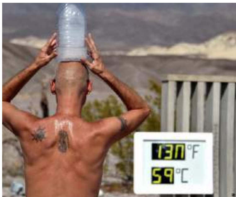
Secas mais comuns colocarão milhões de pessoas em risco de morrer de fome