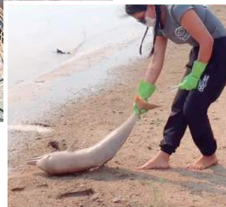
Boto encontrado morto em Coari durante a seca de 2023