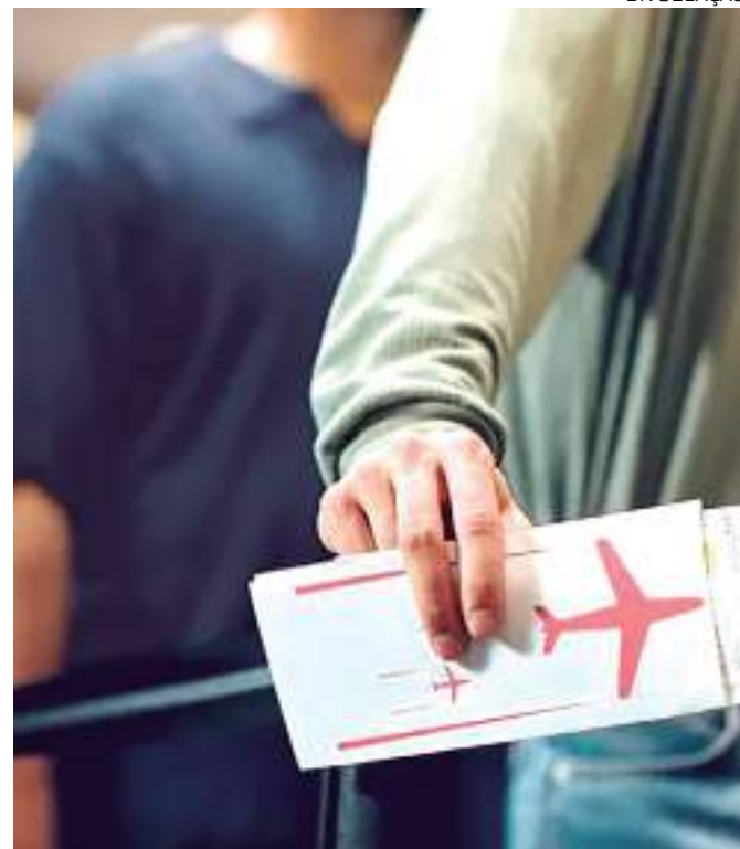
Passagens aéreas ficaram 23,70% mais caras em outubro

"É importante destacar que as associadas Abear aderiram ao Programa Voa Brasil e estão em linha com o objetivo do governo de ampliar a oferta de passagens aéreas com preços competitivos. A Abear compartilha com o Ministério de Portos e Aeroportos informações sobre o cenário do setor aéreo e a necessidade de enfrentamento dos custos das companhias aéreas. A queda do preço do combustível de aviação (QAV), a diminuição da judicialização no setor, a redução de tributos e o estímulo à concorrência são essenciais para democratizar ainda mais o acesso ao transporte aéreo."