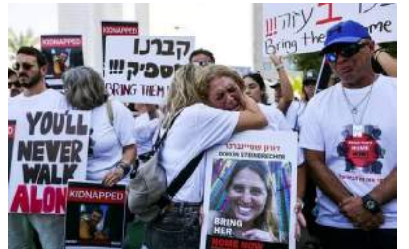
Protesto, em Tel Aviv, para pedir a libertação dos reféns israelenses