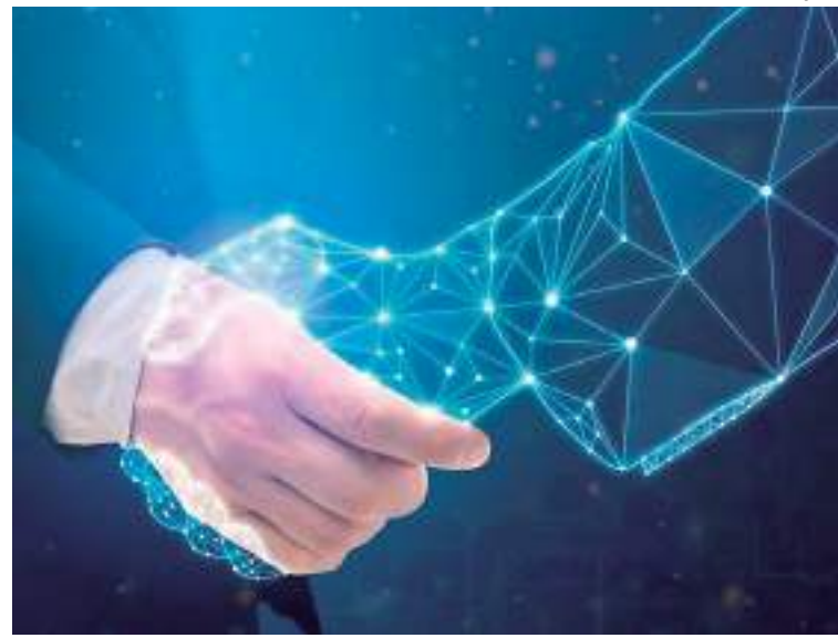
Ferramentas de IA devem ajudar as organizações a acelerar tarefas