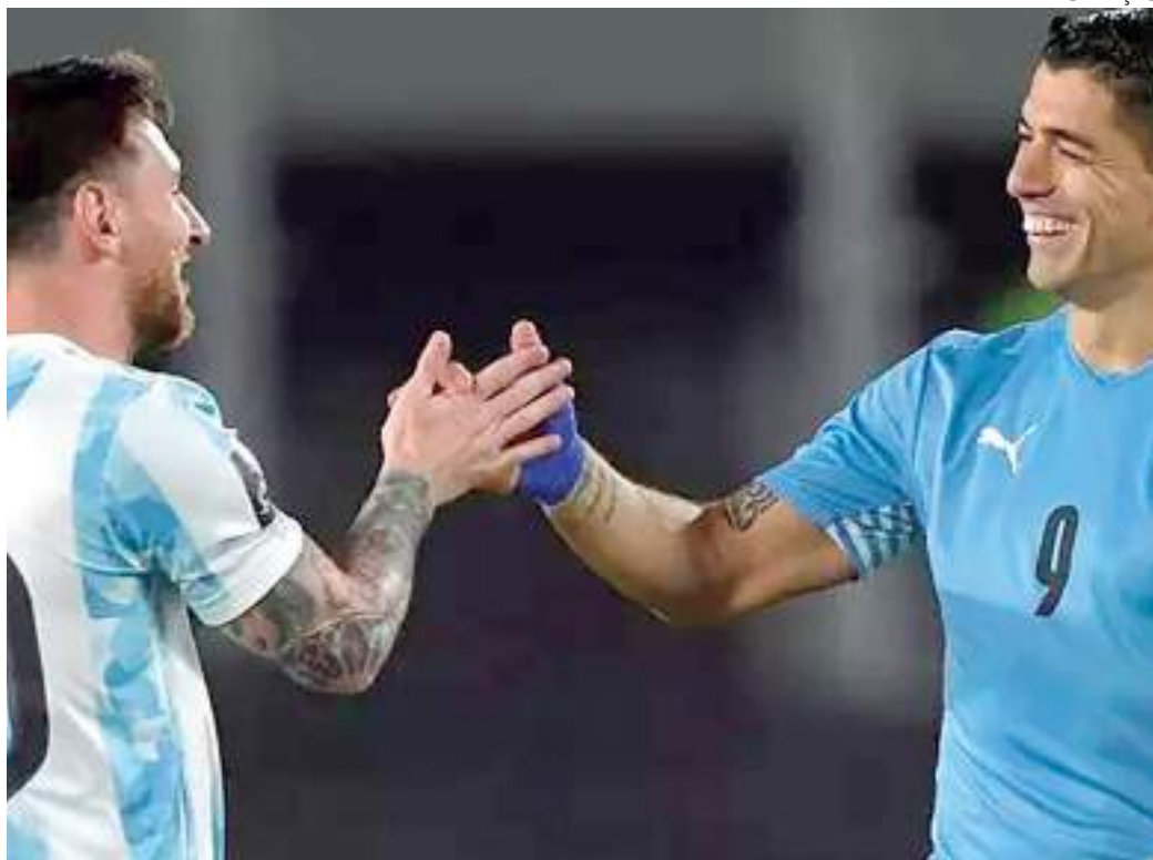
Messi e Suárez vão jogar clássico por suas seleções pelas Eliminatórias