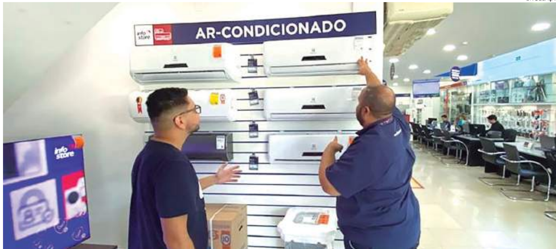
Info Store ampliou o estoque em mais de 50% para atender a demanda pelos produtos

Segundo Toríbio Rolon, presidente do departamento de comércio e distribuição da entidade, o ano deve terminar com a venda de 4 milhões de aparelhos. Se confirmado, a demanda indica forte