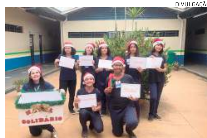
Alunos arrecadam alimentos que serão doados a famílias

Presente na décima competência da Base Nacional Comum Curricular (BNCC), "Responsabilidade e Cidadania", a atividade define habilidades e aprendizagens essenciais para a formação integral do estudante, no