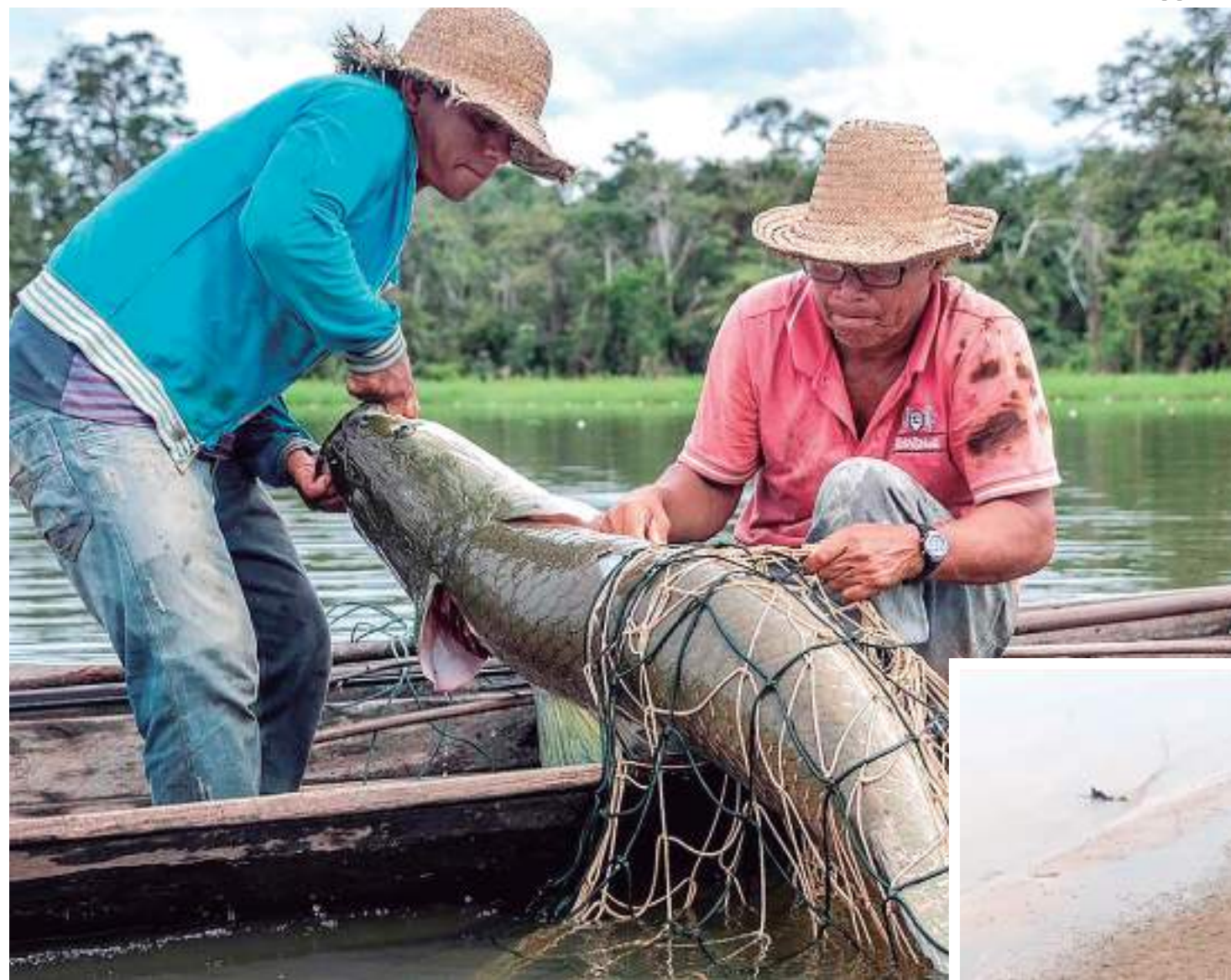
Pescadores poderão pescar o Pirarucu em áreas autorizadas até 20 de dezembro

“Por se tratarem de áreas das quais temos relatórios anuais com as contagens de populações de pirarucu ju-