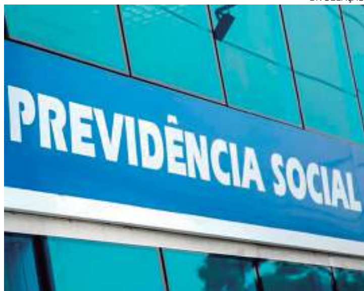
Lei resulta de medida provisória editada em julho

Para reduzir as filas, o programa prevê a retomada do bônus de produtividade aos funcionários que trabalharem além da jornada regular, tanto na análise de requerimentos