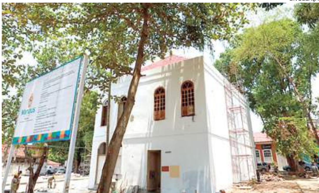
Programa de revitalização do centro histórico da capital já tem três obras em andamento

A prefeitura já tem o programa "Nosso Centro", lançado pelo prefeito David Almeida, em execução com recursos do Tesouro municipal. As primeiras obras –