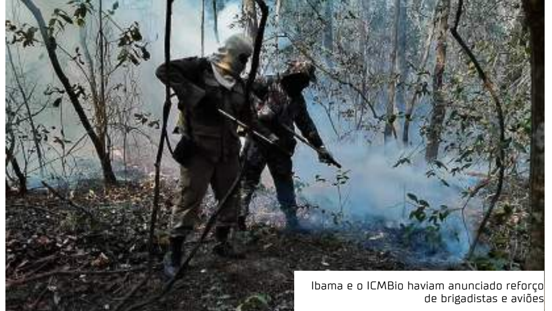
Ibama e o ICMBio haviam anunciado reforço de brigadistas e aviões

O plano resultou em ações de prevenção para evitar o eventual espalhamento do fogo, como as queimas prescritas. As atividades foram realizadas