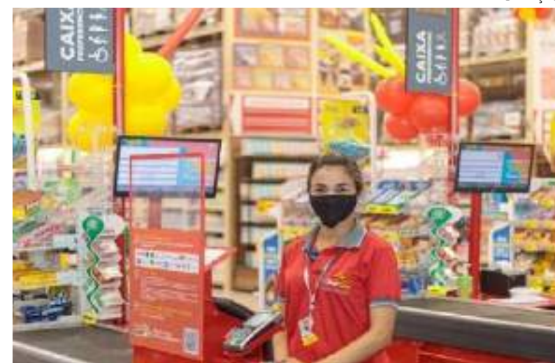
Super Nova Era com oportunidades em vários setores de atuação