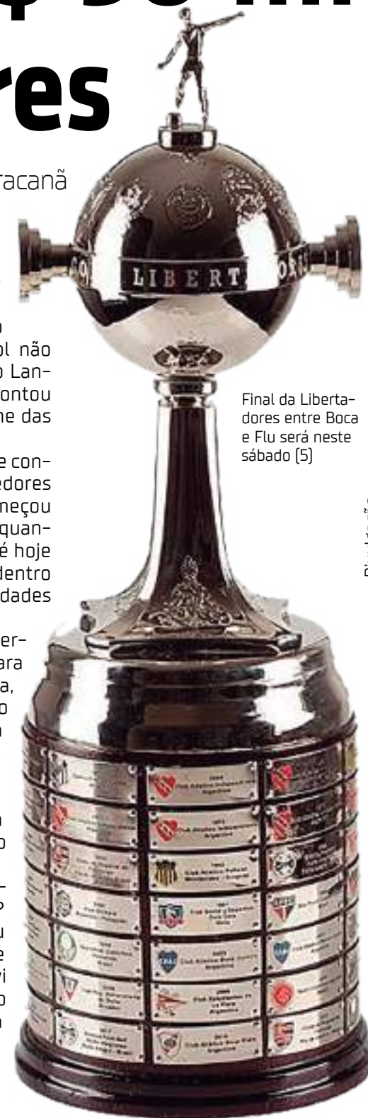
Final da Libertadores entre Boca e Flu será neste sábado (5)

"Em primeiro lugar, o coração tem que resistir, né? Isso é importante. Depois eu quero vitória, paz, alegria e aquela faixa linda que eu vi no Maracanã: 'Lutem até o fim'. Lutem com garra, força e amor ao nosso Fluminense, é isso que eu quero e peço. Com as bênçãos de João de Deus", disse.