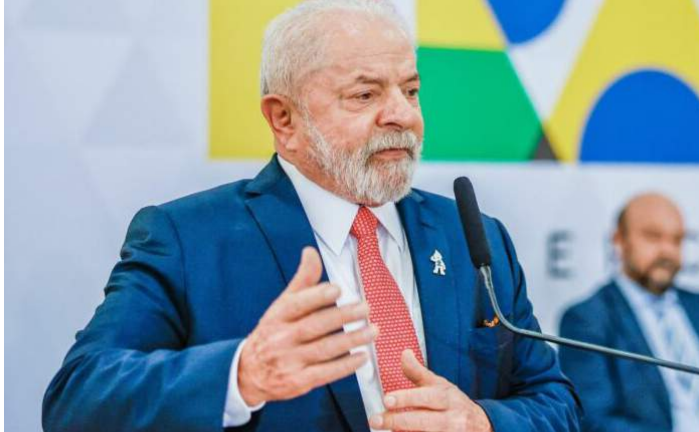
Nova Lei, oriunda do Projeto de Lei nº 4.172/2023, cria um arcabouço normativo para a retomada de obras e serviços

De acordo com a Presidência, na priorização de obras, serão observados critérios como percentual de execução, ano de contratação, se