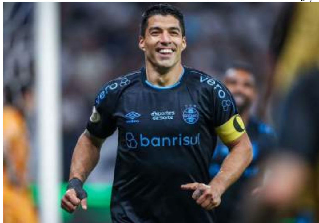
Luis Suárez tem compromisso com o Grêmio até o fim desta temporada