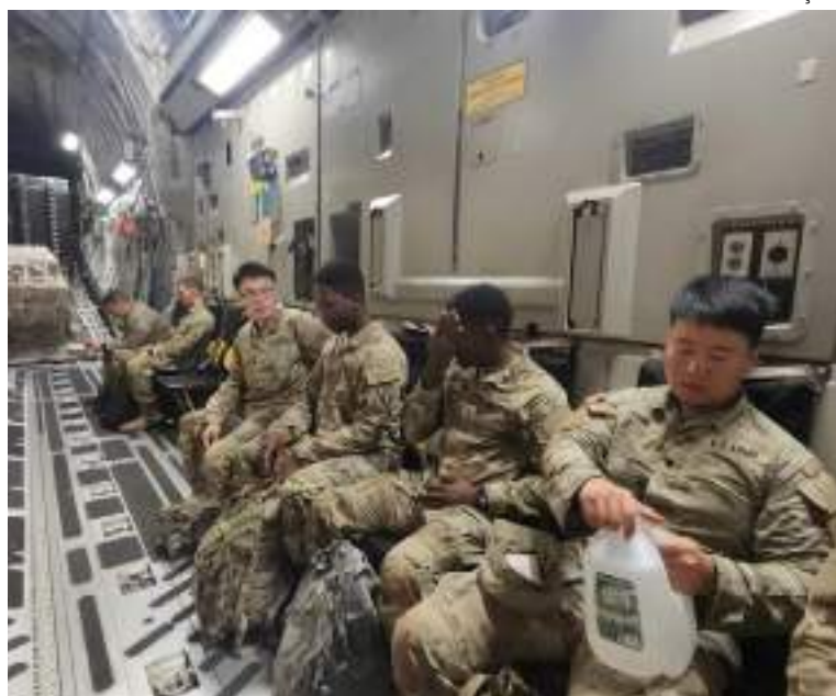
Militares dos Estados Unidos que estão em treinamento no Brasil