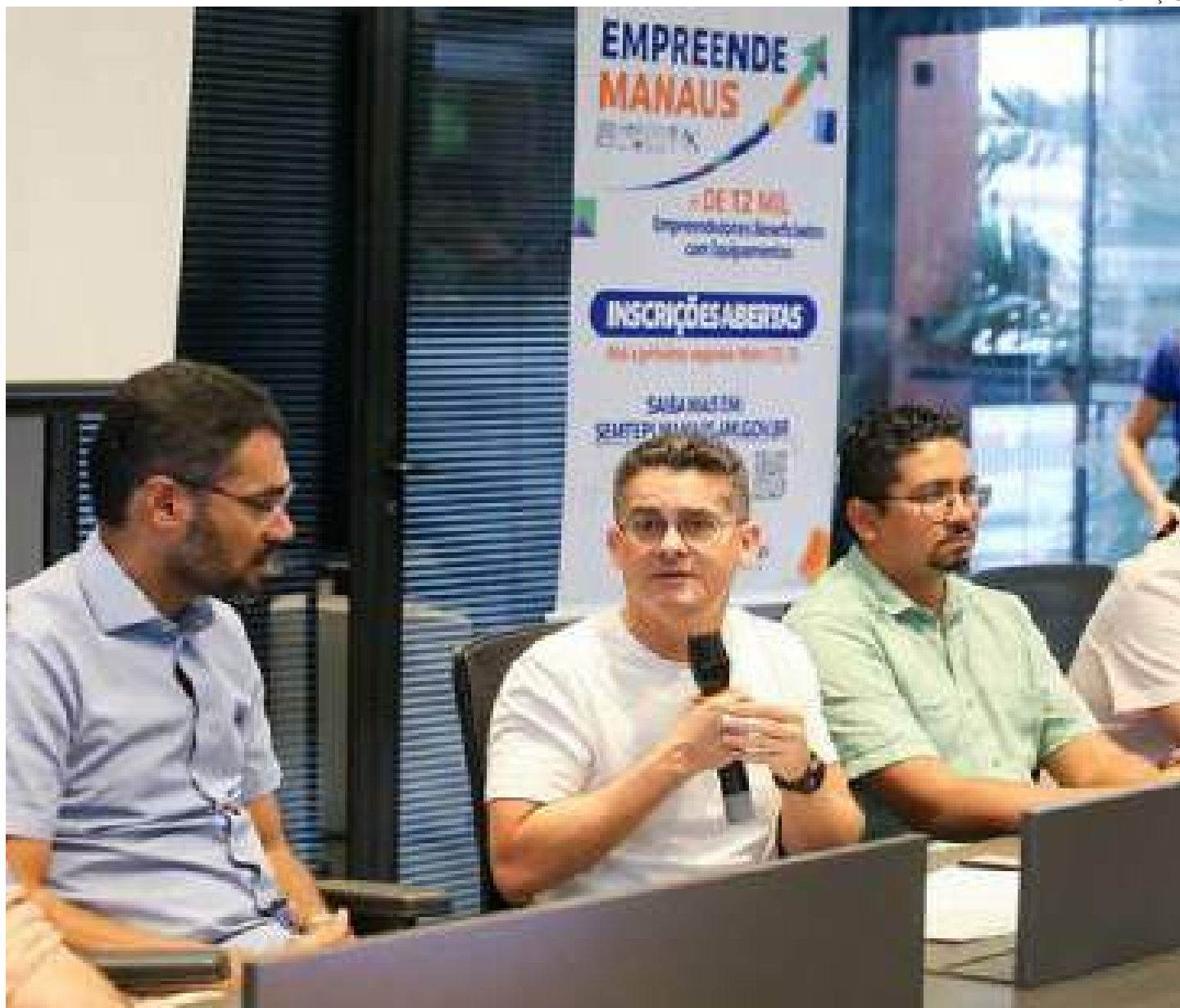
Prefeito David Almeida anunciou entrega de itens do 'Empreende Manaus'

"Esse é um programa inédito, lançado pelo prefeito David Almeida, que atende mais de 5 mil empreendedores de diversas áreas de Manaus. Nós vamos contemplar barbeiros, manicures, pipoqueiros, vendedores de churrasco, feirantes e muito mais, com itens que serão essenciais para o crescimento desses negócios. Todo o processo foi feito da