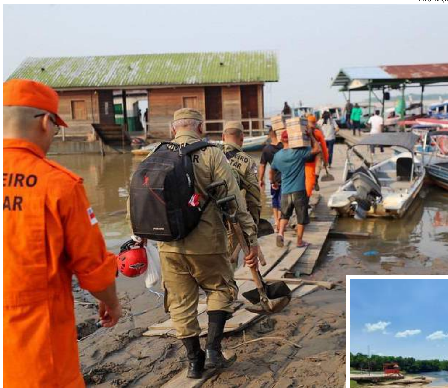
Boletim da Defesa Civil afirma que todas as cidades do AM entram em estado de emergência devido seca severa

Na capital Manaus, a seca do Rio Negro – a maior dos últimos 121 anos –, isolou comu-