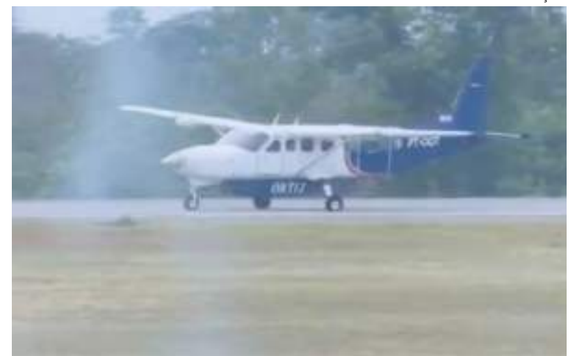
Vítimas de acidente aéreo ocorrido no Acre seriam transportadas no voo