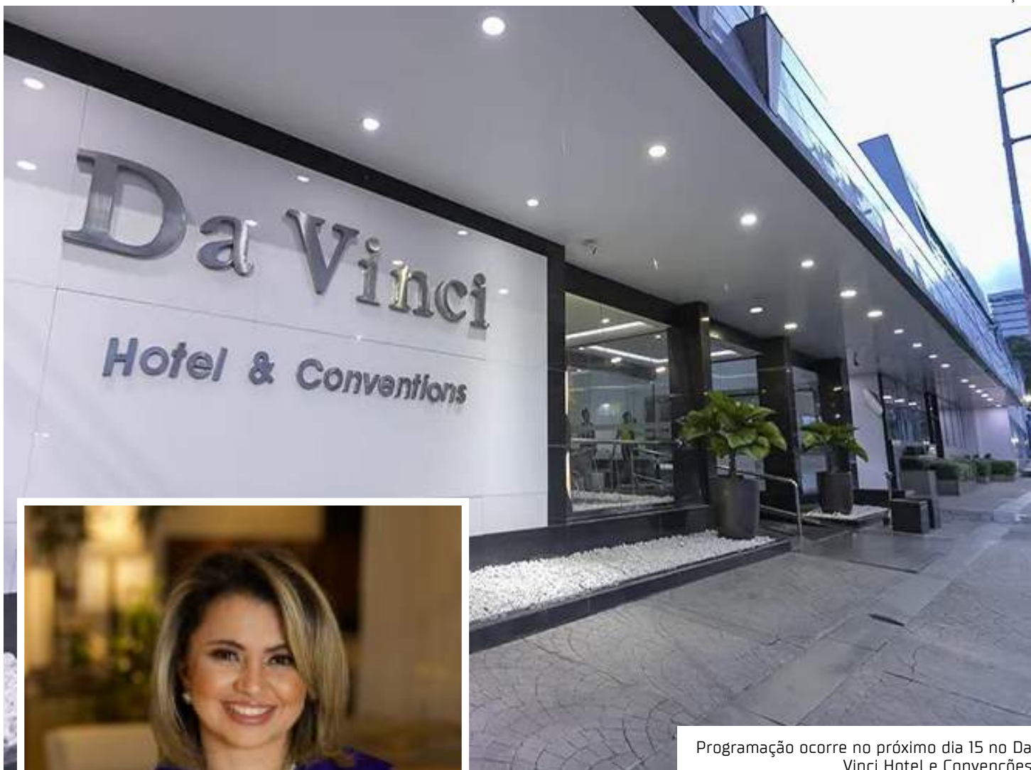
Programação ocorre no próximo dia 15 no Da Vinci Hotel e Convenções

Com valores diferenciados para estudante, profissional e premium, os ingressos podem ser adquiridos por meio de um formulário liberado no Instagram de Natasha (@dranashamayer) ou pelo