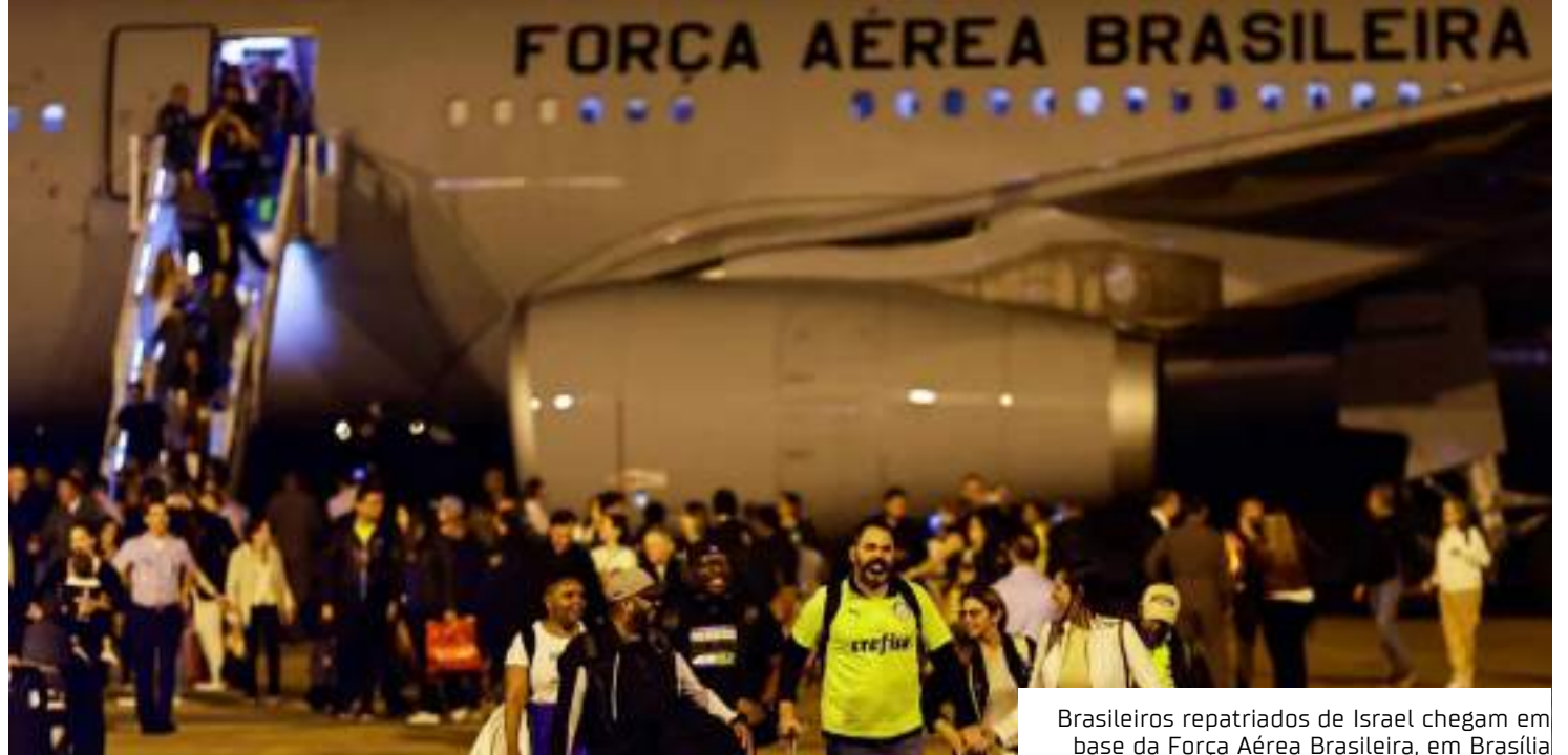
Brasileiros repatriados de Israel chegam em base da Força Aérea Brasileira, em Brasília

Desde o início do conflito Israel-Hamas em 7 de outubro, integrantes da diplomacia brasileira e o próprio presidente Luiz Inácio Lula da Silva (PT) vem mantendo contato com autoridades israelenses, egípcias e palestinas para buscar a evacuação dos brasileiros em Gaza. Em meio a muita expectativa pela abertura de Rafah, os primeiros estrangeiros que de fato irão percorrer a rota de fuga são da Austrália, da Áustria, da Bulgária, da Finlândia, da Indonésia, da Jordânia, do Japão e da República Tcheca.