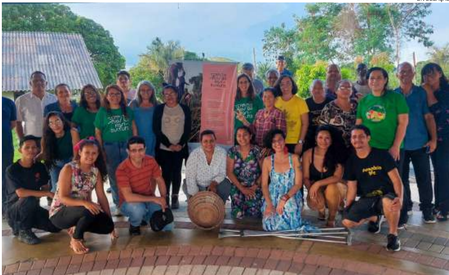
Projeto movimenta área agrícola de Manaus pela produção e comercialização de alimentos saudáveis

“Percorremos todo um caminho plural de cooperação, desde o diagnóstico e a evidência das problemáticas, até a clareza sobre as possibilidades de atuação do grupo. Fica claro que problemas complexos só podem