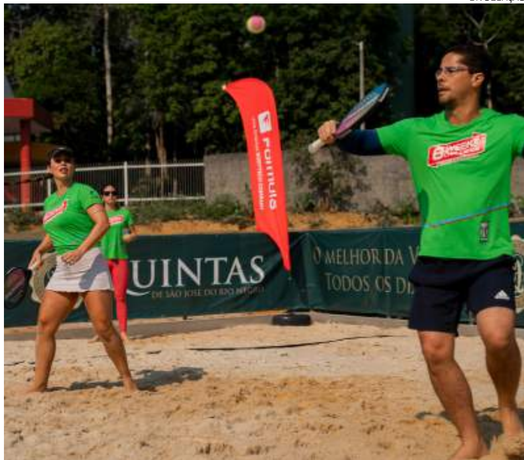
Competição chega à sua penúltima etapa neste fim de semana

O Desafio 6 Weeks Challenge, promovido pela Fórmula Academia e CrossFit Ponta Negra, chega à sua penúltima etapa neste domingo (5), com o Running Day. A largada será às 7h, no Quintas de São José do Rio Negro, na avenida do Cetur, 3020, Tarumã. A corrida tem percurso de 5 quilômetros.