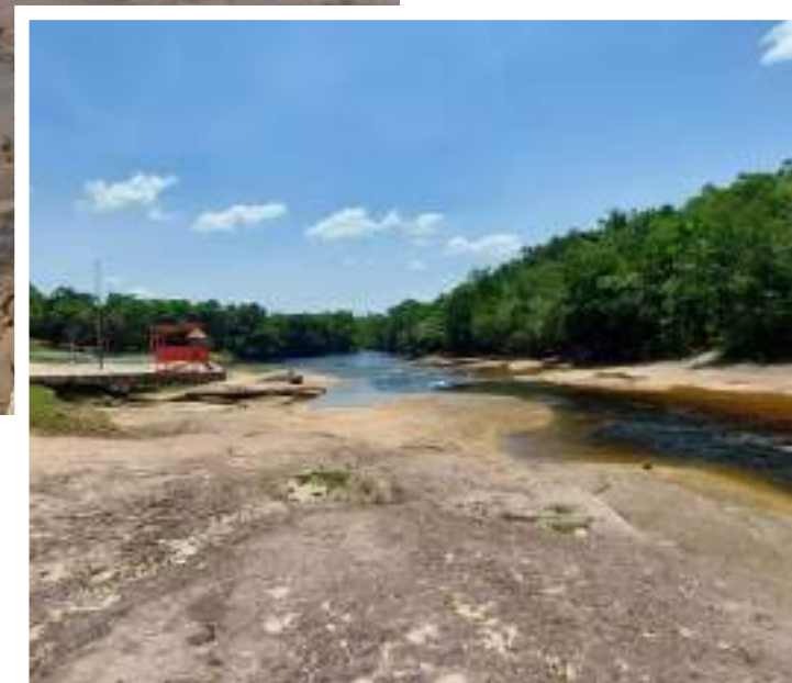
Corredeira do Urubuí em Presidente Figueiredo durante a seca

Com o fenômeno, São Gabriel da Cachoeira, no Alto Rio Negro, sofreu racionamento de energia e desabastecimento. Já outros municípios enfrentaram o fenômeno das terras caídas. Em Beruri, uma vila "sumiu" do mapa após a queda de um barranco arrastar cerca de 40 casas para dentro do rio. Duas pessoas morreram e três seguem desaparecidas.