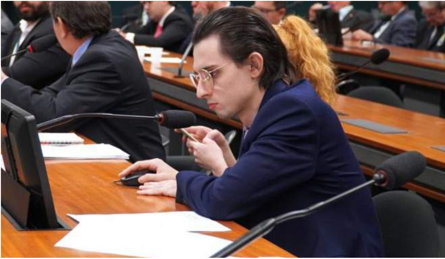
Alteração proposta por Mandel dá às prefeituras municipais de todo o território brasileiro a prerrogativa para a remoção de medidores aéreos

No texto final, a alteração proposta por Mandel dá às prefeituras municipais de