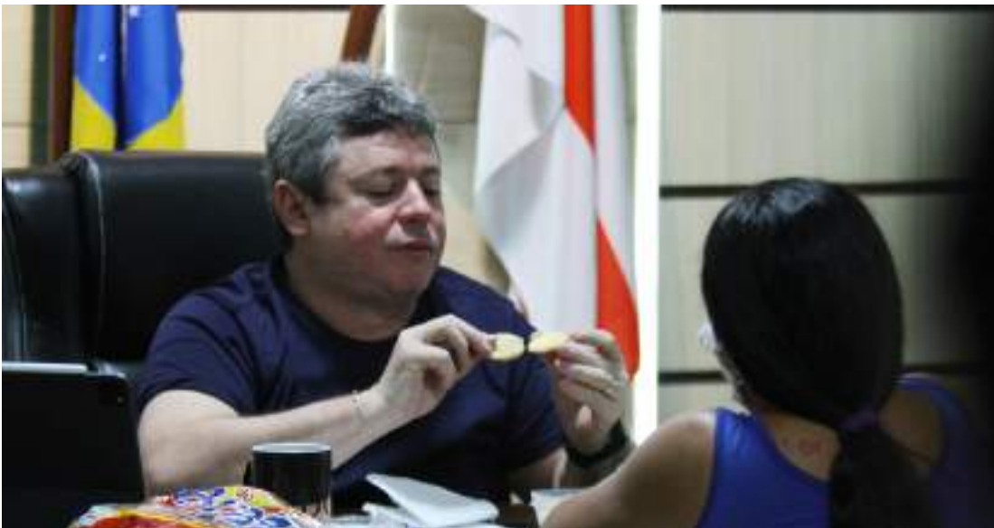
Fundo de Educação repassou R$ 1,1 milhão para o município, em 2012