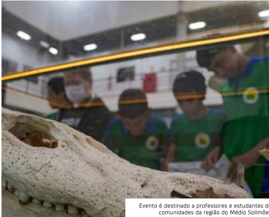
Evento é destinado a professores e estudantes de comunidades da região do Médio Solimões

De acordo com a coordenadora, os artefatos contam uma parte da história do Médio Solimões. O acervo inclui itens que vão de elementos