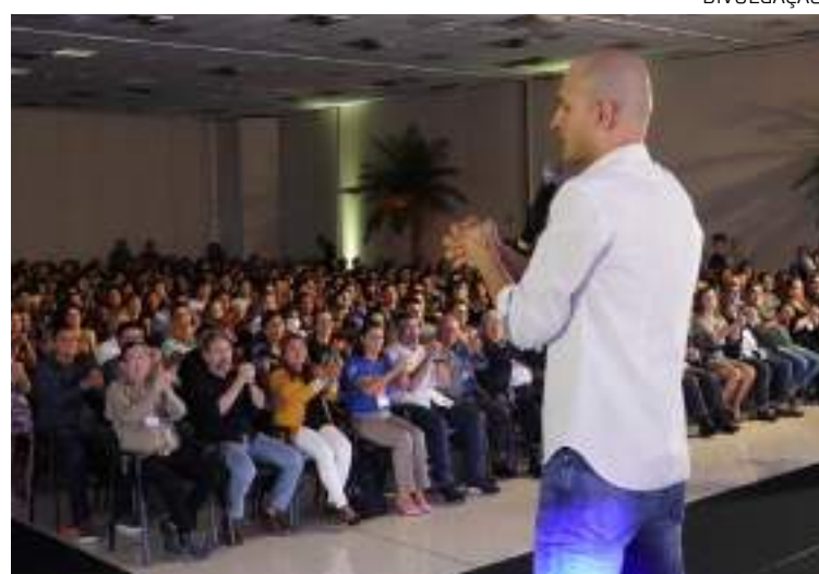
Evento deste ano chega ao seu 4º ano e está consolidado no Amazonas