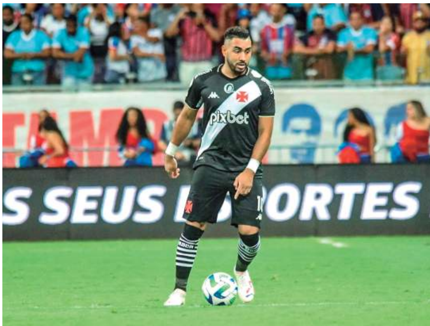
Payet pode ser uma opção no ataque no lugar de Vegetti, suspenso por levar terceiro cartão amarelo

Assim como o Cuiabá, o Vasco, que realizou a preparação para a partida em Goiânia (sede da última partida), também tem um desfalque importante para o duelo desta quinta-feira. Afinal, Vegetti, homem-gol vascaína, foi expulso na última rodada e cumpre suspensão nesta. Assim, a tendência é que o técnico