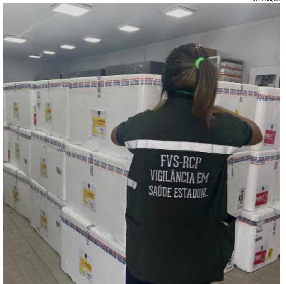
Imunizante é destinado à campanha contra influenza, que inicia no dia 13

Avacinação segue até dia 12 de dezembro. A partir deste ano, a Campanha de Vacinação contra Influenza no Amazonas passa a ser realizada no 2º semestre, em novembro, atendendo o período sazonal de infecções por influenza que estão associados aos períodos de maior umidade.