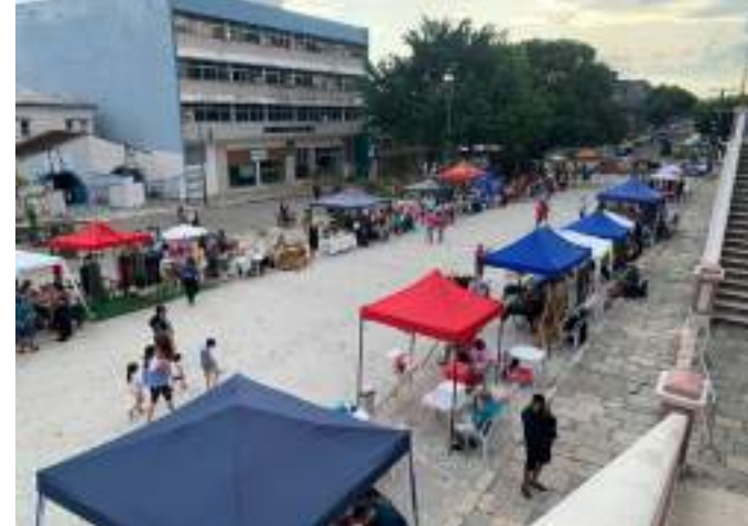
Feira da FAS ocorrerá na Rua Costa Azevedo, bairro Centro

A concepção temática do festival é baseada nos 17 Objetivos de Desenvolvimento Sustentável (ODS) definidos pela Organização das Nações Unidas (ONU). Além de Manaus, a mobilização ocorre em São Paulo, Salvador, Porto Alegre,