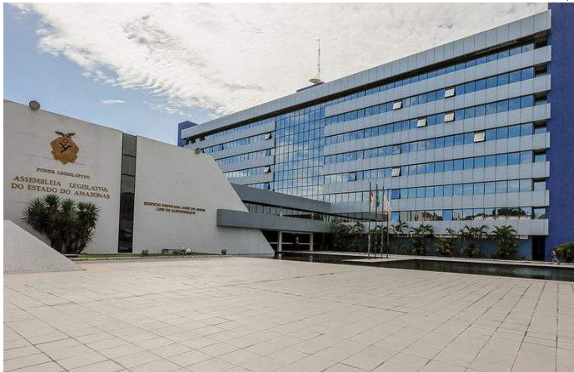
Entre as ações previstas, está a ampliação do alcance do "Programa Água Boa", no interior do Amazonas