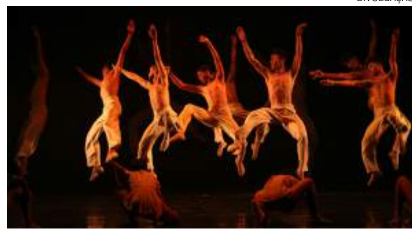
Espectáculos gratuitos incluem dança, teatro e música para todas as idades