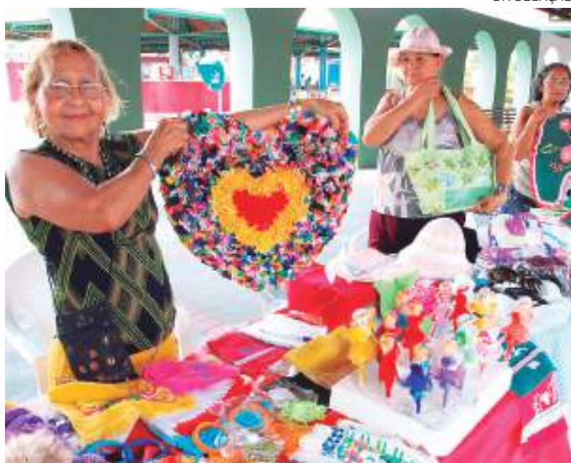
Produtos natalinos foram confeccionados por idosos

O Parque Municipal do Idoso disponibiliza três turmas do curso de Artesanato. As aulas acontecem em dois horários: de segunda a quinta-feira, das 8h às 10h30; e segunda e quarta-feira, das 13h às 15h. Cerca de cem alunas participam das aulas de artesanato.