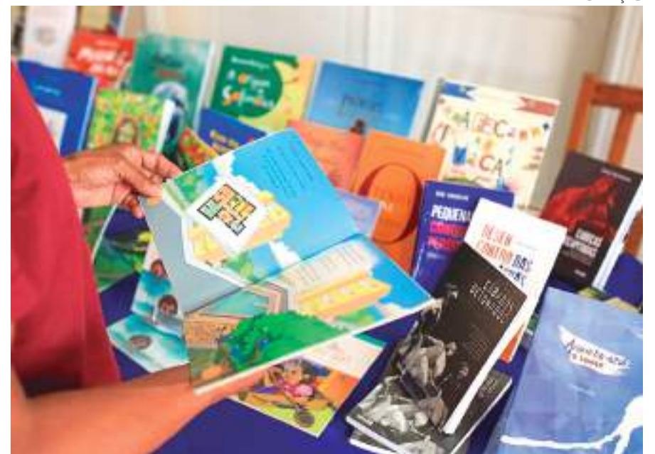
Atividades culturais ocorrerão no teatro Gebes Medeiros