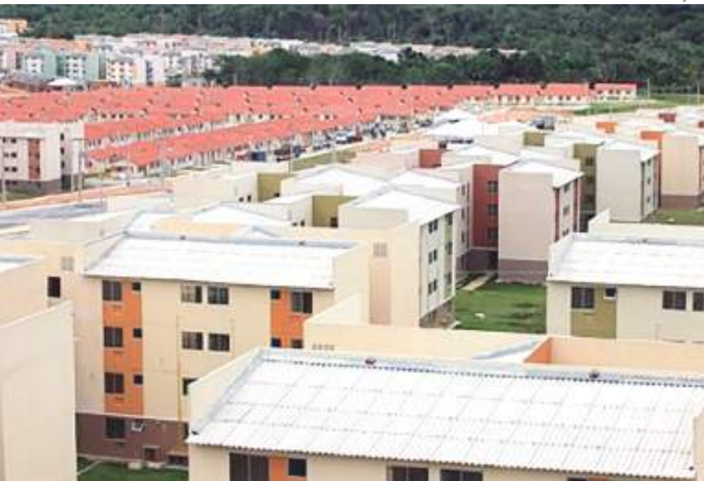
Populações em vulnerabilidade social terão direito à prioridade de acesso ao programa