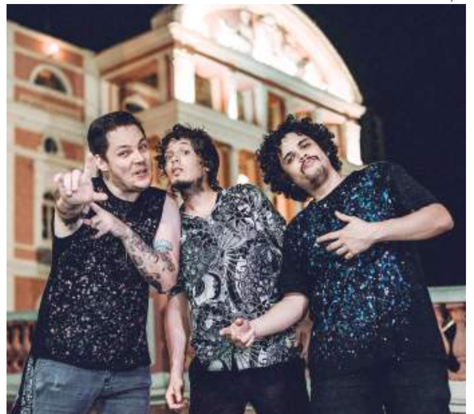
Criada em 2013, O Tronxo é um projeto de música instrumental

Com o lançamento do novo single, os fãs podem esperar uma riqueza de experimentações musicais que caracterizam a identidade única da banda.