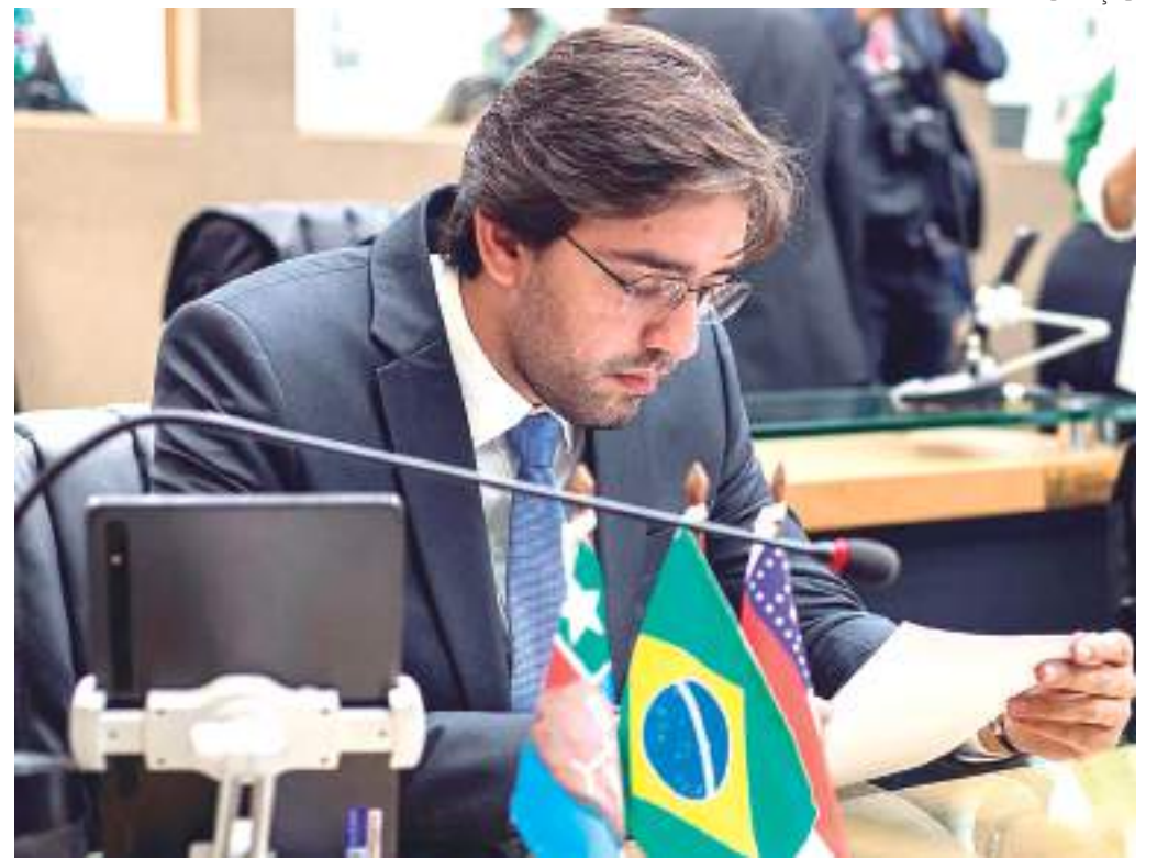
Deputado apresentou o projeto atenderá às mulheres amparadas por medida protetiva