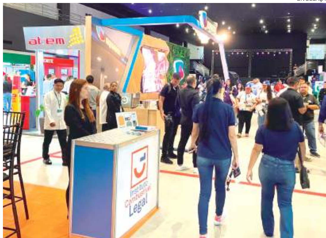
Segmento gera 20 mil empregos diretos na região Norte

Durante dois dias, o evento reuniu mais de duas mil pessoas e foi direcionado exclusivamente para revendedores de combustíveis, proprietários de lojas de conveniência, além de representantes de setores que tenham sinergia