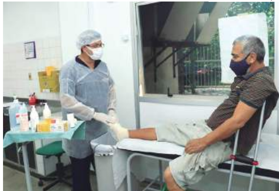
Objetivo é reduzir hospitalizações oferecendo assistência especializada

Após o controle e cura da lesão, os pacientes podem receber acompanhamento para reduzir as chances de recidiva (retorno das lesões tratadas) no Ambulatório de Egressos, que realizou 2.904 atendimentos nos primeiros seis meses de 2023.