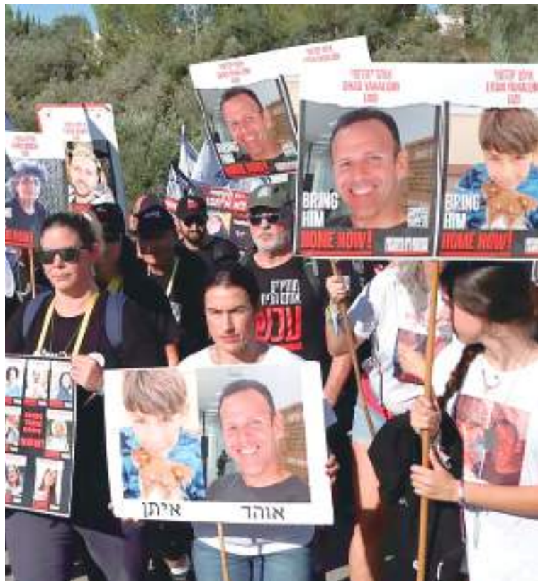
Israelense pedem libertação de todos reféns de guerra