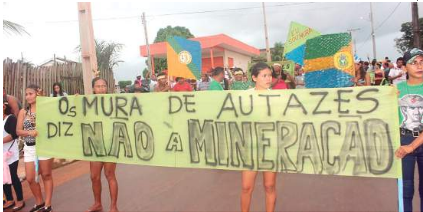
Projeto de exploração do potássio gera divergências entre indígenas

"O MPI é contra o processo de coação, manipulação,