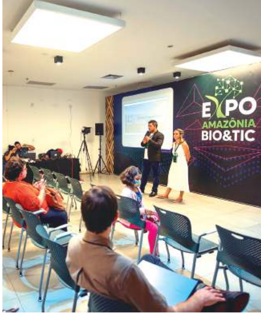
Debates ocorrerão sobre temas de grande importância à região amazônica