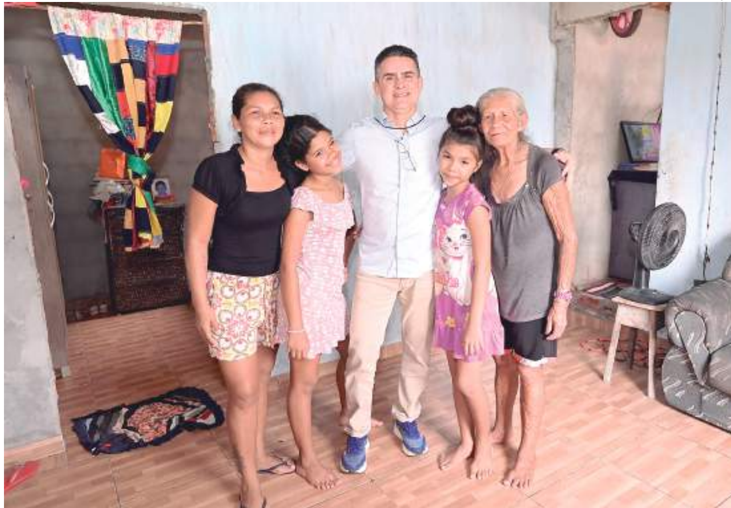
Prefeito David Almeida realizou uma vistoria técnica no bairro Colônia Antônio Aleixo

Segundo o chefe do Executivo municipal, 1,2 mil famílias serão contempladas na primeira etapa do programa, coordenado por meio da Secretaria Municipal de Habitação e Assuntos Fundiários (Semhaf). "Estamos lançando o