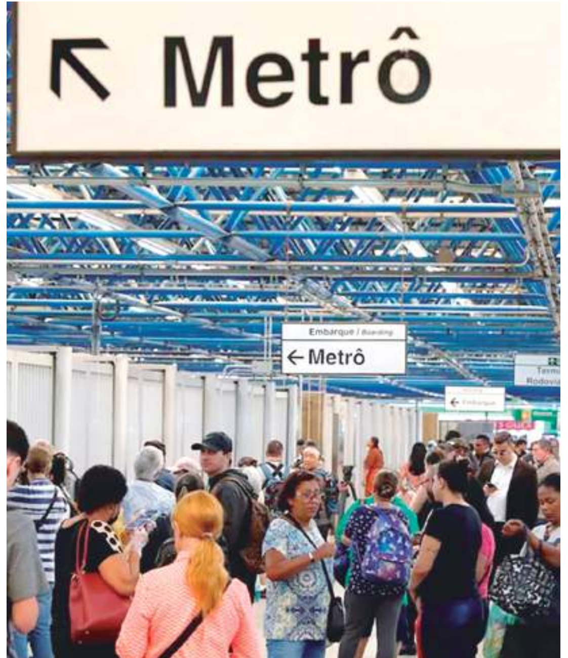
Greve Unificada promete paralisar trens, metrô e escolas em São Paulo

Durante agenda nesta manhã, o prefeito Ricardo Nunes (MDB) disse que comunicou os atos ao delegado geral e pediu que a polícia tome providências. Ele classificou os bloqueios como um ato criminoso.