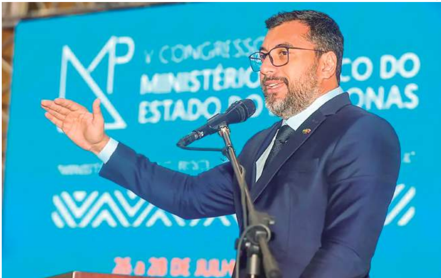
Governador do Amazonas, Wilson Lima, fez o pedido do empréstimo no dia 13 de novembro

No documento, publicado no Sistema de Apoio ao Processo Legislativo (SAPL) da Aleam, o mandatário destaca que, para manter programas de desenvolvimento nos últimos anos, o Estado contratou diversas operações de crédito, mas o estoque da