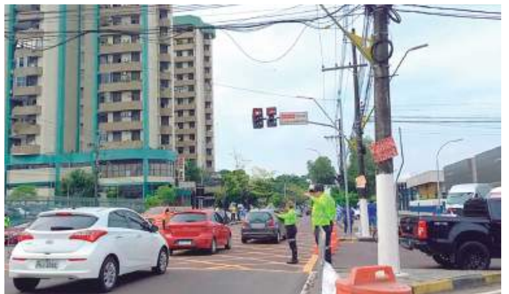
Corrida do Fogo ocorrerá no domingo (26), das 5h às 8h