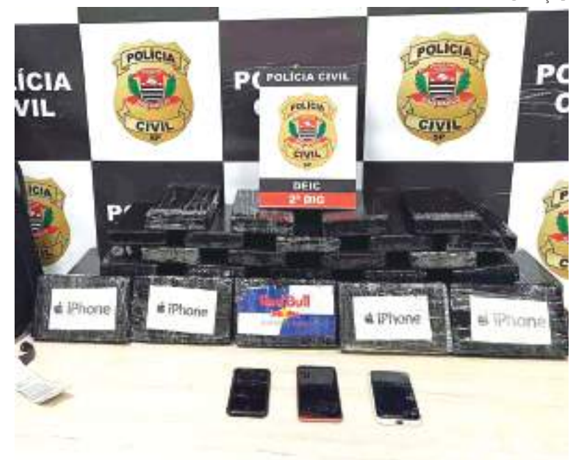
Denúncia ajudou a polícia a identificar e prender grupo criminoso