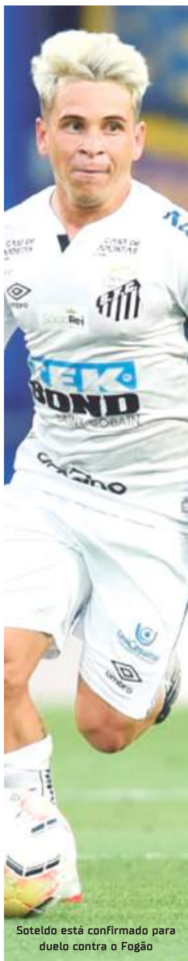
Soteldo está confirmado para duelo contra o Fogão

Santos e Botafogo fazem o clássico dos opostos do fim de semana no Brasileirão