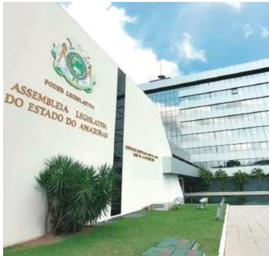
Aleam deve votar o pedido de empréstimo na próxima semana

É sabido que, devido às peculiaridades de nosso Estado, há uma grande concentração da riqueza na capital, Manaus, decorrente do modelo econômico do Polo Industrial de Manaus. Tal circunstância, aliada à intensa pressão de desmatamento ilegal e queimadas nos municípios da região Sul do Estado, demandam a constante busca de desenvolvimento de novas matrizes econômicas, voltadas, sobretudo, à biotecnologia e serviços ambientais, alinhadas às diretrizes de preservação e sustentabilidade ambiental.