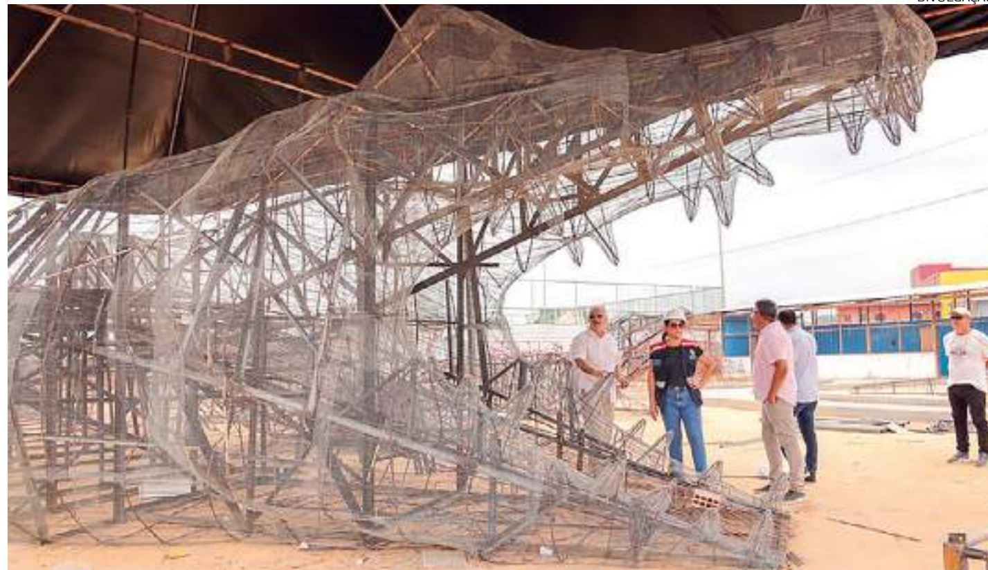
Este será o primeiro parque temático com esculturas de grandes dimensões relativas à natureza amazônica

"Todos os serviços de terraplenagem, drenagem, nivelamento