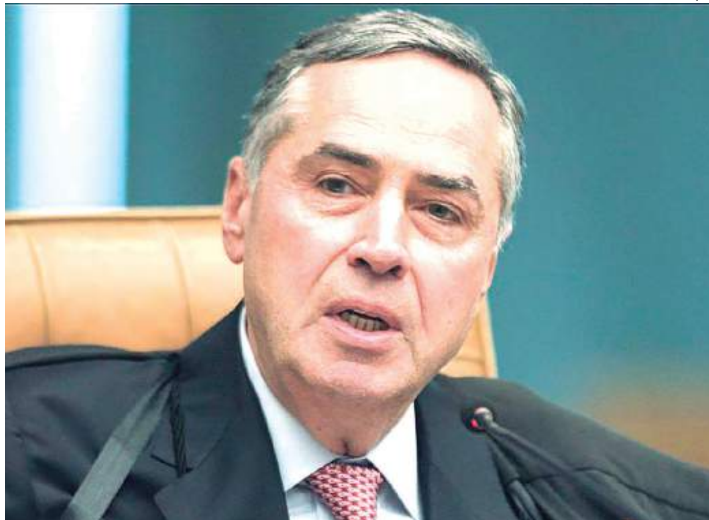
Presidente do STF afirmou que a PEC representa atraso para solução de problemáticas no país

A PEC define que as chamadas decisões monocráticas não podem suspender a eficácia de uma lei ou nor-