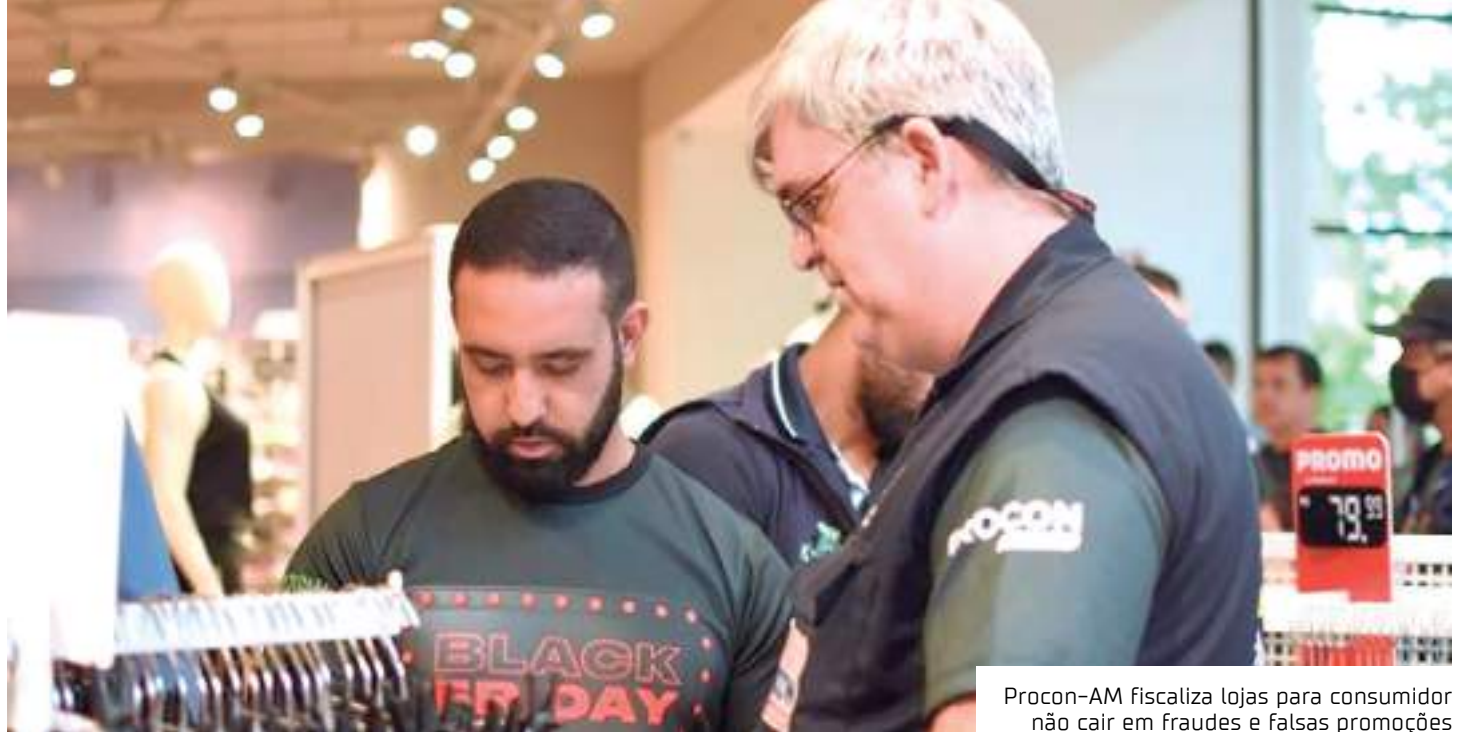
Procon-AM fiscaliza lojas para consumidor não cair em fraudes e falsas promoções

Fraxe explica ainda que essa prática é comum no comércio e precisa de atenção do consumidor: "Por exemplo, a loja tem na vitrine ou no site a ideia de