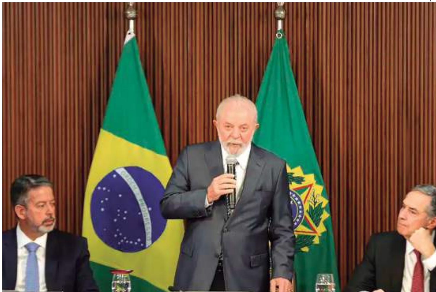
A presidência brasileira no bloco inicia-se em 1º de dezembro deste ano e segue até 30 de novembro de 2024

“Todo mundo vai ter muita tarefa, mas é importante vocês não esquecerem que vocês foram eleitos, indicados ministros para governar