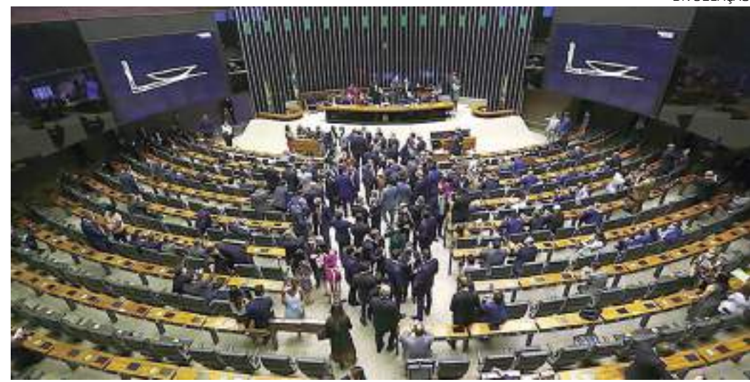
Deputados amazonenses comemoraram prorrogação dos benefícios

Os deputados rejeitaram emenda do Senado que estendia o benefício a empresas situadas no Centro-Oeste, área de abrangência da Superintendência de Desenvolvimento do Centro-Oeste (Sudeco). Esse benefício para empresas nas áreas da Sudam e da Sudene existe desde 2000 e sua