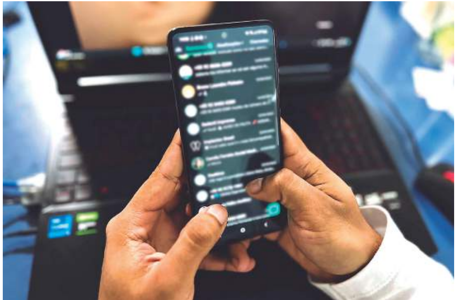
No print das conversas, é possível ver como os suspeitos são bem articulados e chegam a mandar documento falsificados

“Eles encaminham essas mensagens automáticas informando que o processo está para expedição de