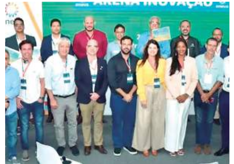
Empresa participa de Feira Nacional de Petróleo e Gás no Rio Grande do Norte