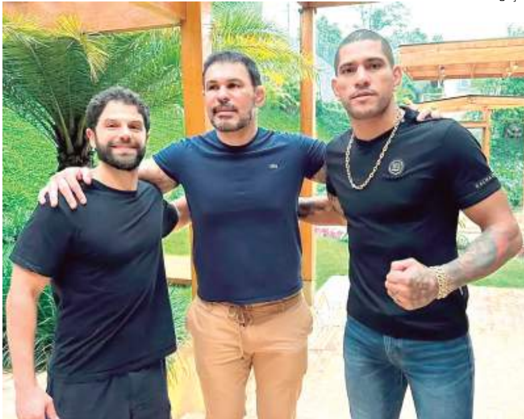
Poatan posa ao lado de lutadores renomados do UFC

Por meio das suas redes sociais, o lutador tcheco afirmou que estaria interessado em medir forças contra Chimaev na divisão dos meio-pesados após o atleta da Chechênia desafiar Alex Poatan para um confronto justamente na categoria até 93kg: "Eu adoraria te recepcionar nos meio-pesados", escre-