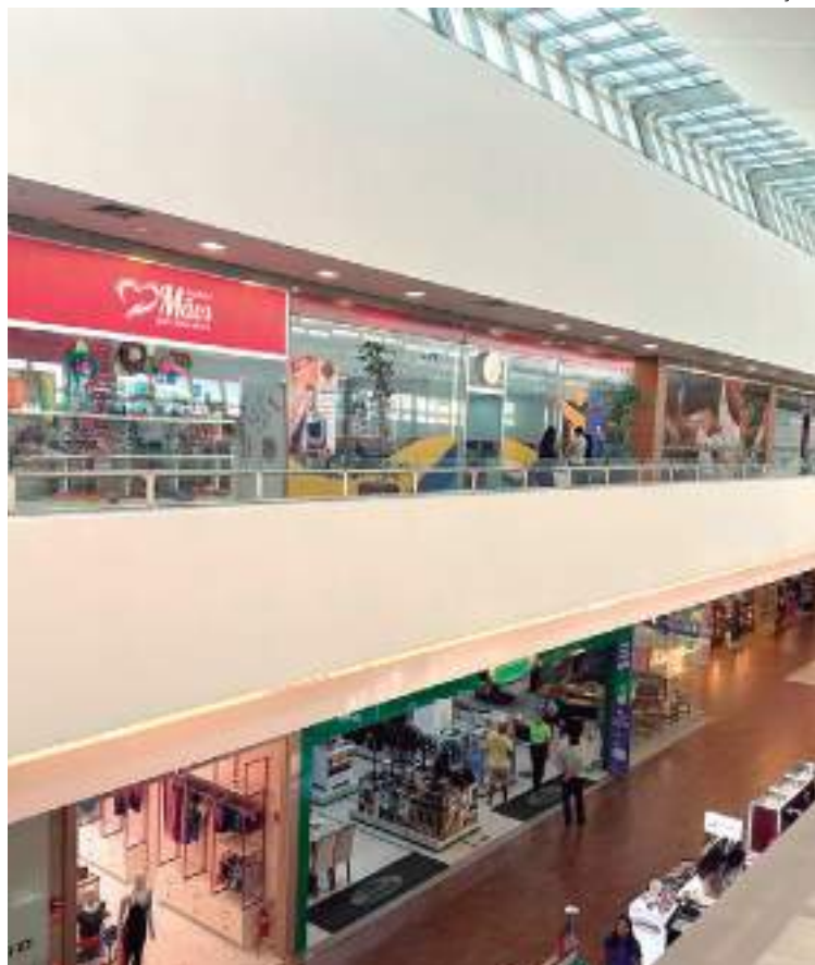
Campanha começa quando as lojas âncoras abrem suas portas