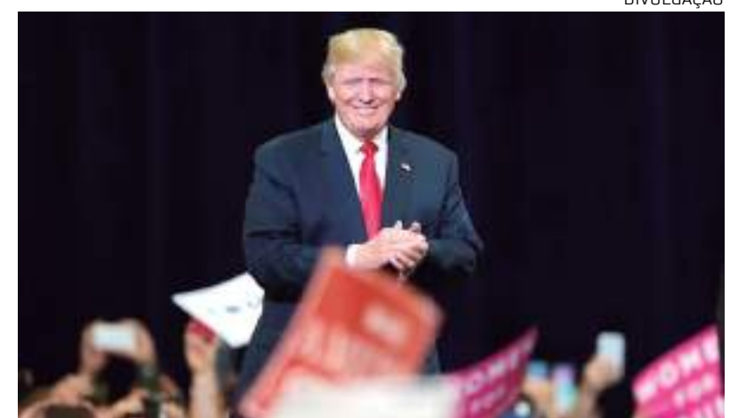
Donald Trump deve se reunir com o novo governante argentino