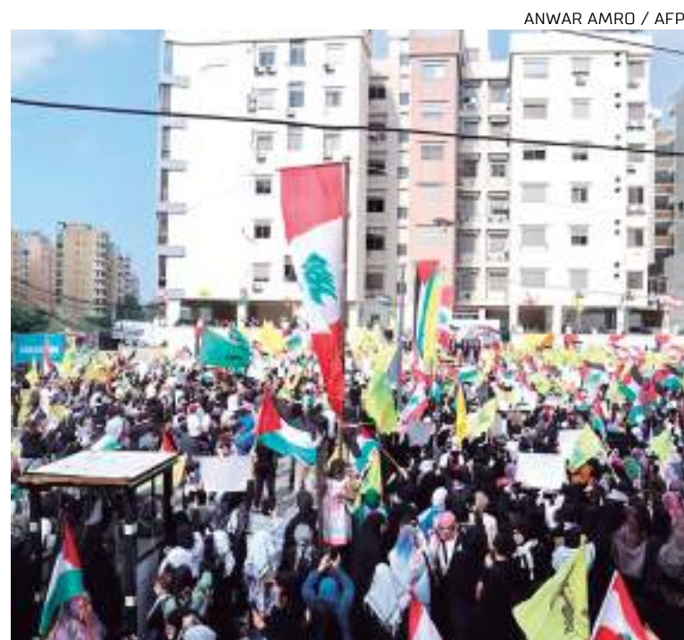
Apoiadores do Hezbollah em protesto a favor da Palestina

O grupo islamista afirma que cerca de 15 mil pessoas, a maioria civis, morreram na ofensiva israelense.