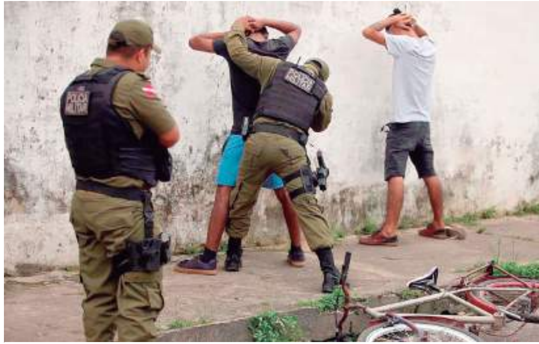
Pessoas negras correm mais risco de serem presas durante patrulhamento

No entanto, ela afirma que o que se tem visto hoje é que as ações policiais estão ligadas ao uso de patrulhamento ostensivo, que é baseado na leitura dos policiais do que é ou não