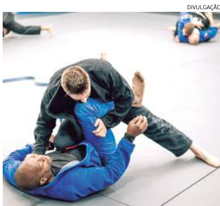
Primeira Copa Sesc de Jiu-Jitsu está com inscrições abertas