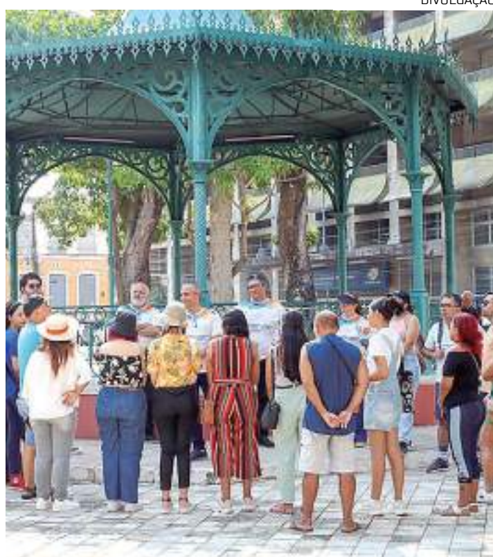
Um grupo de 50 pessoas fará a visita ao centro histórico