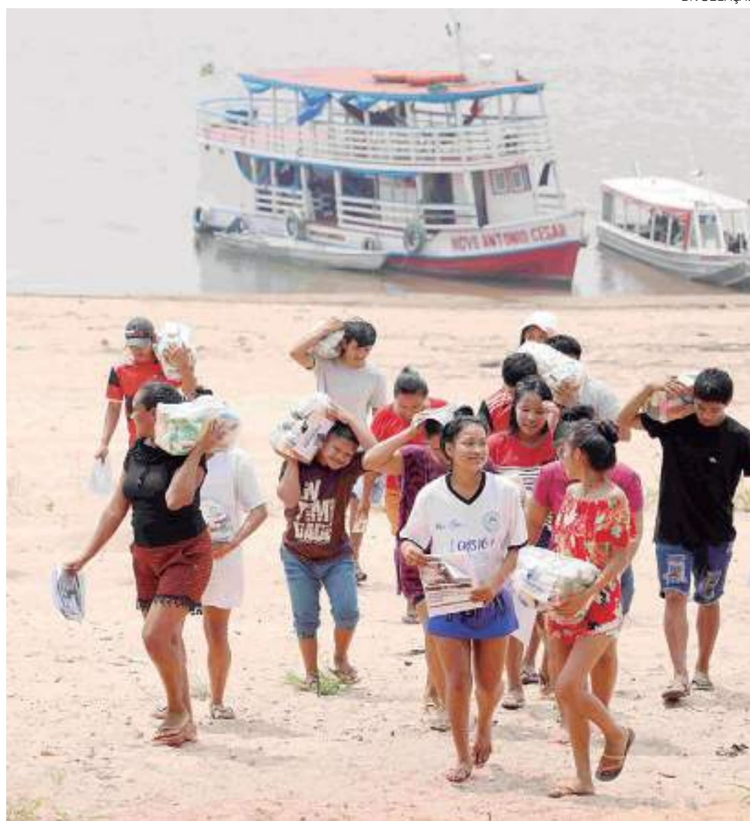
Com a seca histórica deste ano, as aulas passaram a ser à distância e a entrega da merenda escolar a ser feita em casa