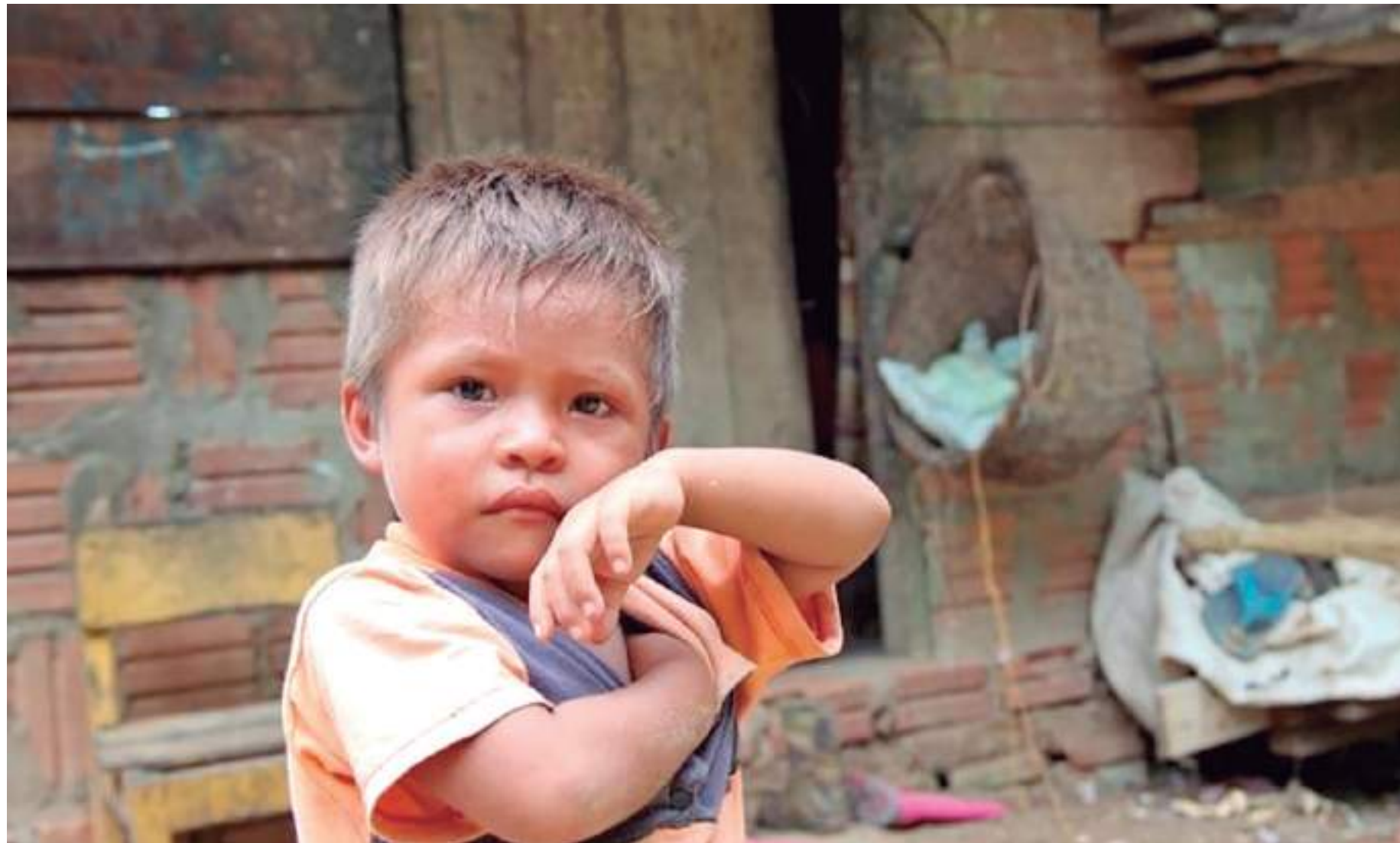
Brasil tem poucos investimentos que venham a melhorar a qualidade de vida da população

“Quando nós pensamos na aplicação desses recursos em investimentos que venham a melhorar a qualidade de vida da população como um todo, a gente vê realmente muito pouco com relação a isso. Nós temos corte em educação, corte... cortes em muito do que é principal e essencial para melhorar a qualidade de vida da nossa população”, destaca o presidente do Instituto Brasileiro de