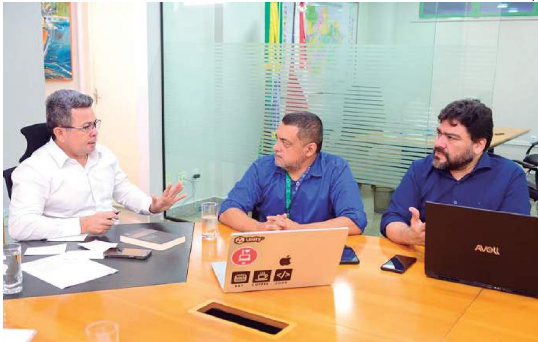
Para o vice-governador, a iniciativa é promissora e pode fortalecer a Zona Franca de Manaus (ZFM)

Fundamentado na Lei de Inovação Tecnológica, o Parque Tecnológico da UEA foi idealizado para acelerar os negócios de Ciência, Tecnologia e Inovação (CT&I), com enfoque nos segmentos de jogos eletrônicos e semicondutores (matéria-prima de chips). Na prática, a ideia é que o novo espaço abrigue incubadoras, crie novas em-