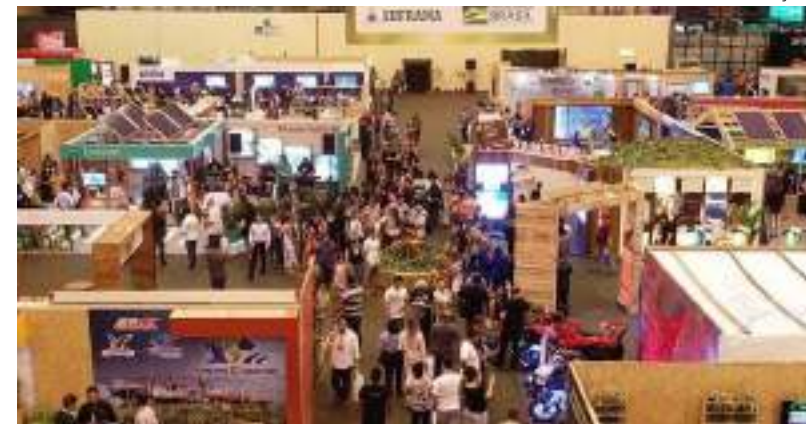
Debates na feira sobre o modelo industrial prometem aumentar a competitividade