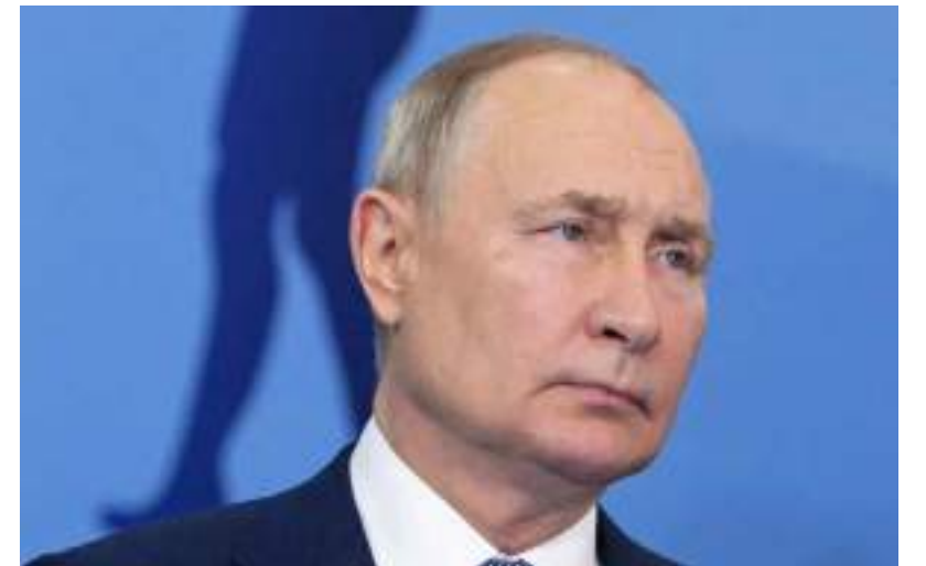
Presidente russo fez várias aparições públicas nos últimos meses