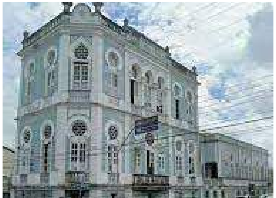
Palacete 5 de Setembro também será revitalizado

O projeto tem previsão de 4 anos de execução e terá um investimento inicial de R$ 50 milhão