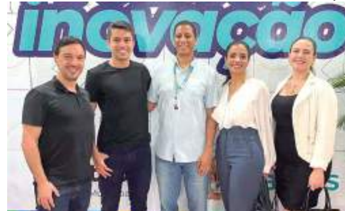
Netshow.me tornou-se a primeira startup beneficiada pelo Proinfe

"Temos buscado atuar constantemente junto a parceiros públicos e privados para estimularmos um ambiente de negócios cada vez mais seguro e atrativo para empresas de base tecnológica. A concessão