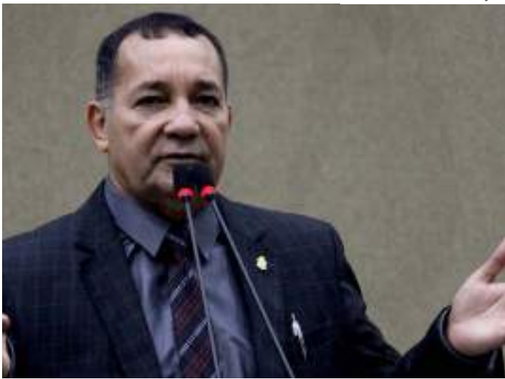
Motivação teria sido comentário sobre “Arraial do CSU”

A relação do parlamentar com o “Arraial do CSU”, como é popularmente conhecido, ocorre a partir da participação de seus assessores na realização do evento. A principal denúncia diz respeito a “privatização” de uma