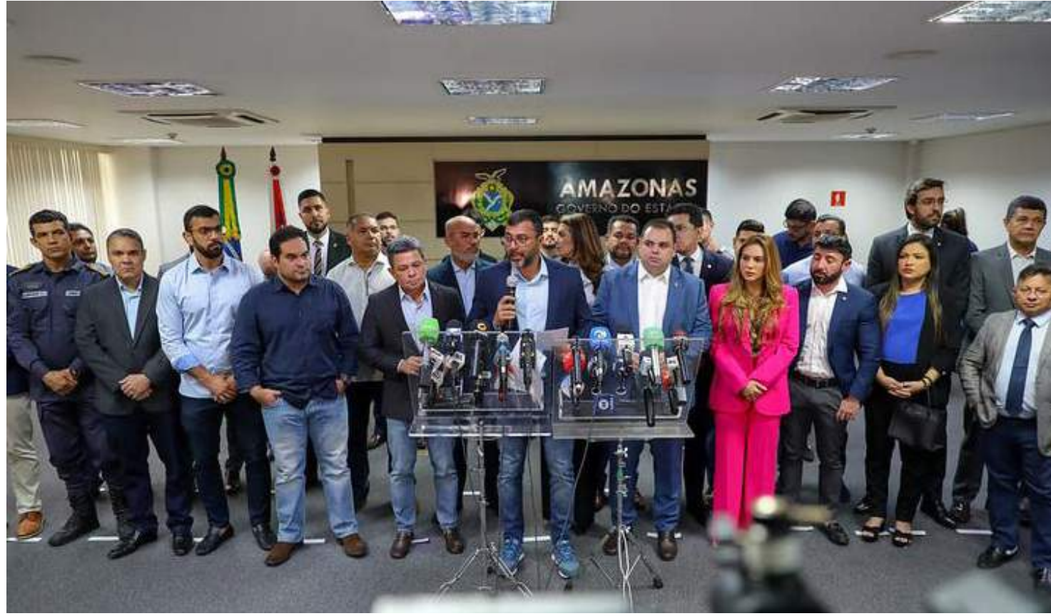
Governador e autoridades públicas realizaram coletiva para anúncio do chamamento

Durante anúncio, realizado na sede do Governo do Amazonas, Wilson Lima destacou os investimentos que