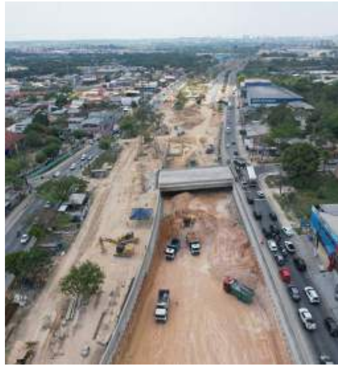
Equipes executaram a implantação de 200 metros de tubulação

A Prefeitura de Manaus trabalha de forma diurna, a obra chega a 87% dos serviços executados. A meta é antecipar a entrega para o mês de dezembro, como forma de presentear os condutores.