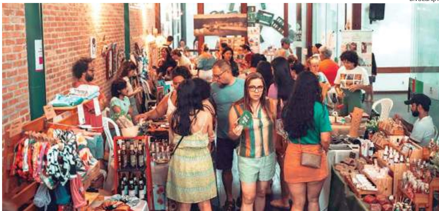
"Fórum de Negócios de Impacto da Periferia" será realizado na sede da FAS