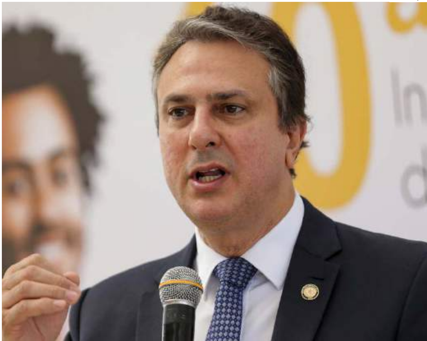
Ministro Camilo Santana reafirmou ainda que o governo estuda mudanças no programa

Também participaram do encontro representantes da Caixa, do BB e do Fundo Nacional de Desenvolvimento da Educação (FNDE), que opera o