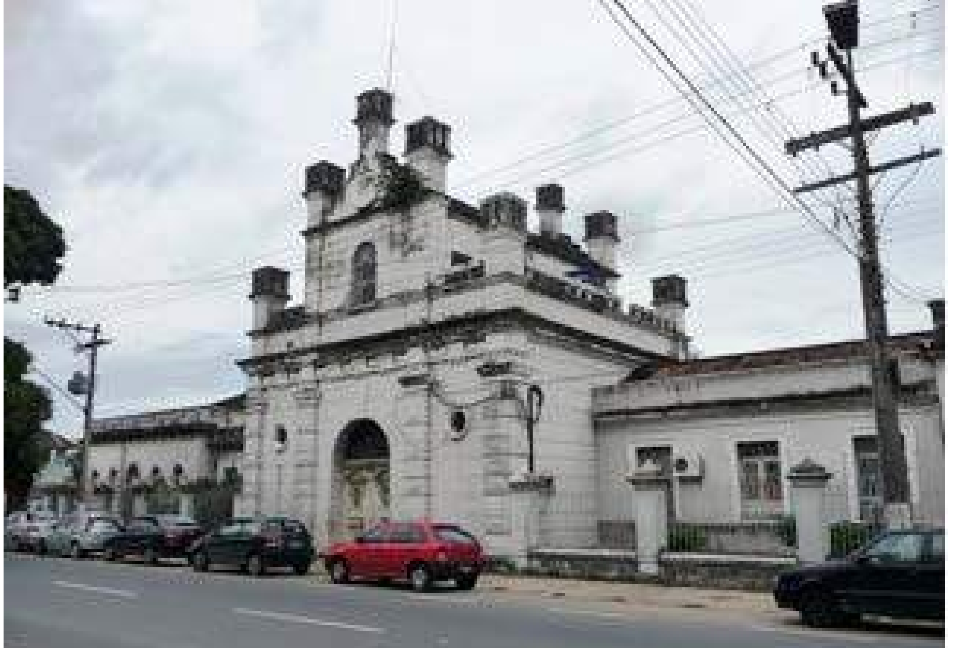
Recursos irão para conservação e revitalização da Cadeia Pública Desembargador Vidal Pessoa

“A gente vem falando de utilizar esse espaço como, na verdade, uma referência cultural. Ela já tem sido pleiteada por algumas instituições que veem nela a possibilidade de ocupação, inclusive, com utilidade social, isso tudo está sendo percebido. Nosso objetivo agora é fazer a restauração do patrimônio. A secretaria