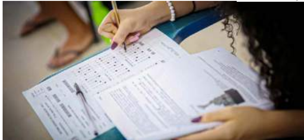
Abstenções do AM são 10% maiores que o segundo o Acre, 2º estado com mais ausências

Ainda conforme o MEC, cinco celulares foram apreendidos e utilizados em fraude, um ponto eletrônico, 15 pessoas foram presas, uma briga com vias de fato e 25