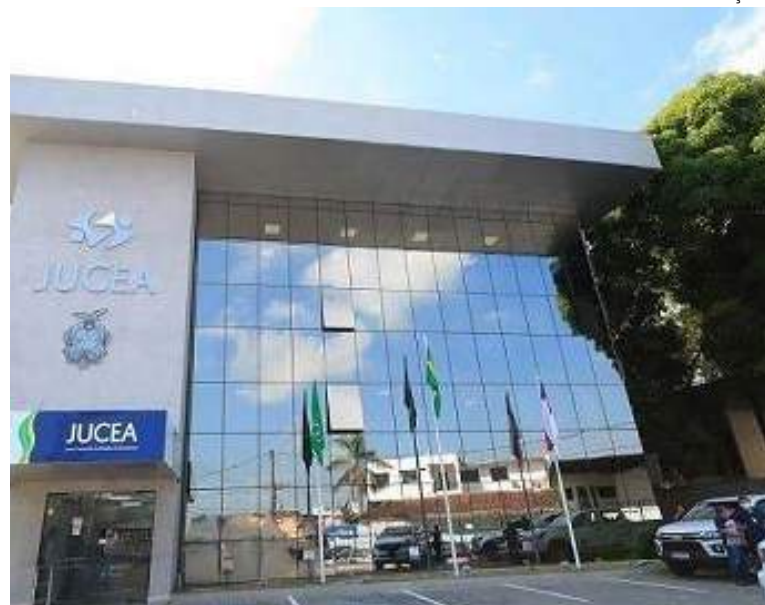
Jucea registra aumento no número de constituições empresariais