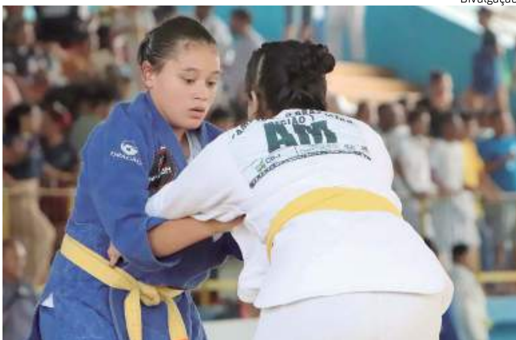
Campeonato Amazonense de judô 2023 teve show de ippons