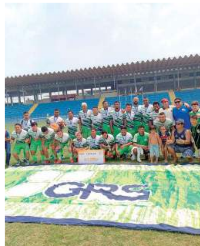
GRS foi campeão do Campeonato da Construção de 2023

O Sintracomec Sindicato dos Trabalhadores nas Indústrias da Construção Civil Montagem e Manutenção Industrial Construção e Montagem de Gasoduto e Oleoduto Engenharia Consultiva de Manaus, representa os direitos dos trabalhadores de cada categoria perante governo, empresas e Justiça do Trabalho. Essa representação acontece de forma individual ou coletiva. Ou seja, em situações relacionadas ao grupo todo ou apenas a um trabalhador.