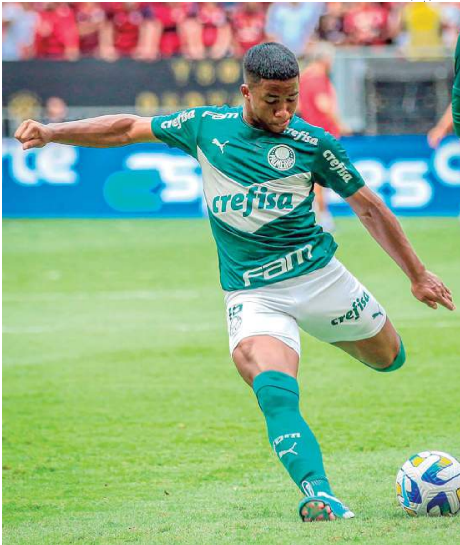
Endrick tem ganho espaço no time do Palmeiras e tem chance de se tornar campeão Brasileiro, antes de ir para o Real Madrid

Zagueiros: Bremer - Juventus (ITA) Gabriel Magalhães - Arsenal (ING) Marquinhos - PSG (FRA) Nino - Fluminense