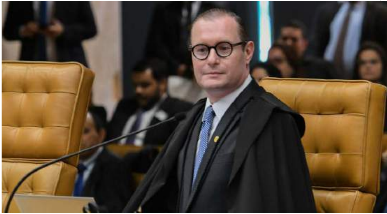
Ação que está com Zanin questiona decisão da Sexta Turma do STJ (Superior Tribunal de Justiça)

A possibilidade de que essa decisão não seja suspensa já causa preocupação generalizada tanto entre integrantes