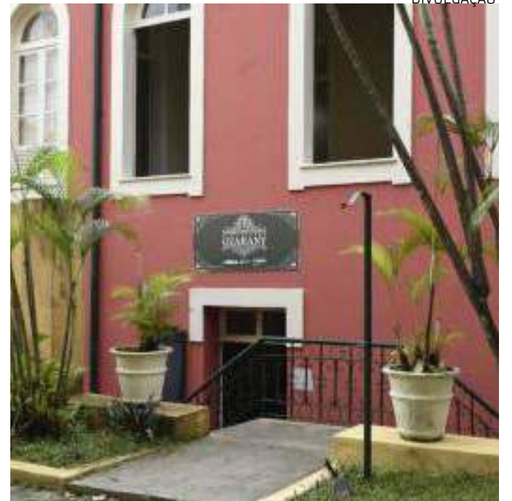
As exposições são gratuitas, com sessão às 18h30, durante festival

O Festival de Cinema Italiano foi criado pela Câmara do Comércio Italiana de São Paulo (ITALCAM), conta com a colaboração e patrocínio da Embaixada da Itália e em Manaus é apoiado pelo Governo do Estado do Amazonas através da Secretaria de Estado de Cultura e Economia Criativa e a Agência de Desenvolvimento Cultural.