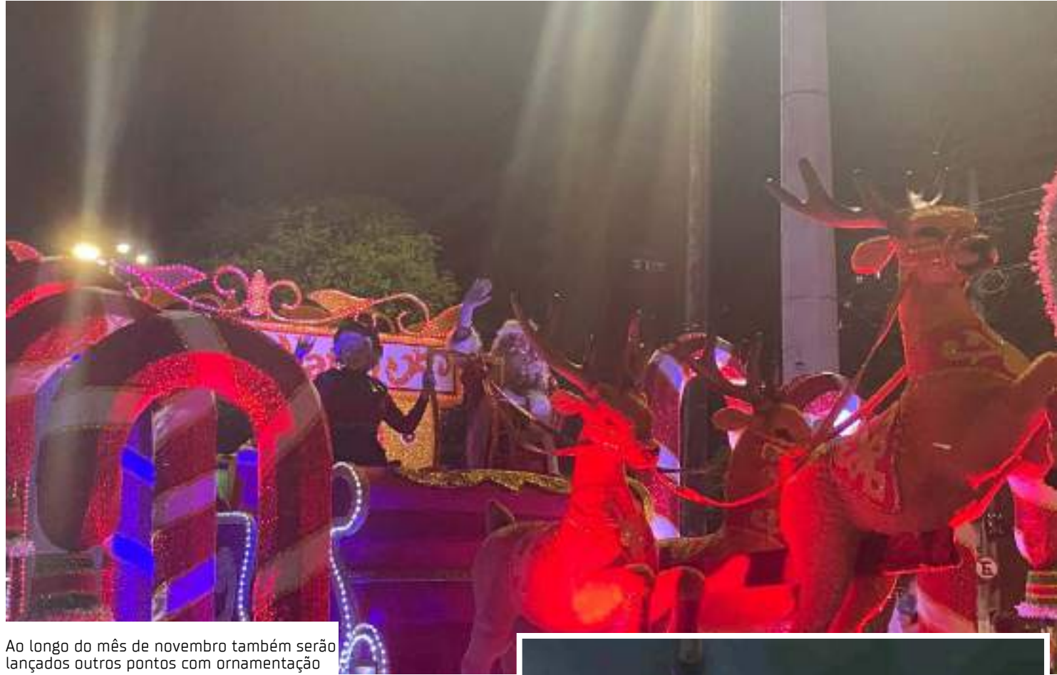
Ao longo do mês de novembro também serão lançados outros pontos com ornamentação

Na oportunidade, foi inaugurado um túnel de 80 metros com mil fitas de LED, que equivale a 3 mil canais de luzes e