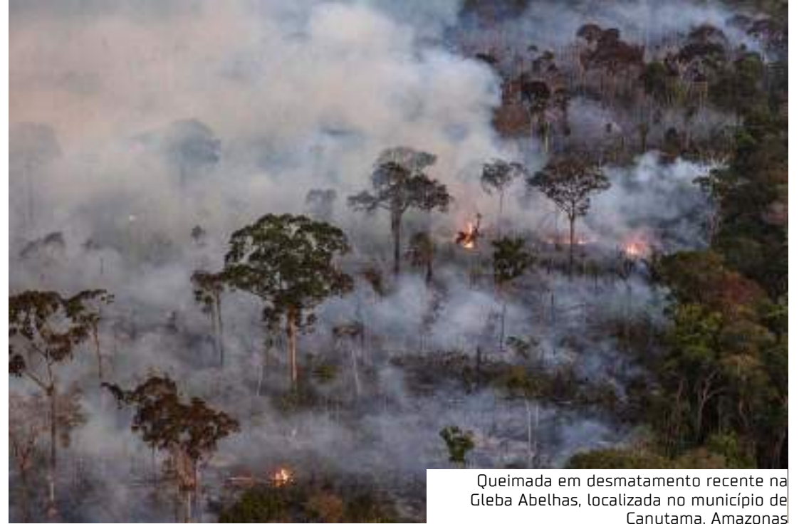
Queimada em desmatamento recente na Gleba Abelhas, localizada no município de Canutama, Amazonas

A expansão agropecuária e a degradação florestal oferecem riscos às áreas protegidas, enquanto aumentam a probabilidade de um incêndio cruzar os limites de suas bordas e afetar a sociobiodiversidade nesses locais. Isso porque a vegetação fragmentada fica mais exposta e vulnerável