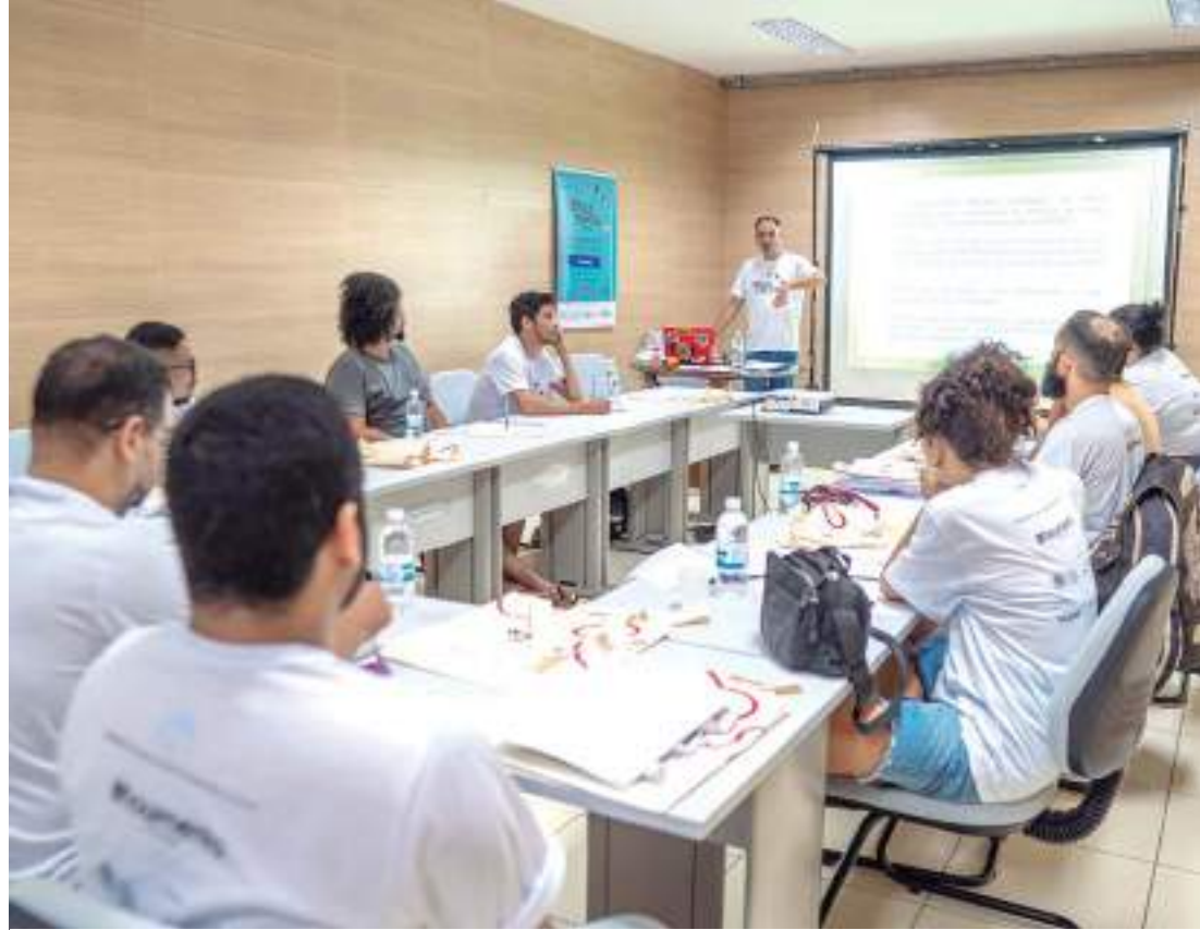
O Movimenta Cultura é uma ação formativa itinerante promovida pelo Centro Cultural Tatajuba