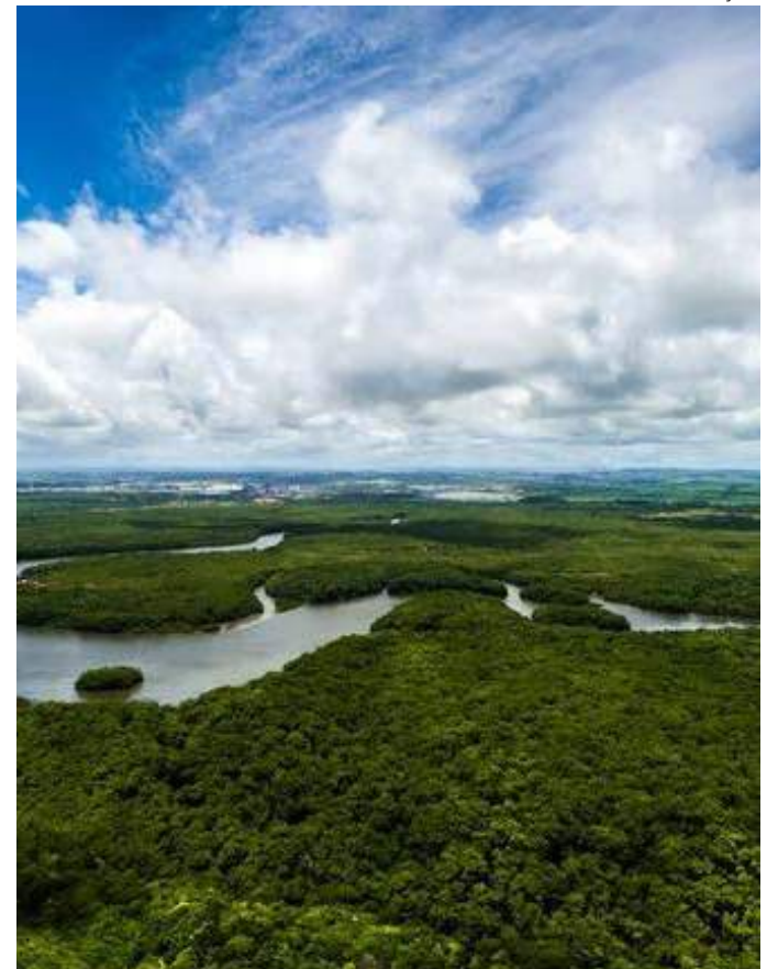
Objetivo é de disponibilizar conexões de Internet para comunidades isoladas

As inscrições para participar do projeto ocorrem entre 30 de outubro e 15 de novembro de 2023 e os pré-requisitos e o link de inscrição podem ser conferidos neste site: www.maisunidos.org .