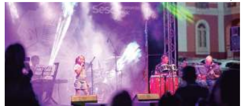
Interessados podem se inscrever gratuitamente até dia 17 de novembro