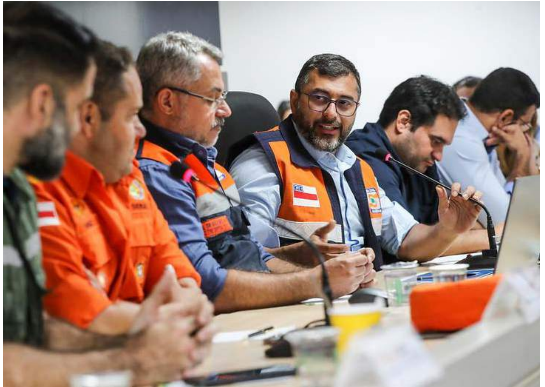
Governador em reunião com Comitê de Enfrentamento à Estiagem em Manaus

O governador também destacou o envio de ajuda humanitária já enviada para 51 municípios do estado em um mês de operação. Desde o dia 2 de outubro, o Governo do Amazonas, com apoio de parceiros como as Forças Armadas, já entregou mais de 74,8 mil cestas básicas, somando 1.372 toneladas e