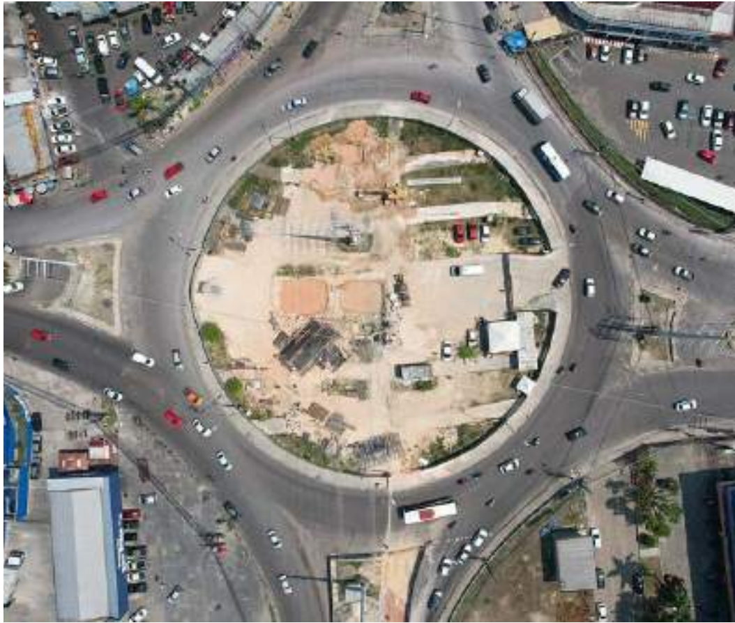
Complexo viário Rei Pelé ganha forma com 54 estacas perfuradas e concretadas na zona Leste