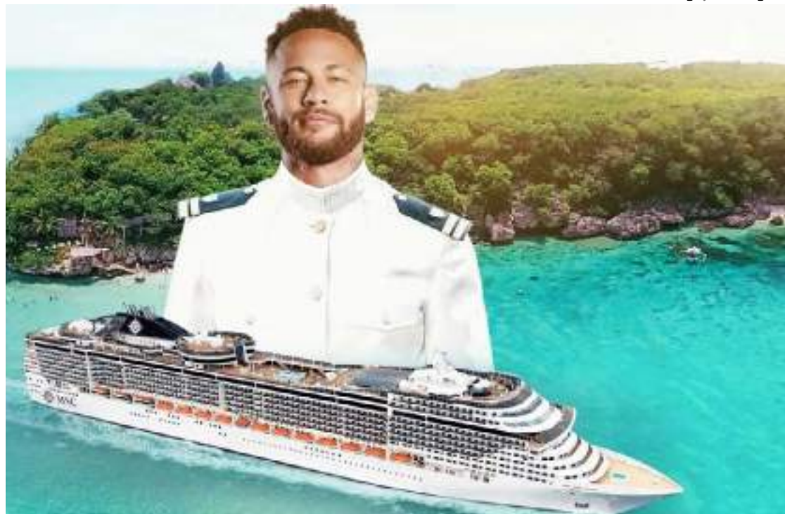
“Ney em Alto Mar” terá show de Péricles e outras atrações

Enquanto se recupera da grave lesão que sofreu no joelho, Neymar terá um compromisso profissional diferente nos próximos dias. De terça-feira (26) até sexta (29), acontece a primeira edição do cruzeiro do jogador.