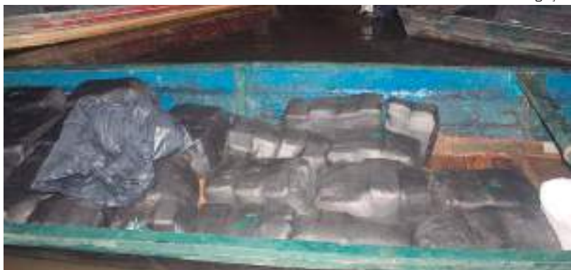
Abordagem a uma embarcação que navegava pela calha do Rio Içá

Uma operação do Exército resultou na apreensão de aproximadamente 750 kg de maconha do tipo skunk em Santo Antônio do Içá, no interior do Amazonas.