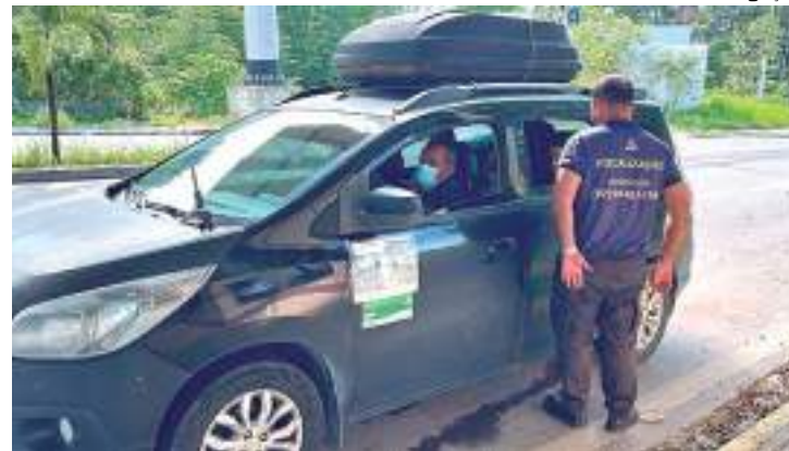
Arsepam realizou 792 fiscalizações, sendo 510 no rodoviário e 282 no hidroviário

“Foi uma operação tranquila seguindo a orientação do governador Wilson Lima. Não registramos nenhum incidente. Foi um trabalho com excelência e em conjunto com outros órgãos da estrutura do Governo do Estado”, disse o gestor.