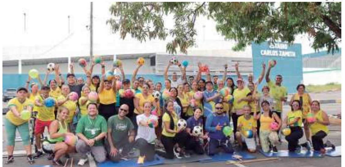
RespirAR é reconhecido internacionalmente pela OMS

Este ano, o RespirAR também realizou ações