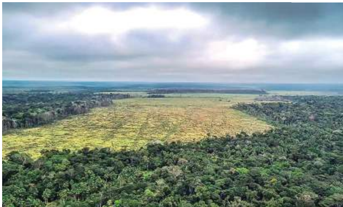
De janeiro a novembro desmatamento teve redução de 62%

O estado mais afetado pela degradação foi o Pará,