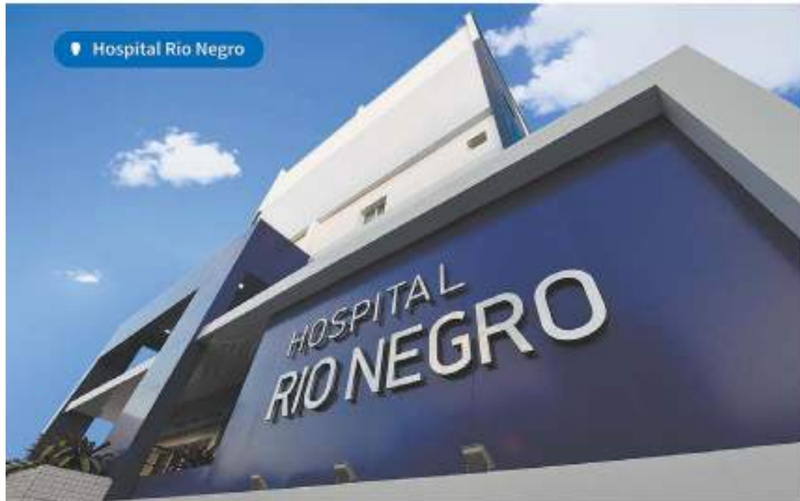
Hospital Rio Negro

Nosso propósito é oferecer acesso a uma saúde de qualidade, que traga conforto e segurança para a nossa gente através de uma rede própria e integrada. No Amazonas e no Brasil inteiro, é isso que nos une e nos motiva, todos os dias, ao atender mais de 15,8 milhões de clientes.