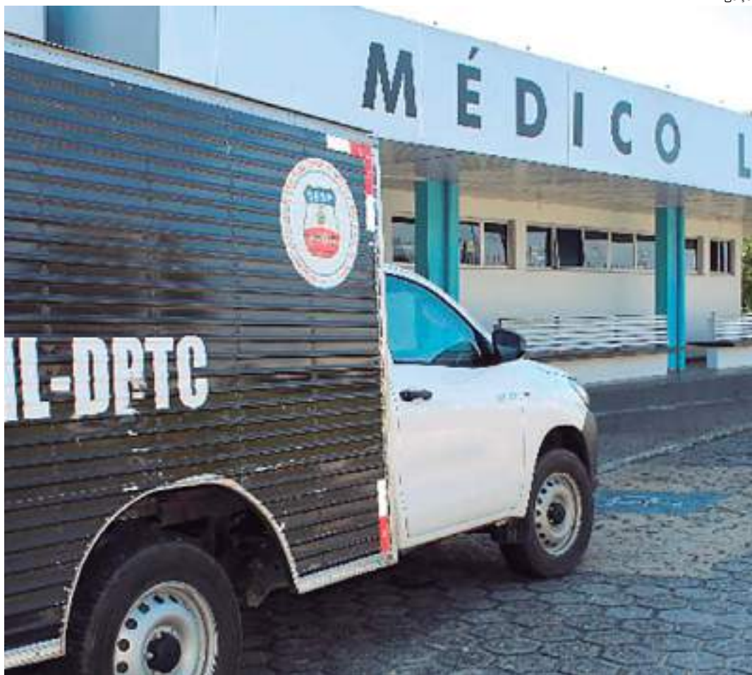
Homem estava em um beco quando foi atingido com vários tiros

Não há informações sobre a motivação do crime. O caso deve ser investigado pela Polícia Civil do Amazonas (PC-AM).