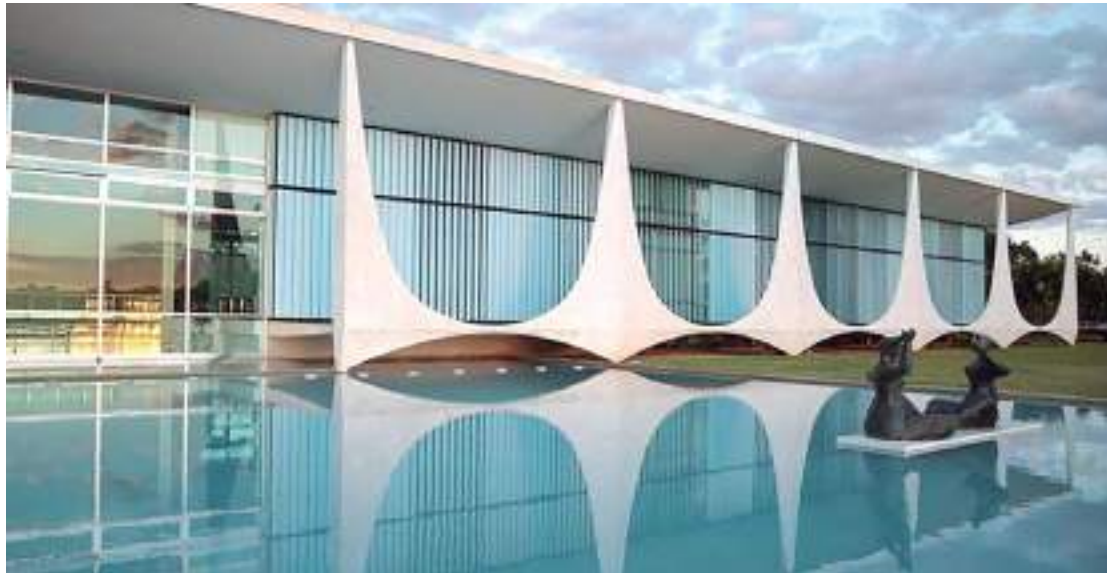
Deste valor, R$ 114 mil foram destinados a um novo tapete, com o objetivo de dar mais "brasilidade" ao Planalto

Deste valor, R$ 114 mil foram destinados a um novo tapete, com o objetivo de dar mais "brasilidade" ao Palácio do Planalto. Um sofá escolhido pela primeira-dama Rosângela da Silva, a Janja, para