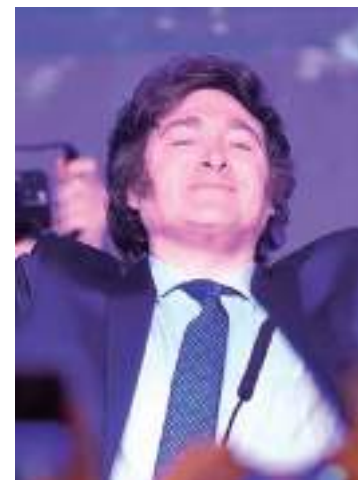
Presidente da Argentina, Javier Milei

O governo assegura que o decreto isentará os trabalhadores contratados no último ano.