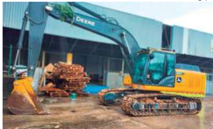
Caminhão e escavadeira hidráulica eram utilizados no crime ambiental

Três homens, com idades de 24, 52 e 71 anos, foram presos por crime ambiental, na tarde de quinta-feira (21), na avenida Efigênio Sales, Zona Centro-Sul de Manaus. O trio foi flagrado derrubando árvores naquela localidade.