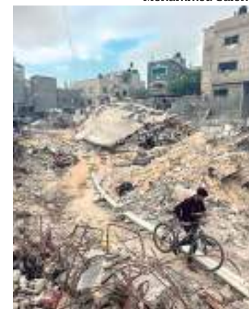
Casas destruídas em ataques israelenses

O Wall Street Journal disse que um oficial das Forças de Defesa de Israel se recusou a comentar sobre o plano de inundação, mas foi citado dizendo: “O exército está operando para desmantelar as capacidades terroristas do Hamas de várias maneiras, usando diferentes ferramentas militares e tecnológicas.”