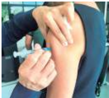
A vacinação contra a influenza é uma das medidas de prevenção

A campanha de vacinação contra influenza (gripe) segue em andamento, até 15 de dezembro, nos postos de vacinação do Amazonas. O objetivo é incentivar ativamente a participação da população na campanha como medida preventiva à doença, ampliando as coberturas vacinais nos públicos prioritários.