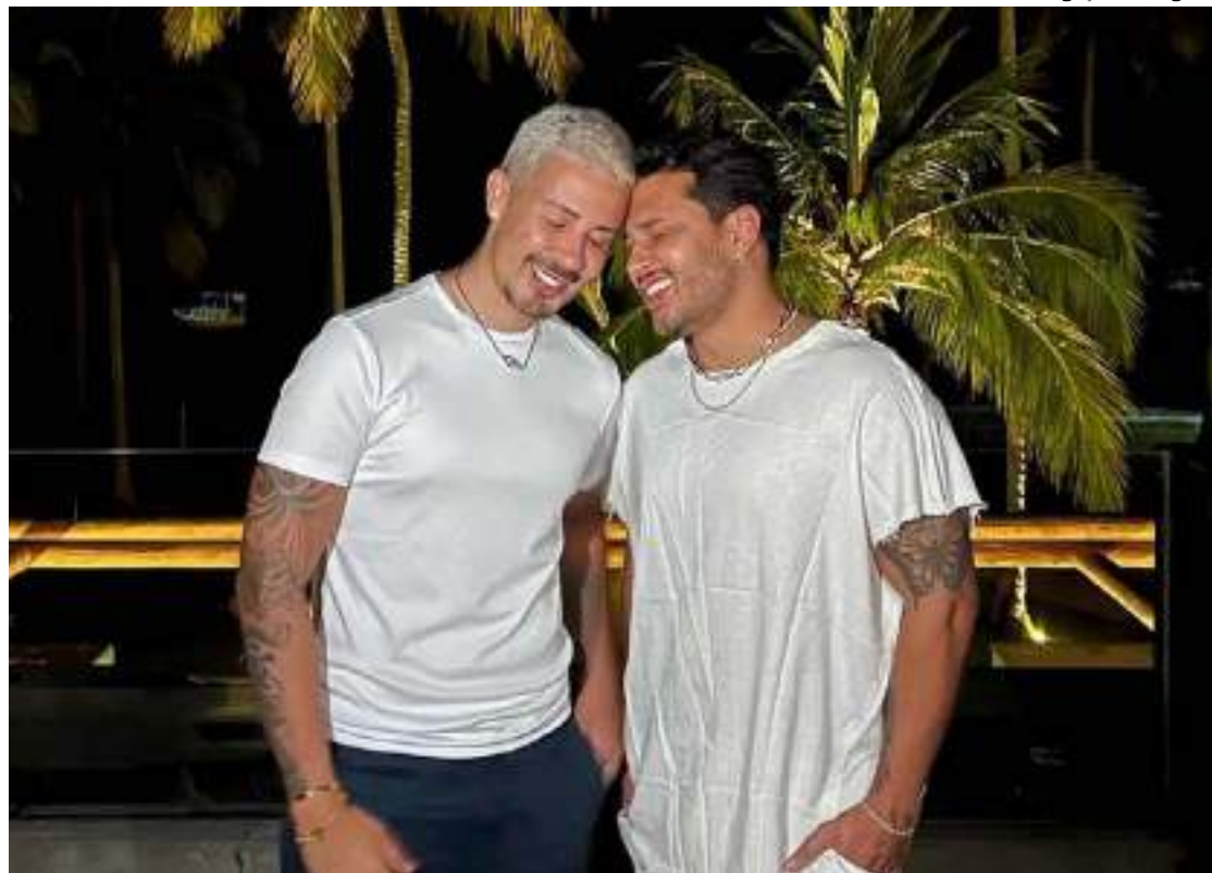
Carlinhos Maia e o marido Lucas Guimarães estariam passando por uma crise no casamento

Carlinhos Maia confirmou a crise no relacionamento com Lucas Guimarães. O influencer explicou que os dois se estranharam bastante durante o primeiro dia da Farofa da Gkay, mas que, durante a noite, eles tiveram uma “bimbada” dos sonhos.