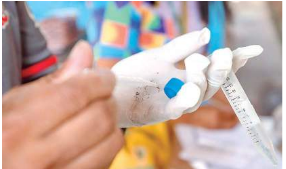
LIRAA foi executado em 26.506 imóveis selecionados por amostragem nos 63 bairros de Manaus

Já os depósitos de armazenamento de água para consumo em nível de solo, como tambores, tonéis ou camburões, barris e tinas, representaram 29,9% dos depósitos identificados no LIRAA. Os recipientes do tipo lixo, garrafas, latas e