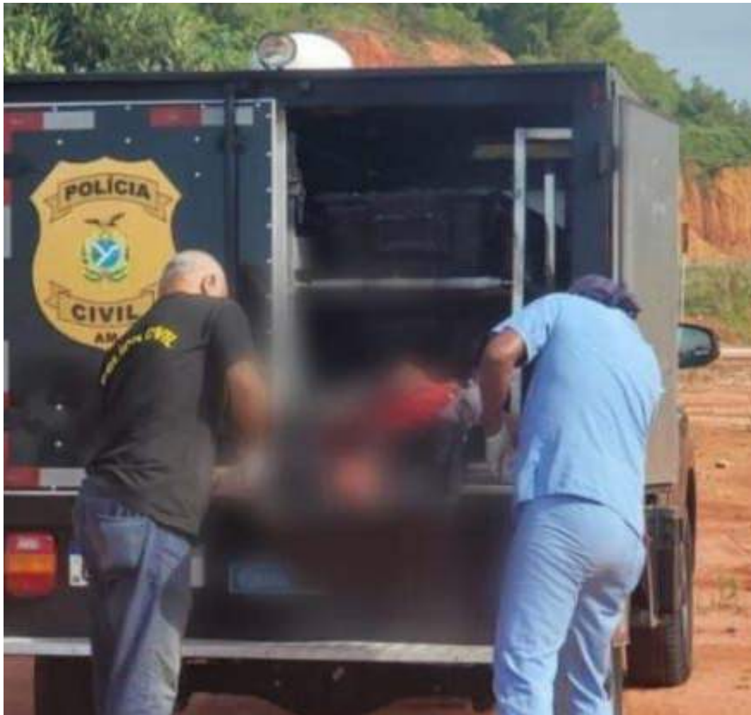
Corpo foi encontrado por moradores do Parque Mosaico

O corpo foi removido pelo Instituto Médico Legal (IML) e o caso deve ser investigado pela Delegacia Especializada em Homicídios e Sequestros (DEHS).