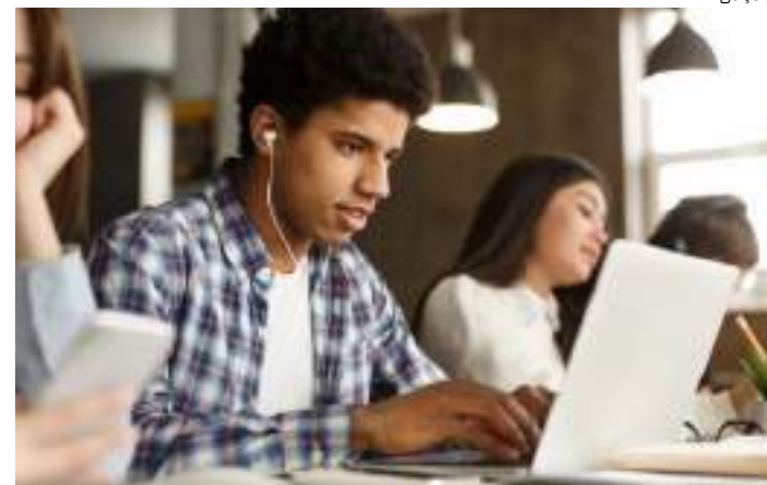
Vagas para nível superior, cursos técnicos e ensino médio

O IEL não recebe currículos por e-mail, nem de forma presencial. A participação será via sistema por meio do cadastro. As vagas ficarão disponíveis até completar o número máximo de candidatos a serem encaminhados de acordo com a demanda da empresa cliente.