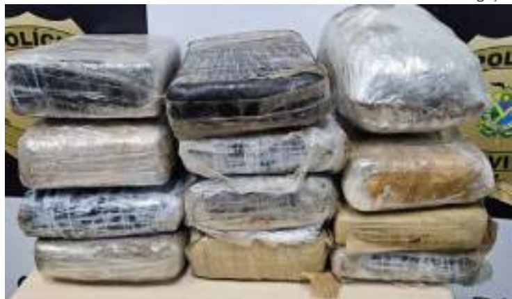
Tabletes de maconha estavam dentro de malas numa lancha em porto

Cerca de 12 quilos de maconha tipo skunk avaliados em R$ 200 mil, foram apreendidos nesta terça-feira (5), em uma lancha expressa que estava atracada no porto do bairro São Raimundo, Zona Oeste de Manaus. A embarcação é oriunda do município de São Gabriel da Cachoeira, interior do Amazonas.