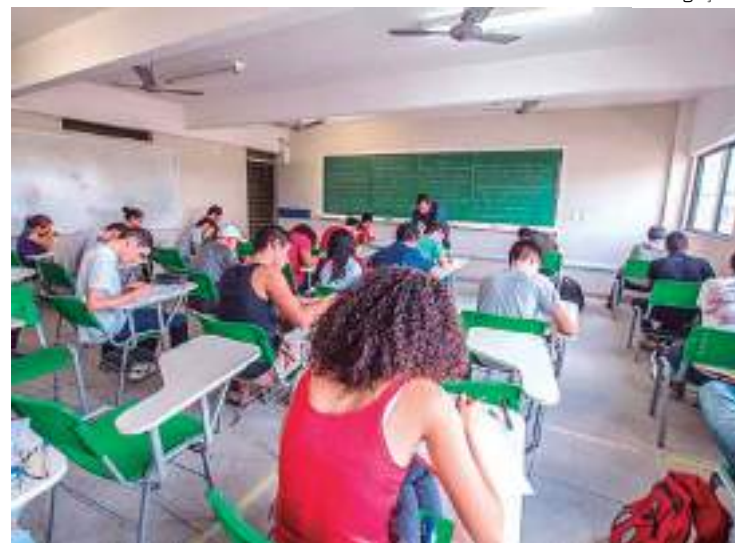
Foram avaliados 690 mil estudantes de 15 anos, em 81 países

O Pisa foi divulgado na manhã de terça (5) pela OCDE, em Paris. Esses são os primeiros resultados em matemática, leitura e ciências que permitem comparar o impacto da pandemia do coronavírus, e do consequente fechamento de escolas, no