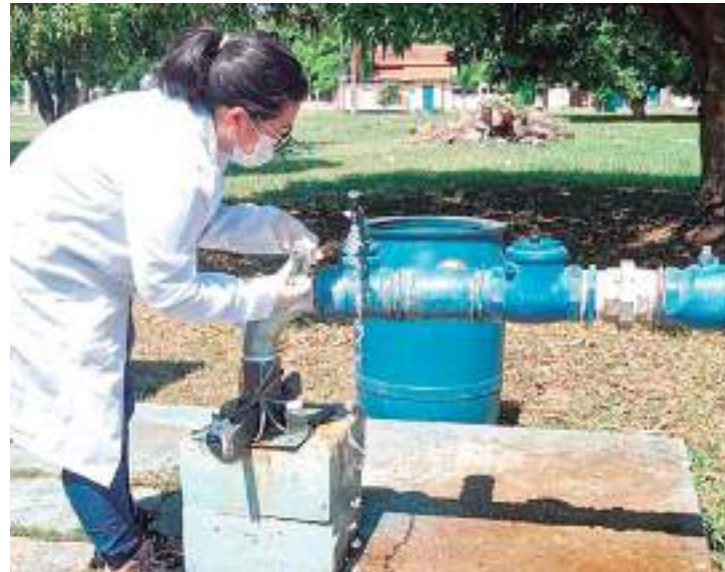
Novo relatório revelou permanência dos problemas de agosto

Entre os poluentes identificados, amônia, manganês, ferro, nitrato, alumínio, coli-