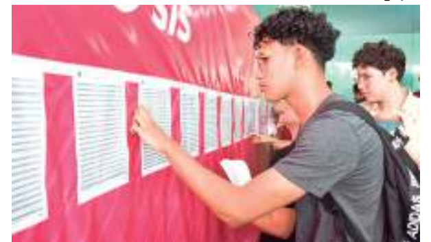
Certame ofereceu, no total, 5.686 vagas, com 1.142 para PcD's

A matrícula nos grupos destinados a esses candidatos depende do parecer favorável da banca. É importante seguir atentamente o edital para garantir a vaga, pois descumprir prazos ou documentações resultará na perda do direito.