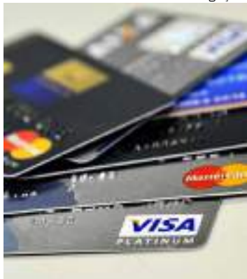
Grupo mantinha contato com responsáveis pela clonagem dos cartões

Policiais civis do 6º Distrito Integrado de Polícia (DIP) prenderam em flagrante, na segunda-feira (4), quatro suspeitos por aplicar golpes com cartões clonados em uma loja de tintas, gerando um prejuízo de R$ 90 mil em produtos. Eles foram presos no momento em que estavam saindo do estabelecimento, no bairro Cidade de Deus, Zona Norte.