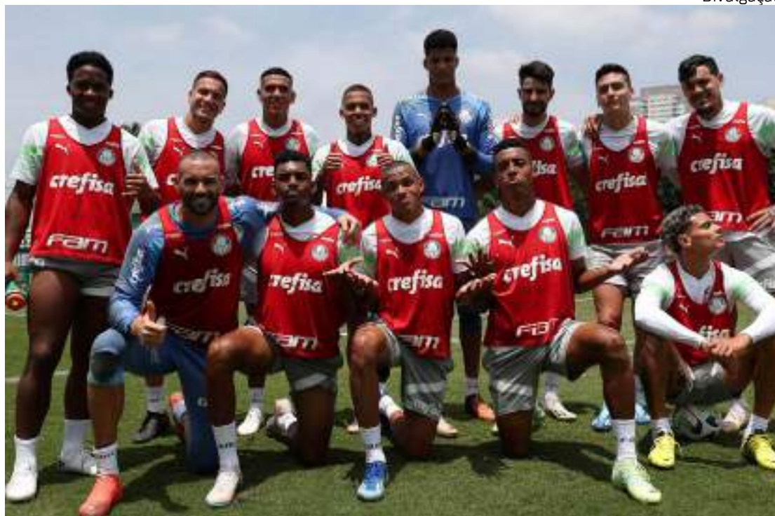
Jogadores do Porco realizam último treino antes de jogo da final do Brasileirão

Assim, o Verdão pode até perder no Mineirão para o Cruzeiro que só não será campeão se um dos clubes tirar a imensa diferença no saldo de gols contra Bahia e São Paulo, o que não soa nada real, sobretudo