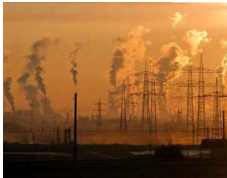
Eliminação dos fósseis esteve nos rascunhos negociados ao longo da semana

Um novo rascunho do balanço global do Acordo de Paris, principal documento desta COP, foi publicado às 7h do horário local em Dubai (meia-noite no Brasil). Como alternativa à menção sobre eliminação gradual (“phase out”, em inglês) dos combustíveis fósseis, o novo texto propôs a transição dos combustíveis fósseis (“transitioning away from”, no termo em inglês). A plenária para aprovação do texto começou por volta das 11h em Dubai (4h no Brasil).