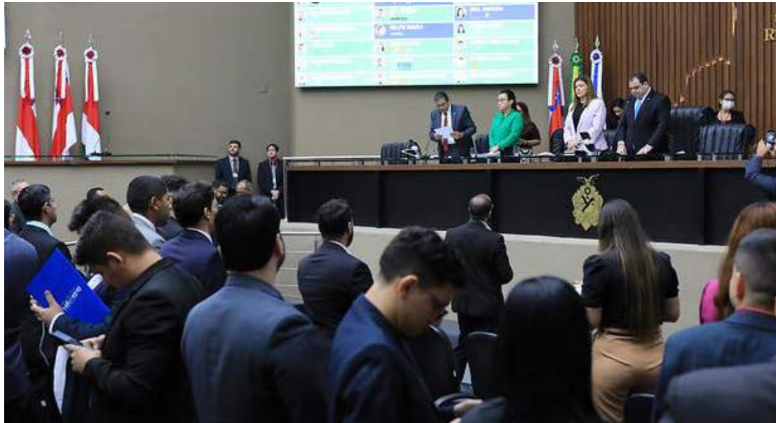
Para o ano que vem, a receita líquida do Amazonas ficou estimada em R$ 30,161 bilhões

Originado pela Mensagem Governamental nº 110 de 2023, apresentada em 31 de outubro, o Projeto de Lei nº 1.012 de 2023 estabelece a Lei Orçamentária Anual (LOA), que estima a receita e fixa a despesa do Estado para o exercício financei-