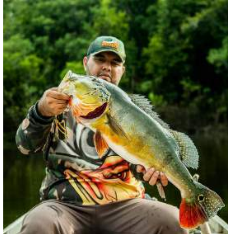
PL regulamenta a realização da pesca esportiva do Tucunaré

“Isso vai permitir ter elementos necessários para fomentar a pesca esportiva, o que naturalmente vai atrair cada vez mais turistas, beneficiando toda uma