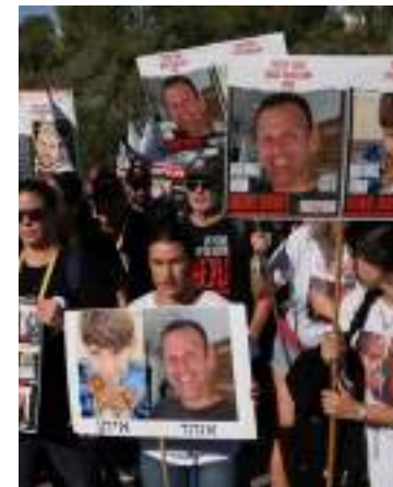
Apoiadores de israelenses feitos reféns

Ao mesmo tempo, Israel, que retomou a operação militar contra o Hamas após uma trégua de sete dias, acredita que a sua ofensiva no sul de Gaza, principalmente na cidade de Khan Younis, deverá exercer pressão adicional.