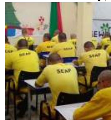
Na capital, 739 reeducandos realizaram o Enem; foram 853 no total

“Dentro do sistema eu tenho acesso à educação, algo que não tinha lá fora, e eu sei que, além de abrir muitas portas para mim, essa oportunidade pode me ajudar a construir uma nova vida”, pontuou o reeducando.