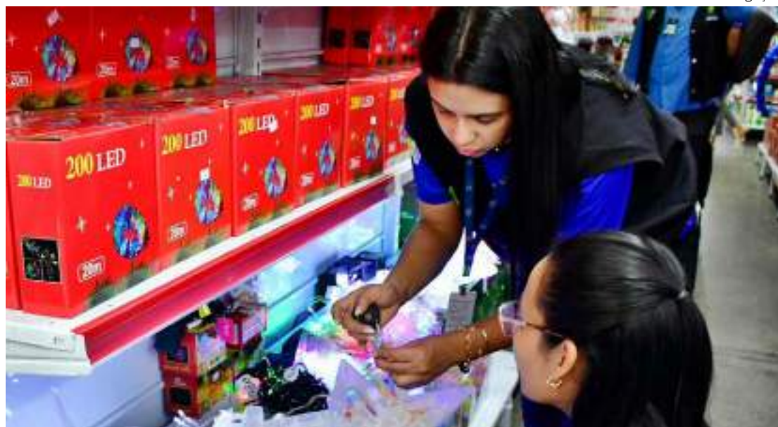
Todos os produtos, mesmo os importados, devem ser submetidos às regras brasileiras

“Os pisca-piscas apreendidos na loja estavam fora dos padrões exigidos e sem o selo do Inmetro, o que é um risco iminente para quem os adquire, uma vez que podem gerar