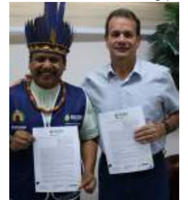
Assinatura formaliza ações de qualificação profissional aos indígenas

As atividades de cursos profissionalizantes, de acordo com as necessidades das comunidades indígenas, estão previstas para iniciar durante o início de 2024, gerando oportunidade de trabalho, renda e empregabilidade aos povos tradicionais.