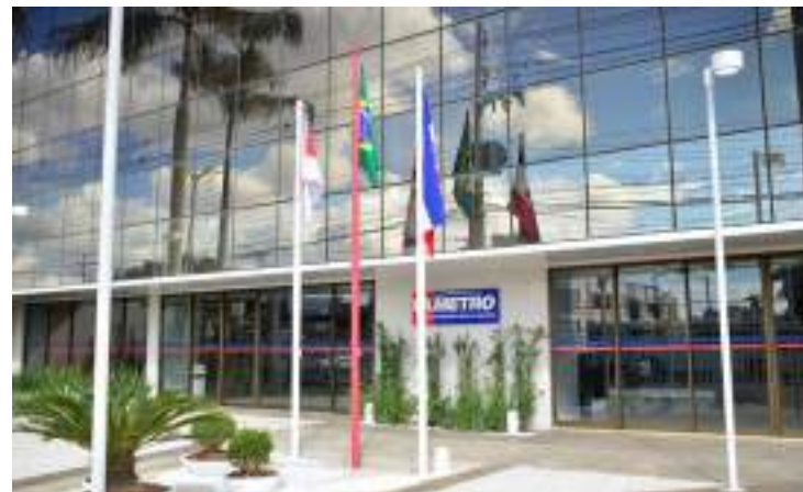
Em 2023, Fametro também conquistou nota máxima do MEC

O Centro Universitário Fametro conquistou, pelo sexto ano consecutivo, o primeiro lugar entre as Instituições de Ensino Superior (IES) mais bem avaliadas no estado do Amazonas, com nota 4 no Índice Geral de Cursos (IGC) e 3,121 no IGC contínuo, do Ministério da Educação (MEC).