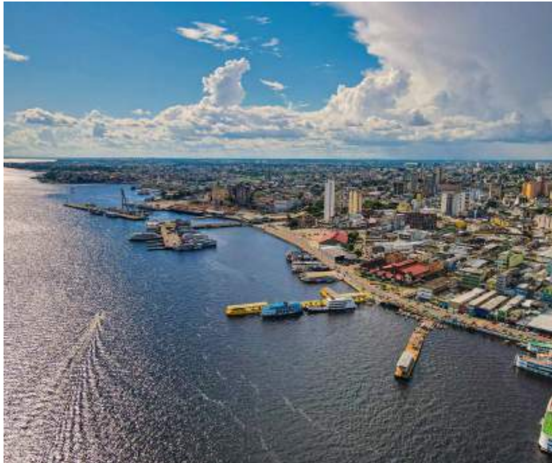
Lula tratou sobre outras pautas pontuais, como importância da manutenção da competitividade da ZFM

“Em uma conversa de uma hora no Palácio do Planalto, eu e o presidente ainda falamos sobre a necessidade urgente de aceleração das obras de recuperação da BR-319 e a importância da Zona Franca de Manaus na conservação da floresta do nosso Amazonas. Graças à ZFM é que mantemos 97% da floresta do estado em pé! Claro