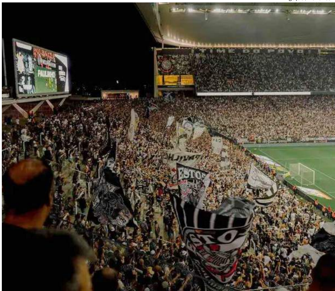
Neo Química será palco de primeiro jogo da NFL no Brasil