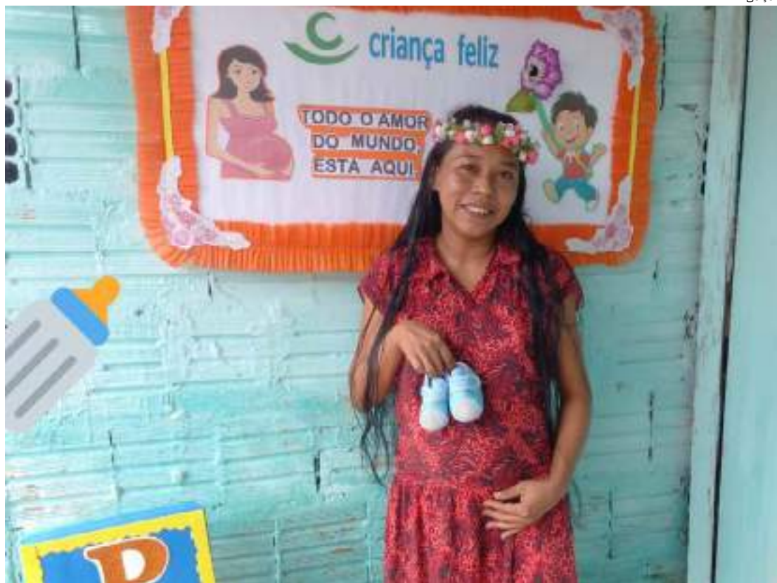
Programa Criança Feliz atende gestantes, crianças de até 36 meses e suas famílias

Feliz atende gestantes, crianças de até 36 meses e suas famílias incluídas no Cadastro Único para Programas Sociais do