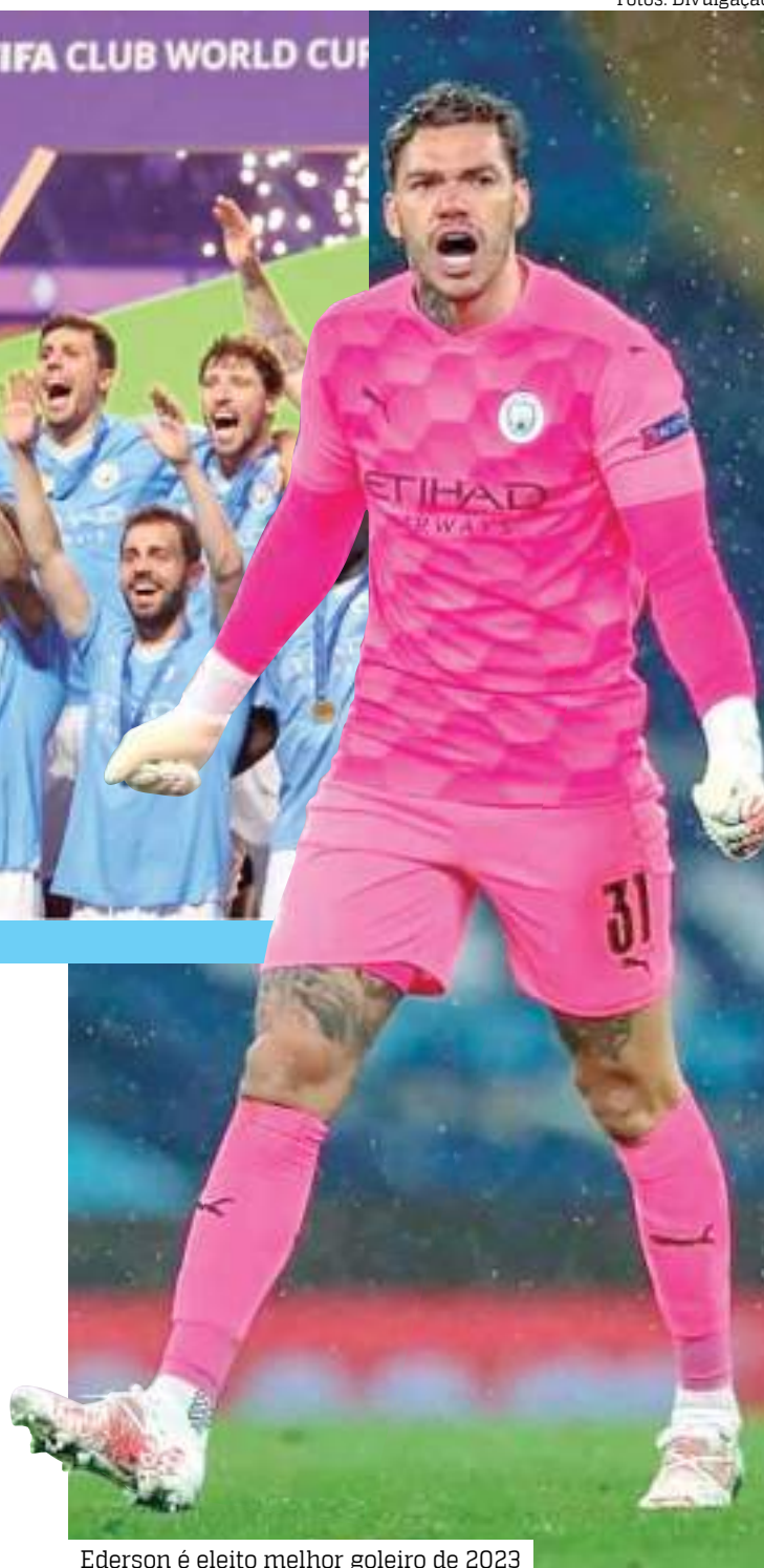
Ederson é eleito melhor goleiro de 2023

Com o título da Liga dos Campeões, o Manchester City se classificou para a Supercopa da UEFA, e venceu mais um título internacional, batendo o Sevilla nos pênaltis após empate em 1 a 1 com a bola rolando.