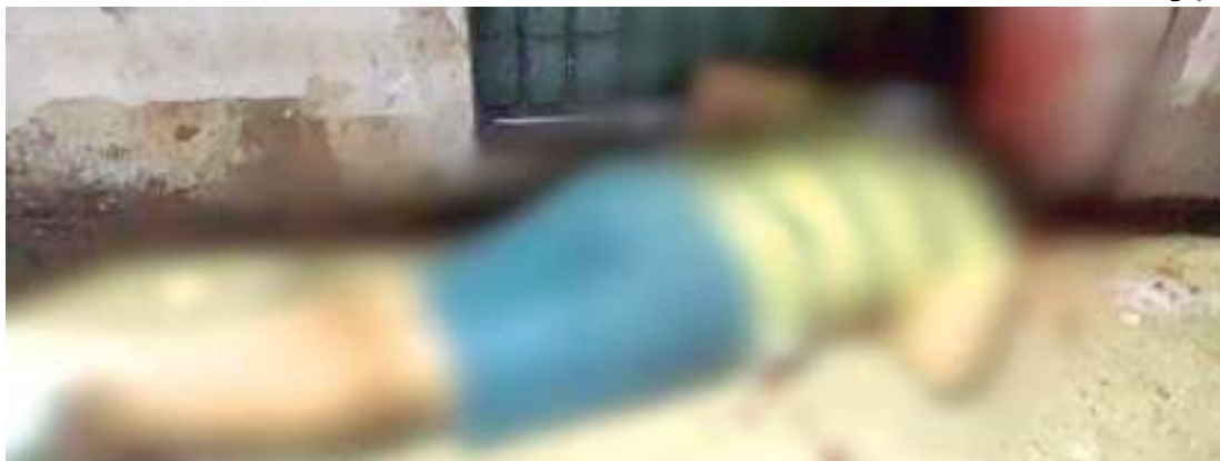
Vizinhos relataram que vítima não tinha envolvimento com a criminalidade