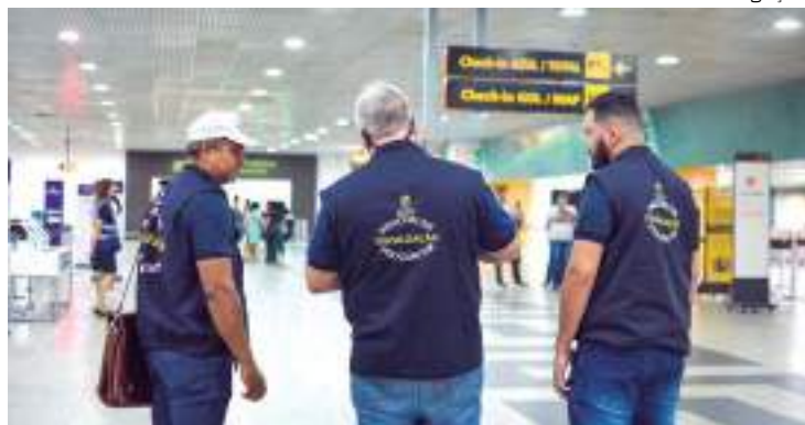
Órgão informou que clientes devem estar cientes de seus direitos

Consumidores que buscam adquirir pacotes de viagens e reservas de hospedagem, visando garantir uma experiência segura e satisfatória para curtir o Réveillon, estão sendo orientados pelo Instituto de Defesa do Consumidor do Amazonas (Procon-AM).