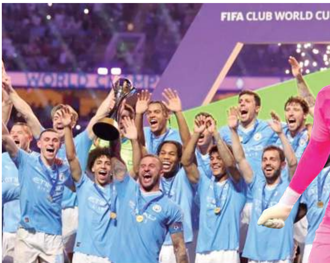
Manchester City foi campeão Mundial de Clubes de 2023

nar o futebol inglês nos últimos anos, tendo conquistado as últimas três edições de Premier League, o Manchester City tem apenas quatro títulos internacionais em sua história.