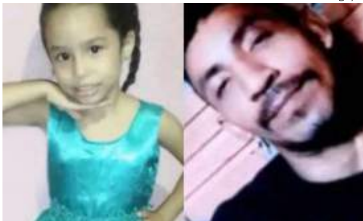
Criança teria abraçado o padrasto e acabou sendo atingida pelos tiros