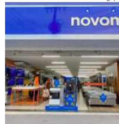
Produtos selecionados estarão com descontos especiais

Além de empréstimos facilitados que podem ser feitos via FGTS, consignado ou pessoal, com muito menos burocracia, a rede varejista NovoMundo.Com também oferece outros serviços pela Novo Mundo Resolve como: Instalação, Limpeza, Impermeabilização e Dedetização, garantindo uma jornada diferenciada, integrada e acessível.