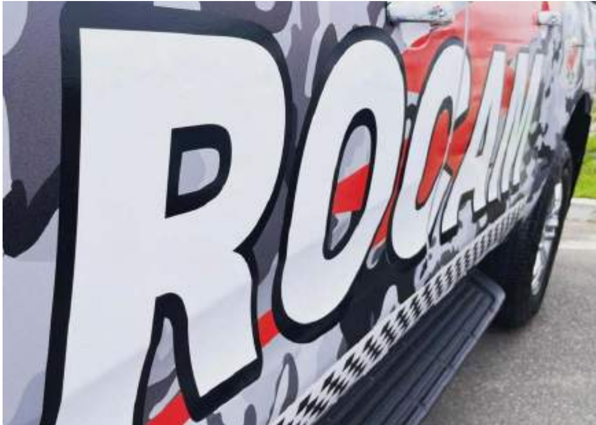
Homem foi torturado durante o tempo que ficou preso no cativo