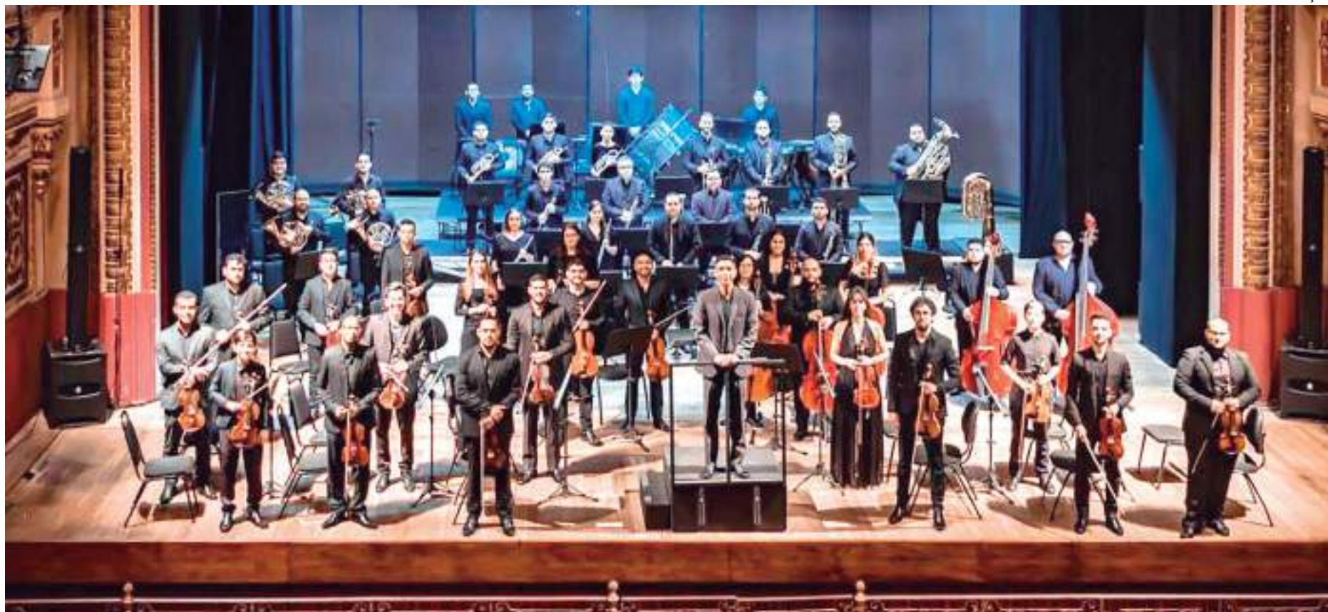
Obra é dividida em três movimentos: Brasileira, Jornada Etérea e Saudoso Carnaval

A primeira temporada da “Série Rio Negro Concertos Sinfônicos” encerra as atividades de 2023 com o último concerto gratuito realizado pela Orquestra Pró Cultura do Amazonas, nesta quinta-feira (28), às 20h, no Teatro Amazonas.