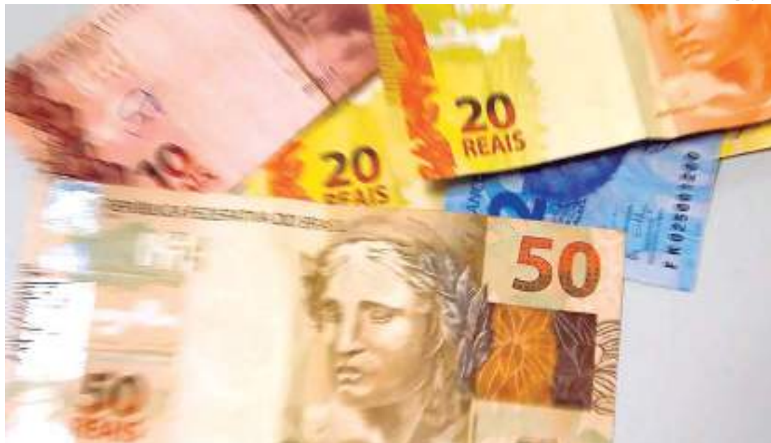
Retorno do aumento real já é possível comprar picanha e cerveja

Quando o governo federal anunciou que o reajuste do salário mínimo