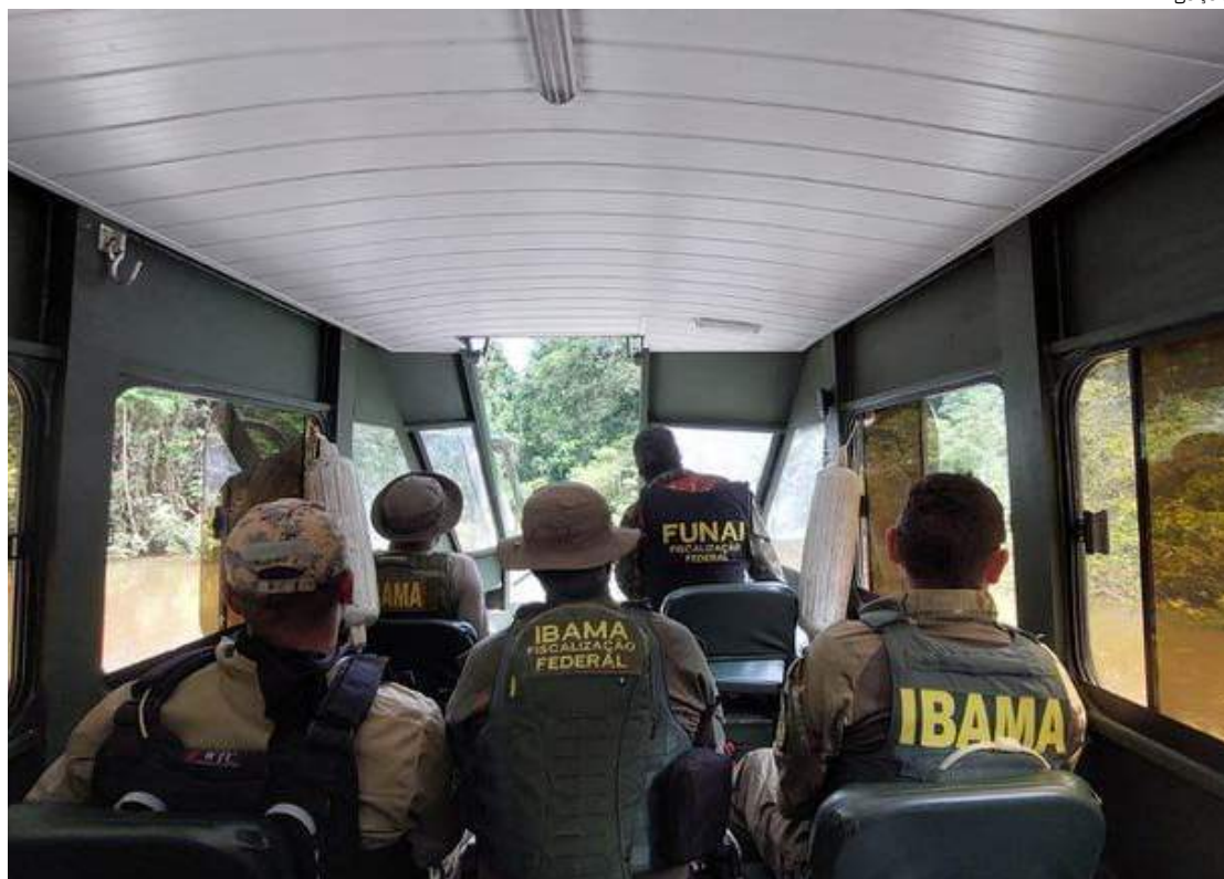
Operação contou ainda com o apoio do Exército Brasileiro

O garimpo ilegal ameaça os povos da TI, que reúne a maior concentração de grupos indígenas isolados do mundo.