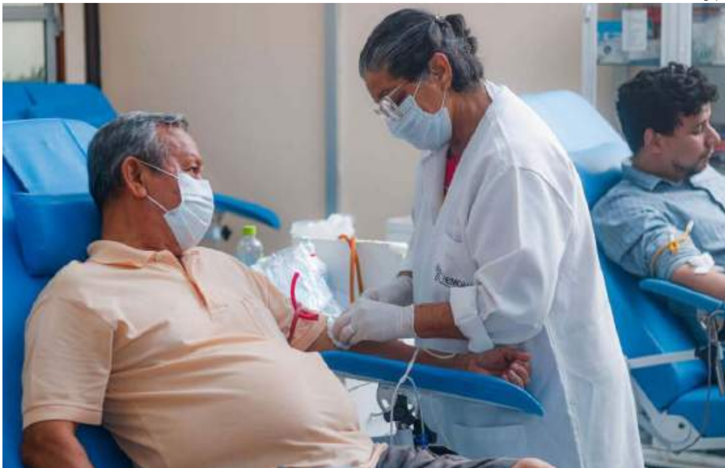
Faixa entre 30-39 anos aparece em segundo lugar com 25,59%

Além do fator envelhecimento, o levantamento