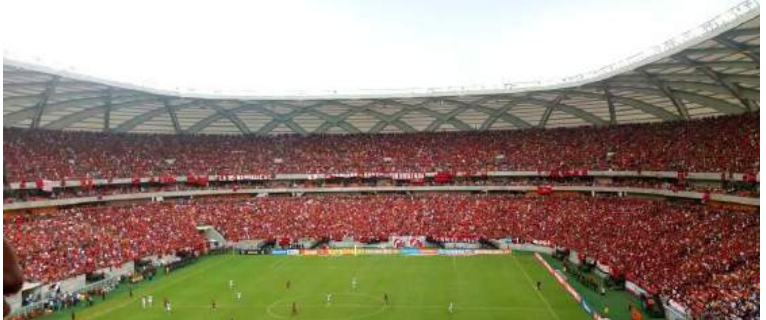
Venda online dos ingressos começou nesta quarta-feira (27)