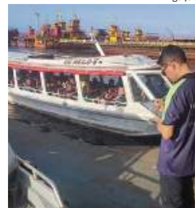
Operação Ano Novo vai fiscalizar movimentação durante feriado

A operação que acontece no Ano Novo conta com o apoio do Batalhão de Policiamento de Trânsito (BPTran), da Polícia Militar do Amazonas (PMAM); da Superintendência Estadual de Navegação, Portos e Hidrovias (SNPH); e do Departamento Estadual de Trânsito do Amazonas (Detran-AM).