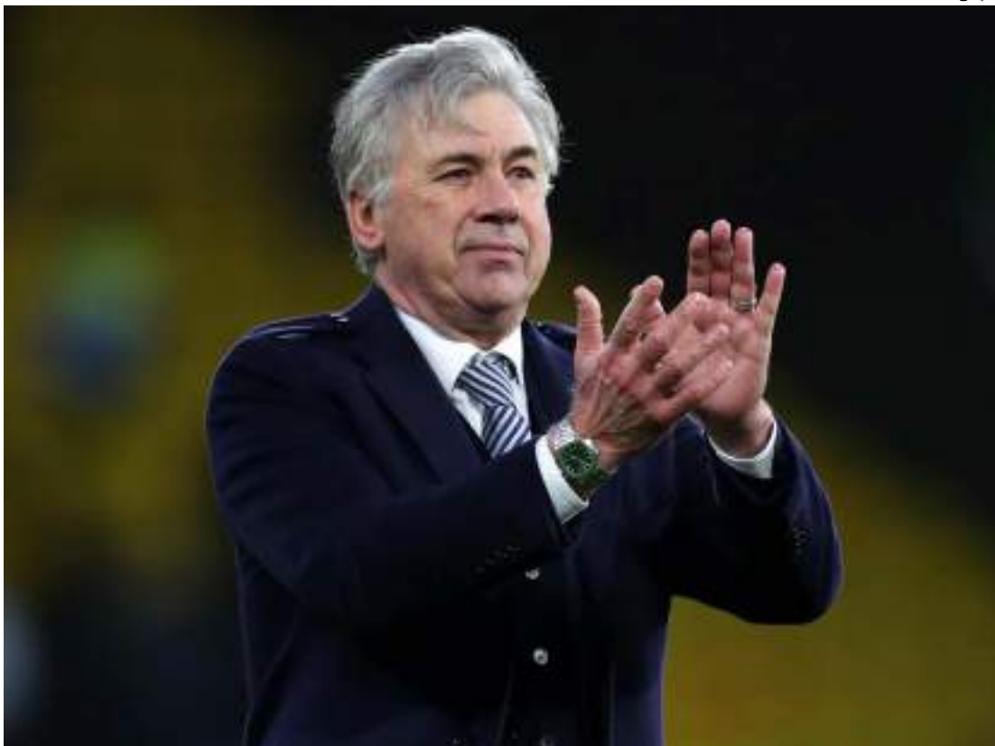
Ancelotti deve renovar com Real Madrid antes do fim do contrato, em junho

Um dos principais nomes no futebol mundial, Carlo Ancelotti é o maior desejo da Confederação Brasileira de Futebol (CBF) para assumir a Seleção Brasileira, mas a relação com o Real Madrid dificulta a transação. De acordo com o jornal espanhol 'As', o treinador italiano está próximo de renovar com o clube merengue.