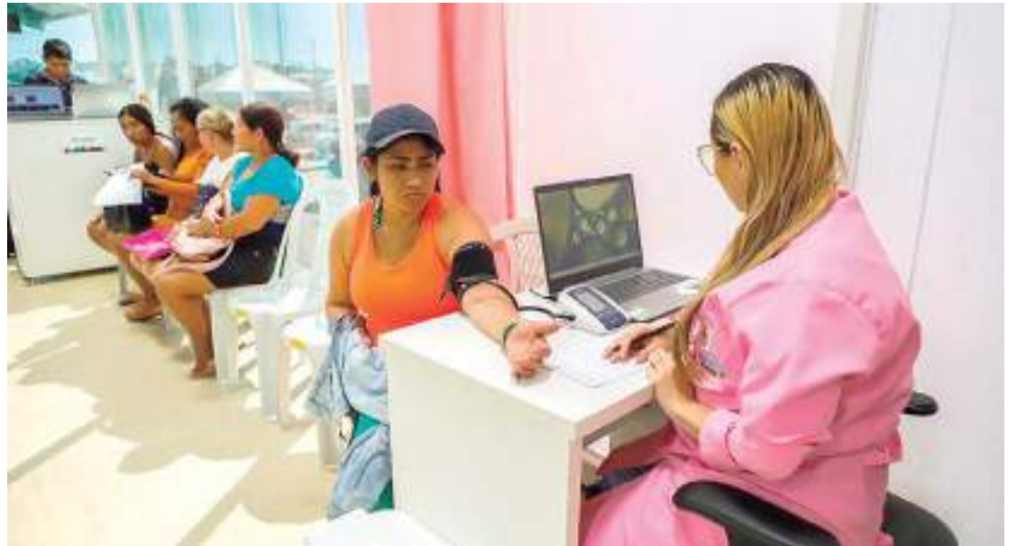
No Brasil, Manaus figurou como a quinta capital que mais investiu na educação

Já na evolução dos investimentos nesse setor, Manaus também teve aumento significativo, comparados aos recursos contabilizados em