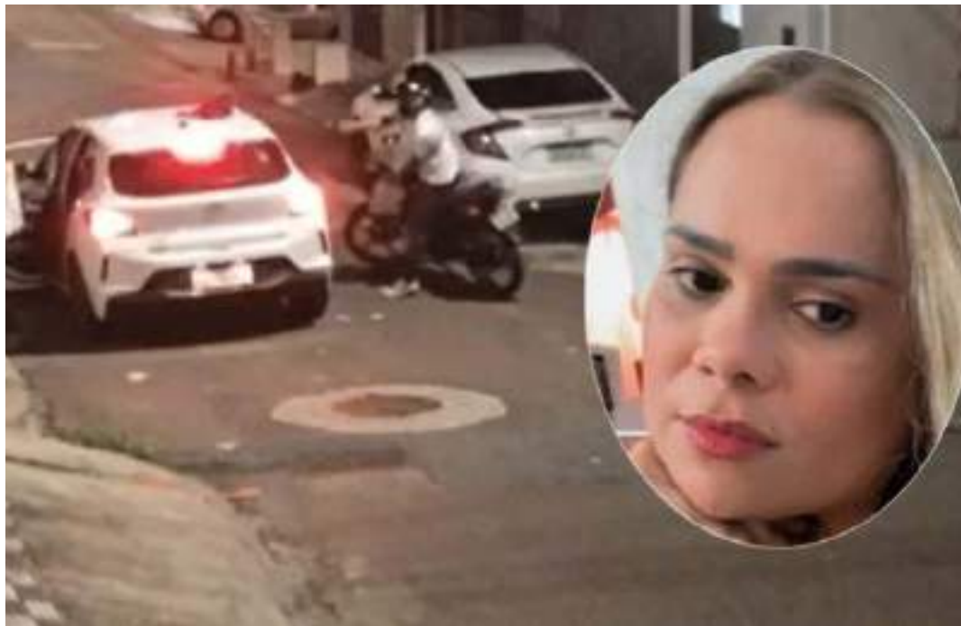
Vítima foi abordada ainda dentro do carro, ela estava com a renda da choperia e reagiu ao assalto

A gravação da câmera de segurança mostra um motoqueiro abordando as vítimas