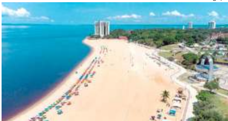
Placas de orientação quanto a cuidados e horários estarão distribuídas

A praia da Ponta Negra, na Zona Oeste de Manaus, ficará fechada para banho a partir das 17h do próximo sábado (30), voltando a ser aberta ao público em geral a partir das 8h de segunda-feira (1º), em 2024. A exemplo de anos anteriores, e para manter a segurança de frequentadores em grandes eventos, a medida de segurança da Prefeitura de Manaus faz parte