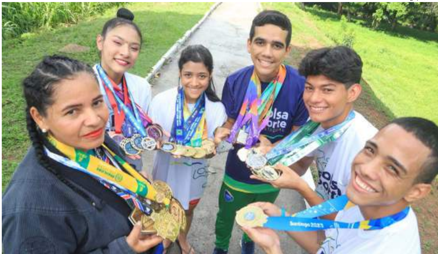
Atletas amazonense, patrocinados pelo governo, conquistam medalhas em competições internacionais

“O Bolsa Esporte é de extrema importância para o desenvolvimento e manu-