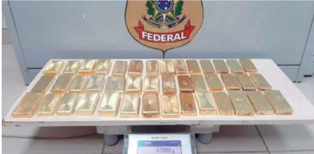
PMAM apreendeu uma carga com 42 barras de ouro ilegal

No local, os policiais militares visualizaram os dois carros parados na via. Funcionários da loja informaram que um dos envolvidos estava se escondendo dentro do estabelecimento e um dos homens teria fugido em direção a uma oficina no outro lado da Avenida das Torres. Os dois suspeitos foram pre-