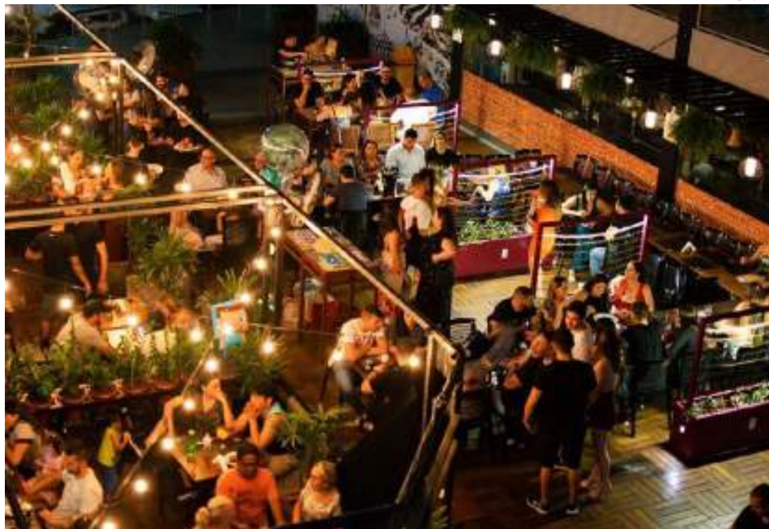
Setor prepara ações especiais para atrair confraternizações

“O final do ano é sempre um período com muitos eventos e confraternizações e isso, de uma maneira geral, aquece o setor