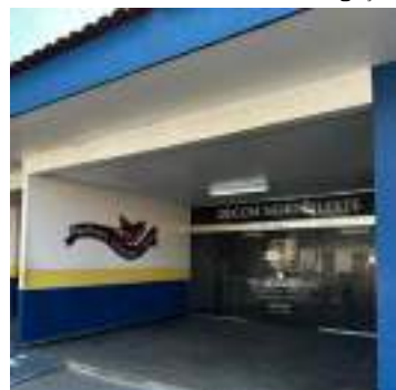
Homem foi preso por ameaçar e descumprir uma medida protetiva

Um homem de 49 anos foi preso, na segunda-feira (11), por ameaçar e descumprir uma medida protetiva concedida em favor de sua ex-companheira, de 44 anos. Ele foi encontrado no bairro Cidade Nova, Zona Norte de Manaus.