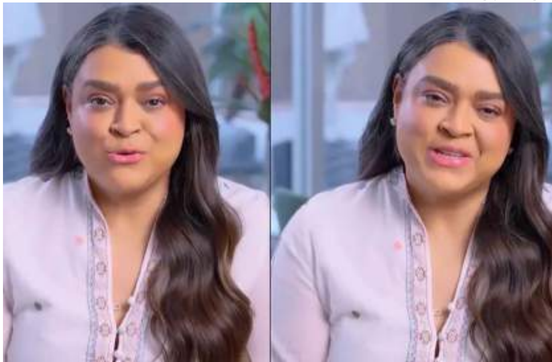
Cantora Preta Gil recebeu o diagnóstico de câncer no intestino no dia 10 de janeiro de 2023

A cantora Preta Gil publicou em sua conta no Instagram, nesta segunda-feira (11), o término do tratamento contra um câncer no intestino. Ela passou por uma reconstrução de parte do trato intestinal no Hospital Sírio-Libanês, na Zona Sul de São Paulo.