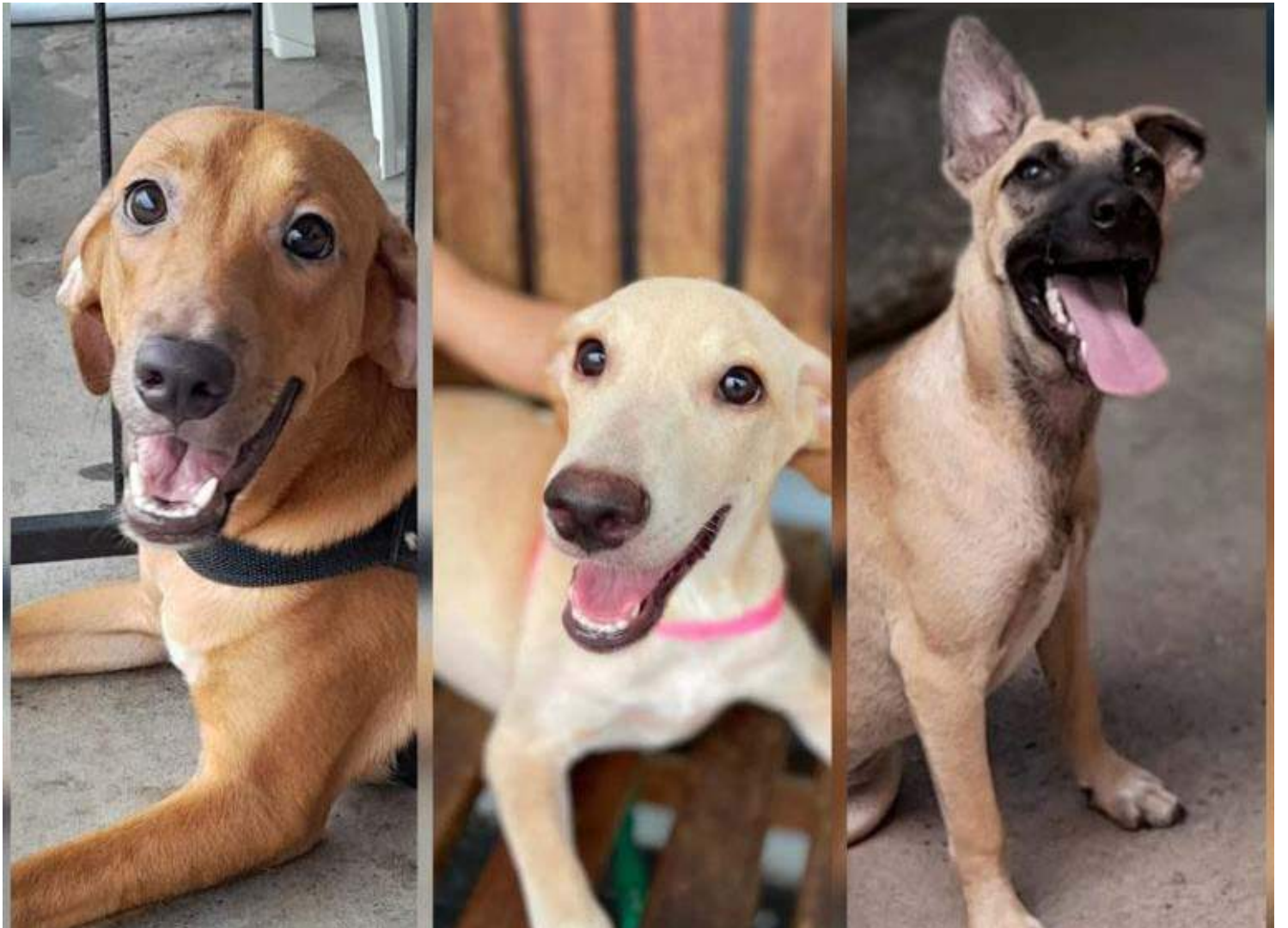
Evento vai reunir parceiros e a ONG OBA, para a realização de atividades direcionadas aos bichinhos

A diversão está garantida no evento. Empresas parceiras estarão presentes, distribuindo petiscos e realizando sorteio de brindes. Haverá também desfile Pet e os tutores podem usar e abusar da criatividade na apresentação do seu bichinho, usando, inclusive, fantasias. Na barraca do lambejo, haverá espaço para as fotos que, certamente, serão guardadas com muito carinho.