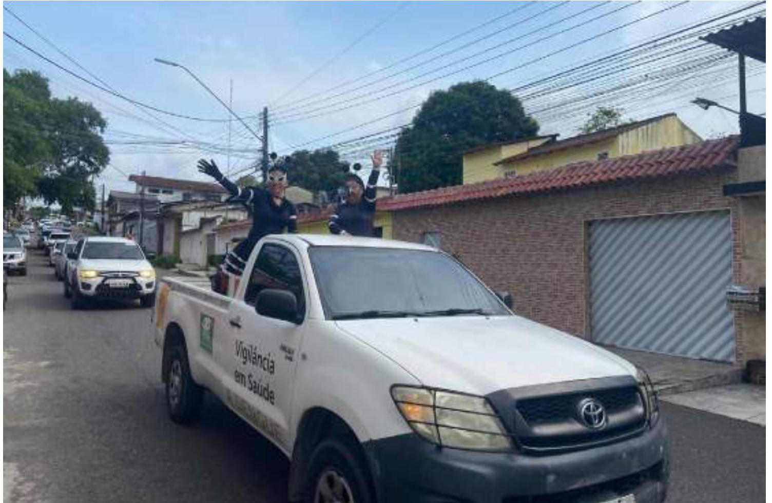
Participaram da ação representando a FVS-RCP e outros órgãos