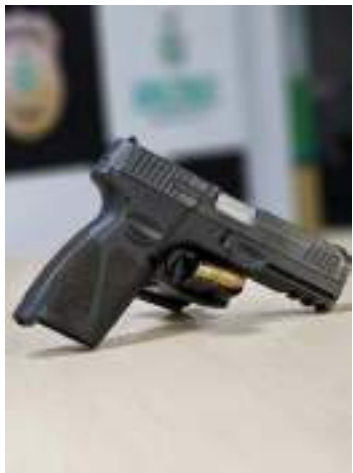
Homem foi preso com duas pistolas calibre 9 milímetros e 30 munições