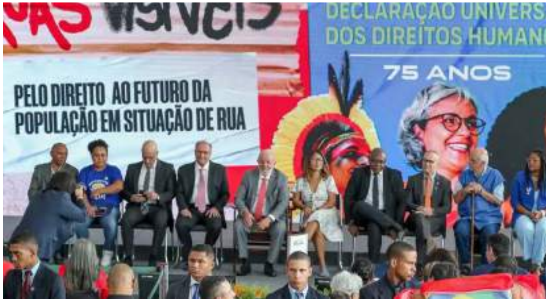
Assistência social e segurança alimentar terão R$ 575 milhões em verba

Para o presidente, a população deve estar comprometida em eleger governantes preocupados também com