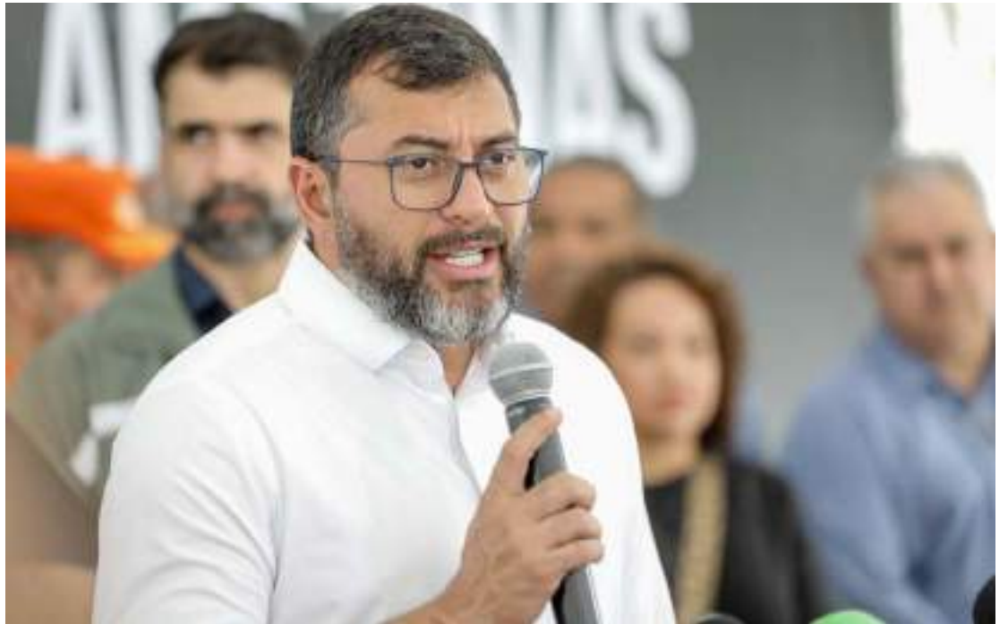
Governo do Amazonas conta com mais de 120 mil servidores, entre ativos, aposentados e pensionistas

O secretário da Secretaria de Estado de Administração e Gestão (Sead) e presidente do Conselho Nacional de Se-