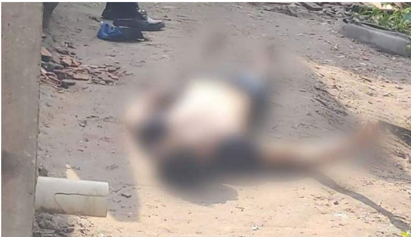
Homem foi encontrado morto com marcas de tiros no bairro Jorge Teixeira

Um homem, não identificado, foi encontrado morto com marcas de tiros, na manhã de segunda-feira (11), no beco Samambaia, bairro Jorge Teixeira,