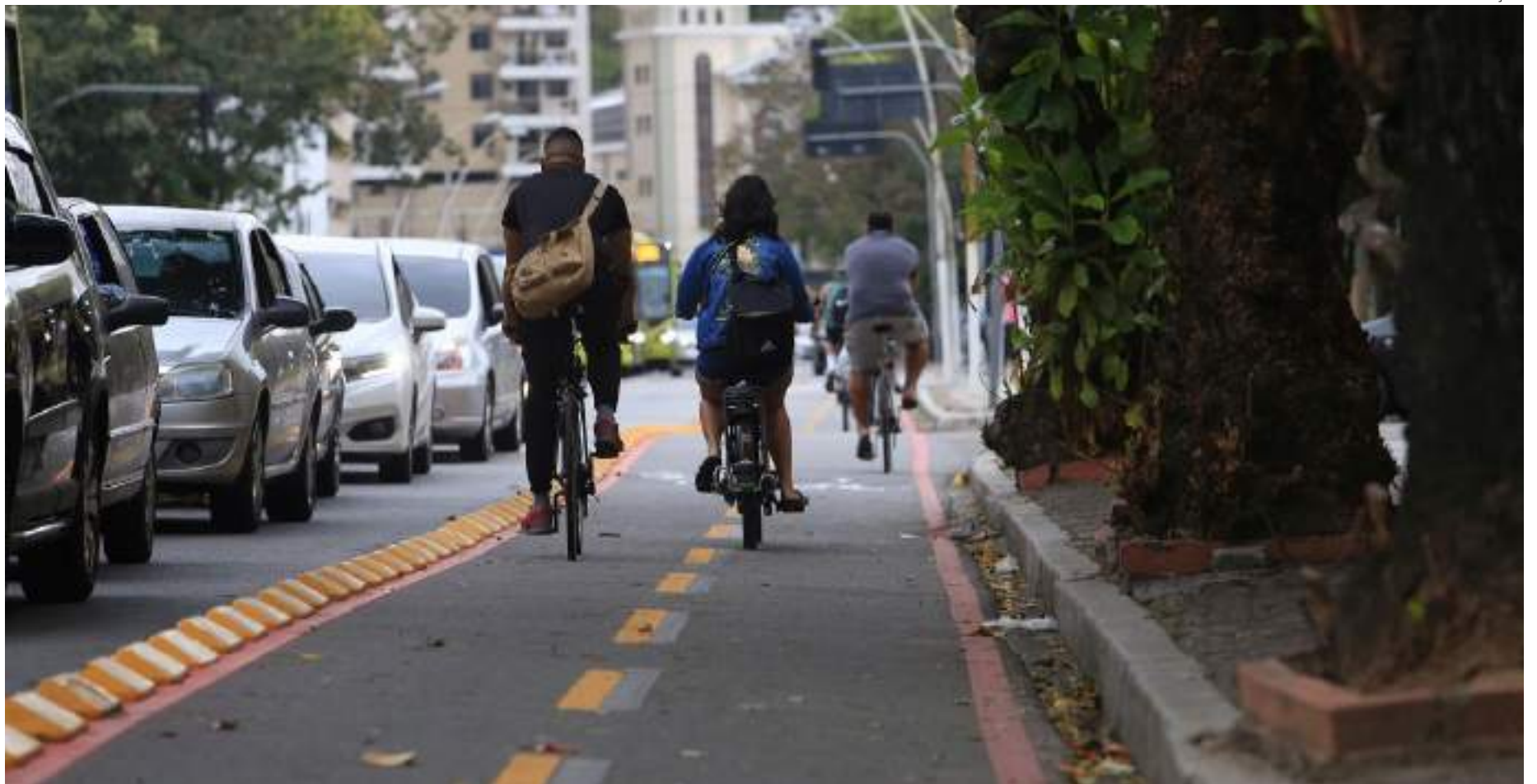
E-bikes surgem como uma alternativa inteligente e sustentável para contornar os problemas de mobilidade

solução prática para escapar da aglomeração nas avenidas e ruas congestionadas. Além de proporcionarem mobilidade ágil, as e-bikes contribuem para a redução das emissões de poluentes, promovendo um meio ambiente mais saudável.