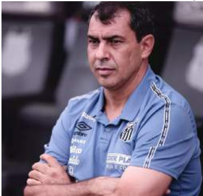
Carille vai comandar o Santos no Paulistão e na Série B do Brasileiro