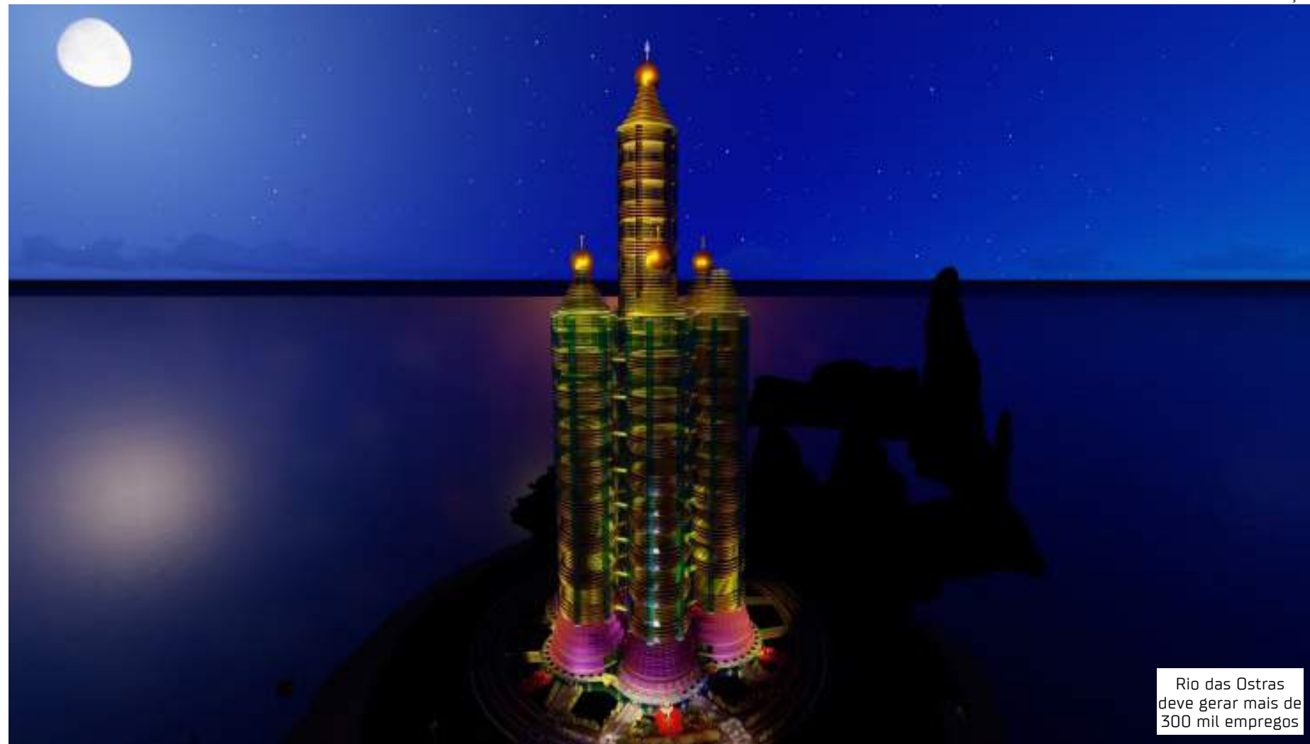
Rio das Ostras deve gerar mais de 300 mil empregos

"Nós temos o caribe brasileiro no Rio de Janeiro, precisamos aproveitar. Eu já enviei uma apresentação