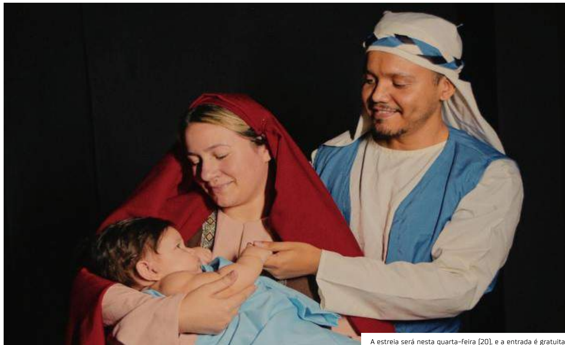
A estreia será nesta quarta-feira (20), e a entrada é gratuita

'A Canção de Natal' terá uma sessão por dia, de quarta-feira (20) a sábado (23), às 19h30, e duas sessões no domingo (24/12), às 10h e às