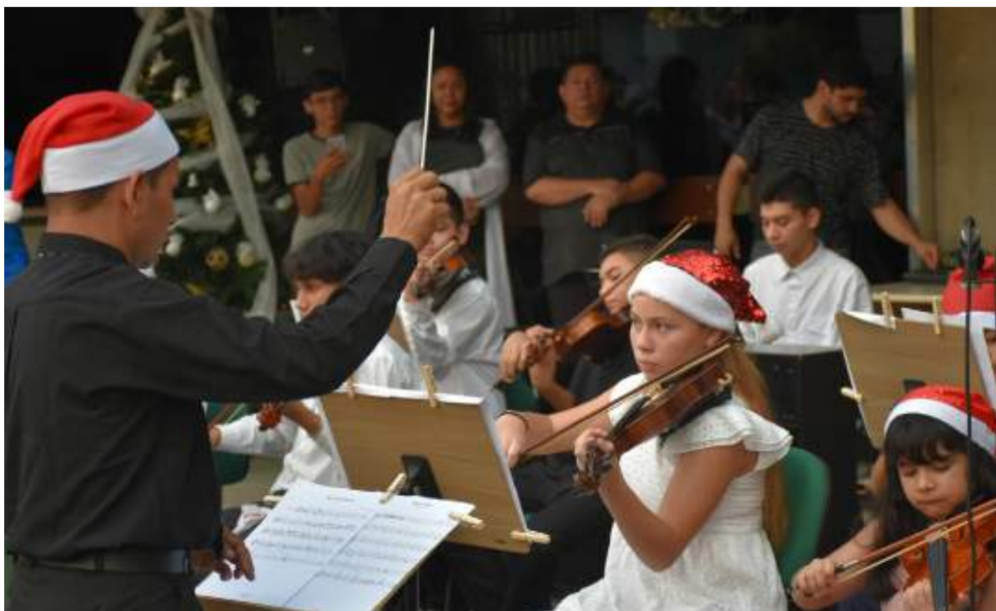
Apresentação é uma ação de extensão universitária desenvolvida por professores e alunos