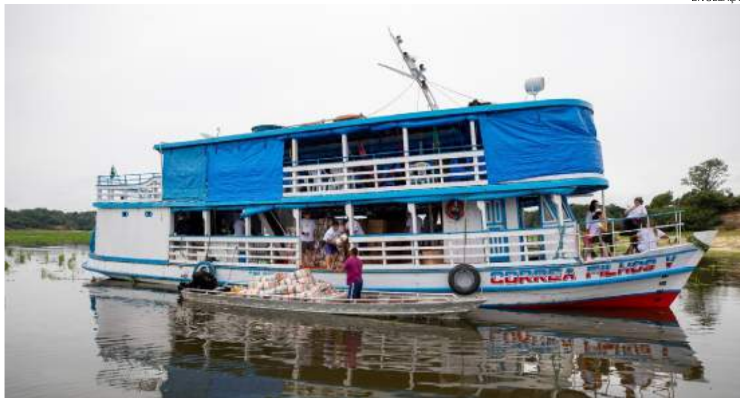
Em 2023, o Amazonas foi impactado pela maior estiagem já registrada na história das medições

Neste período de seca severa, as ações do Arpa também incluíram apoio direto às populações tradicionais, com a aquisição das cestas e dos kits, comprados com recursos do programa, financiado por doadores nacionais e internacionais. A Sema ofereceu apoio logístico para a entrega do material.