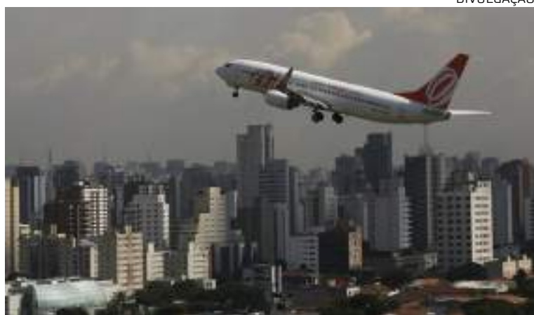
Governo Federal faz pressão

Os observadores do setor estão céticos quanto ao quanto isso mudará a tarifa aérea média no país, atualmente em torno de R$ 750, a mais alta desde 2009, de acordo com dados da Agência Nacional de Aviação Civil (Anac).