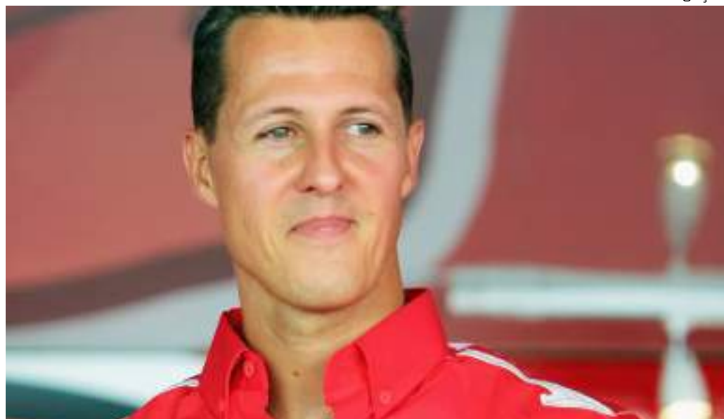
Michael Schumacher está em coma profundo desde que sofreu acidente em esqui