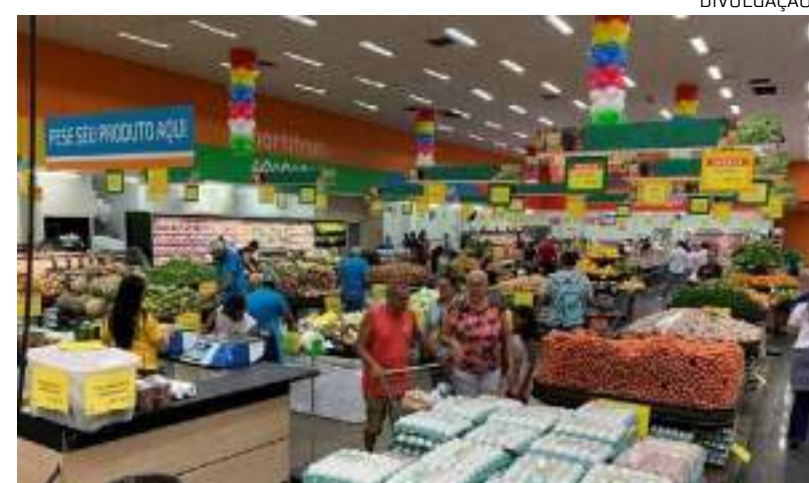
Lojas funcionarão de forma ininterrupta por mais de 35 horas