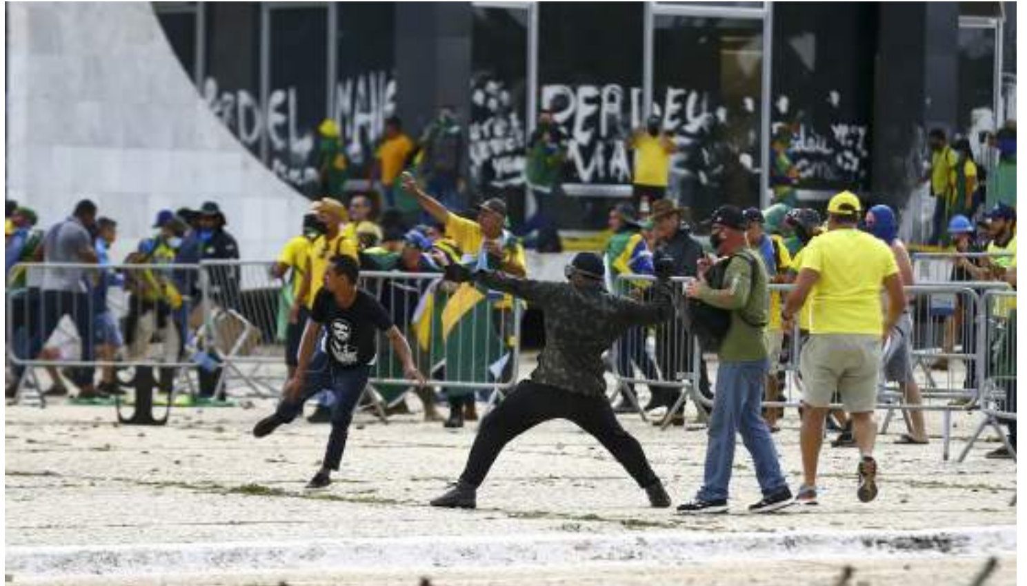
Envolvidos em atos golpistas no dia 8 de janeiro não terão benefício de indulto natalino

A medida veta a aplicação do benefício a integrantes de facções criminosas, a condenados por terrorismo, tortura, milícia privada, lavagem de dinheiro, crimes de preconceito de raça ou cor e genocídio, redução à condição análoga à de escravo, de licitação e contra o sistema financeiro