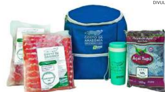
Público encontra quatro opções de kits com produtos da Asproc

A Associação dos Produtores Rurais de Caruaru (Asproc) foi criada em 1994 pelo movimento de extrativistas da região do Médio Juruá, com a missão de comercializar de forma justa a produção local, com foco na produção sustentável e no desenvolvimento econômica, social e ambiental na região do Médio Juruá, Amazonas.