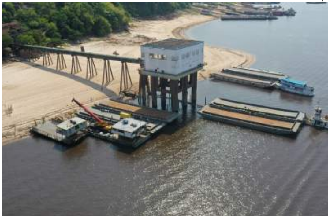
Águas de Manaus traçou estratégias com interligação de sistemas e disponibilização de balsas, por exemplo

"O período de verão amazônico de 2023 trouxe