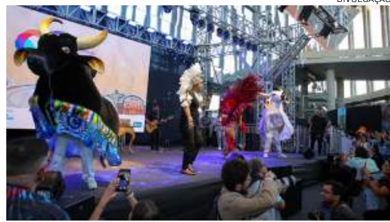
Amazonas ganhou destaque durante discurso do ministro do Turismo