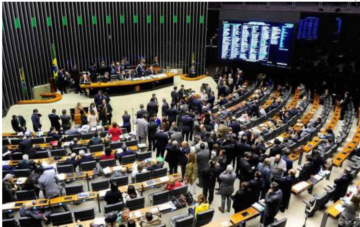
Texto também prevê o valor máximo de R$ 4,9 bilhões para o Fundo Especial de Financiamento de Campanha

A LDO define as diretrizes para a elaboração do Orçamento. O Congresso ainda precisa aprovar a Lei Orçamentária Anual (LOA), com deliberação prevista para a próxima quinta-feira (21).