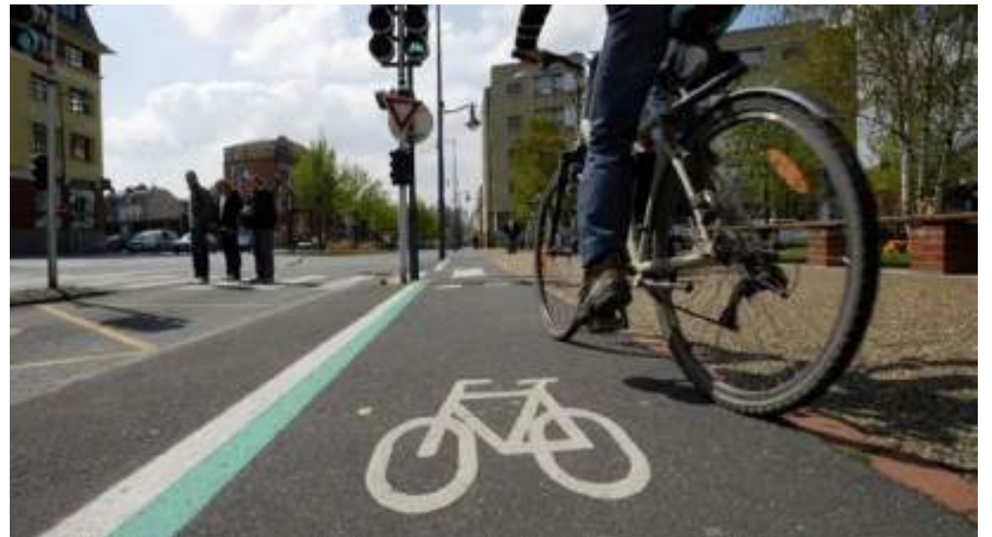
Bicicletas para deslocamentos urbanos

ser a melhor alternativa para deslocamentos urbanos de curta e média distância, levando sustentabilidade e qualidade de vida aos usuários das e-bikes, contribuindo para a solução dos congestionamentos e efetuando zero emissões de CO 2 na atmosfera.