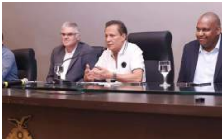
Um dos objetivos do projeto é ter o empreendedorismo como base na educação