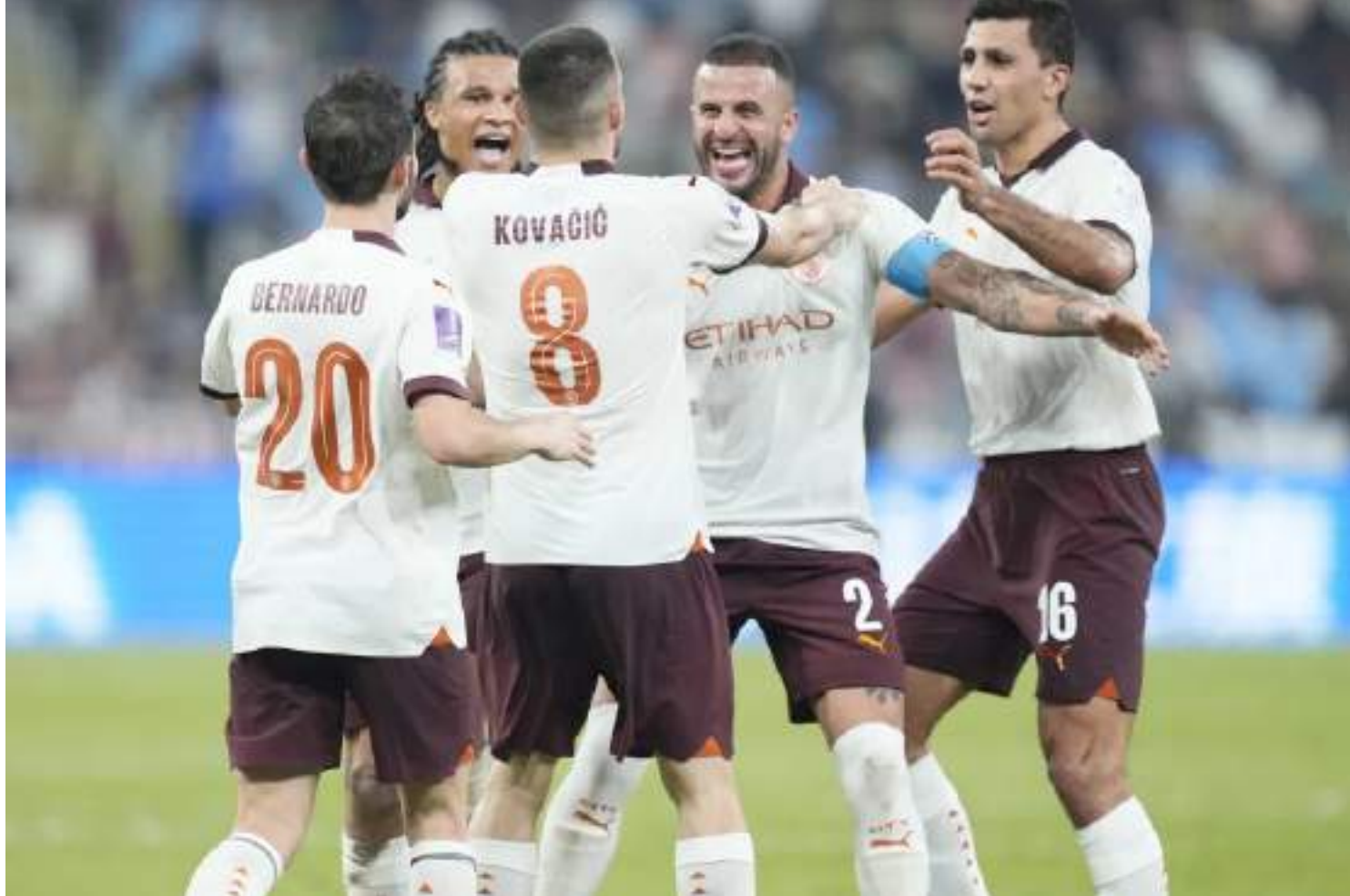
Jogadores do Manchester City fazem festa ao conquistar vaga na final do Mundial de Clubes