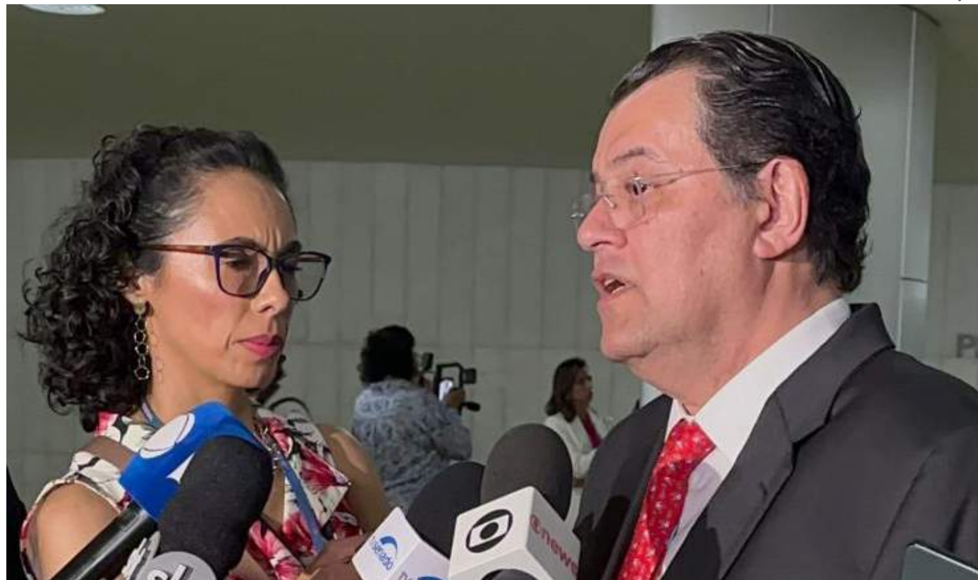
Relator da reforma destacou o processo democrático que resultou na promulgação

"Há uma redução do número de impostos, há uma simplificação, mais transparência, segurança jurídica, além da não cumulatividade para o setor industrial e para a exportação, o que vai dar muita competitividade para a nossa indústria, para que o produto industrial brasileiro volte a ter mercado internacional, o que gerará muitos