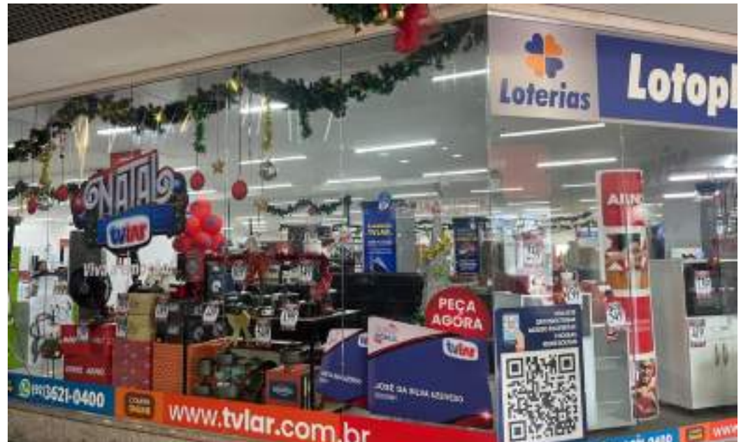
Grupo TVLar está oferecendo descontos especiais e dando presentes para os clientes

A campanha de Natal vai até o dia 31 de dezembro.