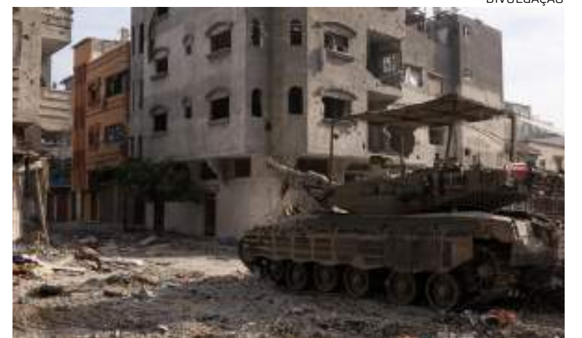
Ataque israelense resultou na morte de financiador do Hamas