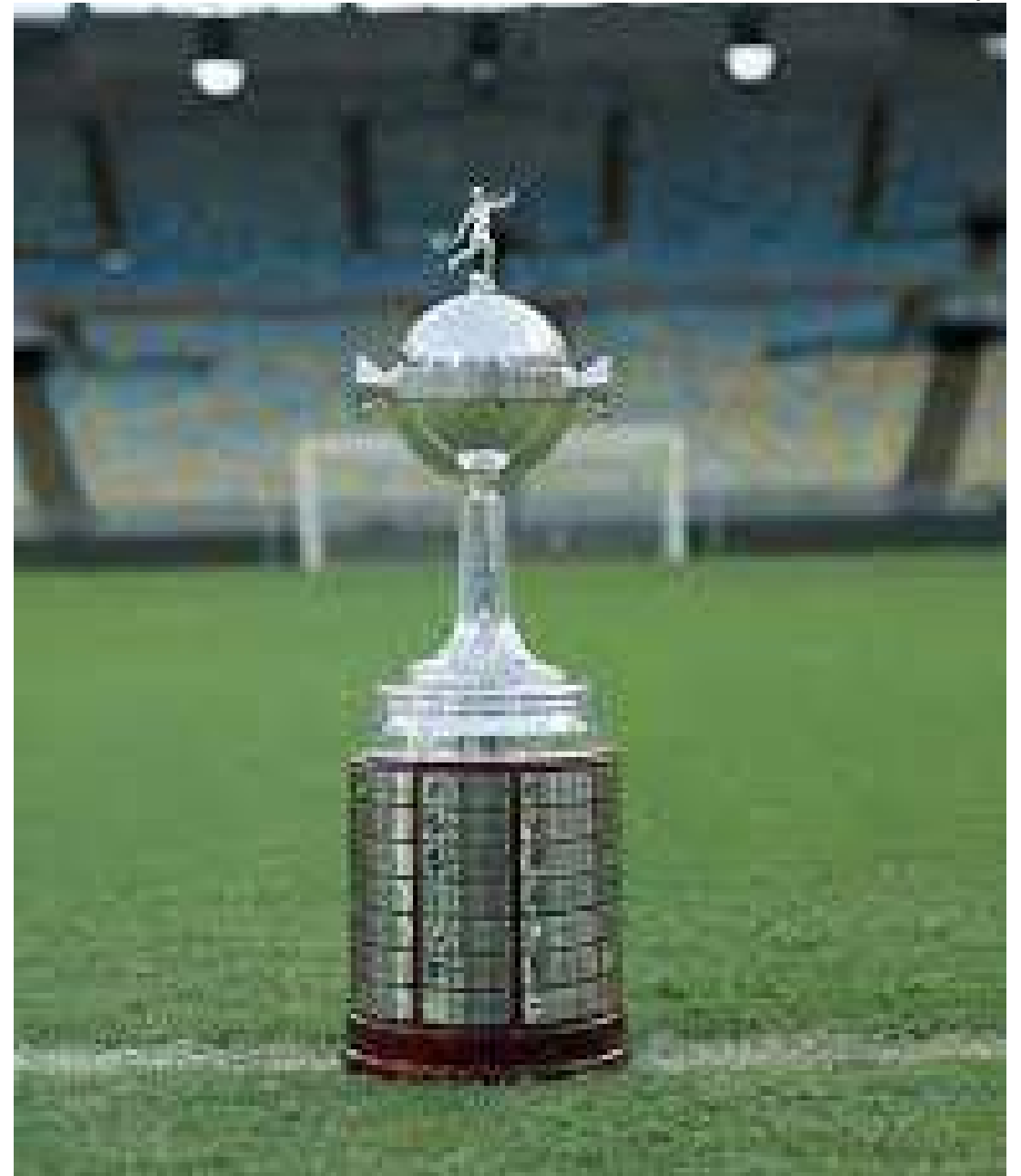
Brasil terá oito representantes na Copa Libertadores da América de 2024

· Fase eliminatória: 07/02 a 13/03 · Fase de grupos: 03/04 a 29/05 · Mata-mata: 14/08 a 30/10 · Final: 30/11/2024.