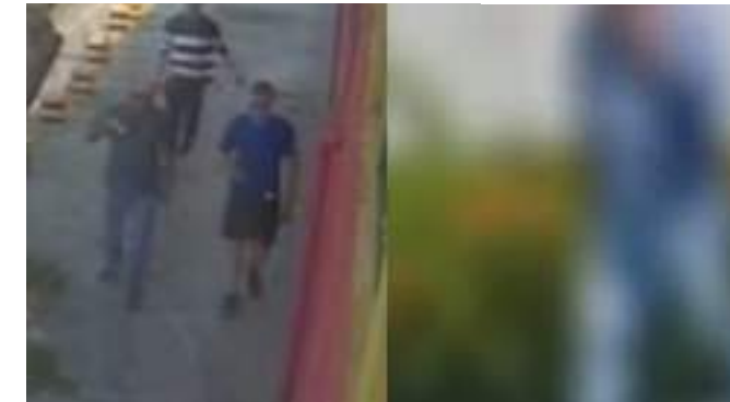
Israel está preso e ficará à disposição da Justiça