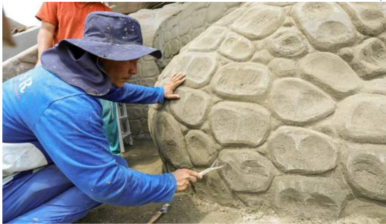
Parte de estrutura e concreto armado estão finalizados e as onças pequenas estão 95% executadas

Prevista para ser entregue em 2024, como presente para os manauaras, a etapa cênica e de área molhada do espaço tem seu primeiro cenário quase concluído. Com onças grandes, tronco e rampas, a parte de estrutura e concreto armado estão finalizados e as onças pequenas estão 95% executadas. O projeto é do Instituto Municipal de Planejamento Urbano