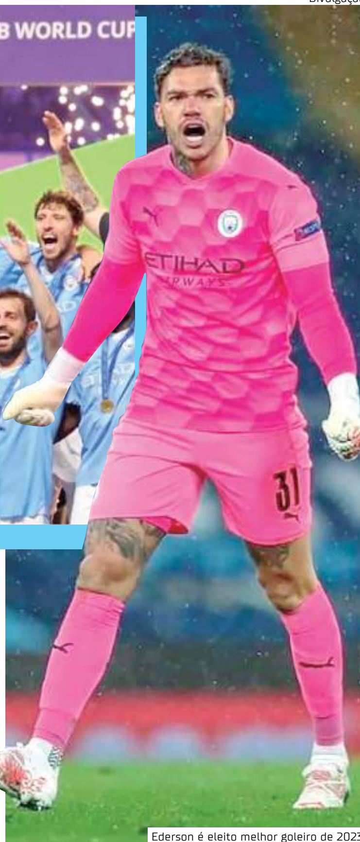
Ederson é eleito melhor goleiro de 2023

O primeiro título internacional da história do Manchester City foi a Recopa da UEFA de 1969. O torneio contava com os campeões das taças nacionais dos países europeus, e o City bateu o Górnik Zabrze na decisão.