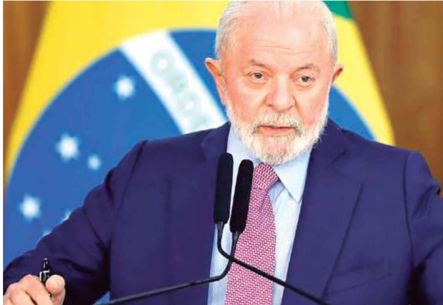
Detalhes das ações do governo federal no setor ainda não foram divulgadas

Segundo o decreto, a iniciativa deverá contar com o compartilhamento de informações entre União, estados e municípios, além