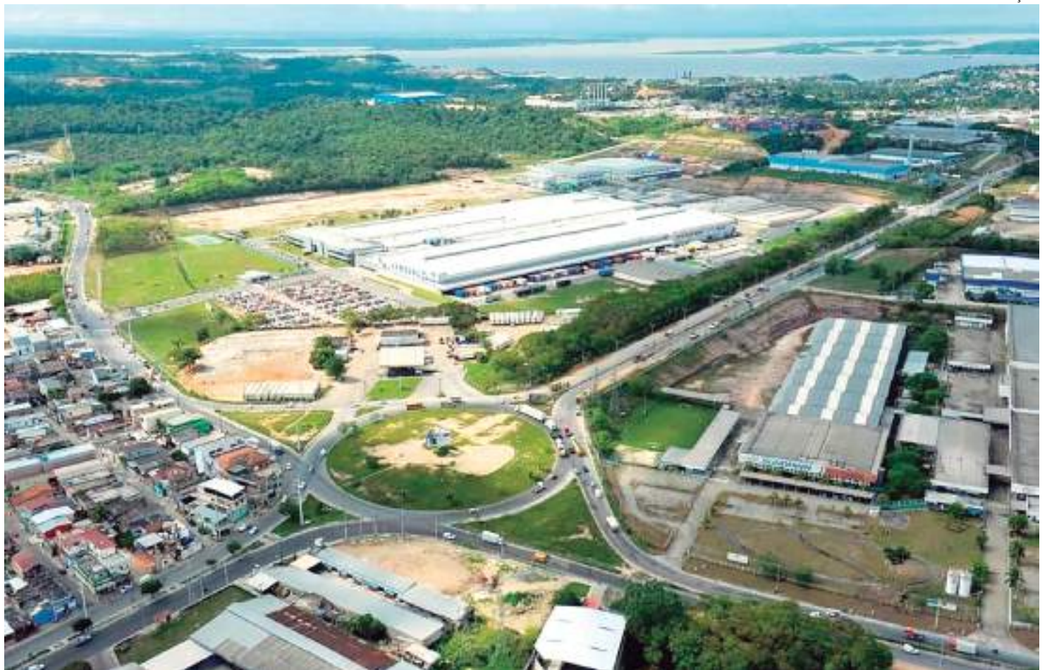
Reforma tributária manteve o diferencial competitivo do parque industrial no Amazonas

A cidade também enfrentou ondas de fumaça causadas por