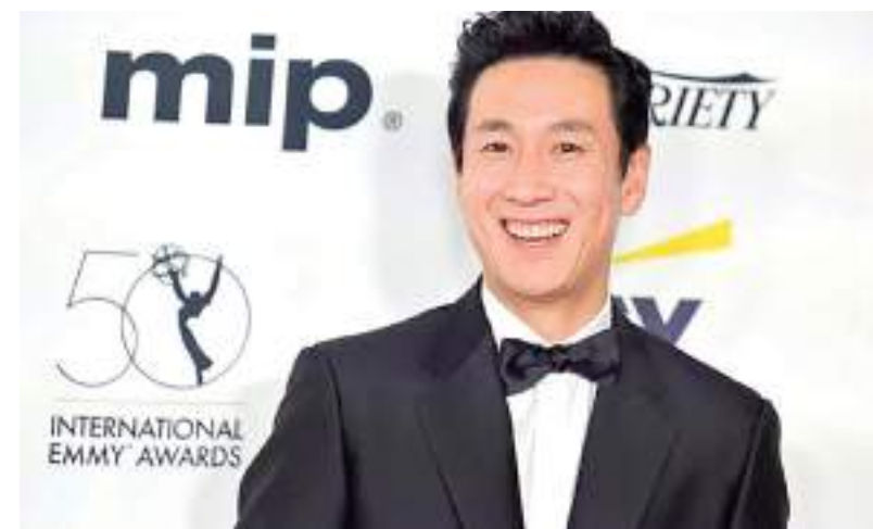
Ator Lee Sun-kyun durante a premiação do Emmy, em 2022