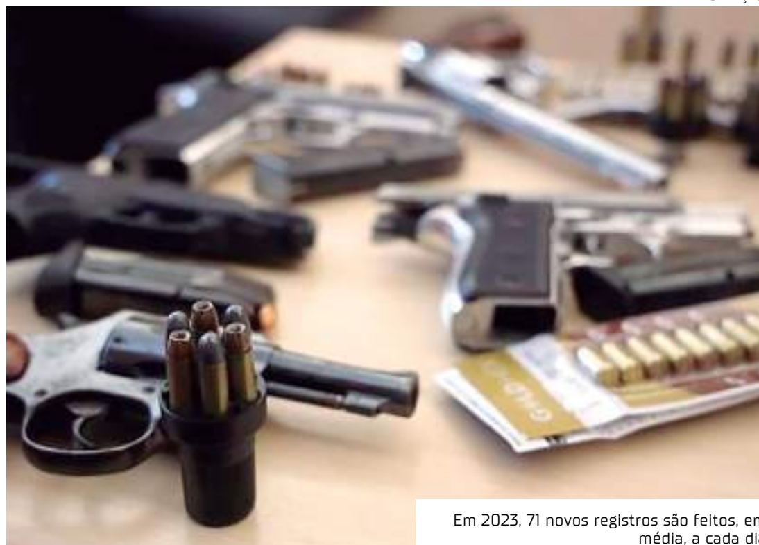
Em 2023, 71 novos registros são feitos, em média, a cada dia

O decreto, aprovado em maio de 2019, ficou ativo