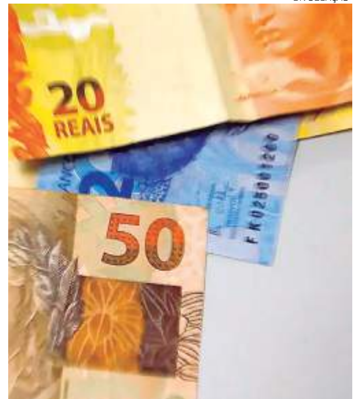
Valor terá um aumento de R$ 92 em relação ao atual

Os dados são do Índice de Preços ao Consumidor Amplo (IPCA), a inflação oficial do país calculada pelo IBGE, divulgada no último dia 12. No geral, o país registrou alta de 0,28% em novembro, sendo que o grupo "alimentação no domicílio" subiu 0,75%. No ano, contudo, os preços da alimentação no domicílio caíram 1,83%.