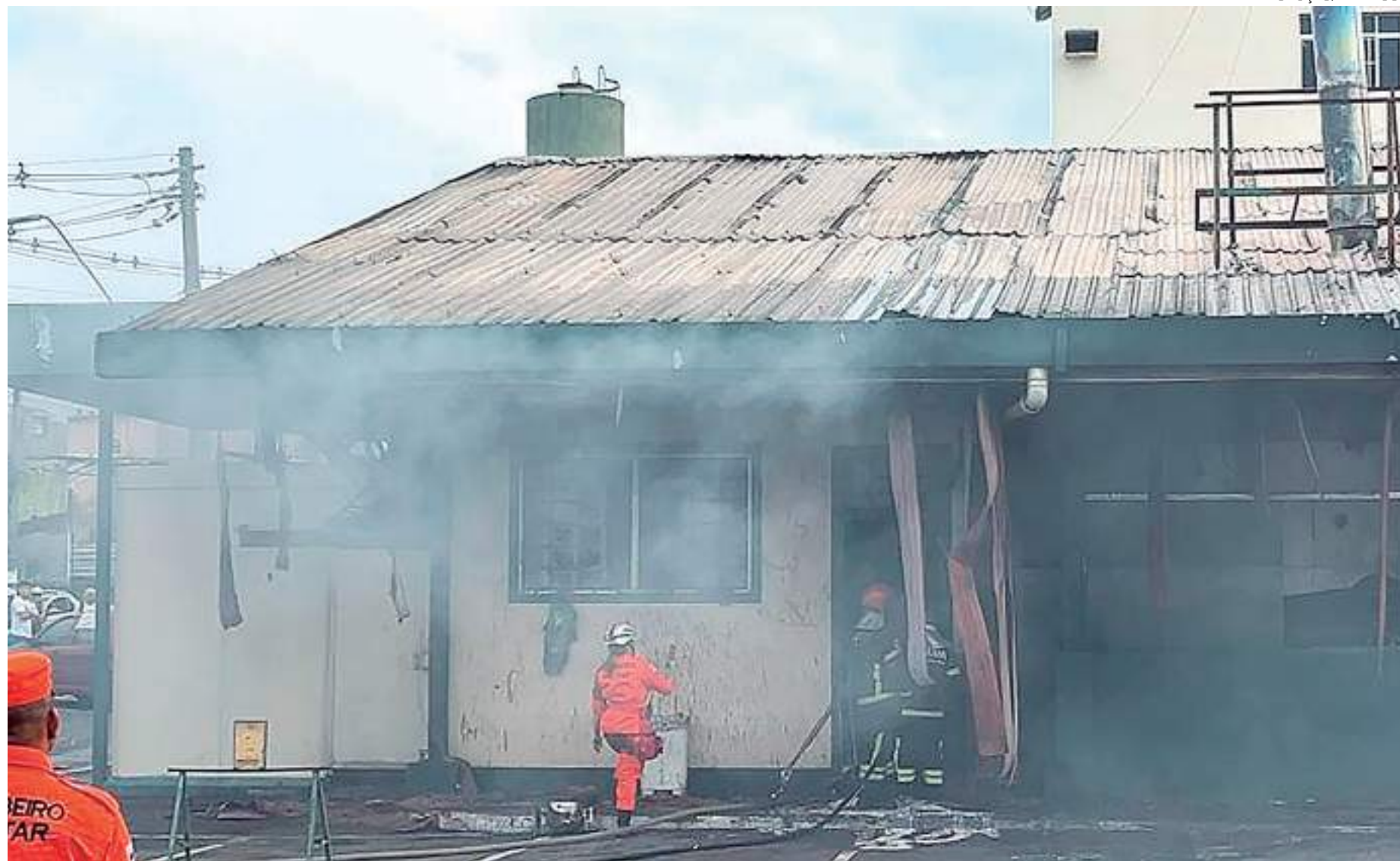
Chamas iniciaram na área da cozinha, mas devido ao rápido atendimento do Corpo de Bombeiros, o fogo não conseguiu se alastrar pelo resto do estabelecimento

Os policiais entenderam que, por ser muito forte a fumaça, eles estranharam. Em pouco tempo, começaram a aparecer chamas. Ao constatarem o anormal, eles acionaram o rádio da nossa equipe, nossa equipe chegou rápido, tinha muita chama, muito calor, e a temperatura alta fez com que o fogo se propagas-