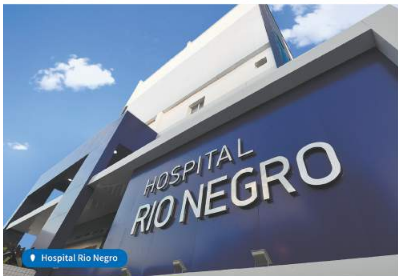
Hospital Rio Negro

Nosso propósito é oferecer acesso a uma saúde de qualidade, que traga conforto e segurança para a nossa gente através de uma rede própria e integrada. No Amazonas e no Brasil inteiro, é isso que nos une e nos motiva, todos os dias, ao atender mais de 15,8 milhões de clientes.