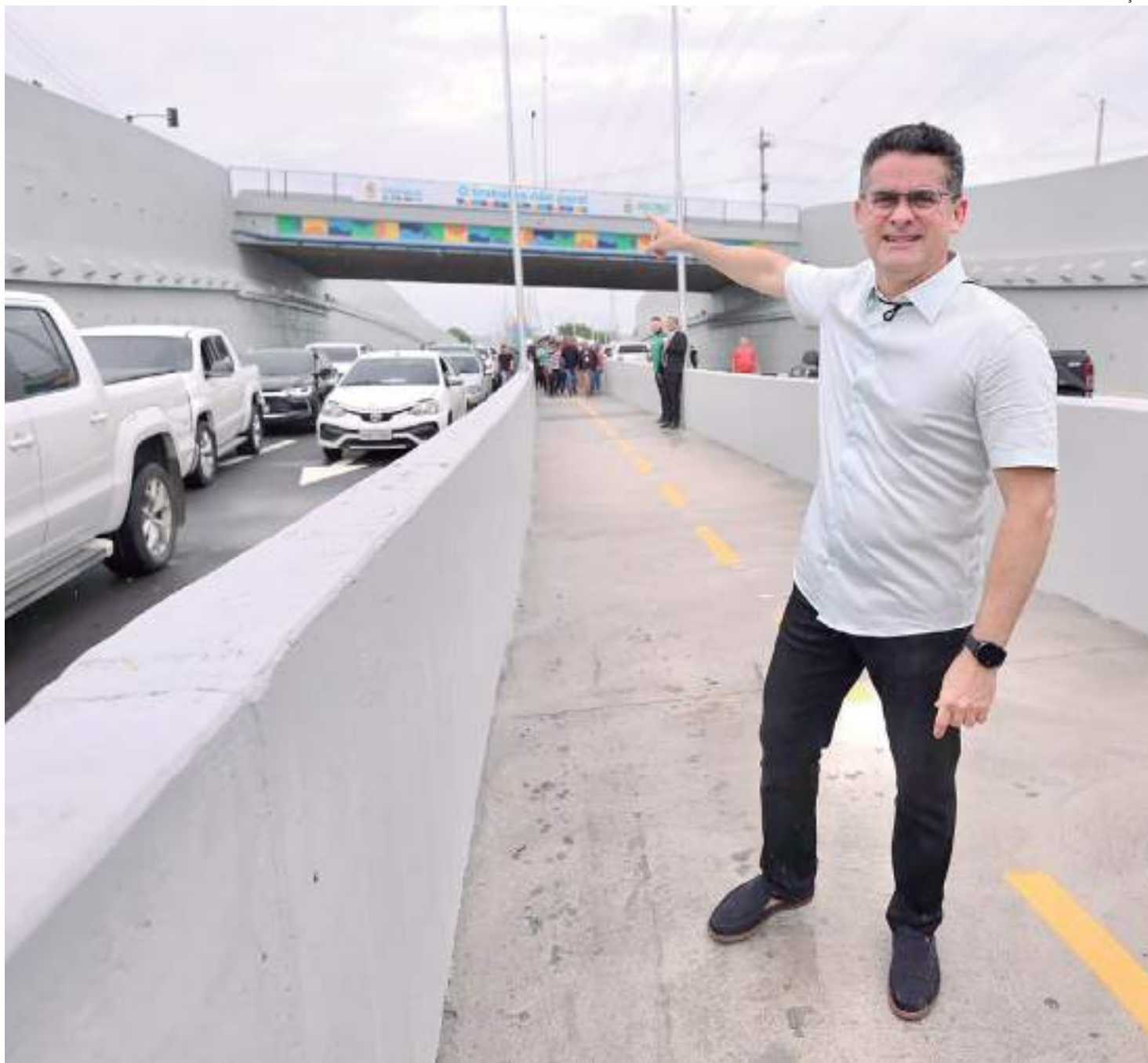
Houve geração de aproximadamente mil empregos diretos e indiretos na obra de conclusão do complexo viário José Fernandes

A avenida Barão do Rio Branco já está com trânsito liberado em ambos os sentidos. Além disso, a alça