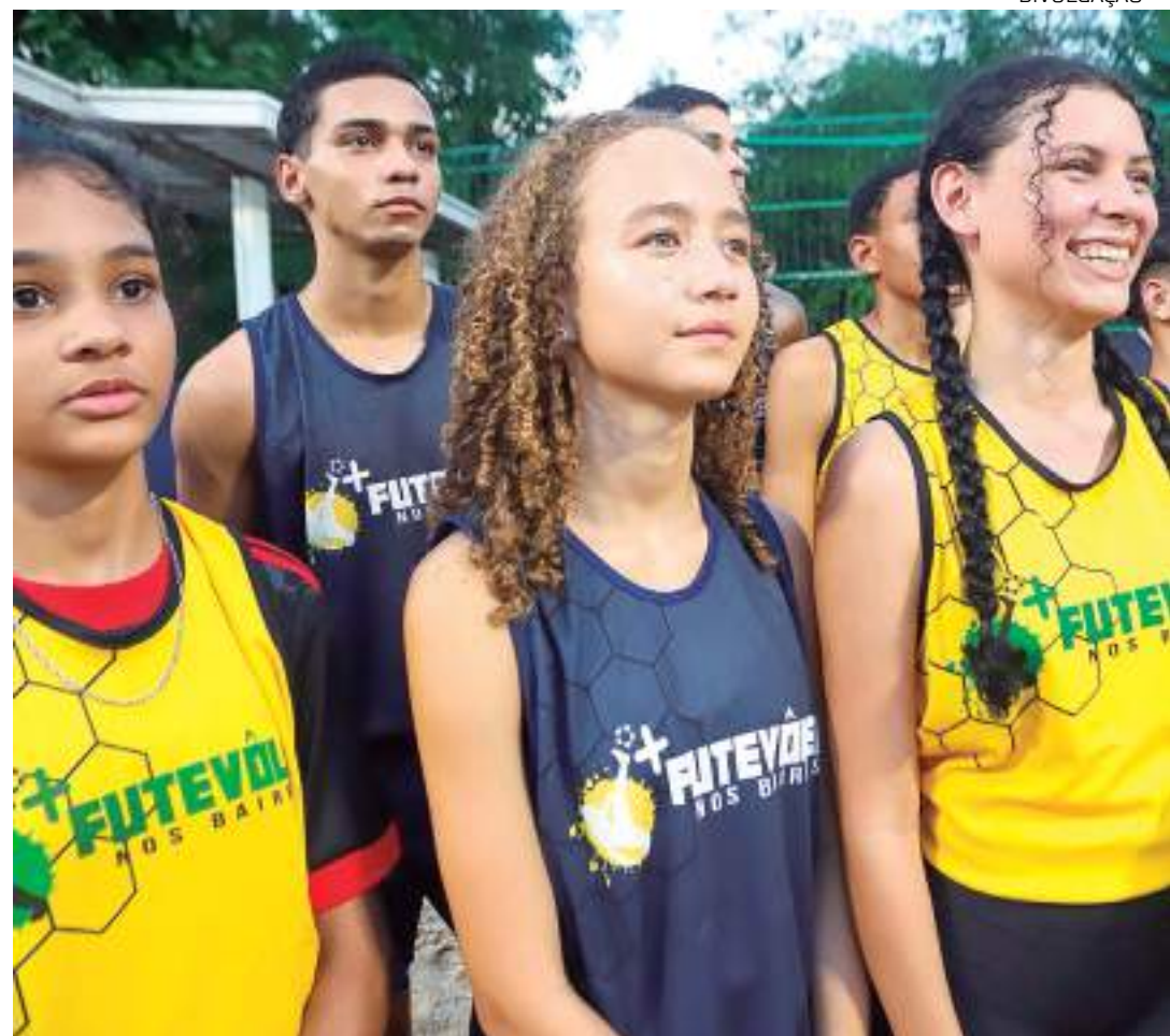
Programa de esporte e lazer ampliou atendimento a jovens de Manaus e do interior