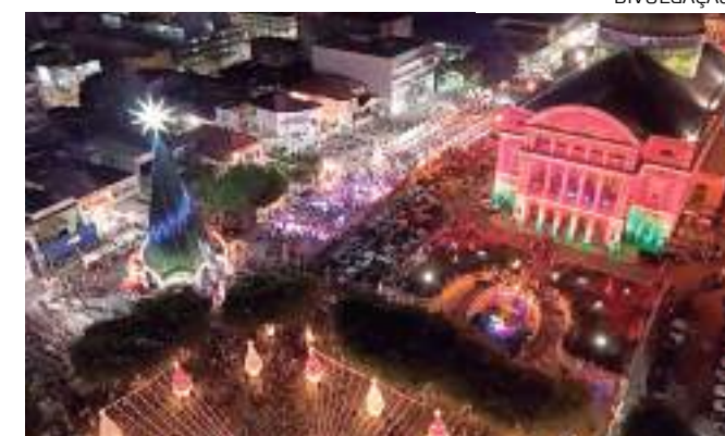
O evento de Ano Novo acontece pela primeira vez no Centro