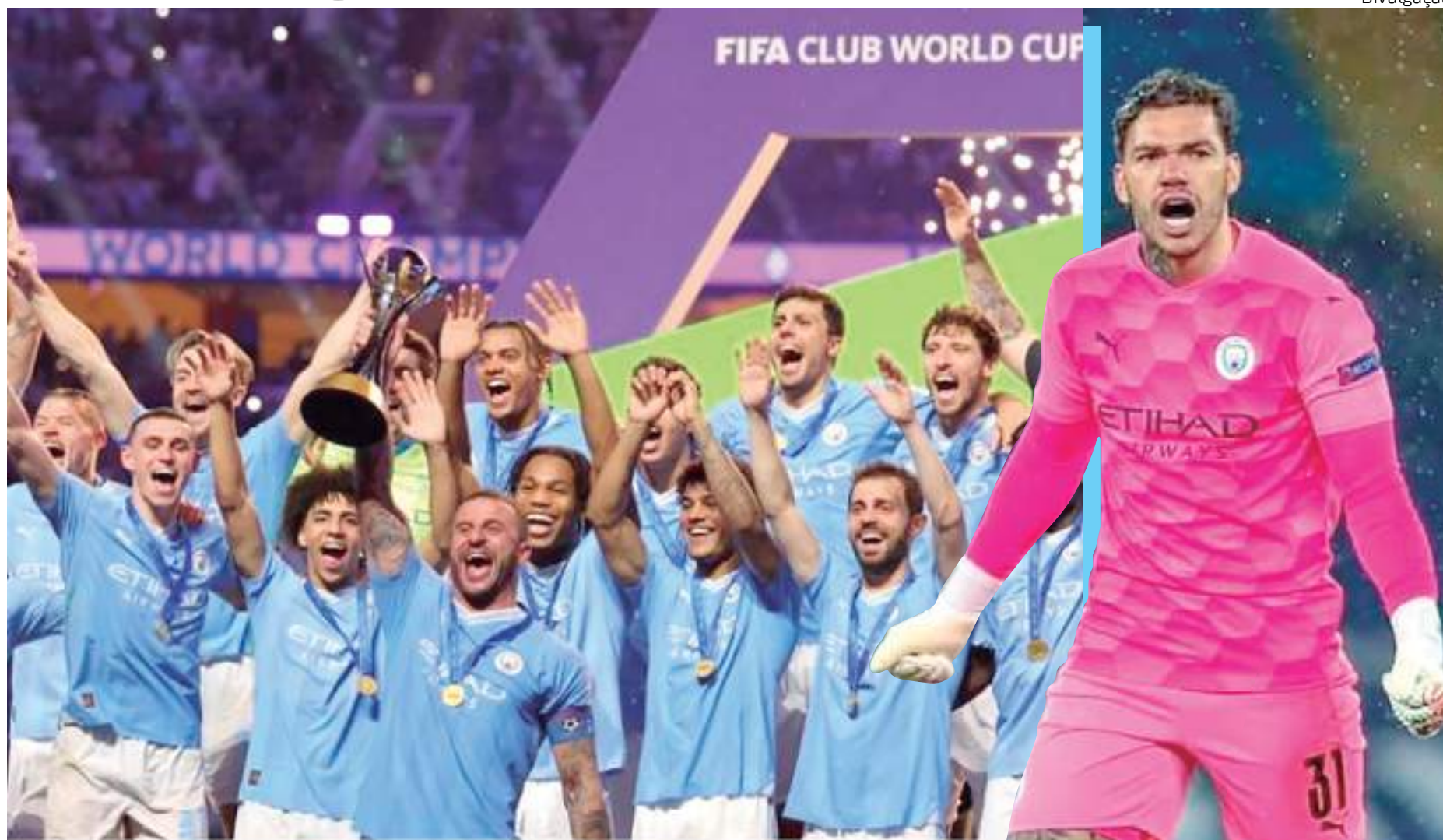
Manchester City foi campeão Mundial de Clubes de 2023

O Manchester City adicionou mais um troféu na sua coleção. Atual campeão da Liga dos Campeões, os citizens bateram o Fluminense na final do Mundial de Clubes de 2023 e conquistaram o primeiro título do torneio em