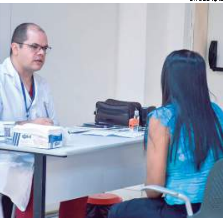
Consultas contemplam oito especialidades incluindo ortopedia e cardiologia

"Quando os poderes Executivo e Legislativo são harmônicos existe esse impacto na vida da população. No ano que vem vamos trabalhar e