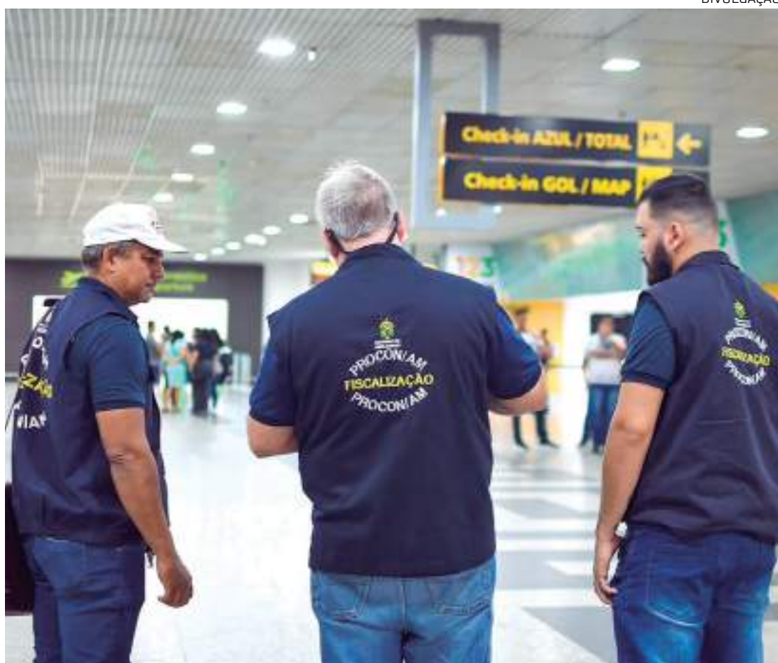
Órgão está à disposição para auxiliar os consumidores em questões relacionadas aos seus direitos

Fraxe ressalta que o Procon-AM está à disposição para auxiliar os consumidores em questões relacionadas aos seus direitos durante a compra de pacotes de viagens e hospedagem. "Nosso objetivo é assegurar que os consumidores tenham uma experiência tranquila