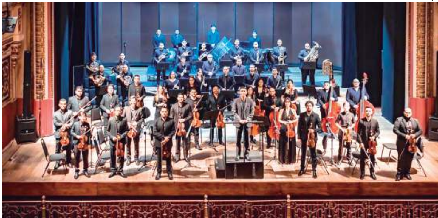
Obra é dividida em três movimentos: Brasileira, Jornada Etérea e Saudoso Carnaval

Conforme o compositor, apesar de ser um movimento lento, ele escolheu dar efervescência rítmica para gerar mais impacto na melodia. "A música tem algumas frases que escolhi fazer em uníssono, essas frases são como um grande lamento lacrimoso. A música termina bruscamente como um coração parando, o tímpano faz o som do coração e as madeiras fazem o bip da máquina que vai descompassando até fatalmente parar de bater",