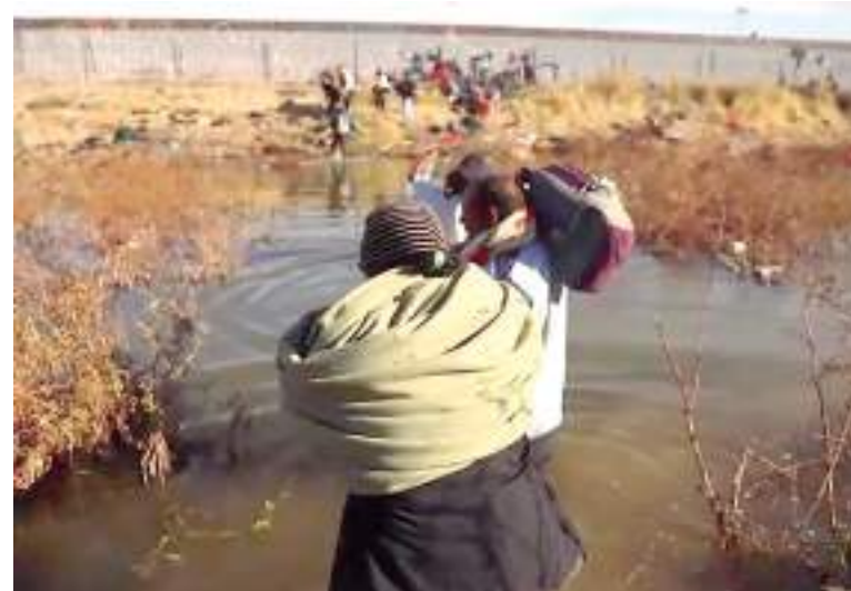
Imigrantes tentam cruzar a fronteira do México com os EUA

Contudo, ambos os países enfrentam dificuldades semelhantes, uma vez que o número de migrantes que atravessam o México excede os seus recursos.