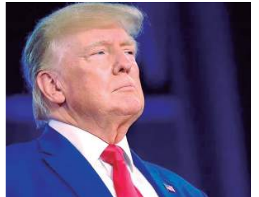
Ex-presidente dos EUA concorre a mais um mandato na Casa Branca em 2024