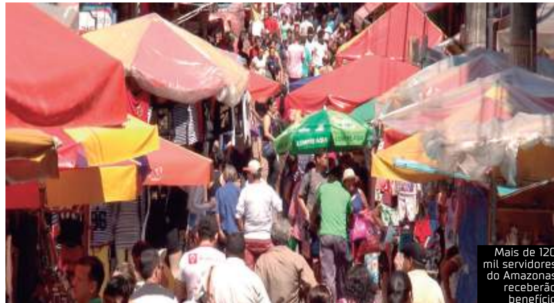
Mais de 120 mil servidores do Amazonas receberão benefício

Somando a segunda parcela do 13º (R$ 660 milhões) com a folha mensal de pagamento de dezembro (R$ 824 milhões), o Governo do Amazonas pagará, neste fim de ano, mais de R$ 1,4 bilhão aos funcionários públicos estaduais.