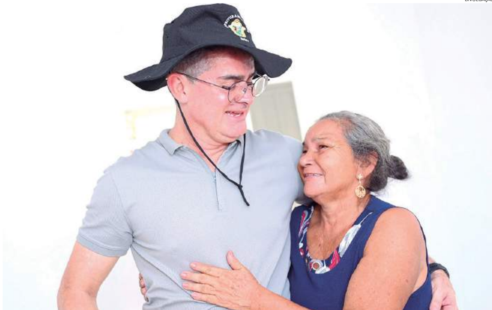
Durante o período da reforma, as famílias são inseridas no Auxílio-Aluguel, benefício liberado no valor de R$ 600

Coordenado por meio da Secretaria Municipal de Habitação e Assuntos Fundiários (Semhaf), o programa "Morar Melhor", vai contemplar as moradias com a reforma completa nas estruturas. Durante o período da reforma, as famílias são inseridas no Auxílio-Aluguel, benefício liberado no valor de R$ 600.