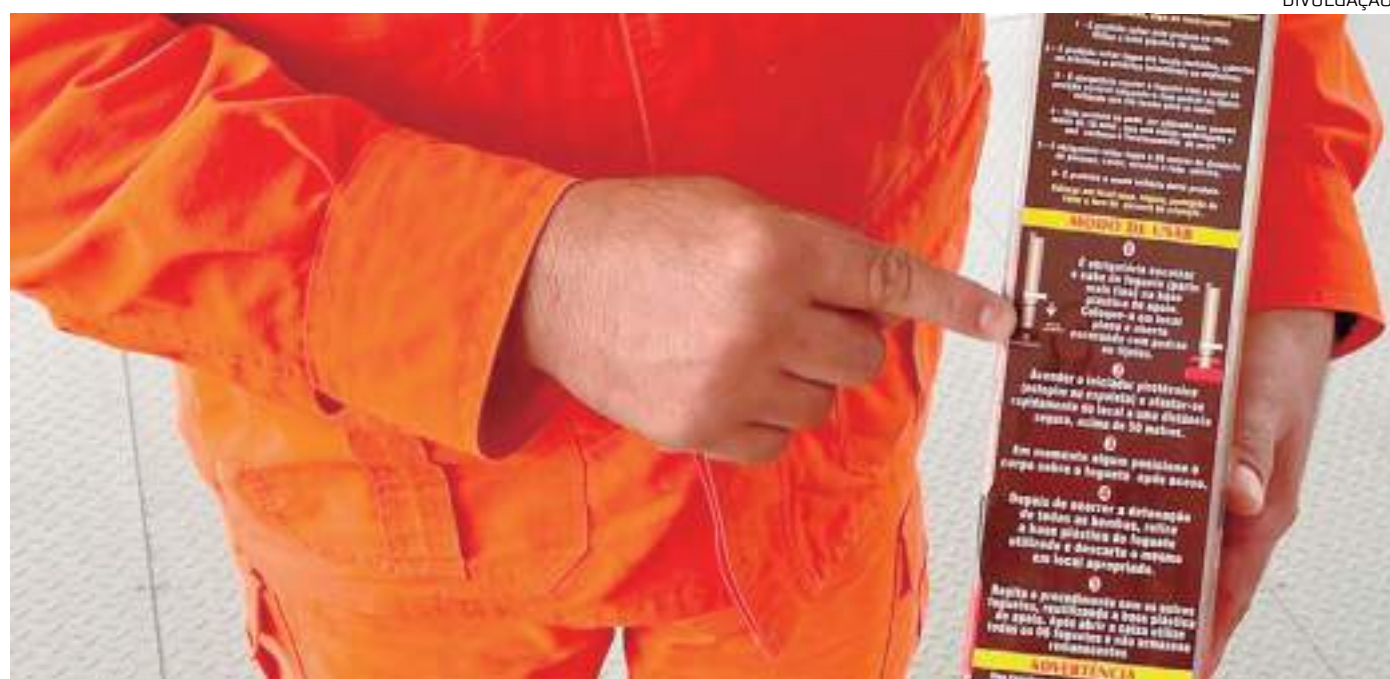
Cuidados na compra e manuseio do produto são essenciais para evitar acidentes

Com a chegada do período de festejos de fim de ano, o Corpo de Bombeiros Militar do Amazonas (CBMAM) orienta a população quanto aos cuidados que devem ser adotados durante a compra e manuseio de fogos de artifício. Medidas como adquirir o produto em lojas licenciadas para venda deste segmento e seguir as instruções de manuseio podem evitar ocorrências de acidente.