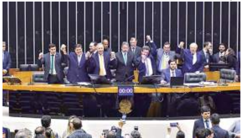
Aprovação na Câmara só foi possível com a costura de muitos acordos