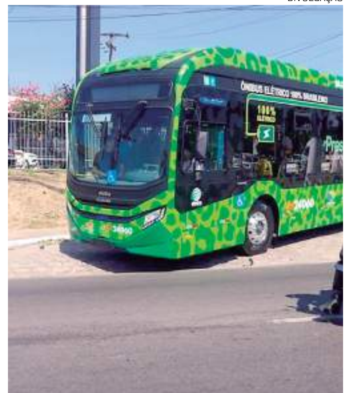
Serviço de Wi-Fi já tem 618 mil usuários ativos

Desde o mês passado, a prefeitura oferece a opção de solicitar o cartão "PassaFácil" e fazer a retirada nos terminais de integração. Além do serviço "PassaFácil delivery", já existente, é possível escolher a retirada do cartão, em até 24 horas, em um dos terminais de integração da capital, sem custo adicional de entrega. O atendimento é realizado pela assistente virtual do Sinetram, a Sindy, por meio do WhatsApp (92) 98444-4412, na opção 2 (Emissão de segunda via do cartão PassaFácil) ou opção 4 (Emissão de primeira via do cartão).