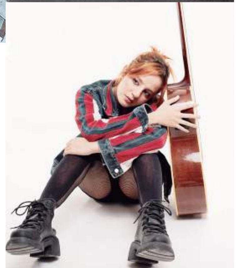
Em 2023, Cella também lançou o EP "Relatos de alguém que não fui"

A dramaturgia do musical é embalada por canções clássicas do repertório da cantora, como "Alô, alô marçiano", "Erva Venenosa" e "Doce Vampiro". A partir do universo lúdico e disruptivo da lírica de Rita, a narrativa aborda a rebeldia de uma juventude que rompeu paradigmas e quer ser fonte de inspiração para que cada espectador faça sua própria revolução pessoal.