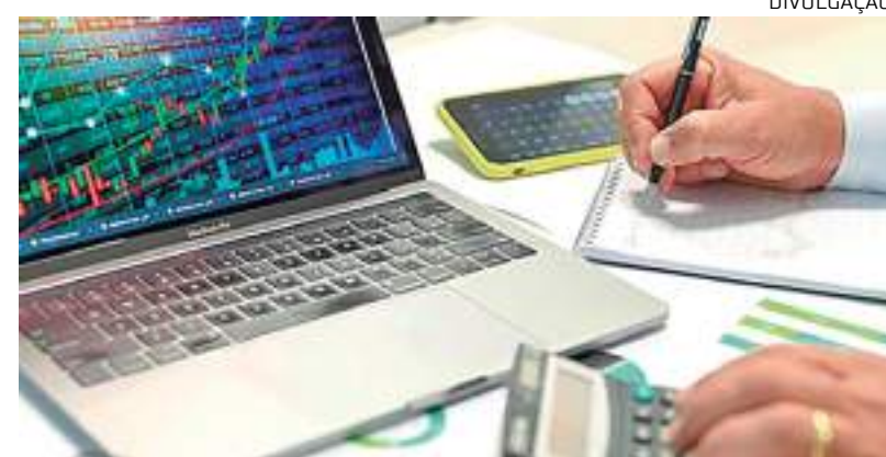
Empresários do setor mostram otimismo para os próximos seis meses