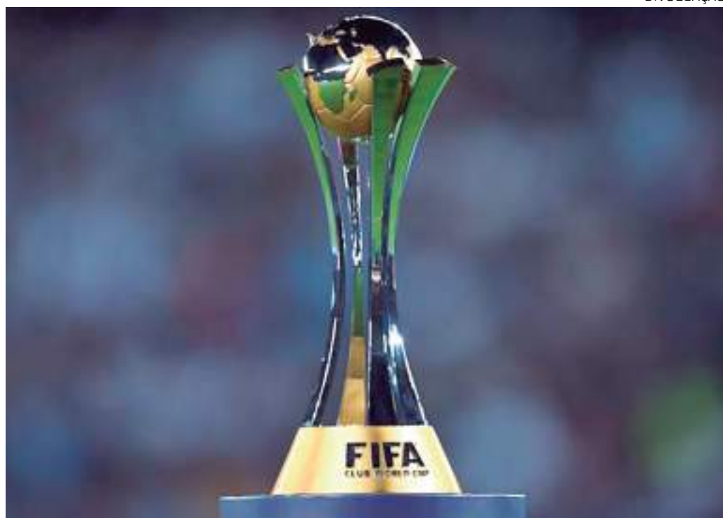
Mundial de Clubes vai iniciar em junho de 2025 e terminará no dia 13 de julho