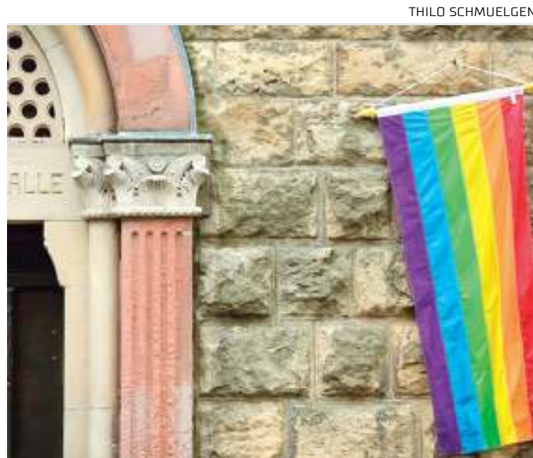
Bandeira LGBTQ+ do lado de fora de igreja em Cologne, na Alemanha

Em 2021, o Vaticano reiterou sua opinião de que a homossexualidade é um "pecado" e de que casais do mesmo sexo não podem receber o sacramento do matrimônio.