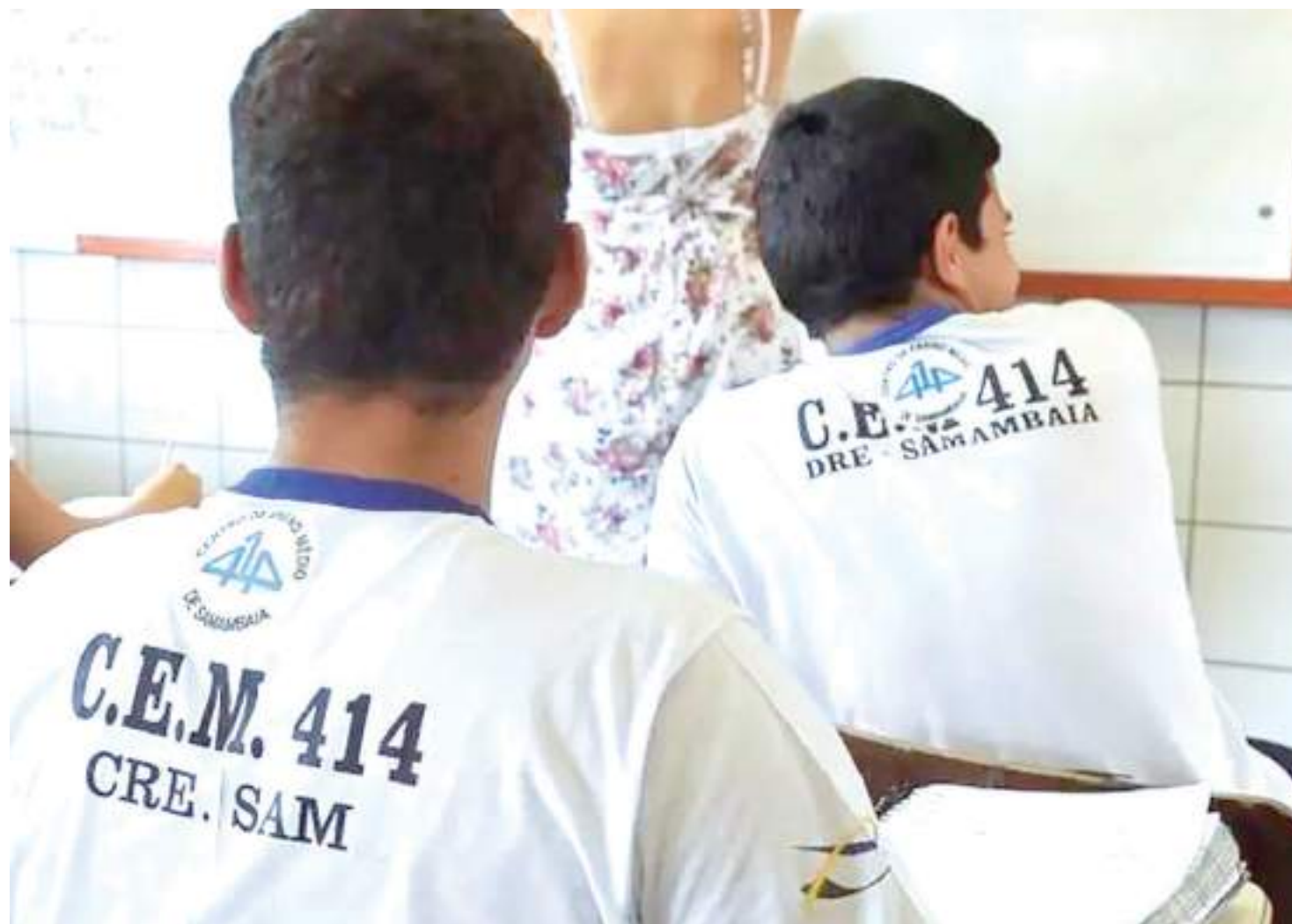
Dados divulgados são apenas uma parte da pesquisa cujo relatório final deverá ser concluído em janeiro de 2024

Os resultados mostram que 56% dos estudantes, 76% dos docentes e 66%