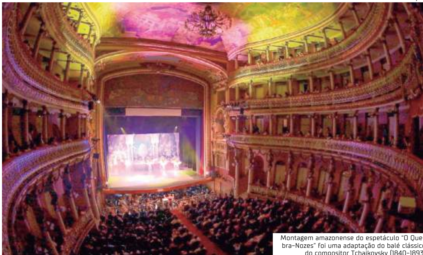
Montagem amazonense do espetáculo "O Quebra-Nozes" foi uma adaptação do balé clássico do compositor Tchaikovsky (1840-1893)