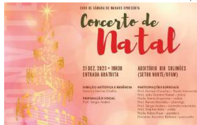
Espetáculo acontece no auditório Rio Solimões, no setor Norte do Campus