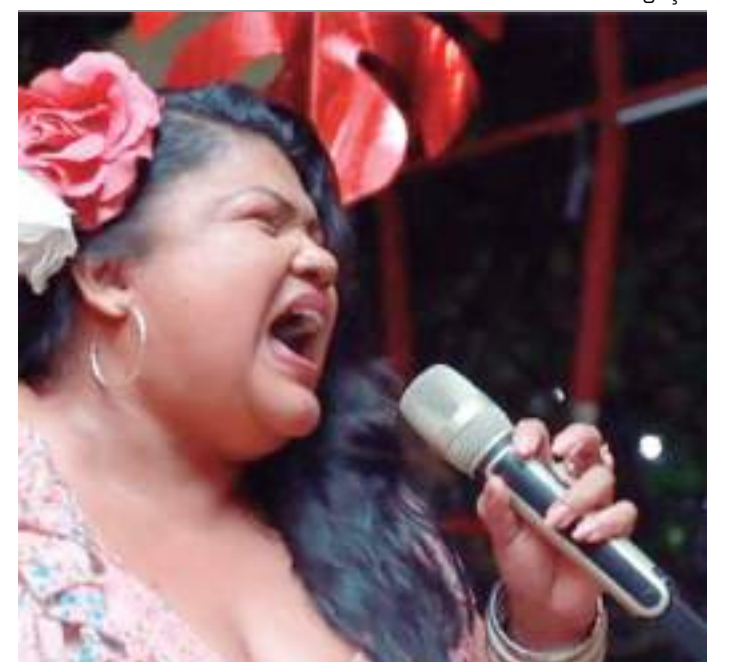
Local vai promover apresentação de fanfarra e a presença do Papai Noel

Para concorrer ao sorteio, o cliente recebe um cupom a cada R$ 400 em compras nas lojas físicas do Pátio Gourmet ou pelo site patiogourmet.com.br. A promoção começa no dia 1º de dezembro e vai até o dia 31 desse mês. A apuração será realizada no dia 05 de janeiro, às 17h00. O sorteio terá livre acesso dos interessados.