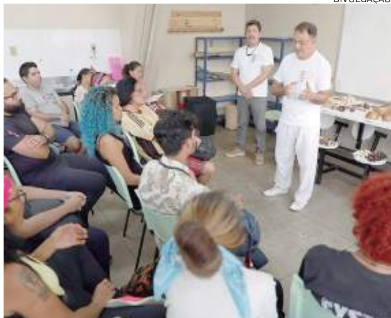
Mostra visa apresentar os resultados obtidos em sala de aula