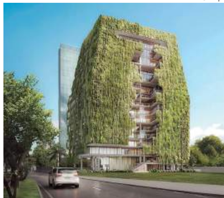
Botânica Office está sendo erguido em Manaus