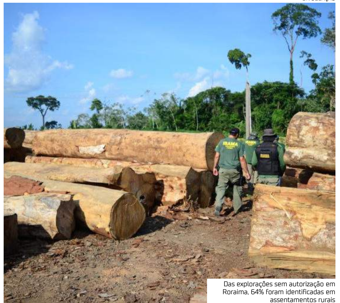
Das explorações sem autorização em Roraima, 64% foram identificadas em assentamentos rurais

Considerando o total explorado, autorizado ou não na Amazônia Legal, o estado do Mato Grosso respondeu por 65,8% da exploração madeireira na região, seguido pelo Amazonas com 12,8%, Pará com 9,8%, Acre com 6,5%, Rondônia com 4,7% e Roraima com menos de 1%. "Comparando com o período anterior, foram verificados aumentos nas áreas exploradas nos estados do Acre (135,8%), Amazonas (236,9%), Rondônia (13,9%) e Roraima (32,8%). E reduções nos estados do Pará (32,5%) e Mato Grosso (6,3%)", diz o estudo do Simex sobre a Amazônia