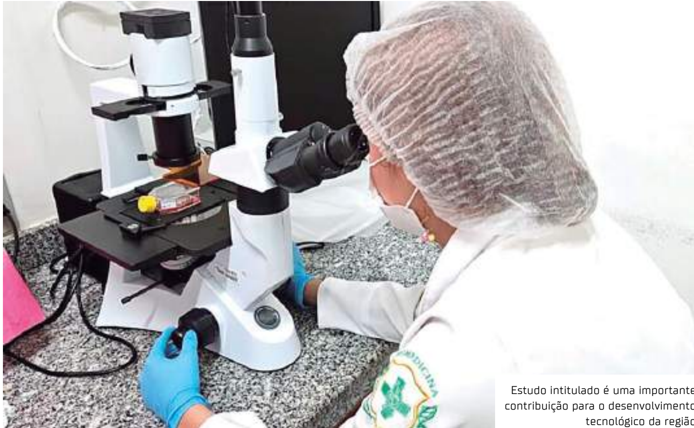
Estudo intitulado é uma importante contribuição para o desenvolvimento tecnológico da região

O estudo intitulado "Bioprospecção de compostos naturais e sintéticos com potencial anticancerígeno e imunomodulador" é uma importante contribuição para o desenvolvimento tecnológico da região. A procura por substâncias naturais com propriedades anticancerígenas pode oferecer benefícios como, por exemplo, menor toxicidade, redução de efeitos colaterais