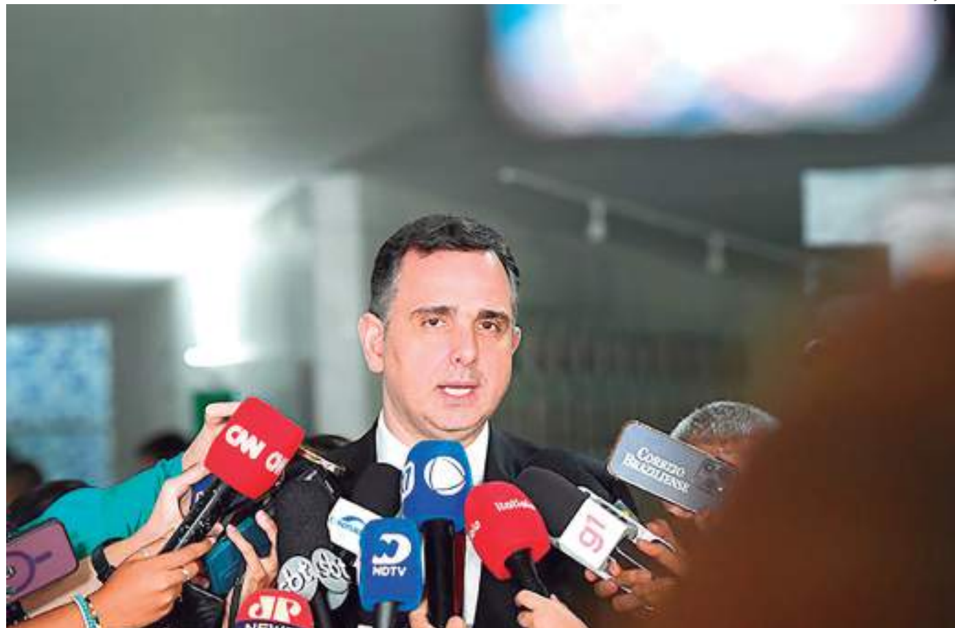
Presidente do Senado disse que cabe agora buscar uma alternativa ao aprimoramento das regras

"O mais correto, na minha opinião, seria o valor da última eleição municipal, que foi em 2020, fazer as devidas correções e adequações e definir um valor que ficaria bem abaixo desse valor definido [de quase R$ 5 bilhões]. Mas o que vale