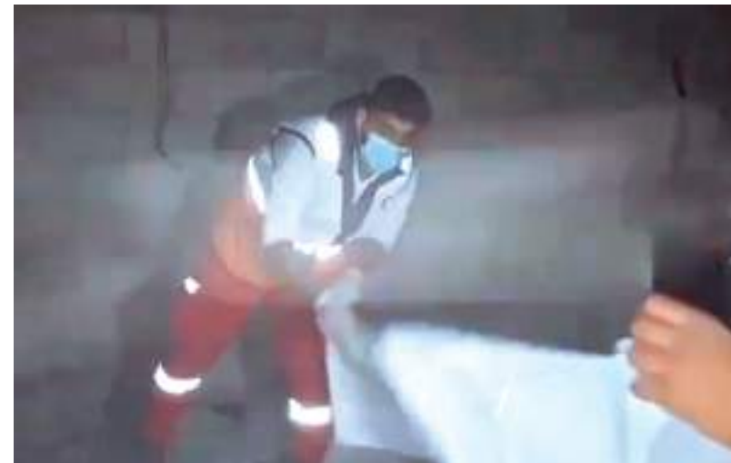
Ataque aconteceu no campo de refugiados de Al-Maghazi