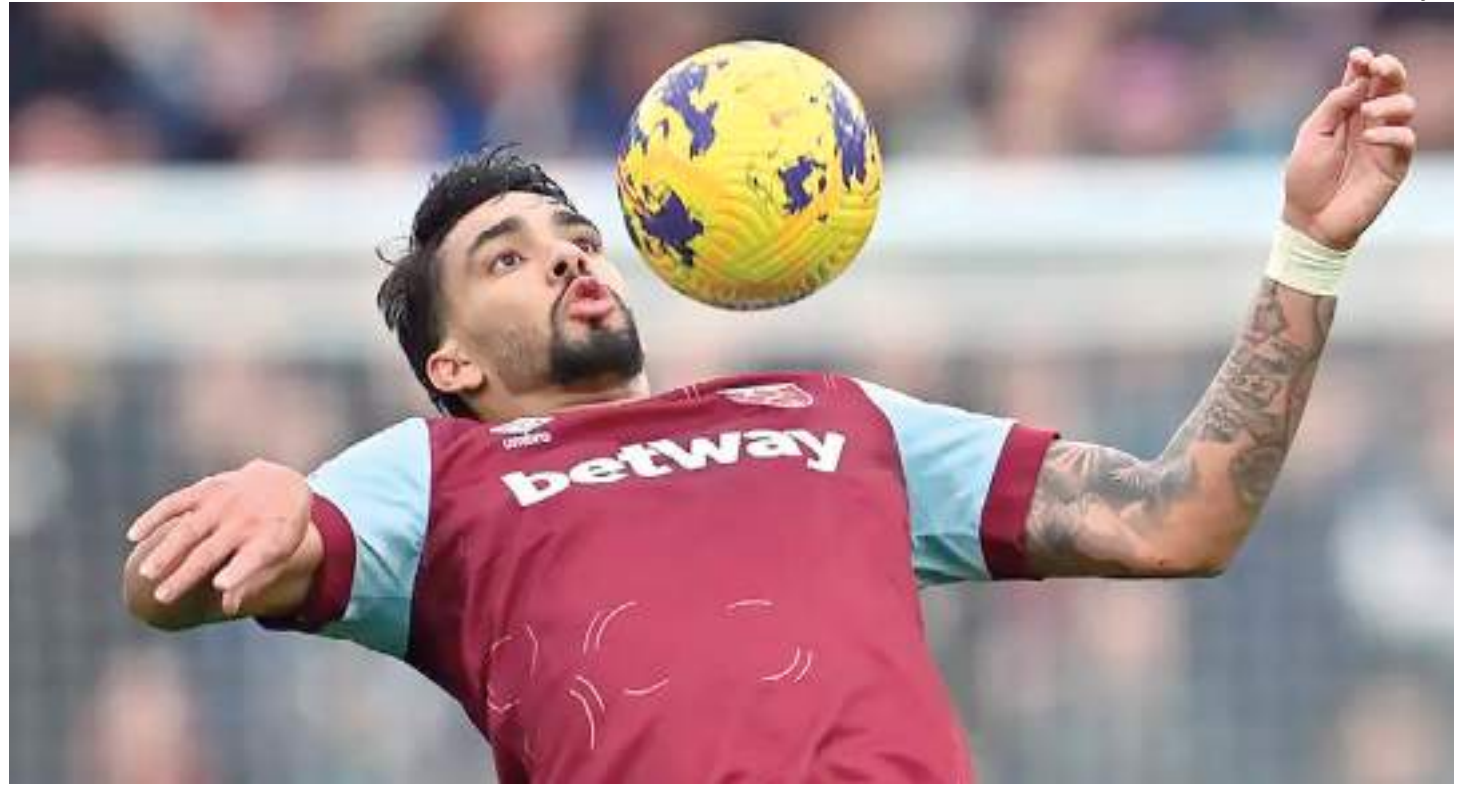
Paquetá está se destacando como jogador do West Ham, na premier League

– Achei que João Gomes se esteve fora do comum hoje. Esteve em todo lugar no meio-campo, fazendo duelsos, ganhando a posse de bola e tentando colocar os Wolves no ataque. Cheio