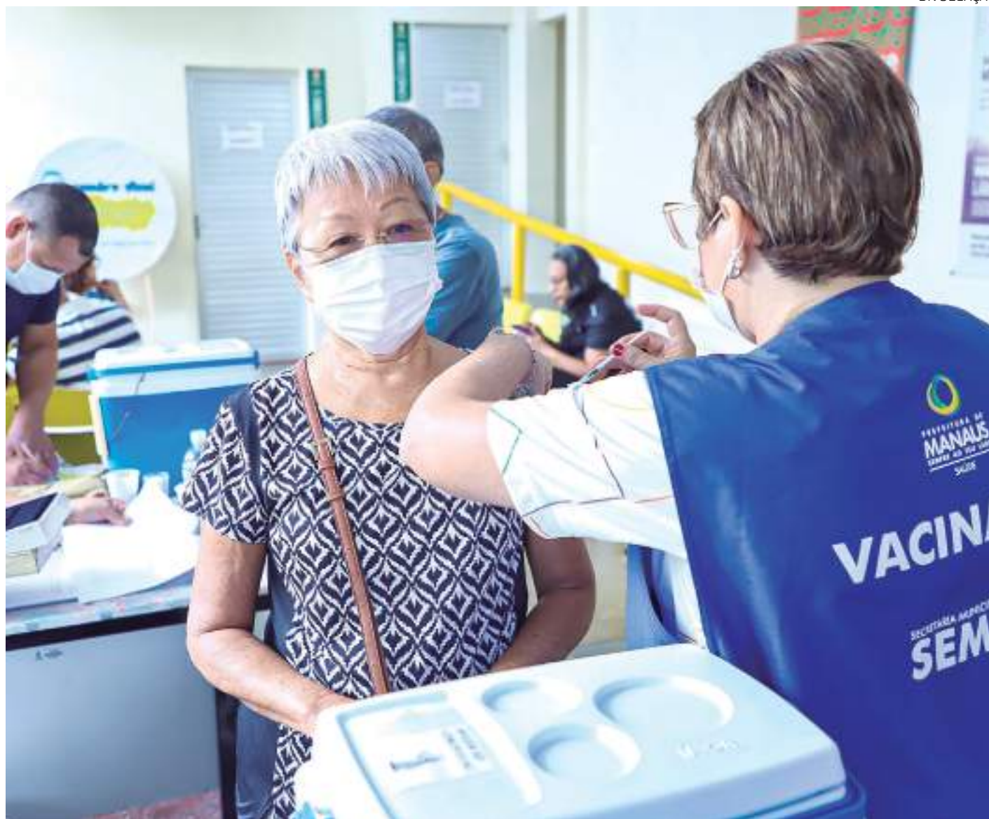
Semsa disponibiliza o Imuniza Manaus ( imuniza.manaus.am.gov.br ), que reúne serviços relacionados à vacinação

"Temos unidades aplicando a vacina contra a Covid-19 em todas as zonas da cidade, sendo que nove delas funcionam em horário ampliado, das 8h às 20h, para assegurar o acesso ao imunizante também para quem estuda ou trabalha em tempo integral", relata