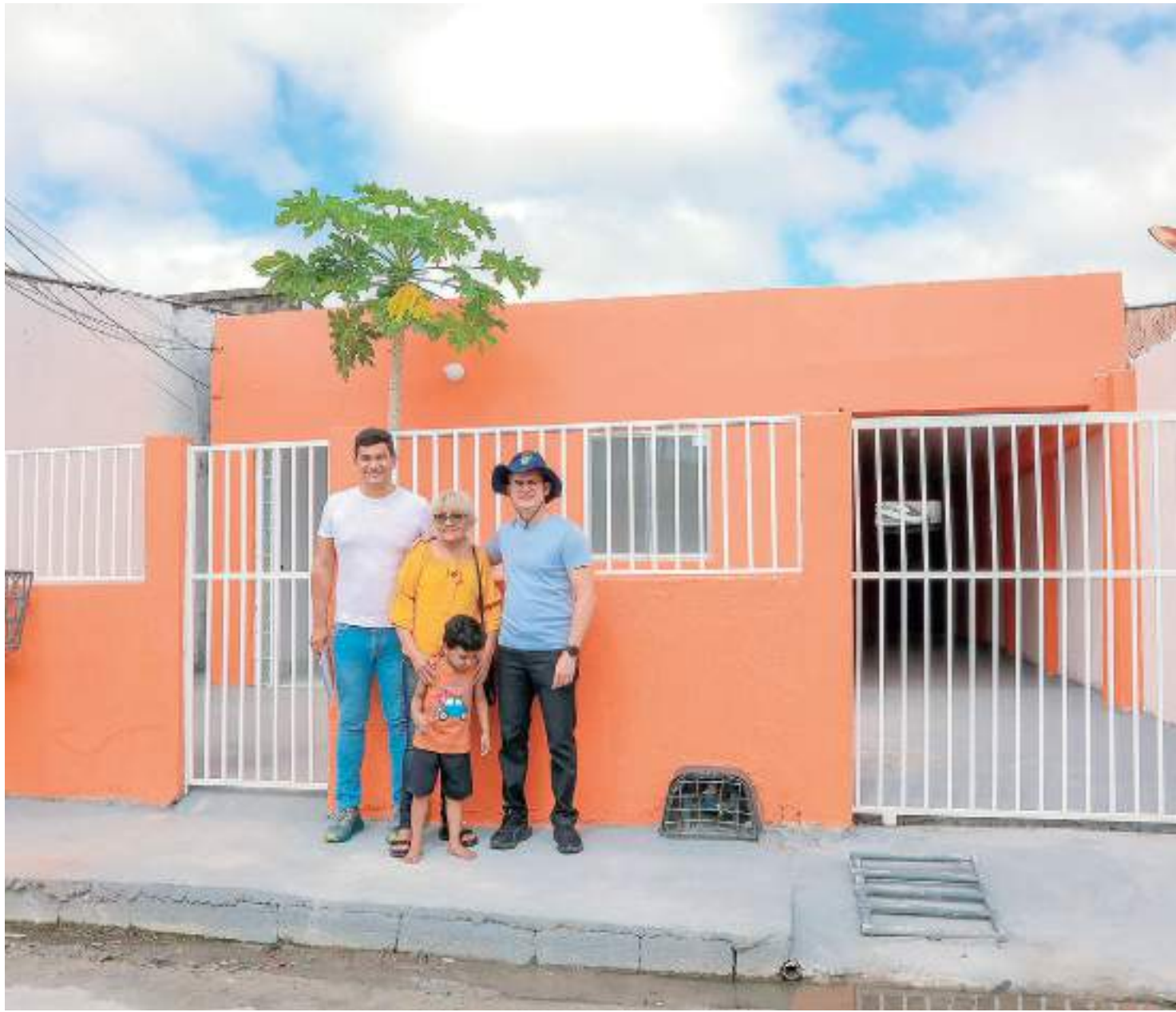
Residências foram contempladas com reforma total das estruturas, que incluiu troca de piso, portas e janelas, reforma do banheiro e outras melhorias

No bairro Puraquequara, duas residências foram contempladas com a reforma total das estruturas, que incluiu troca de piso, portas e janelas, reforma do banheiro e outras melhorias. Uma das