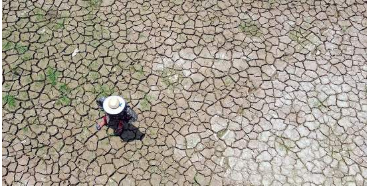
Seca ainda afeta todos os 62 municípios do Amazonas

“Nos meses de dezembro e janeiro as chuvas deverão permanecer abaixo da média no leste e norte do Estado, enquanto na região centro-oeste do estado do Amazonas as