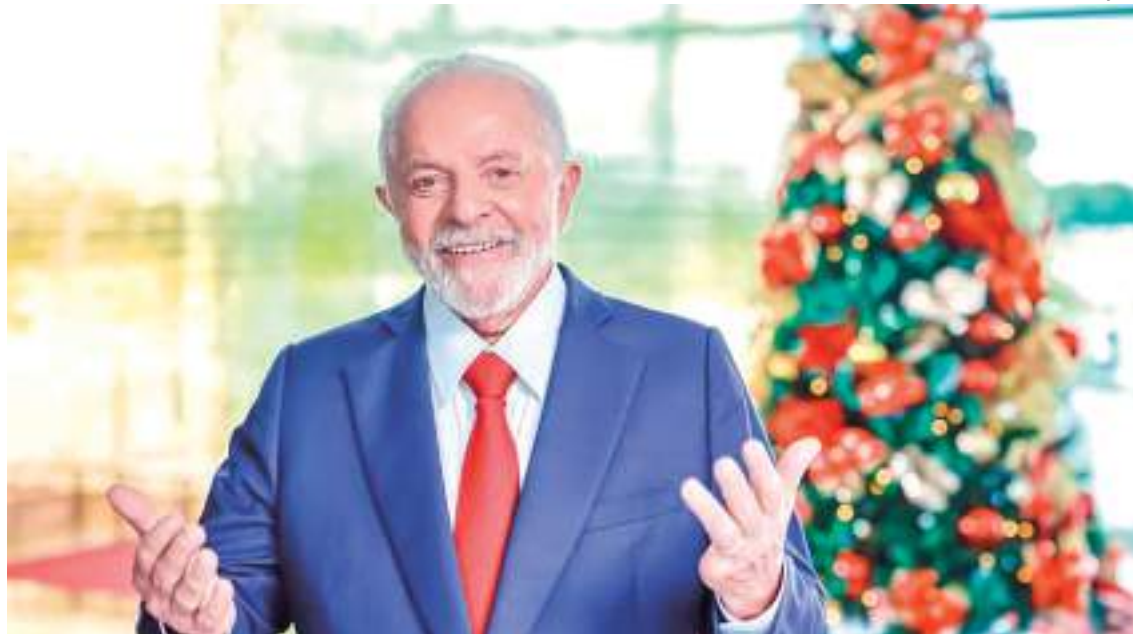
Espaço do PCdoB no primeiro escalão tem sido questionado em função do peso da bancada no Congresso Nacional

Vencido o primeiro ano de governo, o petista já tinha avisado que faria uma avaliação do trabalho de cada auxiliar, substituindo as peças que julgar necessárias. No último dia 20, Lula chamou seus ministros para uma reunião em que todos os 38 auxiliares tiveram a responsabilidade de apresentar um balanço de 2023 e as expectativas para o ano novo, abordando os objetivos planejados para seus ministérios em 2024.