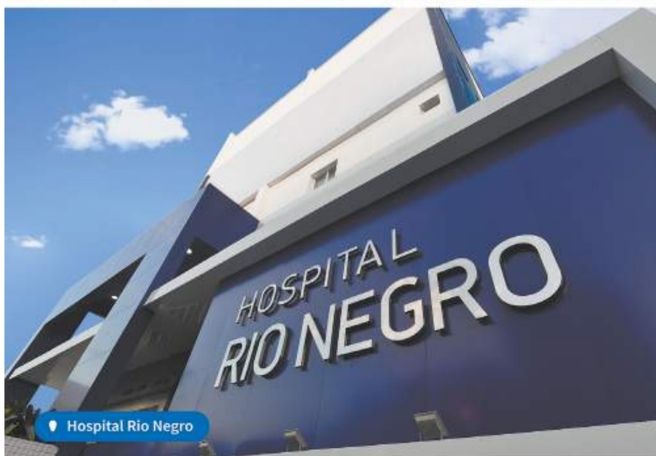
Hospital Rio Negro

Nosso propósito é oferecer acesso a uma saúde de qualidade, que traga conforto e segurança para a nossa gente através de uma rede própria e integrada. No Amazonas e no Brasil inteiro, é isso que nos une e nos motiva, todos os dias, ao atender mais de 15,8 milhões de clientes.