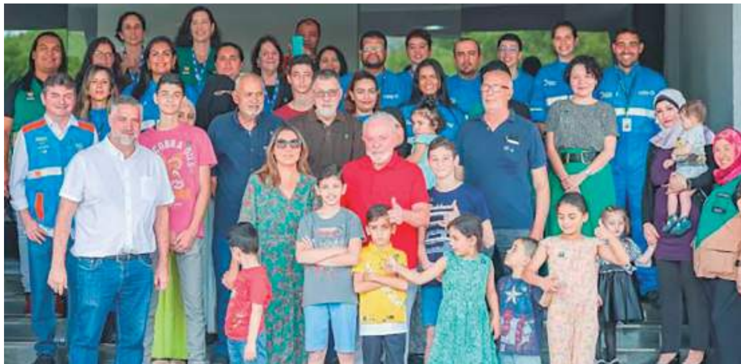
Ao todo, a Operação Voltando em Paz, do governo brasileiro, repatriou 1.555 passageiros e 53 pets

Lula chegou ao meio-dia no Hotel de Trânsito da Base Aérea de Brasília, onde os repatriados estão hospedados temporariamente. Ao chegar, conversou com as