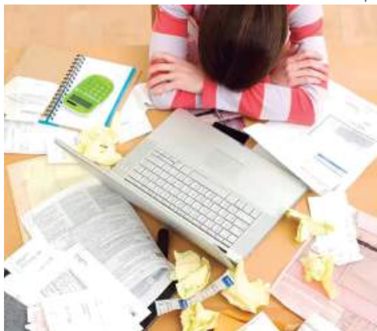
Pesquisa revela que 8 em cada 10 estão preparados para pagar as contas