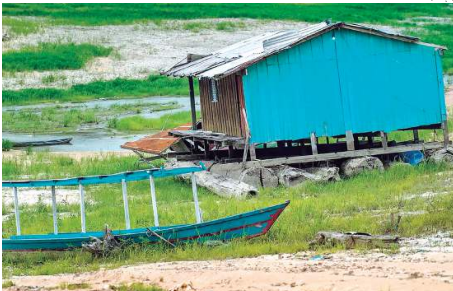
Rios da Amazônia registram menores volumes de chuvas neste período do ano

De acordo com o monitoramento do SGB, a estação do Rio Solimões em Tabatinga (AM) é uma das que já estão na faixa