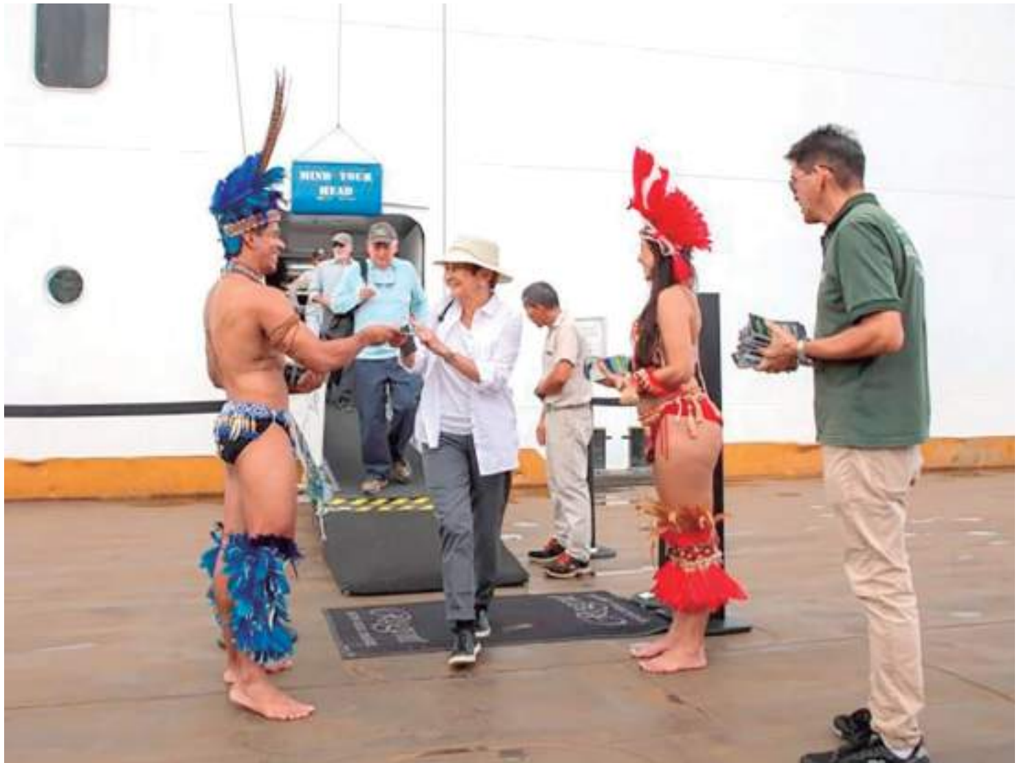
Seven Seas Mariner trouxe 1,2 mil turistas fortalecendo a economia criativa da capital

"Trabalhamos para garantir sempre a melhor experiência aos turistas que chegam ao Amazonas. Dessa forma, voltamos a receber os navios da temporada de cruzeiro atracando na balsa do Porto de Manaus. Isso reflete mais comodidade para que esses visitantes possam chegar até os pontos turísticos do Centro Histórico e assim fazer suas compras, mantendo a geração de emprego e receita", comenta Ribeiro.