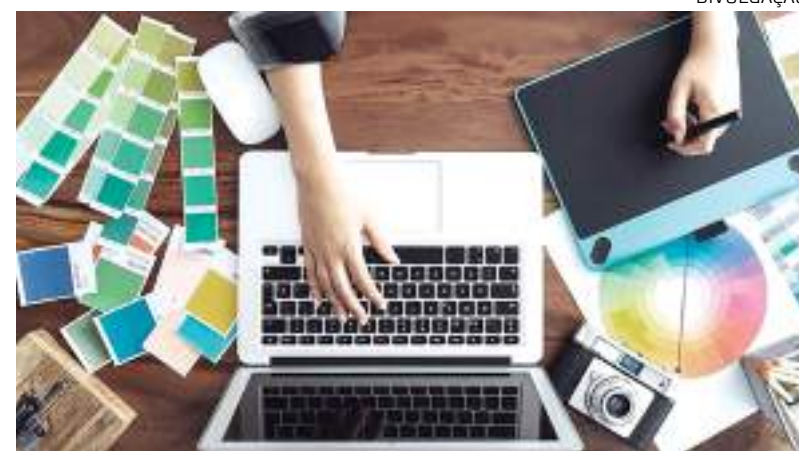
Em 2023 designer gráfico foi um dos profissionais freelancers mais contratado