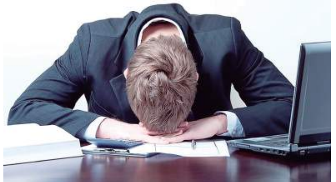
Pesquisa mostra que 90% das pessoas estão dispostas a trocar de emprego

participantes, a satisfação no trabalho é um fator crucial para a retenção dos talentos. Neste sentido, a remuneração justa foi apontada