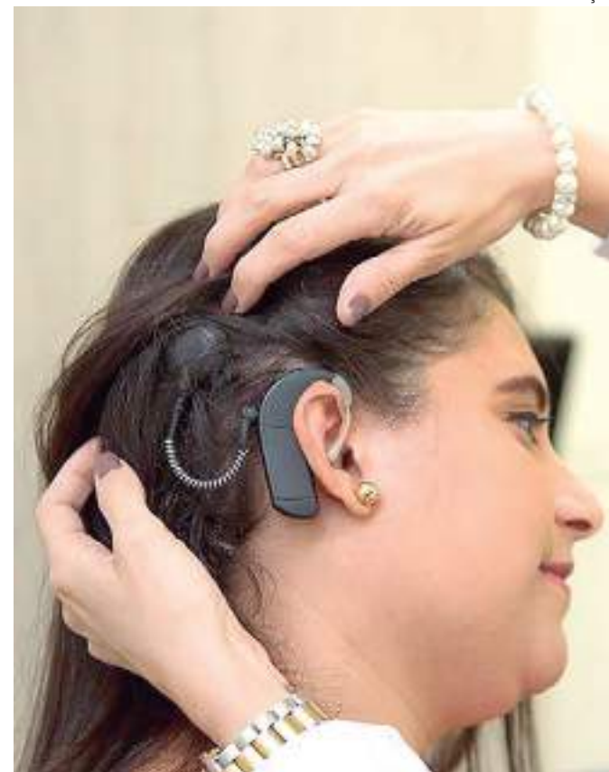
Médicos ressaltaram importância do apoio da gestão Wilson Lima na causa