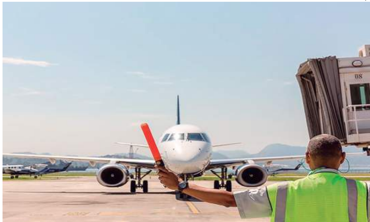
Setor aéreo brasileiro alcançou a marca de 100 milhões de passageiros pela 1ª vez desde 2019

As 3 principais empresas do setor nacional