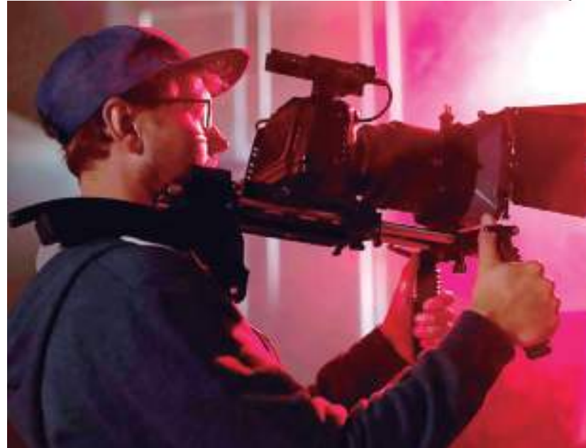
Iniciativas são para coprodução internacional e investimento em filmes

Os objetivos da iniciativa são: fortalecimento das empresas do setor audiovisual brasileiro; estímulo à produção de longas-metragens com alto potencial