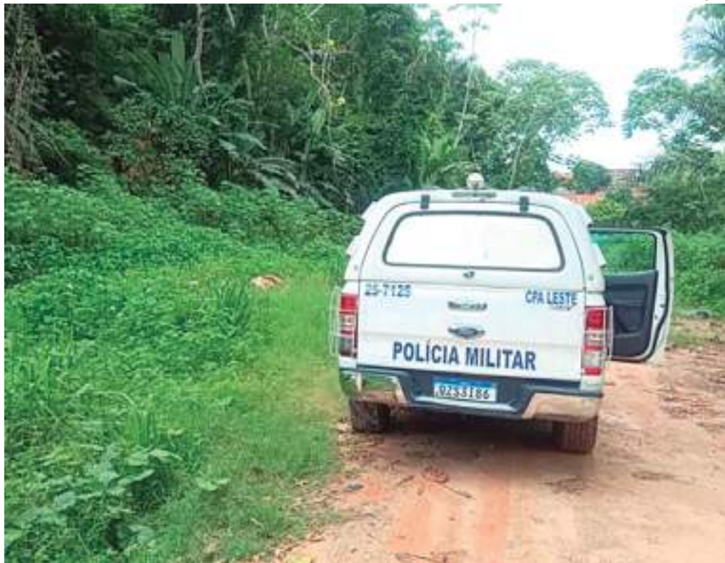
Vítima foi achada em área de mata e não foi reconhecida pelos moradores

O corpo de um homem ainda não identificado foi encontrado com sinais de tortura em uma área de mata localizada na rua Pirineu, bairro São José Operário, Zona Leste de Manaus, durante a manhã de Natal, na segunda-feira (25).