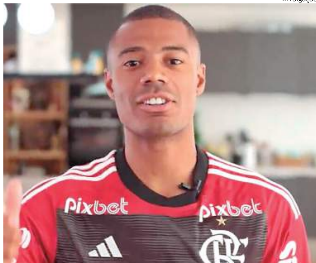
De La Cruz será o novo reforço do Flamengo para próxima temporada