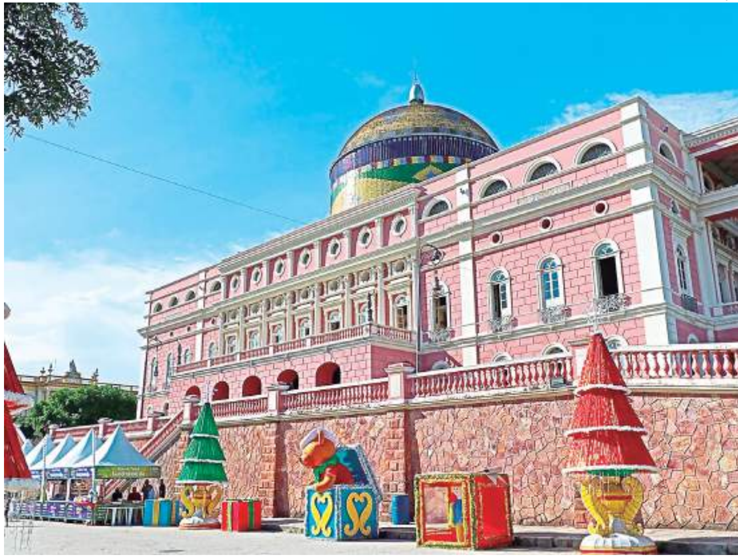
Primeiro Réveillon do Largo contará com mais de 100 artistas

Réveillon dos Réveillons O início das atividades de