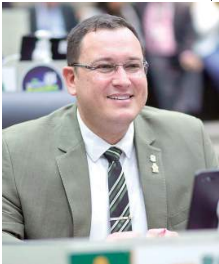
Vereador destacou importância da acessibilidade

"É uma grande conquista para as famílias de Manaus que têm parentes com alguma dificuldade