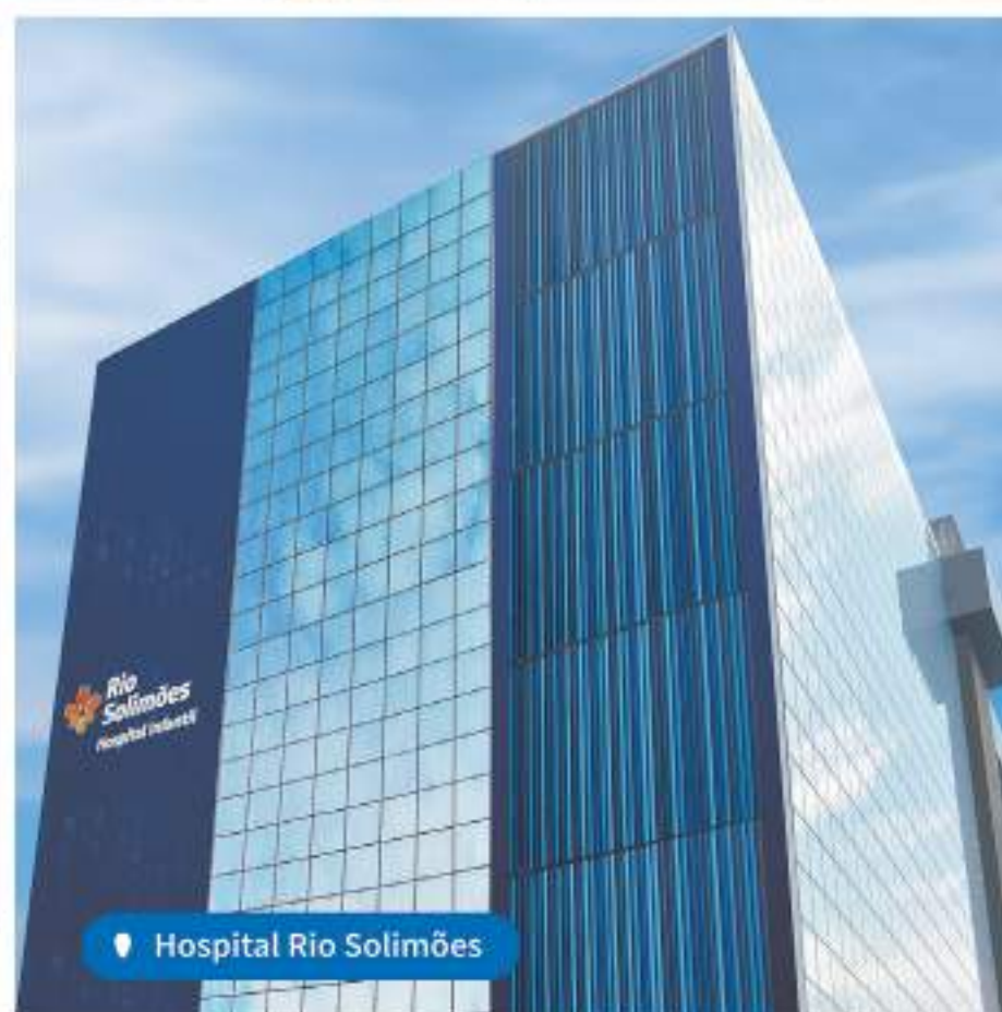
Hospital Rio Solimões