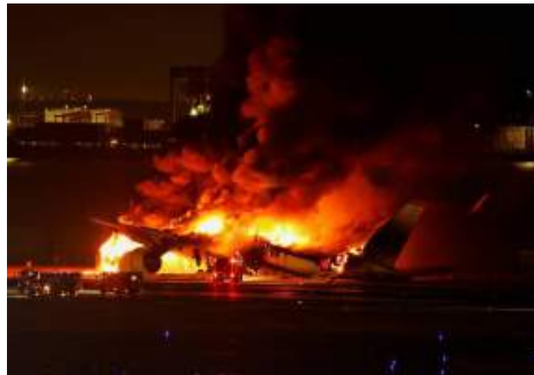
Avião da Japan Airlines em chamas no aeroporto internacional de Haneda