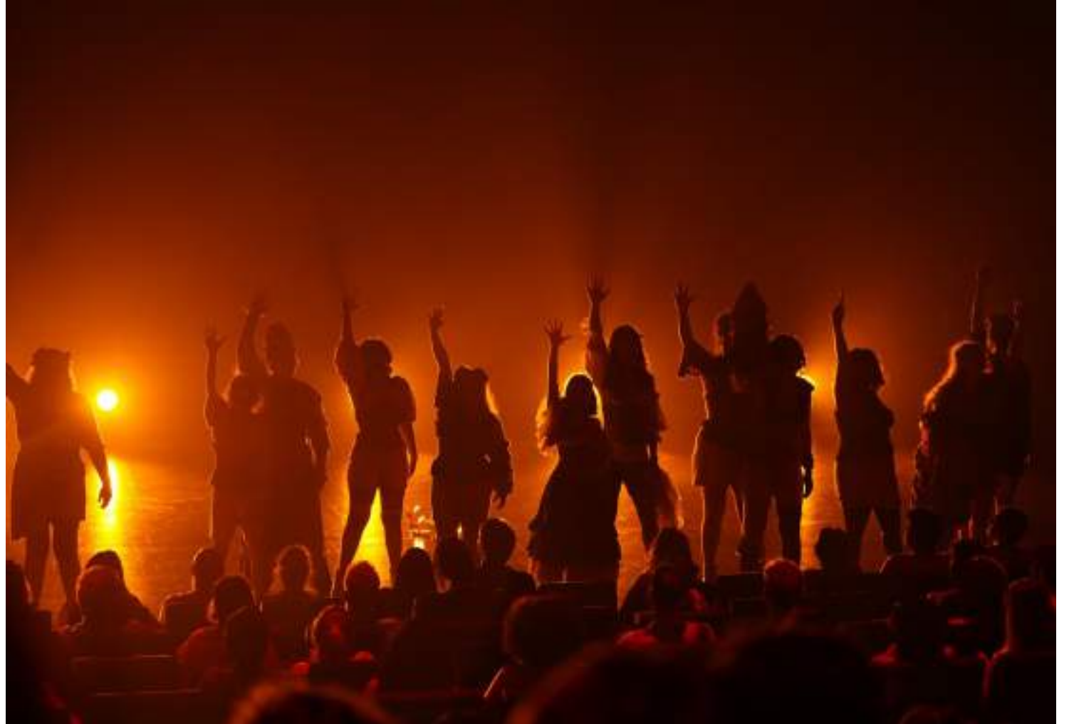
Projeto, que conta com 17 artistas, tem apoio do Governo do Amazonas

"O prêmio é mais uma resposta que estamos furando a bolha", significa que temos