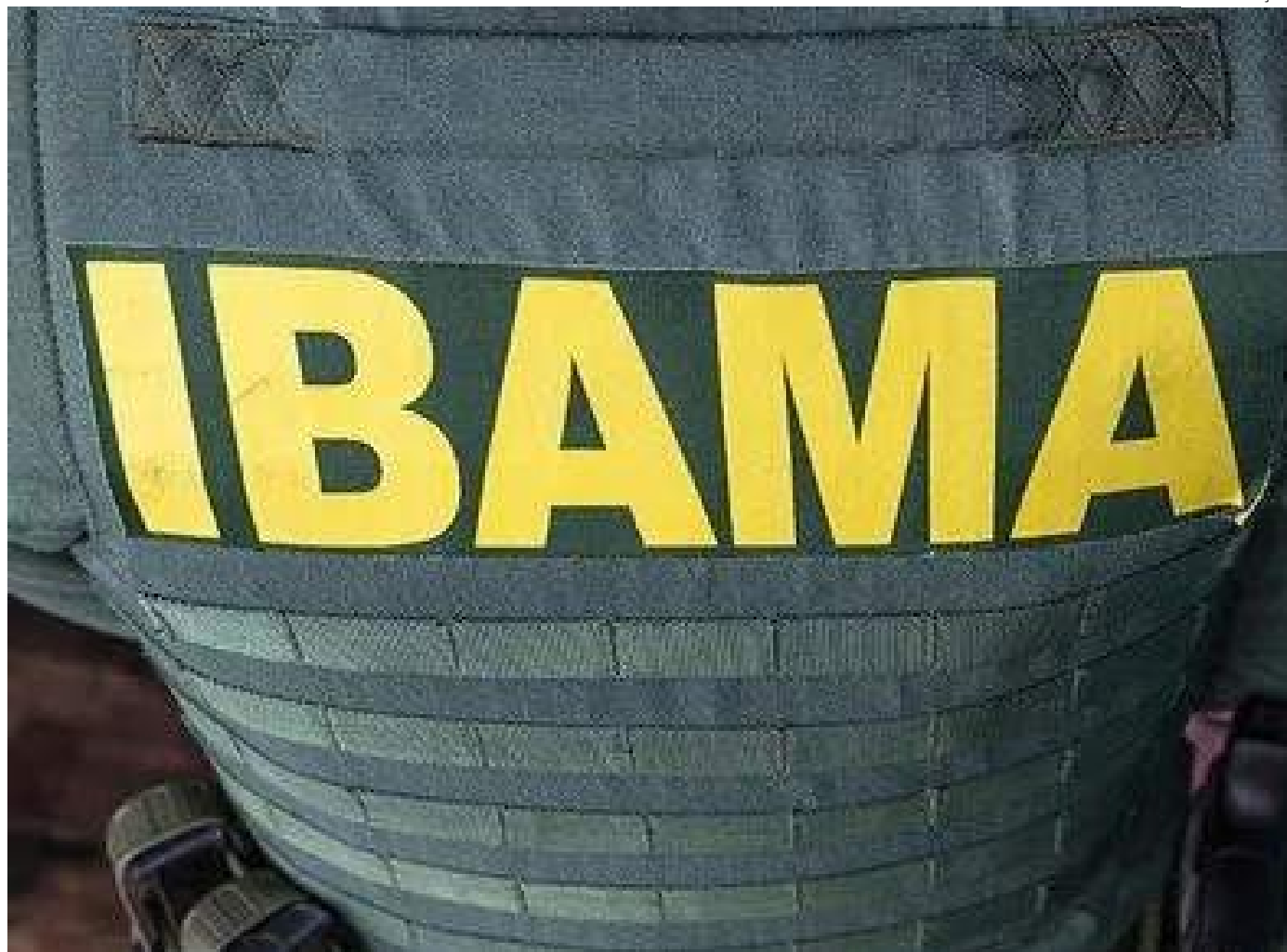
Assembleia está prevista para a próxima terça-feira (9) para discutir a paralisação

De acordo com o texto, todas as atividades do