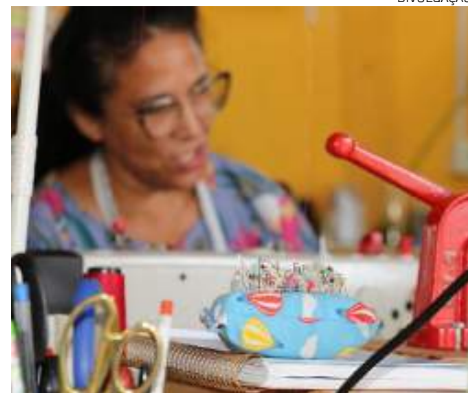
Investimento beneficia moradores nos 62 municípios do Estado

Defesa do Consumidor do Amazonas (Procon-AM) realizou 195 mil atendimentos presenciais, 36.600 online e 5 mil audiências de conciliação. A instituição visa desenvolver um trabalho de orientação e fiscalização do