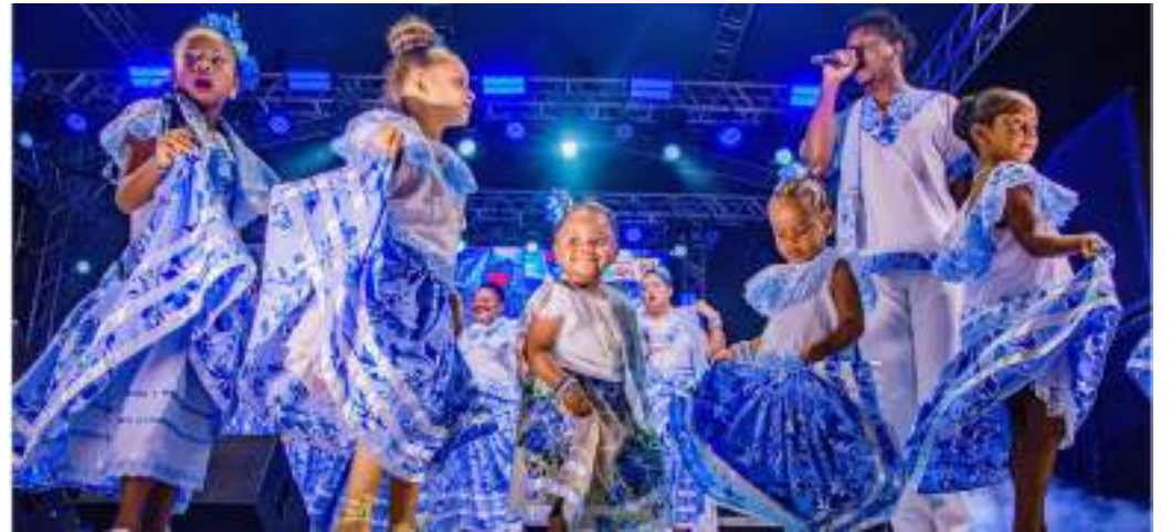
Lei Rouanet beneficia profissionais da cultura de todo o Brasil