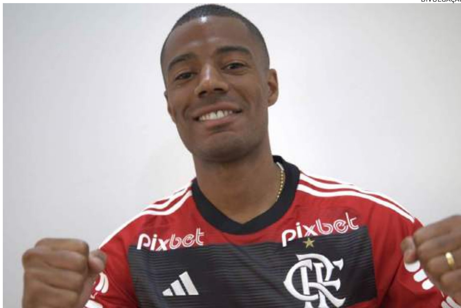
Marca que antes ficava na altura do ombro (imagem), agora será estampada no peito, no principal espaço da camisa rubro-negra

Um novo ano se inicia e, com ele, os cubes se prepararam para novos ciclos.