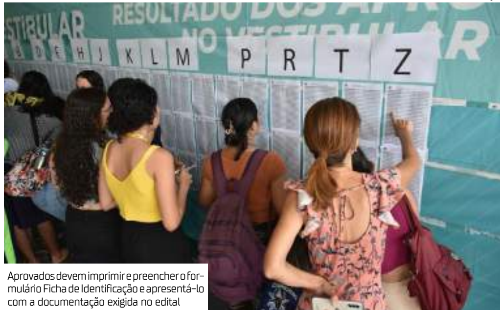
Aprovados devem imprimir e preencher o formulário Ficha de Identificação e apresentá-lo com a documentação exigida no edital

"Quero muito parabenizar nossos alunos por todo o esforço