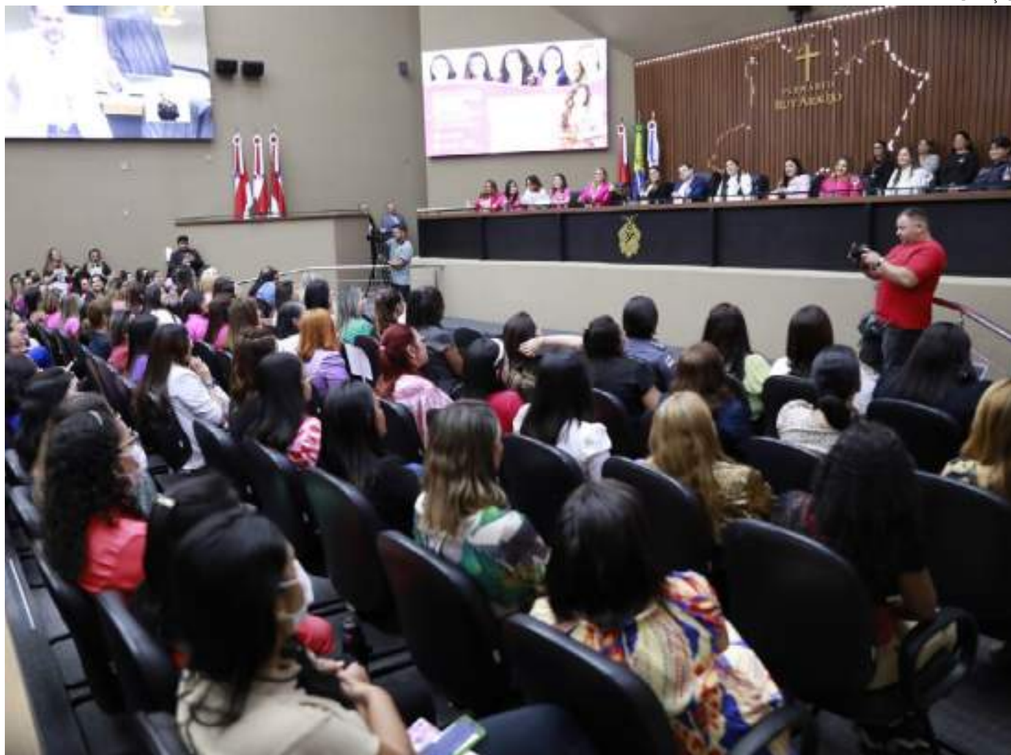
Iniciativas lideradas por parlamentares promovem Segurança Pública do Estado

A Lei n.º 6.291 de 2023 visa a proteção dos idosos, por meio de ações fiscalizadoras e punitivas, promovidas pelas instituições estaduais a partir de denúncias feitas pelo próprio idoso vítima de violência, ou por qualquer