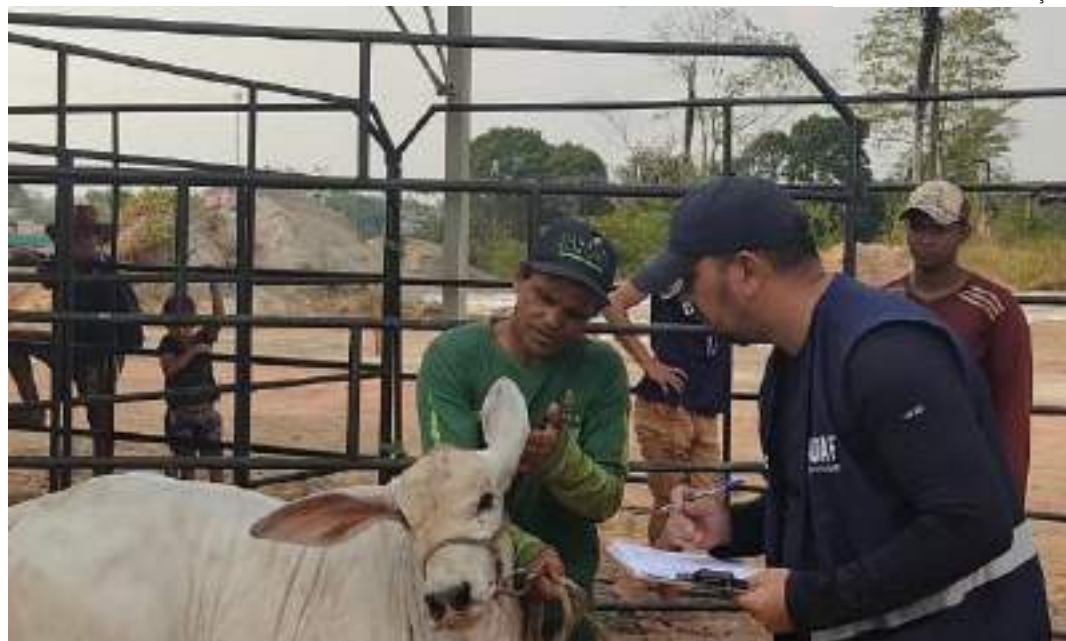
Medida é necessária devido a foco da doença identificado em Uruará (distante 260 quilômetros de Manaus)