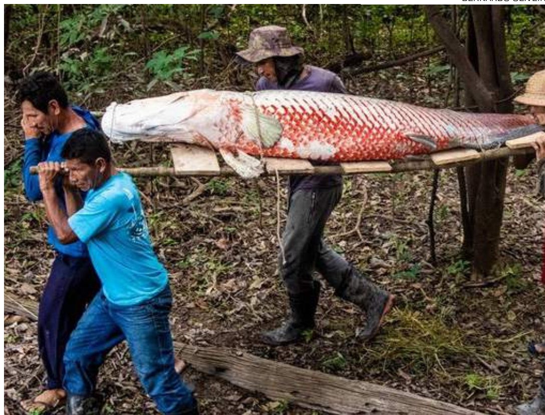
Manejo sustentável é responsável pela recuperação da população de pirarucu

pelo Ibama para as localidades assessoradas pelo Mamirauá para a temporada de pesca de 2023 é de 14.983 peixes ou 749 toneladas. O número representa um crescimento de cerca de 15% em relação ao ano passado. Em geral, as comunidades pesqueiras capturam mais de 90% da cota estabelecida.