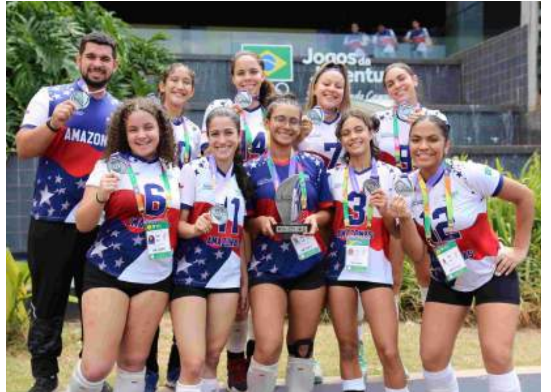
Alunos puderam viajar e participar, ao longo do ano, de competições e eventos estaduais, nacionais e internacionais