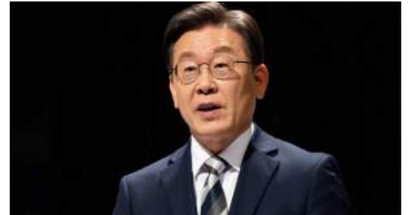
Lee Jae-myung era candidato presidencial do Partido Democrata