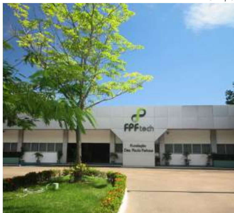
FPFtech fecha o ano de 2023 com um crescimento institucional