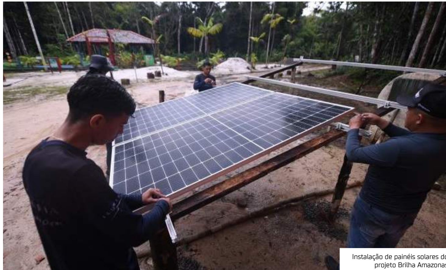
Instalação de painéis solares do projeto Brilha Amazonas

Com objetivo de proporcionar o melhor atendimento e comodidade para quem visita