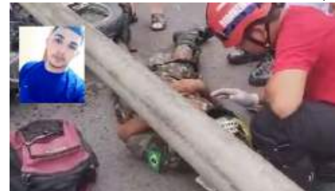
Acidente aconteceu na manhã do primeiro dia do ano de 2024