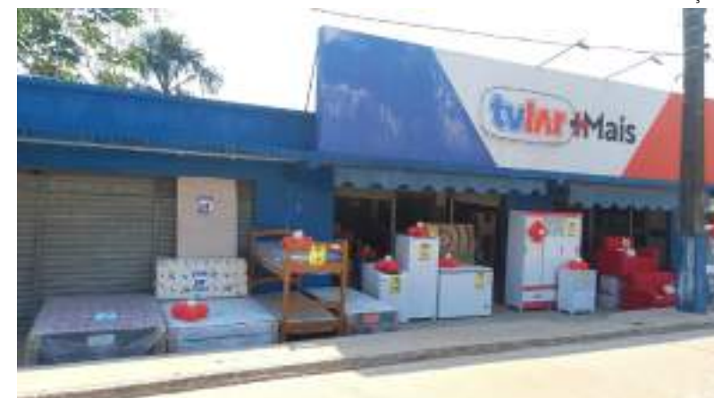
Bota Fora TVLar de janeiro já começou e seguirá por todo o mês