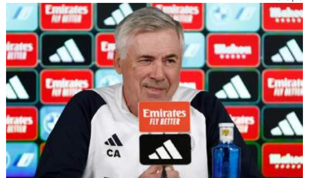
Treinador explicou acerto com o Real Madrid e negativa à Seleção Brasileira