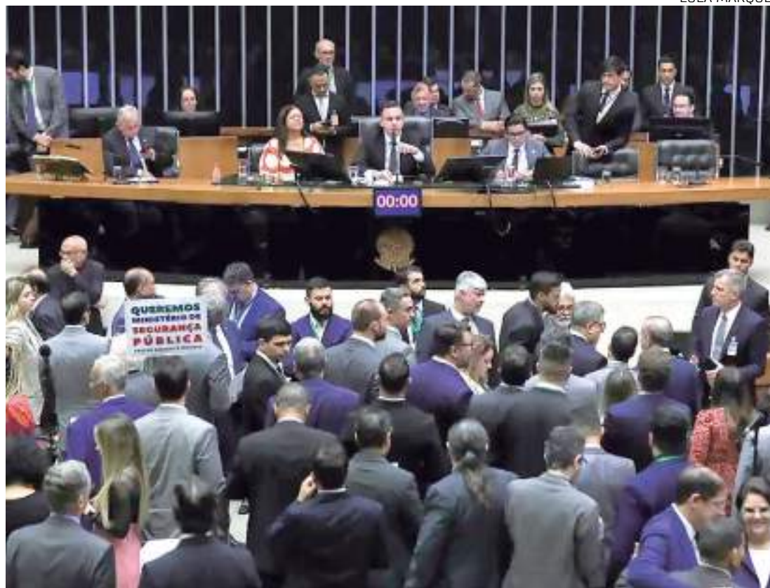
LDO também prevê um teto de R$ 4,9 bilhões para o Fundo Eleitoral

A LDO também prevê um teto de R$ 4,9 bilhões para o Fundo Eleitoral, que poderá ser utilizado pelos partidos políticos em gastos com as eleições municipais de 2024.