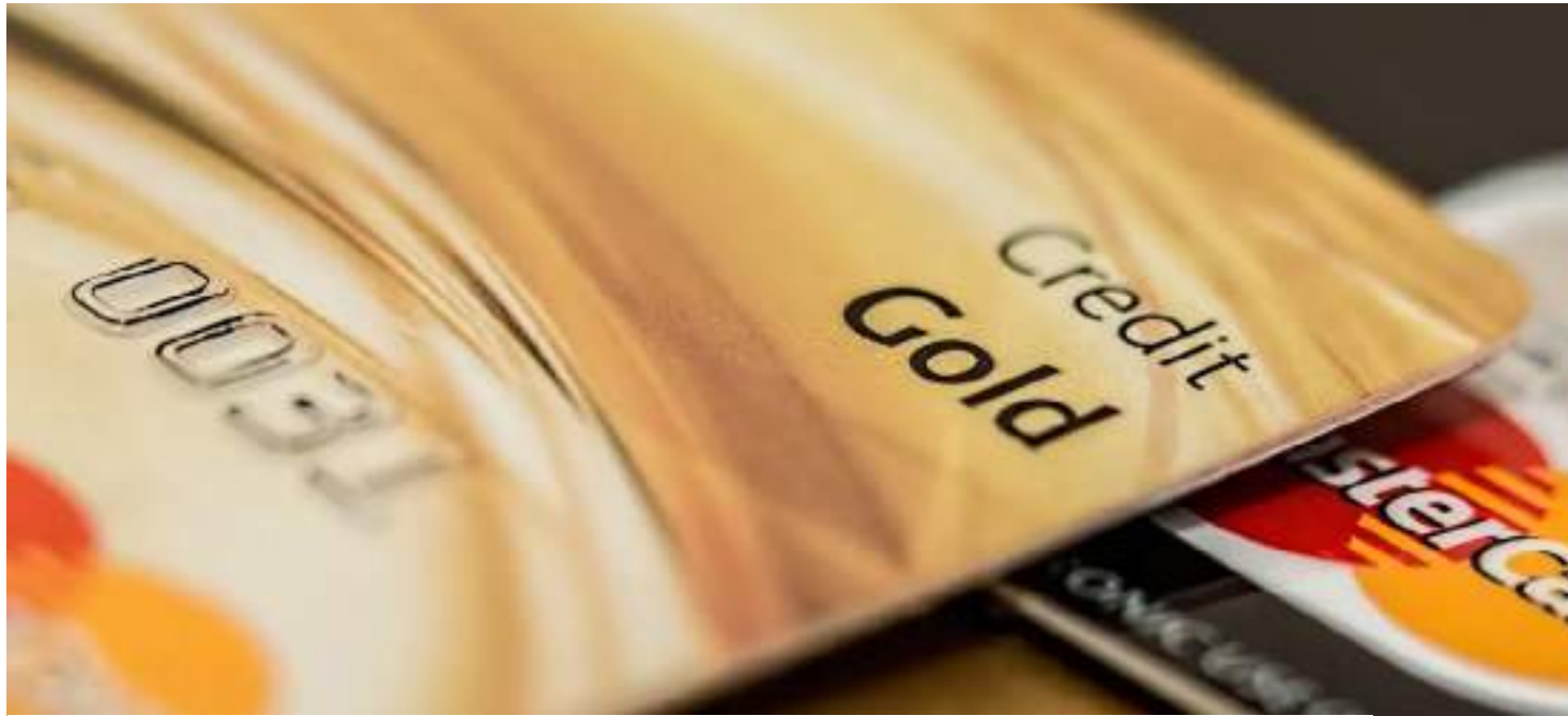
CMN instituiu a portabilidade do saldo devedor do cartão de crédito e aumentou a transparência nas faturas

Instituído pela Lei do Programa Desenrola, sancionada em outubro, o teto foi regulamentado no fim de dezembro pelo Conselho Monetário Nacional (CMN). A lei havia estabelecido 90 dias para que as negociações entre o governo, o Banco Central, as instituições financeiras, o Congresso Nacional e o Banco Central chegassem a um novo