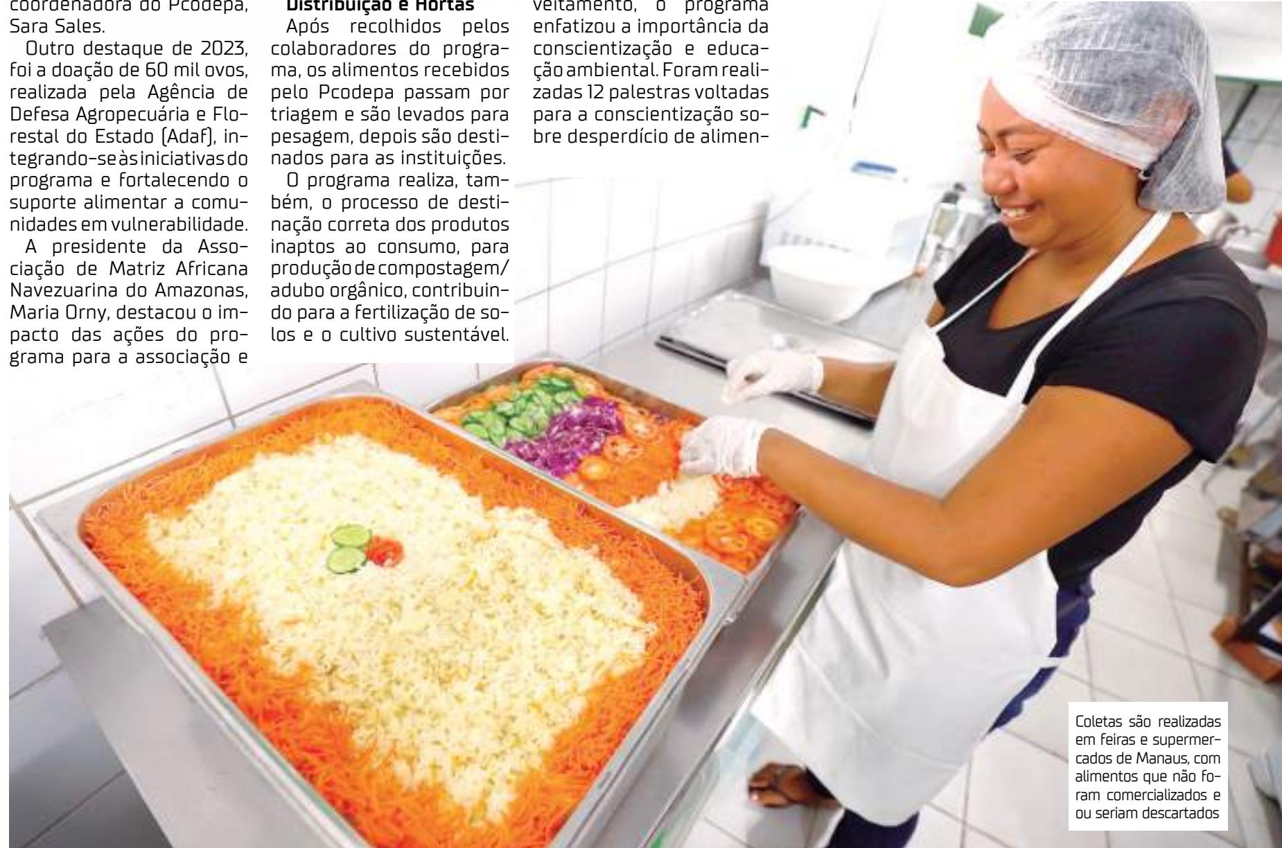
Coletas são realizadas em feiras e supermercados de Manaus, com alimentos que não foram comercializados e ou seriam descartados