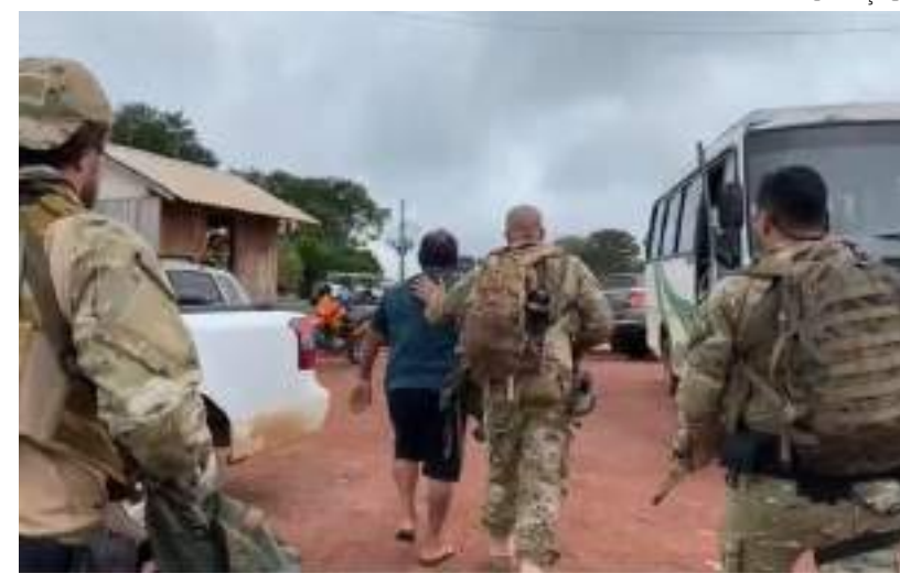
Conforme a polícia, uma das vítimas é neta do suspeito