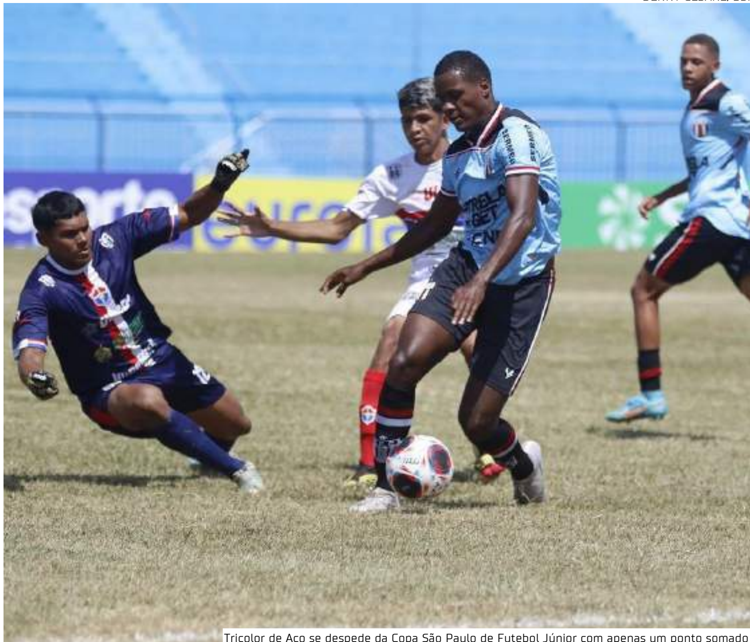
Tricolor de Aço se despede da Copa São Paulo de Futebol Júnior com apenas um ponto somado

No outro jogo do grupo, o Sfera-SP, já classificado, foi derrotado pelo América-RN por 3 a 2. Com os gols, Thalles assumiu a vice-artilharia da competição, com quatro gols - atrás somente de Jardiel, do Grêmio, e Nycollas, do Oeste, que têm cinco gols. Os confrontos da próxima fase ainda serão definidos.