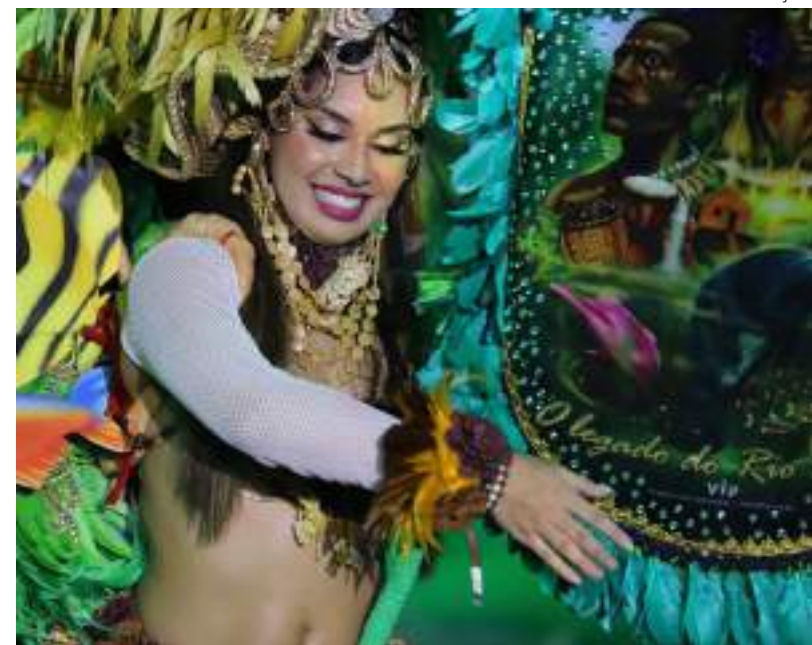
Apresentações do Ecofestival do Peixe-Boi acontecem em Novo Airão