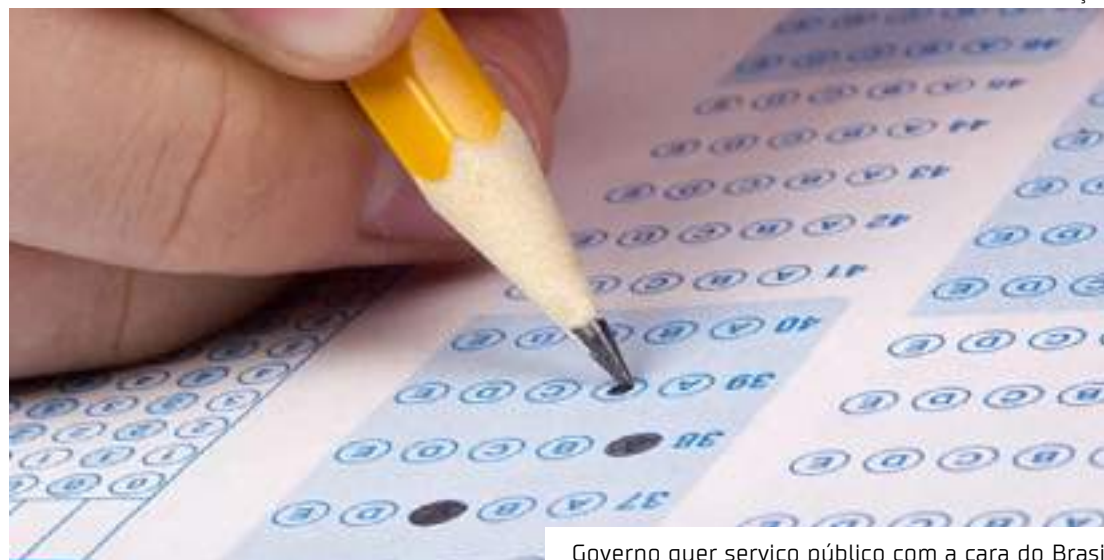
Governo quer serviço público com a cara do Brasil

· 20% para pessoas negras; · 5% para pessoas com deficiência; · 30% para indígenas nos cargos para a Funai.