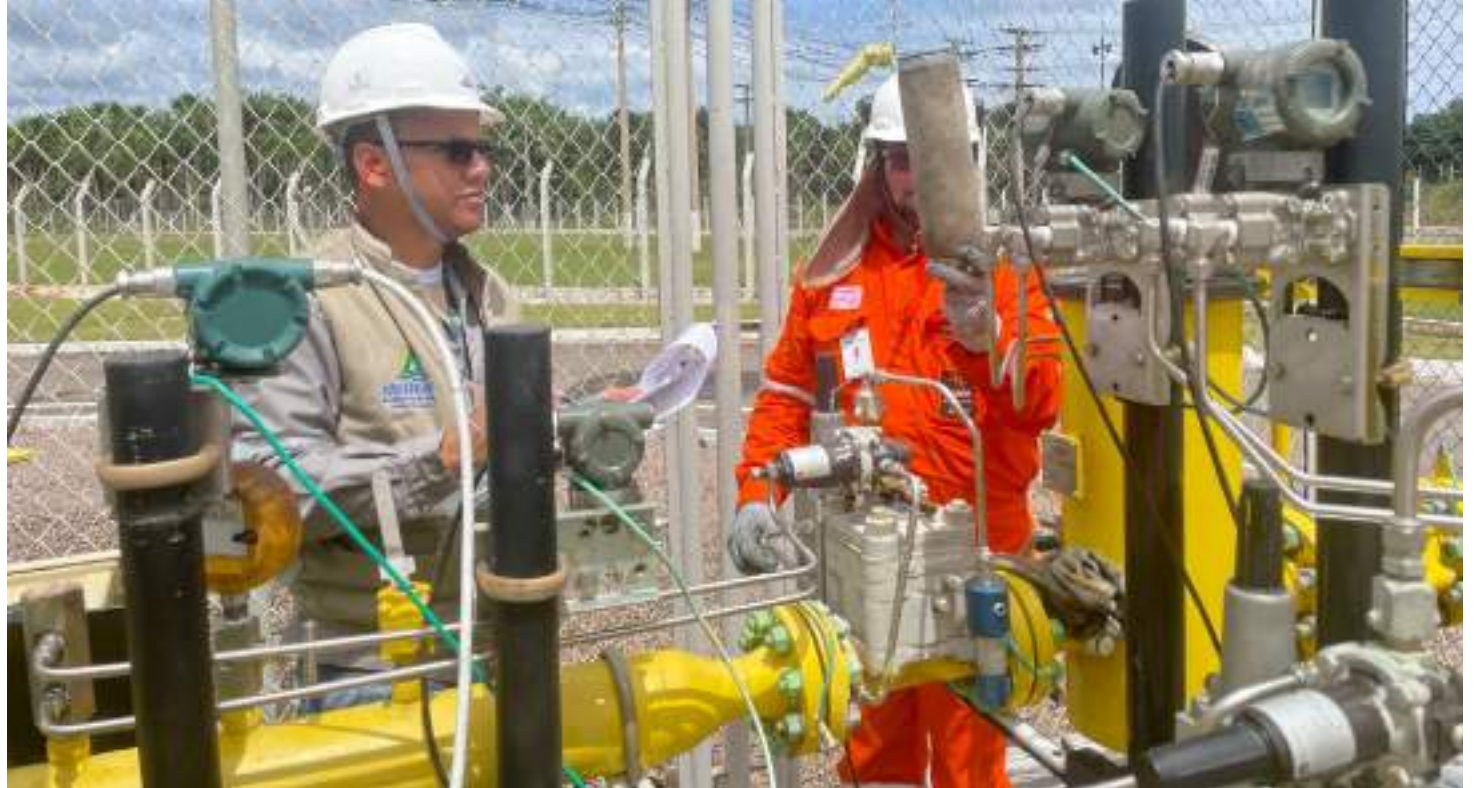
Praticamente todos os segmentos que trabalham com o GN apresentaram aumento em 2023

Para a Resolução N.º 005/2023, foram recebidas mais de 400 contribuições por meio de consulta pública. Destas, 63 foram acatadas, demonstrando o efetivo interesse do Estado do Amazonas em possibilitar um ambiente favo-