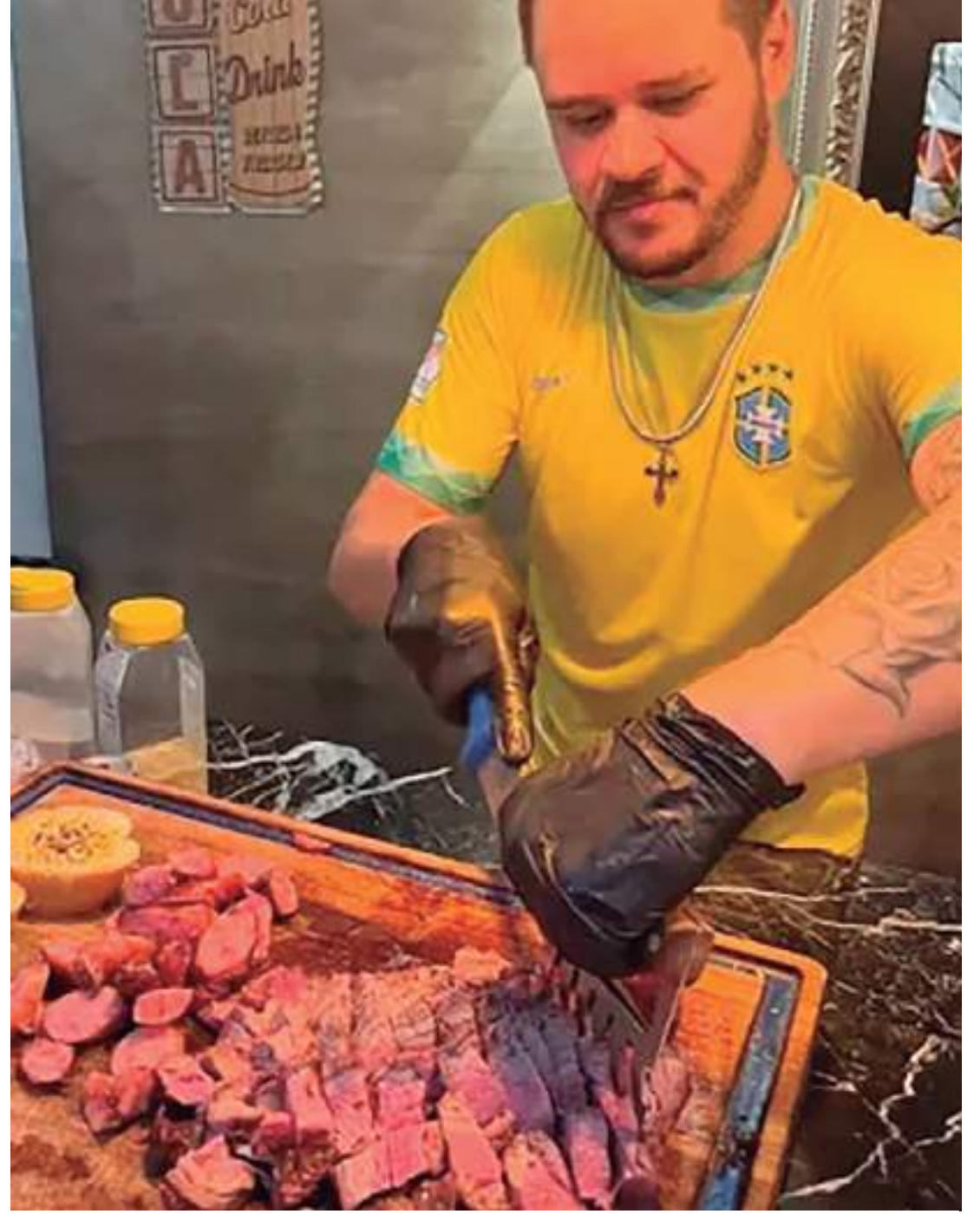
Brasileiro foi sequestrado por criminosos, durante onda de violência no Equador

No texto do decreto, o governo qualifica como "terroristas e atores não estatais beligerantes" 22 organizações. Na lista estão Águias, Águilas Killer, AK47, Cavaleiros Escuros, Chone Killer, Choneros, Covicheros, Quartel das Feias, Cubanos, Fatales, Gánster, Kater Piler, Lagartos, Latin Kings, Lobos, Los p.27, Los Tubarões, Mafia 18, Mafia Trébol, Patrões, R7 e Tiguerones.