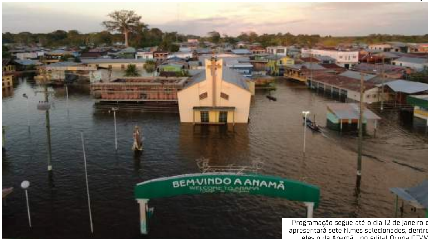
Programação segue até o dia 12 de janeiro e apresentará sete filmes selecionados, dentre eles o de Anamá, no edital Ocupa CCVM

Conforme o diretor, as últimas imagens foram captadas em outubro de 2023, na procissão de São Francisco