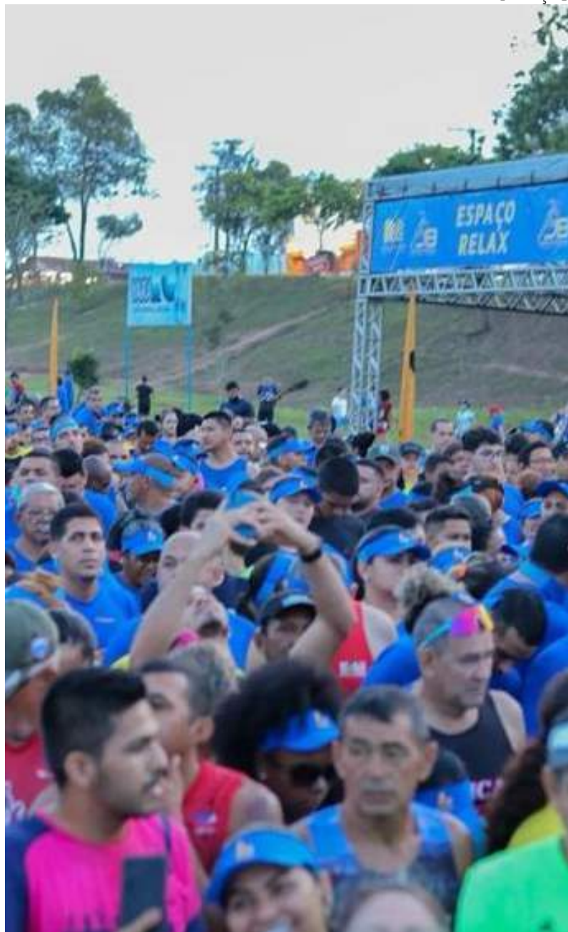
Interessados em participar têm entre os dias 5 de janeiro e 18 de março para garantir vaga

Assim como na edição passada, em 2023, a disputa acontecerá na avenida Governador José Lindoso