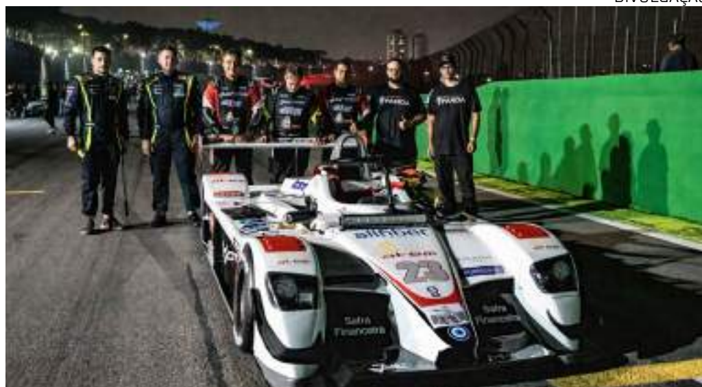
Prova tem como objetivo demonstrar a qualidade dos produtos automotivos fabricados no país