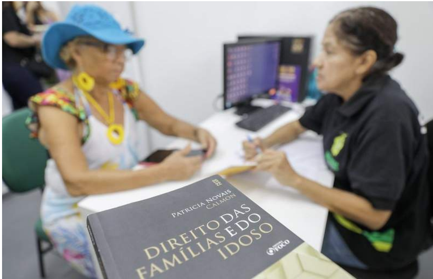
Unidade foi totalmente adequada para melhor atender à população idosa, principalmente, nas zonas Sul e Centro-Sul