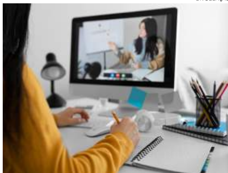
EaD superior cresceu 474%, entre 2011 e 2021