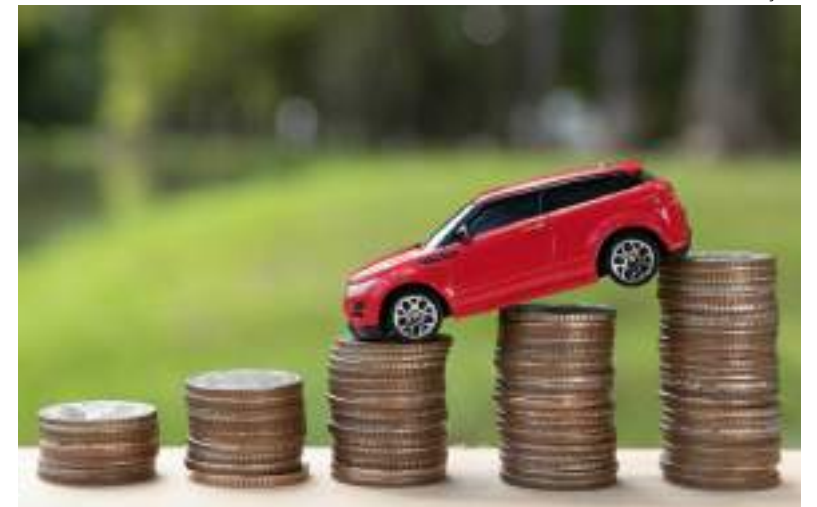
Veículos já impactam bolso dos motoristas e das famílias