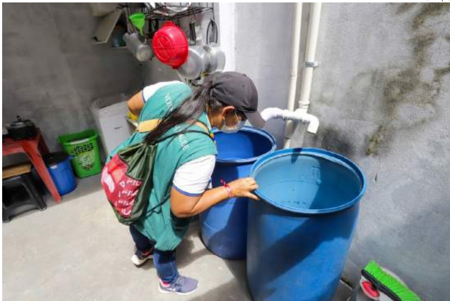
Manaus registrou 722 casos de dengue durante o ano de 2023, segundo consta no Boletim Epidemiológico de Arboviroses

"A diferença é que hoje temos exames para detectar a oropouche e a mayaro, por isso incluímos os dados no boletim ao lado da dengue, chikungunya e zika", relata a epi-