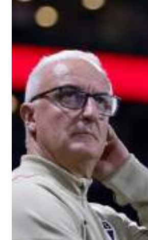
Dorival foi campeão da Copa do Brasil em 2023