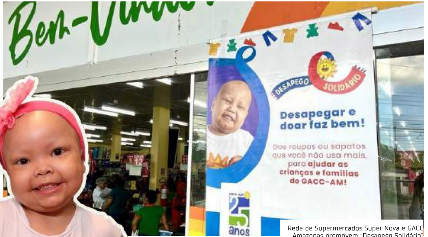
Rede de Supermercados Super Nova e GACC Amazonas promovem "Desapego Solidário"

"A ideia é exatamente estimular as pessoas a desapegarem. E janeiro, normalmente as pessoas tendem a fazer uma arrumação no guarda-roupa e, assim, verificam itens que não precisam mais usar. Então, nós nos sentimos muito honrados em poder participar de uma ação tão nobre e chamar a atenção dos consumidores que estiverem fazendo compras para