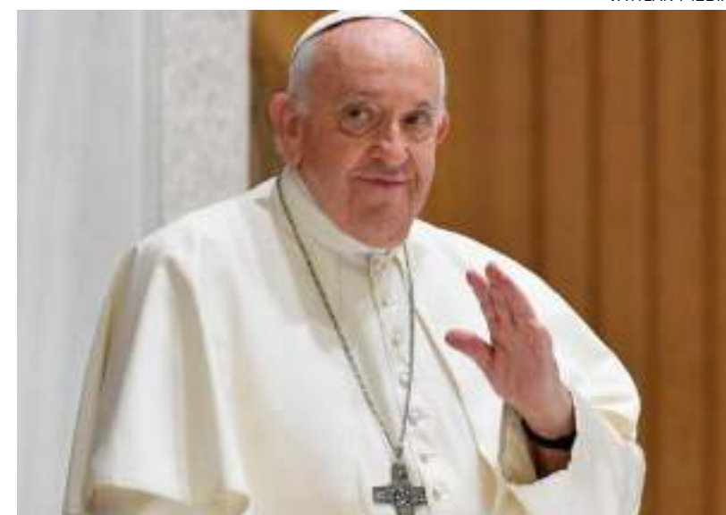
Francisco também fez crítica à pornografia durante fala em audiência geral