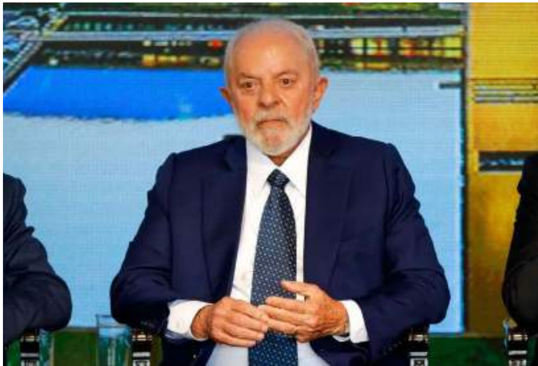
Lula e o PT têm uma reconhecida dificuldade de penetração no meio evangélico

O ato aborda a prebenda, remuneração recebida pelos pastores e líderes reli-