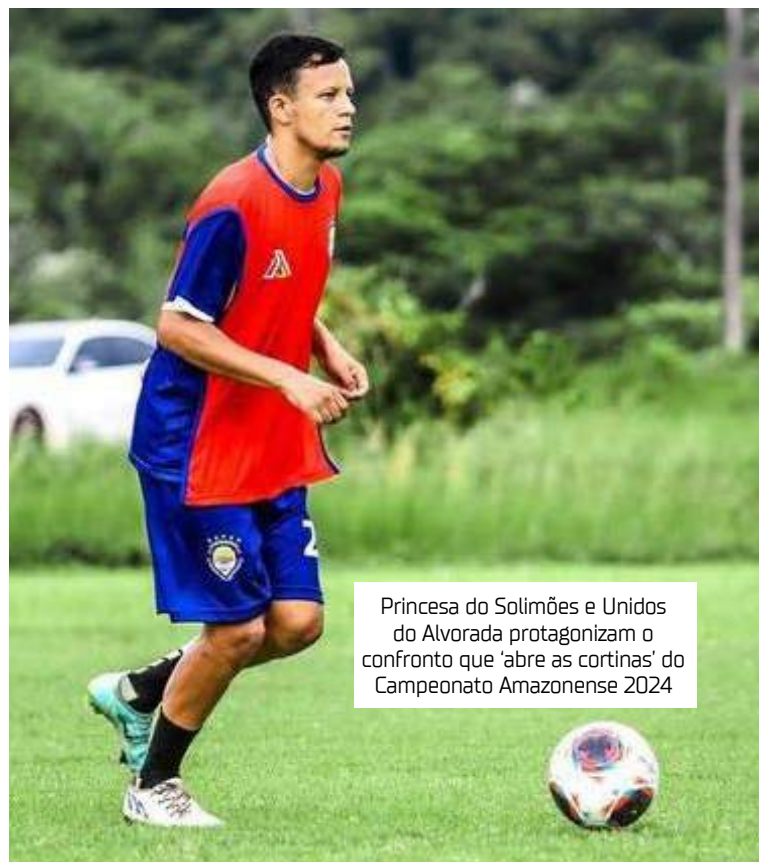
Princesa do Solimões e Unidos do Alvorada protagonizam o confronto que 'abre as cortinas' do Campeonato Amazonense 2024