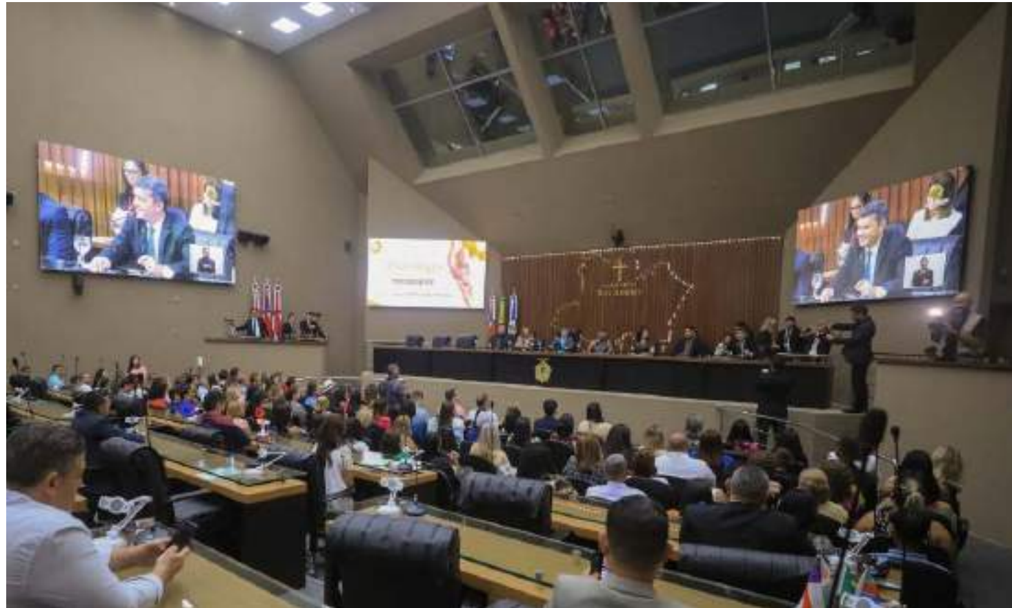
Assembleia Legislativa do Amazonas produz matérias sobre saúde mental