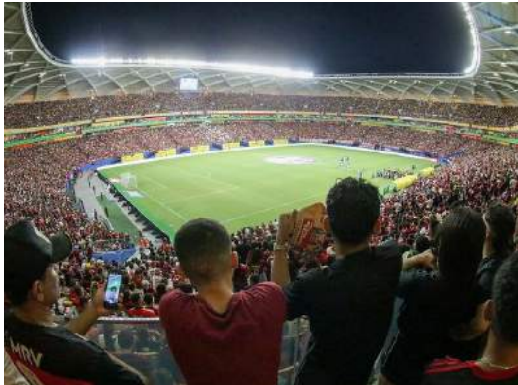
Foi a primeira vez que o Flamengo voltou a Manaus desde 2016, quando perdeu para o Vasco por 2 a 0

“É um grande palco, já tiveram vários jogos grandiosos aqui na Arena da Amazônia e a gente sempre espera ter essa qualidade. O gramado foi elogiado, as áreas comuns estão muito boas, os banheiros