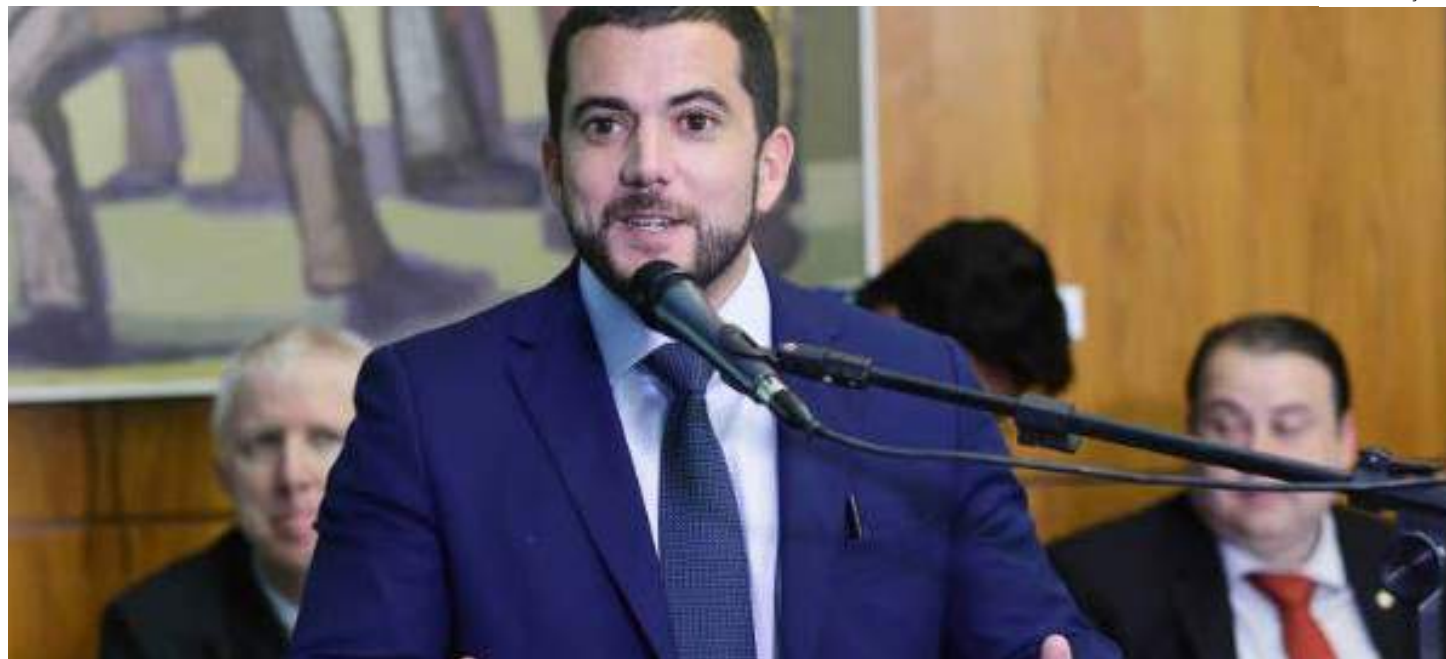
O deputado federal Carlos Jordy (PL-RJ) investigado na Operação Lesa Pátria

sinais de que Jordy orientava CVC e “tinha o poder de ordenar as movimentações antidemocráticas, seja pelas redes sociais ou agitando a militância da região”.