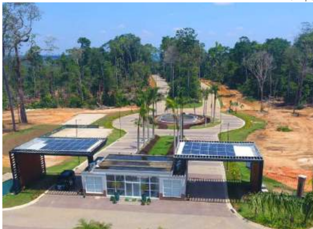
Quintas de São José do Rio Negro caminha para ser o maior condomínio do país em cidades com até 2 mil de habitantes

A degustação dos sabores da natureza é incentivada, com frutas frescas colhidas diretamente das árvores, conectando os moradores ao ciclo natural e proporcionando uma experiência gustativa autêntica.