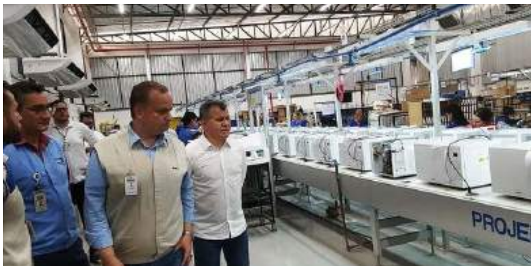
Cerca de 25% de toda a produção dos ventiladores da Philco no Brasil serão feitos no PIM

presa tentou implantar um Processo Produtivo Básico (PPB) para a fabricação de ventiladores na Zona Fran-