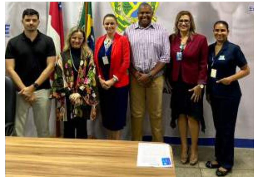
Centro de Ensino Literatus firma parceria com Sine Amazonas