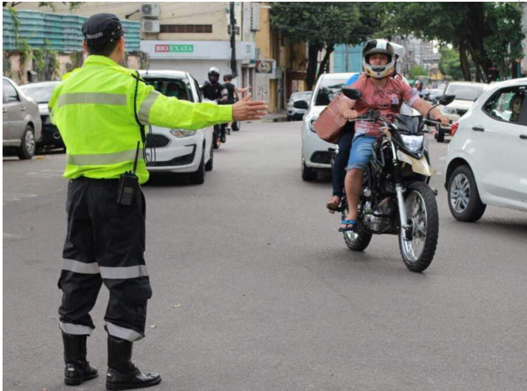
No ano passado, 119 motociclistas perderam suas vidas, em comparação com 103 em 2022

“Embora tenhamos observado uma queda geral nas fatalidades, o aumento de 15% nas mortes de motociclistas em 2023 nos direciona a focarmos neste modal. Nós estamos reforçando as ações de fiscalização para que os usuários do modal de duas rodas possam transitar com segurança. Temos feito ações e orientação com palestras, blitz monitoramento”, dis-