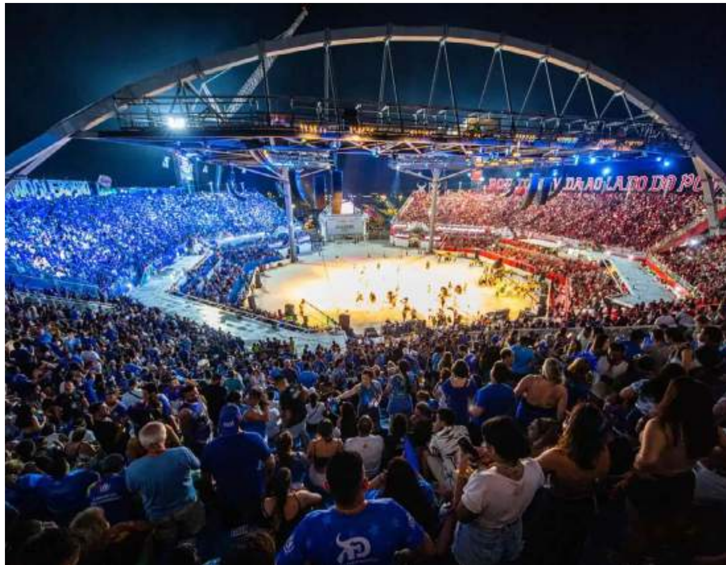
Setores disponíveis são cadeiras (tipo 1 ou tipo 2), arquibancada especial e arquibancada central

De 28 a 30 de junho, Parintins irá revelar ao mundo