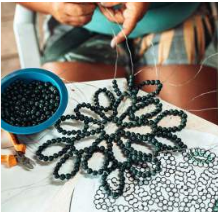
Varejista disponibiliza loja virtual com artesanatos da Amazônia