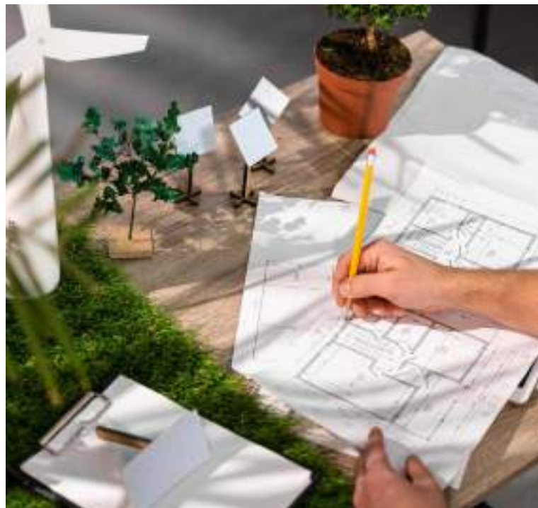
Novos projetos reforçam a necessidade de sustentabilidade no mundo