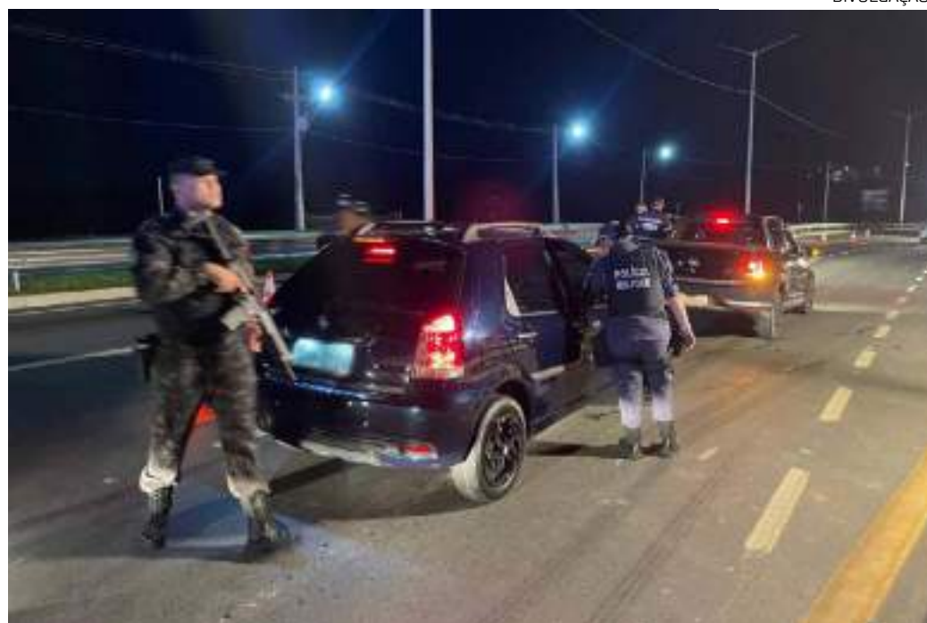
Os dados parciais fazem referência ao mesmo período de 2023

As áreas que recebem as ações estudadas cientificamente pelo Centro Integrado de Estatística de Segurança Pública (Ciesp) e pelas agências de inteligência da SSP-AM, Polícia Militar (PMAM), Polícia Civil (PC-AM) e da Secretaria de Administração Penitenciária (Seap).