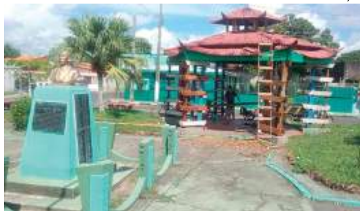
Praça Dr. Tsukasa Uetsuka inaugurada em homenagem à imigração

“Tendo em vista as contribuições dos Koutakuseis, escolhemos o dia 20 de ju-