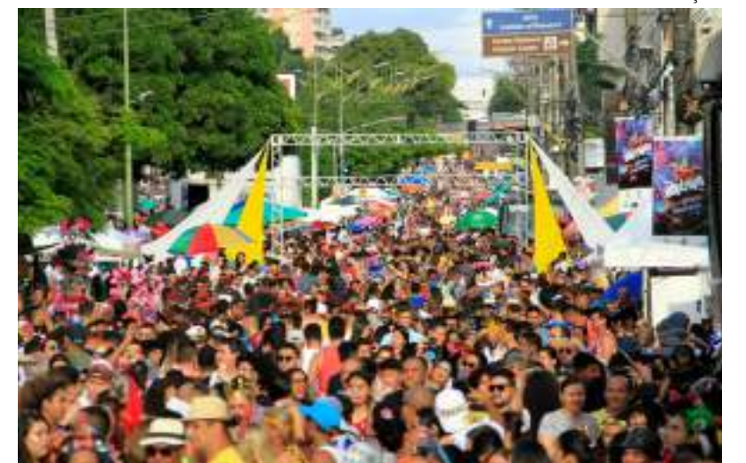
Blocos e bandas vão receber apoio da Prefeitura de Manaus