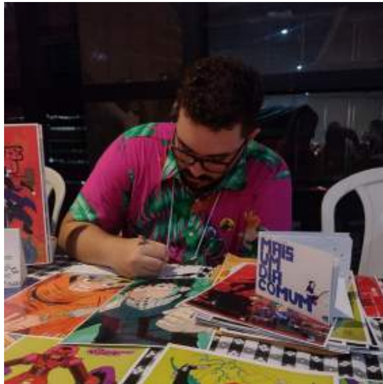
Evento agrega diversos grupos do mundo geek, no Palacete Provincial