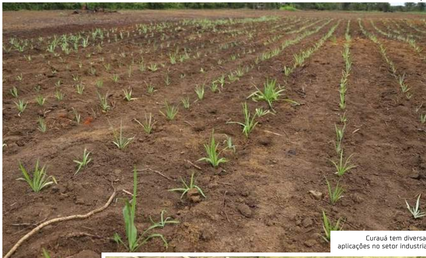
Curauá tem diversas aplicações no setor industrial

“Estamos falando de um projeto de bioeconomia, porque utiliza o insumo da Amazônia num processo produtivo-industrial, no caso específico de termoplásticos, que tem potencial para tornar a utilização da fibra economicamente viável”, destacou.