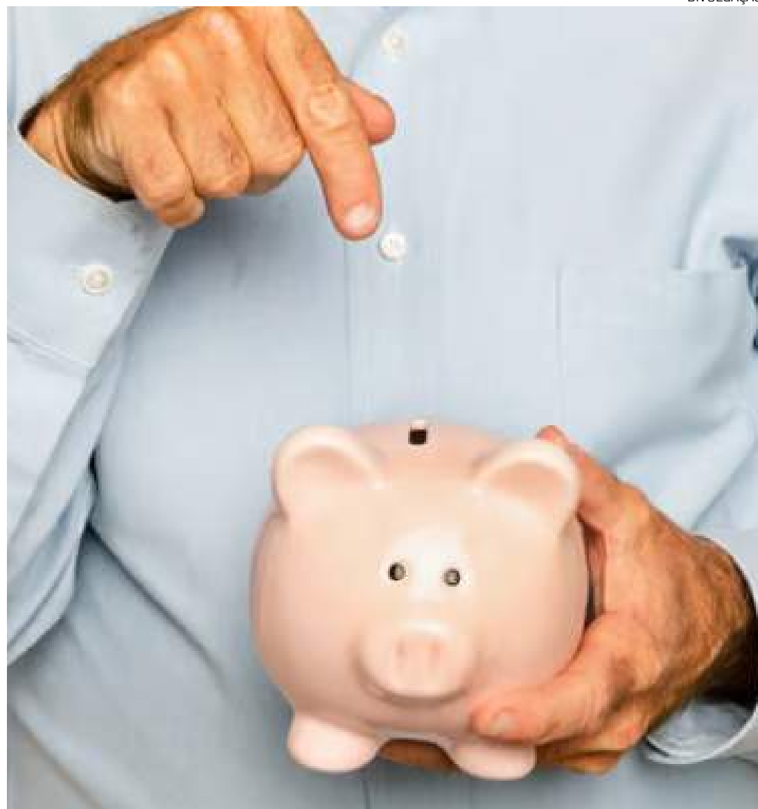
Não existe uma idade mínima e máxima para contratação de uma previdência

O PGBL é o tipo previdência recomendado para pessoas que fazem a declaração completa do Imposto de Renda. Aqui é permitido que o valor aportado durante o ano na previdência seja abatido no volume total de renda tributável anual até o