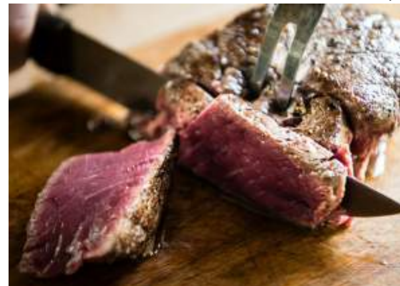
Churrasqueiros investem com foco na seleção das carnes