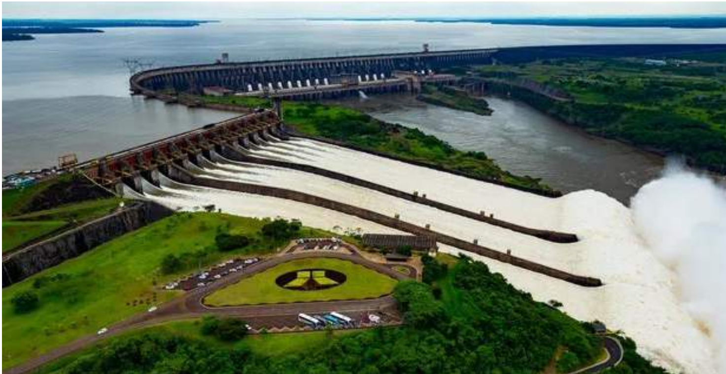
Pelo Tratado de Itaipu, cada país tem direito a 50% da energia gerada pela hidrelétrica de Itaipu

Esse compromisso brasileiro não está expresso no corpo do Tratado que constituiu a empresa binacional. Mas em um documento em anexo, a "nota reversal número cinco" —que, de acordo com o governo, hoje