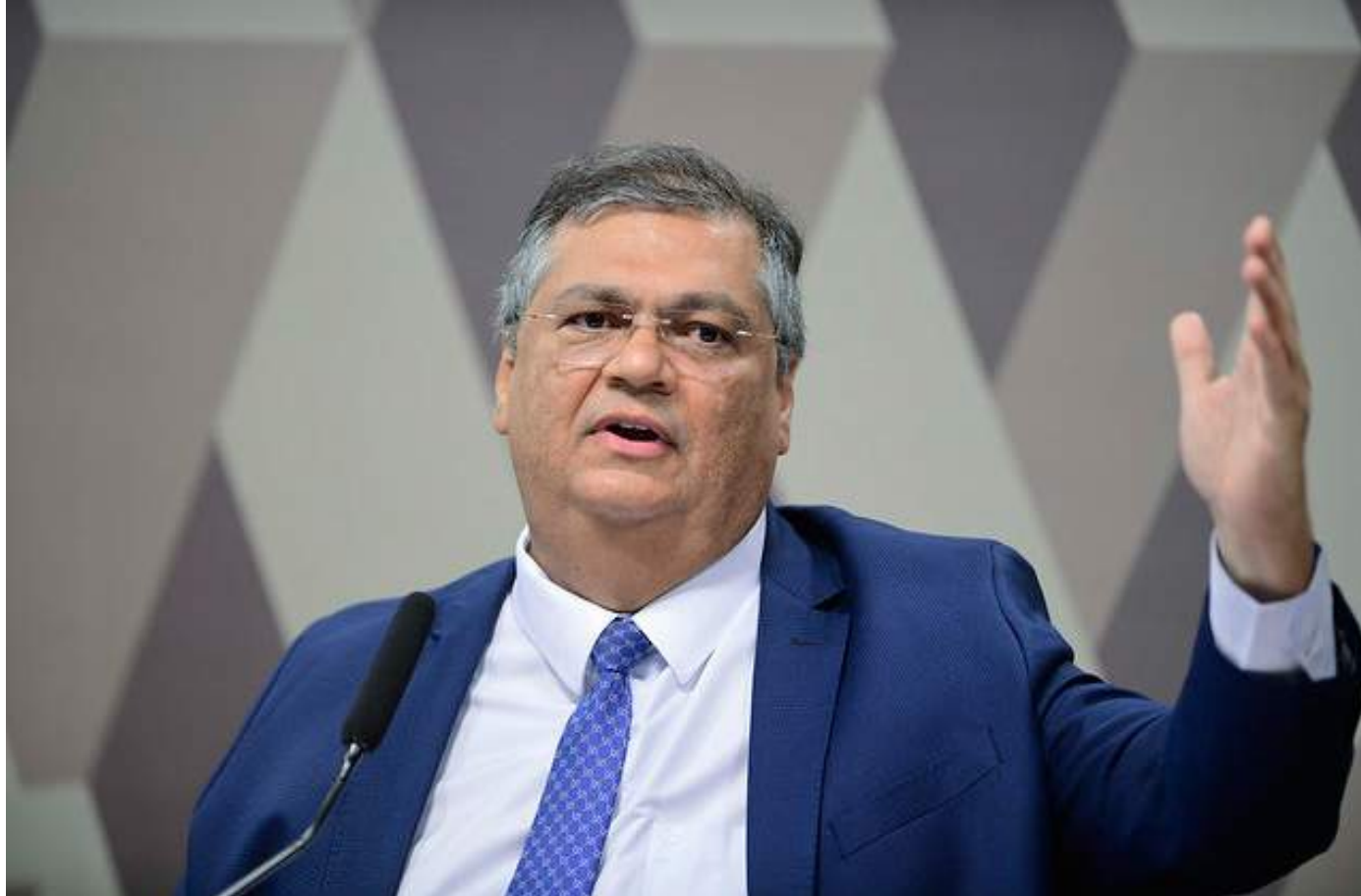
Ministro da Justiça afirma que "ninguém" tem apoio jurídico para "escolher arbitrariamente" quem será espionado

"Do ponto de vista jurídico, independente do caso concreto, que não me cabe ana-