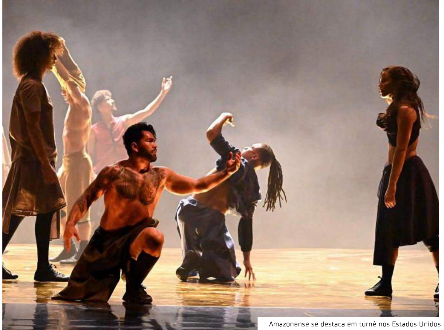
Amazonense se destaca em turnê nos Estados Unidos

"Cada movimento que a gente aprende é um limite que a gente supera. Então, ser BBoy pra mim é superar meus próprios limites. É como se, além