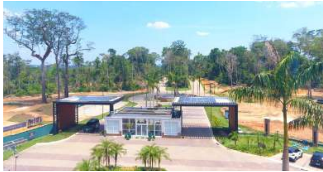
Preferências para residências de alto padrão têm evoluído

O Quintas de São José do Rio Negro está sendo construído pela BTP Urbanismo na estrada do Cetur, bairro do Tarumã, perto do centro da cidade, mas longe do burburinho e atende a necessidade de quem pretende adquirir um imóvel para morar com conforto e segurança. Está planejado sob o conceito de máxima pre-