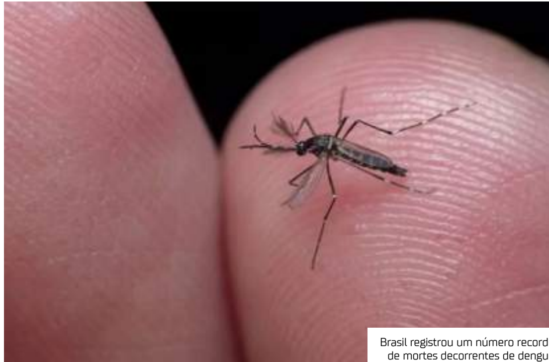
Brasil registrou um número recorde de mortes decorrentes de dengue

Segundo o diretor do Ministério da Saúde, desde o ano passado a pasta tem adotado uma série de medidas para enfrentar a dengue, como a criação de uma Sala Nacional de Arbovirose em conjunto com