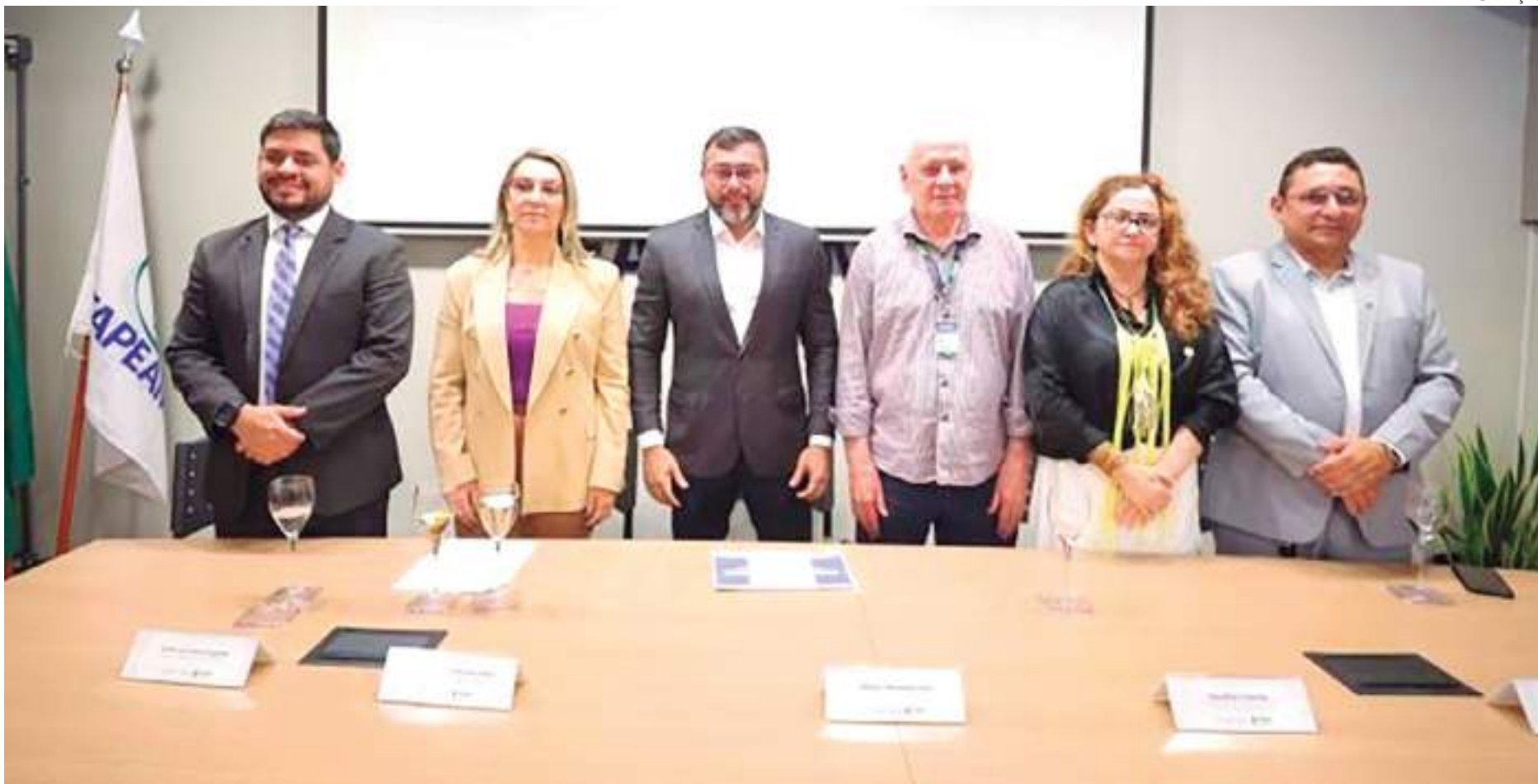
Wilson lança seis novos editais de programas coordenados pela Fapeam

O anúncio foi feito na sede da Fapeam, bairro Flores, Zona Centro-Sul de Manaus. Os editais estarão disponíveis, a partir de 14h desta quinta-feira, no site www.fapeam.am.gov.br . Serão apoiados cerca de 800 projetos e concedidas mais de cinco mil bolsas de ensino e pesquisa a estu-