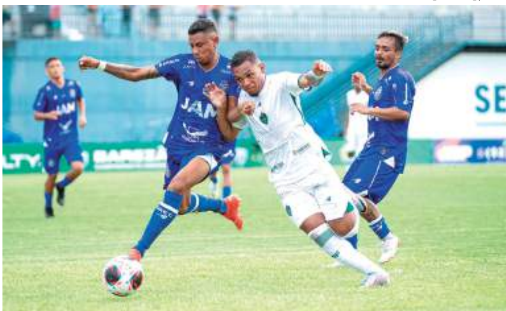
Ambas as equipes chegaram ao segundo empate em duas rodadas de Campeonato Amazonense

A FOME É DIÁRIA. O NOSSO TRABALHO TAMBÉM!