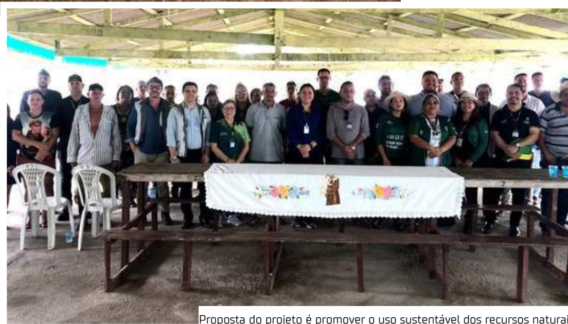
Proposta do projeto é promover o uso sustentável dos recursos naturais

Participaram do evento representantes da Secretaria de Estado de Desenvolvimento Econômico, Ciência, Tecnologia e Inovação (Sedecti); Secretaria de Estado de Produção Rural (Sepror); Secretaria de Estado de Ciência, Tecnologia e Inovação (Secti); Centro de Biotecnologia da Amazônia (CBA); Instituto de Desenvolvimento Agropecuário e Florestal Sustentável do Estado do Amazonas (Idam) e membros da iniciativa privada.