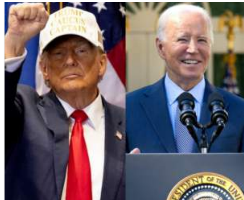
Um ‘repeteco’ não se mostra atraente para os eleitores que querem “sangue novo”