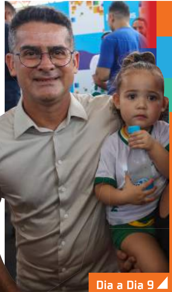
O prefeito de Manaus, David Almeida, realizou, na manhã desta quinta-feira [25], uma visita técnica no andamento das obras da nova creche municipal Severo Câmara, localizada na comunidade Braga Mendes, bairro Cidade de Deus, Zona Norte da cidade. A estrutura será colocada à disposição da população no mês de fevereiro com mais de 200 vagas e, segundo o chefe do Executivo municipal, o número de matriculados chegará a 10 mil crianças.