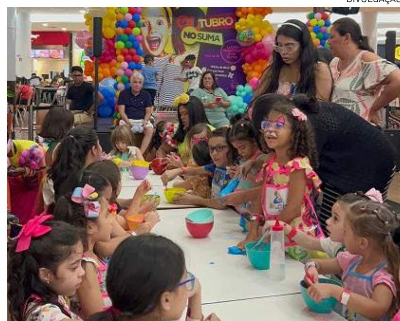
Qualificação do curso técnico de gastronomia do Cetam