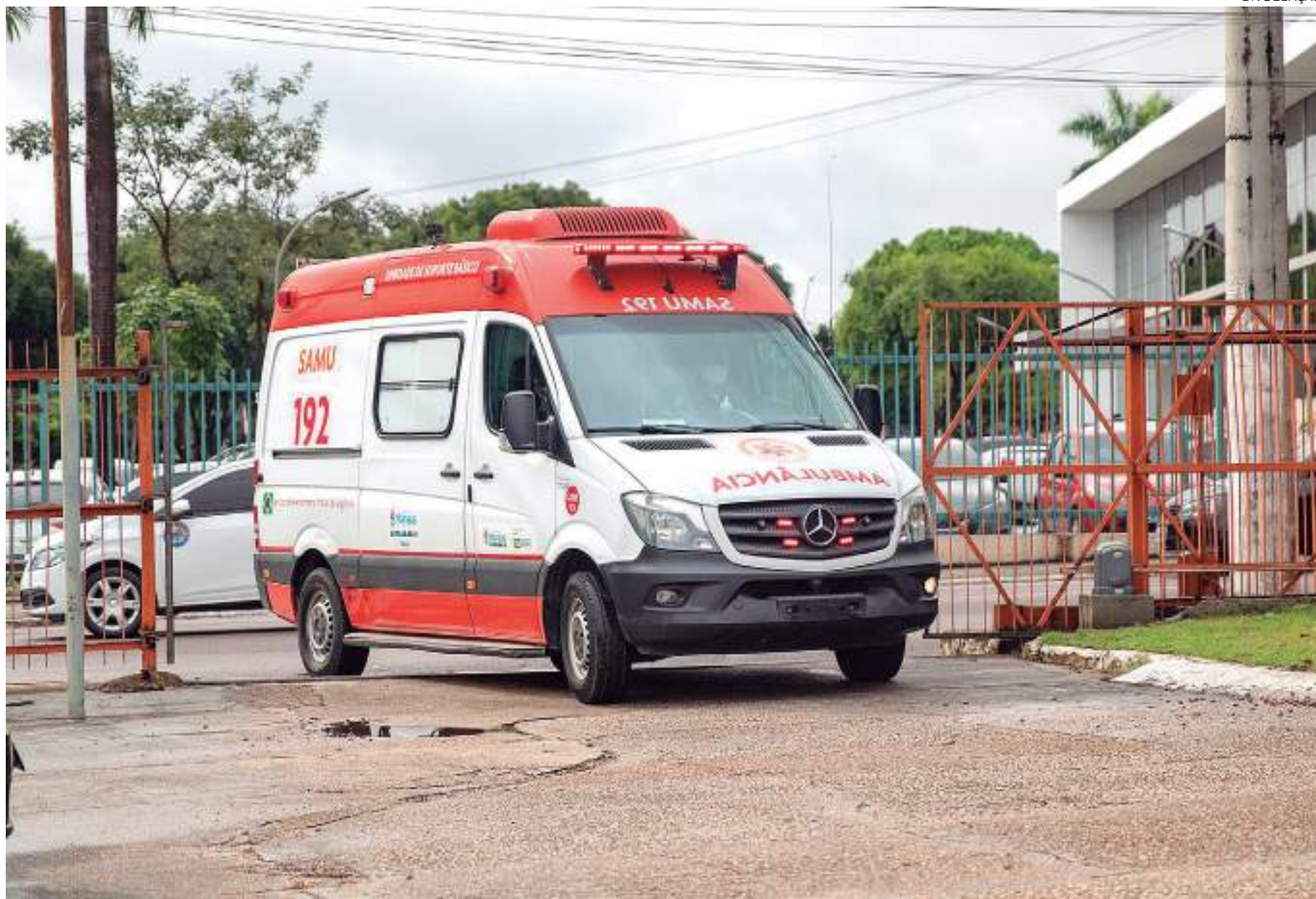
No ano passado, o Samu 192 contabilizou 55.614 envios de unidades do serviço para prestar socorro em casos de urgência e emergência