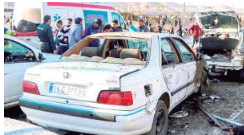
Pessoas se reúnem no local das explosões em Kerman, no Irã