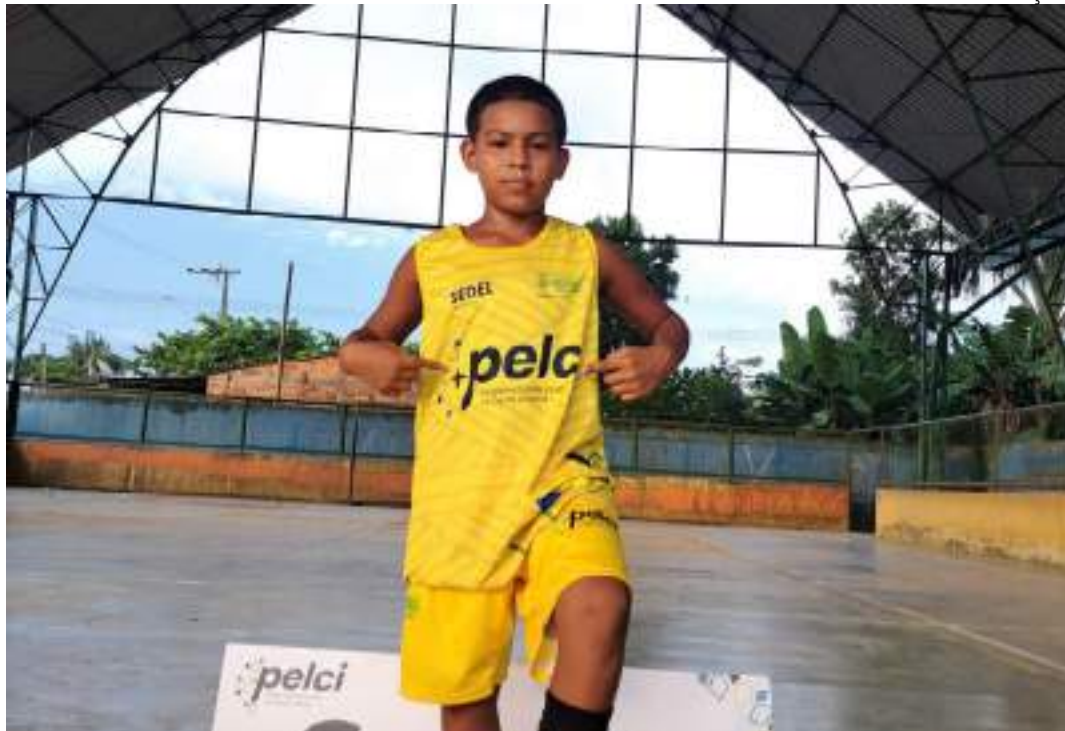
Após inauguração do polo do Pelci em Codajás, o jovem passou a praticar as aulas no programa

O jovem receberá passagens do Governo do Amazonas para viajar à Curitiba, onde fará monitoramento anual até completar 14 anos, quando passará por nova avaliação de ingresso nas categorias de base do clube. "Os planos são que ele se dedique mais aos estudos e ao futebol. Vamos continuar indo para Curitiba e, se for da vontade de Deus,