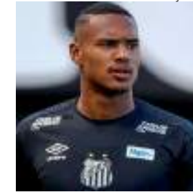
Goleiro tem 27 anos