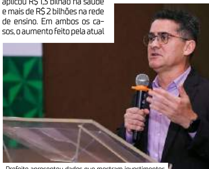
Prefeito apresentou dados que mostram investimentos