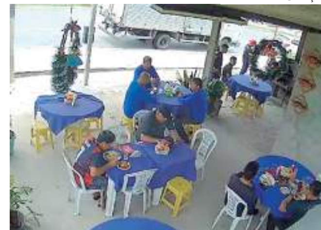
Caso foi registrado no 19º Distrito Integrado de Polícia (DIP)