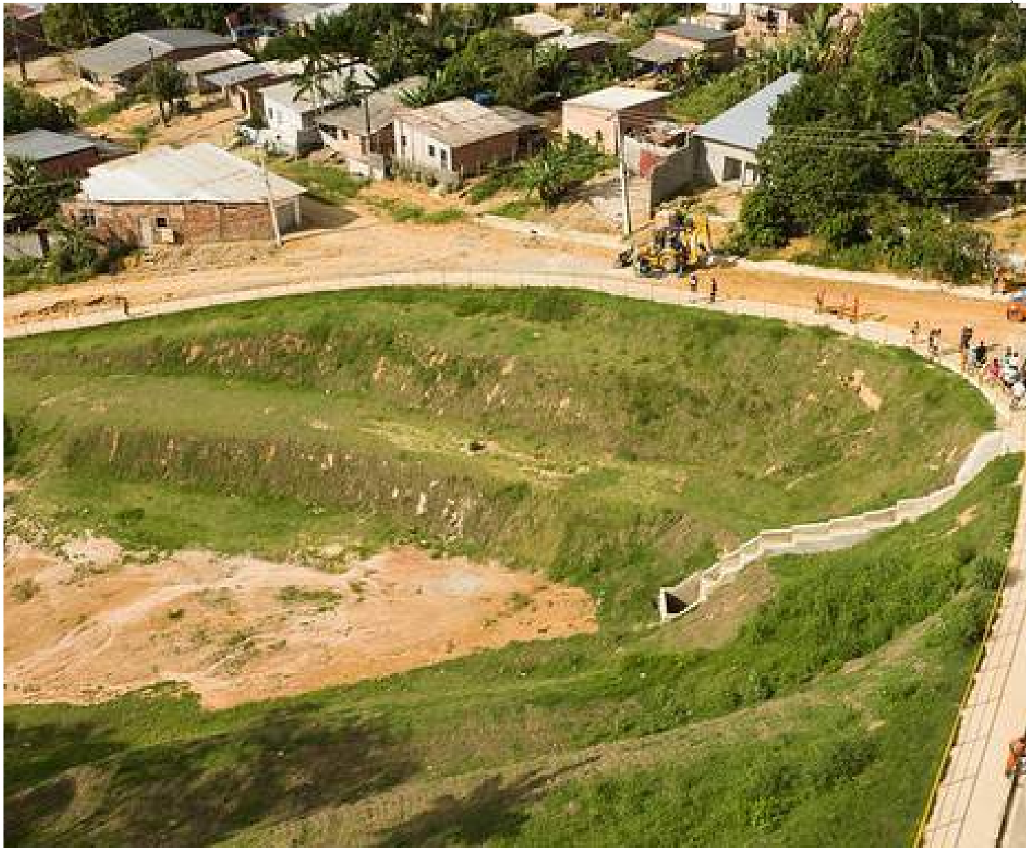
Área de erosão na comunidade Parque das Tribos foi recuperada pela Prefeitura de Manaus

A Secretaria Municipal de Infraestrutura (Seminf) iniciou, no primeiro semestre de 2023, a intervenção com a recomposição do talude, seguida de construção do muro de contenção e de sustentação do aterro, implantação de rede de drenagem profunda e super-