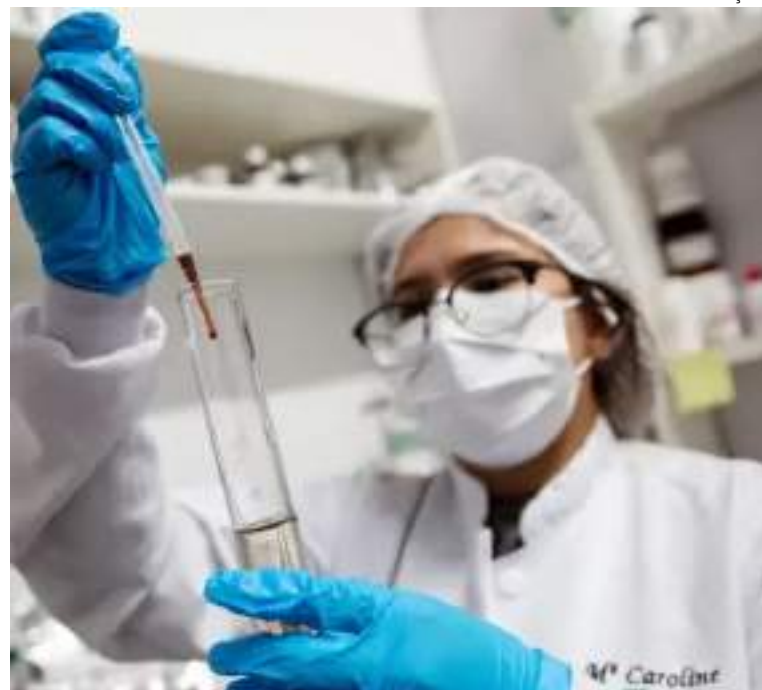
Guia aponta que área da saúde tem tendência de crescer em 2024

nidades que estão em alta ao redor do mundo, mas ainda são pouco exploradas no Brasil, como soluções tecnológicas para pequenas e médias empresas, soluções sustentáveis na agricultura e a oferta de serviços de saúde e bem-estar para populações de baixa renda em comunidades carentes. O material está disponível no link: https://agenciasebrae.com.br/wp-content/uploads/2024/01/Tendencias_de_empreendedorismo_2024.pdf