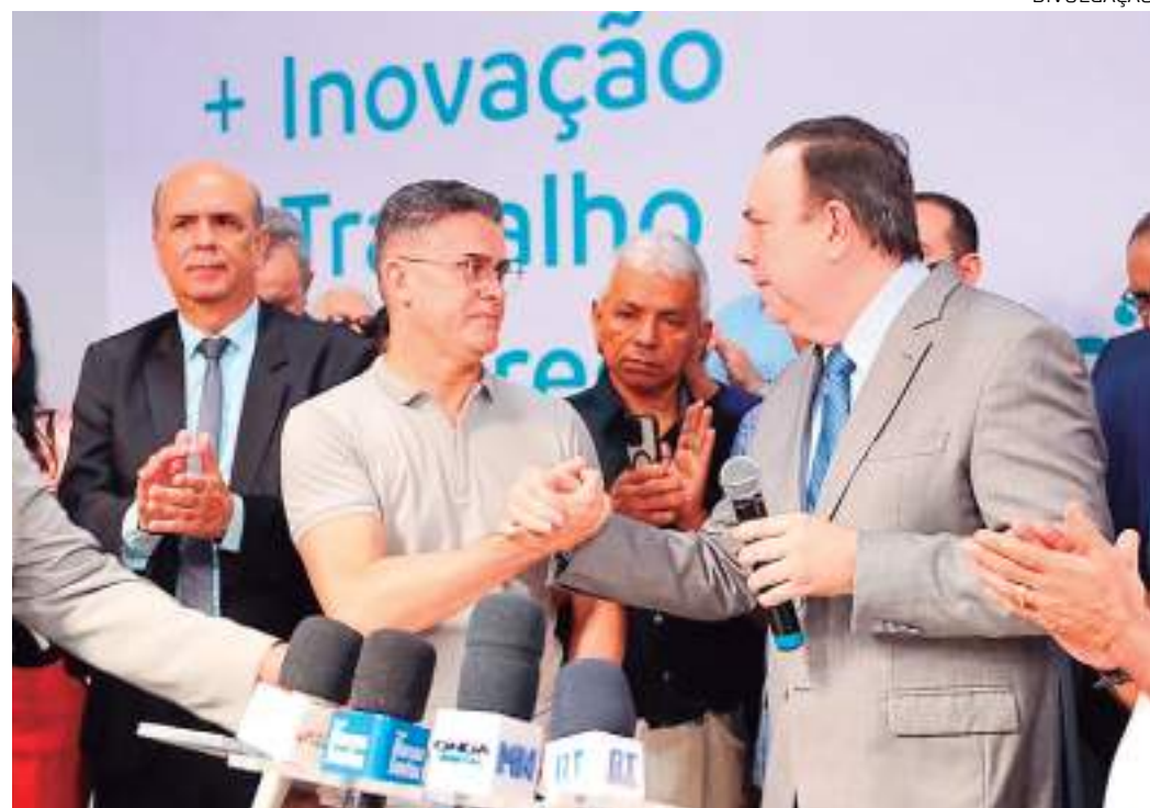
Área é dividida em seis salas, que poderão ser utilizadas por advogados para atender seus clientes

"Aqui a gente vai ter um apoio melhor para atender nossos clientes, para estar conversando sobre como vai ser o andamento dos processos, toda a dinâmica que o advogado precisa", ressaltou.