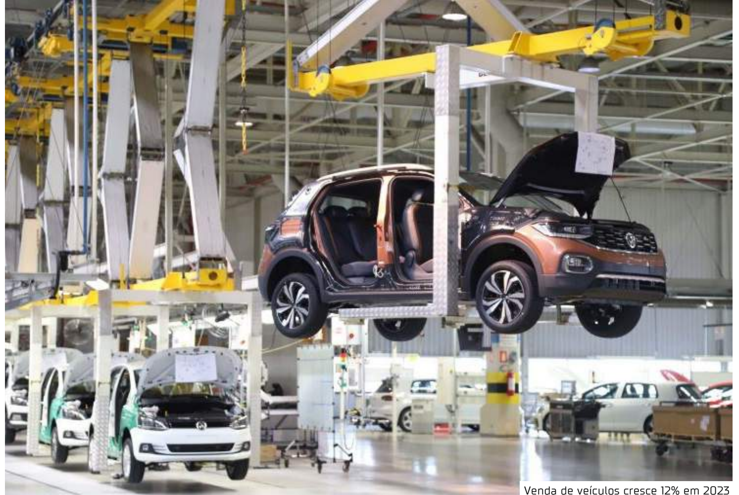
Venda de veículos cresce 12% em 2023

A venda de caminhões deve crescer 10%, com 114.571 unidades emplacadas e o segmento de ônibus deve alcançar as 29.546 unidades vendidas, um aumento de 20%. Os implementos rodoviários podem crescer 10%, com 99.296 unidades vendidas. A estimativa para as motocicletas é a de 1.834.571 de unidades comercializadas, correspondendo a um incremento de 16%.