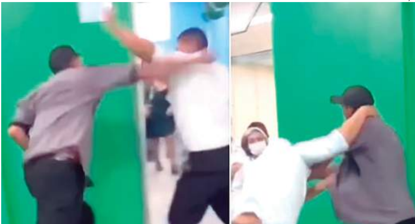
Ainda não há informações sobre a motivação da violência na unidade de saúde localizada na Zona Norte