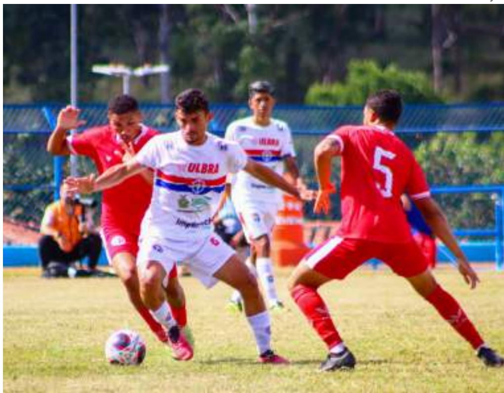
Fast Clube é o representante do futebol amazonense na Copinha pela terceira vez consecutiva