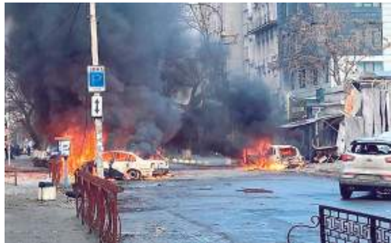
Ataque da Rússia a Kherson, na Ucrânia