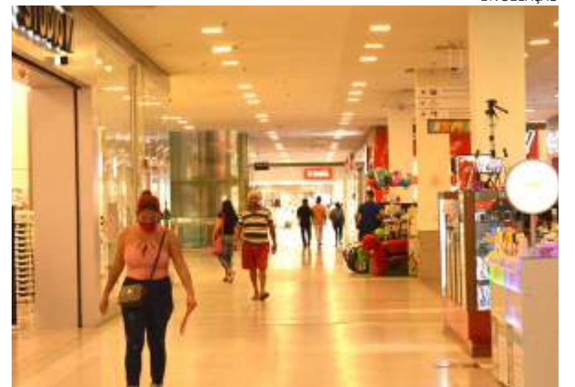
Shopping Manaus ViaNorte estará com a promoção "Liquida Tudo"