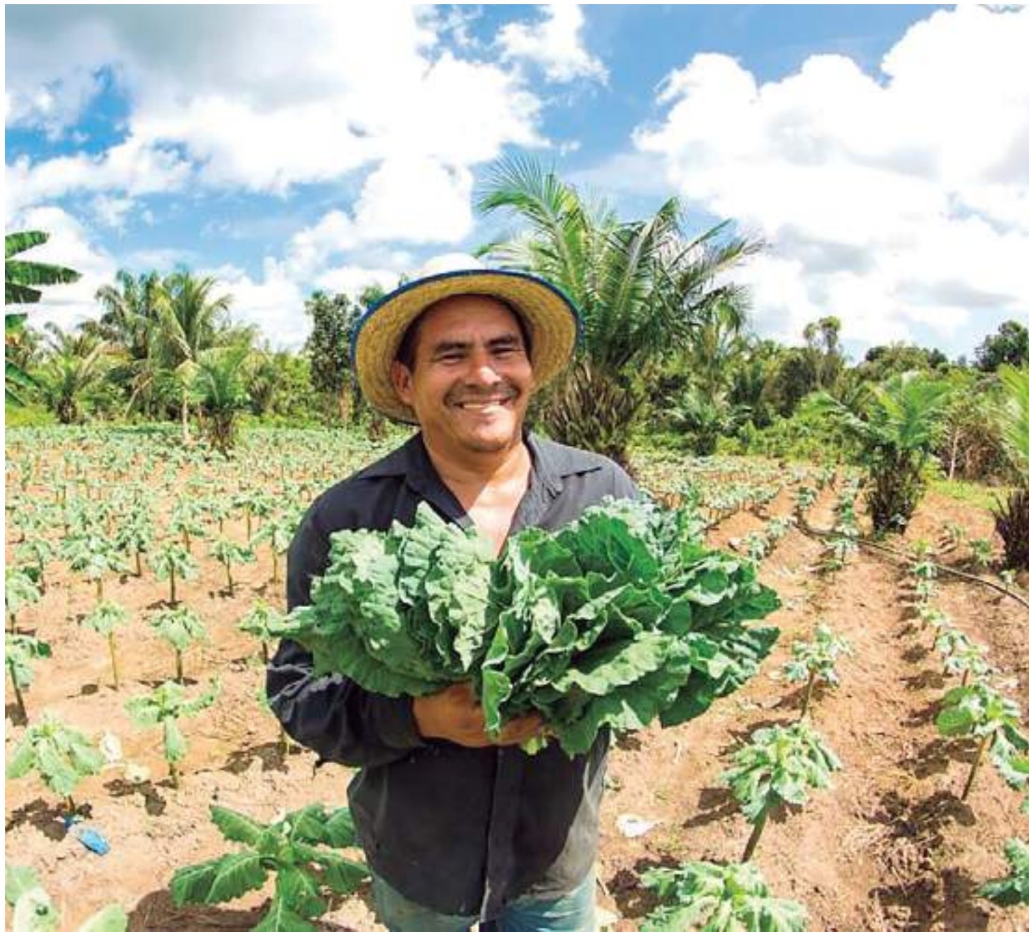
Programa é uma das iniciativas da Agência de Desenvolvimento Sustentável do Amazonas (ADS) que estimula a produção de produtos regionais no AM

Durante a estiagem, os municípios de Tefé (a 523 quilômetros de Manaus) e Juruá (a 674 quilômetros de Manaus), foram beneficiados por meio do PAF, a ação beneficiou 10 produtores rurais com a comercialização de 733 qui-