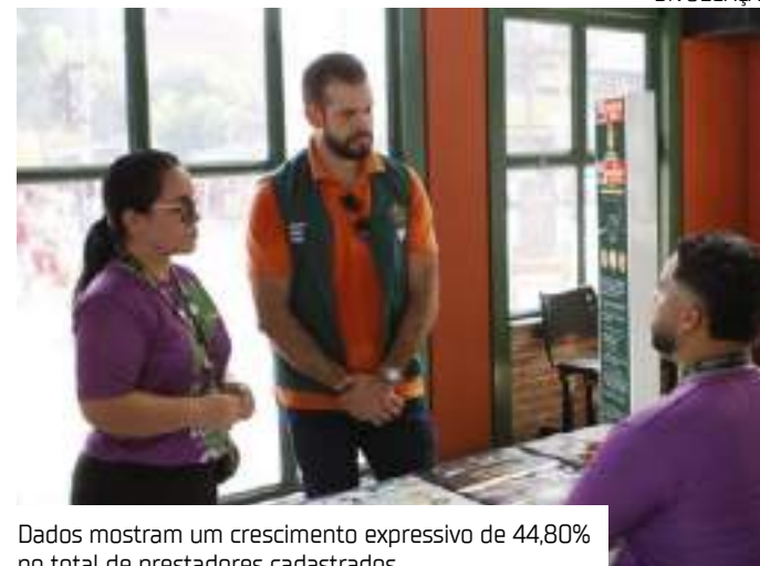
Dados mostram um crescimento expressivo de 44,80% no total de prestadores cadastrados

Benefícios do Cadastur O Cadastur oferece benefi-