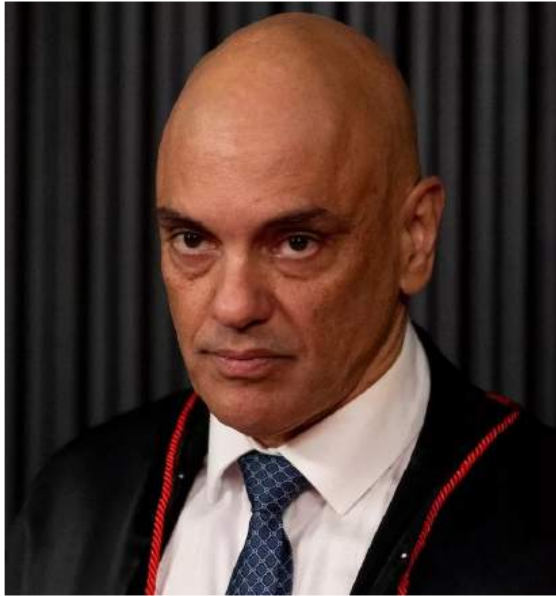
Magistrado é relator das investigações sobre o caso no Supremo Tribunal Federal (STF)

"Eu já recebia ameaças da criminalidade organizada. O esquema é o mesmo há quase nove anos. Esses golpistas são extremamente corajosos virtualmente e muito covardes pessoalmente. Então, chegam muitas ameaças, principalmente contra minhas filhas, porque até nisso eles são misóginos. Preferem ameaçar as meninas e sempre com mensagens de cunho sexual. É um povo doente", declarou.