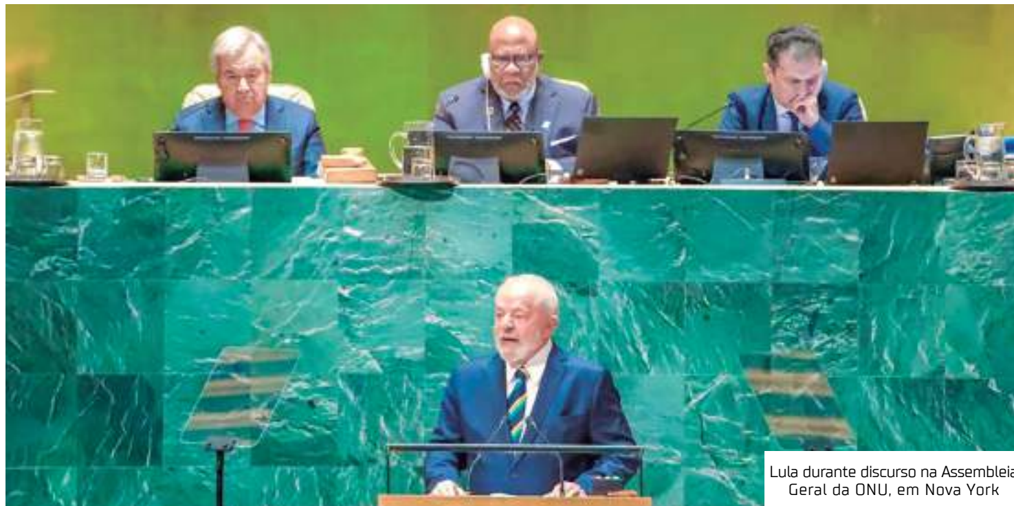
Lula durante discurso na Assembleia Geral da ONU, em Nova York

De acordo com o governo, o pagamento da dívida "fortalece a imagem do Brasil no cenário internacional global e regional, reafirma o compromisso do país com o multilate-