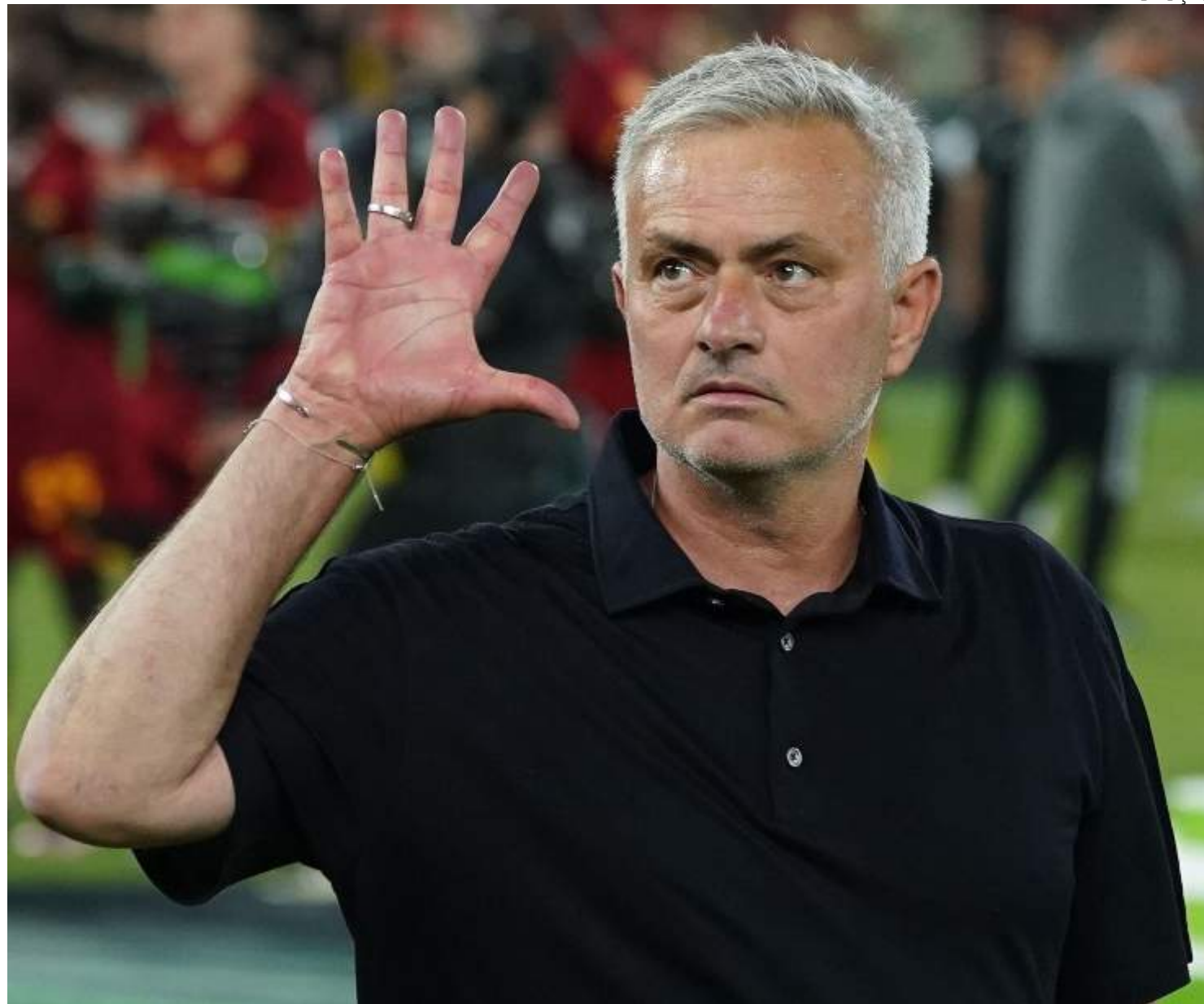
Atualmente na Roma, o português tem contrato expirando ao fim do primeiro semestre de 2024 e interessa à CBF

Com renovação de Carlo Ancelotti junto ao Real Madrid, CBF busca opções para o cargo