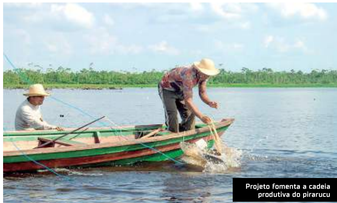
Projeto fomenta a cadeia produtiva do pirarucu

números de destaque, como o aumento de 202% na renda média de milhares famílias beneficiadas e a queda de 40% no desmatamento em áreas atendidas entre 2008 e 2021.