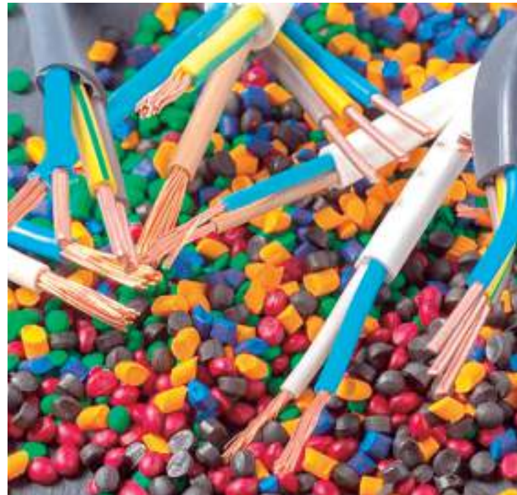
Vida Polímeros do Amazonas foi pioneira na fabricação de resinas termoplásticas