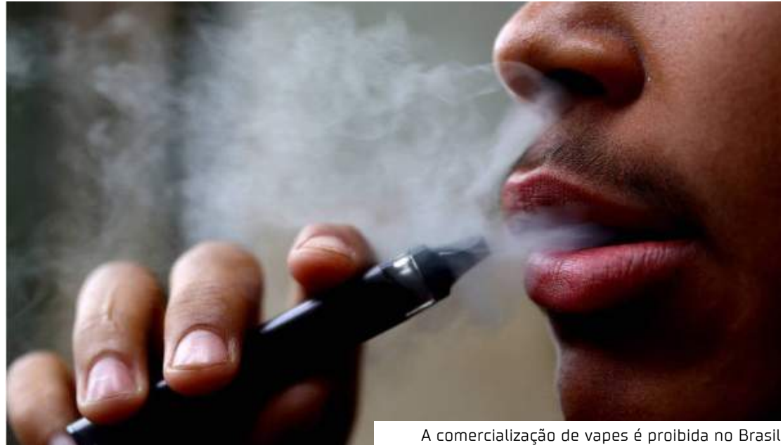
A comercialização de vapes é proibida no Brasil

Para o médico pneumologista Renato Eugênio Macchione, o aumento do consumo é uma realidade, mas isso não significa que a regulamentação vá melhorar esse panorama. Ele rechaça os argumentos de que o regramento po-