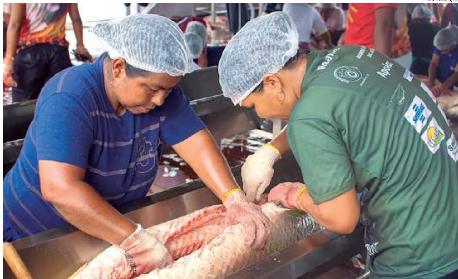
Estabelecimento recebe combos de pirarucu elaborados sob medida, com cortes especiais e de forma mensal

A origem sustentável do pescado que é comercializado via Piraruclub também é um atrativo para os consumidores que estão cada vez mais conscientes sobre os impactos de seus hábitos de consumo sobre o planeta. "Além de ter à disposição um peixe de ótima qualidade, o cliente também está contribuindo para esse ciclo de sustentabilidade do consumo do pirarucu e do desenvolvimento social das comunidades envolvidas na atividade", resume.