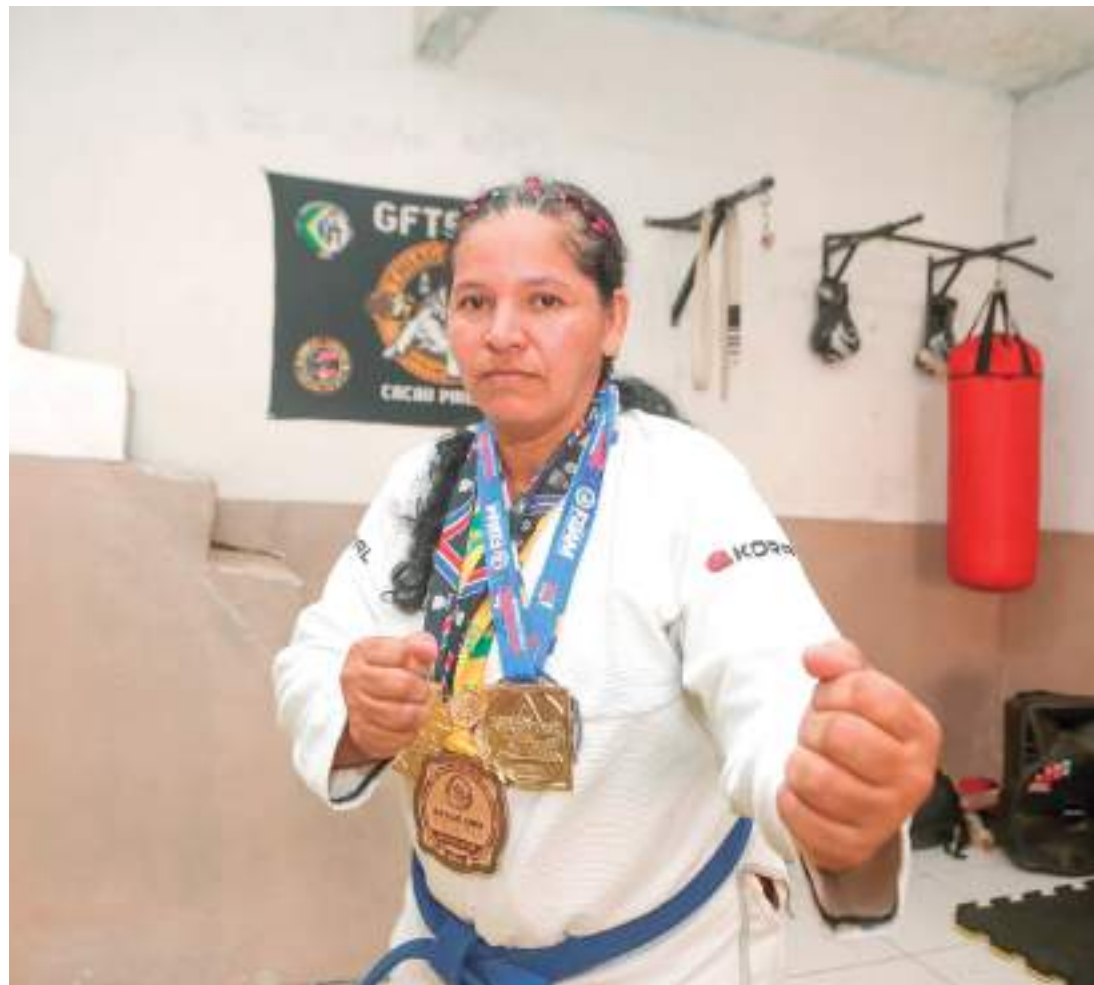
Atleta natural de Iranduba superou adversidades durante sua trajetória como atleta