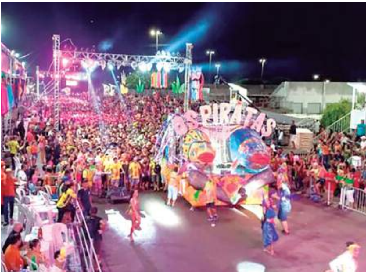
Organização está apostando no bloco Os Piratas para fechar primeira noite do evento