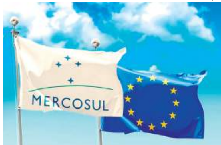
Bandeiras do Mercosul e da União Europeia