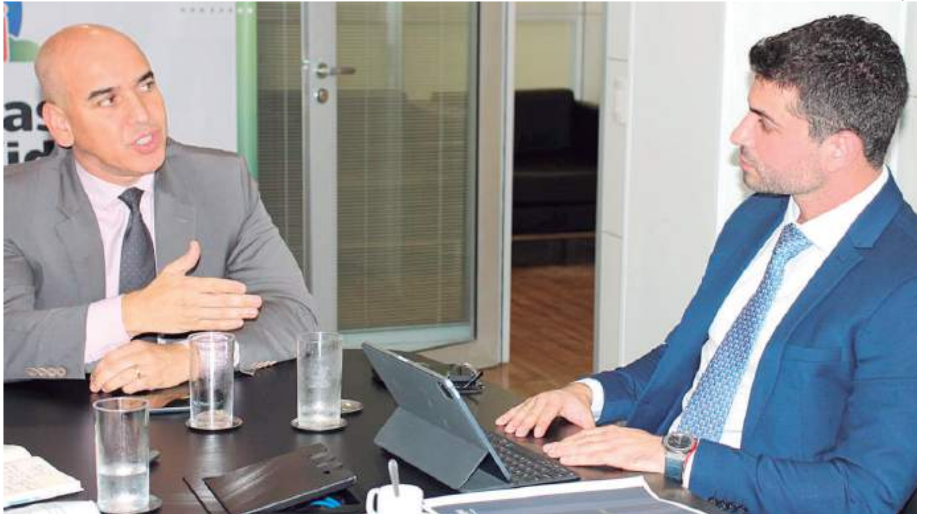
Diretor-presidente da Suhab se reuniu com representantes da Secretaria Nacional de Habitação

Ao todo, foram seis projetos apresentados pelo Amazonas com 720 unidades habitacionais aprovados pelo Governo Federal, sendo dois da Secretaria de Estado de Desenvolvimento Urbano e Metropolitano (Sedurb) e quatro da Suhab, o Conjunto Cidadão 10,