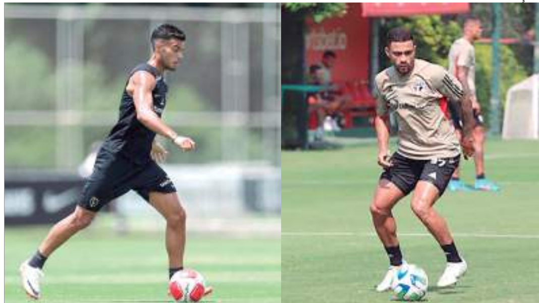
Corinthians nunca foi derrotado pelo São Paulo em clássicos na Neo Química Arena