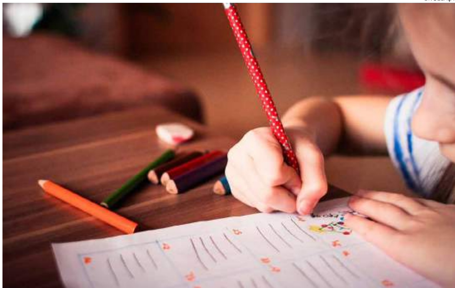
Cenário nacional, que já preocupava antes da pandemia de Covid-19, se agravou ao longo dela

Enfrentar esse desafio passa por duas estratégias principais e urgentes, que precisam ser implementadas em paralelo. A primeira é investir em práticas pedagógicas de qualidade, voltadas à alfabetização das crianças que estão chegando agora aos primeiros anos do Ensino Fundamental, para que aprendam a ler e escrever na idade certa. A segunda é implementar propostas de recomposição das aprendizagens voltadas a aqueles estudantes que não aprenderam a ler e escrever até