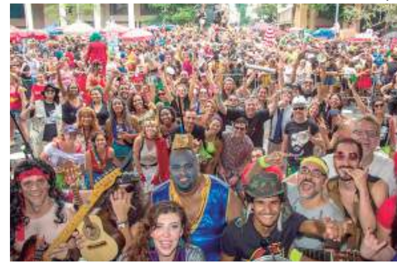
Turista brasileiro deve gastar mais neste Carnaval