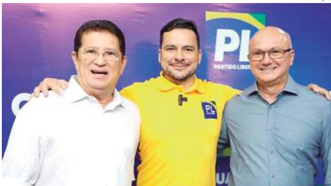
Nascimento vai direcionar atividades para organização do partido

“0% de chance de vir candidato em qualquer que seja a disputa em 2024”, declarou.