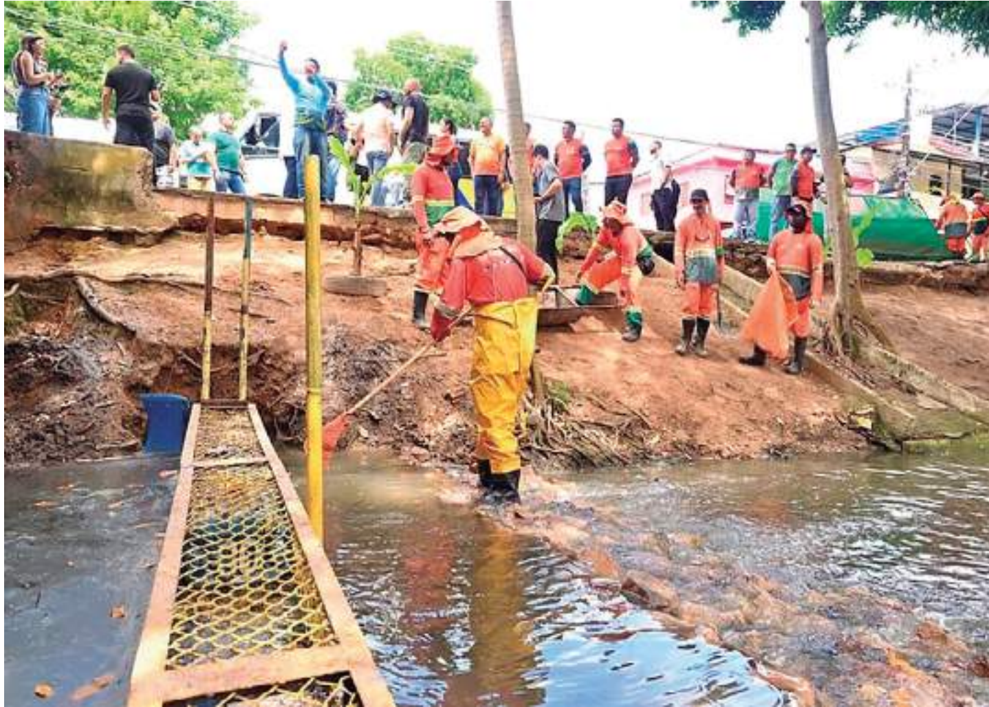
Área no entorno do igarapé também será totalmente reestruturada com serviços executados por meio da Seminf