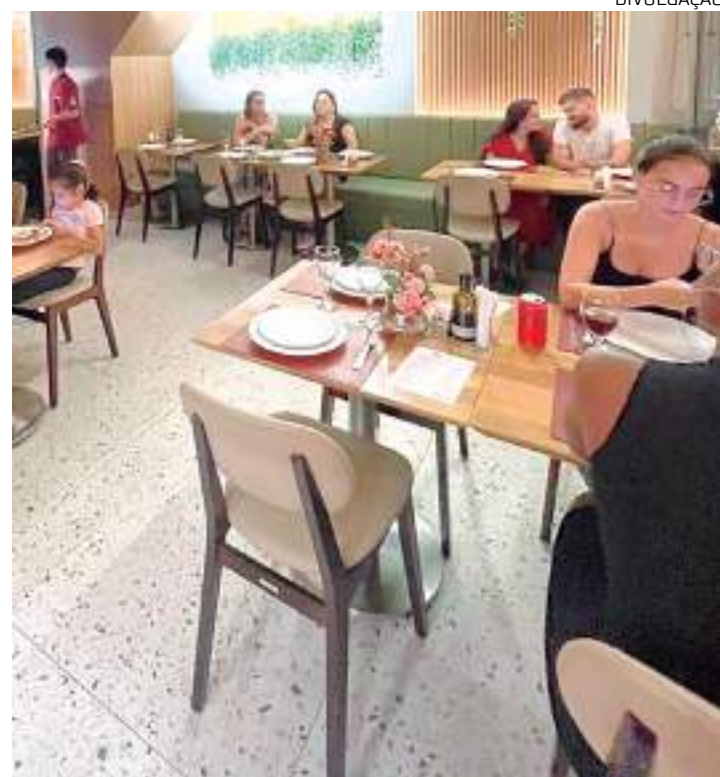
Novidades expandem o leque de opções para clientes habituais

O duo de restaurantes está localizado no Sollarium Mall, na Avenida Professor Nilton Lins, 1591, Loja 02 e 03 - Flores, Zona Centro-Sul de Manaus. Mais informações pelo (92) 9 8440-2303.