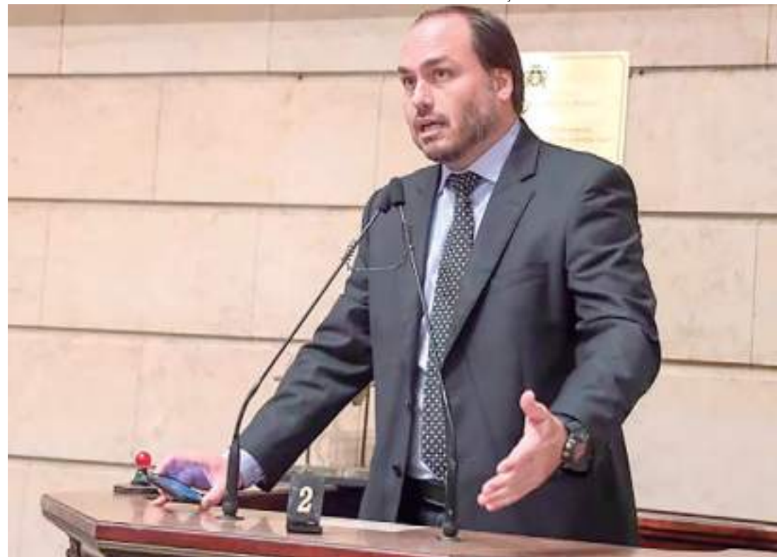
Segundo investigações, Carlos Bolsonaro é suspeito de ter criado a 'Abin paralela'

De acordo com a mensagem de WhatsApp, que faz parte do inquérito, a solicitação envol-