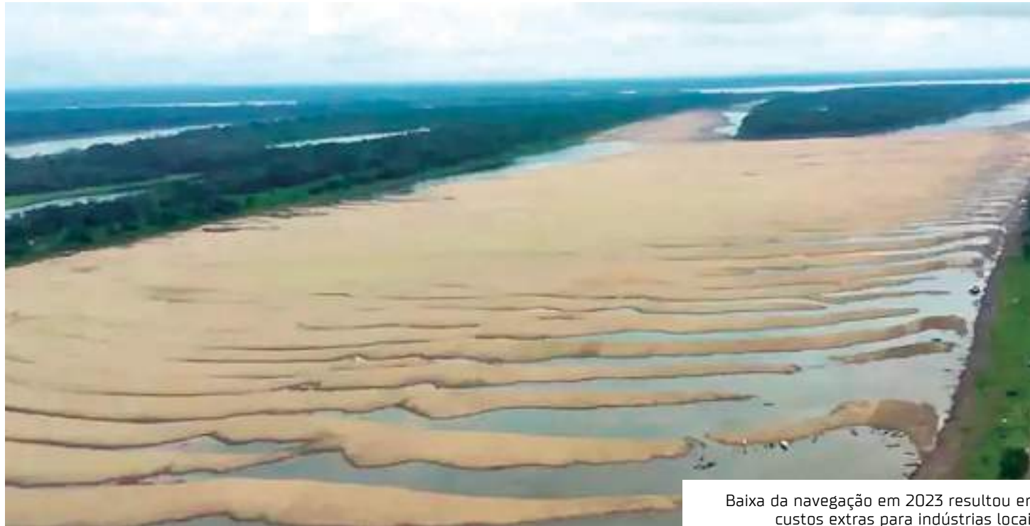
Baixa da navegação em 2023 resultou em custos extras para indústrias locais

A interrupção da navegação de grande porte gerou reduções na arrecadação tributária do Estado. "As perdas acumuladas na arrecadação de ICMS de outu-