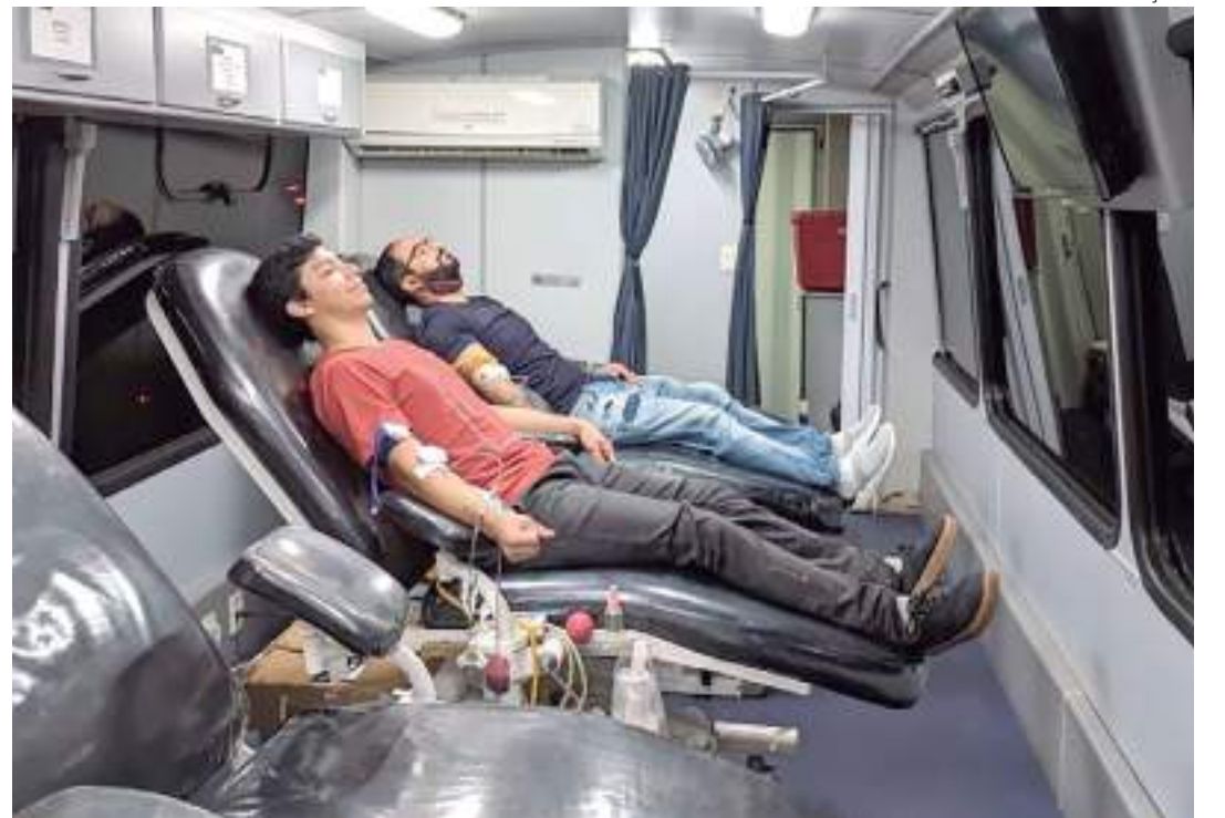
Ônibus estará posicionado no estacionamento externo LI

O empreendimento reúne um mix que se destaca pelas marcas exclusivas, nacionais e internacionais. O shopping reúne apro-