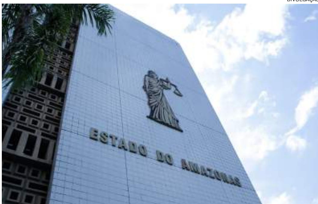
Segundo o Tribunal de Justiça do Amazonas, o julgamento foi adiado a a pedido do MPE