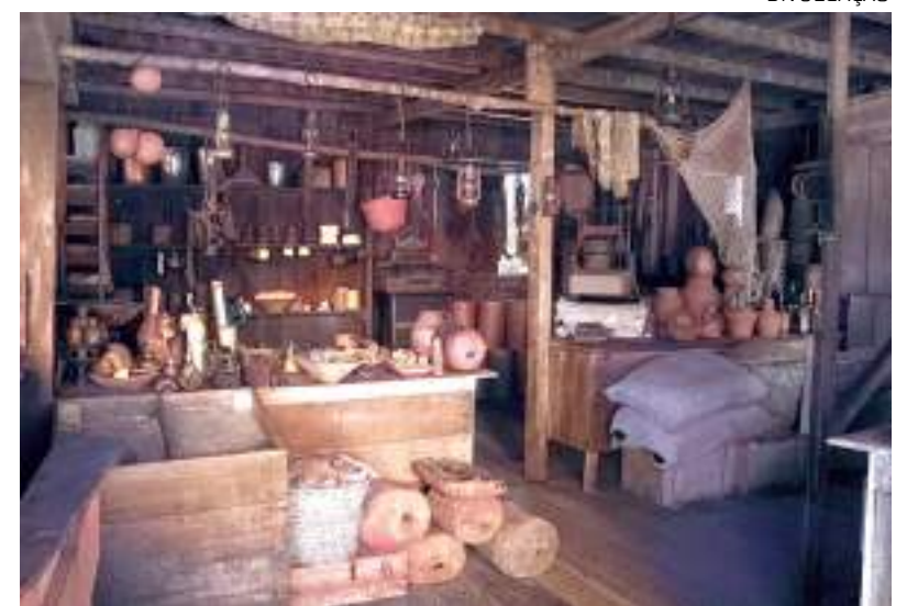
Acesso ao museu é somente via fluvial pela marina do Davi, Ponta Negra