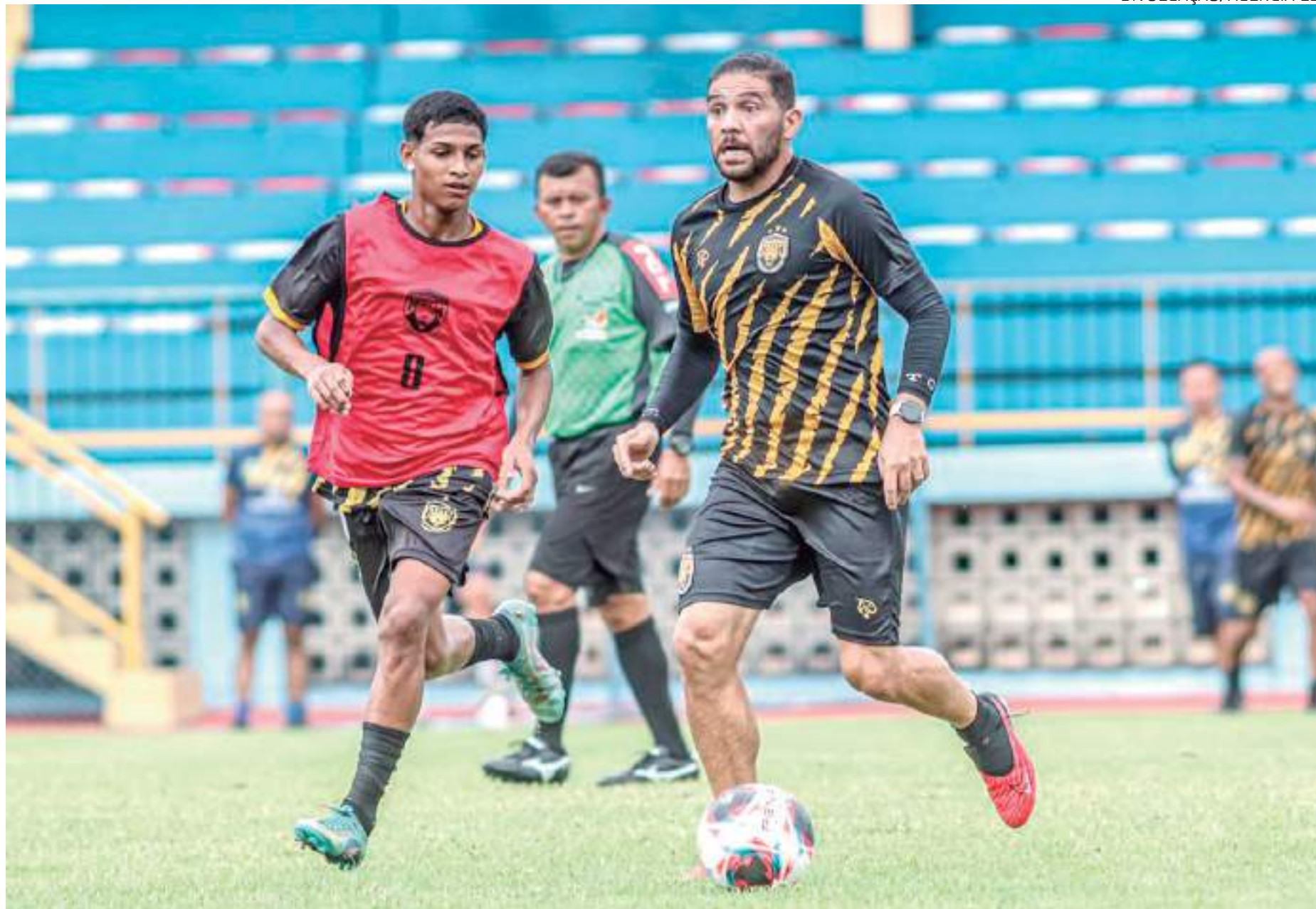
Programação das Feras da Base antes da estreia ainda reserva mais um jogo-treino nos próximos dias, desta vez contra a equipe feminina Sub-20 do JC Futebol Clube

“Bom, a gente estava dando mais importância na parte física. Agora estamos entrando na parte tática e técnica. Para nós, é uma avaliação enorme estar fazendo esse treinamento com profissional. É uma experiência única, até porque nos campeonatos, infelizmente, a gente não encontrou uma equipe que pudesse colocar uma imposição de jogo, fazer nosso time correr atrás da bola, aí a gente não consegue observar algumas dificuldades que a equipe tem. Esse tipo de treino aqui dá exatamente essas respostas que a gente precisa. A gente identificou alguns erros de posicionamento, alguns erros táticos que a gente pode corrigir no treino, por isso que é uma avaliação assim,