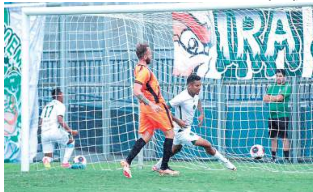
Equipes já se enfrentaram quatro vezes na história e o Gavião Real nunca perdeu