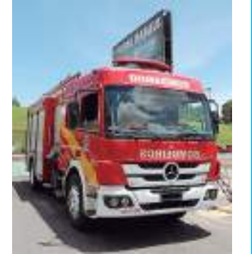
CBMAM age rápido contra fogo