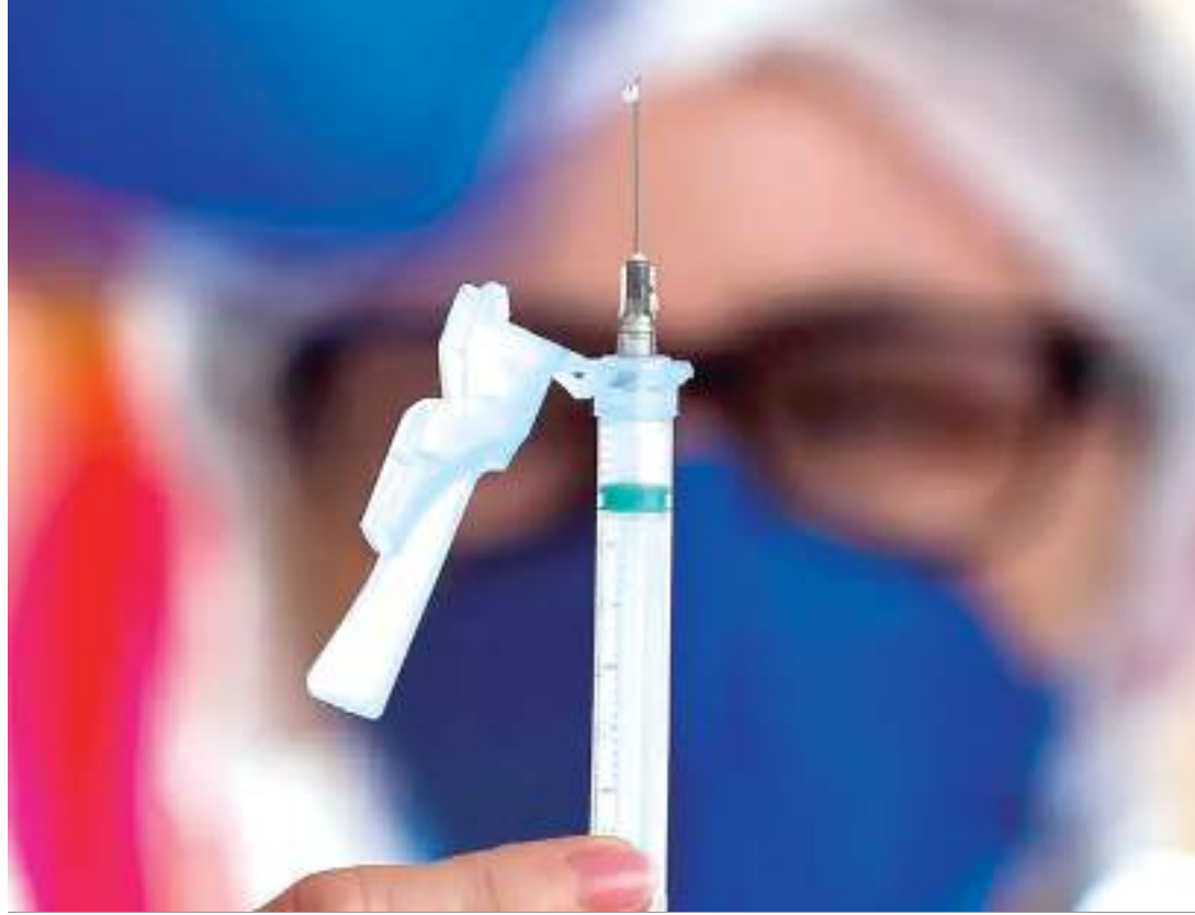
Vacinação representa avanço no enfrentamento da dengue na capital amazonense

"A vacina é mais uma conquista da saúde pública, e ficamos felizes em contar com essa proteção para nossas crianças. Pedimos aos pais que não deixem de vacinar os filhos, e sigam atentos para eliminar os focos de água pa-