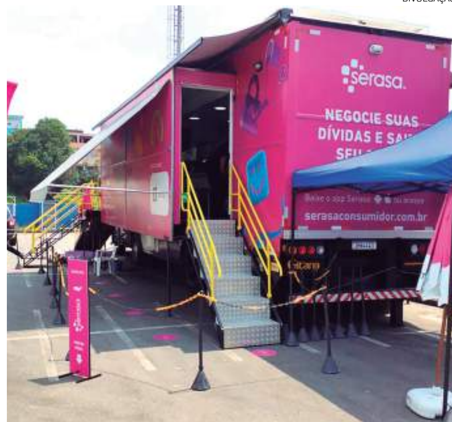
Caravana leva serviços gratuitos para melhoria da saúde financeira da população

Com o propósito de revolucionar o acesso ao crédito no Brasil, a Serasa oferece um ecossistema completo voltado para a melhoria da saúde financeira da população com produtos e serviços digitais.