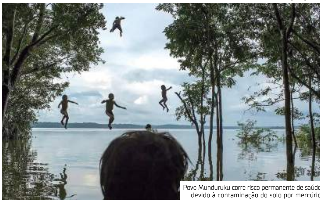
Povo Munduruku corre risco permanente de saúde devido à contaminação do solo por mercúrio

A determinação do conselho diz que, ao constatar a existência de área contaminada ou reabilitada para o uso declarado, os órgãos ambientais competentes têm que comunicar formalmente os órgãos federais, estaduais, distritais e municipais de saúde, meio ambiente e de recursos hídricos.