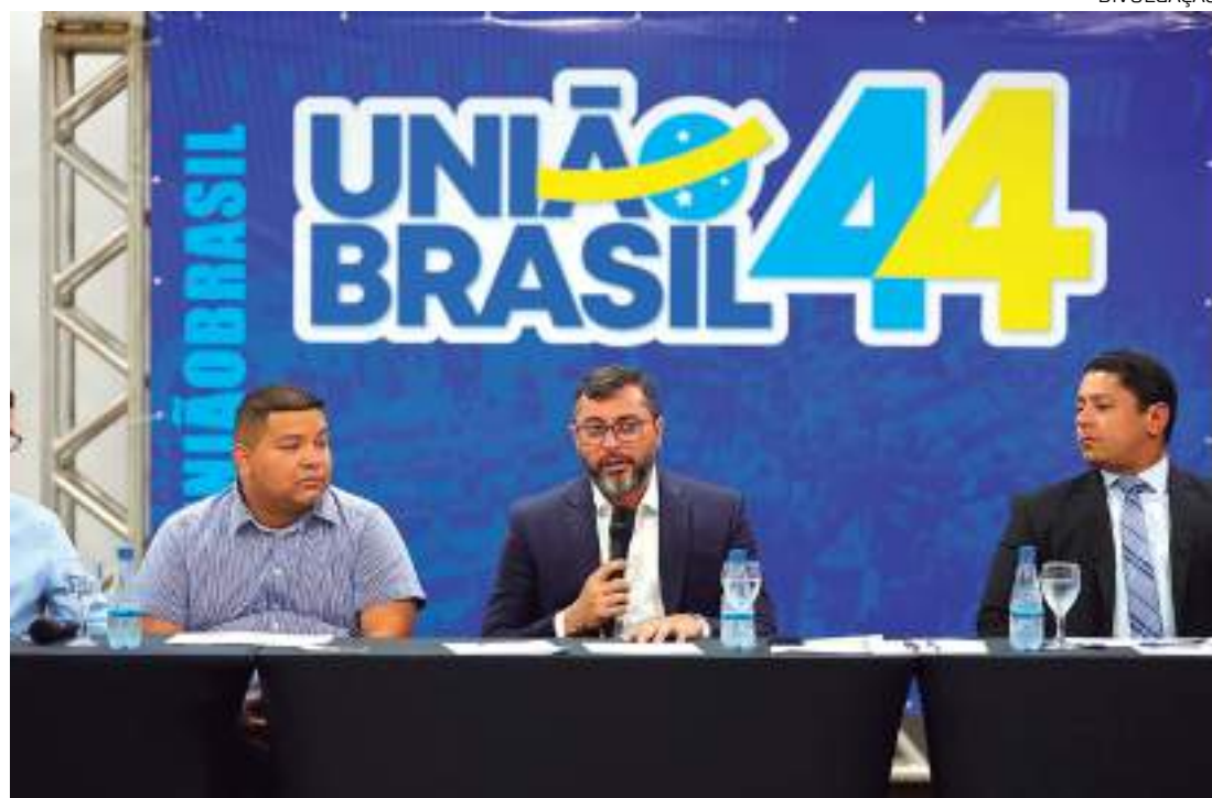
Governador Wilson Lima destacou criação de novos empregos nas operações da Eneva