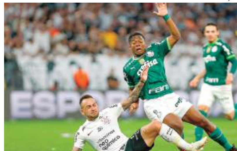
Clássico paulista deve ser bastante disputado entre as equipes