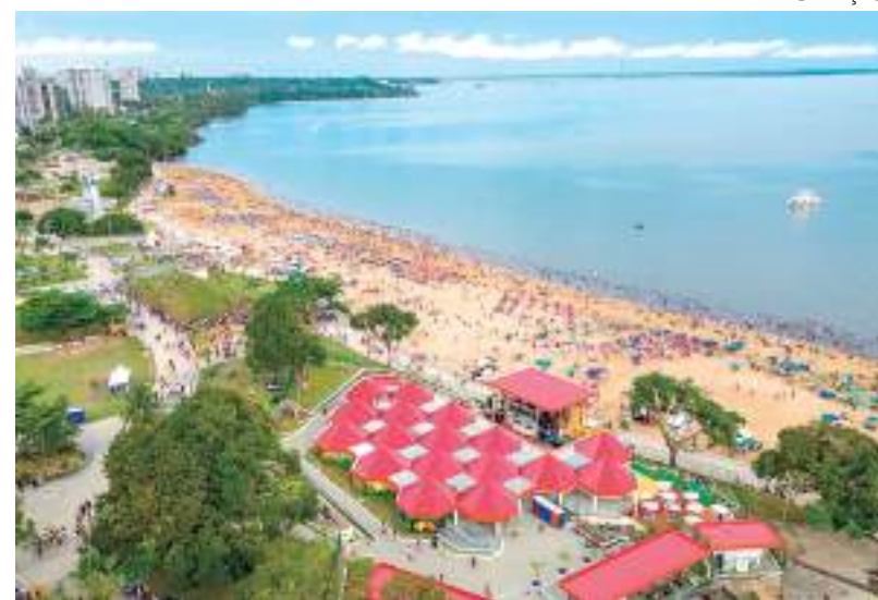
Casa de Praia Zezinho Corrêa terá shows gratuitos no fim de semana