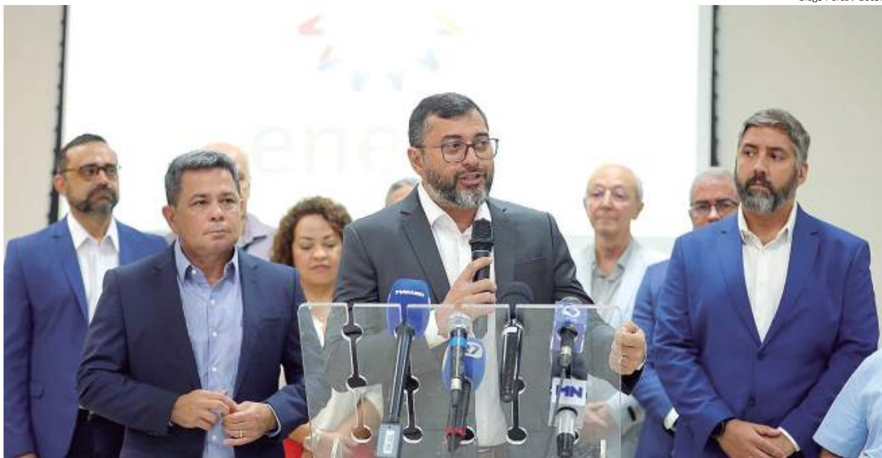
Diego Peres / Secom