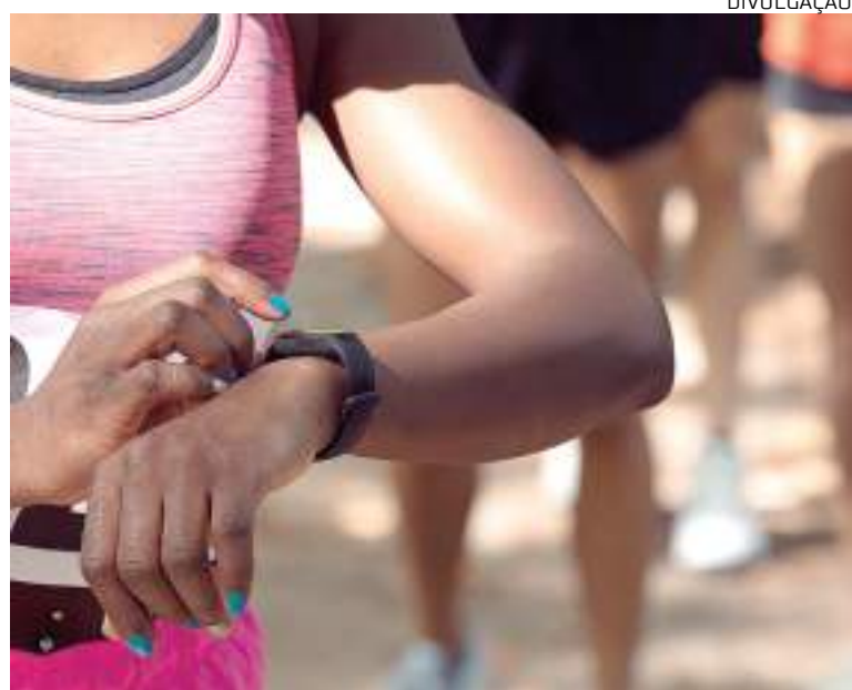
Corrida celebra representatividade feminina no esporte