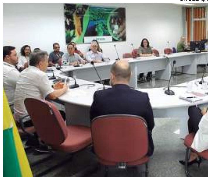
Empresas participam de reunião de adesão ao programa ZFPA

"Nós temos tido o privilégio de, periodicamente, visitar as fábricas. É muito gratificante ver a alegria dos trabalhadores, a concentração como desempenham suas funções, os cuidados de segurança observados. É ótimo ver também a coragem dos empreendedores. Ver como investem em