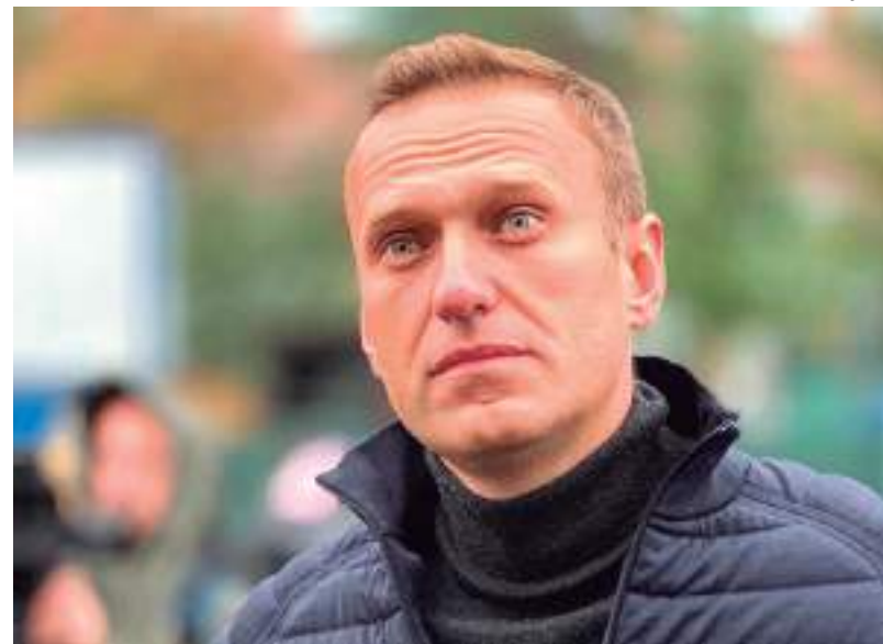
Ativista Alexei Navalny cumpria pena em uma das prisões mais rígidas da Rússia