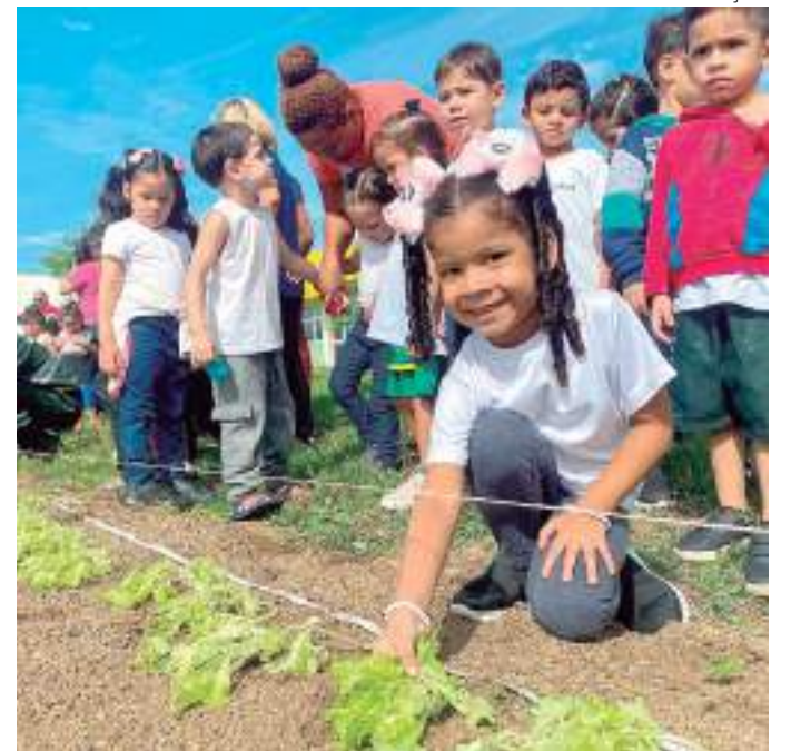
Alunos da educação infantil puderam plantar as mudas

A unidade pública municipal de ensino atende 700 alunos da Educação Infantil em tempo