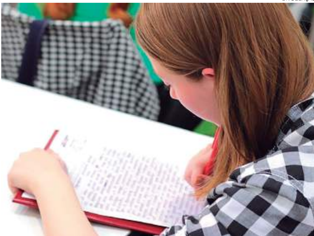
Com o EJA do Literatus, é possível conquistar o diploma por meio do provão