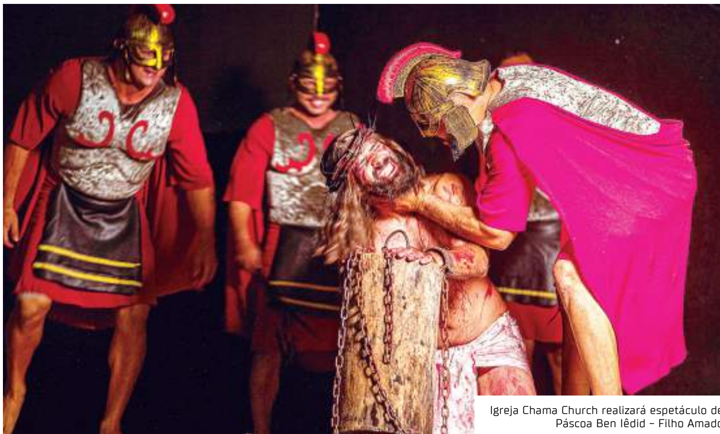
Igreja Chama Church realizará espetáculo de Páscoa Ben Iêdid – Filho Amado