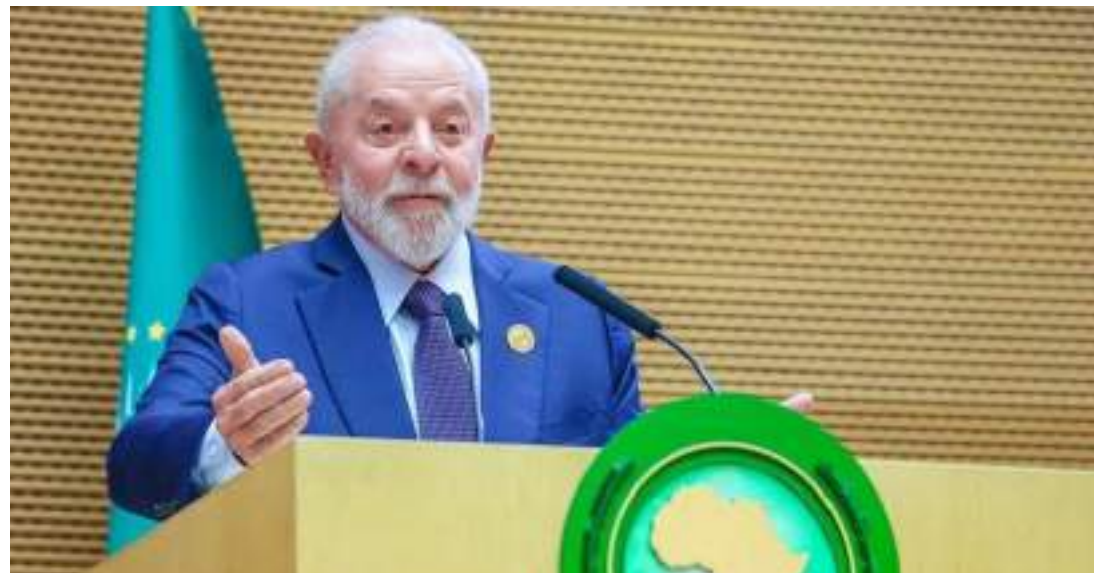
Manifestação do chefe do Executivo brasileiro foi feita durante uma coletiva na Etiópia no último domingo (18)

O premiê Netanyahu já havia dito que Lula "cruzara uma linha vermelha" com suas declarações, e alguns deputados federais aliados do ex-presidente Jair Bolsonaro (PL) usaram o tema politicamente e