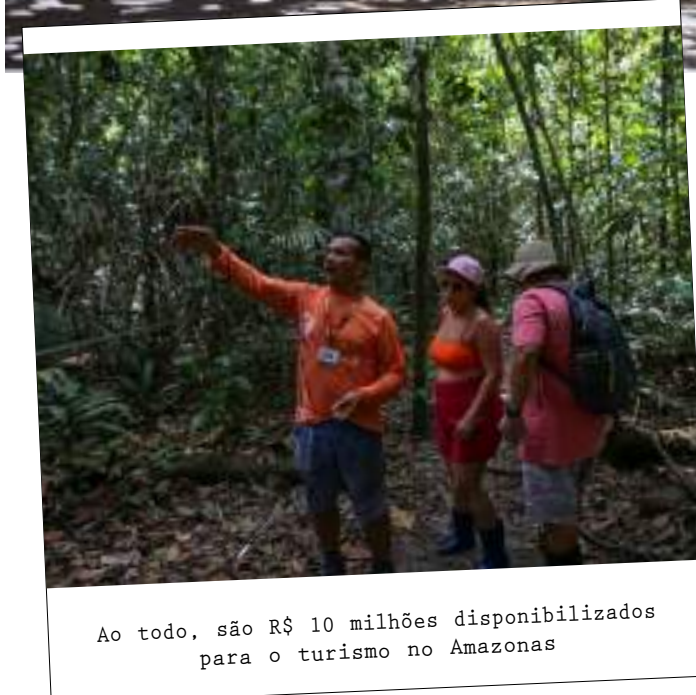
Ao todo, são R$ 10 milhões disponibilizados para o turismo no Amazonas

devem obedecer aos critérios, que incluem estar com Cadastro de Prestadores de Serviços Turísticos (Cadastur) e não ter restrição cadastral nos sistemas de proteção ao crédito. É necessário ainda comprovar a consolidação do empreendimento com, pelo menos, um ano de mercado, e foto anexada.