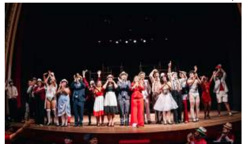
Espectáculo contou com uma equipe 100% local