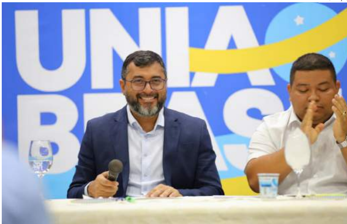
Convenção contou com a presença de prefeitos do interior, deputados federais, estaduais e vereadores da sigla

A eleição do diretório estadual e comissão executiva do União Brasil no Amazonas ocorreu durante a convenção estadual, no Da Vinci Hotel e Convenções, bairro Adrianópolis, zona centro-sul de Manaus. O