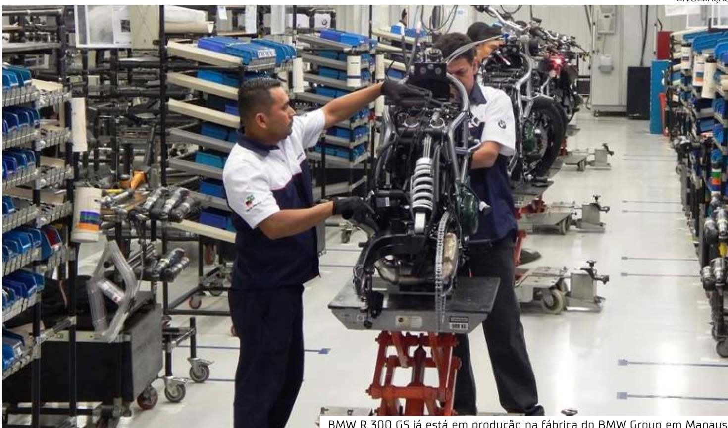
BMW R 300 GS já está em produção na fábrica do BMW Group em Manaus

Com área aproximada de 15 mil metros quadrados e capacidade de produzir até 17 mil motocicletas por ano, a planta possui ações voltadas para sustentabilidade e meio ambiente, como o uso de energia proveniente de fontes renováveis, promovendo redução na emissão de CO 2 e tem certificação I-REC (International REC Standard), sistema global que possibilita a