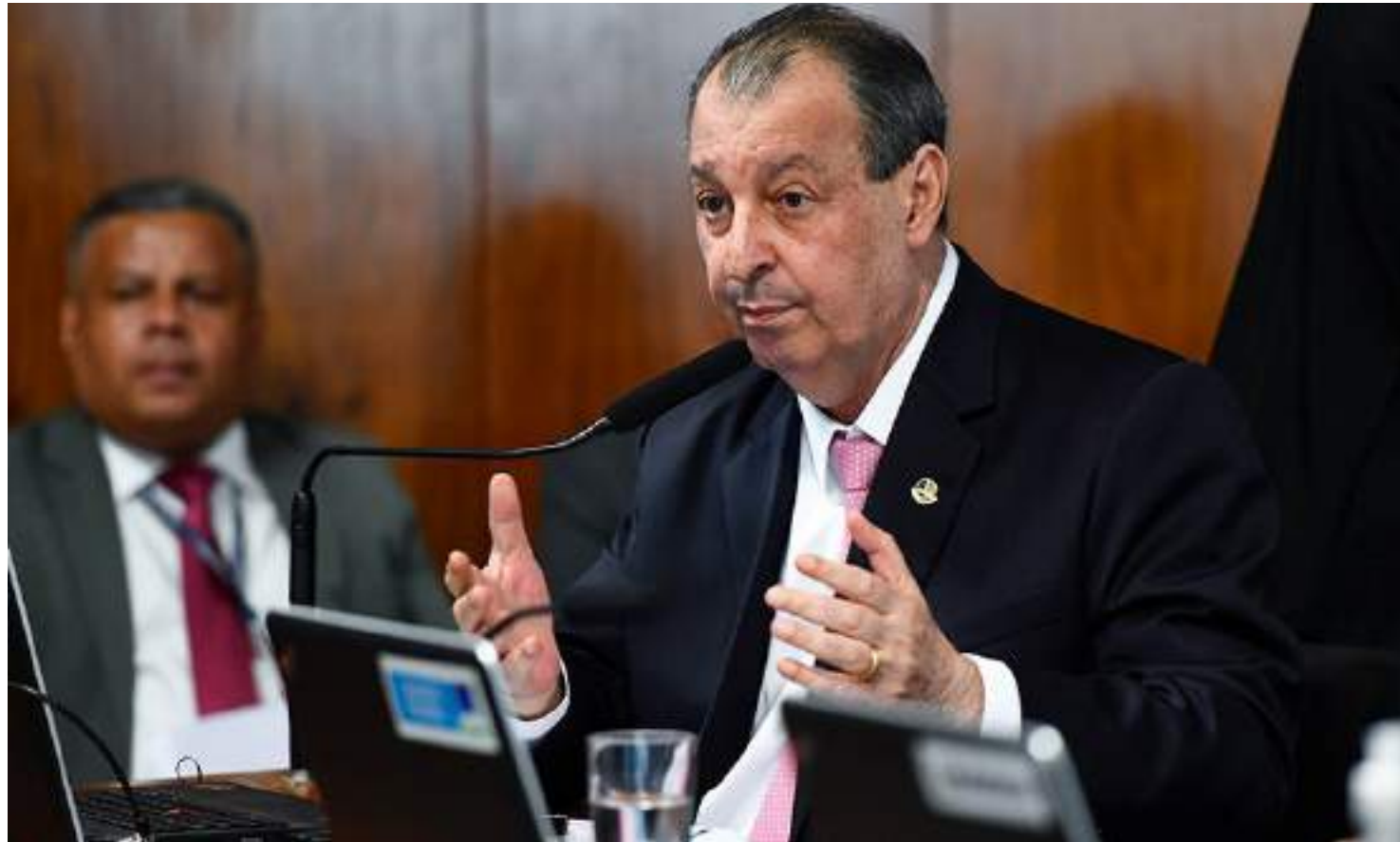
Comissão busca averiguar possíveis omissões e negligências que teriam contribuído para a ocorrência do desastre

Com a presidência do senador Omar Aziz, a CPI promete inten-