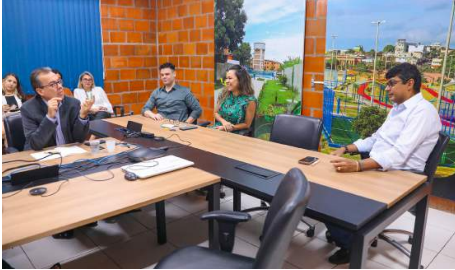
Pela primeira vez o evento não será realizado nos Estados Unidos

Nesta segunda-feira (19), representantes do Governo do Amazonas receberam uma equipe do BID Invest para tratar sobre a organização do evento, que tem como um dos objetivos construir parcerias estratégicas e encontrar investidores em busca de projetos com foco na sustentabilidade ambiental da Amazônia. A reunião, que aconteceu na sede da Unidade Gestora de Projetos Especiais (UGPE), contou com equipes do órgão, da Secretaria de Estado de