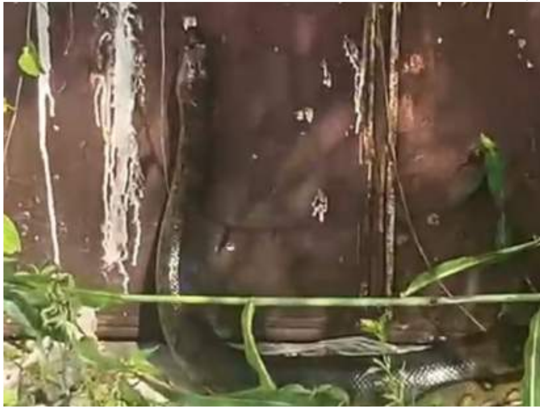
Moradores do Dom Pedro contataram os órgãos de controle, mas o animal ainda não foi retirado