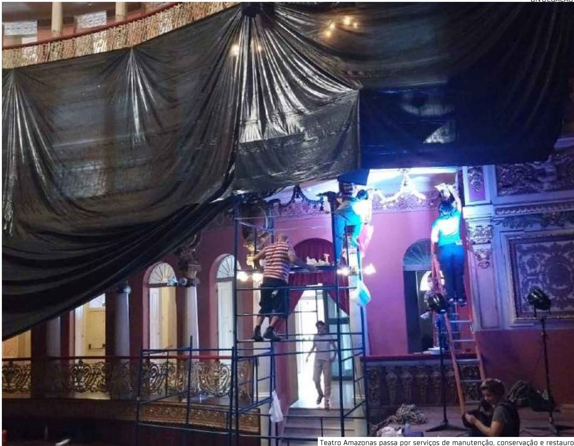
Teatro Amazonas passa por serviços de manutenção, conservação e restauro

Também foi efetuada a aquisição e instalação de central de refrigeração na área admi-