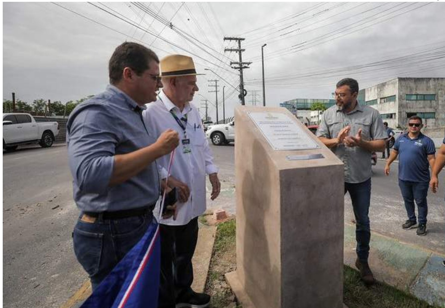
Execução da obra pelo Estado melhora o tráfego de veículos pesados

Segundo o governador Wilson Lima, a via completamente pavimentada melhora a mobilidade no local, sendo uma rota importante e que tem intenso tráfego de caminhões de carga, em média 130 veículos pesados por dia. Além disso, é o primeiro passo concreto para uma