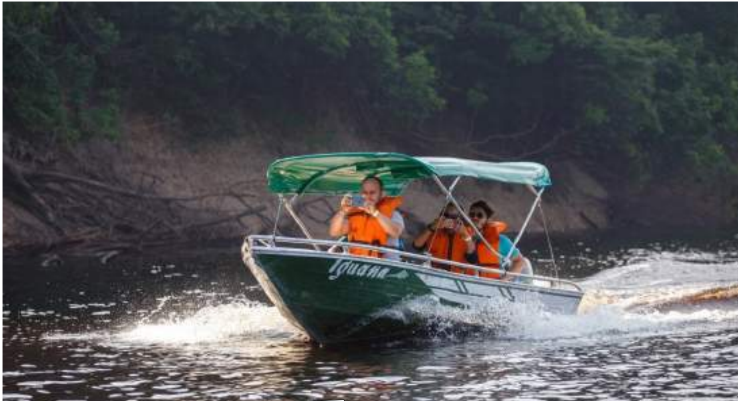
Programa é destinado exclusivamente a empreendedores e profissionais do setor

Os empreendedores e profissionais do setor de turismo