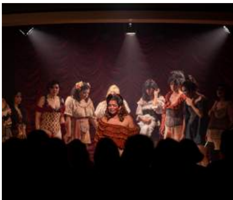
'Cabaré Chinelo' abre temporada no teatro Gebes Medeiros