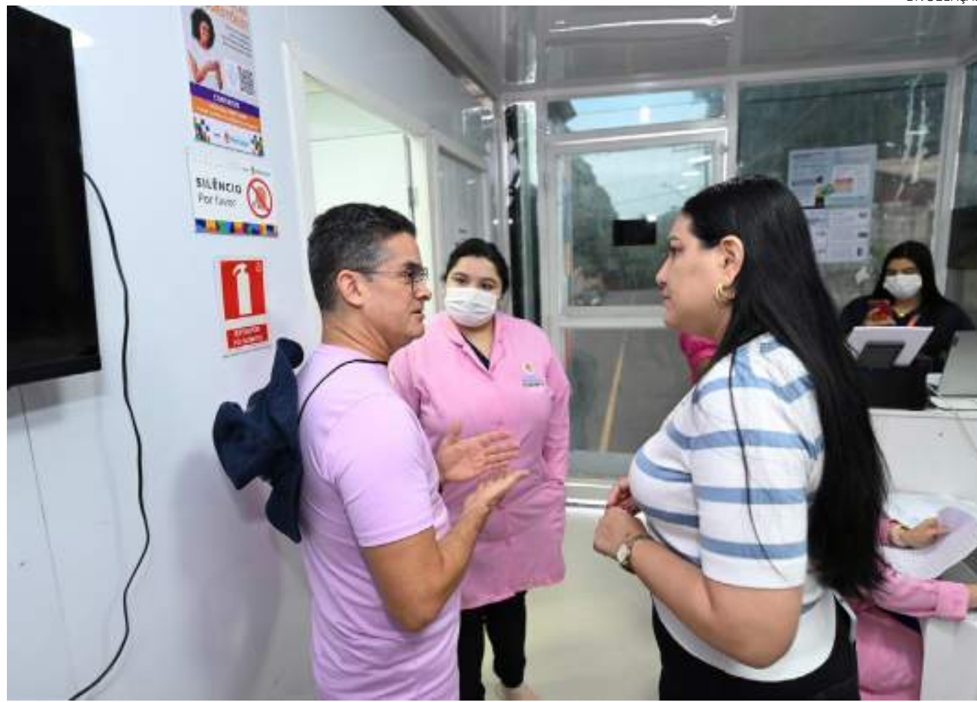
Prefeito David Almeida acompanhou atendimentos na Unidade Móvel da Saúde da Mulher na Zona Norte de Manaus

"Esta unidade móvel de saúde da mulher atende consultas médicas, pré-natal, mamografias, ultrassonografias, preventivo, planejamento reprodutivo, vacinação, oferta de medicamentos. É a prefeitura le-