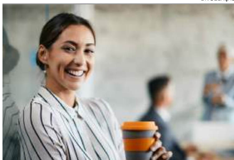
Jovens estão ocupando cargos de liderança em grandes empresas