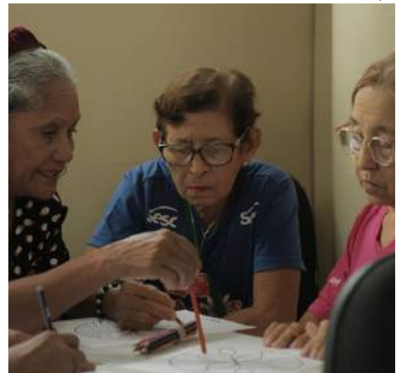
Trabalho social com grupos do Sesc Amazonas