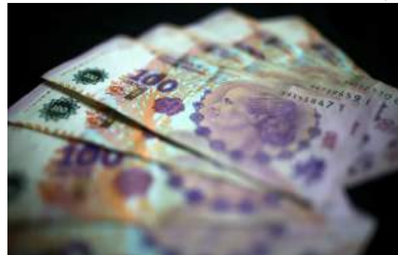
Desvalorização do peso agravou crise no país