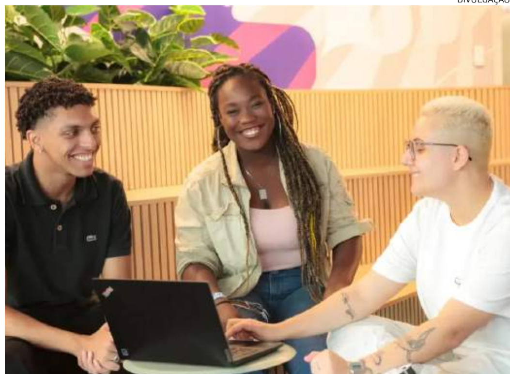
Metade das oportunidades na empresa é para talentos negros

O programa de certificação do Top Employers Institute se baseia na participação e nos resultados da Pesquisa de Melhores Práticas de RH. Desenvolvida a partir de uma metodologia global, a pesquisa cobre seis dimensões de RH divididas em 20 sub-tópicos, como Estratégia de Pessoas, Ambiente de Trabalho, Aquisição de Talentos, Aprendizagem, Bem-estar e Diversidade e Inclusão e muito mais.