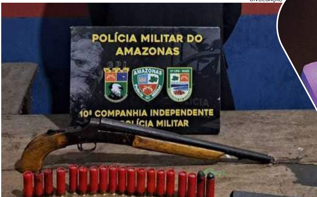
Homem foi encontrado com uma espingarda calibre 16 e não reagiu à prisão

Comele foi apreendida uma espingarda calibre 16, além de 19 munições, sendo 19 intactas e uma deflagrada, e um aparelho celular. O homem