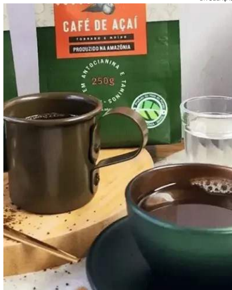
Produto se assemelha ao café e é feito a partir do caroço do açaí