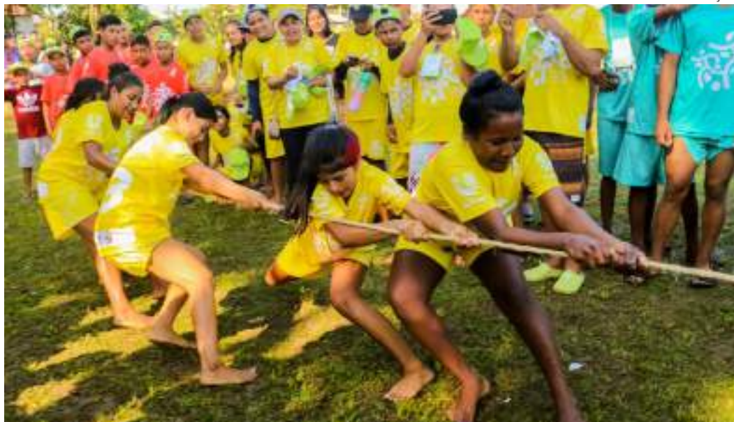
Ao todo, foram 108 ações promovidas em 302 comunidades ribeirinhas e bairros periféricos do estado

Outro destaque do ano foi o retorno do projeto ao muni-