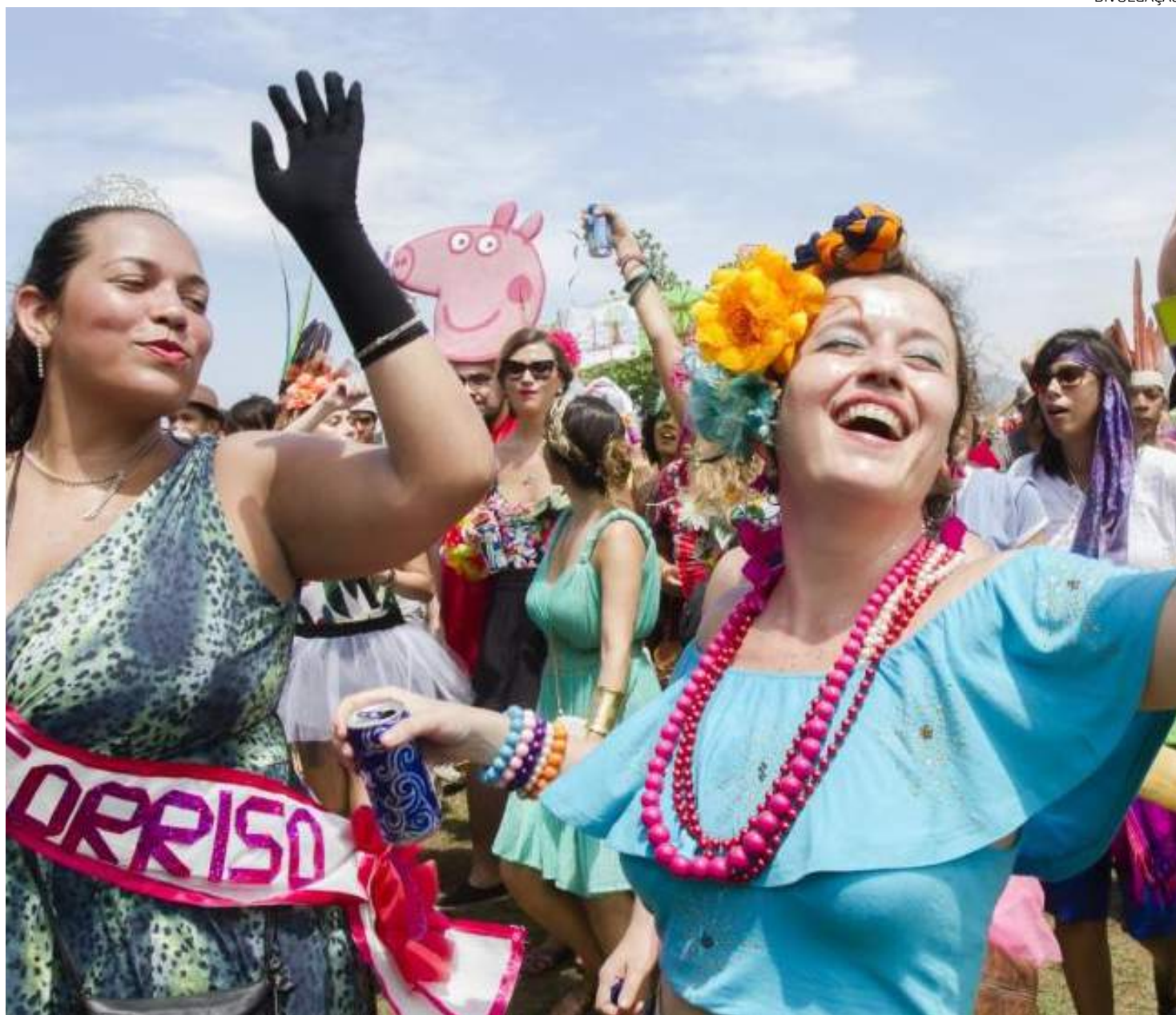
Carnaval deste ano deverá ter maior movimento de pessoas fazendo turismo no Brasil

Celso Sabino disse acreditar que o resultado deste ano será ainda melhor. Ele destacou que houve recor-