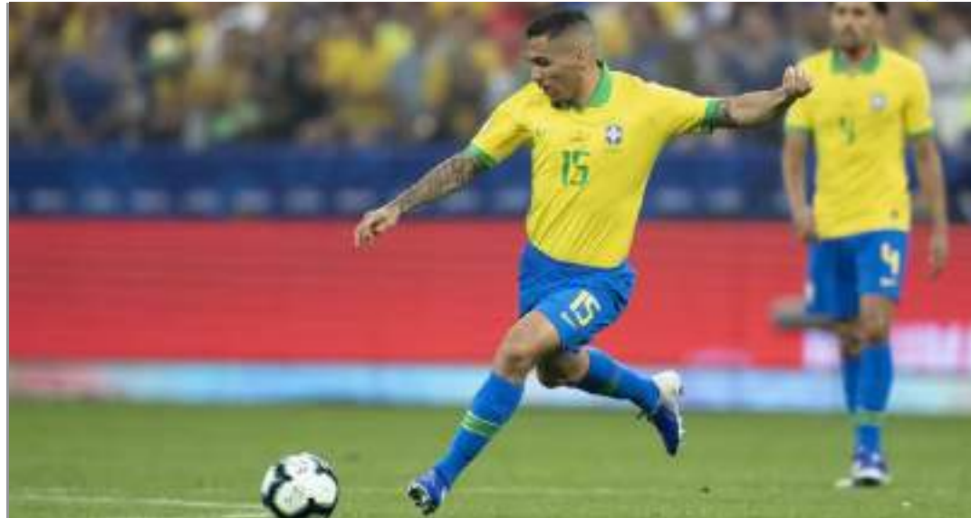
Volante teve participações em convocações da Seleção Brasileira do técnico Tite, do Flamengo