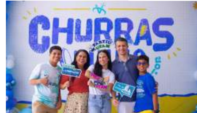
Dos 170 alunos aprovados no Vator, 14 foram em Medicina