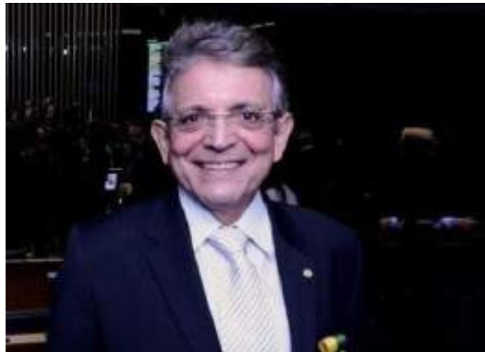
Deputado federal retornar à Casa após cinco anos

muitas coisas mudaram no parlamento ao longo dos últimos anos, principalmente no que diz respeito às questões ideológicas que, segundo ele, acabam obscurecendo pautas que poderiam contribuir com a sociedade de uma maneira geral.