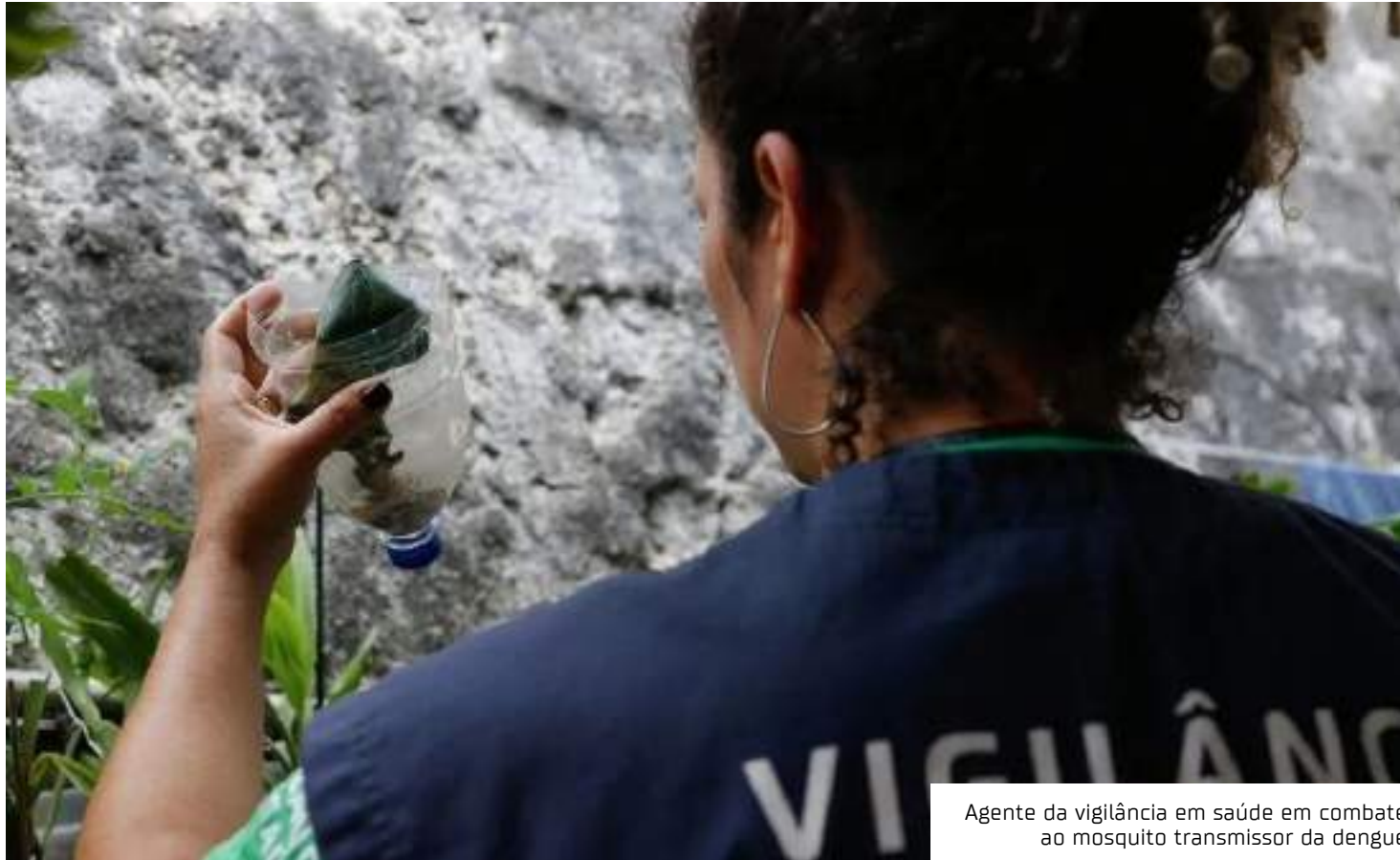
Agente da vigilância em saúde em combate ao mosquito transmissor da dengue

A explosão de casos de dengue em diversas regiões do país fez com que pelo menos quatro estados – Acre, Minas