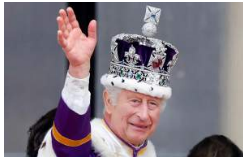
Tipo de câncer não foi divulgado pelo Palácio de Buckingham