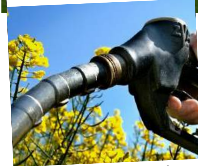
Indústria tem investido no biodiesel para assegurar uma produção sustentável

liza biodiesel 100% em sua frota de caminhões, como forma de comprovar a qualidade do combustível. Os caminhões rodam, em média, 1.200 km por dia, e o consumo de combustível como B100 se assemelha ao do diesel fóssil. Na mesma linha, a empresa Be8 aposta no desenvolvimento de novas tecnologias que expandem a usabilidade do biodiesel puro. Por não possuir contaminantes, o BeVant pode ser dosado em maiores quantidades no diesel fóssil. Em 2022, a empresa faturou R$ 9,6 bilhões