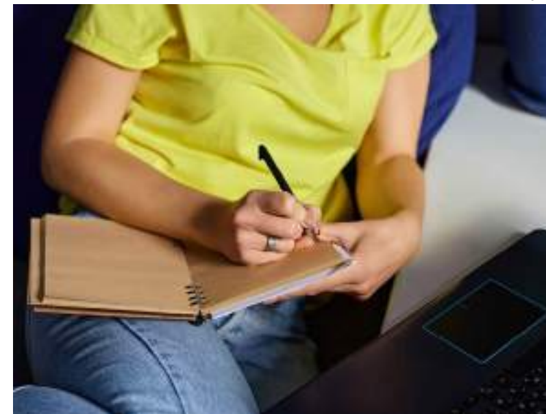
“Empreenda e Renda” visa desenvolver competências práticas em gestão