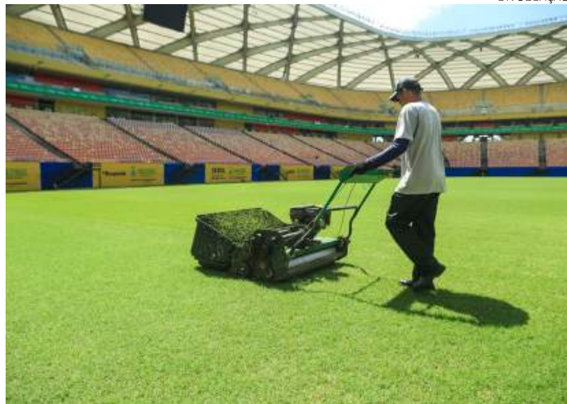
Estádio já recebeu Flamengo x Audax, também pelo Carioca, com carga total dos ingressos vendidos

Um dos entraves é que Abel Ferreira gosta do jogador e não deve facilitar a saída. Além disso, atualmente o Verdão conta com poucos atacantes no elenco, além de Breno: Dudu (contundido), Bruno Rodrigues (contundido), Endrick (na Seleção Sub-23), Flaco López e Rony. Na prática, apenas dois estão à dispo-