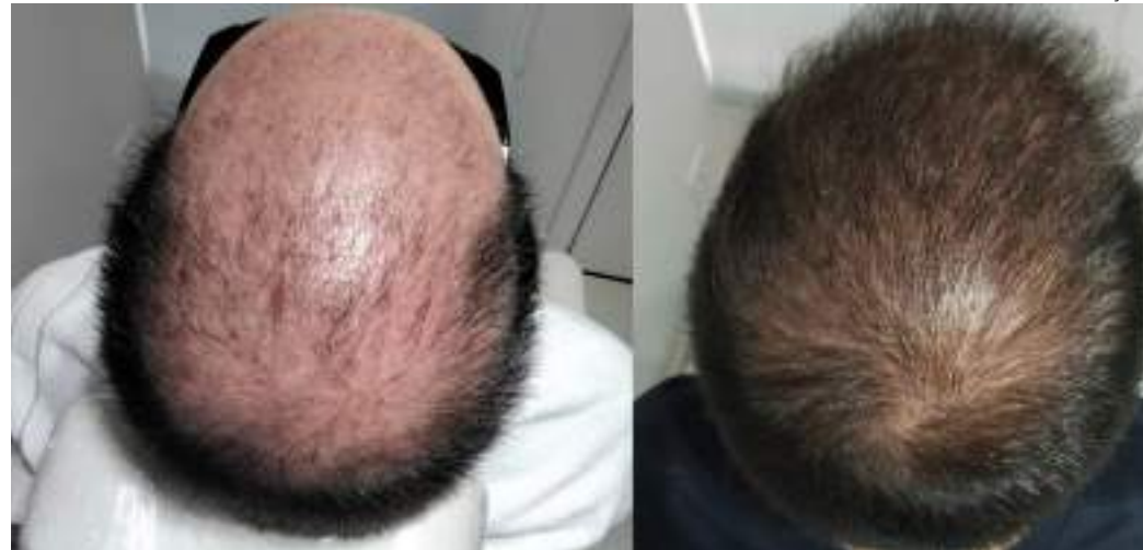
Popularidade dos transplantes capilares tem crescido em todo o mundo

Além de ser uma opção para pessoas com calvície, o procedimento FUE também pode ser uma escolha estética para quem deseja redesenhar a linha frontal, especialmente para aqueles que buscam diminuir testas proeminentes.