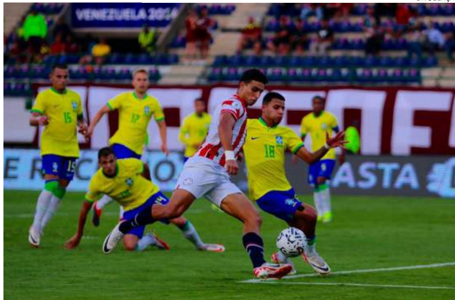
Brasil perdeu para o Paraguai em jogo bastante disputado, na Venezuela

o duelo com o Paraguai como a equipe que mais pontuou no torneio e líder do Grupo A. Já o Paraguai garantiu sua participação nesta etapa decisiva como segundo colocado do Grupo B.