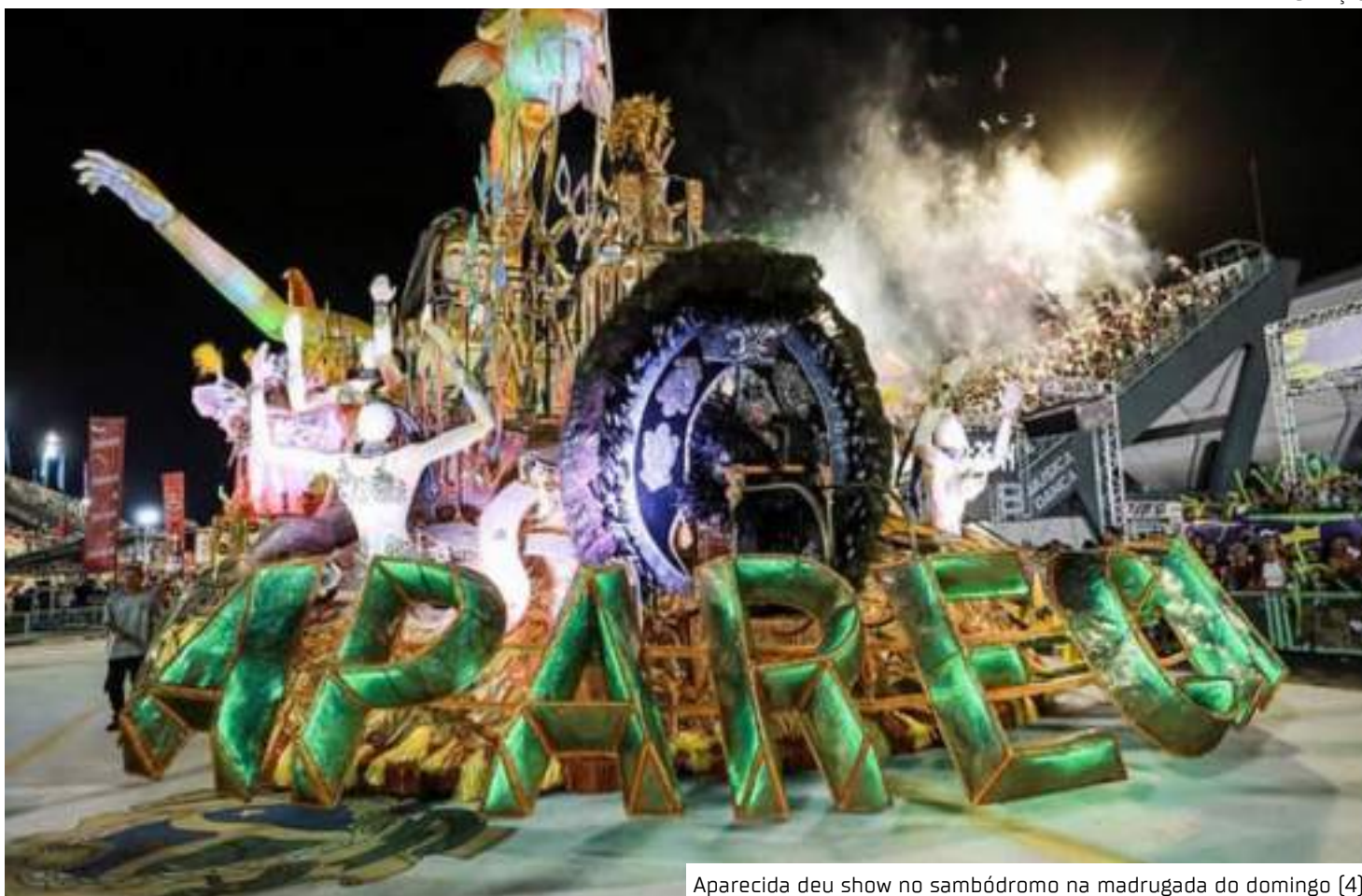
Aparecida deu show no sambódromo na madrugada do domingo (4)

A tradicional escola de samba de Manaus, que representa o bairro Nova Cidade, Zona Nor-