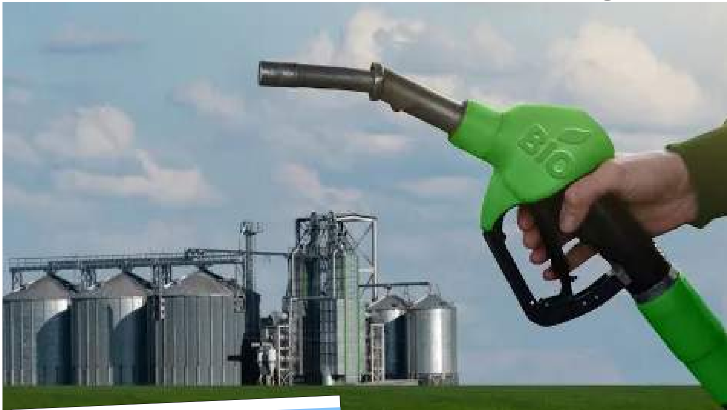
Brasil se destacou na produção de biocombustíveis em 2023

A indústria tem investido no biodiesel para assegurar uma produção sustentável do começo ao fim. Para isso, tem utilizado tecnologia e pesquisa. A JBS Biodiesel, por exemplo, está entre as cinco maiores produtoras do combustível no Brasil e é líder na elaboração de biodiesel a partir do sebo bovino. Além disso, a empresa uti-