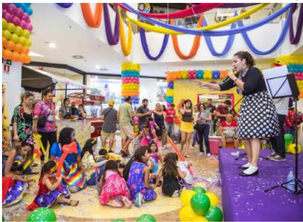
Crianças vão se divertir com programação carnavalesca do Shopping Ponta Negra

Espaço pet friendly, permitindo circulação de animais de pequeno e médio porte em suas dependências, o Shopping Ponta Negra vai realizar