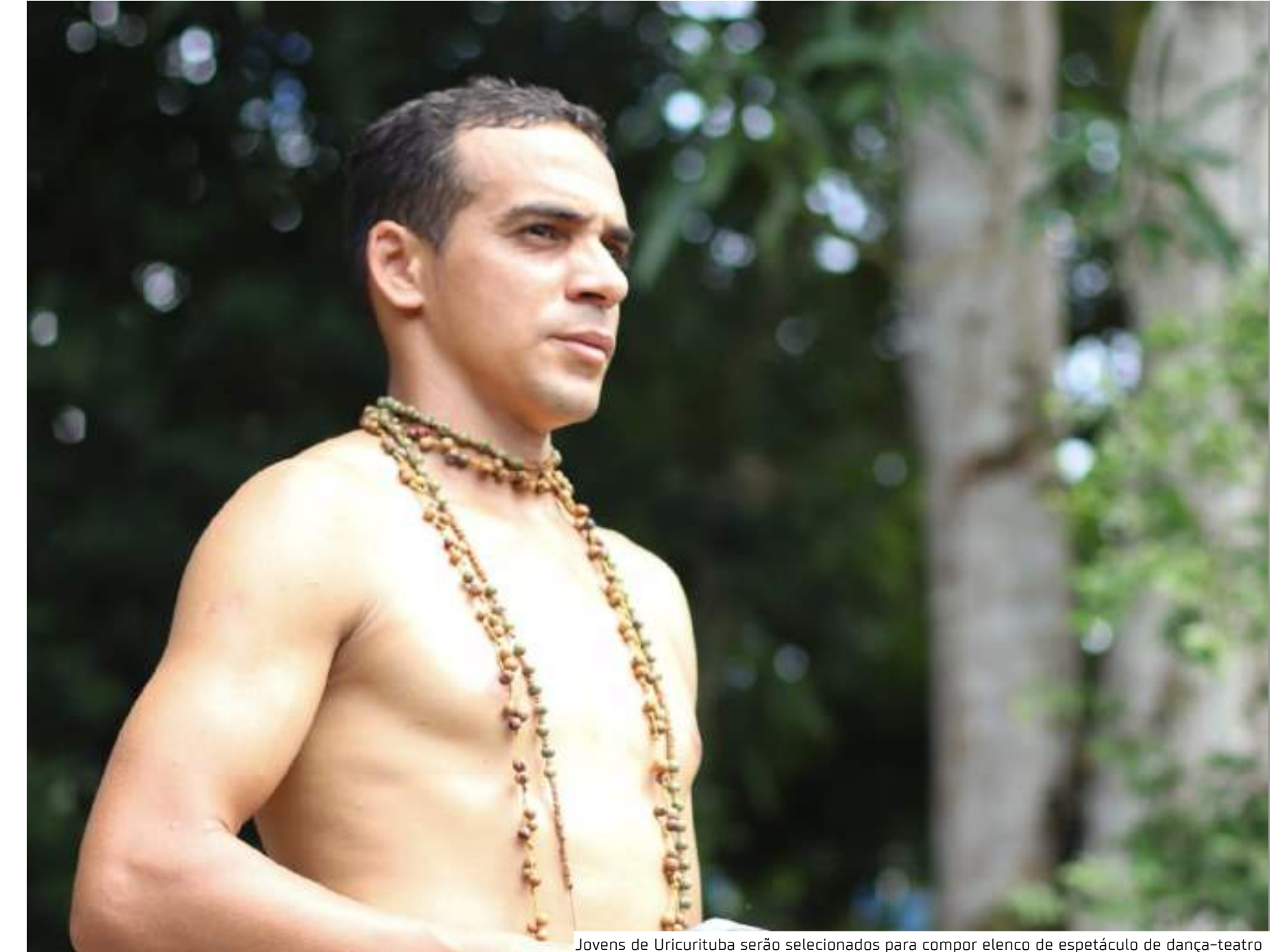
Jovens de Urucurituba serão selecionados para compor elenco de espetáculo de dança-teatro

"Urucurituba é uma terra de muitos jovens talentosos e sonhadores e esse projeto veio para reacender a chama do amor pela arte. Falar sobre identidade, sobre resgate cultural e pesquisas mostra o quanto a arte e cultura são importantes e fazem toda diferença na