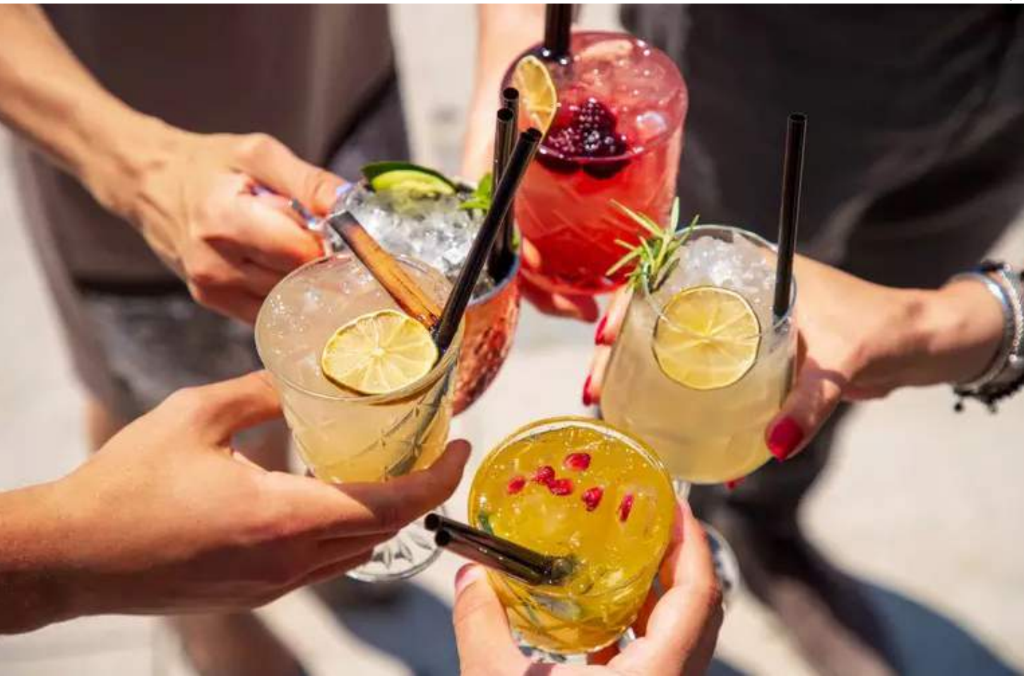
De acordo com especialistas, é sempre importante não ingerir álcool com o estômago vazio

Para quem prefere outra mistura, uma combinação que também dá certo é a do melão com pepino e/ou hortelã. A fruta é cheia de água e auxilia no combate à desidratação. Além disso, melhora o sistema imune e ajuda a eliminar toxinas. Ingredientes: meio pepino descascado, uma fatia média de melão, um copo com 200 ml de água e hortelã a gosto. O preparo é no liquidificador.