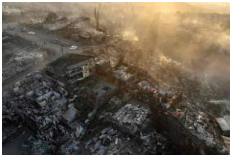
Casas destruídas por incêndio florestal em Viña del Mar, na região central do Chile