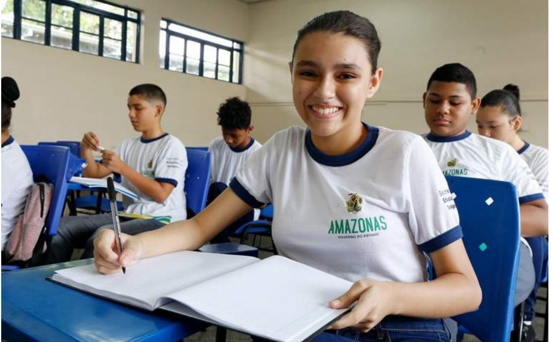
Passe Livre é um projeto de promoção educacional que beneficia os estudantes da rede pública de ensino

Após a mineração de dados, as informações são enviadas para a Secretaria Municipal de Finanças (Semef) realizar a checagem, via georreferenciamento, dos alunos que residem a mais de um quilômetro de onde estudam. Somente após essa etapa, é que os nomes dos estudantes con-