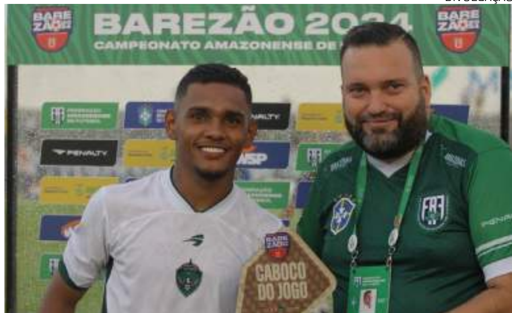
Atacante marcou o gol de falta que decretou a virada do Manaus sobre o Princesa do Solimões