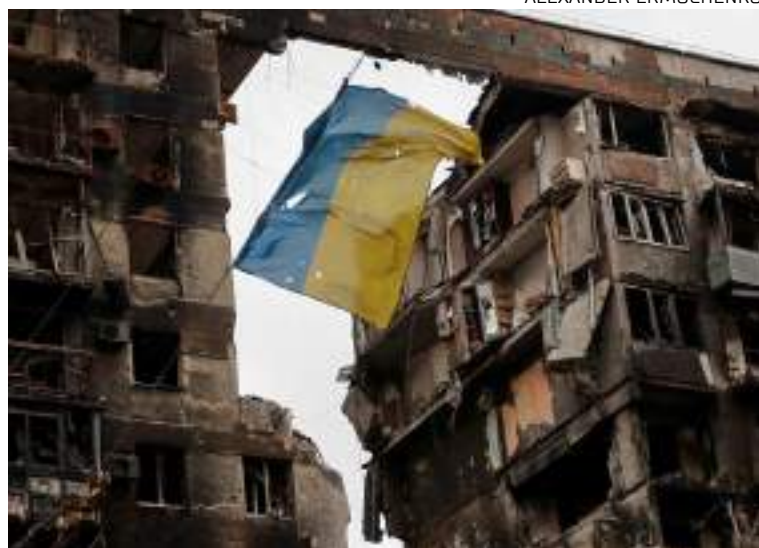
Líderes republicanos continuam recusando ajuda militar adicional