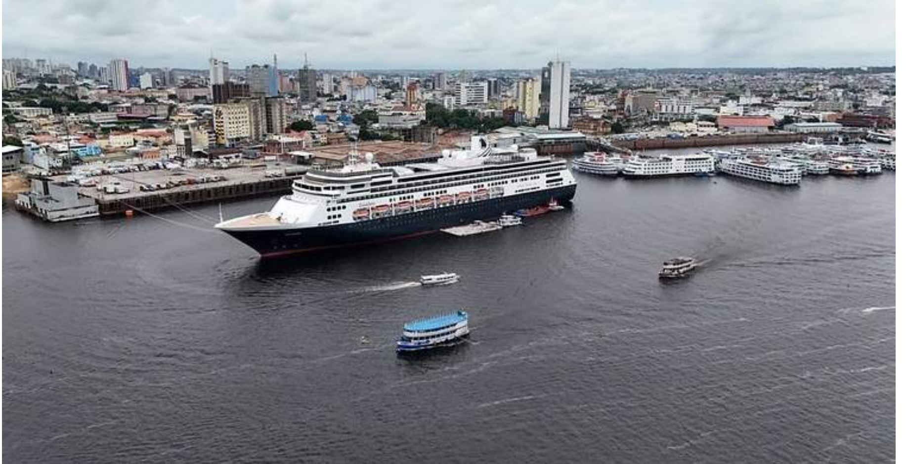
Manaus recebe navios com aproximadamente 6,3 mil cruzeiristas

"Além do receptivo e a entrega da placa que sim-