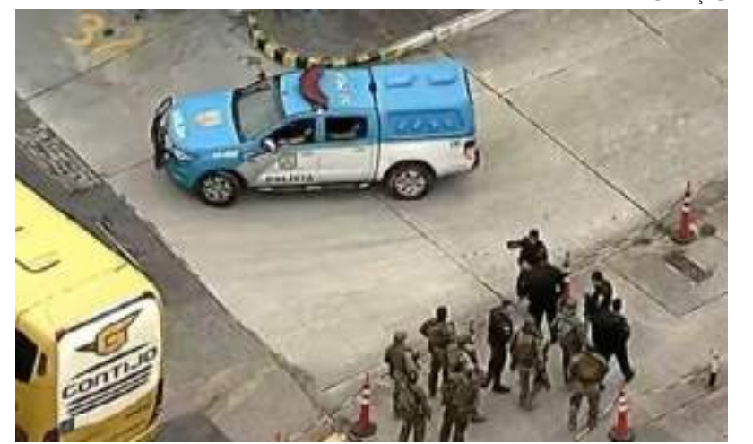
Pelo menos duas pessoas se feriram, uma delas em estado grave