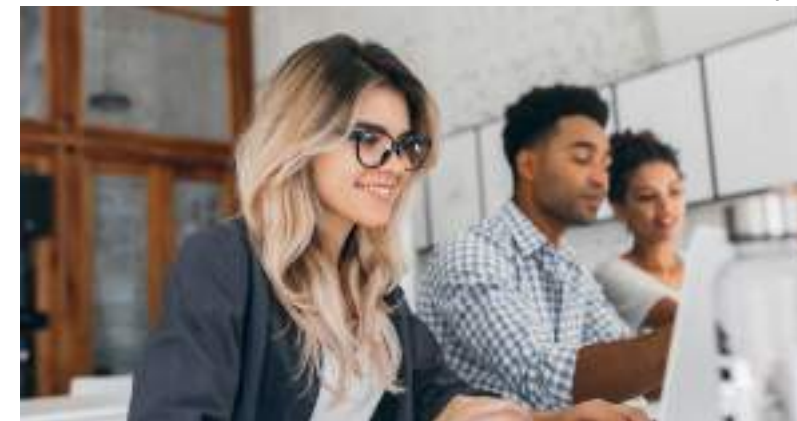
Vagas são para estudantes de nível superior, técnico e ensino médio