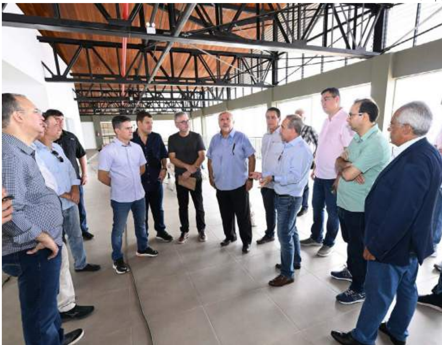
Mirante ainda servirá como base para operadores do turismo, servindo, principalmente, como porta de entrada dos turistas

"Teremos aqui também restaurantes, quiosques gourmet, choperia, sorveteria, tacacá, açai, ou seja, é um point para a gente valorizar a nossa gastronomia. O turismo no Brasil teve um tempo que era turismo para praias, do Nordeste, principalmente. Hoje, o turista quer curtir