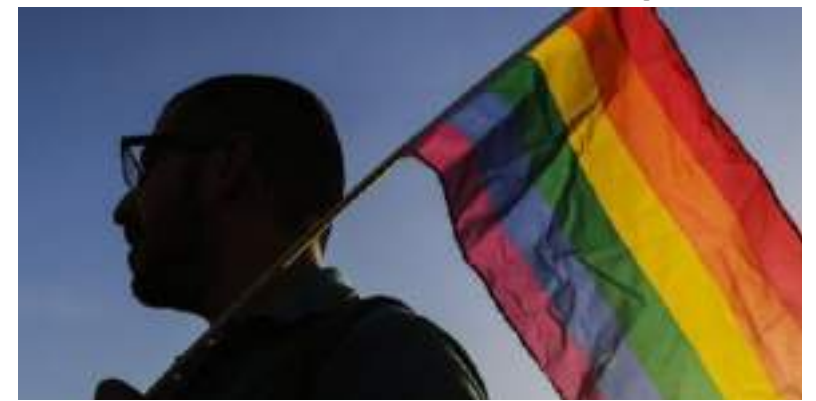
Programa tem como missão formar agentes de mudança dentro da comunidade