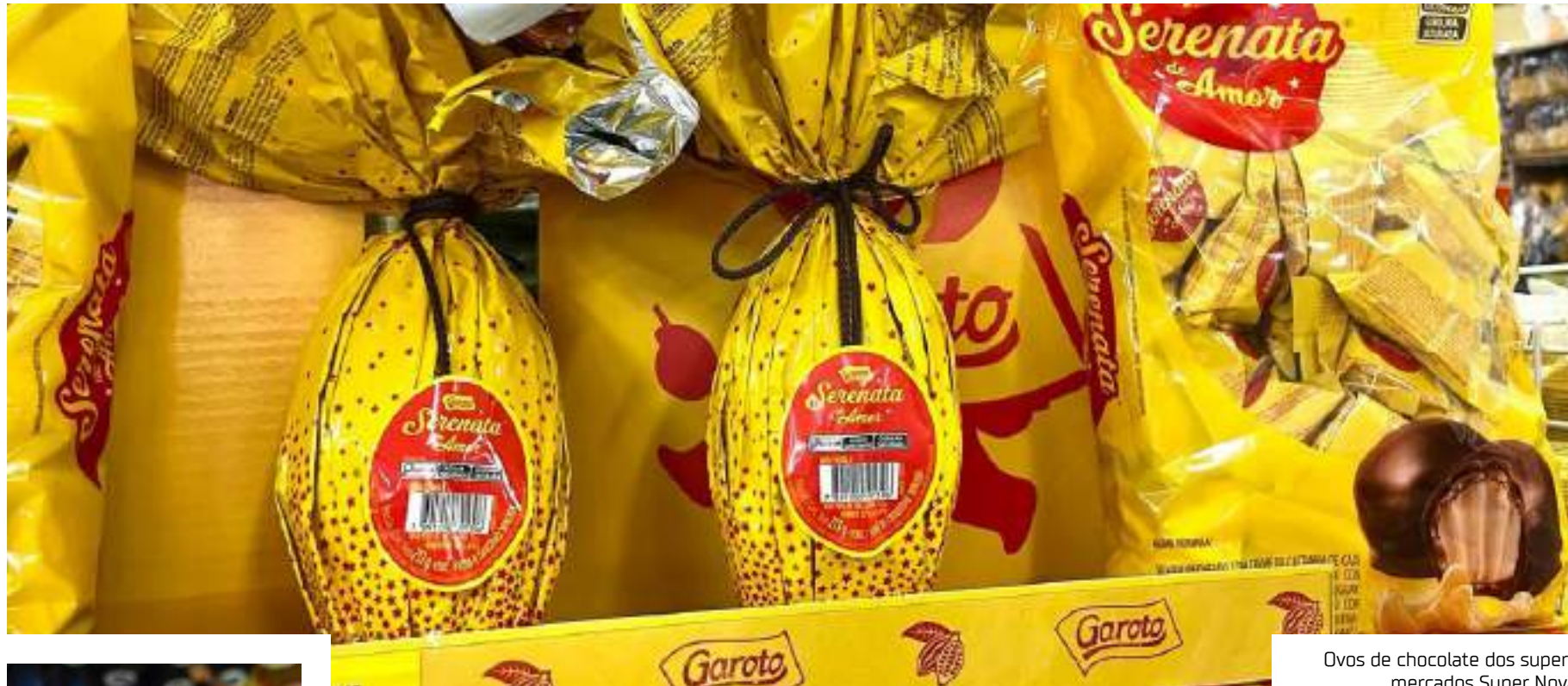
Ovos de chocolate dos supermercados Super Nova

Com menos de um mês para a Páscoa, que neste ano ocorre no dia 31 de março, os corredores de supermercados e lojas de doces estão repletos de ovos de chocolate para cativar a atenção dos clientes. A Associação Brasileira de Supermercados (Abrás) estima que o consumo neste período deve crescer de 13% a 15% em comparação com 2023. Conforme o estudo da Abrás, um dos motivos para o otimismo ocorre devido aos recursos que serão injetados até a data.