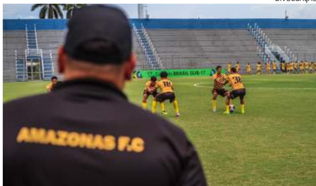
Na primeira fase, a Onça venceu o Sant German-RO por 2 a 1, no mesmo palco do jogo de logo mais