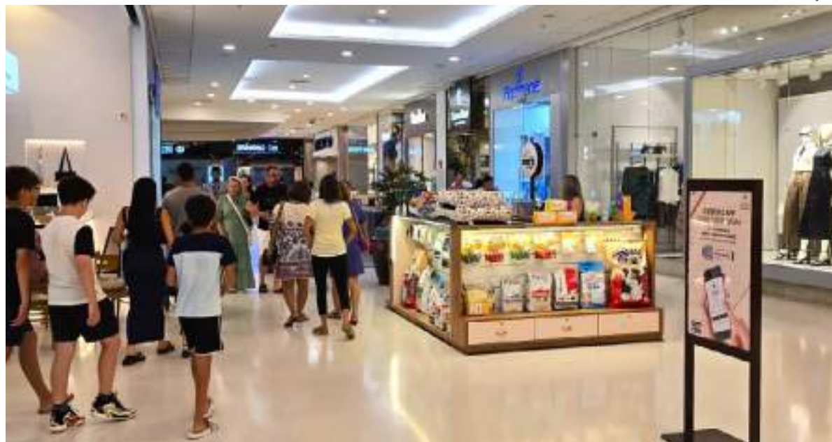
Clientes podem participar da ação promocional baixando cupom digital no aplicativo Clube Ponta Negra