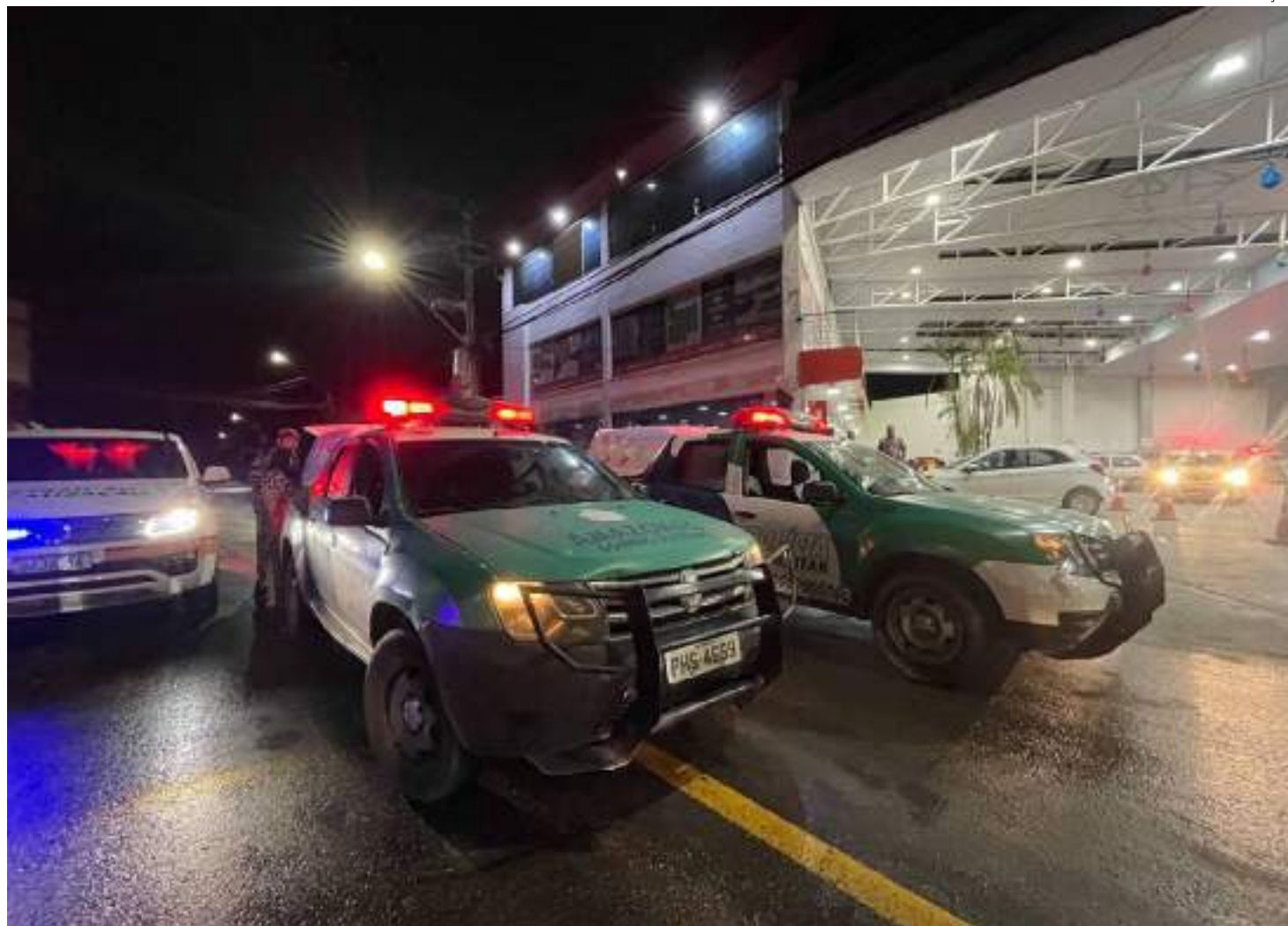
Estão inseridos nos casos de mortes violentas intencionais os crimes de homicídios, latrocínio, feminicídio e lesão corporal seguida de morte

Os dados destacam o trabalho do Governo do Amazonas, que a partir dos investimentos como na aquisição de novas tecnologias como o "Paredão", de novas lanchas blindadas, novos armamentos, dentre outros, utilizados como o empenho das Forças de Segurança, manteve a redu-