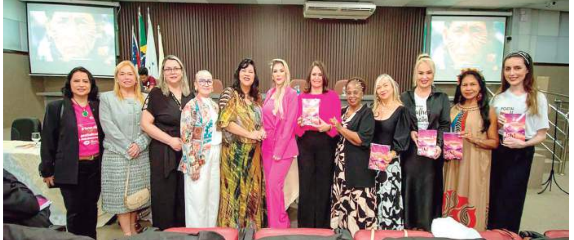
Livro ‘Mulheres Interseccionalidades: Vivências Amazônicas’ é de autoria de 16 mulheres, sendo a maioria do campo jurídico

Ela quem assina o prefácio do livro, trazendo a riqueza dos temas, voltados às mulheres da Amazônia e quem proferiu discurso emocionante na abertura do evento.