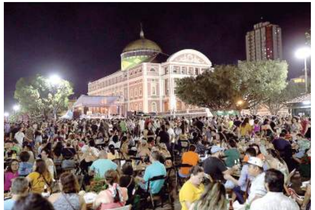
Evento terá programações, sempre na primeira e penúltima quarta-feira do mês, até outubro

Para acompanhar de perto a programação e não perder nenhuma novidade, basta seguir na página oficial do evento no Instagram: @tacacabossaooficial. Com sua volta triunfante, o Tacacá na Bossa reafirma seu compromisso de celebrar a diversidade cultural amazônica e continuar sendo um ponto de encontro importante para amantes de música e arte em Manaus.