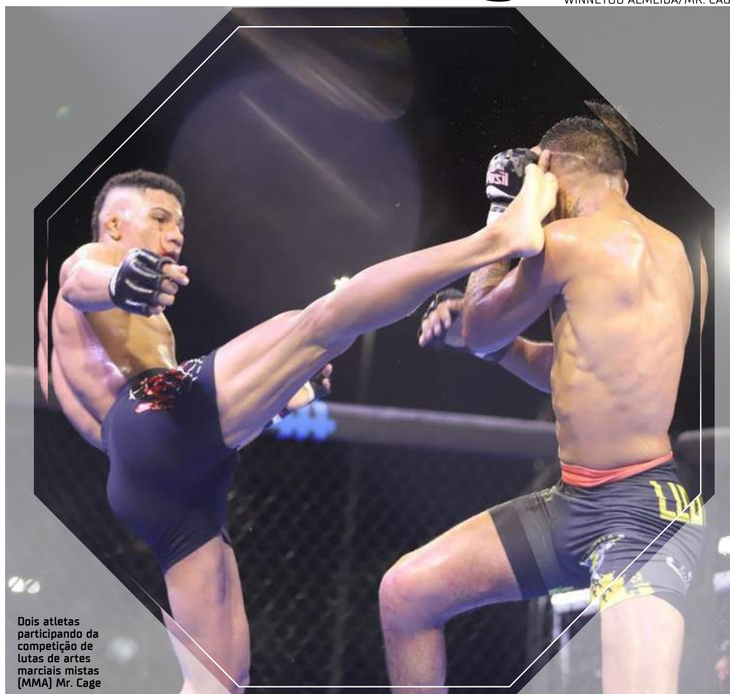
Dois atletas participando da competição de lutas de artes marciais mistas (MMA) Mr. Cage

"O Mr. Cage decidiu, mais uma vez, realizar parceria com o setor público, visando promover cultura e esporte em nossa cidade. É com grande satisfação que nos unimos a essa iniciativa, que proporciona uma oportu-