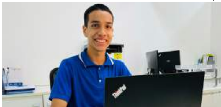
Estudantes de escolas públicas serão selecionados para participar do projeto