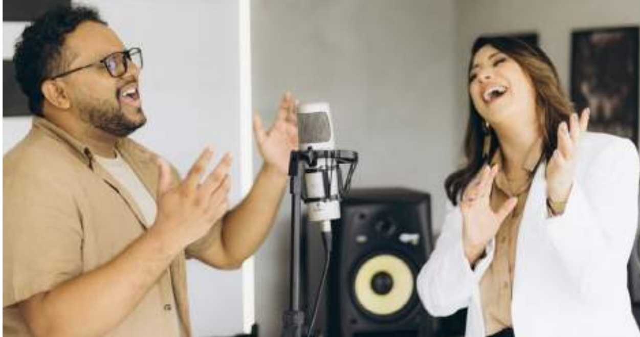
Gravação de EP será na Igreja Batista da Lagoinha Sede Manaus