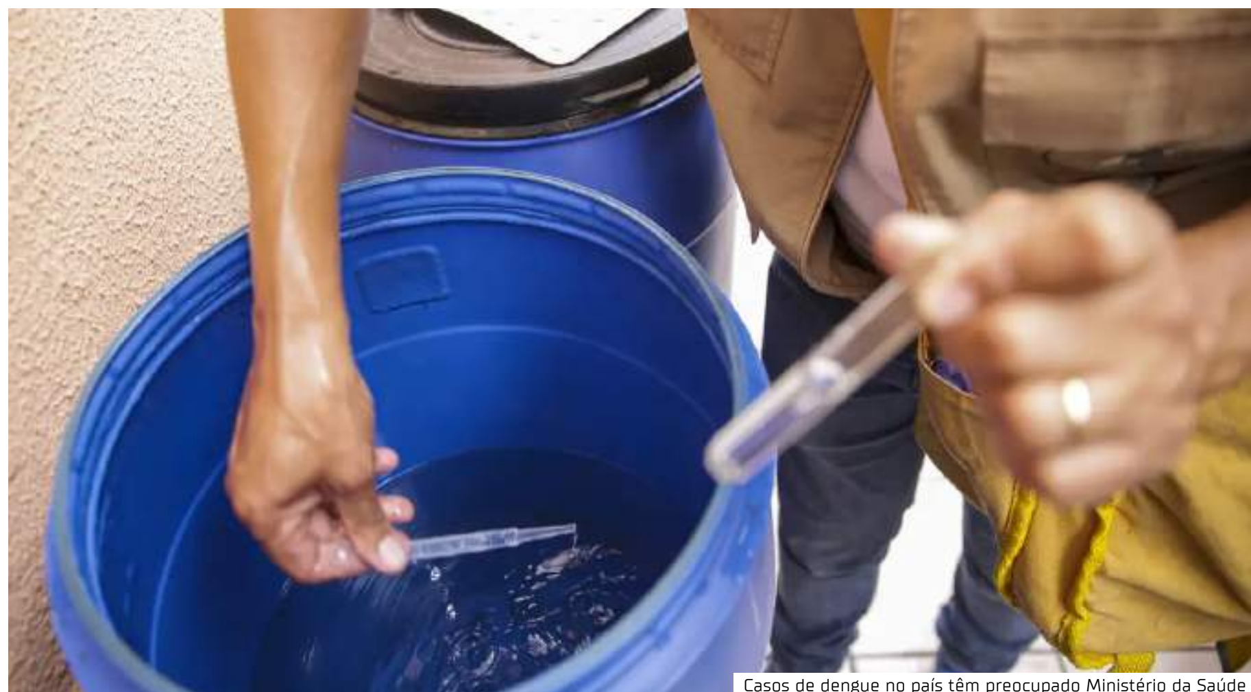
Casos de dengue no país têm preocupado Ministério da Saúde