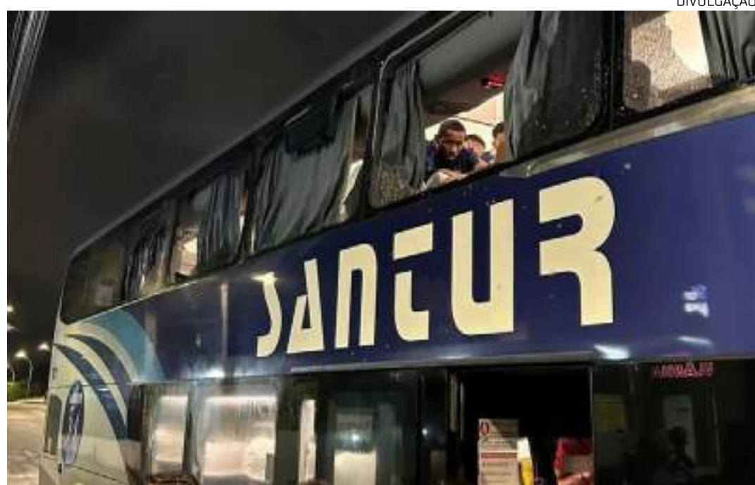
Sport terá de jogar as próximas oito partidas em casa com portões fechados, além de pagar multa de R$ 80 mil