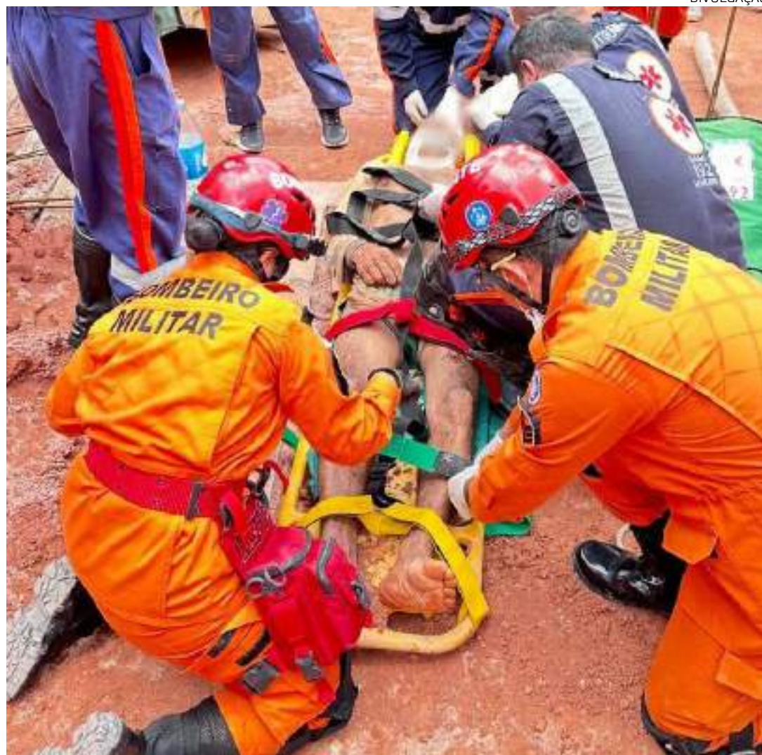
Ao todo, 12 bombeiros atuaram para fazer o resgate e atendimento dos dois trabalhadores atingidos

Após a retirada do segundo trabalhador, que esteve consciente durante toda a operação de resgate, ele foi estabilizado em prancha rígida e recebeu atendimento pré-hospitalar. Na sequência, foi encaminhado pela equipe do Samu para receber atendimento médico em uma unidade hospitalar.