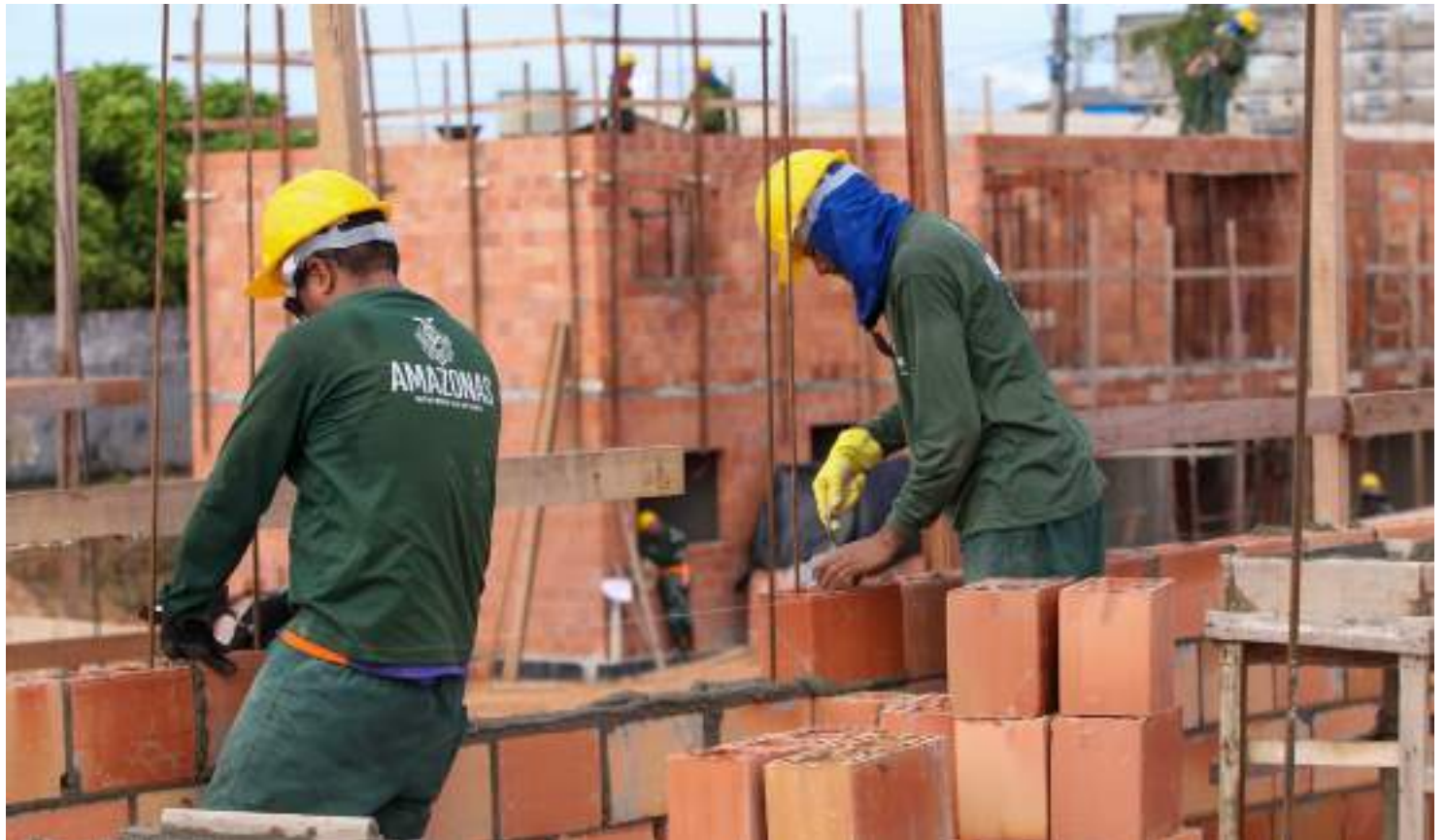
Conjunto habitacional, na Zona Sul de Manaus, terá 72 apartamentos

"São pessoas que optaram pelos benefícios a serem entregues para essa população, que conta com bônus moradia, auxílio, aluguel e unidades habitacionais que também