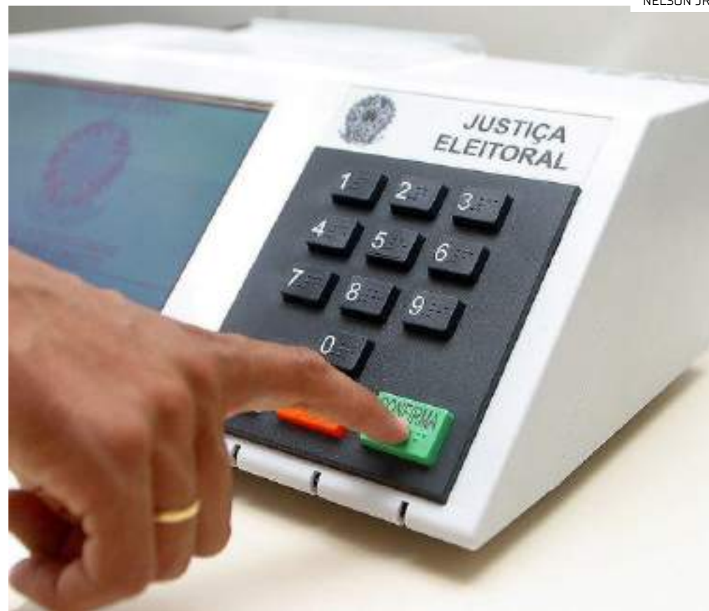
Comando do Centro ficará a cargo do presidente do TSE, ministro Alexandre de Moraes

Vão participar da iniciativa a Procuradoria-Geral da República; o Ministério da Justiça e Segurança Pú-