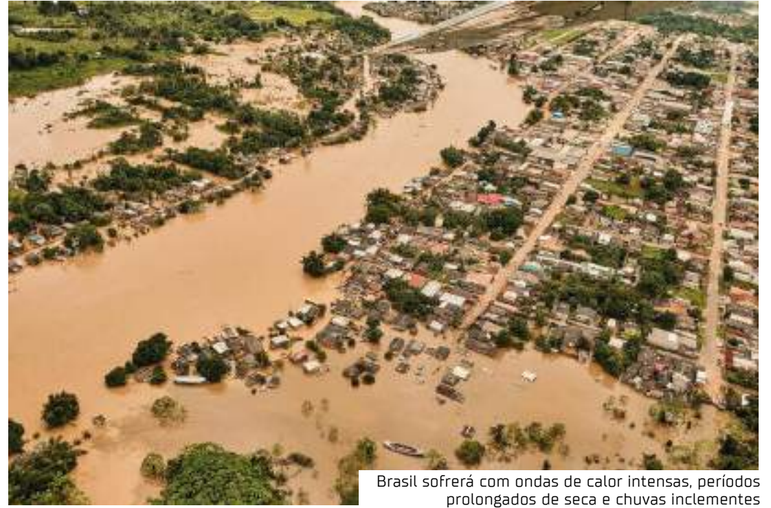
Brasil sofrerá com ondas de calor intensas, períodos prolongados de seca e chuvas inclementes

cendo de forma cada vez mais frequente em todo o planeta", observa o cientista Carlos Nobre, do Instituto de Estudos Avançados da Universidade de São Paulo (USP).