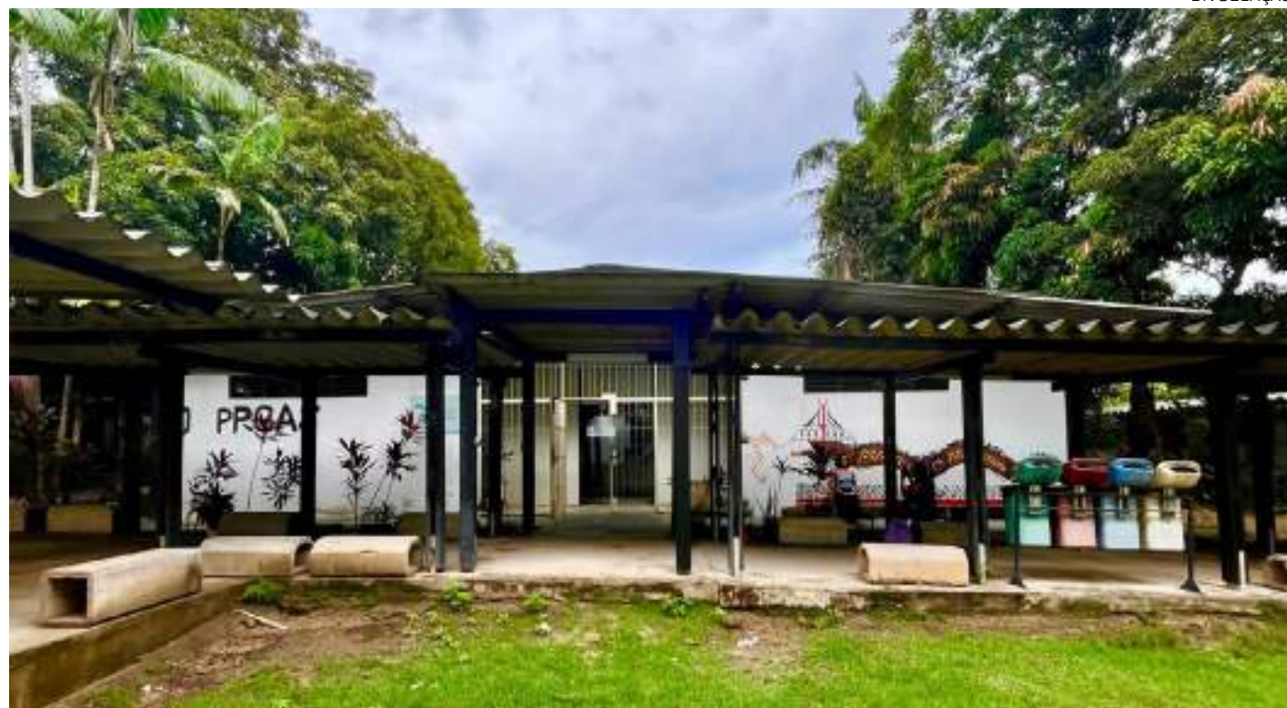
Encerramento, na sexta-feira (22), será aberto ao público com mesa redonda, lançamento de livros e conferência