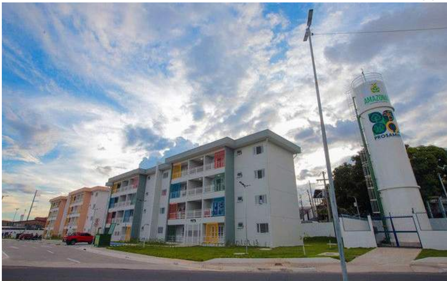
Programa Amazonas Meu Lar integra as políticas de habitação e fundiária do Governo do Amazonas

Representante do Governo do Amazonas no Comitê de Saneamento do ConCidades, o secretário explica que, no primeiro dia, haverá uma reunião para tratar sobre o Fundo Nacional de Habitação de Interesse Social. "O tema é muito importante, porque o Fundo visa combater o déficit habitacional para a população de baixa renda e em situação de vulnerabilidade social. O Governo do Estado tem um grande programa nesse segmento, o Amazonas Meu Lar, que tem como meta ofertar 24.044 so-