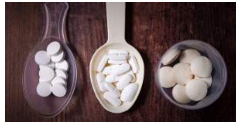
Número é influenciado pela disponibilidade de medicamentos abortivos