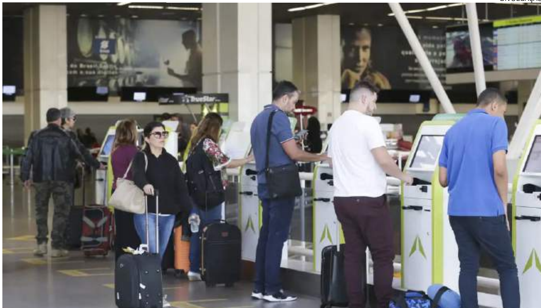
Programa Voa Brasil, com 5 milhões de passagens a R$ 200, será lançado nas próximas semana

Em entrevista à TV Cultura, Costa Filho disse que passagens nesse valor para todos os brasileiros seria "insano". O programa havia sido apresentado no ano passado pelo seu antecessor no cargo, Márcio França, atual ministro do Empreendedorismo.