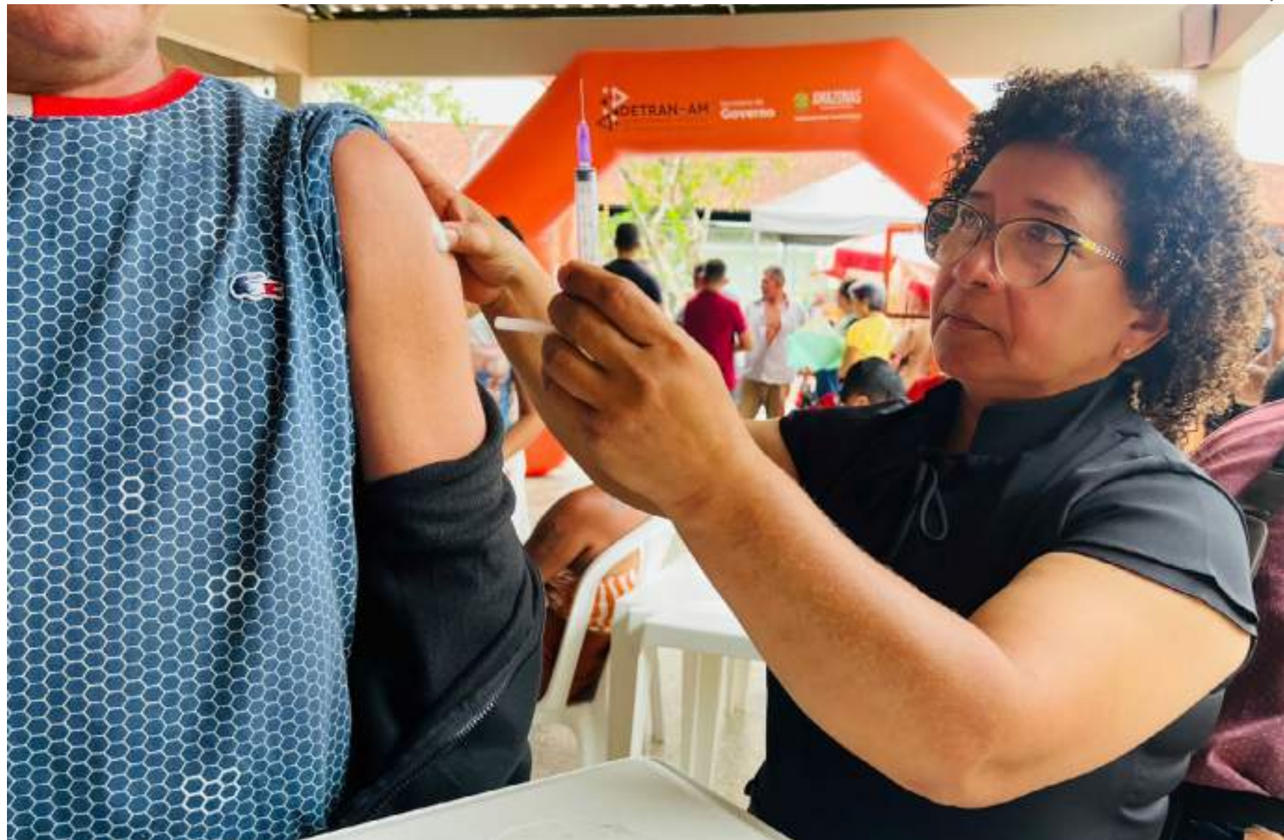
Ações educativas, além do reforço à importância da vacinação na prevenção de doenças imunopreveníveis, estão entre as atividades a serem realizadas pela campanha

De acordo com a diretora-presidente da FVS-RCP, Tatyana Amorim, a estratégia de Vacinação na Escola, em 2024, segue a programação do Programa Saúde na Escola (PSE). "A estratégia de multivacinação nas escolas é para oportunizar o acesso àqueles que desejam atualizar sua caderneta de vacinação, mas não conseguem chegar no posto de saúde no horário de rotina", explica.