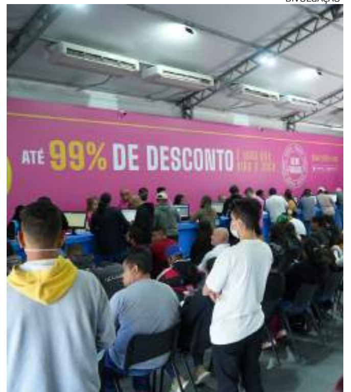
Dia D terá atendimento presencial especial em agências dos Correios

Com o propósito de revolucionar o acesso ao crédito no Brasil, a Serasa oferece um ecossistema completo voltado para a melhoria da saúde