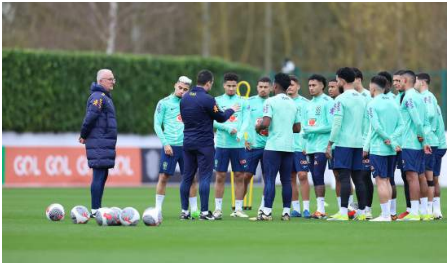
Dois oito estreantes na Seleção Brasileira, cinco são do futebol nacional e três destes trabalharam com o treinador Dorival Jr. em São Paulo e Flamengo

Savinho é o jogador mais novo convocado por Dorival Júnior. Ele vai completar 20 anos em abril. O capixaba de São Mateus joga no Giro-