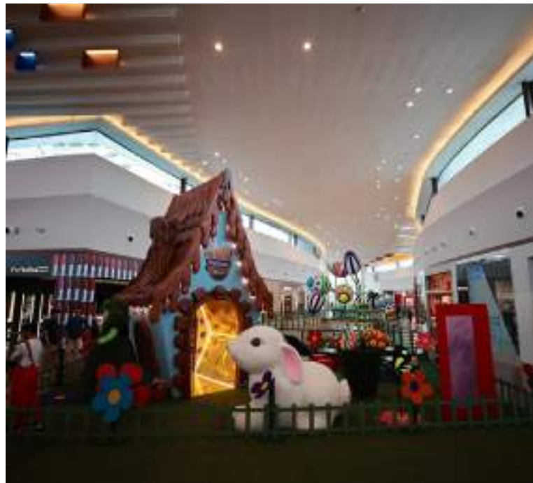
Páscoa Encantada no Manauara Shopping tem espaço temático para crianças