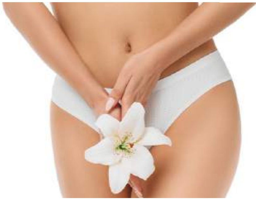
Procedimentos de estética íntima são indicados para mulheres de todas as idades