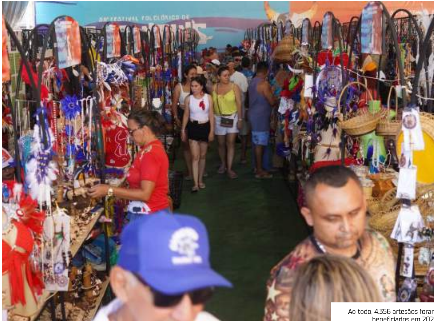
Ao todo, 4.356 artesãos foram beneficiados em 2023

Com objetivo de viabilizar ainda mais a geração de emprego e renda, a Secretaria Executiva do Trabalho e Empreendedorismo (Setemp) se tornou um escritório parceiro da Agência de Fomento do Estado do Amazonas (Afeam), levando oportunidade da linha de crédito aos artesãos e empreendedores. E, em 2023, o programa beneficiou 89 artesãos e empreendedores solidários, liberado em linha de crédito mais de R$ 643 mil.