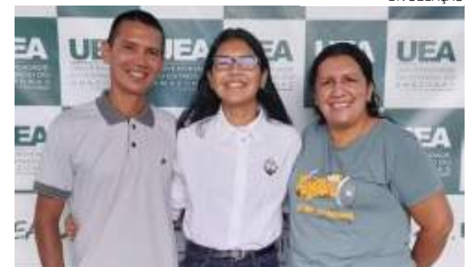
Após cometer duplo homicídio, sargento tentou tirar a própria vida

A Polícia Militar do Amazonas divulgou uma nota informando que "não compactua com quaisquer condutas criminosas cometidas por seus agentes" e informa que, "além do processo na polícia judiciária pelos crimes cometidos, será instaurado um procedimento administrativo pela instituição para apurar a conduta do agente".