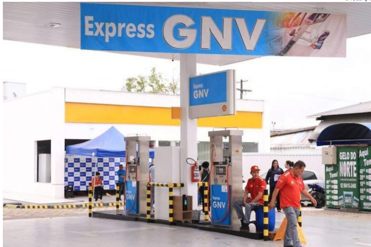
Zona Leste de Manaus ganha 1º posto de abastecimento de GNV