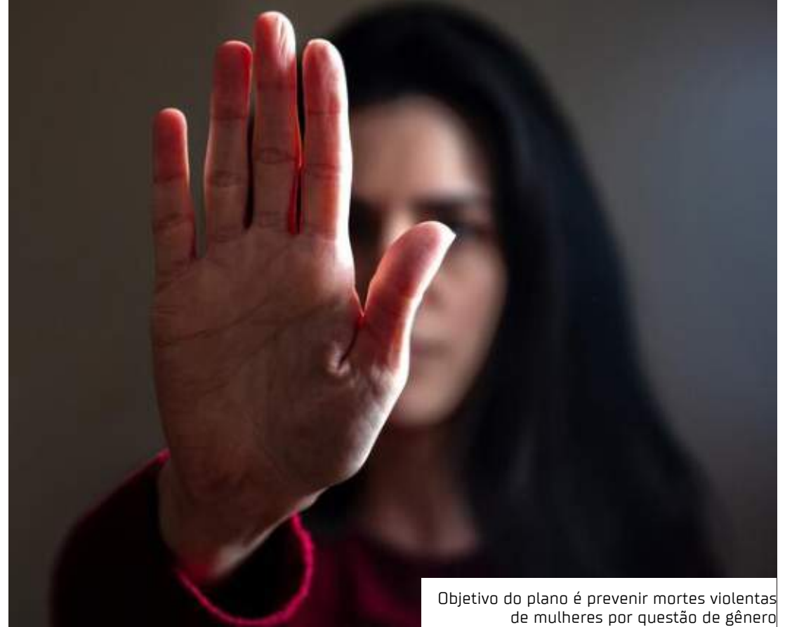
Objetivo do plano é prevenir mortes violentas de mulheres por questão de gênero

evitar a violência por meio da mudança de crenças e comportamentos para eliminar os estereótipos, promover cultura de respeito e não tolerância à discriminação, por exemplo, com a formação de mulheres líderes comunitárias e realização de oficinas de escuta nacional com mulheres.