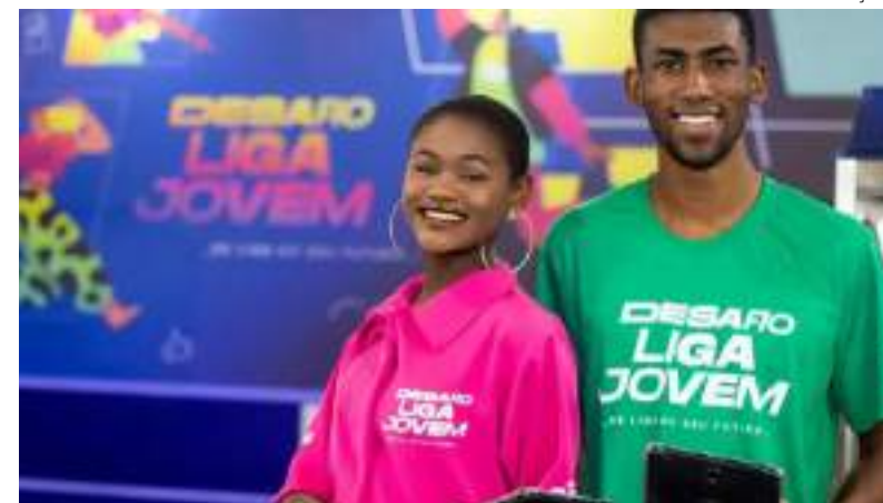
Desafio Liga Jovem vai promover uma trilha de capacitação para estudantes