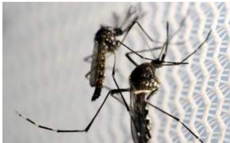
Dados incluem 10 semanas epidemiológicas de 2024, até 9 de março