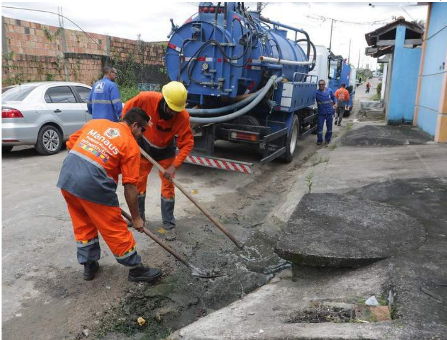
Em janeiro, as equipes da Seminf atenderam solicitações para desobstruir 476 caixas

Outros serviços acontecem na Zona Sul, onde os trabalhadores realizam a remoção de resíduos na avenida Rodrigo Otávio, bairro Japiim. Na Zona Norte, o Distrito de Obras executa a limpeza das caixas coletoras no conjunto Manauara 2, no bairro Santa Etelvina.