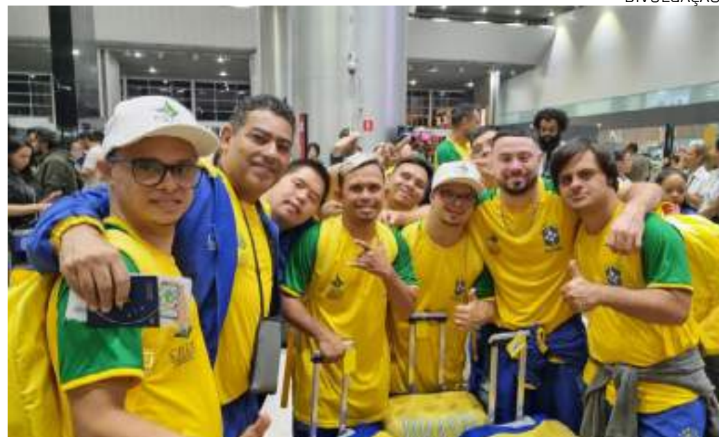
Duas primeiras partidas da Seleção Brasileira no Mundial serão contra México e Portugal