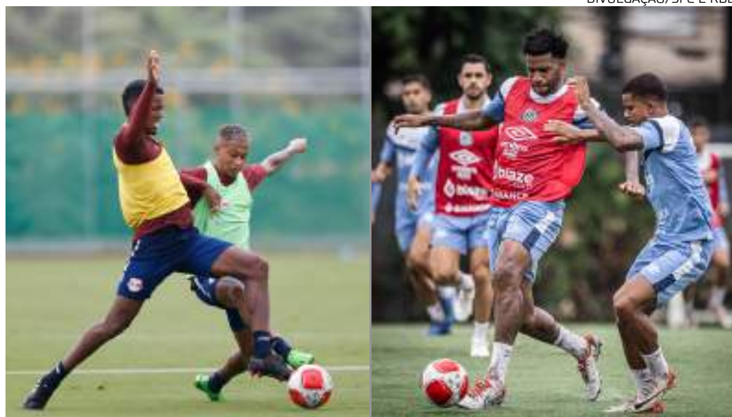
Enquanto o Massa Bruta quer voltar à final pela primeira vez desde 1990, Santos foi campeão em 2016