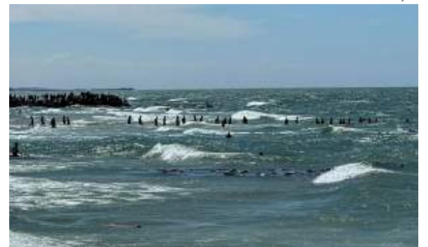
Testemunha disse que pacotes foram lançados a quase um quilômetro da costa