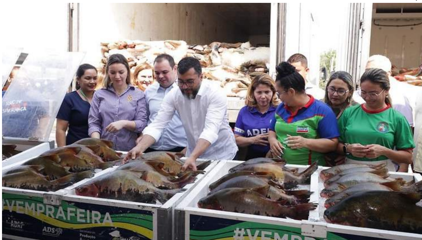
Wilson Lima anuncia doação de mais de 360 toneladas de peixe a instituições assistenciais do Amazonas

O pescado doado é proveniente de piscicultores da capital