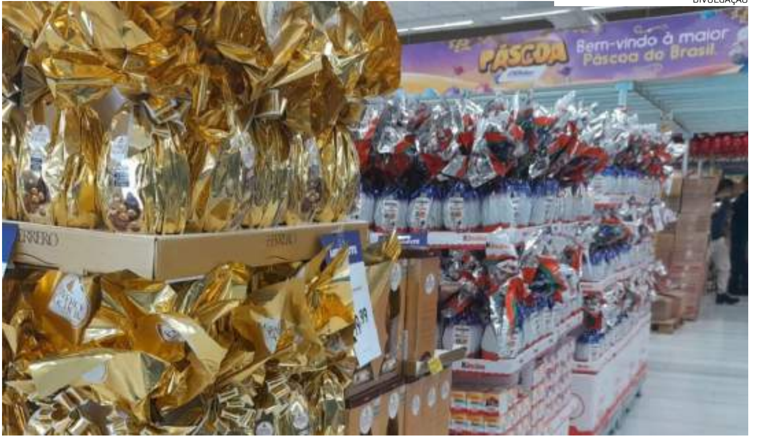
Ovos de Páscoa subiram, em média, 10,33% este ano

"A principal dica nesse período é atenção na qualidade do produto que você está comprando. Es-