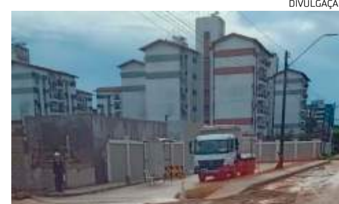
No ano passado, a MRV investiu R$ 7.189.603 em obras

No ano passado, a MRV investiu R$ 7.189.603 em obras de urbanização em todas as zonas de Manaus. Esse valor foi utilizado em infraestrutura viária, obras de drenagem e construção e revitalização de praças e parques, refletindo numa melhor mobilidade urbana e maior área verde.