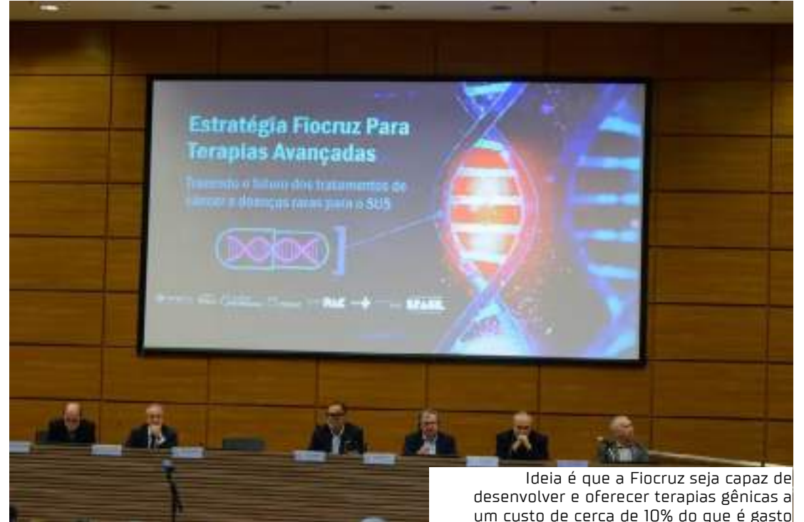
Ideia é que a Fiocruz seja capaz de desenvolver e oferecer terapias gênicas a um custo de cerca de 10% do que é gasto

A terapia chamada de CAR-T consiste em inserir, em linfócitos T (células de defesa) dos pacientes, lentivírus que carregam um gene específico para combater o tumor.