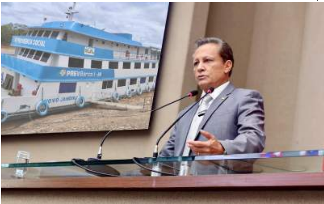
Deputado solicita providências para viabilizar drenagem em trechos do rio

Em visita recente a Pauini, por ocasião dos festejos do aniversário do município, o deputado explicou ter se deslocado de lancha em um trecho que liga os dois municípios citados e averiguou a necessidade de dragagem e sinalização do rio para que não se torne difícil a navegabilidade, principalmente na época da seca, prejudicando o transporte das embarcações.