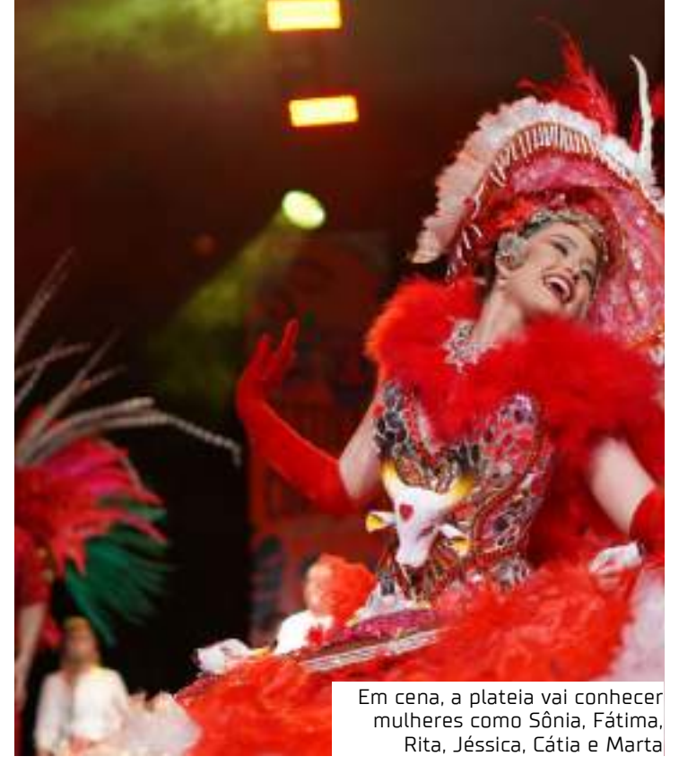
Em cena, a plateia vai conhecer mulheres como Sônia, Fátima, Rita, Jéssica, Cátia e Marta

direção artística foi assinada por Rivaldo Pereira (Garantido) e de Edwan Oliveira (Caprichoso).