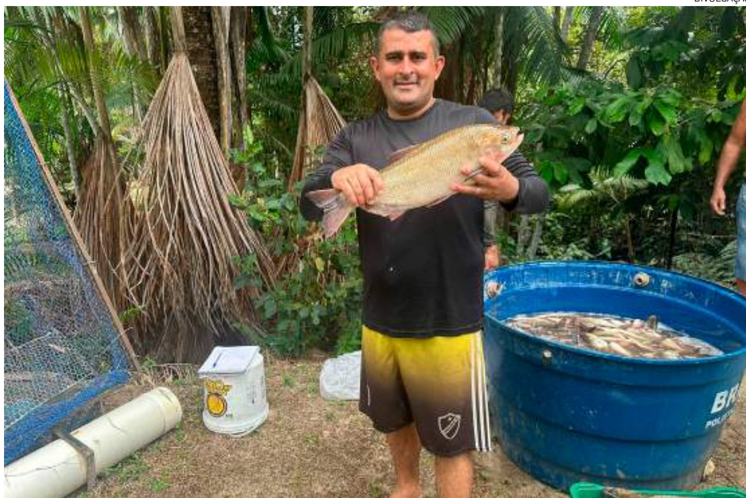
Peixes são oriundos de piscicultores de Careiro da várzea, Careiro Castanho, Iranduba, Itacoatiara, Rio Preto da Eva e outros municípios

"Este é o meu segundo ano participando do Feirão do Pescado. Já estou envolvido nessa atividade há dois anos, graças à parceria com a ADS.