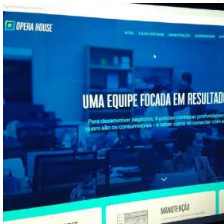
Empresa cria ferramenta exclusiva para o gerenciamento de sites e lojas