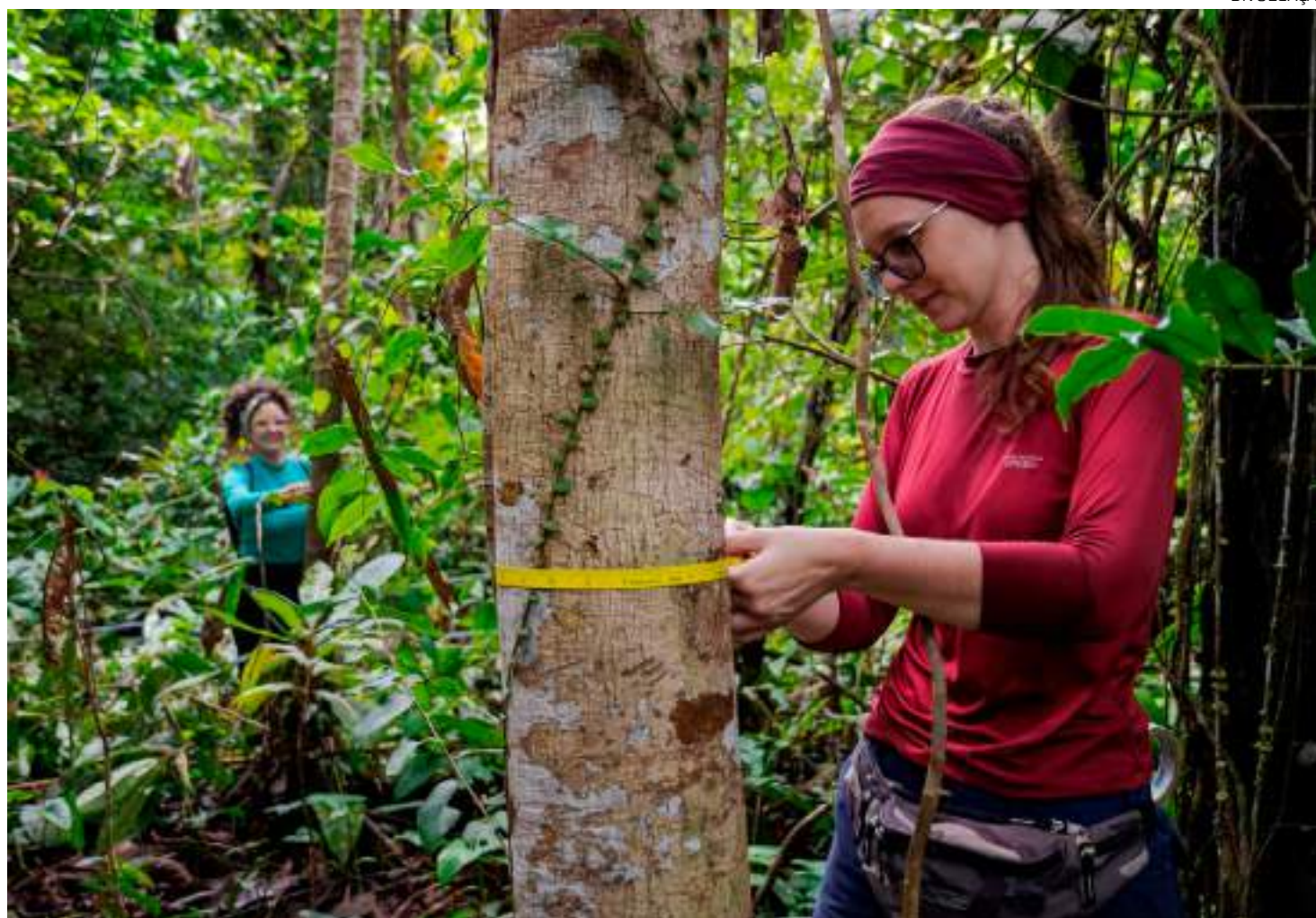
Expedição desempenhou papel importante no registro de espécies novas e na identificação de novos locais de ocorrência para espécies já conhecidas

Os pesquisadores também relatam a descoberta de uma possível nova espécie de peixe, conhecido como candiru, além de algumas espécies de anfíbios. Os candirus compreendem um grupo de bagres de tamanho pequeno,