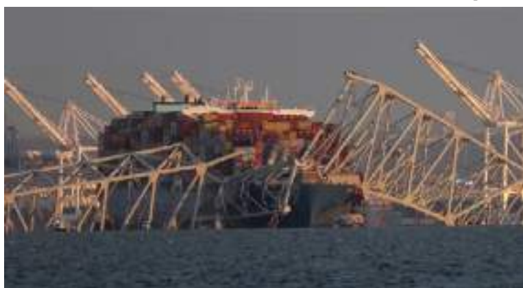
Vista da ponte Francis Scott Key, que desabou após a colisão de um navio