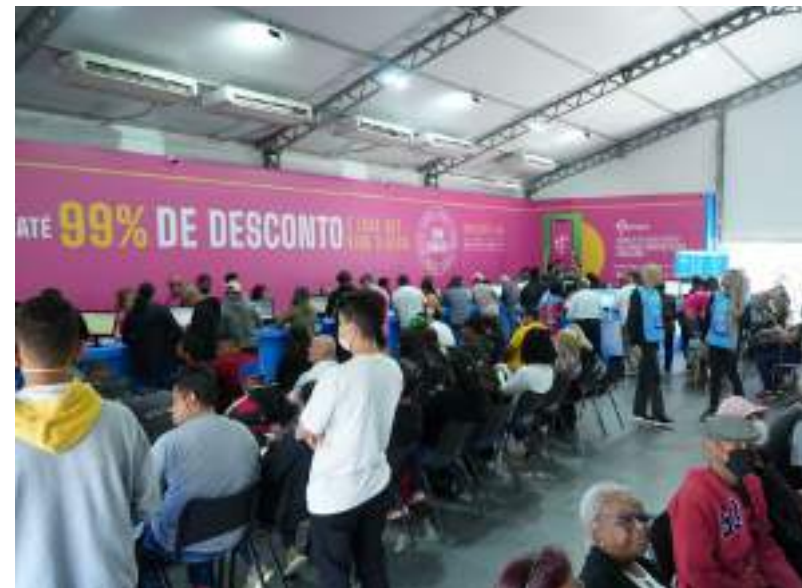
Serasa e o Programa Desenrola disponibilizam 7 milhões de ofertas no Amazonas