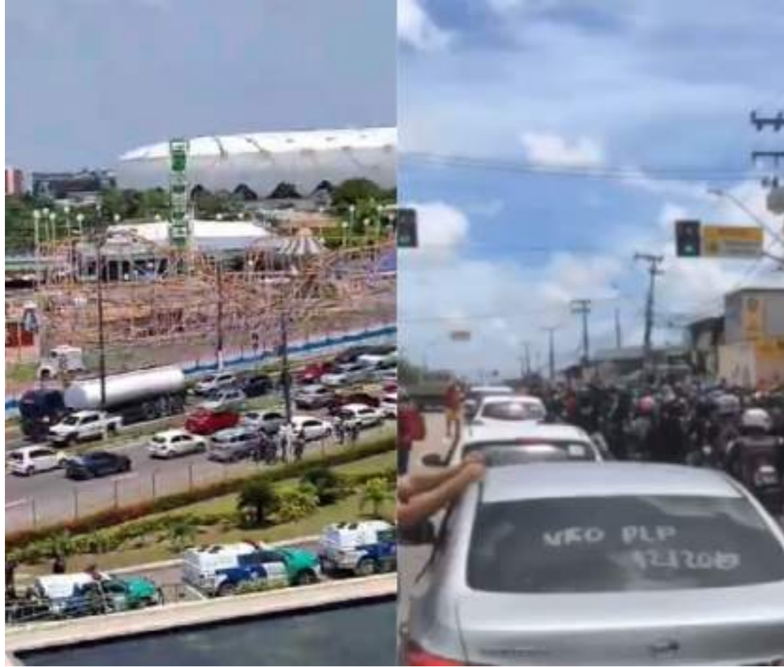
Manifestação de dezenas de trabalhadores percorreu por meio das principais avenidas da capital amazonense

Segundo o último levantamento realizado pelo Instituto Brasileiro de Geografia e Estatística (IBGE), estima-se que a lei deve impactar, ao menos, 704 mil motoristas de aplicativo.