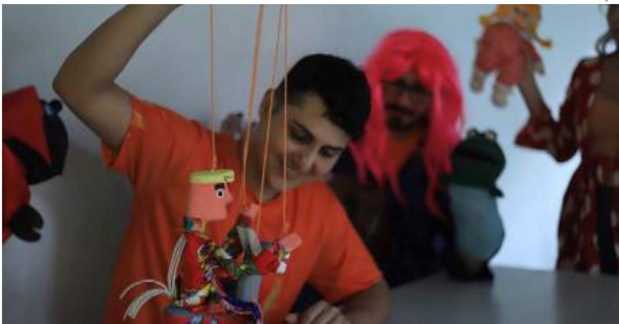
Oficina será realizada na unidade Liceu de Artes, no Sambódromo