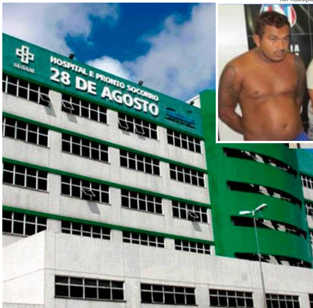
Alvos foram endereços residenciais, entre eles, de servidores estatutários do órgão

Trata-se do desdobramento de uma investigação criminal que visa apurar a associação entre agentes públicos e particulares para prática dos cri-