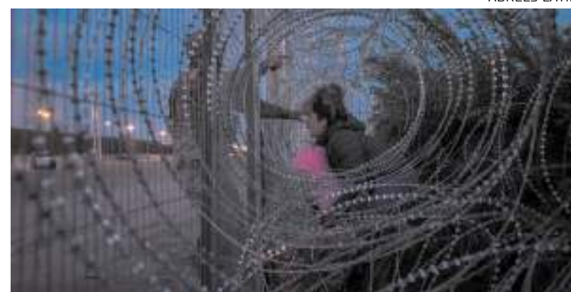
Imigrante venezuelana em local de fronteira em El Paso, Texas