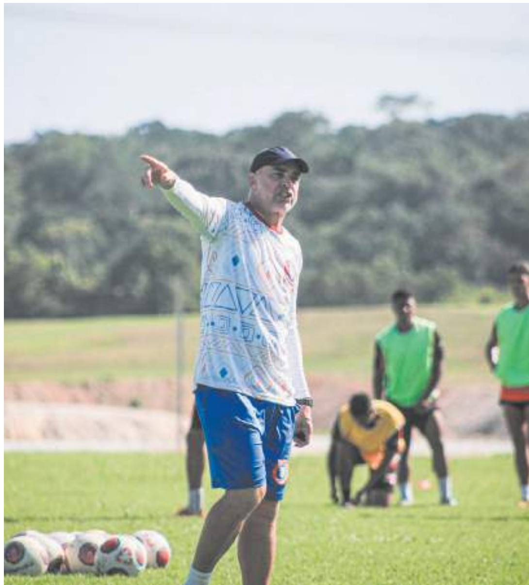
RPE Parintins, terceiro colocado do grupo B no segundo turno, vai encarar o Amazonas FC nas quartas de final