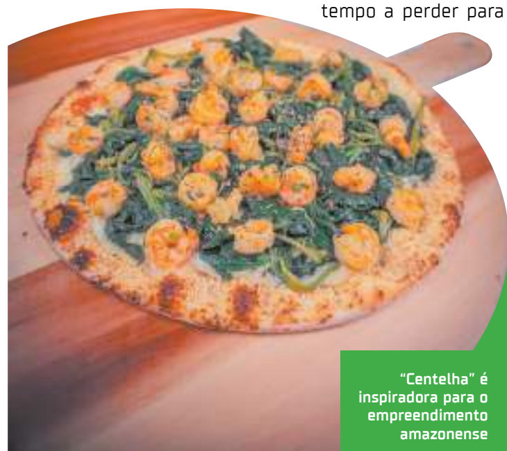
“Centelha” é inspiradora para o empreendimento amazonense

“O Amazonas deu espaço para que realizássemos o sonho de sermos empreendedores, de conseguir criar nossas filhas, de gerar empregos. Atualmente, geramos trinta e quatro empregos diretos, fora os indiretos. E uma realização também maior é a de poder dar testemunho do projeto ‘Economia de Comunhão’, sendo uma nova forma de pensar e fazer negócios, mostrando ser possível ganhar dinheiro e gerar impacto na sociedade. Nossa missão é contribuir para uma economia mais justa, fraterna e regenerativa.”