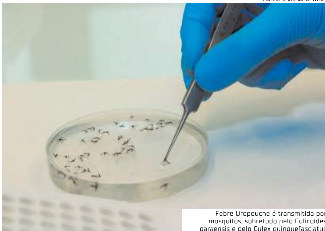
Febre Oropouche é transmitida por mosquitos, sobretudo pelo Culicoides paraensis e pelo Culex quinquefasciatus

Os sintomas da doença são semelhantes aos da dengue e incluem febre — temperatura entre 38 e 39,5°C —, dor no corpo e nas articulações, calafrios, dor de cabeça, náuseas, vômitos e diarreia. Eles duram, em média, uma semana.