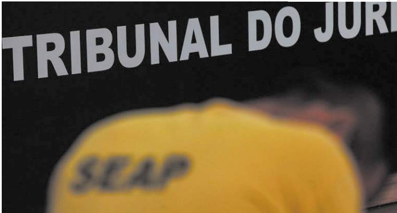
Crime teve relação com brigas entre membros de facções criminosas do tráfico de drogas