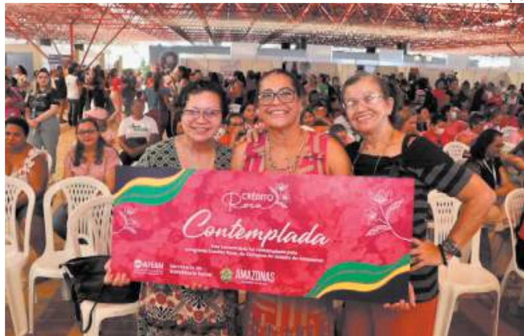
Programa beneficia mais de 2 mil empreendedoras com financiamentos

que empreendem e atuam no mercado de trabalho autônomas ou Microempreendedora Individual (MEI), o Crédito Rosa é oferecido pela Agência de Fomento do Amazonas (Afeam) e conta com a parceria da Seas, por