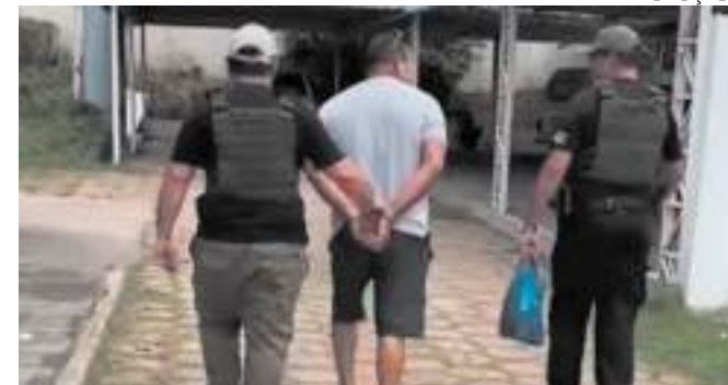
Vítima foi quem denunciou o crime a uma professora