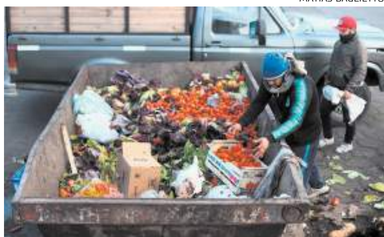
Homem recolhe comida em contêiner com alimentos descartados

Apenas 21 países incluíram a perda e o desperdício de alimentos nos seus planos climáticos nacionais, apesar de gerarem 8% a 10% das emissões globais que provocam o aquecimento do planeta — quase cinco vezes mais do que as emissões do setor da aviação.