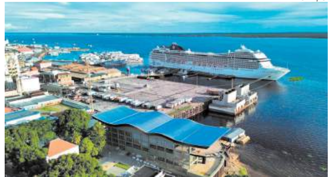
Vinhedo Rio & Mar abre novo restaurante no Centro Histórico de Manaus

Para uma grande comemoração, o Vinhedo Mirante terá o tradicional Pirarucu Assado, servindo até 18 pessoas, mas há também a “carne de ouro” em porções individuais com 350 gramas com um toque amazônico no acompanhamento. E há