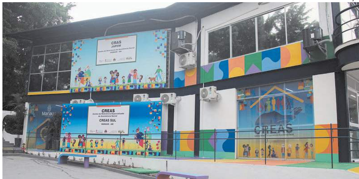
Prefeitura de Manaus reinaugura Creas na Zona Sul da capital

Diferente dos Centros de Referência de Assistência Social (Cras), que trabalham no intuito de prevenir