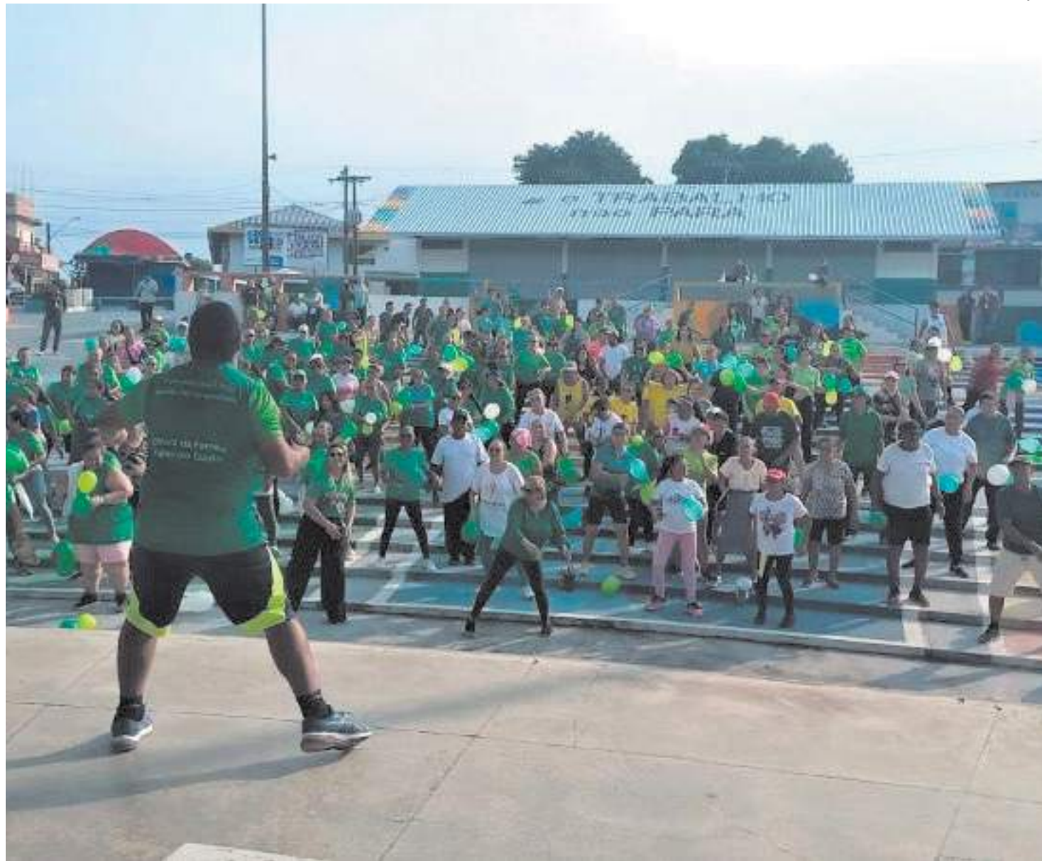
Na ação, aferição de pressão arterial; teste de glicemia; e medição de peso e altura foram alguns dos serviços realizados

“Na avaliação com médicos, nutricionistas, enfermeiros,