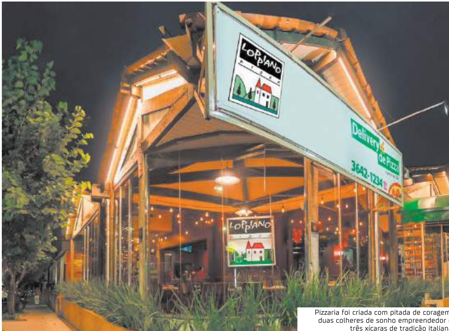
Pizzaria foi criada com pitada de coragem, duas colheres de sonho empreendedor e três xícaras de tradição italiana