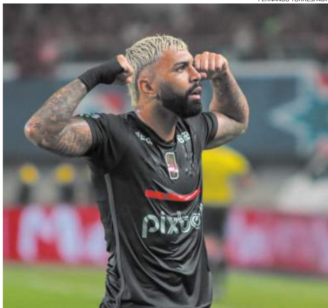
Atacante sofreu suspensão de dois anos por tentativa de fraude no exame antidoping, mas vai recorrer