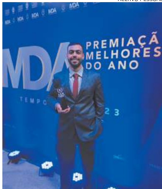
Prêmio entregue pela CBDU destacou o terceiro lugar no Pan-Americano