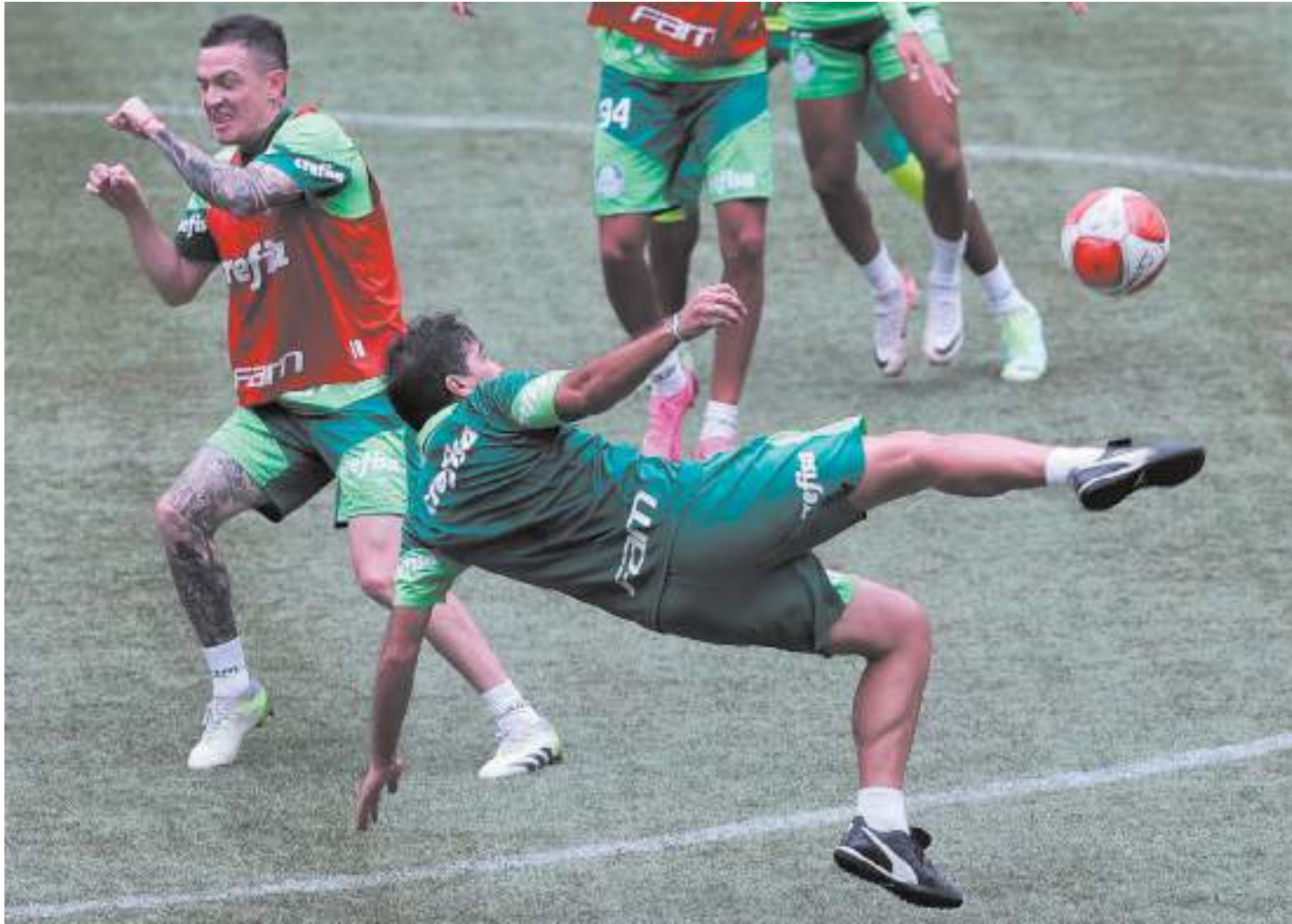
Atividade no Allianz Parque serviu para o grupo fazer reconhecimento do novo gramado artificial do estádio do Verdão

“Foi uma experiência muito boa. A gente conseguiu