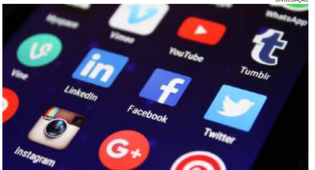
PL cria novas regras para a moderação de conteúdos nas redes sociais