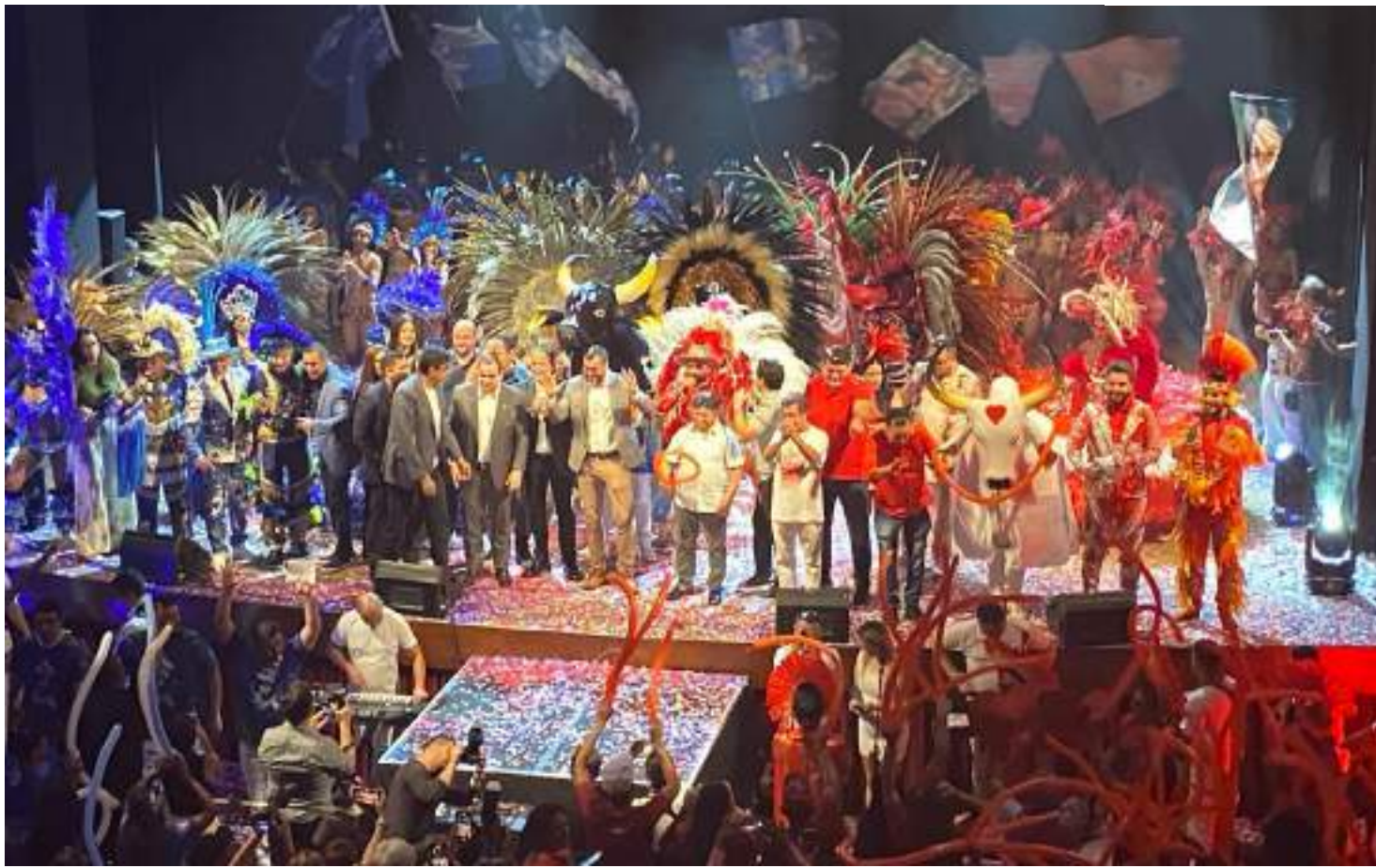
Governador apresentou na sexta-feira (15), temporada de eventos do 57º Festival de Parintins no Teatro Amazonas

"Estamos há 28 anos apoiando os bois. Ano passado, em Parintins, foi recorde de geração de emprego e renda. Temos um orgulho muito grande; esse