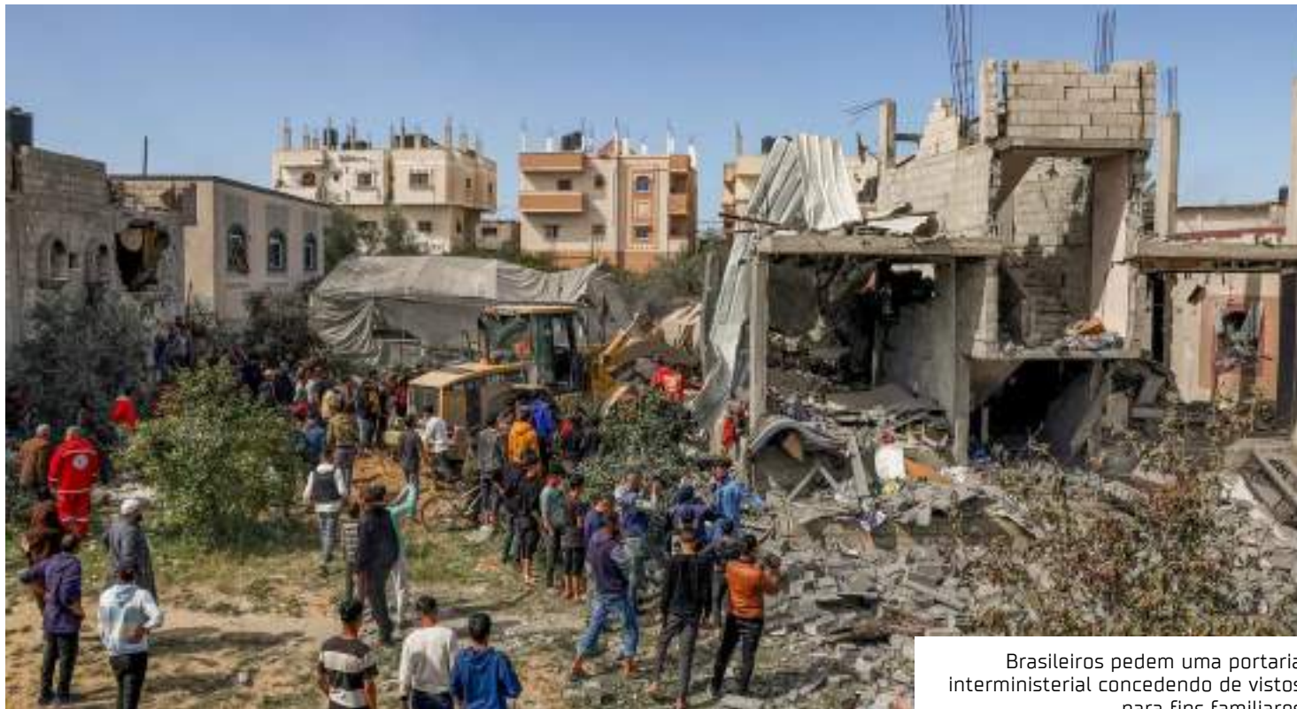
Brasileiros pedem uma portaria interministerial concedendo de vistos para fins familiares

origem palestina vive no Brasil há muitos anos, em diversos estados como São Paulo, Rio Grande do Sul e Bahia. Eles são orientados por um grupo de advogadas especializadas em direito internacional e direitos humanos.