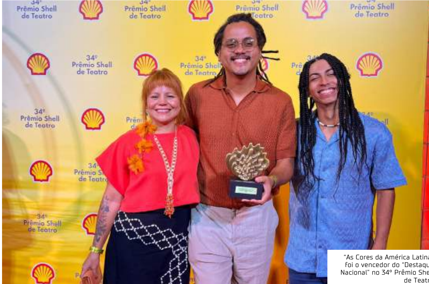
"As Cores da América Latina" foi o vencedor do "Destaque Nacional" no 34º Prêmio Shell de Teatro

Surgiu como uma das forças propulsoras do desenvolvimento regional, no âmbito do município de Manaus, uma vez que