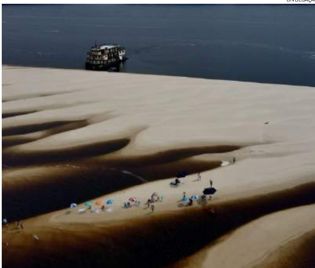
Praias do município de Novo Airão, no Parque Nacional das Anavilhanas, no período da vazante

O Sebrae, por liderar ações de inovação no turismo, participará da Feira Internacional de Destinos Inteligentes, apresentando a experiência que vem sendo realizada em