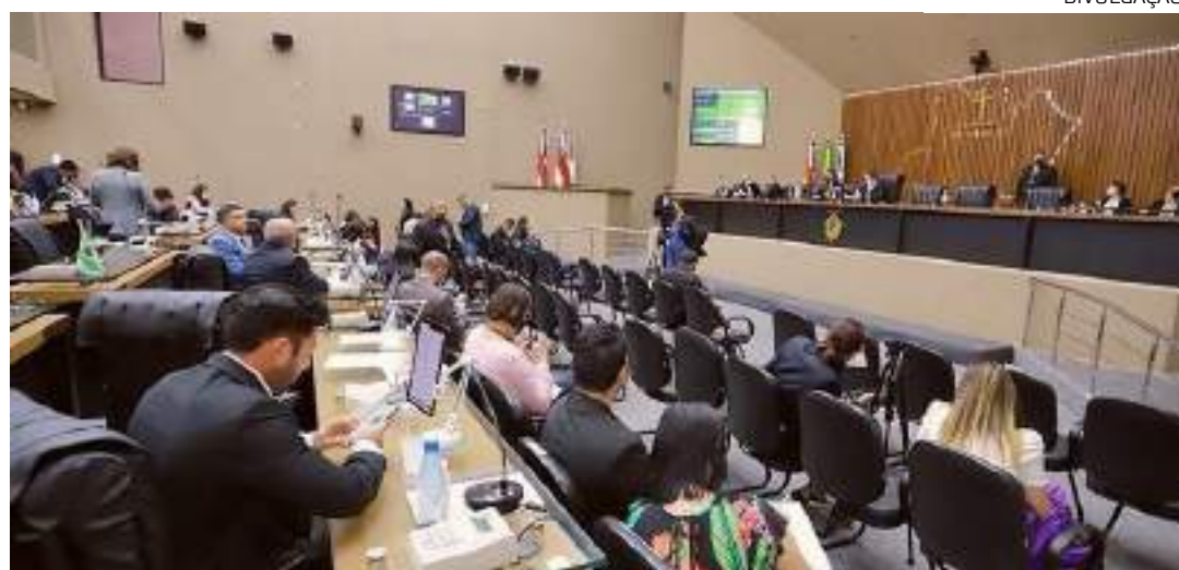
Projeto visa criação, fusão e desmembramento de municípios

de Lei, no Congresso, tratando sobre a emancipação de municípios, porém, existem fatores que impedem os processos de serem finalizados, como, por exemplo, força política. A solução seria que conseguíssemos aprovar uma PEC, documento que não se altera, para devolver as