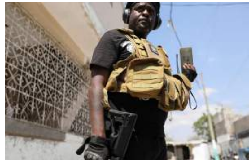
Ex-policial e líder de aliança de grupos armados Jimmy "Churrasco" Cherizier