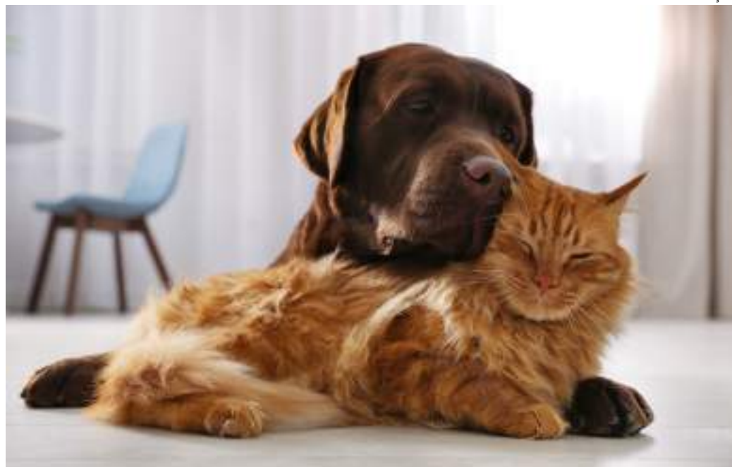
Migração de animais portadores da doença para o Amazonas, aliado à proliferação do Aedes, aumentou casos

O tratamento nas fases iniciais é feito com vermífugos e dependendo da gravidade da lesão, serão necessários outros procedimentos e medicações. Em caso de dúvidas, a professora indica a procura imediata de um profissional veterinário