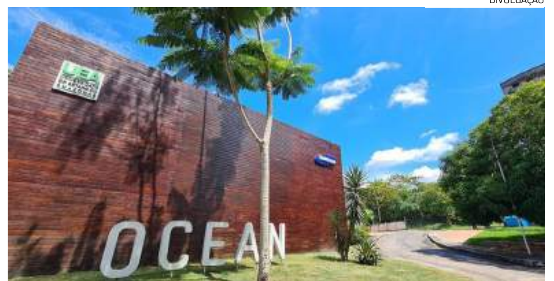
Samsung Ocean é programa de capacitação tecnológica em Manaus

"O Samsung Ocean é uma iniciativa da Samsung para contribuir com o aprendizado tecnológico e a disseminação do conhecimento de quali-