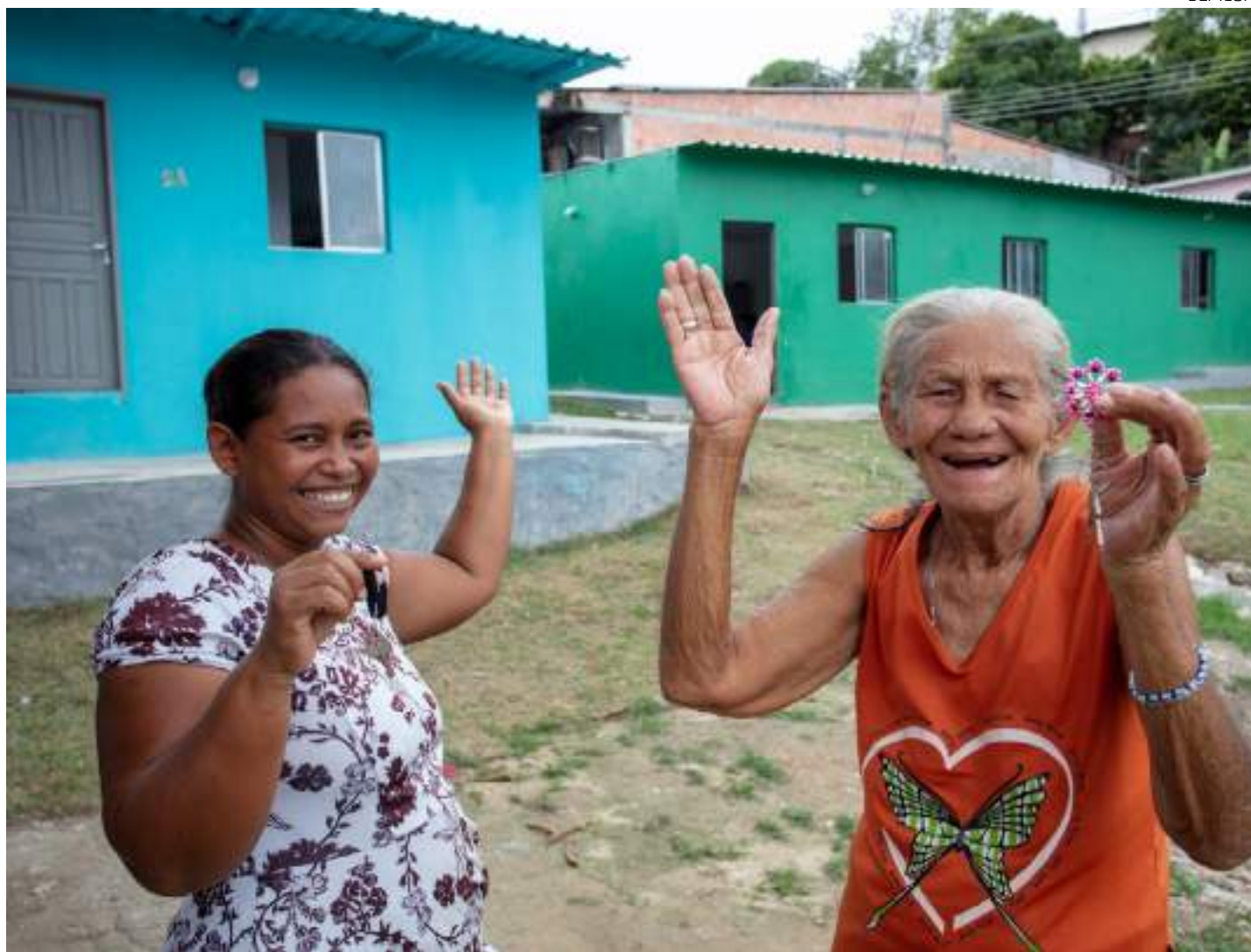
Doas moradoras exibem as chaves das casas reformadas pela Prefeitura de Manaus

"Nós vamos investir recursos nas reformas dessas casas, dessas moradias, com a contrapartida dos moradores. É um financiamento. É um programa pelo qual nós vamos dar uma parte e os moradores contemplados vão pagar a outra parte, com o financiamento feito pela própria Prefeitura de Manaus. Com isso, nós vamos dar digni-