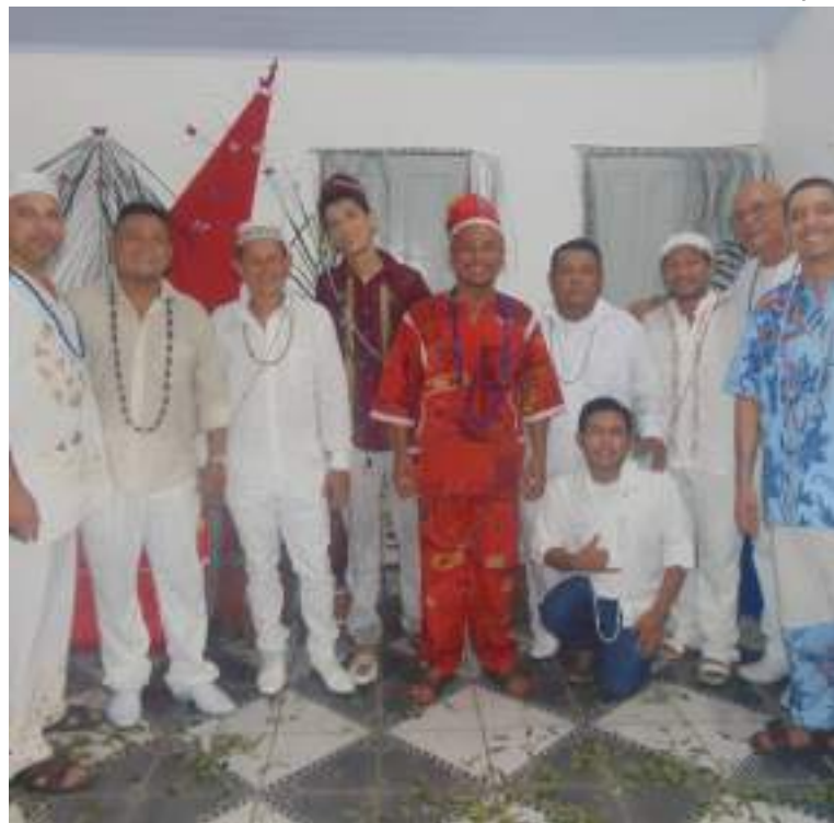
Projeto tenta aproximar público das religiões de matriz africana

Portanto, o lançamento do projeto é um marco importante na busca por uma sociedade mais inclusiva e consciente de suas raízes, trazendo voz às tradições das comunidades de matriz africana e contribuindo para uma maior valorização e reconhecimento da diversidade cultural do Brasil.