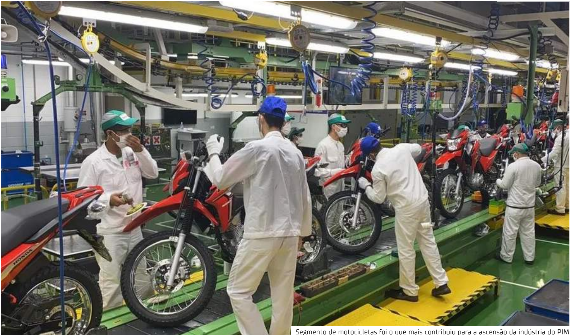
Segmento de motocicletas foi o que mais contribuiu para a ascensão da indústria do PIM

"Temos um departamento interno, dentro do CIEAM, específico para reunir e avaliar os indicadores industriais da região. Esse trabalho é muito importante, pois permite uma análise econômica geral do nosso estado, tendo como base o indicador IBCR-AM. Também aproveitamos dados do Ministério do Trabalho