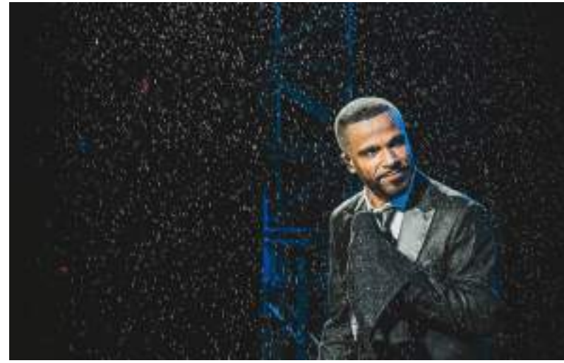
Alexandre Pires vai se despedir do grupo "Só pra Contrariar"