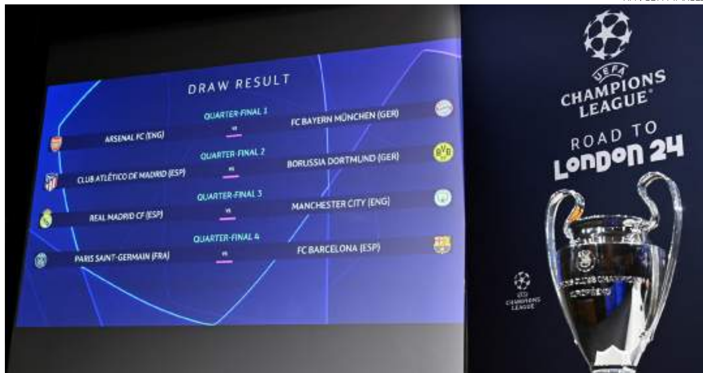
Sorteio das quartas de final da Liga dos Campeões aconteceu na sede da UEFA, em Nyon, na Suíça, nesta sexta-feira (15)

De um lado da chave, Arsenal, Bayern, Manchester City e Real Madrid vão lutar por uma vaga na final