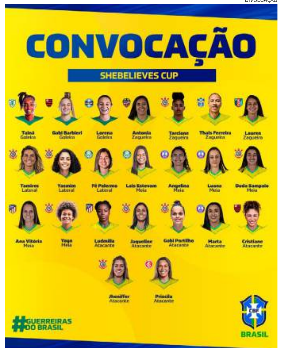
Entre as convocadas, 15 atletas atuam no Brasileirão e seis jogadoras são estreantes

A melhor posição obtida pelo Brasil aconteceu em 2009, quando a Seleção chegou à vice-liderança do ranking.