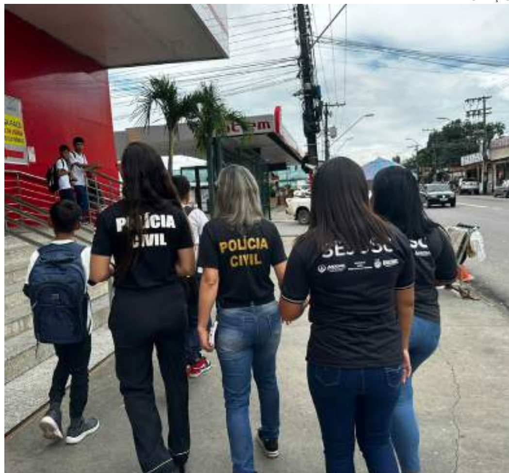
Órgãos do Estado atuam de forma integrada com foco na redução de crimes contra mulheres no período

Durante o mês de março, a Operação Átria atua com foco no combate a crimes praticados contra mulheres. No Amazonas, as ações são realizadas sob a coordenação da Secretaria de Segurança Pública (SSP-AM), com o apoio das Forças de Segurança e de outros órgãos.