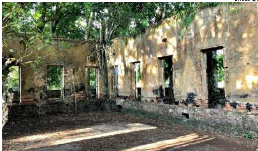
Paricatuba atrai visitantes para conhecer as ruínas do casarão

O Impact Hub Manaus será a empresa responsável pelo desenvolvimento e execução do projeto, que prevê mais de 50 horas de capacitação, entre oficinas e workshops, para mais de 90 empreendedores, abordando temáticas sobre a melhoria do modelo turístico local. Além disso, o