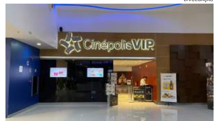
Shopping Ponta Negra terá sessão de cinema para autistas