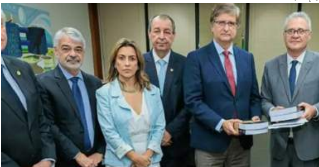
Paulo Gonet, procurador-geral da República, recebeu senadores