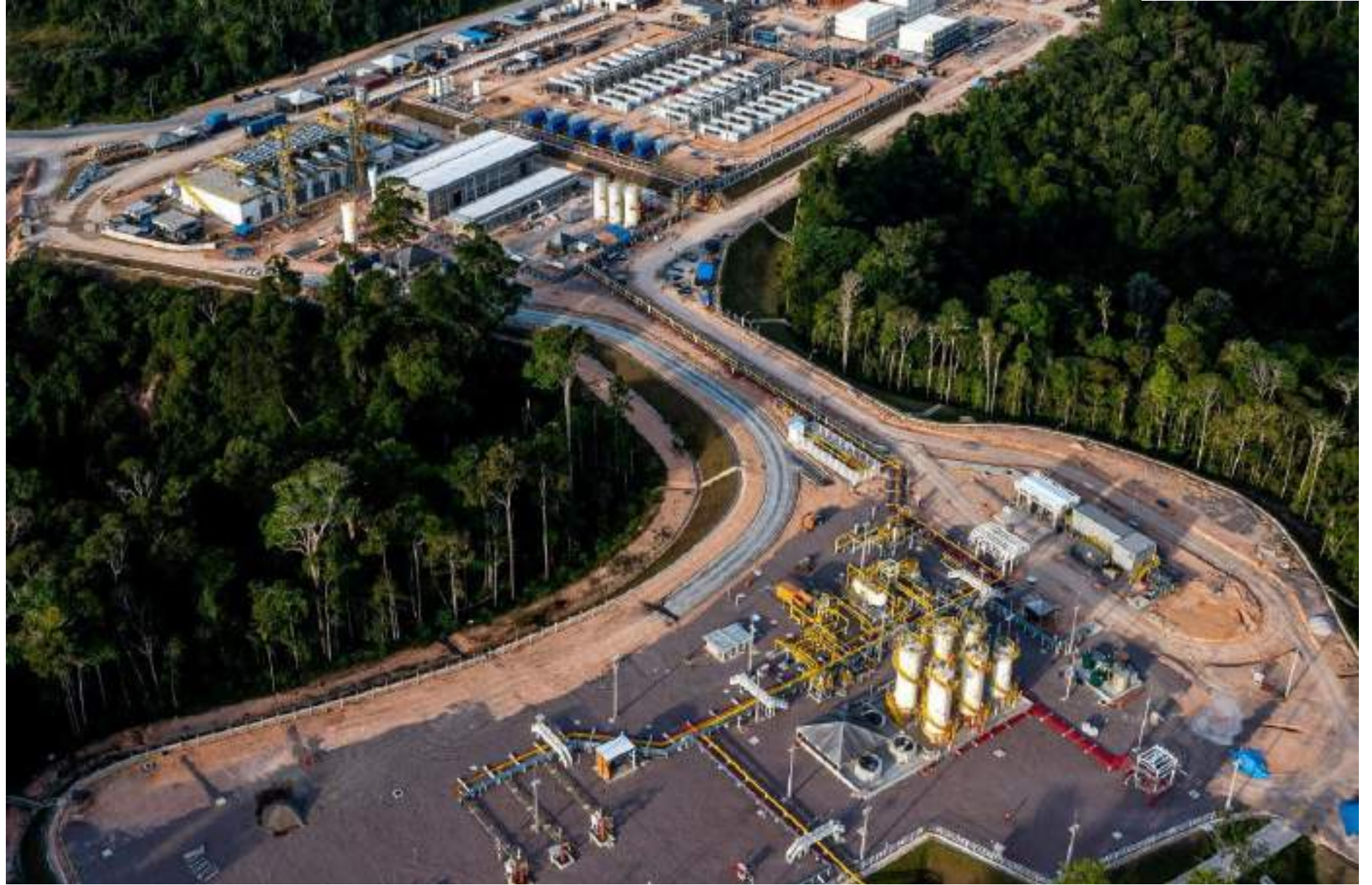
Complexo Azulão 950 é uma empreitada que abrigará as usinas termelétricas Azulão I e II

firma-se o marco da primeira descoberta comercial de petróleo e gás natural no Estado nos últimos 20 anos, já que a última vez que isso ocorreu foi em 2004, quando a Petrobras declarou comercialidade do Campo de Azulão.