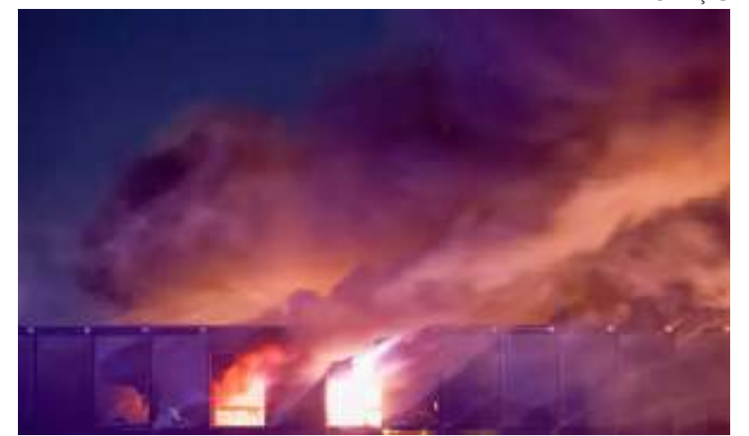
Homens invadem casa de shows em Moscou e atiram contra multidão