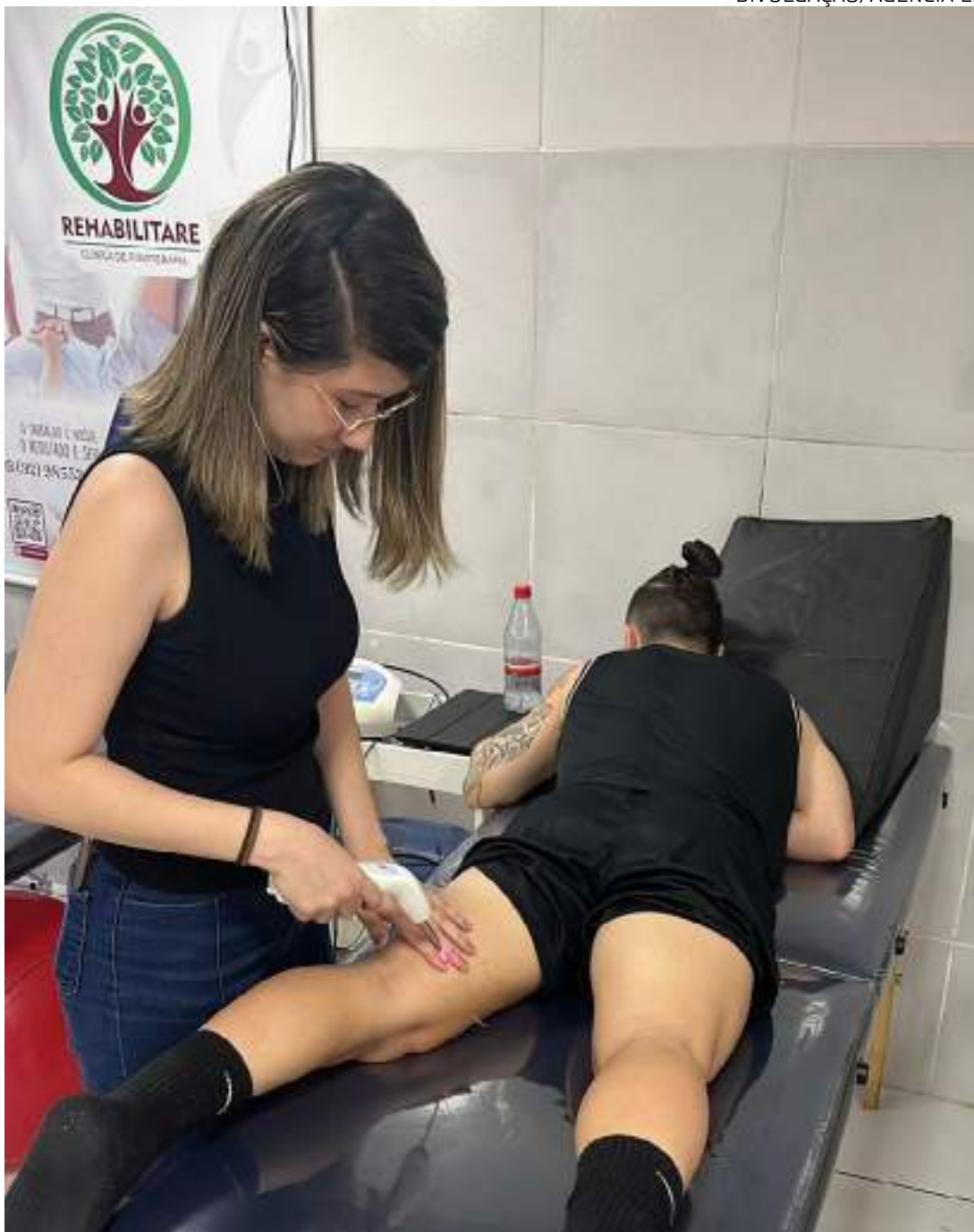
Prática da acupuntura tem beneficiados atletas, inclusive os jogadores do Amazonas FC

Além disso, a acupunturista descreve a diferença da acupuntura em homens e mulheres.