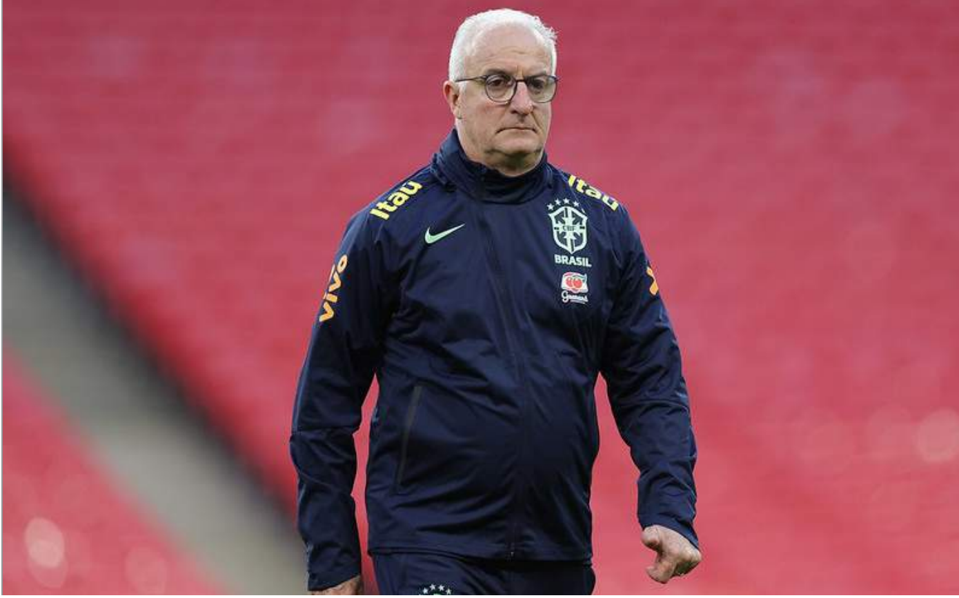
Técnico Dorival Júnior vai estrear no comando da Seleção Brasileira no duelo contra a Inglaterra, em Londres, no estádio Wembley

"Não desejo isso a ninguém. Sinto por todos. Sinto por tudo que passarão a partir de então nas suas vidas. Posso ajudar