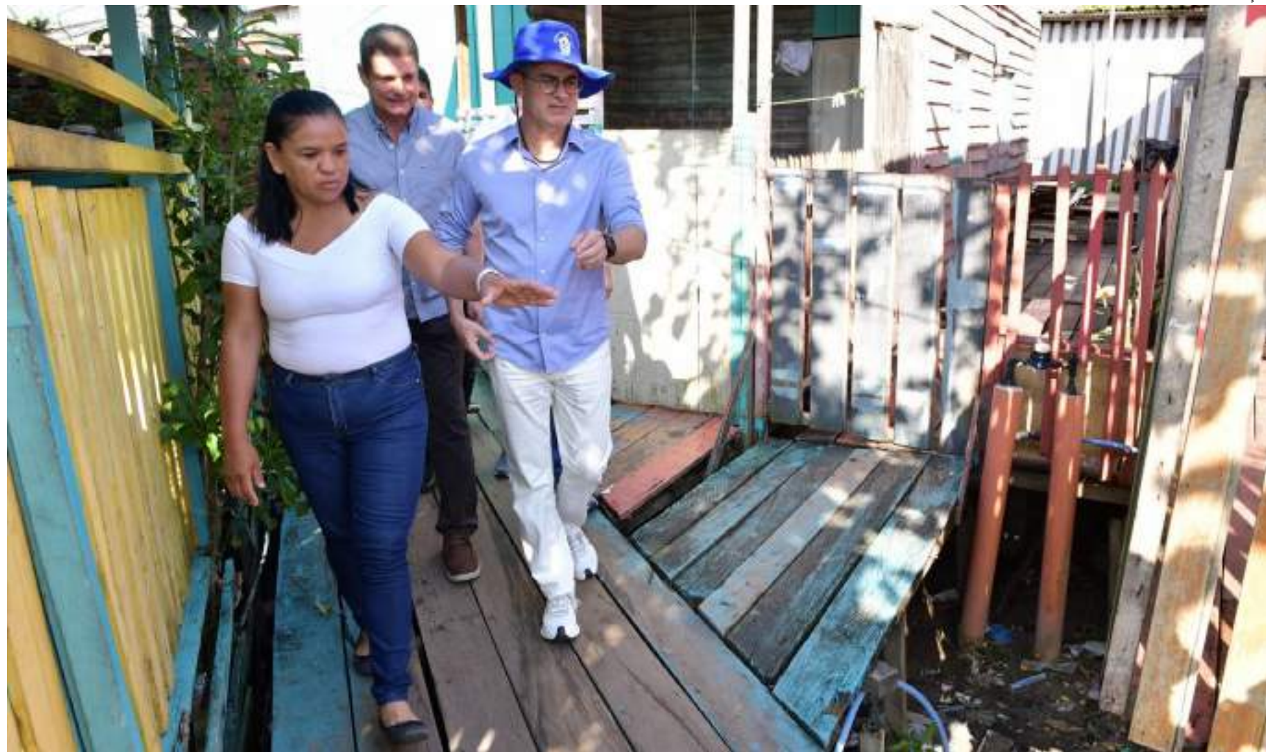
Prefeito de Manaus, David Almeida, em visita à estrutura de saneamento básico instalada no beco Nonato, no bairro Cachoeirinha, Zona Sul da cidade

"Nesta data simbólica, quando é celebrado o Dia Mundial da Água, comemoramos o avanço do serviço de abastecimento de água e a expansão do saneamento básico aos manauaras residentes em áreas vulneráveis