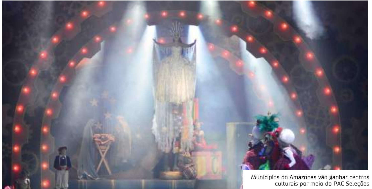
Municípios do Amazonas vão ganhar centros culturais por meio do PAC Seleções

"Será um trabalho coordenado pela nossa secretaria nessa questão da elaboração de projetos e acompanhamento, e o município também vai fazer toda a parte de operacionalização e manutenção desses espa-