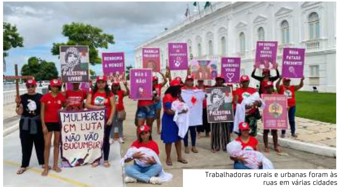
Trabalhadoras rurais e urbanas foram às ruas em várias cidades

"Essa casa é do povo maranhense, essa casa é nossa e vamos voltar quantas vezes for