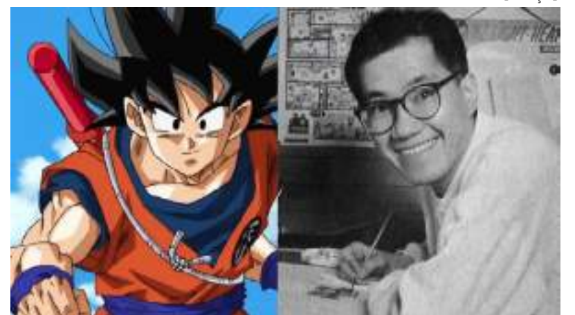
Artista japonês morreu devido a um coágulo de sangue no cérebro