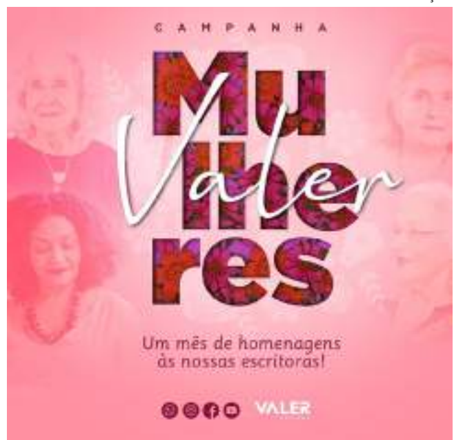
Campanha Valer Mulheres quer incentivar à leitura de escritoras nortistas