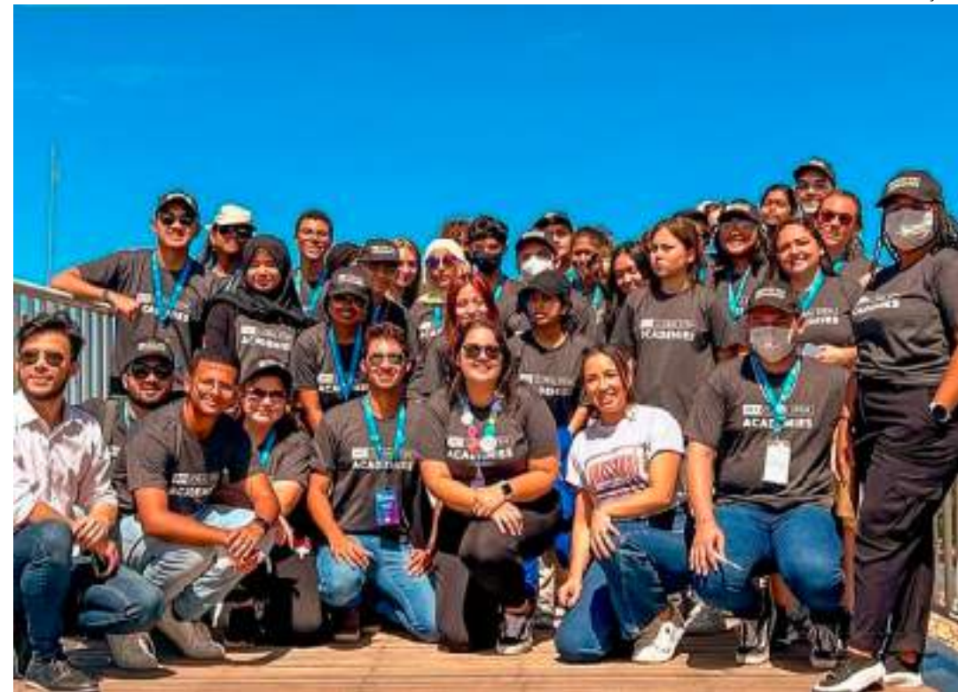
Organização AFS Intercultura Brasil seleciona pessoas que tenham interesse em abrir as portas de seus lares

"A saúde, segurança e bem-estar dos nossos estudantes é a prioridade número um. Os voluntários e profissionais da AFS são comprometidos e treinados a auxiliar os estudantes e