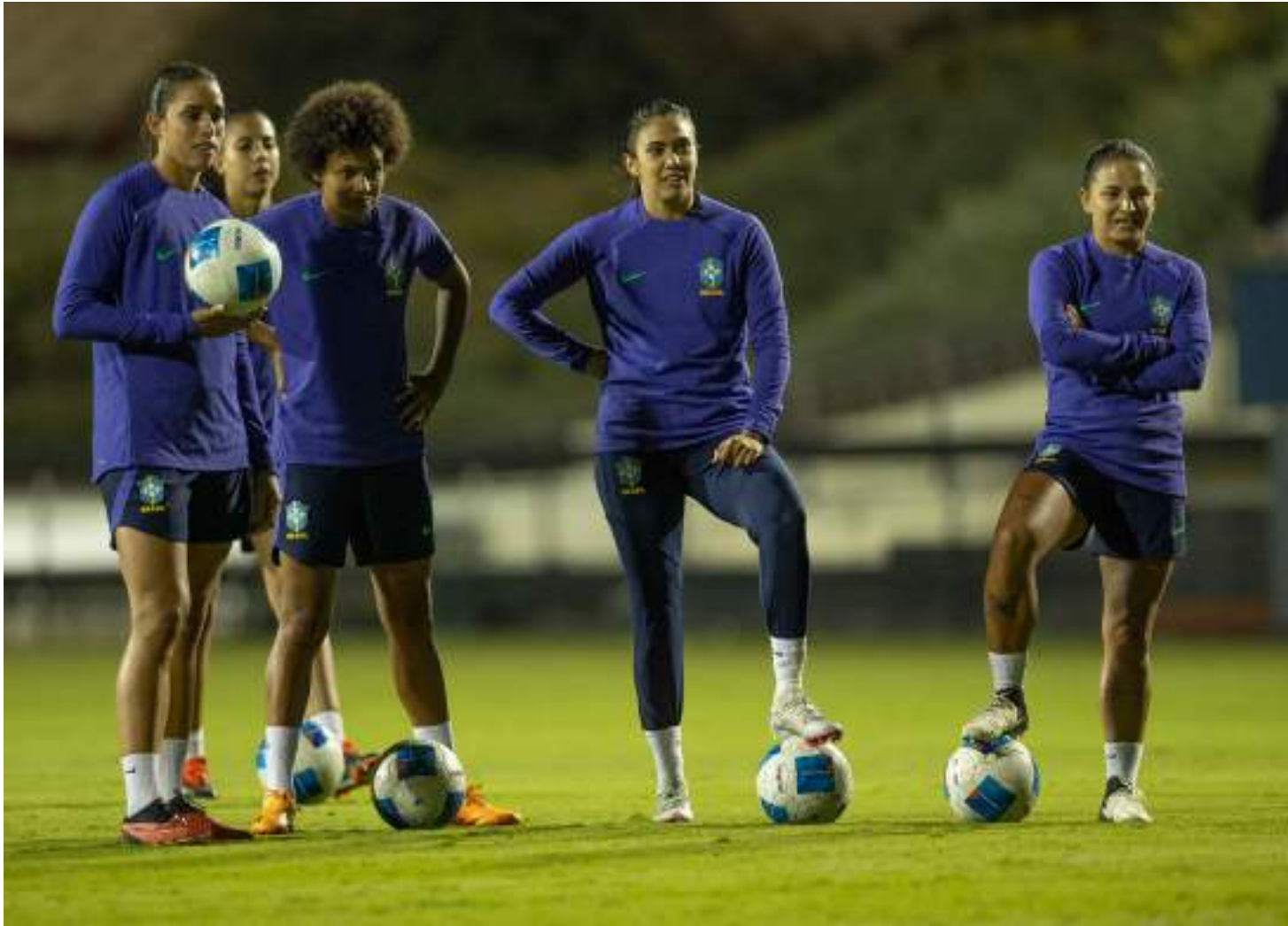
O Brasil está invicto na competição, com cinco vitórias na sequência contra Porto Rico, Colômbia, Panamá, Argentina e México

A última vez que as equipes se enfrentaram foi em 2023, pela SheBelieves Cup.