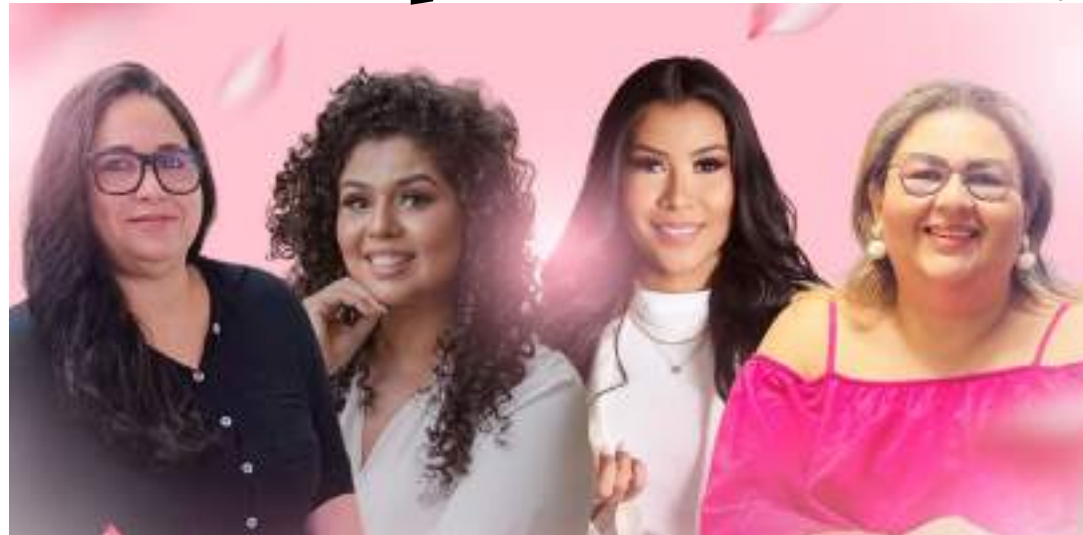
Empresárias enfrentam obstáculos para empreender no Brasil

Ainda segundo o relatório do GEM, o apoio necessário às mulheres não se limita apenas ao financiamento, elas demandam estruturas como creches, instituições extracurriculares para seus dependentes, locais para cuidados com os idosos, ou seja, uma rede de apoio para a em-