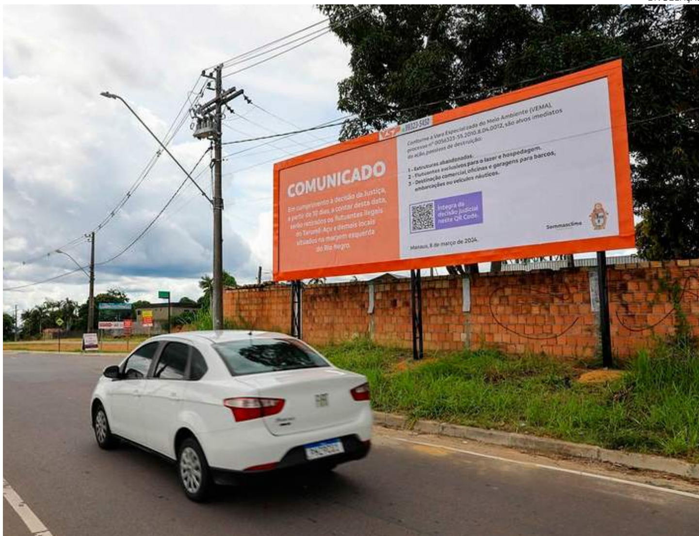
Prefeitura instalou outdoors nas entradas das vias que dão acesso à marina do Davi e praia Dourada

O processo de retirada dos flutuantes será coordenado pela Secretaria Municipal de Meio Ambiente, Sustentabilidade e Mudança do Clima (Semmasclima), e contará com suporte do