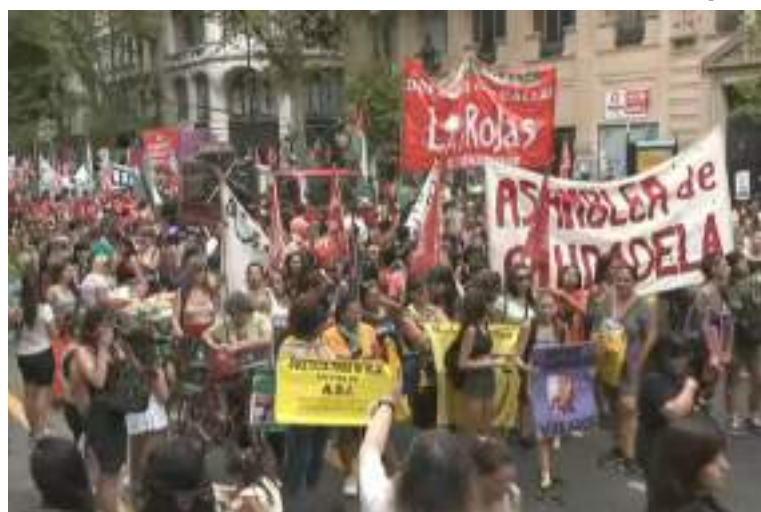
Mulheres se manifestam contra políticas do governo de Javier Milei

Também apontam para o envio ao Congresso, por legisladores do partido governista A Liberdade Avança, de um projeto de lei para revogar a legalização do aborto, que por enquanto acabou não prosperando.