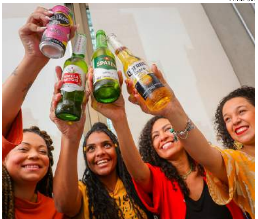
Curso é voltado à inclusão produtiva de mulheres no mercado cervejeiro

Academia da Cerveja A Academia da Cerveja