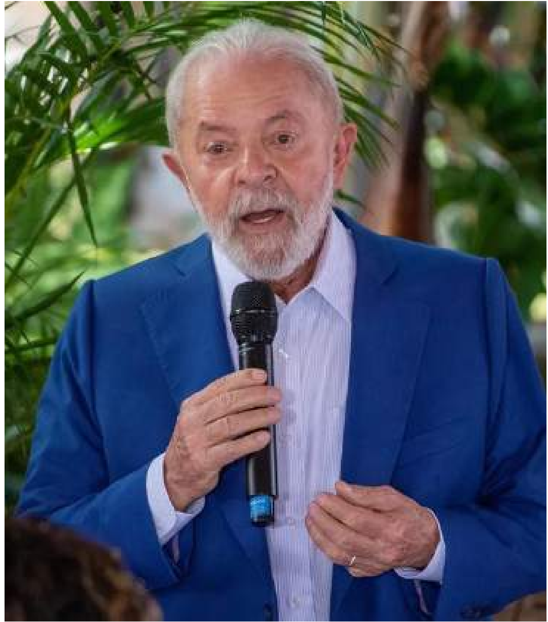
Declaração do presidente aconteceu em evento em comemoração ao Dia Internacional das Mulheres

"Com o passar dos anos, as mulheres já aprenderam a trabalhar, foram para o mercado de trabalho. Mas os homens não aprenderam a ir para a cozinha, a lavar a roupa, não aprenderam a cuidar das coisas que elas cuidam. A gente não compartilha, no que diz respeito à solidariedade e ao companheirismo, com nossas companheiras", afirmou.